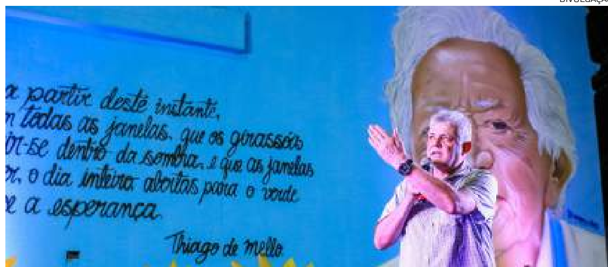
Secretário da Manauscult divulgando o edital “Thiago de Melo – Artistas e Profissionais da Cultura”

moção de formação dos artistas e produtores culturais manauaras. E, todas as atividades decorrentes da realização dos projetos premiados no edital deverão ser oferecidas gratuitamente à população.