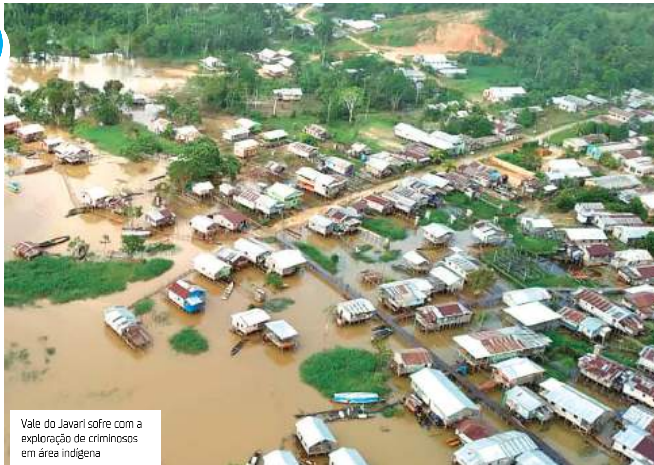
Vale do Javari sofre com a exploração de criminosos em área indígena

O plano de Pereira foi citado nesta segunda-feira (27) em um evento realizado pela União dos Povos Indígenas do Vale do Javari (Univajá). "Eu não tive acesso a essas anotações do Bruno Pereira, mas, certamente, a política e a diretriz do governo [federal], de