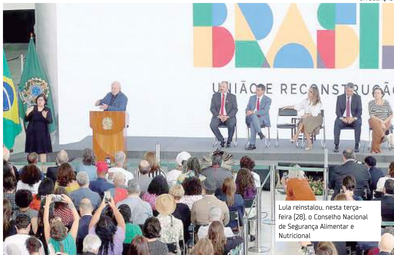
Lula reinstalou, nesta terça-feira (28), o Conselho Nacional de Segurança Alimentar e Nutricional