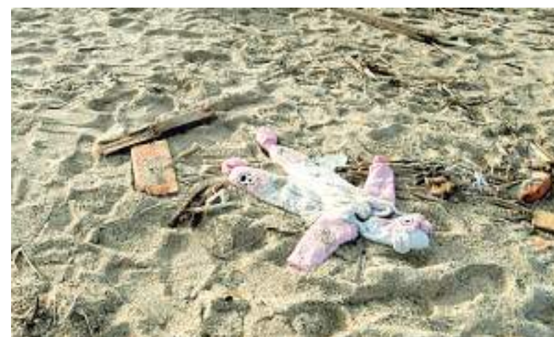
Ministério das Relações Exteriores do Afeganistão confirma crianças entre mortos

As buscas por corpos de desaparecidos continuam, segundo a polícia italiana. Todos os dias são repassados boletim sobre o resgate de corpos, vítimas do naufrágio clandestino.