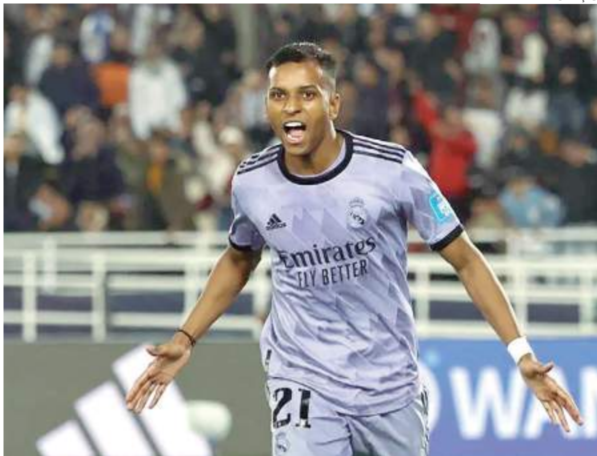
Rodrygo treinou normalmente com o elenco do Real Madrid nesta terça-feira