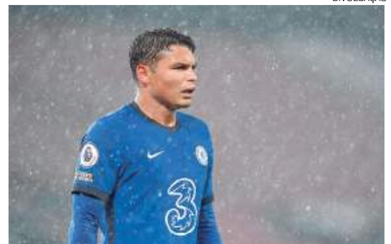
Defensor não participa de jogo contra o Borussia Dortmund, da Alemanha