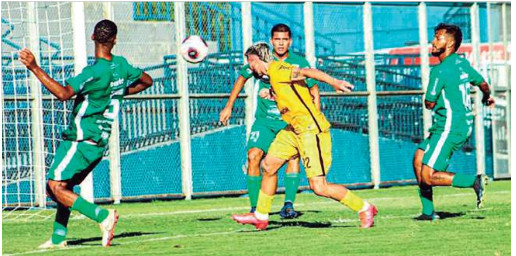
Clube, que passa por momento conturbado, terá que amargar mais uma temporada na Série B do campeonato local

"No Amazonas não vai haver esse tipo de coisa. Não vai acontecer. Nosso futebol precisa de seriedade, precisa respirar. Hoje com o nosso documento, administrativamente, o Irاندuba está