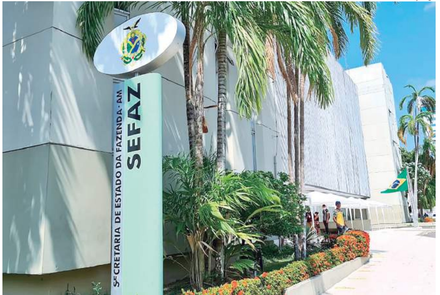
Fachada do prédio da Sefaz

No município de Tabatinga, situado na fronteira do Brasil com a Colômbia e o Peru, a equipe da Sefaz, composta por servidores do Núcleo de Educação Fis-