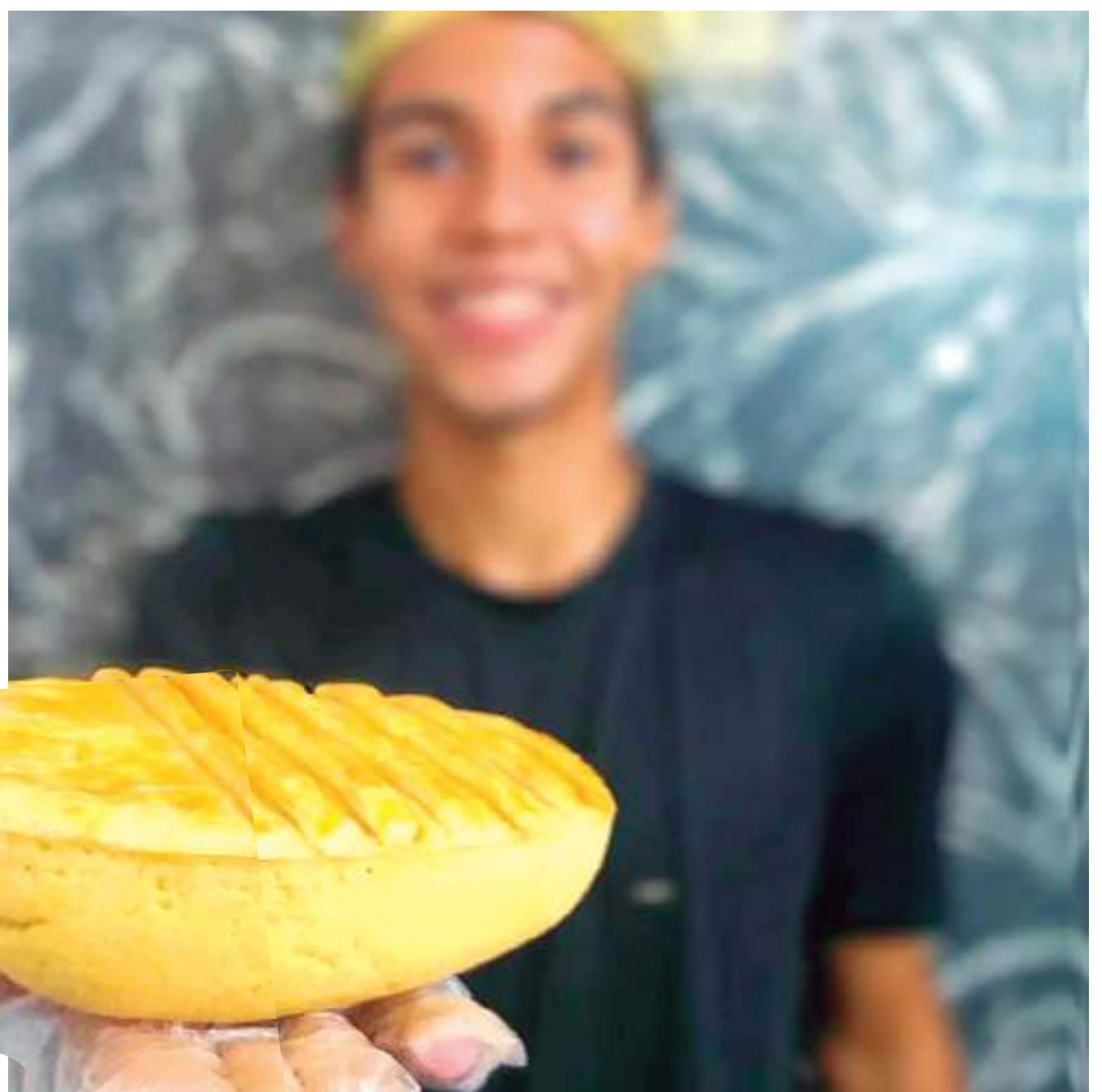
Empreendedor criando ovos com diversos recheios

Além disso, a Queiroz possui diferentes canais de venda. São 15 lojas físicas em Manaus, estrategicamente localizadas em todas as zonas da cidade e atua, ainda, nas plataformas digitais, como o site www.lojasqueiroz.com.br , aplicativo Ifood e televidas, facilitando e agregando comodidade ao dia a dia do consumidor.