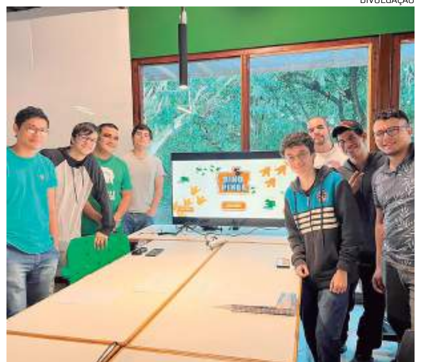
Universitários do Ludus Lab UEA

Os interessados podem participar virtualmente de qualquer lugar do Brasil, realizando sua inscrição no site oficial, onde também é possível conferir a programação completa e os convidados renomados nacionalmente: https://www.event3.com.br/ludus-lab-summit-2023/ .