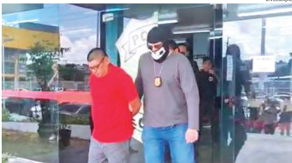
Suspeito de estuprar e matar própria filha de 13 anos estava foragido e acabou preso pela DEHS