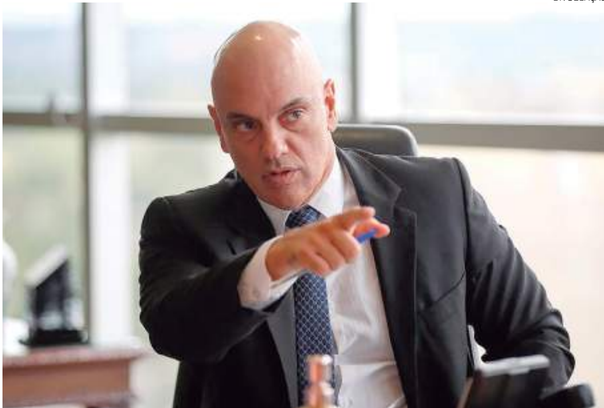
Alexandre de Moraes levou em consideração que a maioria tem a condição de réu primário

Ao analisar a situação dos acusados, Alexandre de Moraes levou em consideração que a maioria tem a condição de réu primário e filhos menores de idade. O grupo foi denunciado por incitação ao crime e associação criminosa. Ao determinar a soltura dos investigados, Alexandre determinou que eles fossem no-