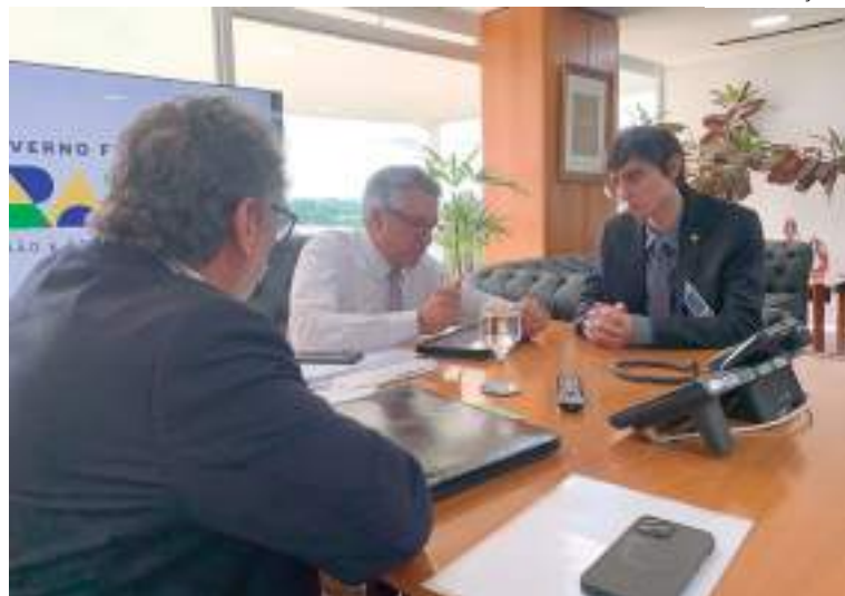
Amom reuniu-se com ministro de Relações Institucionais

Parlamentar defende que são necessárias ações assertivas para garantir a segurança e a manutenção da ZFM.