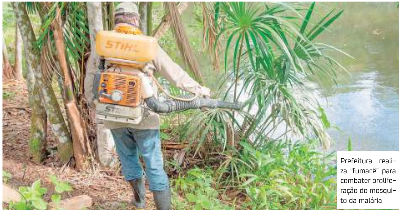
Prefeitura realiza "fumacê" para combater proliferação do mosquito da malária

"A Semsa tem conseguido o controle com as ações de rotina, com Manaus mantendo redução anual desde 2018, mas estamos buscando estratégias