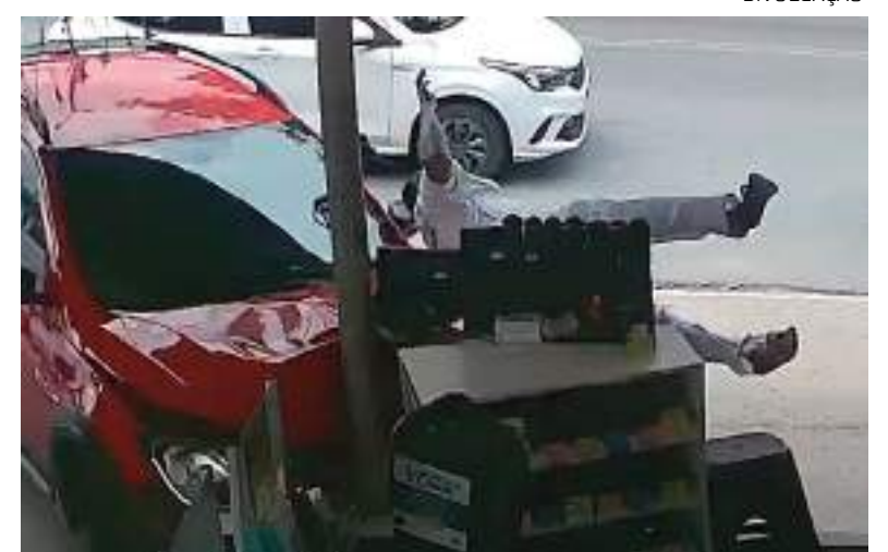
Câmera flagra momento em que mulher bate em carro e atropela idoso