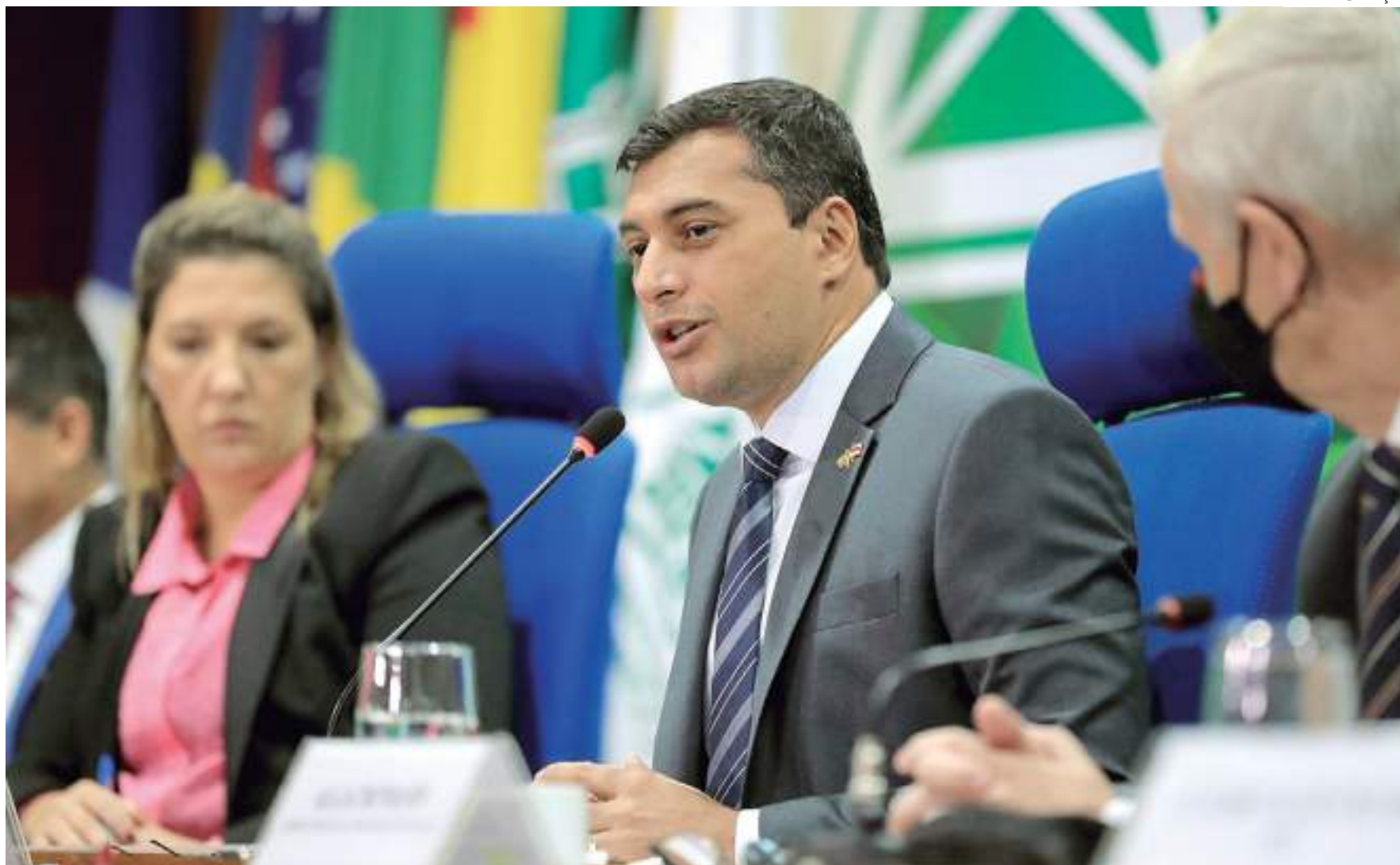
Governador cumpriu agenda em Brasília, onde discursou sobre importância do combate a queimadas durante posse do novo presidente do Ibama

O governador lembrou, ainda, que um de seus atos no primeiro ano em que assumiu o Governo do Amazonas, em 2019, foi criar um grupo de trabalho formado por técnicos das secretarias estaduais de Fazenda (Sefaz) e de Desenvolvimento Econômico, Ciência, Tecnologia e Inovação (Sedecti) para trabalhar em favor do modelo.