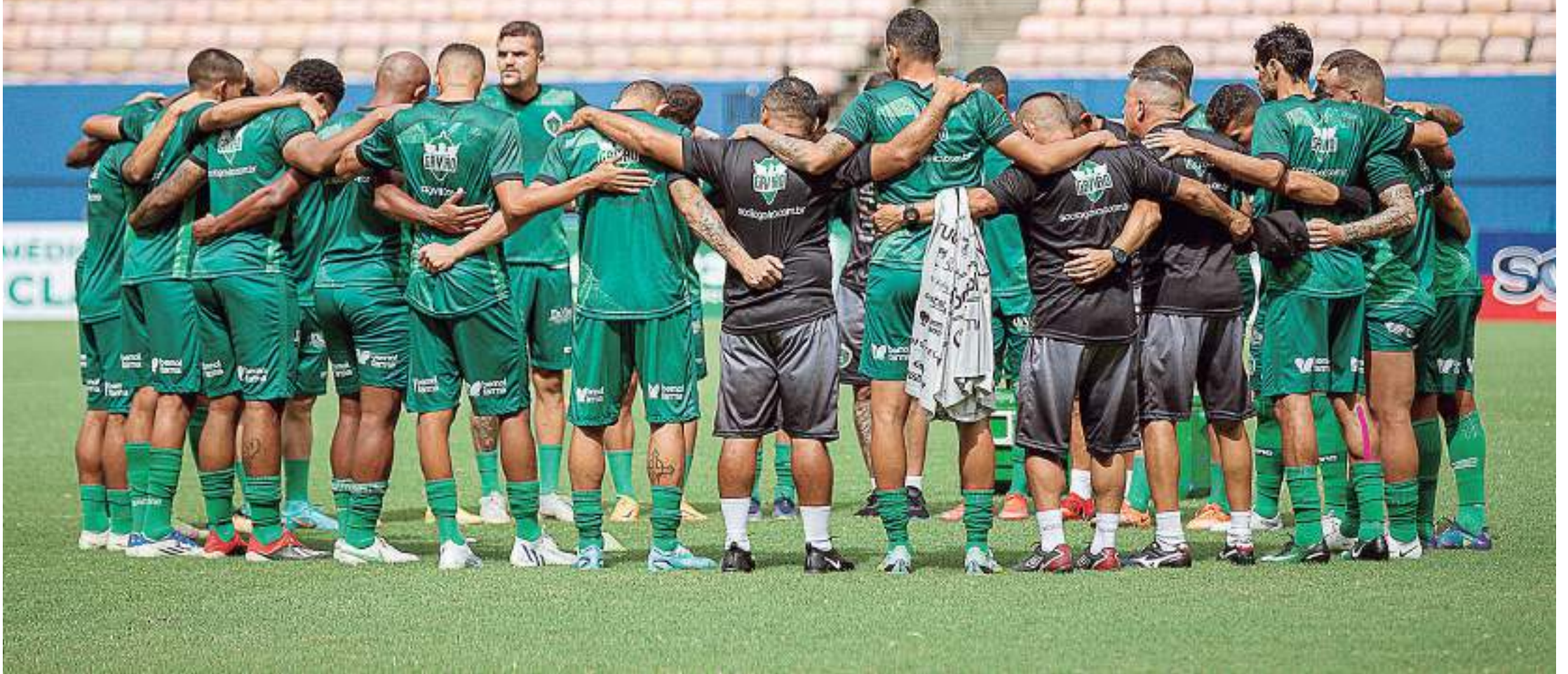
O Gavião Real volta a enfrentar um time catarinense oito meses após empatar em 1 a 1 com o Figueirense-SC

A partida desta quarta-feira marca a estreia de Higo Magalhães no comando do Gavião do Norte