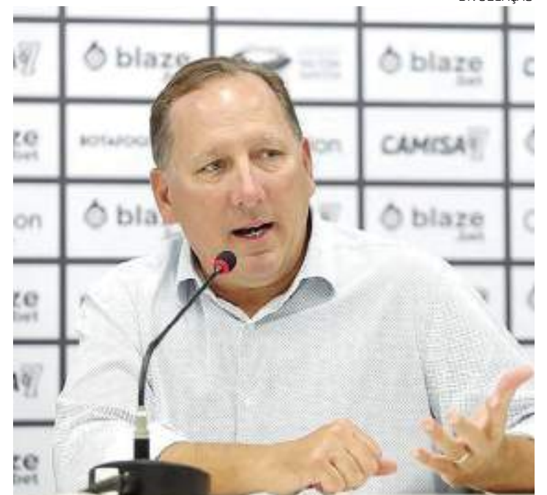
Botafogo promove encontro com conselheiros do clube