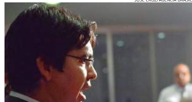
Declaração é do líder do governo no Congresso, Randolfe Rodrigues