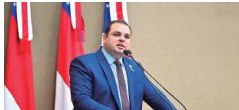
Cidade denunciou que o Dnit não tem sido colaborativo

“Estivemos reunidos com representantes do Careiro da Várzea, Careiro Castanho, Autazes, Nova Olinda do Norte e Manaquiri, municípios diretamente atingidos pela queda das pontes, que vieram nos falar sobre a angústia das mais de 200 mil pessoas que foram atingidas por esse ocorrido. O Dnit precisa informar sobre o andamento das licitações para a construção das novas pontes e também sobre o trabalho paliativo que está sendo pensado para aquele local. Não pode, sim-