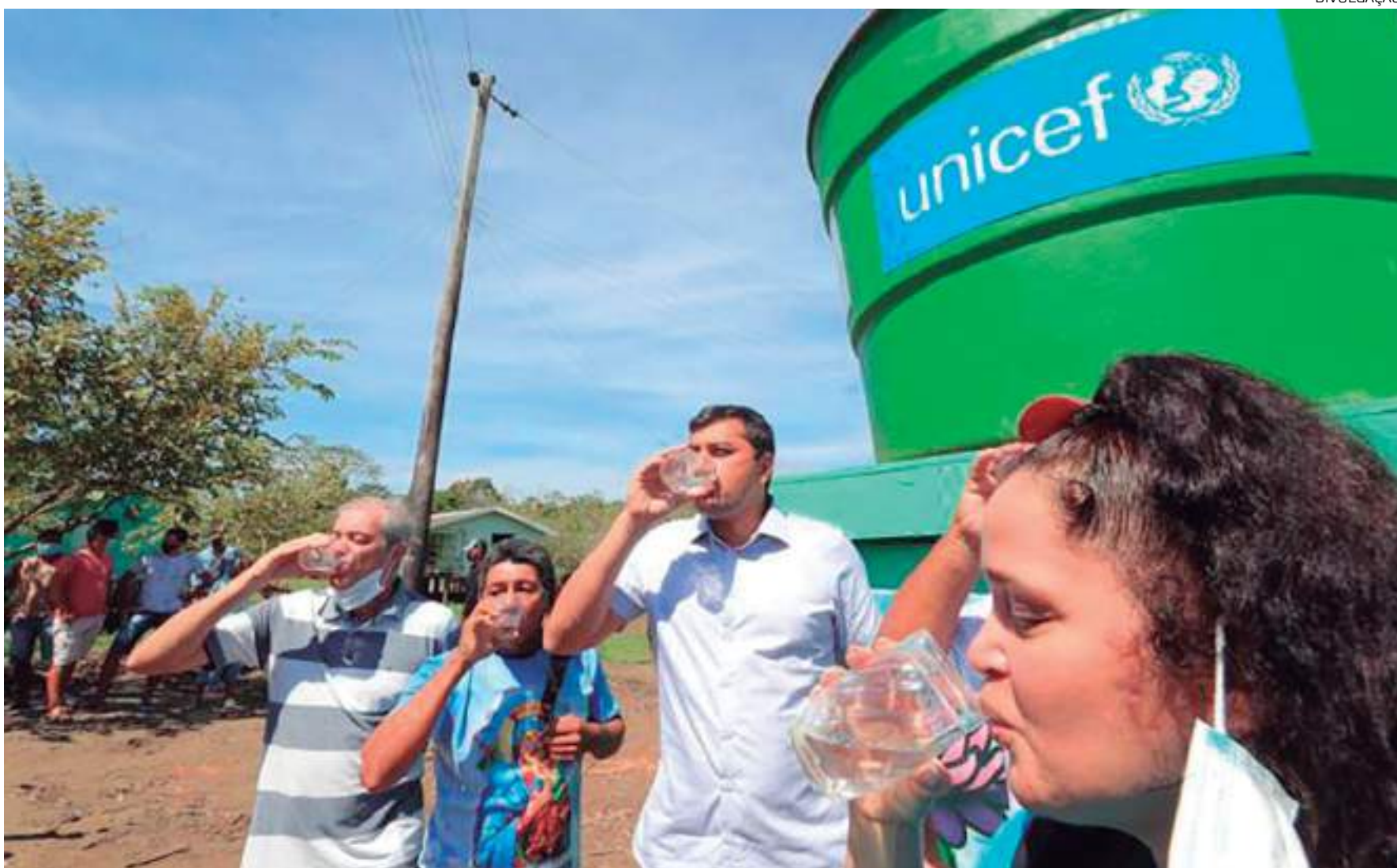
Governador ressaltou políticas públicas da sua gestão que entregam água potável a regiões de logística dificultosa

quatro anos no Amazonas está a elaboração do Plano Estadual de Recursos Hídricos, regulamentado após 10 anos da sua criação legal, definindo diretrizes, metas, programas e projetos para o uso sustentável da água. Também foi feita a criação do primeiro Plano de Bacias em 20 anos, documento que vai orientar a gestão da Bacia Hidrográfica do Tarumã-Açu, na capital do Amazonas.