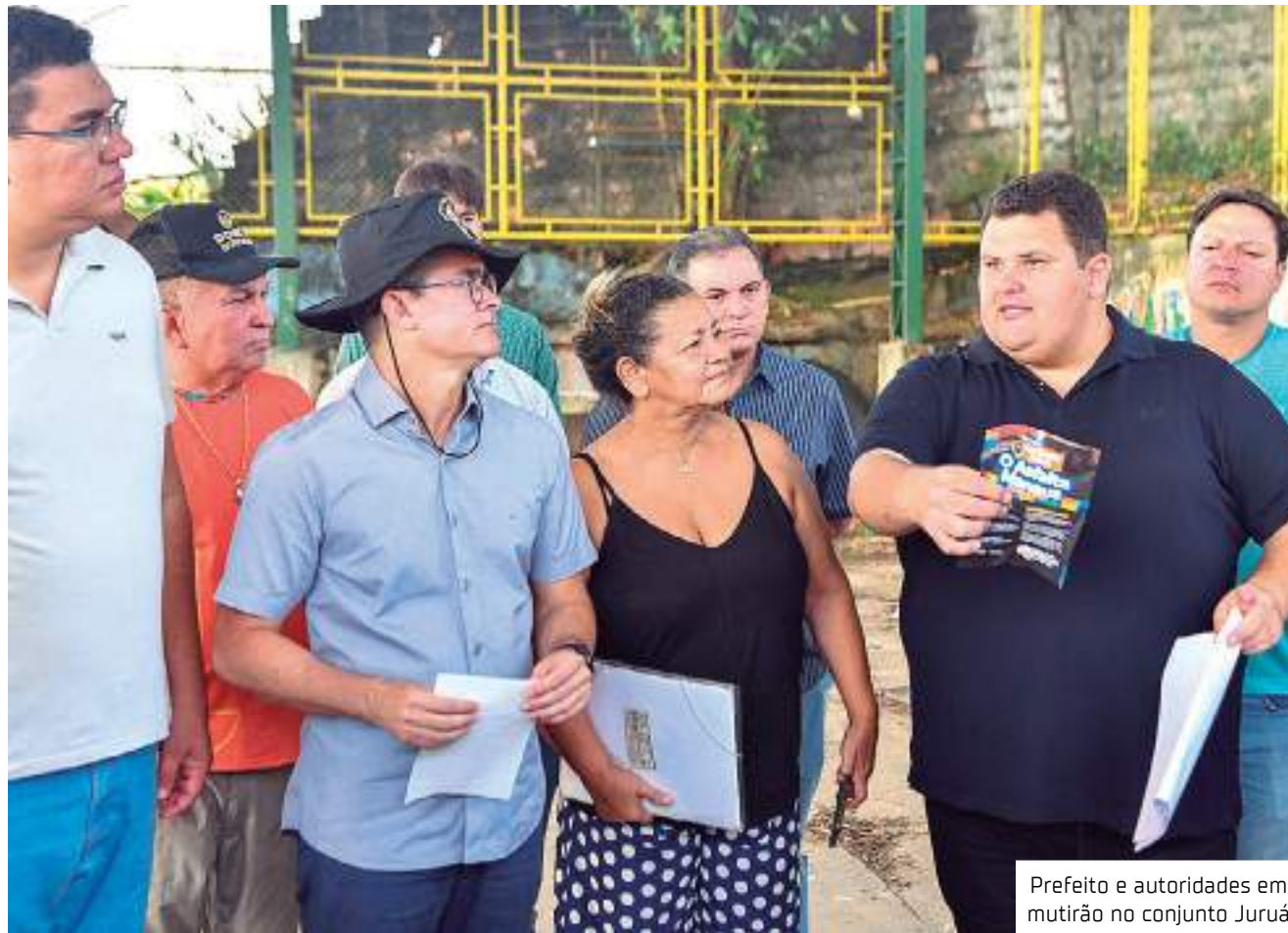
Prefeito e autoridades em mutirão no conjunto Juruá

conjunto é a construção do novo complexo esportivo da cidade. O local irá se tornara “Casa do Vôlei” em Manaus, e será composto por uma quadra oficial coberta, vestiários, dormitórios e duas quadras de vôlei de areia.