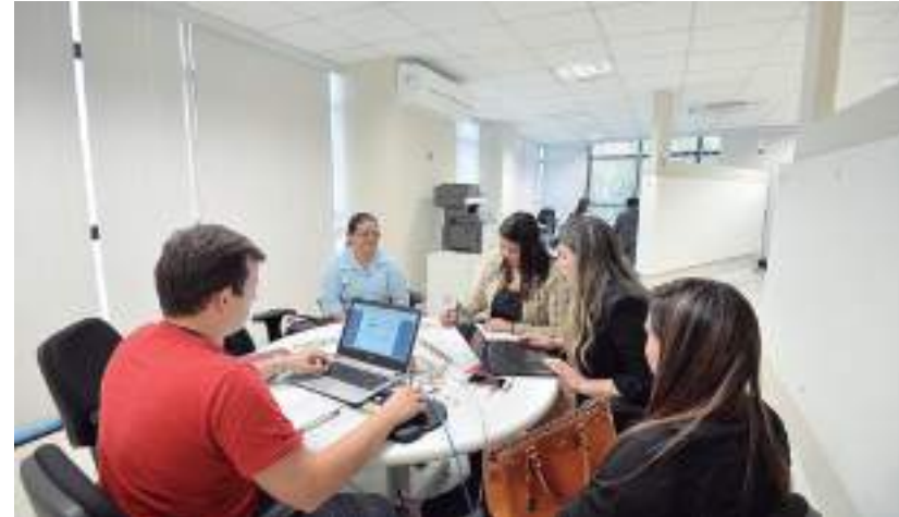
As partes realizam mediação pré-processual para resolver conflitos no TRT-11

No caso dos dissídios individuais, a petição deve ser protocolada conforme artigo 15 do Ato 10/2023. A Vara para qual for distribuída a RPP deverá encaminhá-la ao Cejusc-JT da sua jurisdição. Se não houver