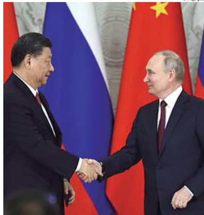
Vladimir Putin conversou, nesta terça-feira, com o líder chinês, Xi Jinping.

O líder chinês visitou Moscou dias depois que um tribunal internacional emitiu um mandato de prisão contra Putin devido às ações da Rússia na Ucrânia, onde as forças russas fizeram pouco progresso nos últimos meses, apesar de sofrerem pesadas perdas.