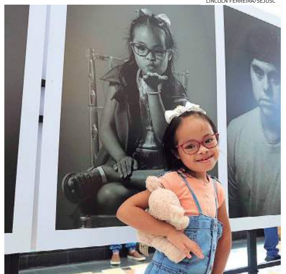
Exposição "Um Olhar 21", no piso Castanheira do Manauara Shopping

O centro comercial também será iluminado nas cores azul e amarelo em referência à Síndrome de Down.