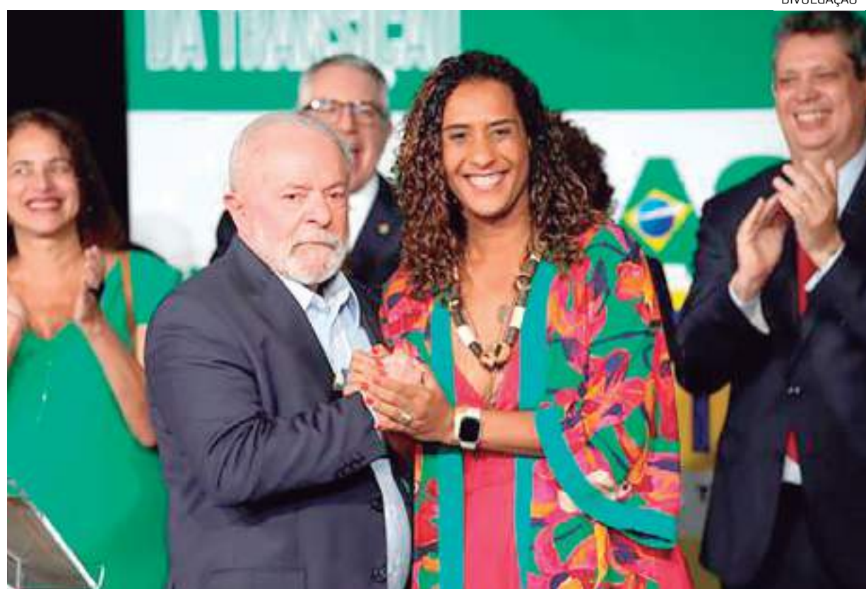
O presidente com a ministra Anielle Franco anunciaram pacote visando à igualdade racial

Durante o evento desta terça, o governo também anunciou a criação do programa Aquilomba Brasil, voltado à promoção dos direitos da população quilombola. Segundo o Ministério da Igualdade Racial, a iniciativa, que será criada por um decreto assinado por Lula, terá três eixos. São eles: acesso à terra e ao território quilombola, infra-