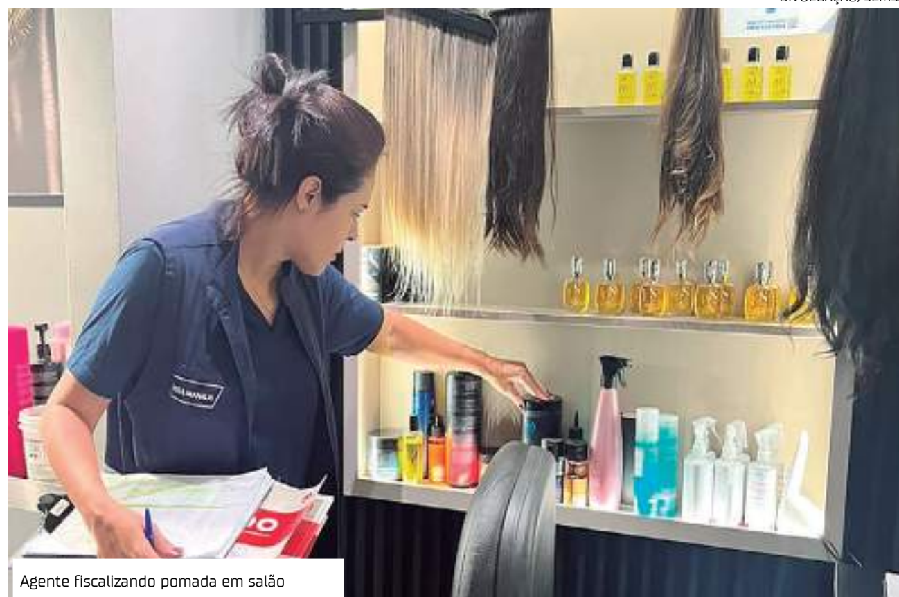
Agente fiscalizando pomada em salão

Com o avanço das investigações sobre os efeitos adversos oculares provocados pelas pomadas em várias cidades brasileiras, os técnicos da Anvisa conseguiram identificar que a maioria dos produtos que causaram as reações apresenta-