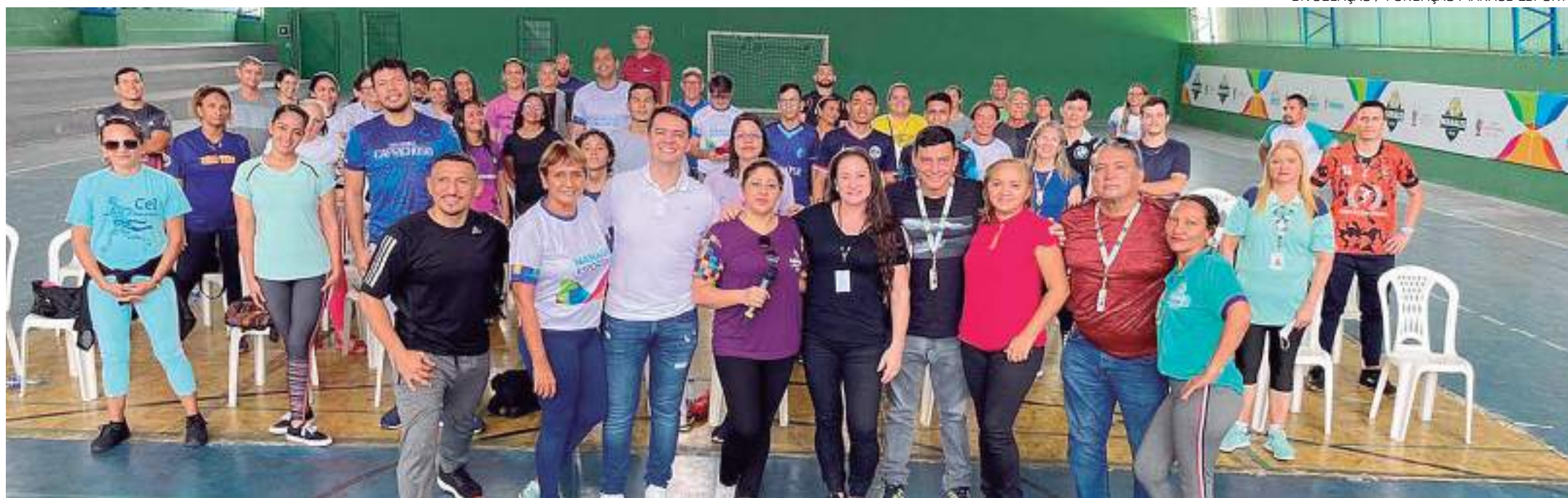
Professores que participaram da capacitação