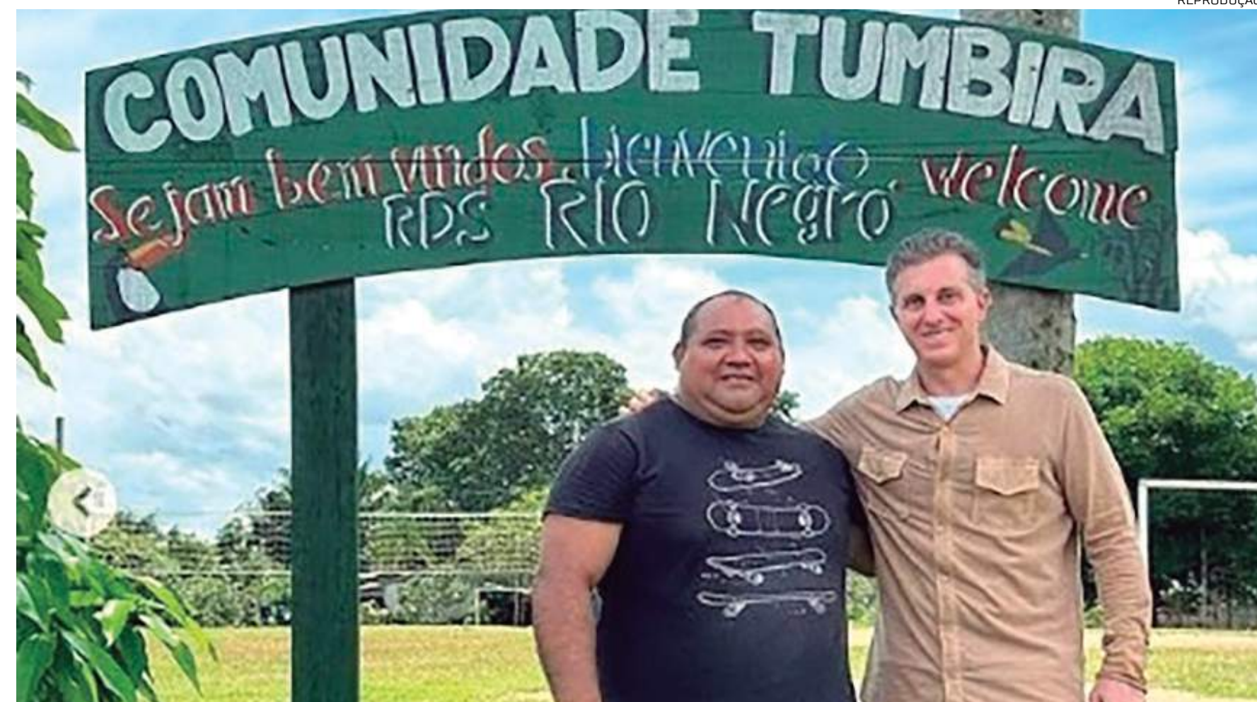
Luciano Huck visita a comunidade do Tumbira, na Reserva de Desenvolvimento Sustentável do Rio Negro

O turismo comunitário ou de base comunitária se encaixa na tendência do segmento, conforme