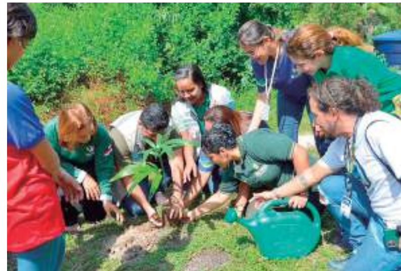
Pessoas plantando uma árvore