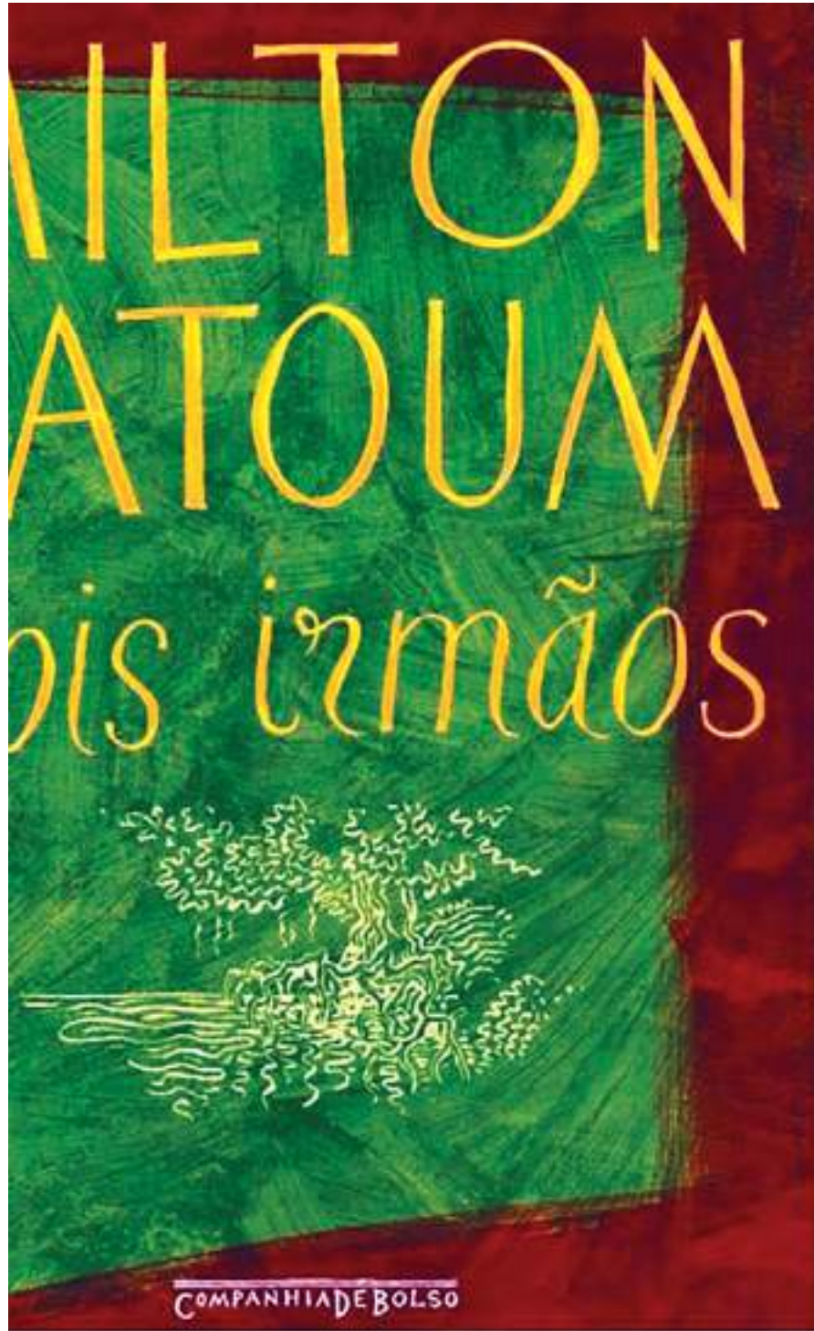
"Dois Irmãos" é um romance do escritor amazonense Milton Hatoum

Baseado no livro do escritor Milton Hatoum, o romance ganha uma peça produzida e estrelada por amazonenses