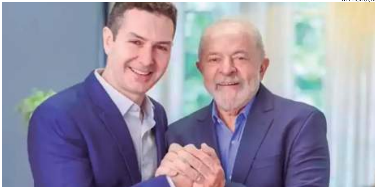
FNNIC contará com a presença do ministro das Cidades do PT, Jader Filho

O Fórum Norte e Nordeste da Indústria da Construção Civil (FNNIC), que ocorre em Manaus nos dias 23 e 24 de março, a partir das 9h, no Quality Hotel, contará com a presença do ministro das Cidades, Jader Filho. O titular da pasta, responsável pelo programa de habitação do Governo Federal, “Minha Casa Minha Vida” (MCMV), falará sobre “Ações de Investimentos do Ministério das Cidades para a Infraestrutura das Regiões Norte e Nordeste”.