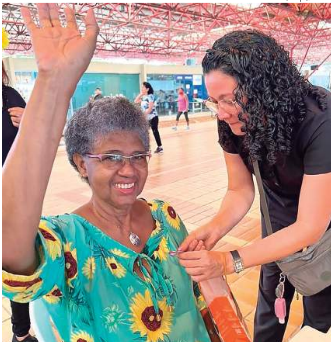
Idosa recebendo atendimento no Caimi

Agora, com a volta à unidade de origem, o Centro de Atenção Integral à Melhor Idade Dr. André Araújo se prepara para a reinauguração, que irá oferecer ainda mais qualidade e conforto aos pacientes atendidos. A previsão é que a unidade seja reaberta no mês de abril, com uma cerimônia que irá marcar a retomada das atividades no local.