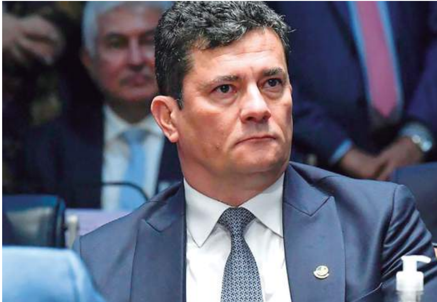
O senador Sérgio Moro disse, por meio das redes sociais, que o plano da facção criminosa era matar toda a sua família

Os mandados de prisão e busca e apreensão são cumpridos em cinco unidades da Federação: Rondônia, Paraná, Distrito Federal, Mato Grosso do Sul e São Paulo. De acordo com as diligências da PF, os ataques poderiam ocorrer de forma simultâ-