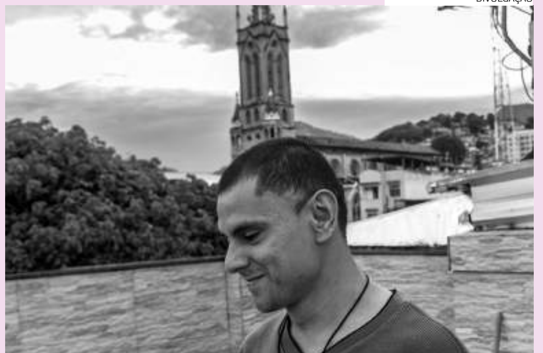
O artista Perezes Júnior é especialista em fotografia religiosa, gastronômica e natural