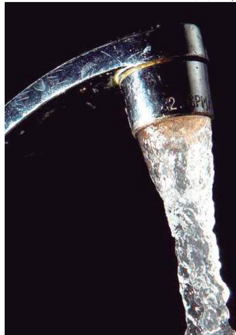
Água escorre de torneira. Escassez de água será discutida durante conferência