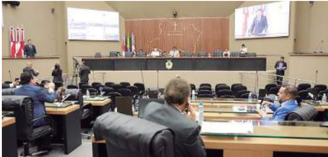
Preocupação dos parlamentares com segurança nos rios gera defesa de criação de nova polícia

"Nossas estradas são nossos rios, porém os criminosos dominam es-