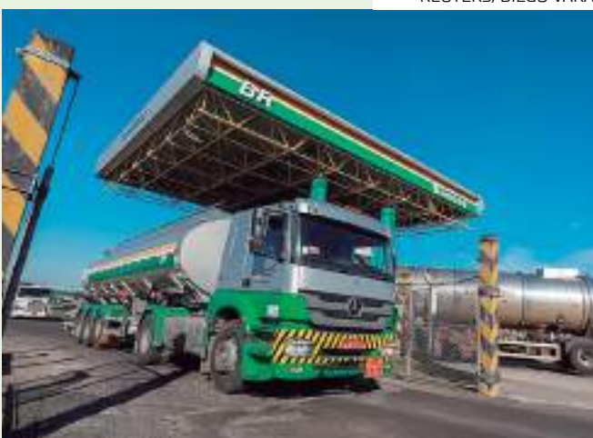
Preço de diesel A da Petrobras será mais baixo para as distribuidoras