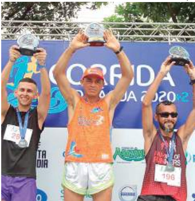
Três finalistas exibindo troféus conquistados na corrida