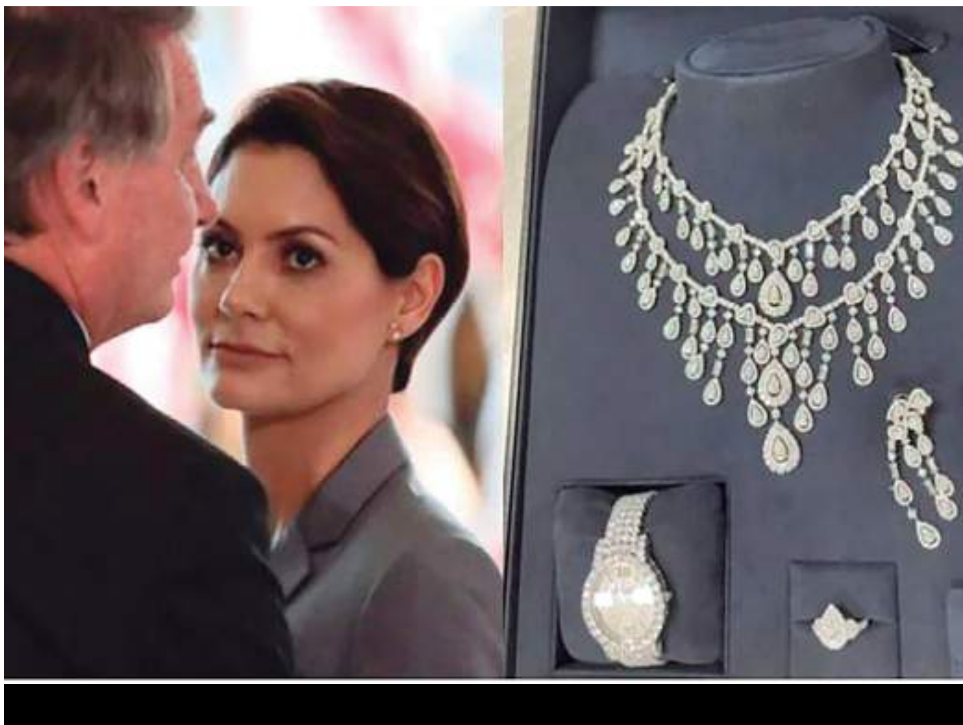
A defesa de Bolsonaro aguardava por uma definição do TCU para realizar a entrega do estojo de joias

"Vou direto nos pontos mais específicos em relação às determinações. Determinar que as armas devem ser entregues na diretoria da polícia administrativa da PF, no edifício sede da corporação, em Brasília. As joias em seu poder devem ser entregues à Caixa Econômica Federal, e determinar também que a secretaria especial da Receita Federal do Brasil que o conjunto de joias retido pelas autoridades alfandegárias, tendo em vista a inquestionável natureza de bem pú-