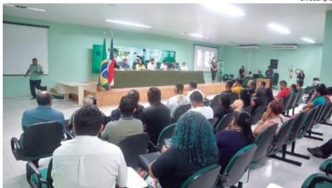
Professores indígenas da Prefeitura de Manaus participam de curso de pedagogia intercultural da UEA