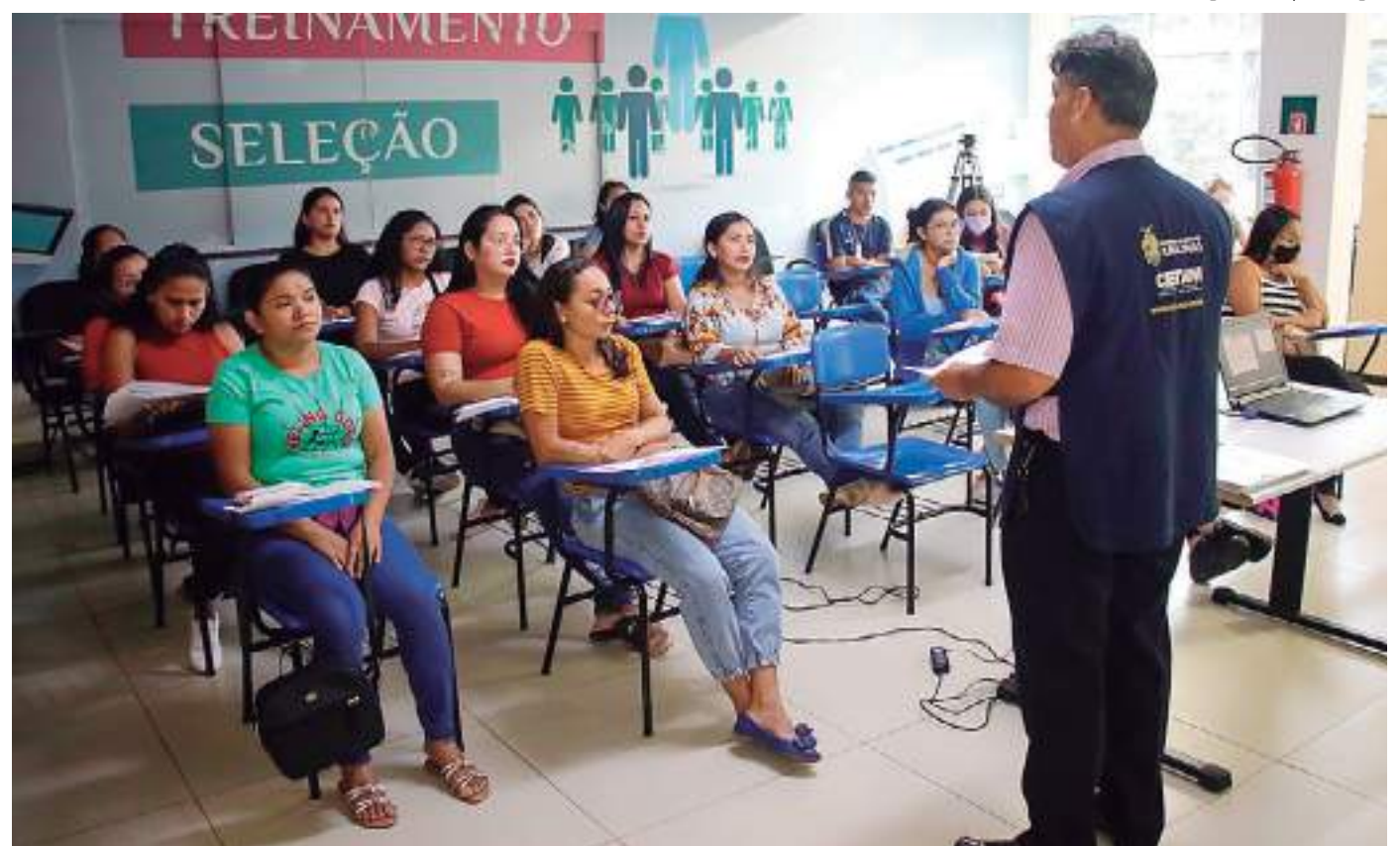
Projeto é destinado a trabalhadores cadastrados no Sine Manaus

A Prefeitura de Manaus, por meio da Secretaria Municipal do Trabalho, Empreendedorismo e Inovação (Semtepi), em parceria com o Grupo Moura Consulting, lançou, ontem (22), um edital com 40 vagas gratuitas para o curso de Treinamento Básico Operacional (TBO), que integra o projeto "Qualificar é o Caminho Certo para Empregar".