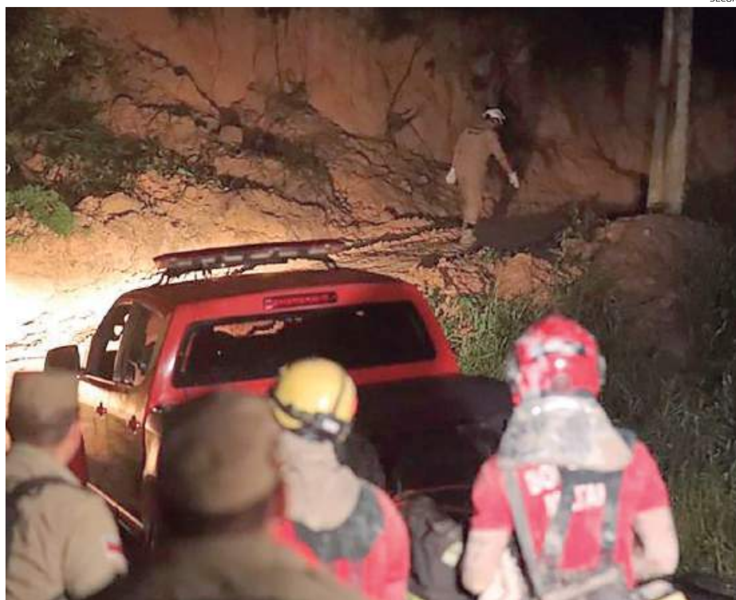
Agentes do Corpo de Bombeiros em deslizamento ocorrido no dia 12 de março

"Estamos muito felizes em receber, hoje, nossos amigos da Adra, uma organização respeitadíssima e que atua em mais de 107 países, para nos ajudar a atender as necessidades dessas famílias. É uma ajuda que chega em boa hora, tendo em vista a situação de vulnerabilidade enfrentada por esse público e que, em nome do prefeito David Almeida, só temos a agradecer", afirmou o sub-