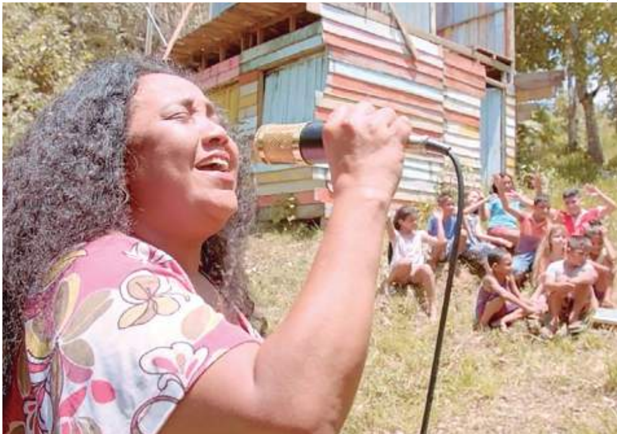
Cena da média-metragem "Estratégia da fome", dirigido por Walter Fernandes Jr

Sinopse: Um garoto pobre do interior se perde na cidade e encontra uma jovem de classe média que tenta revolucionar a sua própria vida.