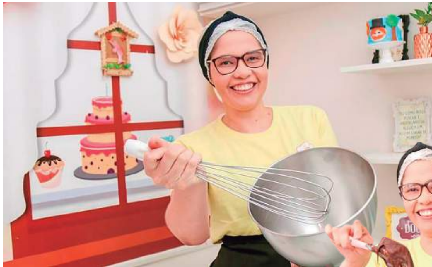
A confeitaria Esther Reis passou a investir no ramo de doces em 2014

"Anos atrás eu vi na internet uma publicação onde o internauta dizia que já tinha visto rodízio de tudo, mas nunca de bolo. A publicação dele viralizou e alguns clientes nos marcaram nas redes sociais. Isso me fez abrir os olhos para uma grande oportunidade. Nós temos feito pelo menos