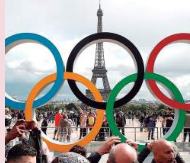
Anéis da Olimpíada com a Torre Eiffel ao fundo