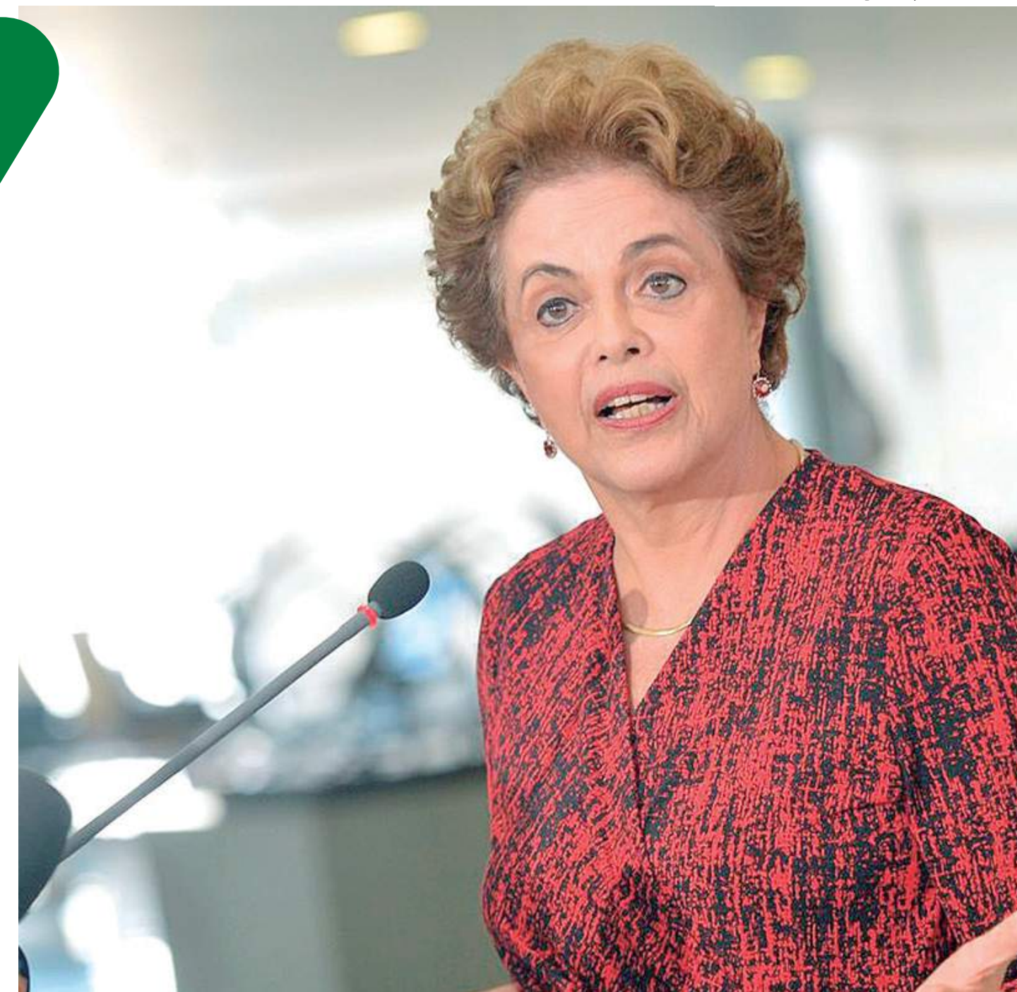
Ex-presidente do Brasil Dilma Rousseff presidirá o Banco do Brics até julho de 2025

Embora o banco tenha anunciado a substituição de Troyjo por Dilma no último dia 10, a eleição no Conselho de Administração do banco só ocorreu nesta sexta-feira. Cada país do Brics – Brasil, Rússia, Índia, China e África do Sul – preside o banco por mandatos rotativos de