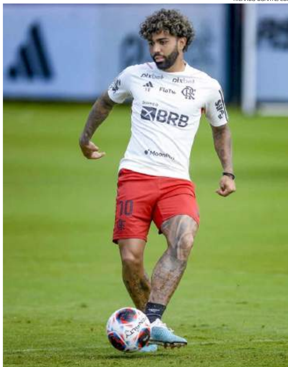
Gabigol está passando por uma fase ruim com a falta de gols pelo time do Flamengo -

Os números da temporada, no entanto, seguem bem expressivos. O centroavante disputou 14 jogos em 2023 e balançou as redes nove vezes, contra Portuguesa, Nova Iguaçu, Palmeiras, Al