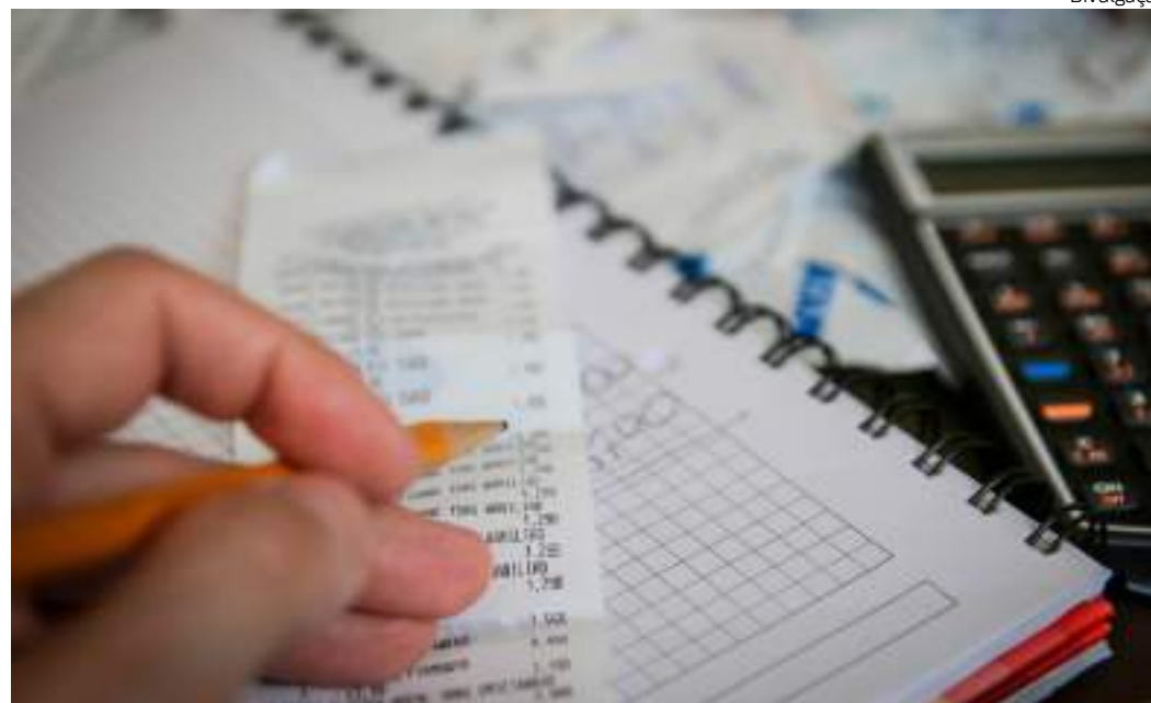
Guia visa a auxiliar inadimplentes sobre garantias na hora de negociar dívidas

O Manual do Endividado pode ser acessado no link: https://www.serasa.com.br/blog/manual-do-endividado/