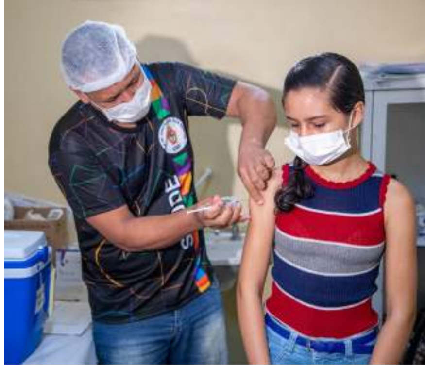
Para se vacinar, basta se dirigir aos postos portando identidade, CPF ou CNS e cartão vacinal