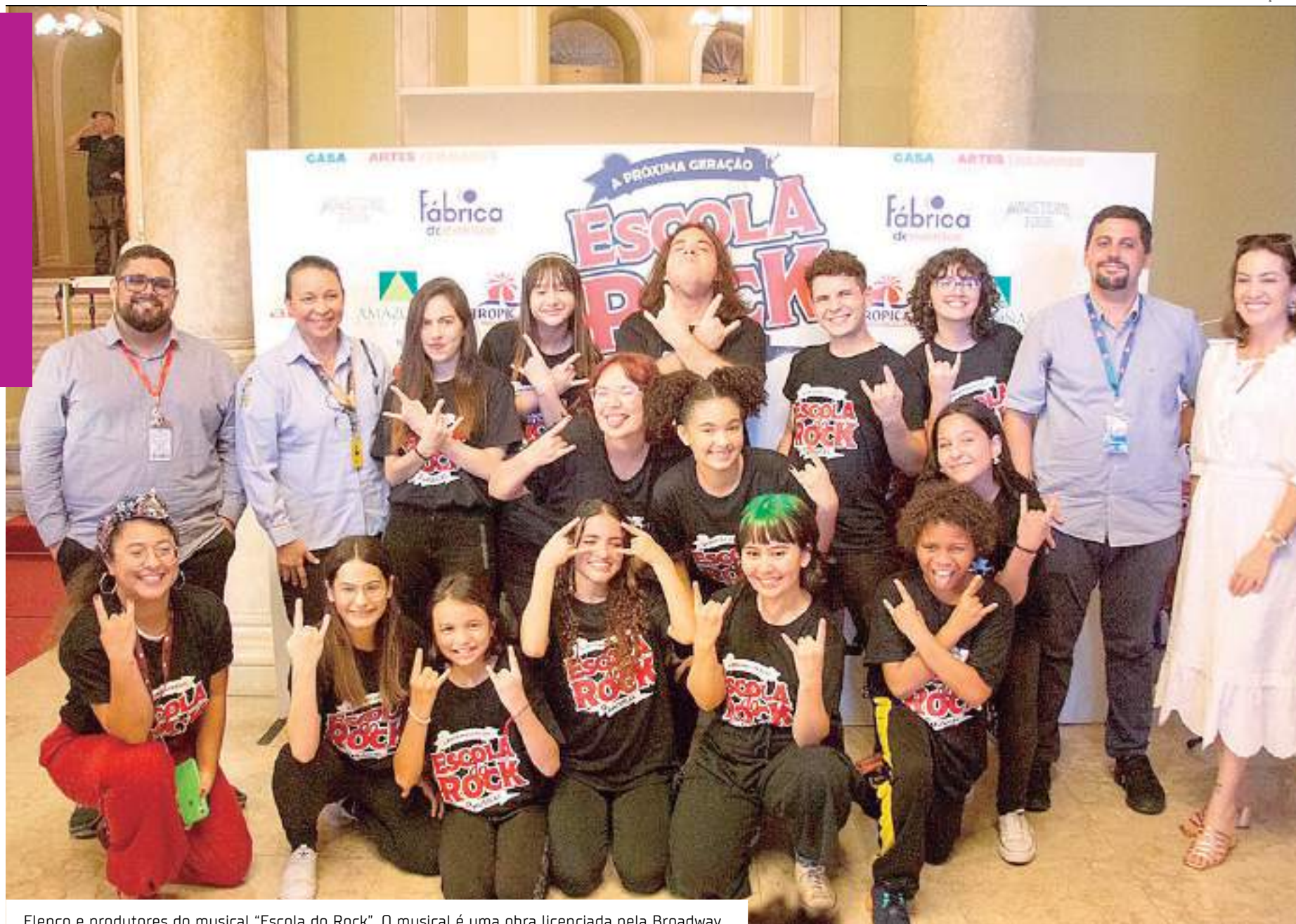
Elenco e produtores do musical "Escola do Rock". O musical é uma obra licenciada pela Broadway