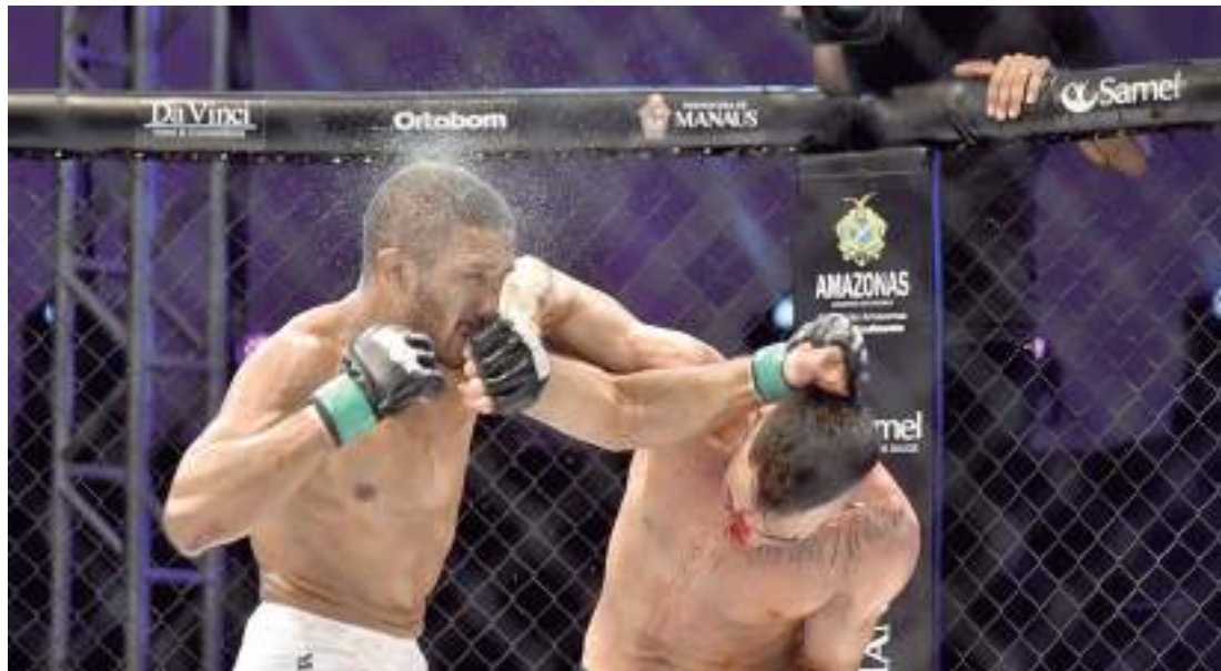
Principal evento de lutas da América Latina, o Jungle Fight 114ª acontece na Arena Amadeu Teixeira, bairro Flores, Zona Centro-Sul