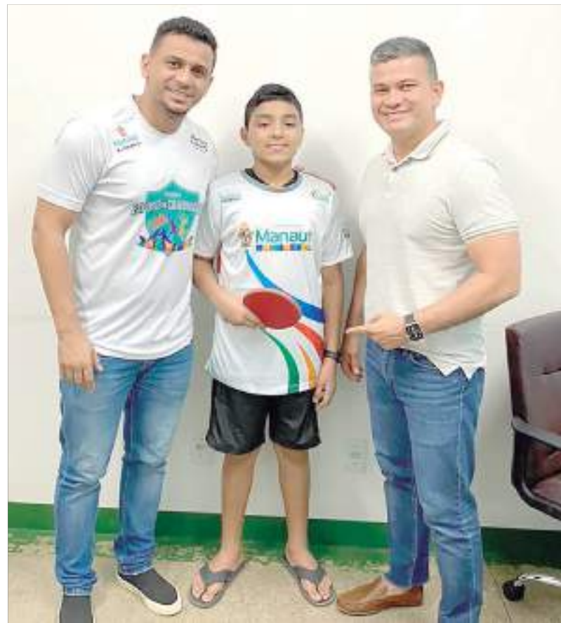
Atletas do programa 'Manaus Olímpica' embarca para competições nacionais com apoio da prefeitura

O fomento do esporte e a produção de atletas de ponta são uns dos claros focos da