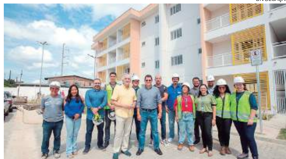
Conjunto na avenida Rodrigo Otávio será o primeiro do programa entregue regularizado