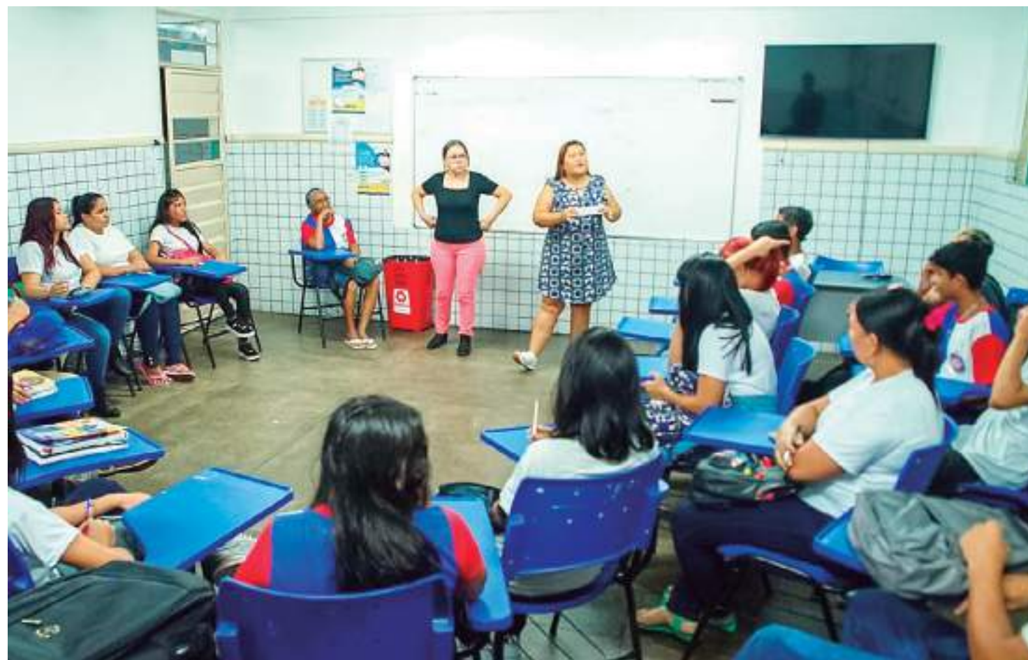
Monifes ocorreu na escola municipal Vicente de Paula, no bairro Japiim, Zona Sul

O Monifes, que ocorreu na escola municipal Vicente de Paula, no bairro Japiim, Zona Sul, é uma ação semestral promovida pela Semed, por meio da Gerência de Educação de Jovens e Adultos (Geja), em parceria com as