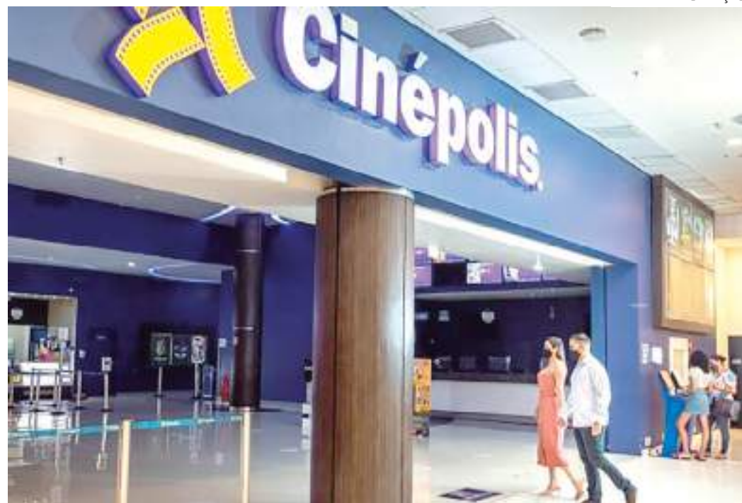
Cinema do Shopping Ponta Negra, onde ocorrerá a sessão inclusiva

Localizado no bairro Ponta Negra, área de expansão imobiliária e de forte apelo turístico, o Shopping Ponta Negra foi inaugurado em 08 de agosto de 2013, trazendo a Manaus uma proposta diferenciada de centro de compras. O empreendimento reúne um mix que se destaca pelas marcas exclusivas, nacionais e internacionais.