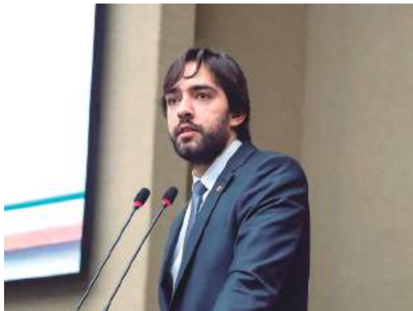
Deputado defende que o acesso à informação é pilar da educação

Para o deputado do União Brasil, um dos pilares da Educação é a conectividade e o acesso à informação.