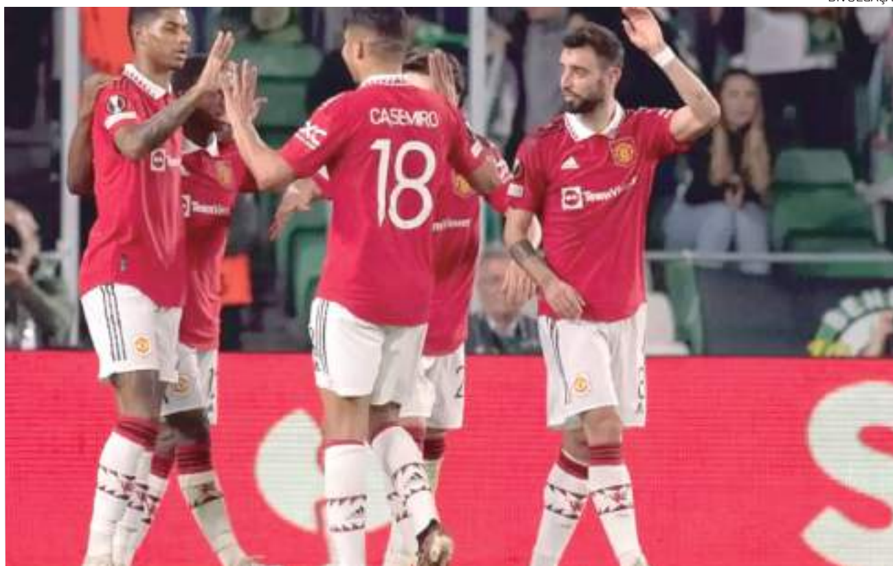
Rashford marca gol da vitória do Manchester United e recebe apoio dos jogadores

neste domingo por suas ligas nacionais. A Juventus visita a Inter de Milão, às 16h45 (de Brasília), pelo Campeonato Italiano. Já o Freiburg visita o Mainz 05, às 15h45, pelo Alemão.