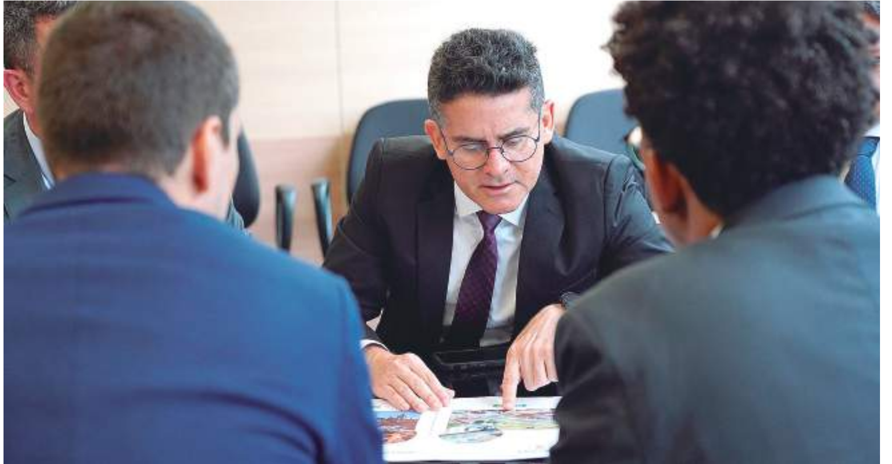
As propostas encaminhadas ao governo federal buscam atender a moradias populares e promover a retirada de famílias de áreas de risco

tica Nacional de Habitação, em articulação com as demais políticas públicas e instituições voltadas ao desenvolvimento urbano, com o objetivo de promover a universalização do acesso à moradia.