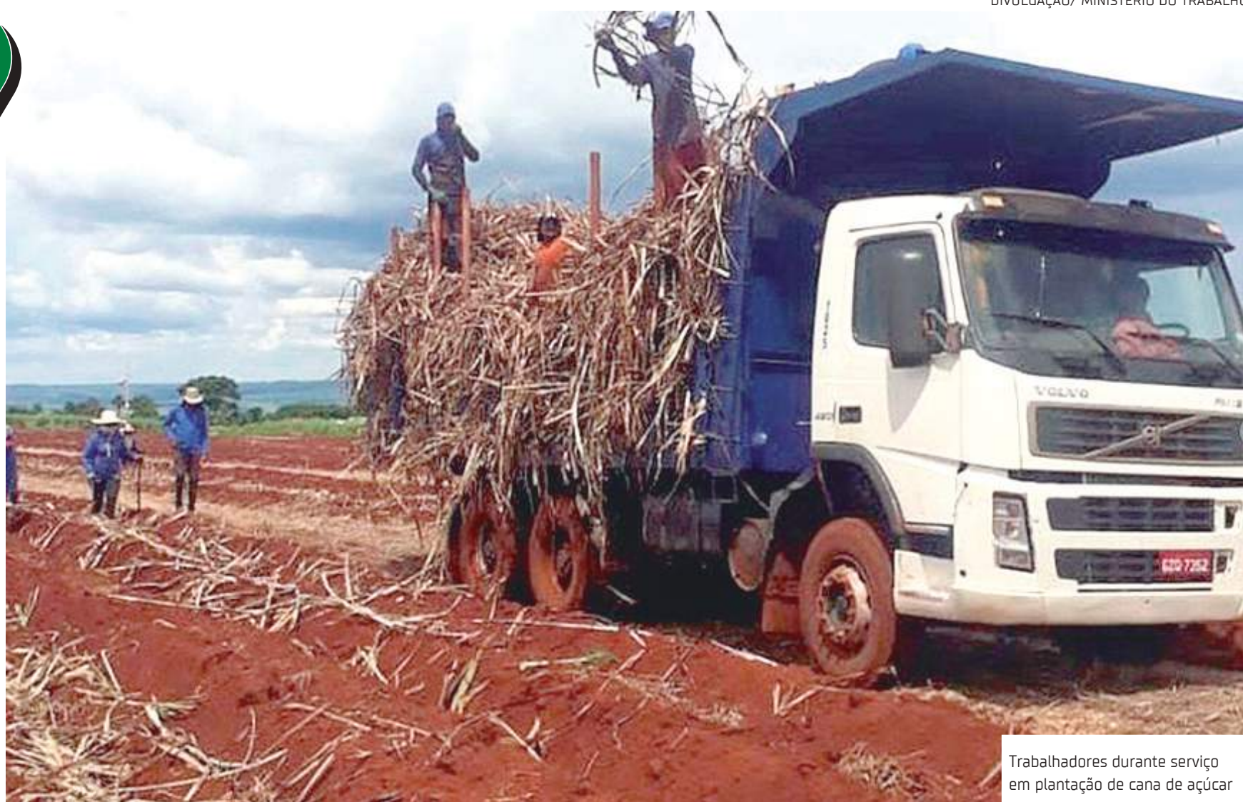
Trabalhadores durante serviço em plantação de cana de açúcar

O transporte inadequado de funcionários foi outro problema constatado em diversas propriedades, com o uso de caminhões pesados deslocando-se pelas áreas de plantio e levando trabalhadores em cima da carga de cana-de-açúcar. Diante