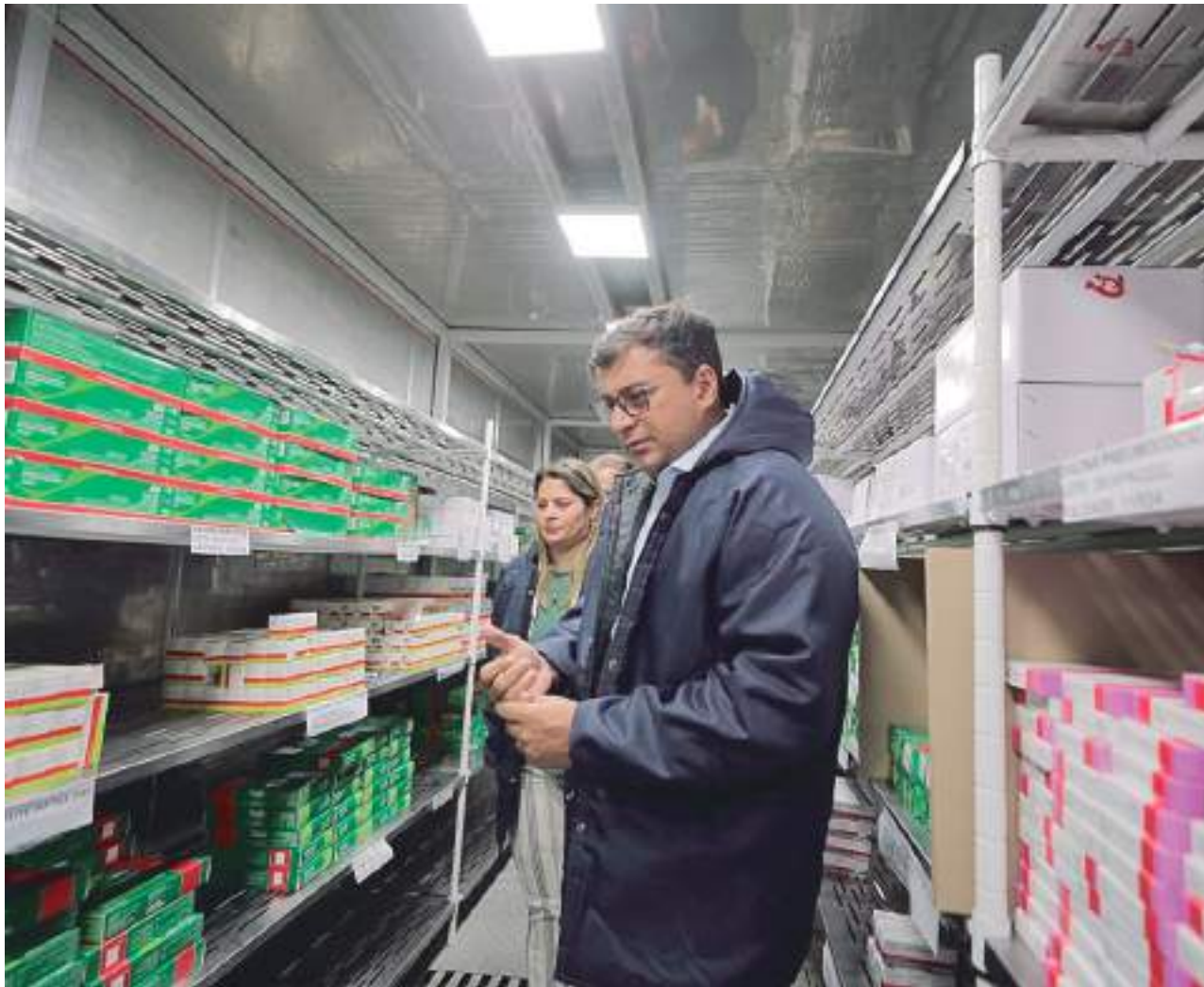
Wilson Lima verifica mais de 1,7 milhão de doses da vacina contra a gripe que chegaram ao Amazonas

"Temos um quadro significativo das síndromes respiratórias no início do ano, por conta do período de chuvas, e a gente consegue antecipar em 30 dias essa campanha de vacinação. Seguindo a de-