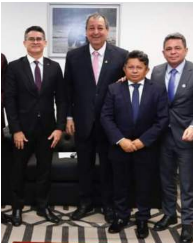
O prefeito de Manaus, David Almeida, ao lado do senador Omar Aziz, do deputado Sinésio Campos e do vice - governador Tadeu de Souza, cumpriu agenda positiva na capital federal. Desde terça-feira em Brasília, garantiu recursos para a realização de outras obras estruturais para a cidade.