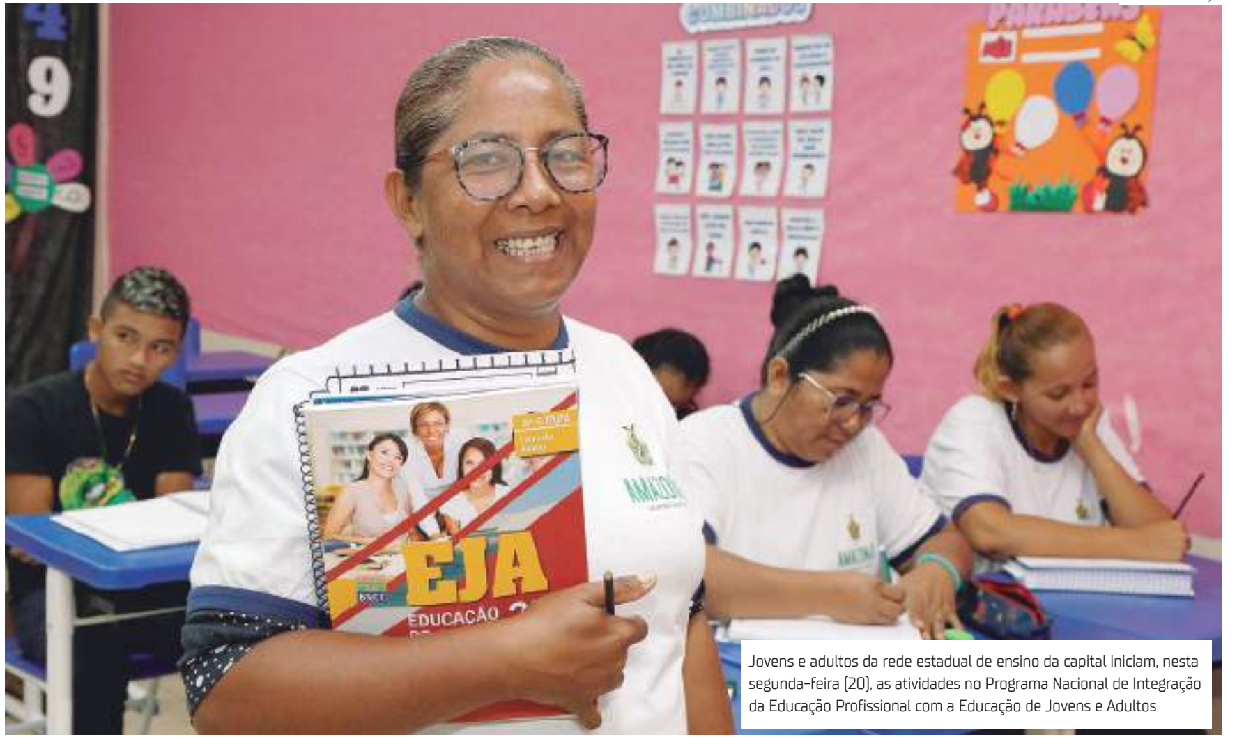
Jovens e adultos da rede estadual de ensino da capital iniciam, nesta segunda-feira (20), as atividades no Programa Nacional de Integração da Educação Profissional com a Educação de Jovens e Adultos

Devido à necessidade de uso de computadores e/ou celulares para estudo, um pacote de internet também será disponibilizado