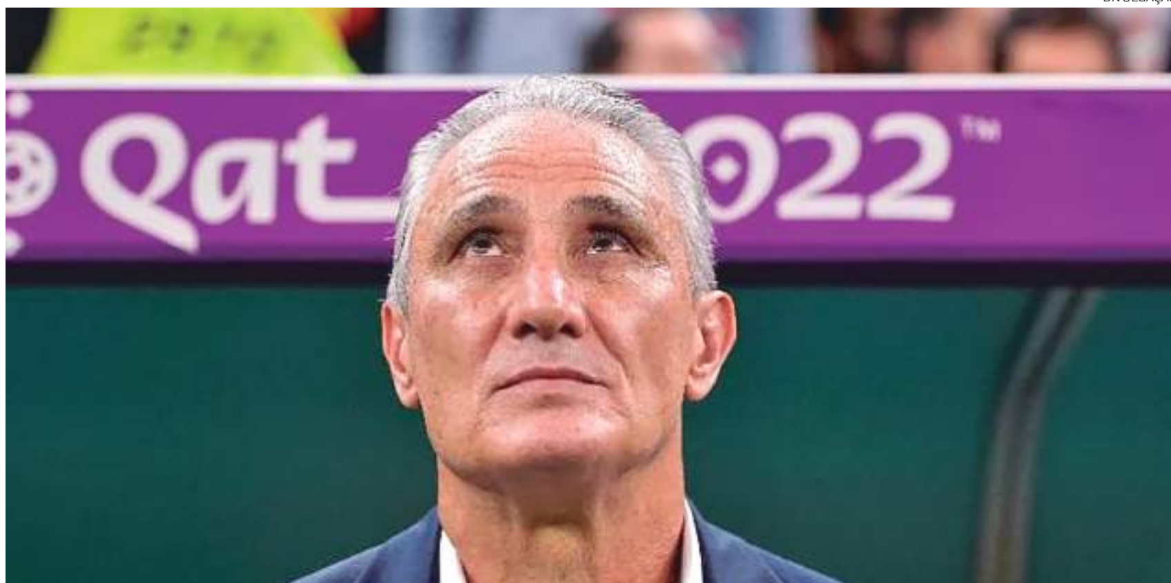
Tite abriu uma queixa-crime contra o ex-jogador Neto por injúria

No canal oficial do programa Donos da Bola, no Youtube, o vídeo "Neto reage a pênaltis de Brasil x Croácia e fica irado com Tite", com pouco mais de