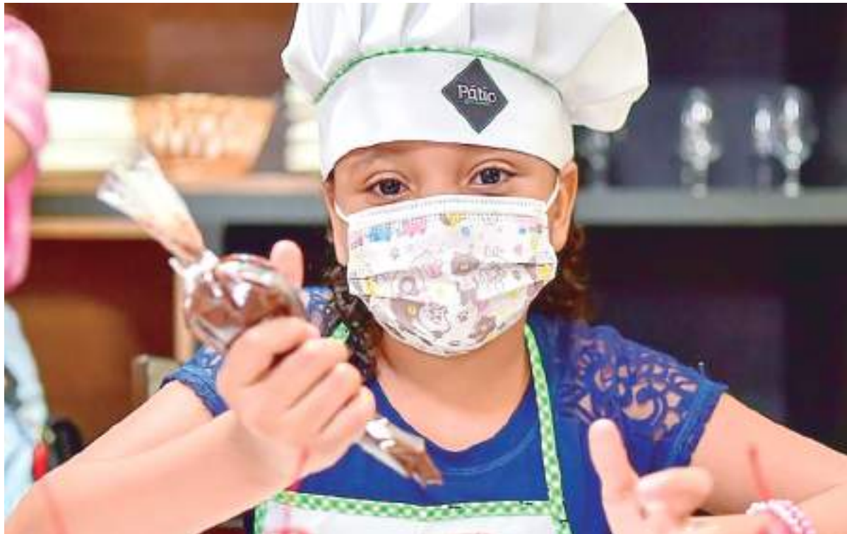
Oficina de confecção de ovos de Páscoa no Pátio Gourmet