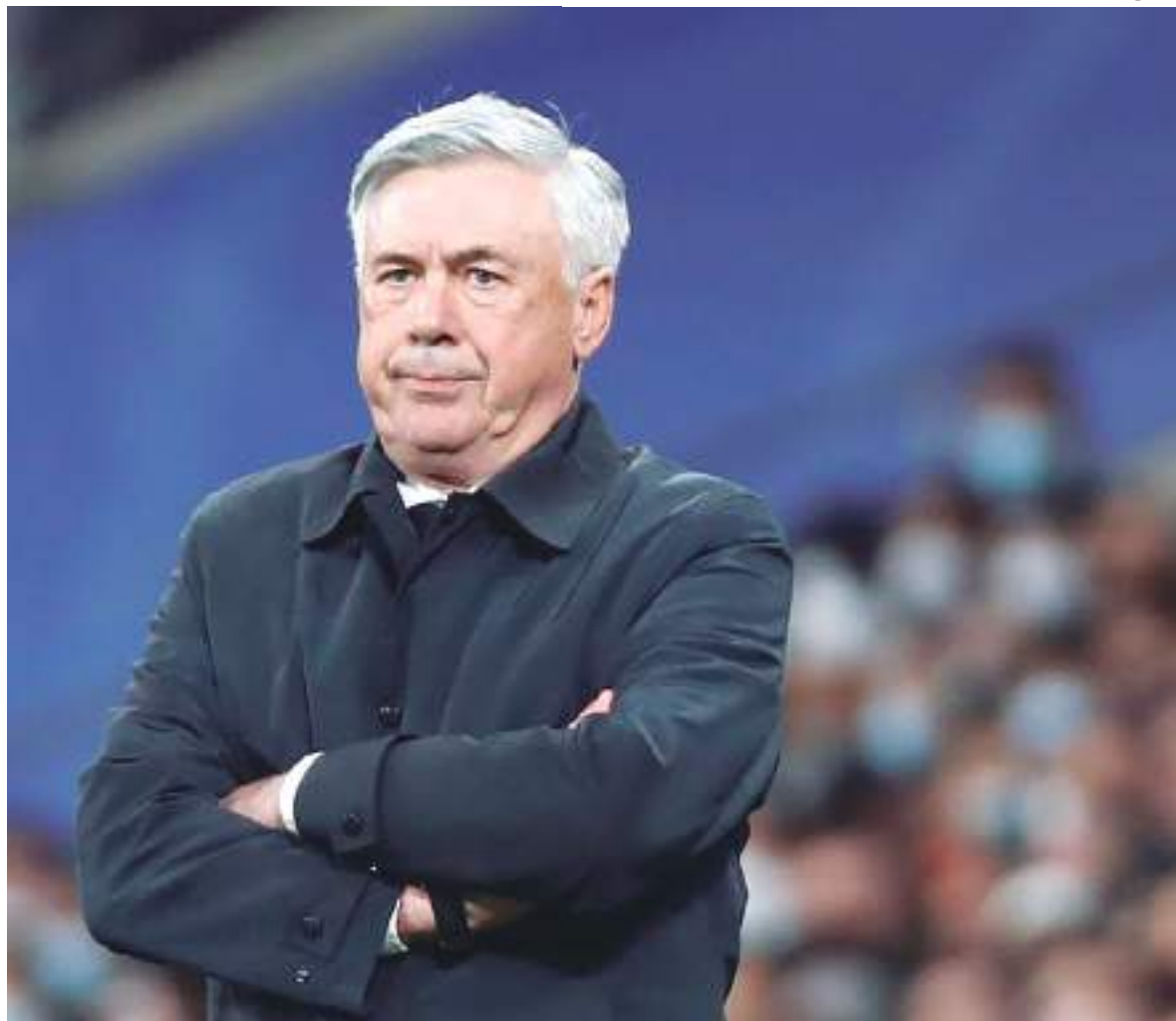
Carlo Ancelotti pode deixar o Real Madrid ainda nesta temporada, segundo jornalista

Seguindo pela La Liga, o Real Madrid enfrenta o Valladolid, precisando da vitória.