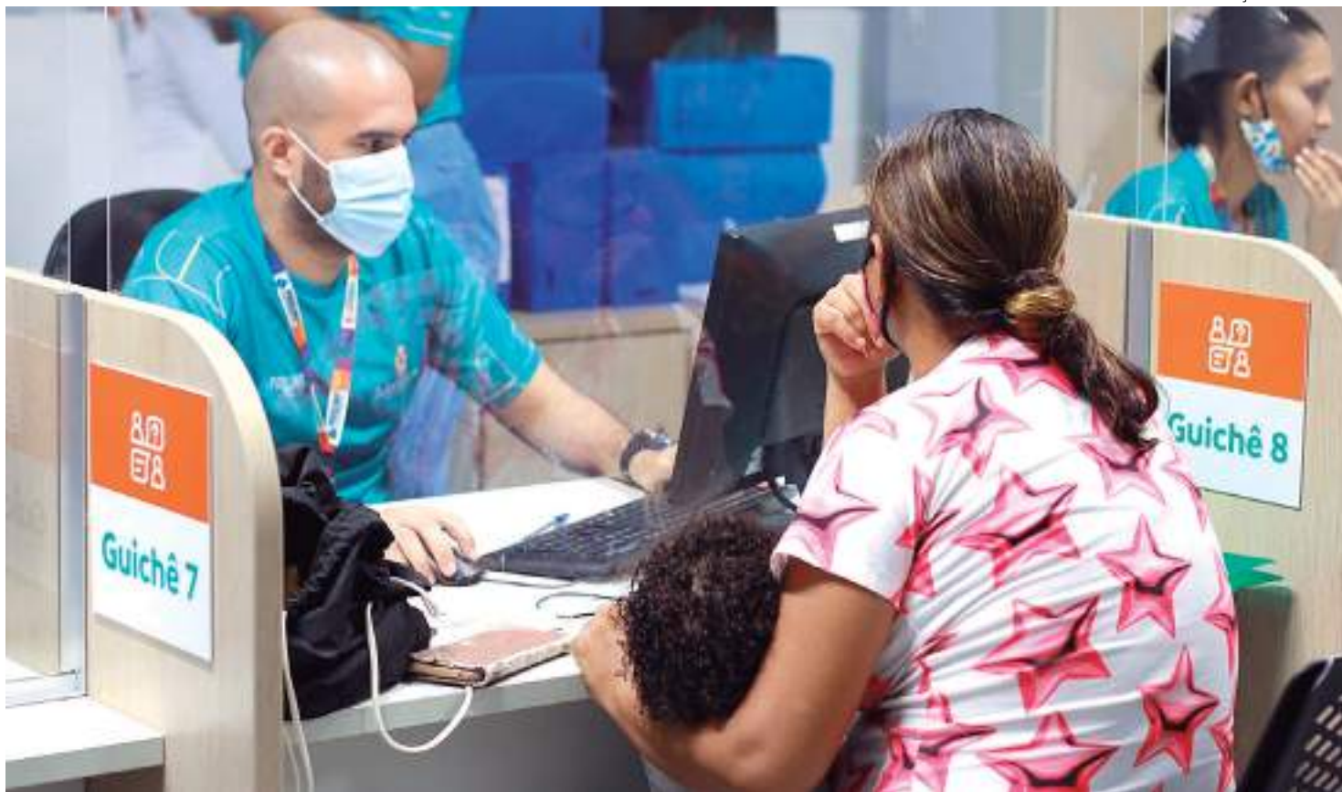
Mulher segurando uma criança enquanto recebe atendimento em guichê

"Nós estaremos levando os serviços da prefeitura para mais perto da população, garantindo cidadania. Em dois anos foram milhares de atendimentos, e agora com esse novo formato, iremos facilitar ainda mais o acesso. A determinação do prefeito David Almeida é que todos os cidadãos sejam tratados com dignidade e respeito e para isso estamos implementando políticas que visam melhorar a qualidade de vida dos menos favorecidos, incluindo ações de assistência social", declarou o secretário da Semasc,