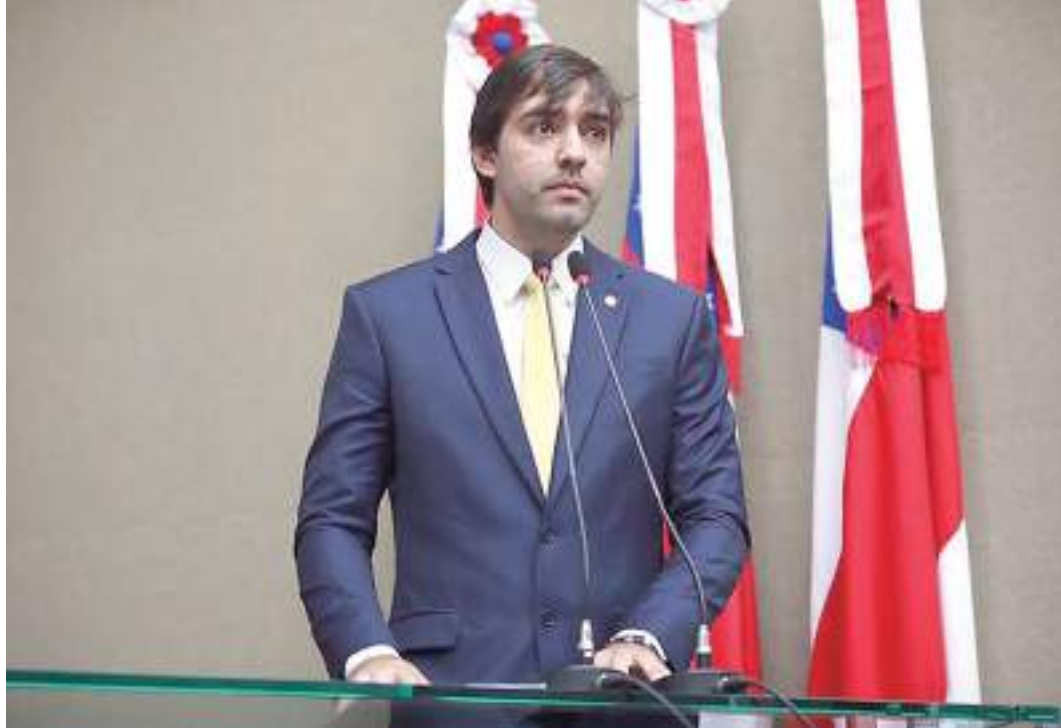
O deputado de primeiro mandato tem as pautas do interior do Amazonas como uma de suas prioridades

“Destá tribuna, faço uma reivindicação em nome do município de Nhamundá a quem eu tenho um carinho muito grande. É referente à comunidade de São Sebastião do Corocoro, que vem sofrendo por conta do desmoronamento em função da cheia dos rios e está