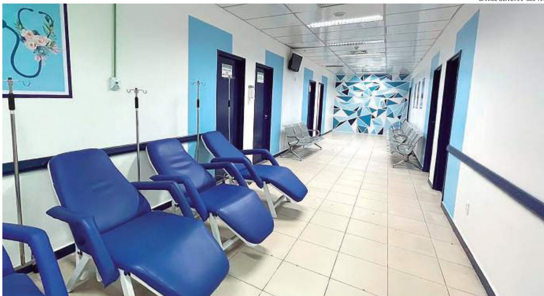
Espaço revitalizado do Hospital e Pronto Socorro Dr. Platão Araújo

“Esse é o primeiro espaço em que o paciente, se