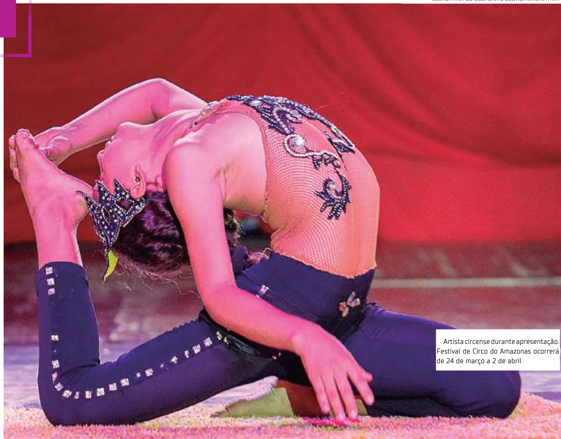
Artista circense durante apresentação. Festival de Circo do Amazonas ocorrerá de 24 de março a 2 de abril

A abertura do 3º Festival de Circo do Amazonas será