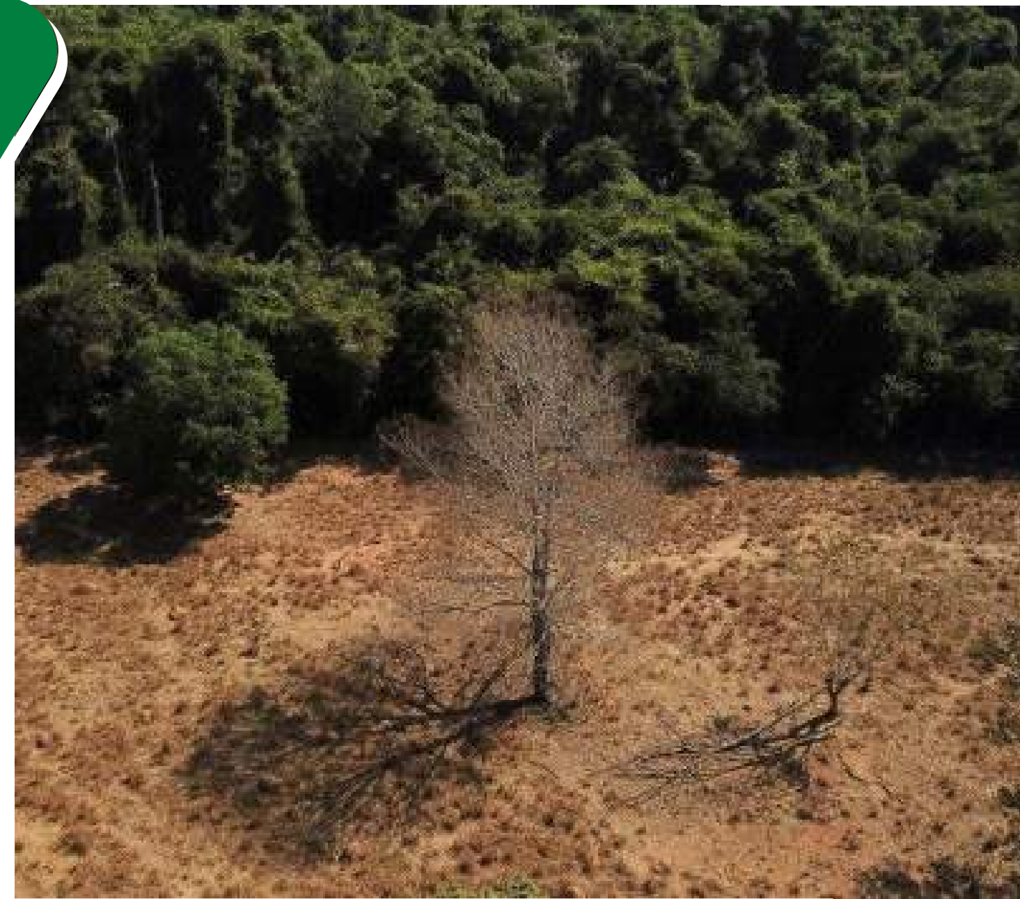
Floresta desmatada no Brasil. Amazonas é o quinto maior emissor por desmatamento do país

O estudo revela que as mudanças do uso da terra são o componente que elevou a maioria das emissões brutas do Brasil, dois anos atrás. Quan-