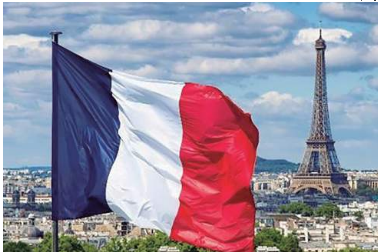
Bandeira francesa com Torre Eiffel ao fundo. País passa por momento de turbulência política

O presidente Macron quebrou semanas de silêncio sobre a nova política para dizer que permanecerá firme e que a lei entrará em vigor até o fim do ano, a certa altura comparando os protestos com a invasão do Capitólio dos Estados Unidos em 6 de janeiro de 2021.