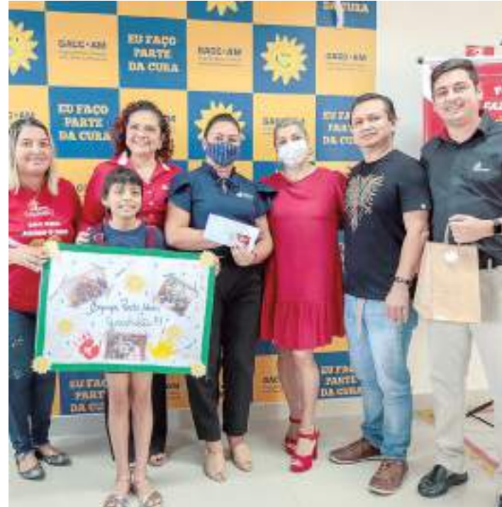
Representantes da Atem durante entrega de prêmio à diretoria do GAAC-AM

É importante também ler o regulamento completo da campanha acessando o endereço https://fazbemfazerobem.com.br/