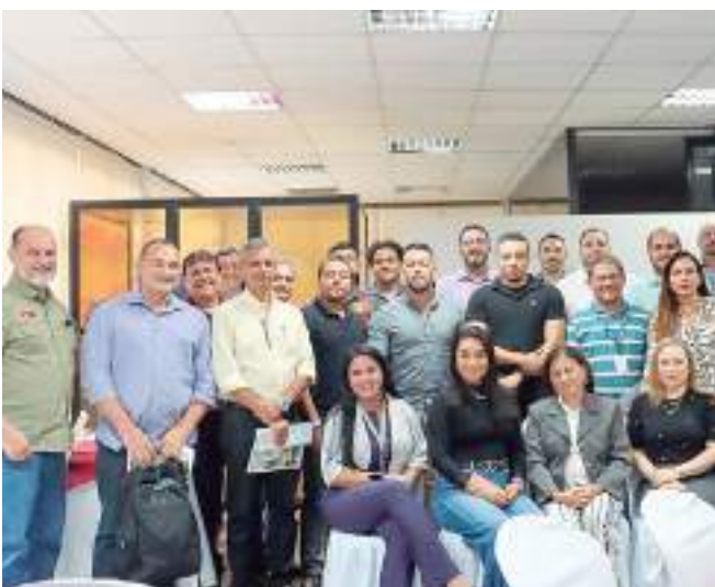
Companhia apresentou plano de expansão durante Café com Negócios