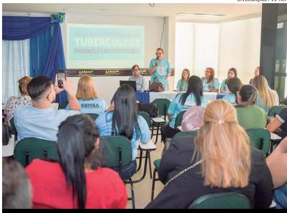
Servidores em ação de conscientização promovida pela FVS-RCP

Há ainda intensificação de busca por casos de Tuberculose para a investigação de Tuberculose Ativa e Tuberculose Latente, que é quando há a infecção, mas o paciente não apresenta sinais e sintomas comumente chamada de Infecção Latente da Tu-