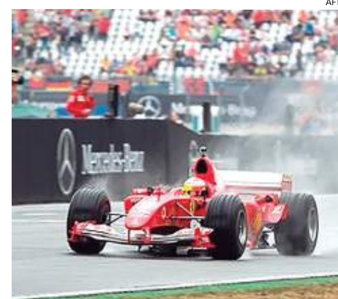
Carro foi pilotado por Michael Schumacher no GP de Interlagos

A RM Sotheby's não revela o preço inicial do leilão, contudo, este mesmo carro foi vendido em 2014 por US$ 1,8 milhão.