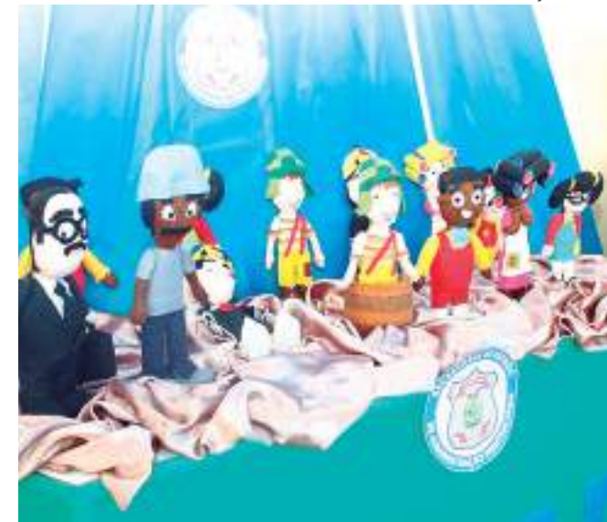
Bonecos feitos por reeducandos da Enfermaria Psiquiátrica