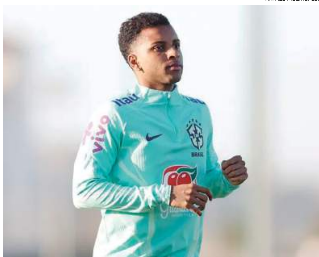
Rodrygo com o uniforme da Seleção Brasileira em campo de treinamento

Rodrygo será o 113º jogador a ter a honra de usar a 10 da seleção. Foram 18 antes de Pelé e agora 94 depois. Alguns nomes trazem curiosidades, o último