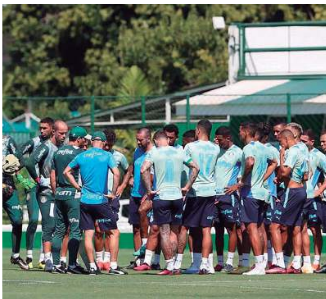
Equipe do Palmeiras em retorno de treinamento na Academia de Futebol

Com a data Fifa neste próximo fim de semana, o Palmeiras tem duas semanas de preparação até a final contra o Água Santa, previstas para os dias 2 e 9 de abril. Nestes primeiros dias de treinos focados na decisão, o técnico Abel Ferreira não conta com Weverton, Raphael Veiga e Rony, convocados pela