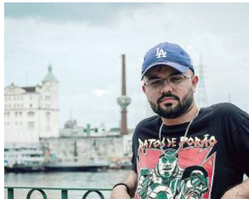
Rapper "Pinheiro" lança música "Trakinas Freestyle" nas principais plataformas digitais

A discografia do músico também pode ser ouvida no YouTube, através do link: http://bit.ly/MawatoDiscografia . Assinada pelo produtor musical Diego Mac, "Trakinas Freestyle" está disponível agora no Itunes, Amazon Music, Spotify, Deezer, Tidal, Youtube, TikTok etc.