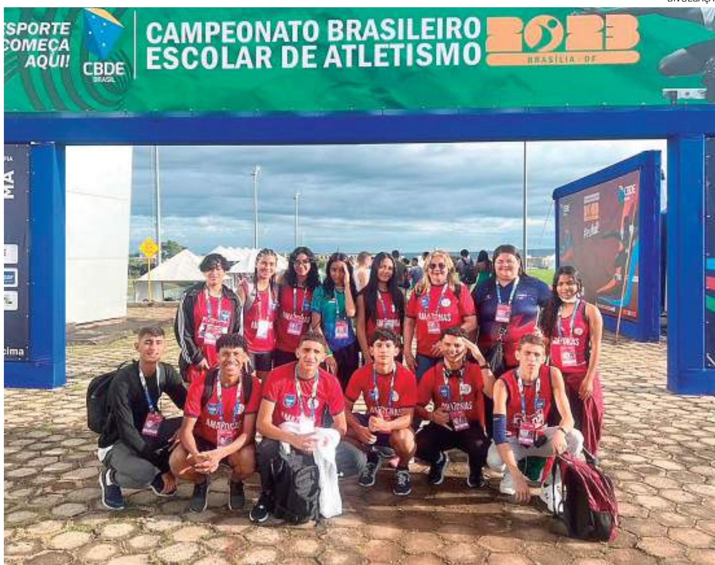
Estudantes da rede estadual de ensino que participaram do Campeonato Brasileiro em Brasília

"O nível da competição foi muito forte, por isso que a sensação de quando ganhei