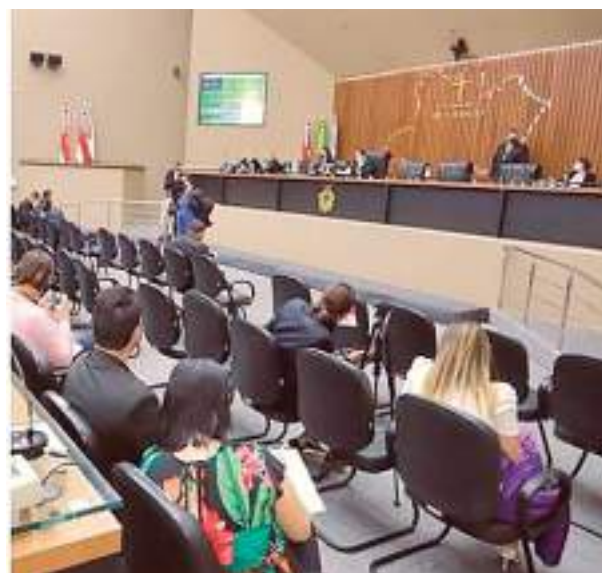
O ex-deputado federal foi oficialmente indicado ao cargo pela bancada federal do Amazonas