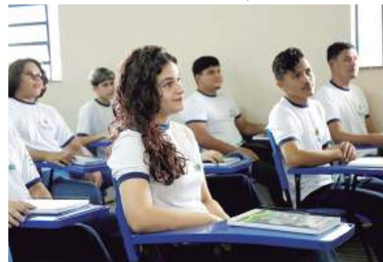
Estudantes sentados em sala de aula