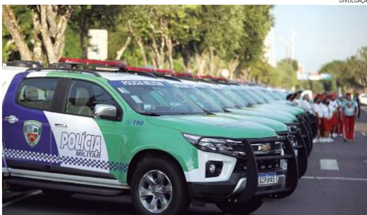
Governo investiu no reforço da segurança do Estado com entrega de viaturas e armamentos para as polícias

Esses resultados foram alcançados, graças ao trabalho integrado das forças de Segurança a partir dos investimentos realizados pelo governo do Estado nos últimos anos com o programa Amazonas Mais Seguro, lançado em 2021. Durante esse período, o Governo do Amazonas realizou uma série de entregas, incluindo materiais para suprir necessidades de anos sem investimentos pesados, aquisição e implantação de tecnologia como o Cerco Inteligente de Videomonitoramento, o 'Paredão', que conta