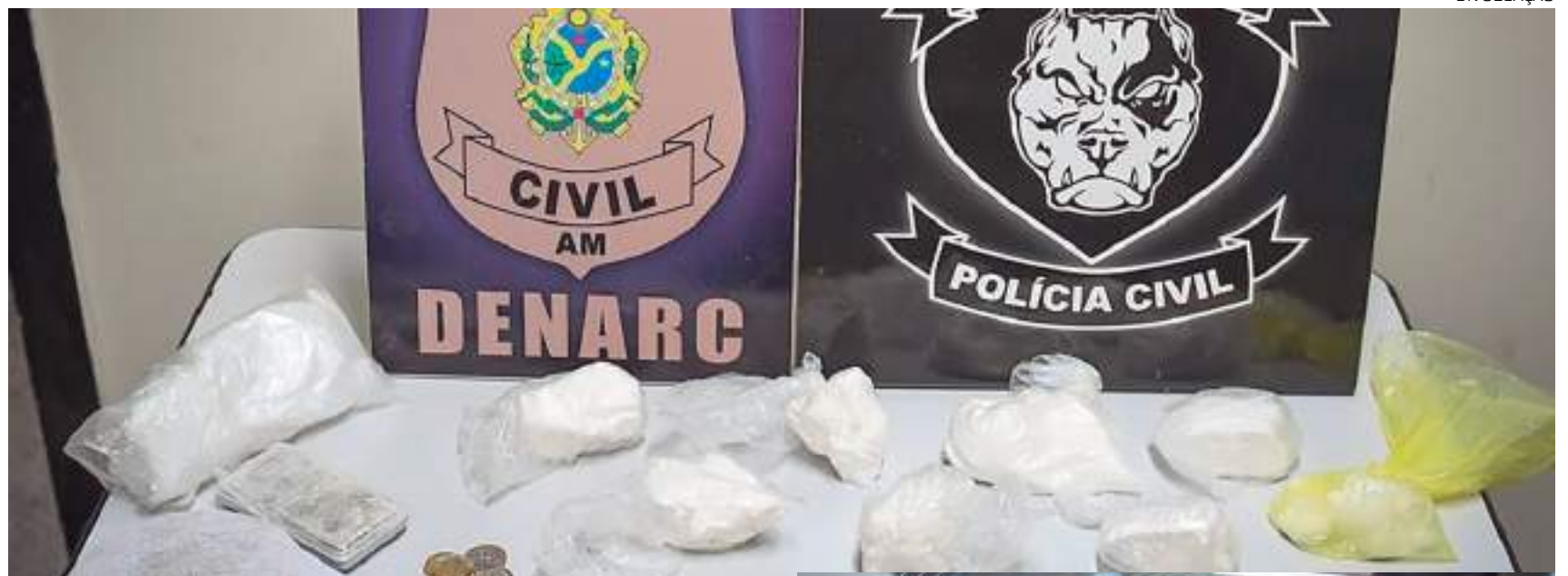
Cassiterita, dinheiro e balança apreendidos

“Nós tivemos o registro de um Boletim de Ocorrência de um motorista de caminhão que foi feito refém e os criminosos levaram a carga de 10 toneladas de cassiterita. Após dois meses de investigação, hoje, conseguimos efetuar a prisão de três envolvidos no crime, sendo um deles preso em Roraima, mas ainda há três foragidos. O que chama