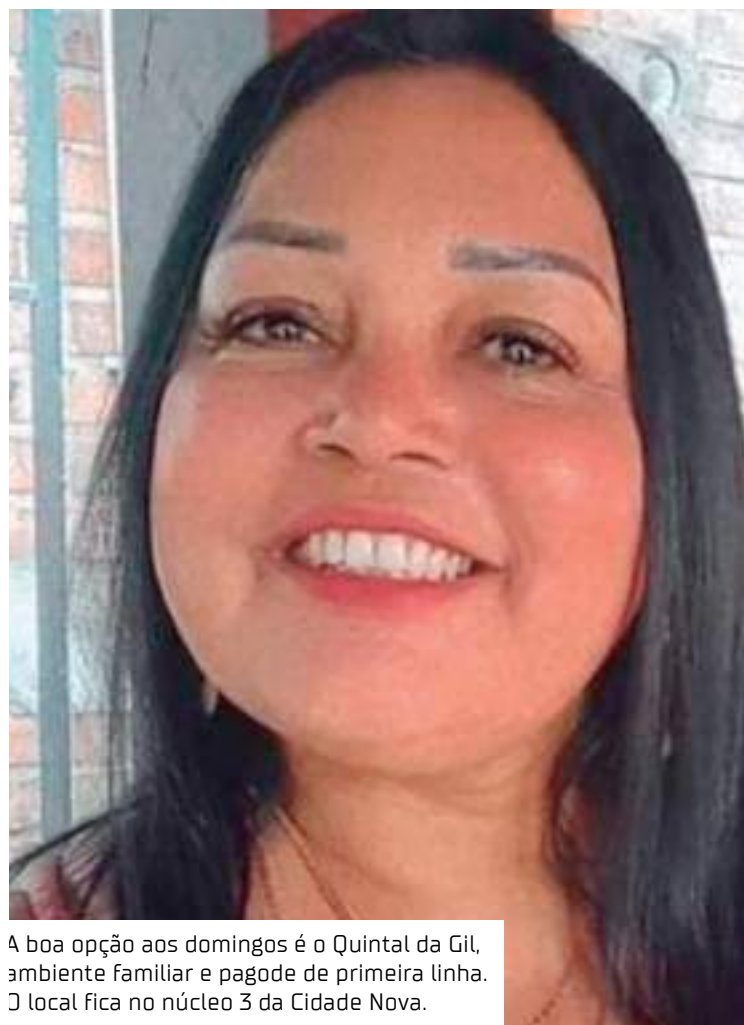
A boa opção aos domingos é o Quintal da Gil, ambiente familiar e pagode de primeira linha. O local fica no núcleo 3 da Cidade Nova.