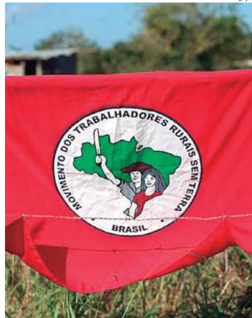
Grupo do MST invadiu área da Suzano no Estado da Bahia

A Suzano disse, em nota, que não houve descumprimento, e que a invasão das propriedades com essa justificativa é ilegal, como já foi reconhecido pela Justiça: "Este acordo assinado com a Suzano é um acordo entre Suzano, MST e Instituto Nacional de Colonização e Reforma Agrária - Incra, e não foi violado pela Suzano. A completa entrega das áreas pela Suzano depende de processos públicos que ainda não ocorreram ou foram implementados pelo Incra".