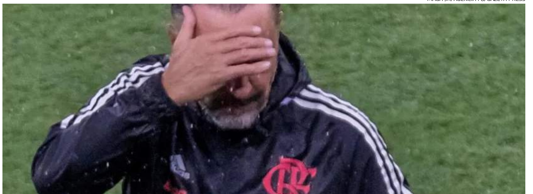
Vitor Pereira cobrindo os olhos em campo de futebol

significa estabilidade fora dele. Abel Braga, Jorge Jesus, Domènec Torrent, Rogério Ceni, Renato Gaúcho, Paulo Sousa, Dorival Júnior e Vitor Pereira fazem o rubro-negro figurar na vice-liderança entre os outros oito clubes brasileiros que disputam a edição de 2023 da Libertadores. Athletico e Internacional estão ao seu lado.