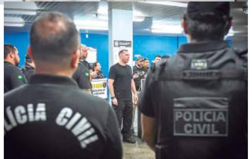
Reunião com policiais envolvidos na operação

Os homens serão encaminhados para audiência de custódia e ficarão à disposição da Justiça.