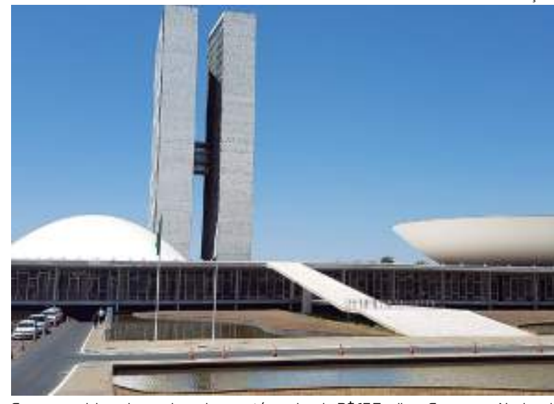
Cargos comissionados podem chegar até o valor de R$ 15,7 mil no Congresso Nacional