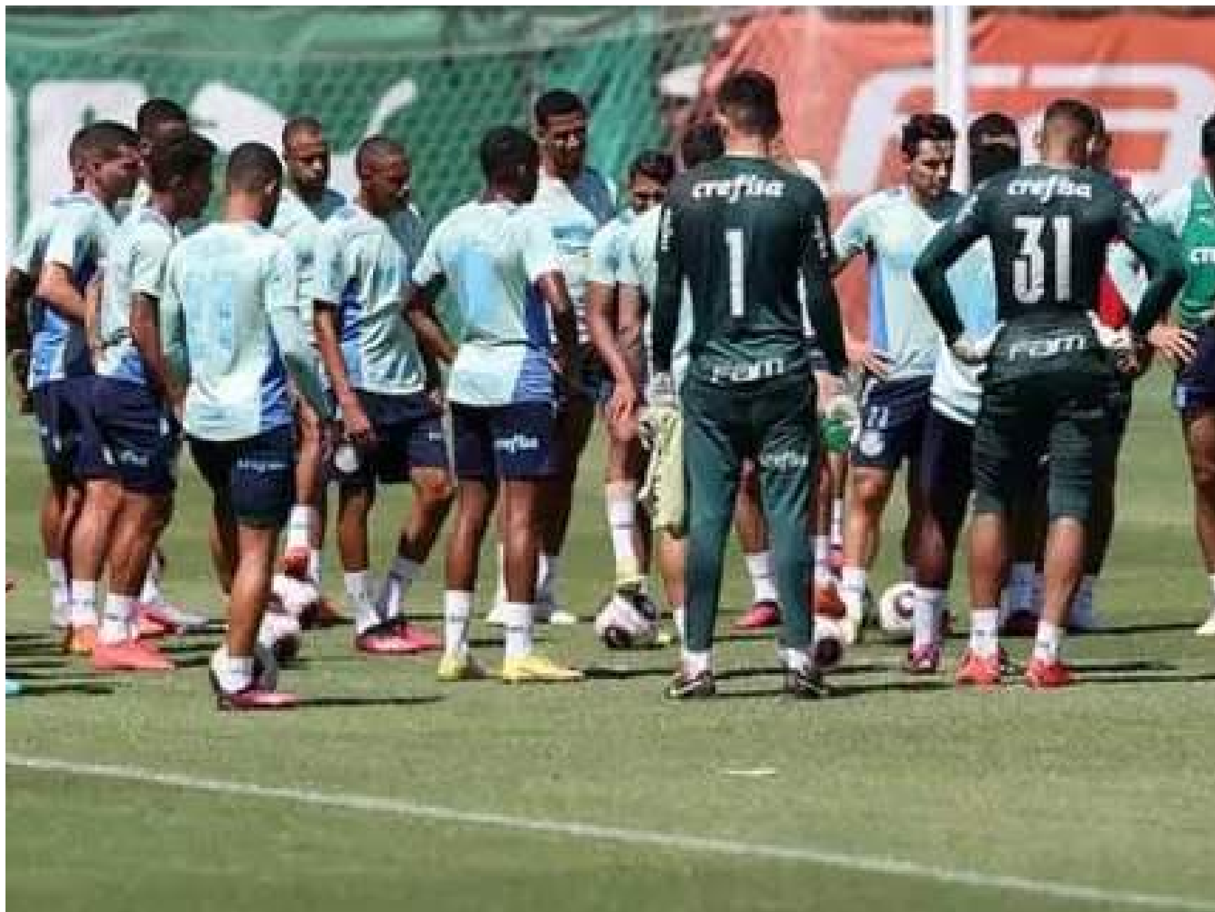
Elenco do Verdão em treinamento antes de enfrentar o Bugre

O time do ABC tem 26 pontos, um a menos que o Palestra. Assim, uma vitória do Bernô combinada com um empate ou derrota do