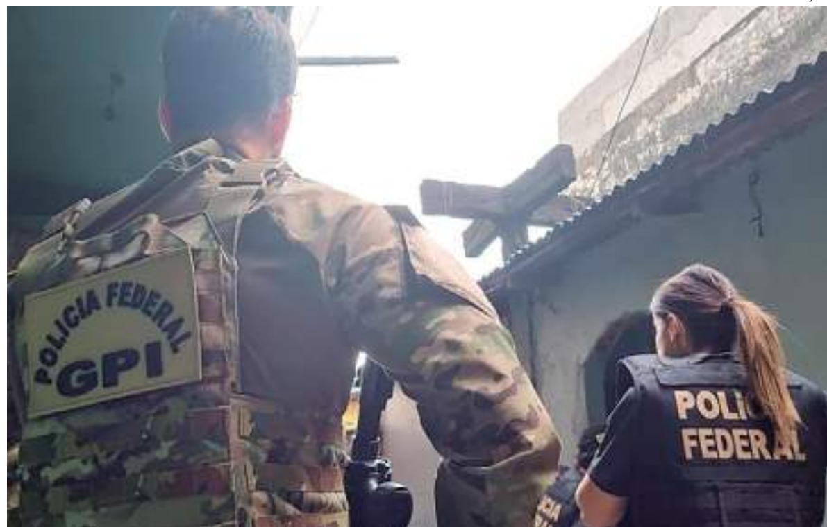
Policiais federais de costas em operação