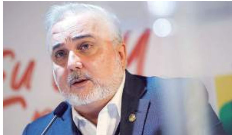
Presidente Jean Paul Prates afirma que outras políticas podem ser adotadas

O Conselho de Administração sugeriu então que os acionistas avaliem a criação da reserva para reter até R$ 6,5 bilhões do resultado do