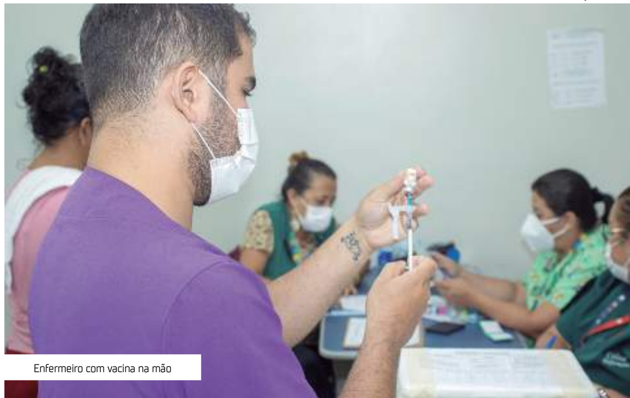
Enfermeiro com vacina na mão

"Os trabalhos científicos mostram que temos índices que variam de 70% a 99% da presença do HPV nos casos desse tipo de câncer, e a vacinação é a principal arma que temos contra ele. A OMS (Organização Mundial de Saúde) coloca