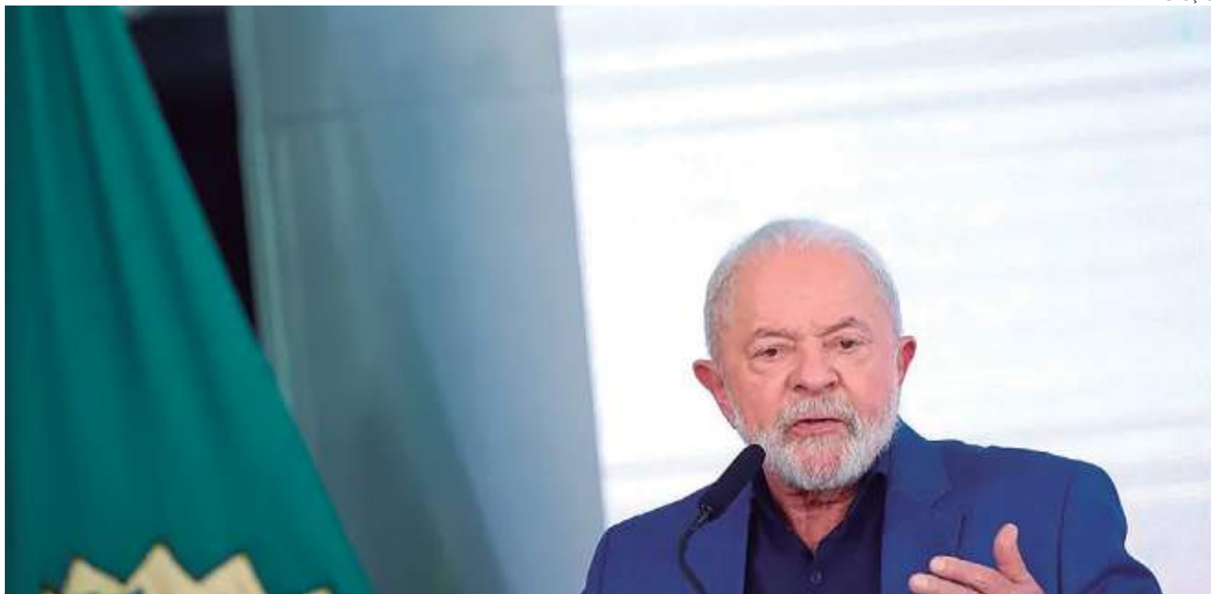
Presidente afirma que governo passado não estimulou crescimento da economia

Para Haddad, a desaceleração da economia está ligada à atual taxa de juros, que, segundo o