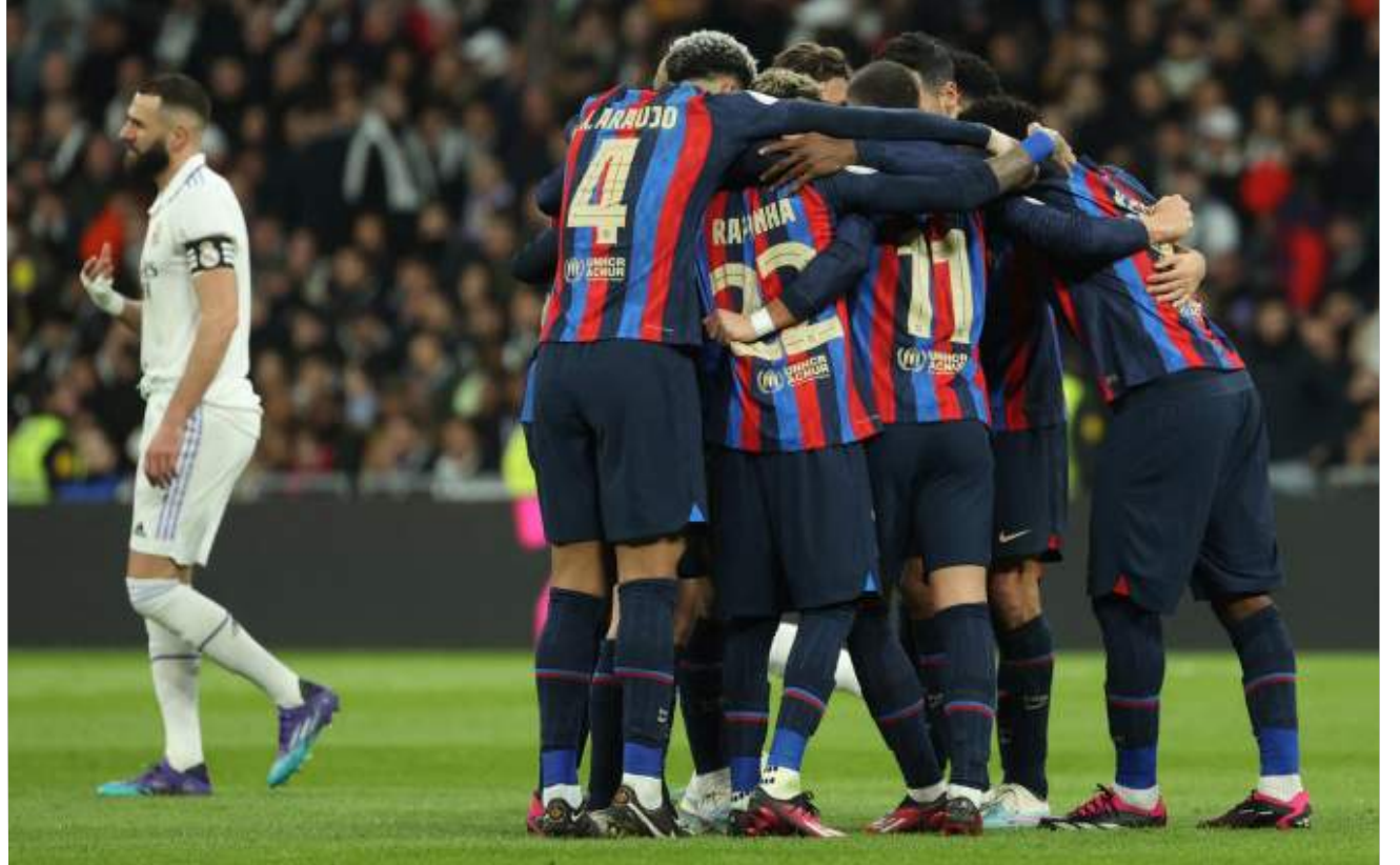
Jogadores do Barcelona comemorando o único gol da partida

Apesar do domínio merengue, quem chegou com muito perigo novamente foi o Barcelona. Aos 26 minutos da segunda etapa, Kessié recebeu livre na grande área do Real Madrid e finalizou com endereço, mas deu azar quando a bola bateu em seu companheiro Ansu Fati, que praticamente jogou de