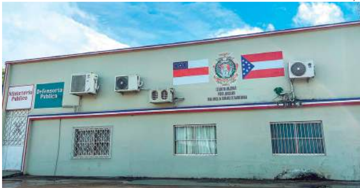
Vara de Justiça funciona no município de Barreirinha, no Amazonas