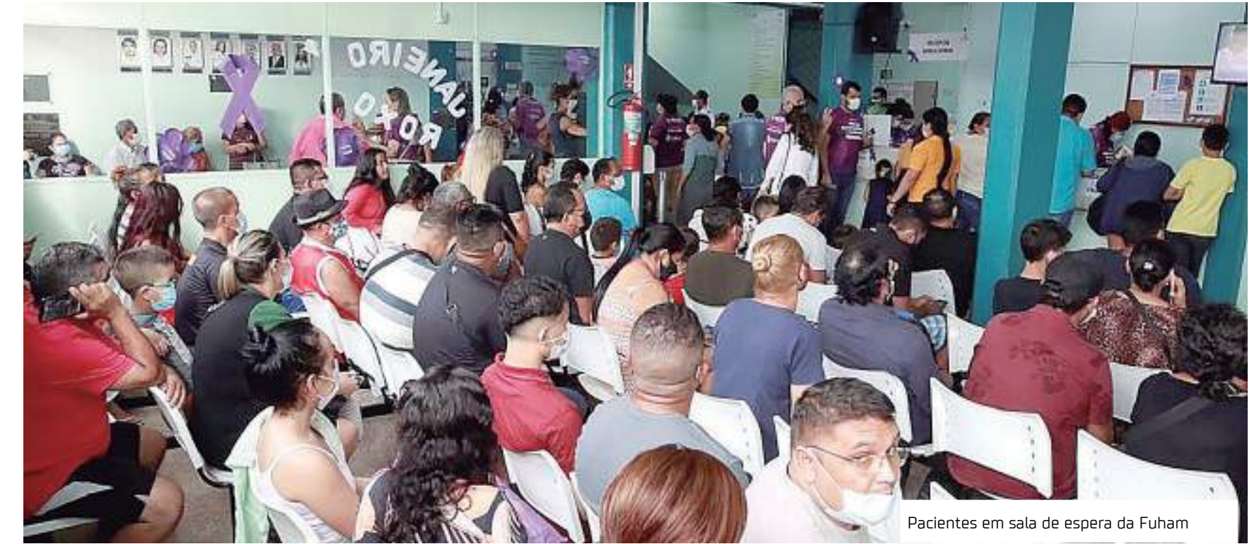
Pacientes em sala de espera da Fuham

“Quando a fila fica muito longa, o paciente resolve os problemas por outros meios ou então o problema se resolve e ele falta no dia. As agendas estavam cheias. Então a gente resolveu