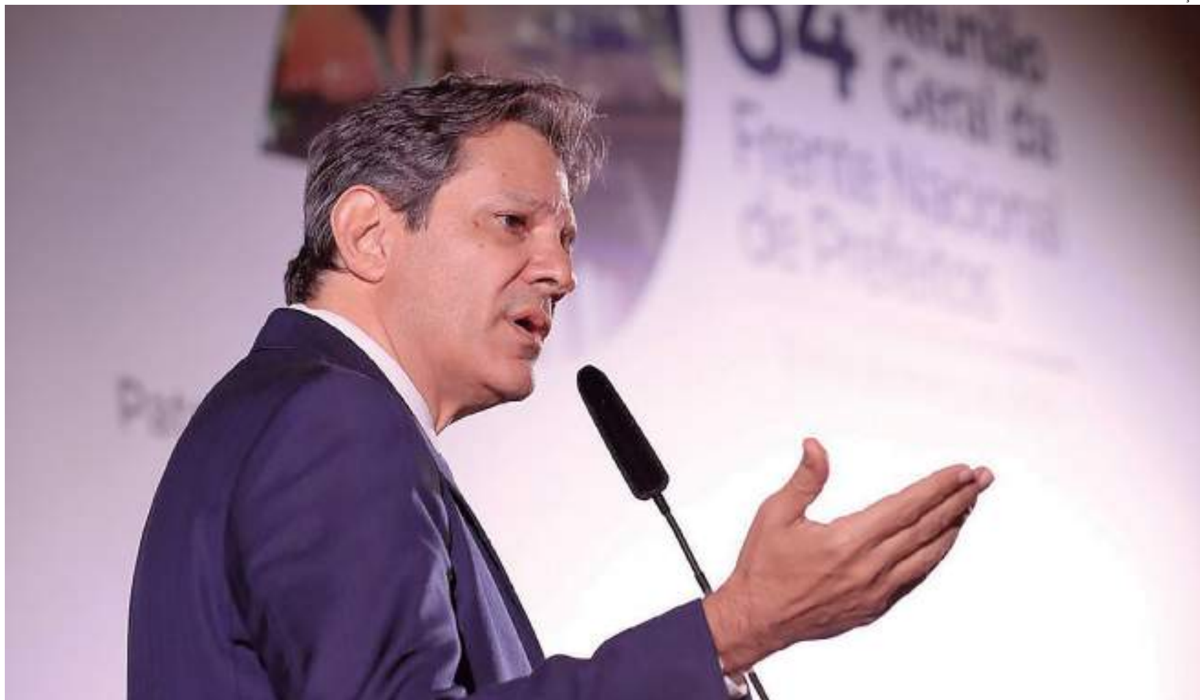
O ministro comparou a criação do IBS ao Fundo de Manutenção e Desenvolvimento da Educação Básica (Fundeb)

A unificação de vários tributos no Imposto sobre Bens e Serviços (IBS) não trará perda de arrecadação aos municípios, disse nesta segunda-feira (13) o ministro da Fazenda, Fernando Haddad. Ele participou de debate sobre a Reforma Tributária promovido pela Frente Nacional dos Prefeitos (FNP).