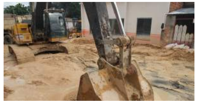
Obras para contenção da erosão na comunidade Monte Cristo