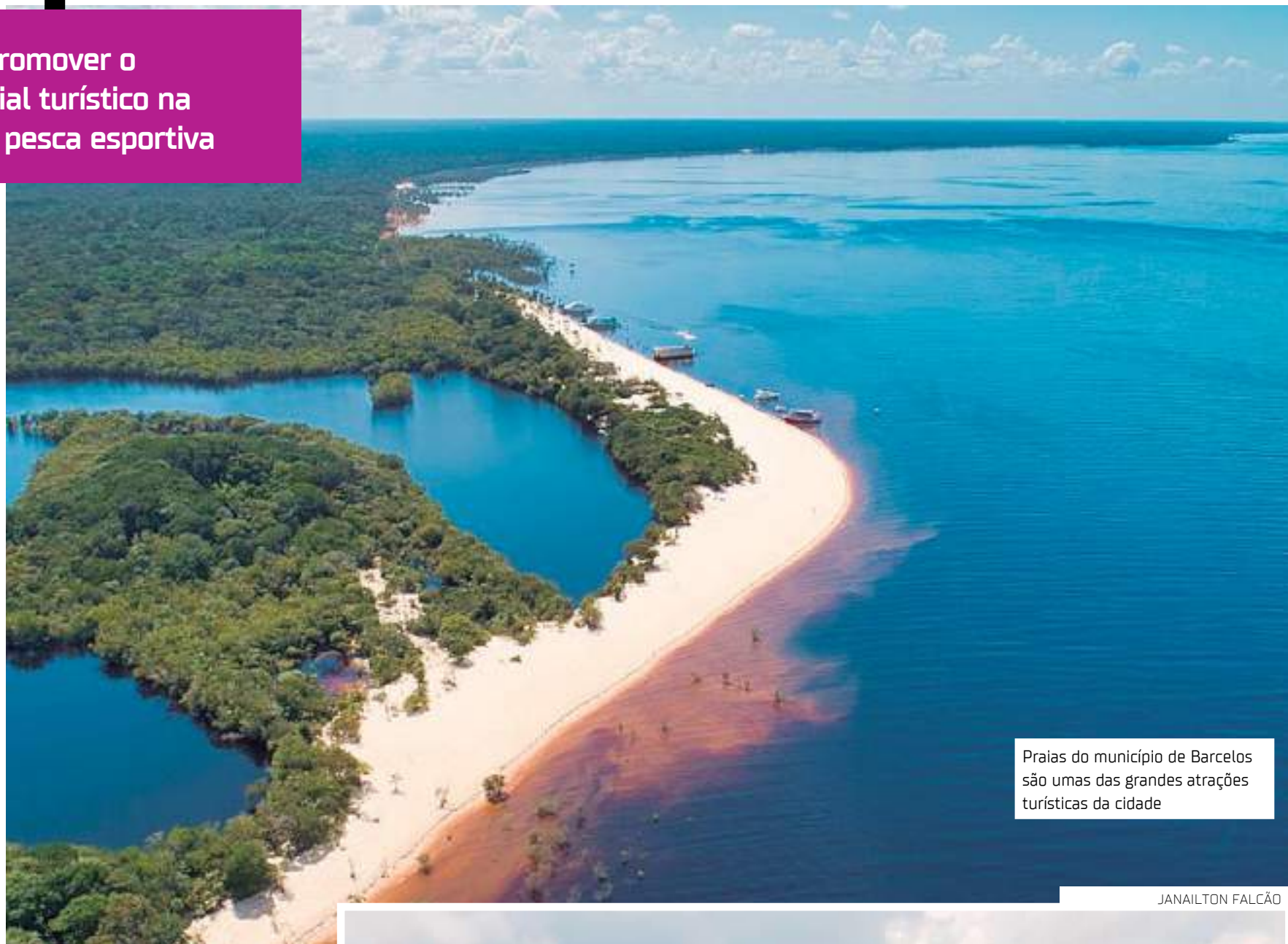
Praias do município de Barcelos são umas das grandes atrações turísticas da cidade

A primeira atividade da programação é sessão de negócios, que oferta atendimentos nesta segunda (13), das 9h às 12h e das 14h às