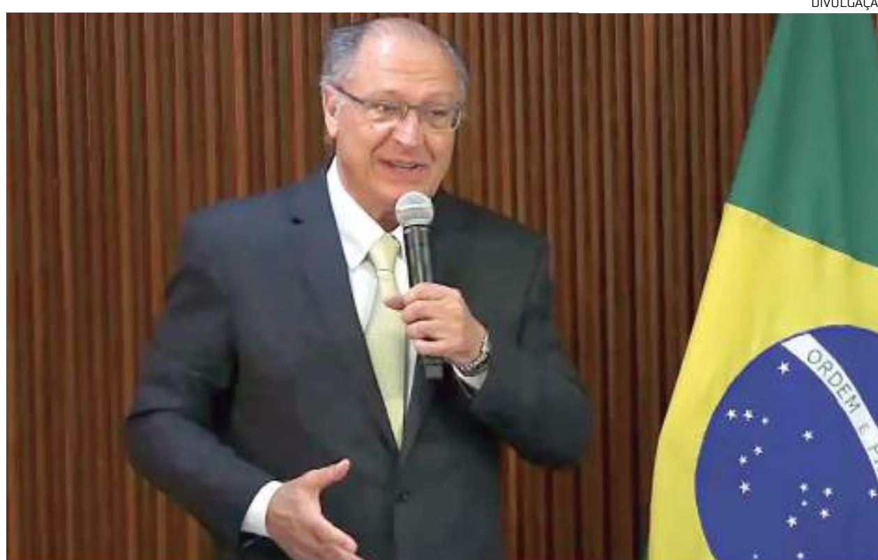
Vice-presidente garante que nova Reforma Tributária vai ajudar a reduzir a taxa de juros

"A inflação não é de demanda, não faz sentido uma taxa tão alta. Não é a Selic que vai resolver", comentou. Nas últimas semanas, o presidente Lula reclamou sobre a taxa Selic de 13,75% e da gestão de Roberto Campos Neto à frente do Banco Central.