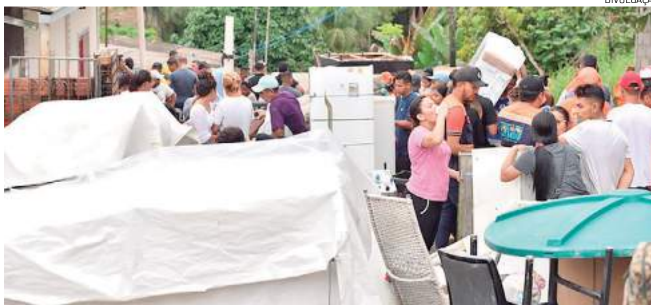
Desmoronamento do barranco atingiu 11 casas