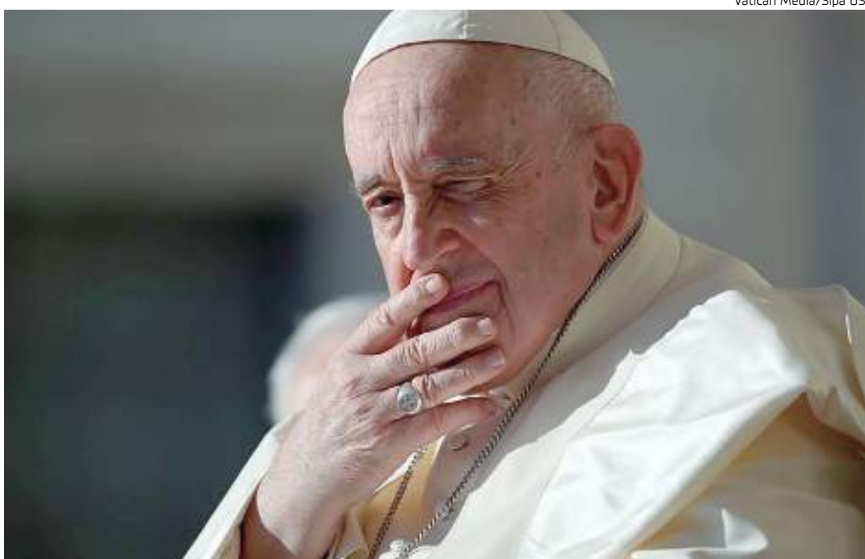
Francisco tem 86 anos e é o único pontífice latino-americano da história

Francisco afirmou que estaria pronto para renunciar se graves problemas de saúde o impedissem de administrar a Igreja de 1,38 bilhão de membros. Mas ele também disse que acha que os papas deveriam tentar manter a função por toda a vida e que ser papa emérito - como Bento foi - não deveria se tornar uma "moda".