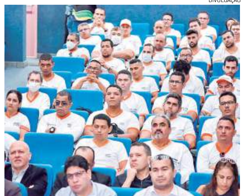
Aprovados já trajam uniforme de alunos do órgão

"A aula inaugural tem mais essa função: dar boas-vindas, explicar para eles a história da instituição, de que forma e que metodologia será adotada no curso de formação. No geral, dar traços e linhas iniciais de como funciona a administração pública", ressaltou.