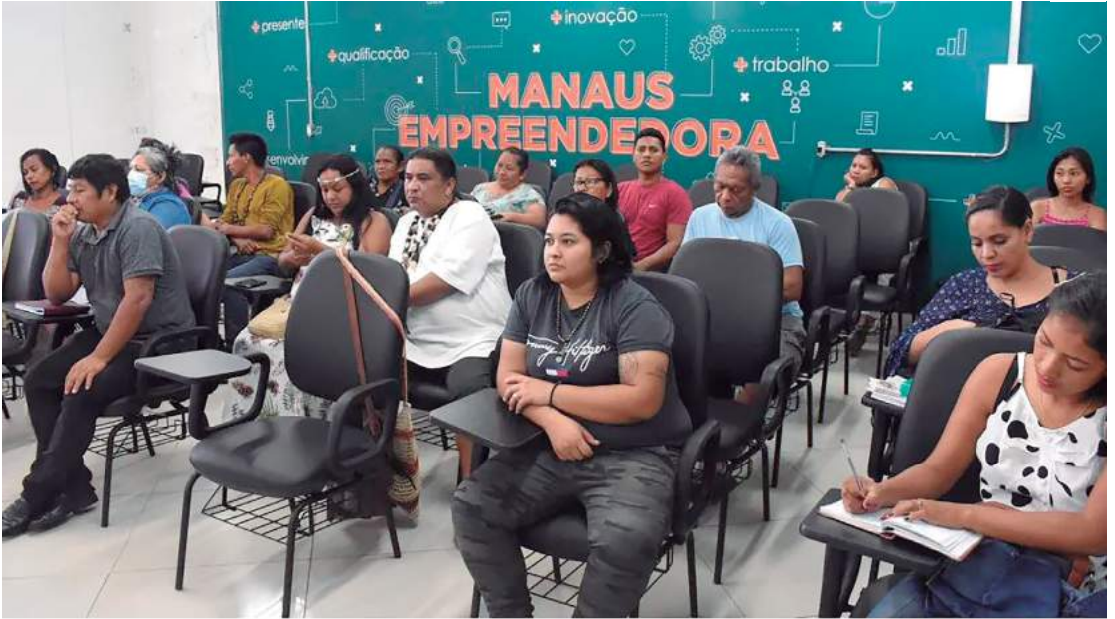
Objetivo do programa é ofertar capacitação e qualificação profissional para todos os artistas residentes em Manaus