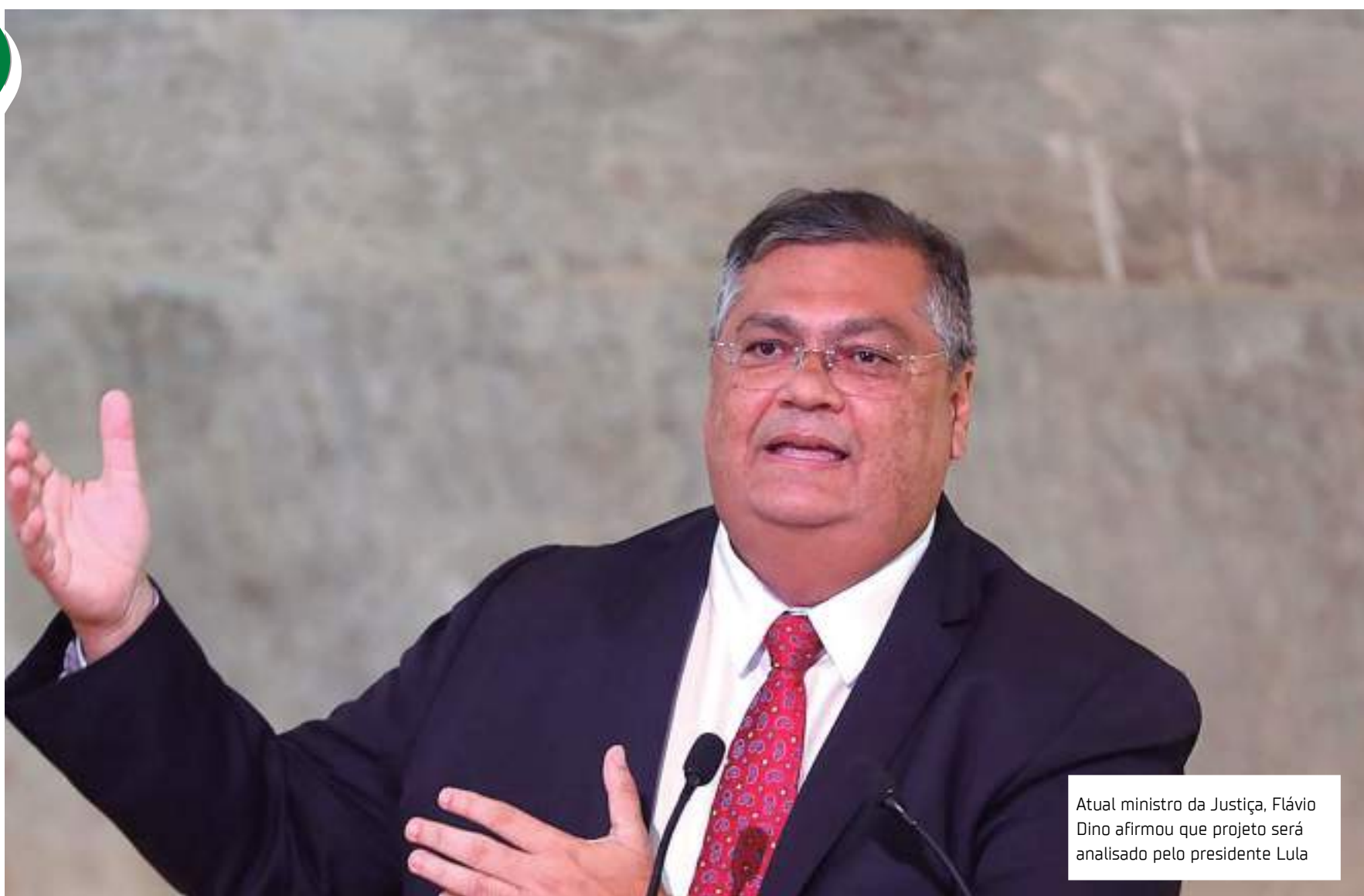
Atual ministro da Justiça, Flávio Dino afirmou que projeto será analisado pelo presidente Lula

Ministro da Justiça, Flávio Dino, espera que a lei seja aprovada ainda neste ano