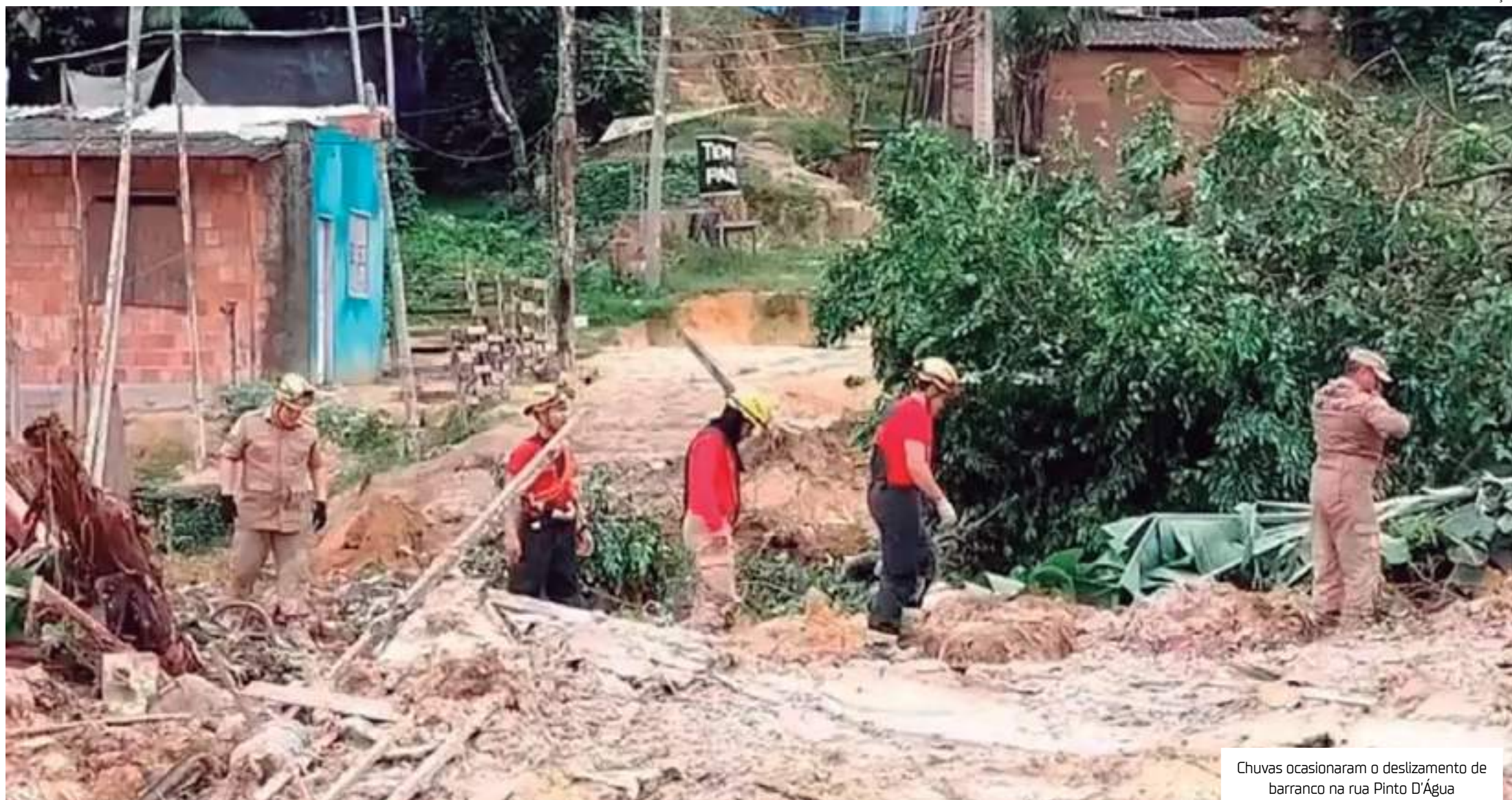
Chuvas ocasionaram o deslizamento de barranco na rua Pinto D'Água

O desmoronamento do barranco no Jorge Teixeira vitimou oito pessoas, sendo quatro adultos e quatro crianças