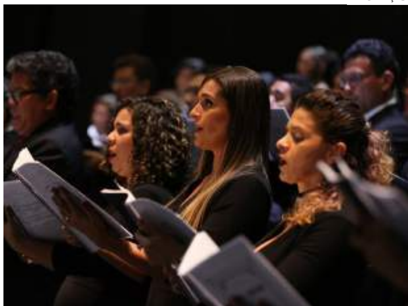
Cantores se apresentam durante show no Teatro Amazonas

Para compor o quadro de pessoal do Madrigal do Amazonas e do Grupo Vocal dos Corpos Artísticos (GVCA), a Secretaria de Cultura e Economia Criativa lança edital com o período de inscrição até amanhã (15). Para concorrer às vagas, os candidatos devem ter entre 18 e 55 anos. As inscrições são efetuadas exclusivamente pela internet, mediante o preenchimento do formulário disponível na aba "Editais" do portal da Cultura (cultura.am.gov.br).