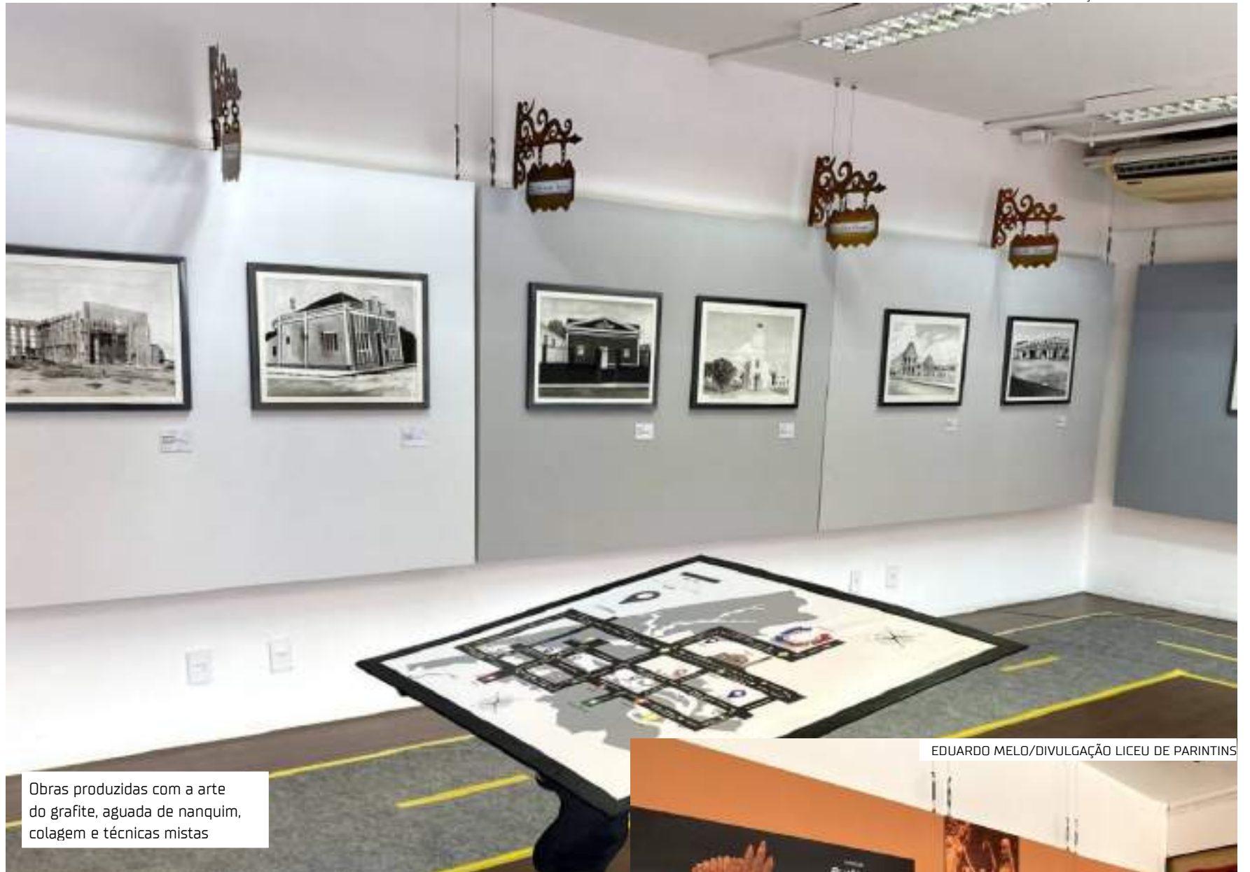
Obras produzidas com a arte do grafite, aguada de nanquim, colagem e técnicas mistas

para muitos artistas nas diversas áreas, é uma instituição que se dedica à formação dos profissionais, para que o talento caminhe junto com a qualificação técnica, e a cultura se torne uma atividade rentável", disse o secretário.