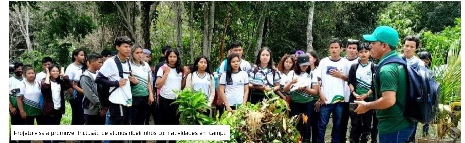
Projeto visa a promover inclusão de alunos ribeirinhos com atividades em campo

De acordo com o educador, a iniciativa nasceu após o corpo docente perceber que a escola recebe, anualmente, uma quantidade considerável de alunos ribeirinhos, quilombolas e indígenas da etnia Sateré-Mawé, e que seria importante desenvolver ação voltada para auxiliar na socialização deles. "Normalmente, esses estudantes