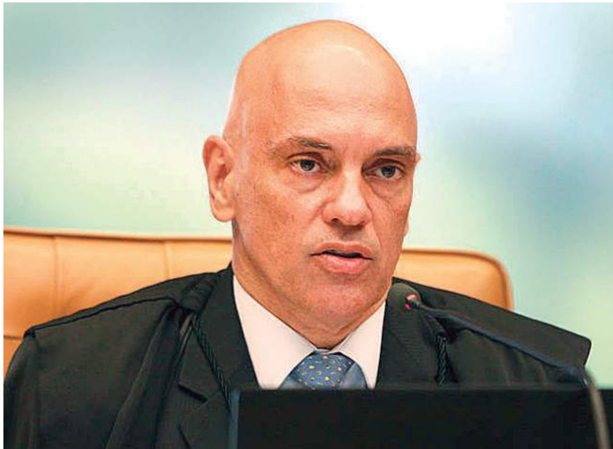
Ministro considerou que acusados liberados não representam risco para sociedade no momento

O STF também divulgou um balanço com números sobre os atos.