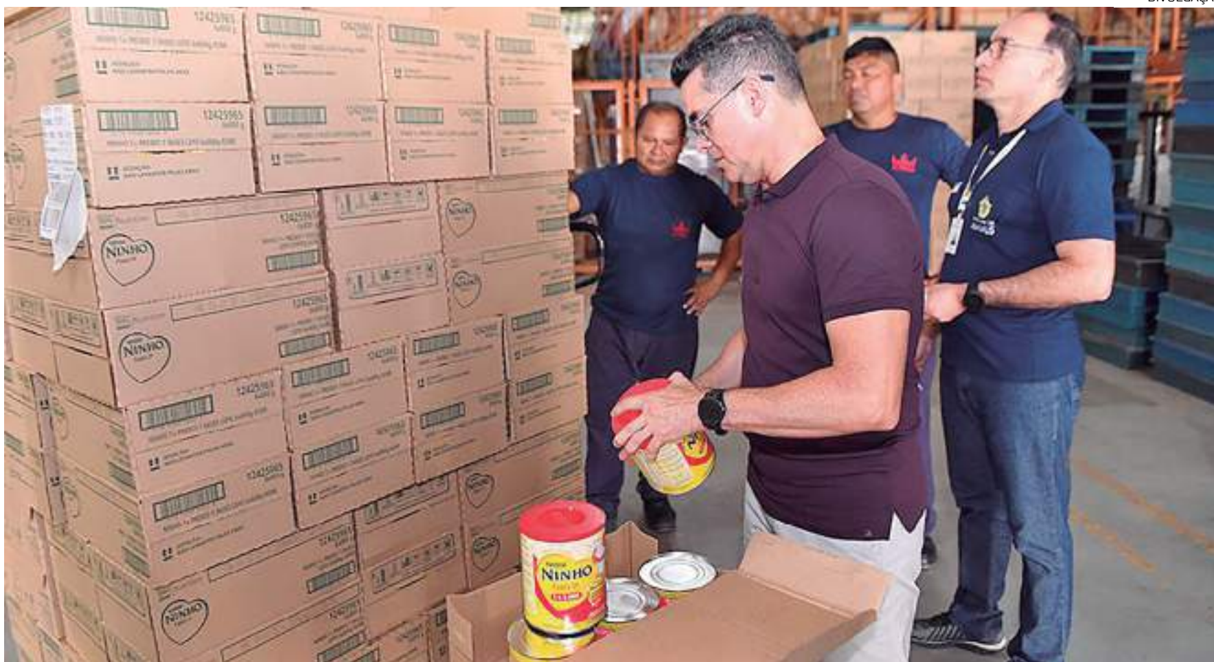
Desde o dia 6 de Março, as centrais de distribuição do "Leite do Meu Filho" estão realizando a entrega das fórmulas infantis para crianças de 1 e 2 anos de idade

Na próxima segunda-feira (20), a distribuição será voltada para responsáveis com as letras iniciais G, H