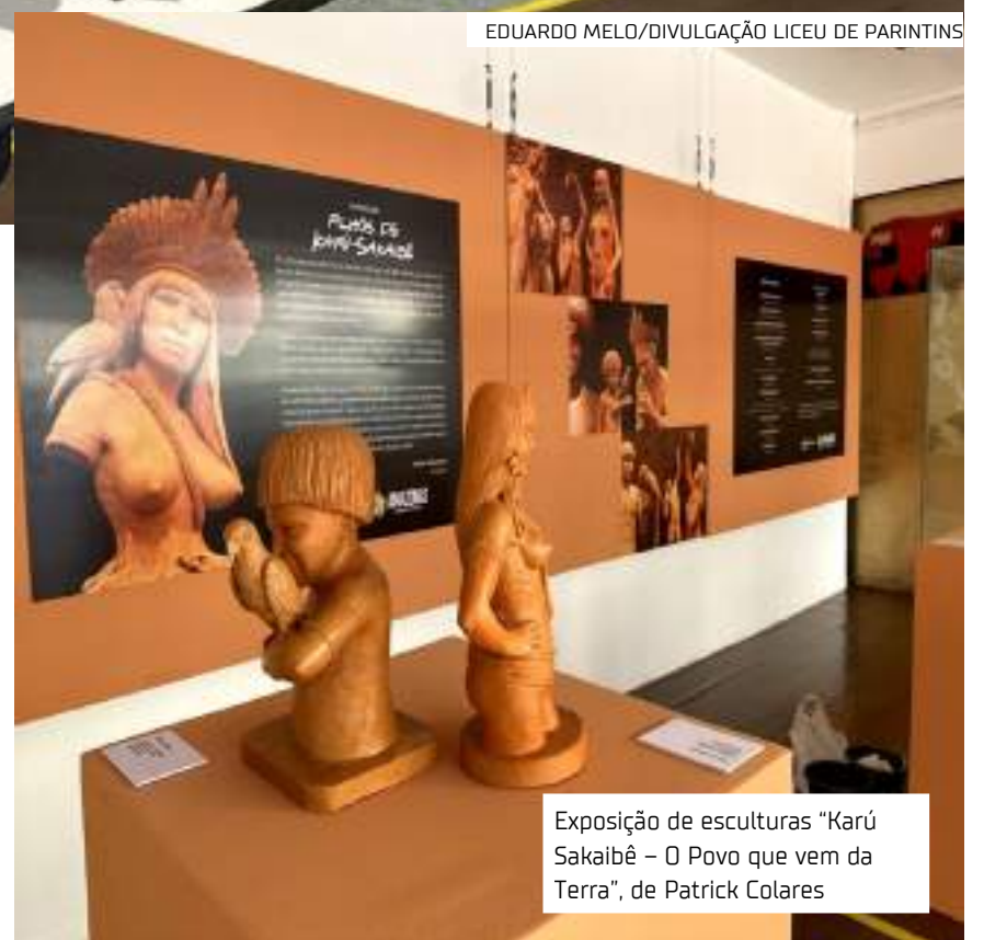
Exposição de esculturas "Karú Sakaibê - O Povo que vem da Terra", de Patrick Colares

As exposições "Recordações" e "Karú Sakaibê - O Povo que vem da Terra", têm entrada gratuita no Liceu de Parintins, avenida das Nações Unidas, Centro. A visitação segue até o dia 13 de maio nos seguintes horários: Segunda a sexta, das 8h30 às 11h e das 14h30 às 17h; e aos sábados, das 14h às 18h.