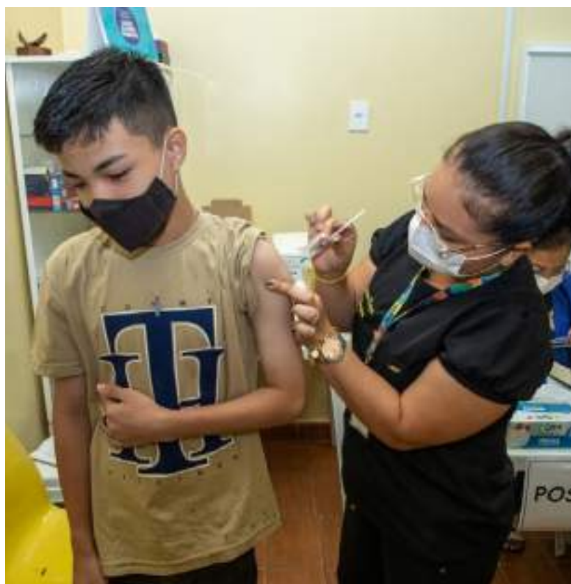
Criança recebe vacinação contra a Covid-19

dade de que os pais protejam suas crianças e não deixem de completar o esquema vacinal.