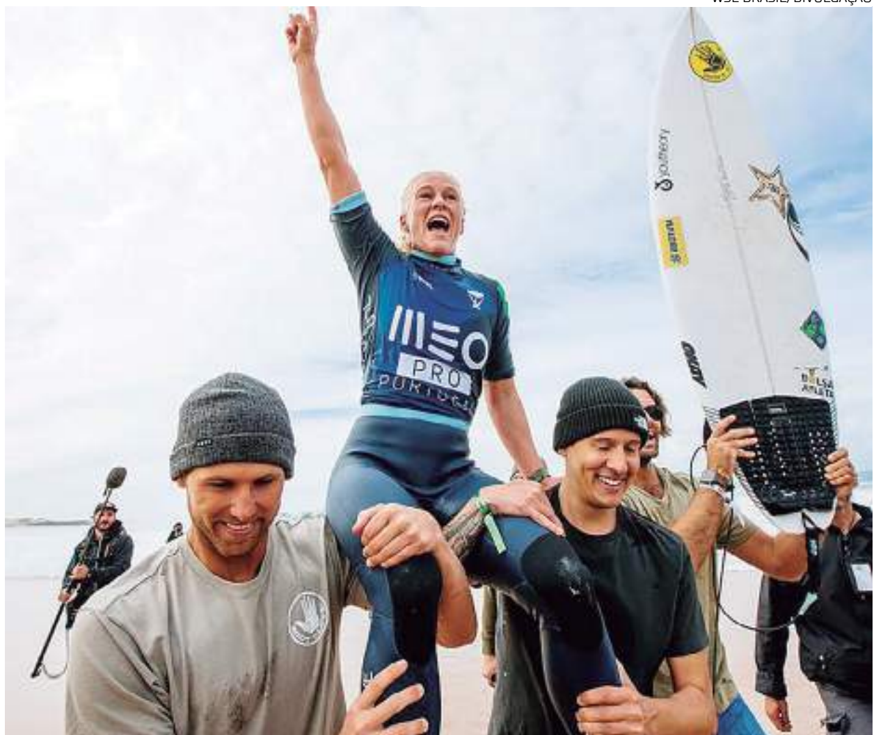
Weston-Webb avança às quartas da competição internacional de surfe em Peniche

Medina terá pela frente nas oitavas o norte-americano Griffin Colapinto, que derrotou hoje (13) o australiano Jackson Baker ao totalizar 14.43 contra 13.17.