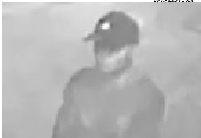
Homem matou namorada na madrugada do dia 27 de março deste ano

Quem tiver informações da localização do indivíduo, deve entrar em contato pelo número (92) 98118-9535, disque-denúncia da DEHS. “A identidade do informante será preservada”, garantiu a delegada.