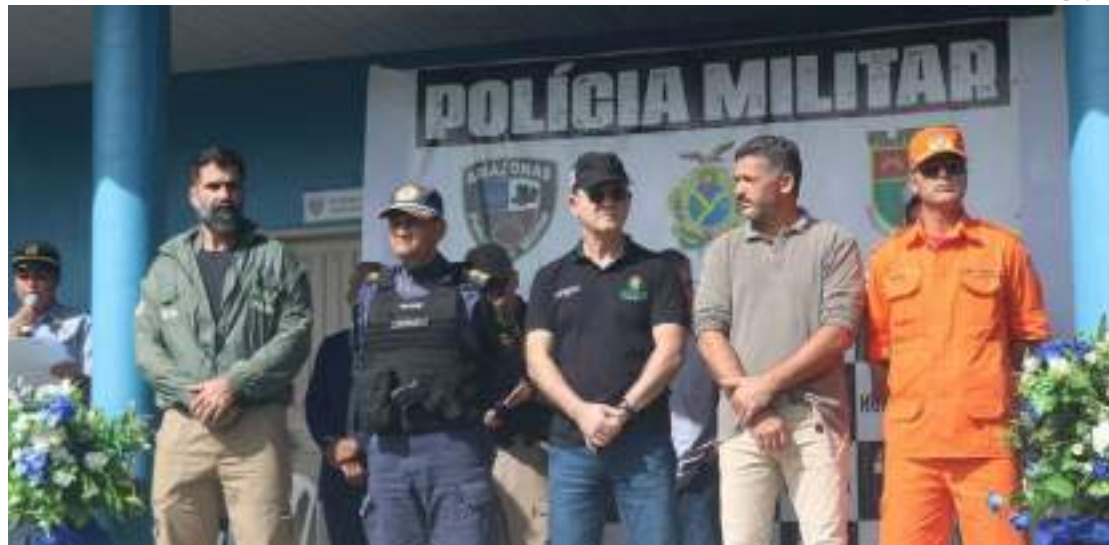
Autoridades de segurança lançam operação em Humaitá

O secretário de Estado do Meio Ambiente (Sema),