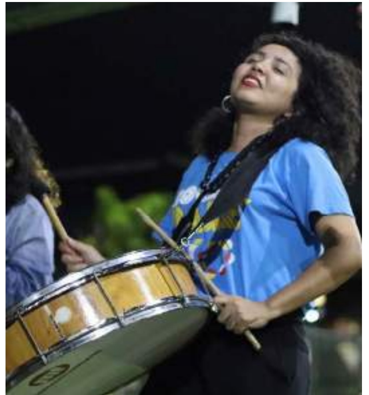
Musicista do projeto Quebrando Coco ensina alunas durante oficina

O Cocada Baré tem desenvolvido o ritmo do coco de roda na cidade de Manaus. O grupo musical nasceu a partir da iniciativa da produção de um show para o lançamento do videoclipe de Flor do Sertão (VEJA: https://youtu.be/_3XIAHavA_o ) da artista Andarilha, realizado no mês de julho de 2022 no Espaço Cultural Toca do Mumu.