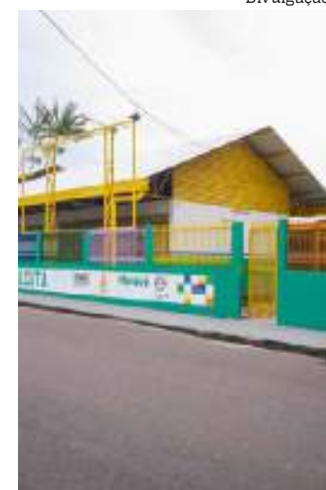
Escola Madre Tereza de Calcutá no Conjunto Nova Floresta