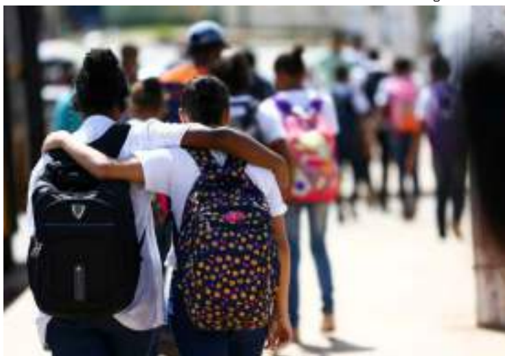
Estudantes de escolas públicas vão ganhar plano de segurança

A pasta da Educação comandada pelo ministro Camilo Santana (PT) determinou a antecipação de R$ 1,097 bilhão referentes à parcela de setembro do Programa Dinheiro Direto na Escola (PDDE) para que os gestores educacionais possam investir em infraestrutura de melhora da segurança das instituições de ensino. Ainda dentro do programa, o MEC liberou R$ 1,8 bilhão de