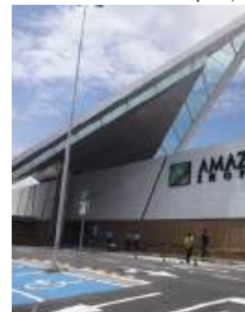
Atividades para a conscientização sobre o Autismo

Os valores são a partir de R$ 10. Todo o recurso será revertido para manutenção do trabalho das duas instituições. Os stands vão funcionar das 16h às 22h, na Praça de Eventos Rio Solimões, em frente ao Rei do Mate, no primeiro piso.