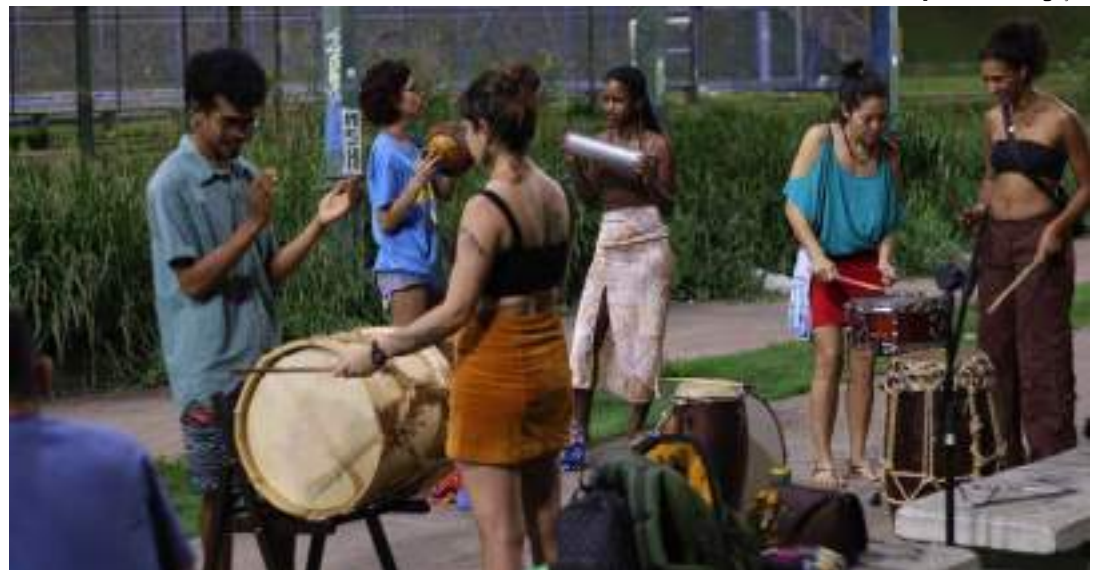
Instrutores e alunos interagem na oficina de coco de roda