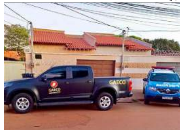
MP cumpre mandados de busca e apreensão durante Operação

A Operação Penalidade Máxima II foi executada pelo Grupo de Atuação Especial de Combate ao Crime Organizado (Gaeco) de Goiás.