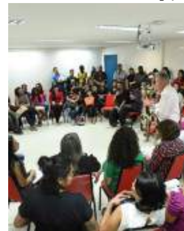
Núcleo de Empreendedorismo e Inovação da FST