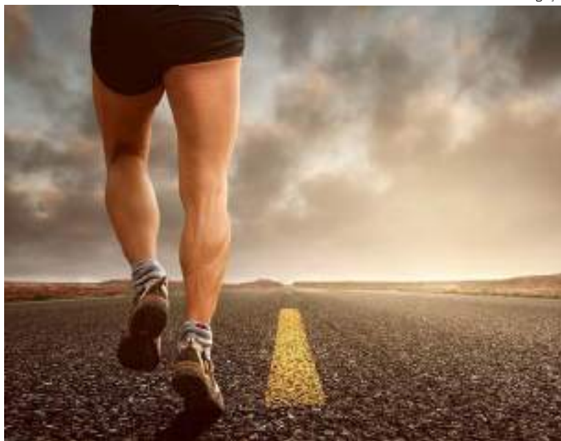
Atleta pratica corrida de rua. O evento contará com prova adulta e infantil.

A prova terá percurso de 5 km para adultos, além de uma corridinha kids, direcionada para