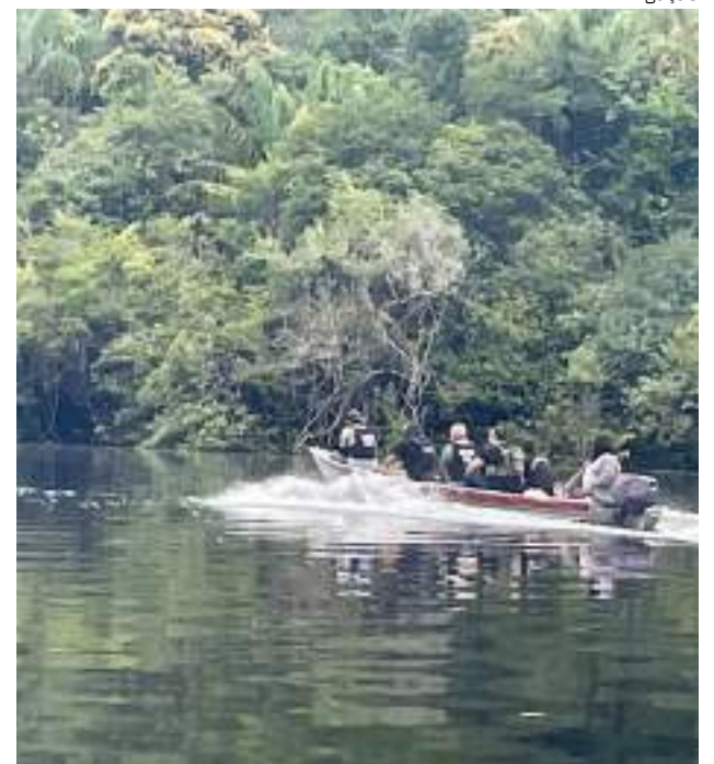
Trio foi preso durante operação “Turismo Seguro”

O trio responderá por roubo qualificado, tráfico de drogas e associação criminosa, e será encaminhado à audiência de custódia, onde ficará à disposição do Poder Judiciário.