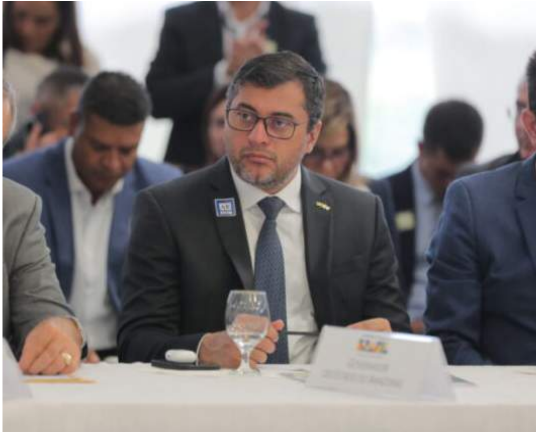
Governador levou diversas propostas sobre escolas ao Planalto

“O encontro hoje aqui com o presidente, com os ministros, com os poderes, com o Congresso Nacional, é importante para que a gente possa estar na mesma página, entender e trocar experiências sobre o que estão fazendo outros estados nesse sentido, quais as iniciativas, mas aqui, pelos discursos, a gente tem um pensamento comum, a repressão tem um limite e a gente tem