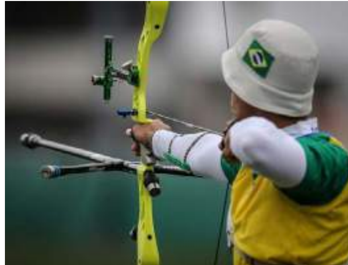
Atleta de tiro com arco contemplado pelo programa

envio de documentação é feito online. Apenas neste ano, a partir da abertura do período de inscrição, em fevereiro, mais de 187 mil mensagens foram recebidas pelo Ministério do Esporte via canal de WhatsApp. Além disso, 1.456