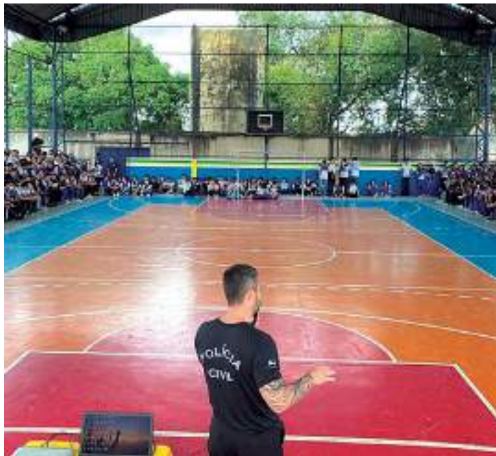
Agentes de segurança realizam palestras em escolas estaduais