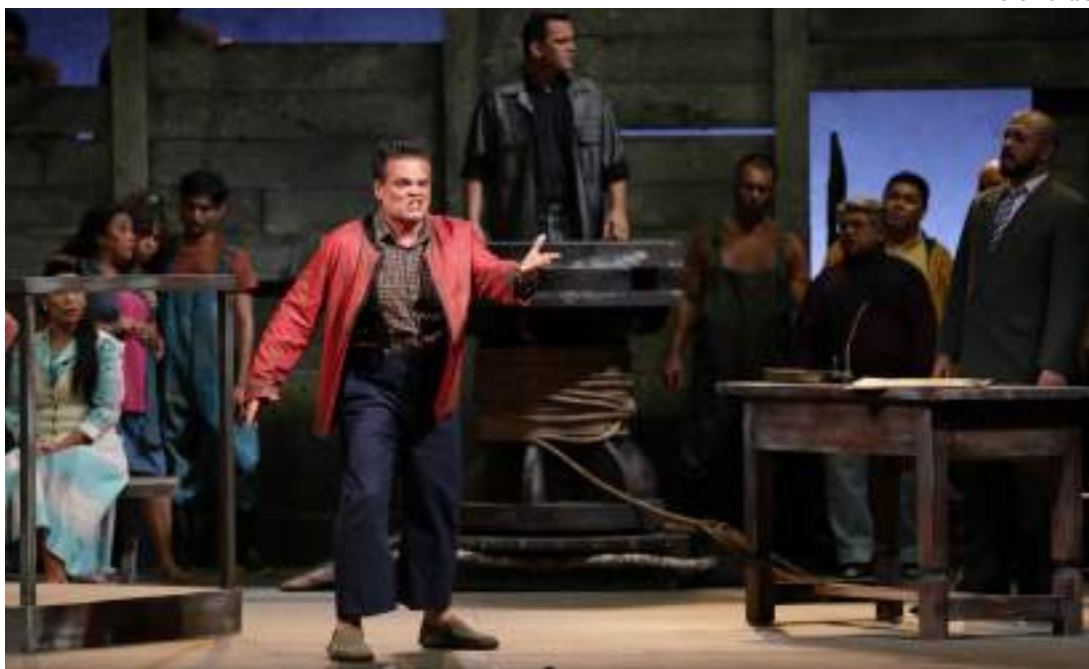
Artistas atuam no palco do Teatro Amazonas durante apresentação no Festival Amazonas de Ópera

A cultura do Amazonas ganha as páginas do mês de abril da revista "Concerto", publicação nacional especializada em música clássica. O destaque foi para o 25º Festival Amazonas de Ópera (FAO), que será realizado do dia 21 de abril a 28 de maio, na capital amazonense. A matéria que corresponde à