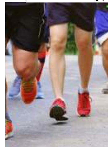
Atletas praticam corrida. Evento conta com mais de 100 inscritos

de Convivência 31 de Março oferece, por meio do Projeto Mais Vida, atividades de esportes como futsal, aula de ritmos, treino funcional pilates e balé, além de fisioterapia. "Através do Projeto Rede de Proteção, o Centro oferece grupos de convivência, atendimentos psicossociais, oficinas e palestras, visitas domiciliares, campanhas socioassistenciais e programações das datas comemorativas durante todo o ano", sintetizou.