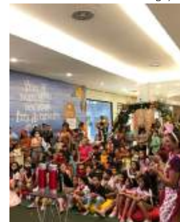
circuito de jogos promete garantir a diversão dos pequenos

Para completar a brincadeira no domingo de Páscoa (9), a criançada vai poder participar da ação de caça aos ovos de Páscoa no piso L2, a partir das 18h. De acordo com a gerente de marketing do Shopping Ponta Negra, Priscila Furtado, o centro de compras vai promover ações que são clássicas na Páscoa. “O clima de Páscoa vai tomar conta do mall com atividades que prometem encantar toda a família”, disse.