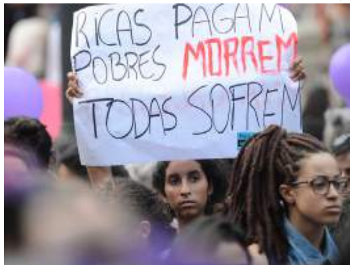
Pesquisa Nacional de Aborto mostra situação de abortos no Brasil

Nesta edição, a taxa de aborto mostrou queda no comparativo com as duas PNAs anteriores, realizadas em 2010 e 2016. Em 2021, cerca de 10% das mulheres entrevistadas afirmaram ter feito pelo menos um aborto no decorrer de suas vidas, comparado com 13%, em 2016, e 15%, em 2010. A pesquisa concluiu que a queda pode ser explicada pela tendência crescente do uso de métodos contraceptivos reversíveis na América Latina e no Caribe.