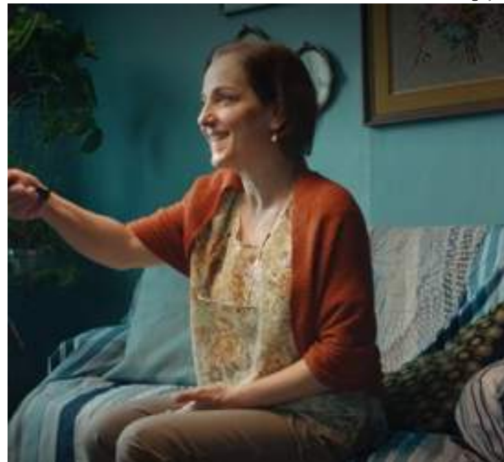
Instalação gratuita para famílias de menor renda no Amazonas

Outras 18 cidades do Amazonas continuam com o agendamento para instalação do kit gratuito liberado. A previsão é de que 89,8 mil famílias podem ter direito à instalação gratuito na capital e nas cidades de Autazes, Boa Vista do Ramos, Careiro, Careiro da Várzea, Iranduba, Itacoatia-