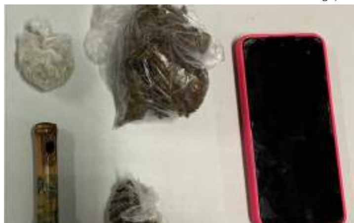
Polícia localizou entorpecentes, supostamente maconha e oxí

Adriano responderá por roubo majorado, receptação e também foi autuado por tráfico de drogas. Ele será encaminhado à audiência de custódia e ficará à disposição da Justiça.