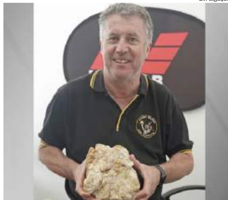
Garimpeiro encontrou enorme pepita de ouro avaliada em R$ 800 mil

O garimpeiro usou um detector Minelab Equinox 800 que custou US$ 800 (R$ 4,1 mil) disse Kamp. “Isso apenas prova que uma máquina pode encontrar ouro”, acrescentou Kamp, que disse que sua loja tem vendido mais detectores recentemente, provavelmente porque as taxas de juros estão boas.