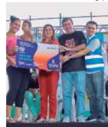
Entrega 376 vouchers de alimentação, cestas básicas e kits

“Manaus realmente vive uma situação calamitosa.”