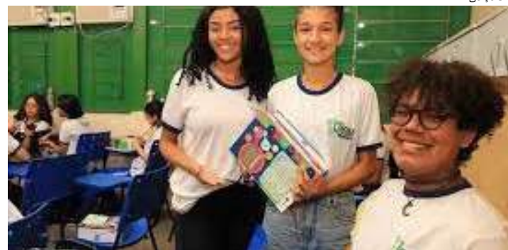
Alunos integram o curso técnico em serviços jurídico

“Esses alunos iniciaram o curso quando estavam no 2º ano do Ensino Médio e é notável como a visão deles para o mercado de trabalho mudou e como o comportamento de cada um melhorou desde o início do curso”, dis-