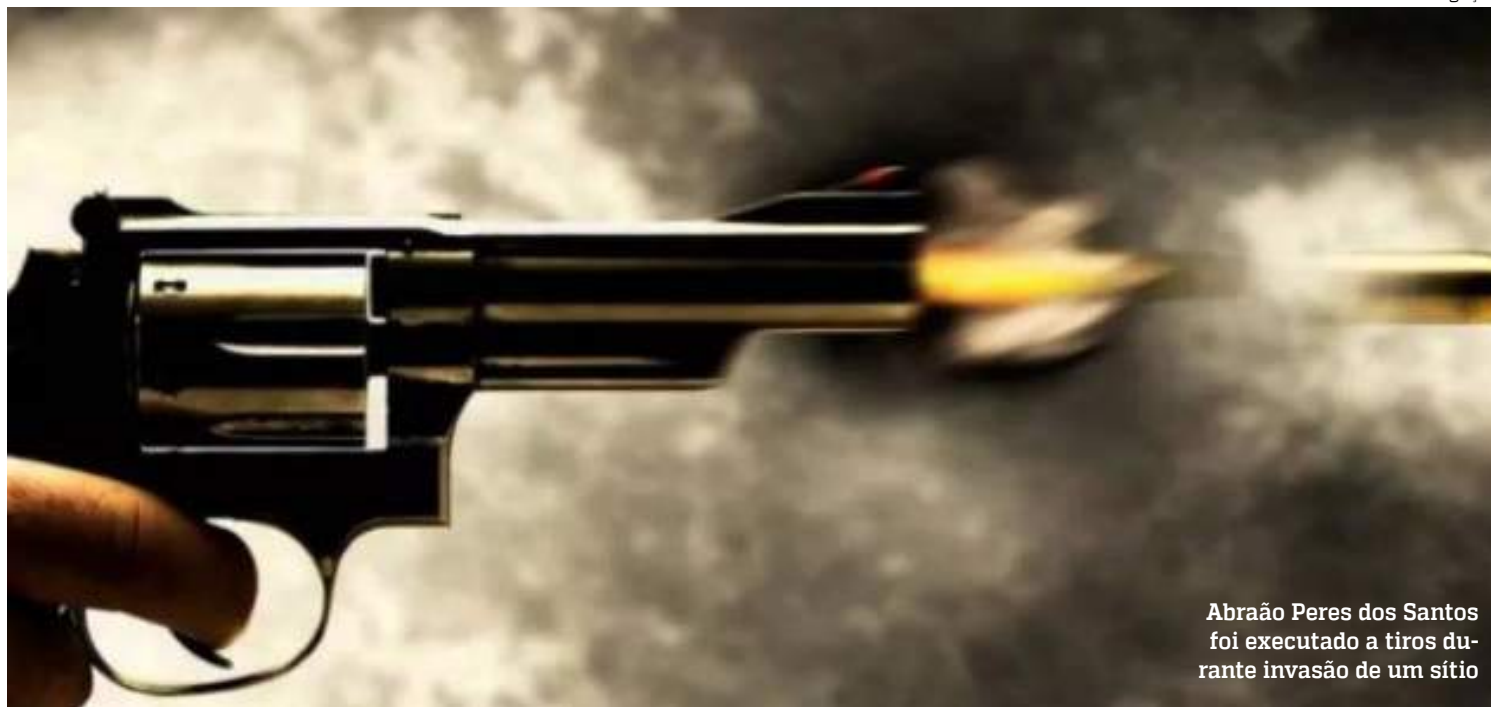
Abraão Peres dos Santos foi executado a tiros durante invasão de um sítio