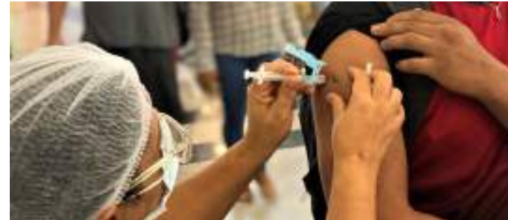
Até ontem (26), foram aplicadas 94.759 vacinas bivalentes

A vacina bivalente contra a Covid-19 é a continuação da resposta protetora da vacinação para a prevenção da doença sintomática e formas graves das novas variantes da Ômicron. Como dose de reforço, a vacinação