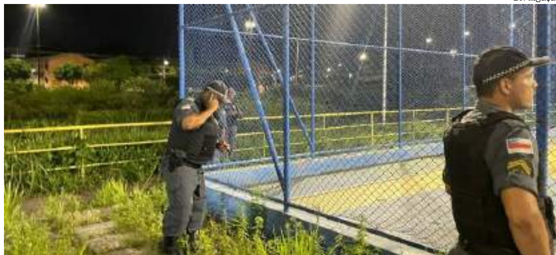
Homem foi executado a tiros dentro da quadra durante uma partida de futebol

A Delegacia Especializada em Homicídios e Sequestros (DEHS) deve investigar a autoria e motivação do crime.