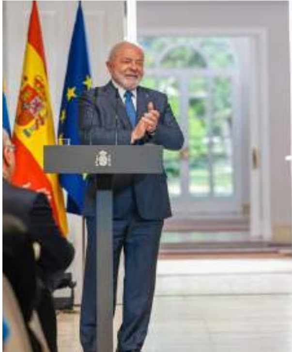
Lula conversou sobre possível acordo entre Mercosul e União Europeia

Na Moncloa, representantes de órgãos dos dois países assinaram três acordos de cooperação. Depois, Lula e Sánchez fizeram um pronunciamento conjunto sobre as questões abordadas no encontro, como a retomada das relações diplomáticas entre os dois países, a proteção ao