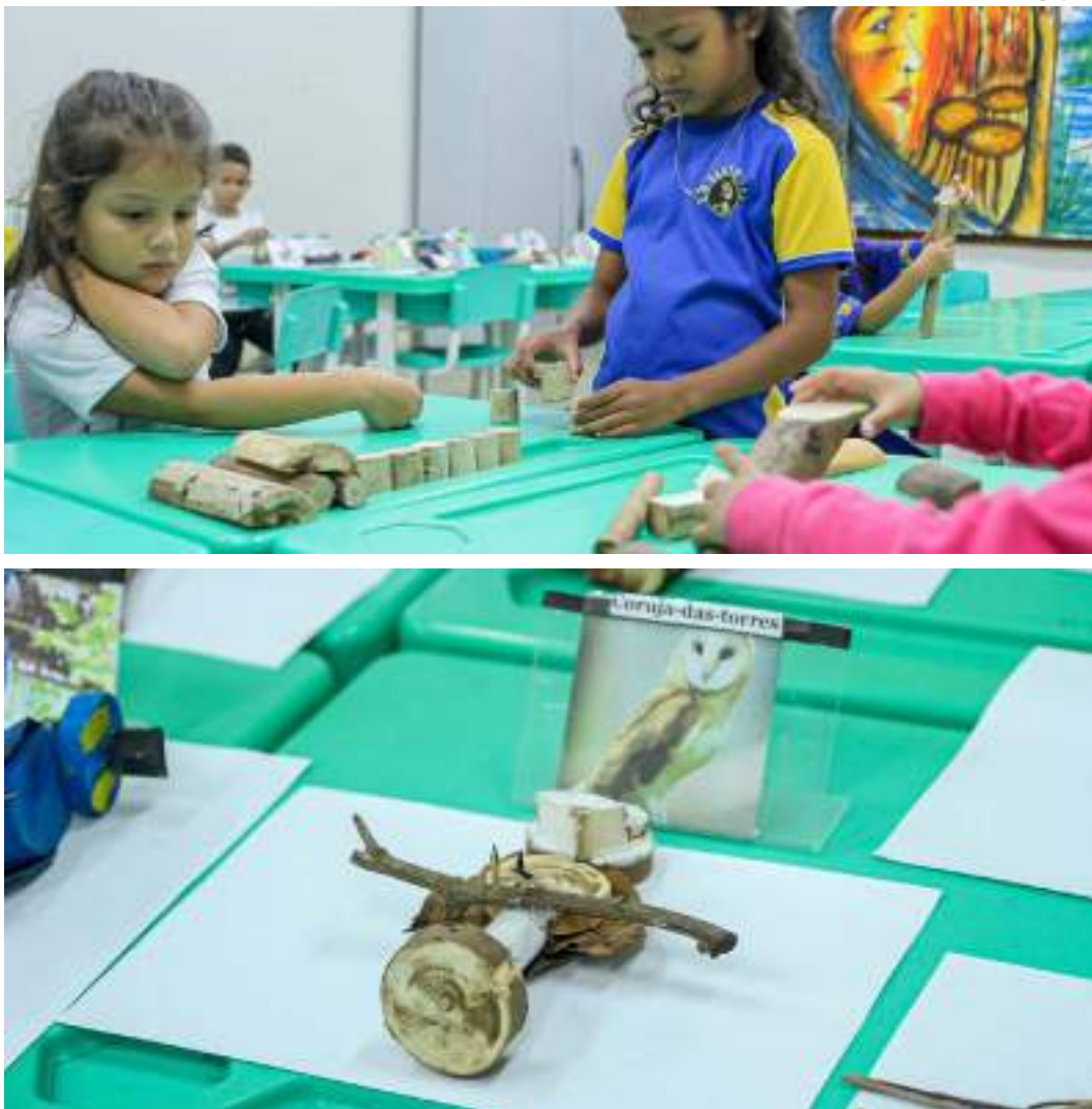
Alunos de escola municipal participam de projeto que incentiva a preservação de animais da fauna amazônica

“As famílias participaram e fizeram a curadoria de todo o material, trouxeram a madeira. É muito gratificante ver o produto de tudo isso e ver que, de fato, houve aprendizado em relação a esse tema”, comentou a profes-