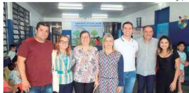
Reforço foi definido durante reunião, na quarta-feira (26)

"As parcerias são de fundamental importância, principalmente com os acadêmicos que serão os futuros