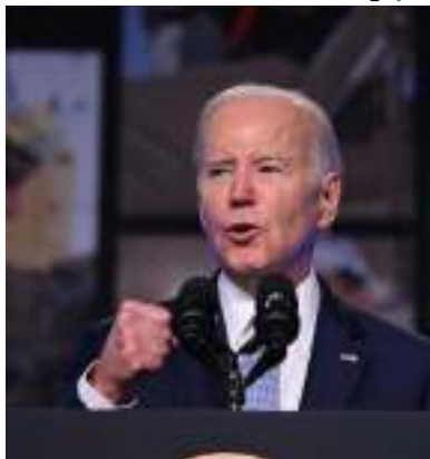
Biden anunciou através das redes sociais que será candidato em 2024