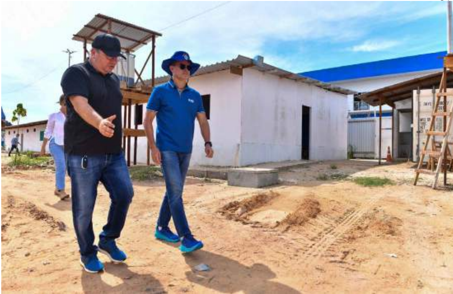
David Almeida esteve vistoriando as obras do Parque Amazonino Mendes, que abrangerá as Zonas Norte e Leste da capital

O prefeito de Manaus, David Almeida, realizou, na manhã desta quarta-feira (26), uma vistoria nas obras do parque Amazonino Mendes, o antigo Gigantes da Floresta, localizado entre as avenidas Isaías Vieiralves e Olívia de Menezes Vieiralves, nos bairros Novo Aleixo e Tancredo Neves. A obra é parceria da atual gestão municipal com o governo do Estado e busca transformar a realidade dos moradores das zonas mais populosas da cidade, mudando o eixo turístico para as zonas Norte e Leste da capital.