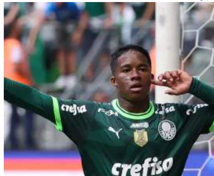
Endrick figura entre os jogadores mais promissores do futebol mundial

O Centro Internacional de Estudos do Esporte divulgou uma lista com 200 jovens mais promissores do futebol mundial na categoria Sub-20. No levantamento, são quatro brasileiros entre os 10 jogadores mais bem avaliados.