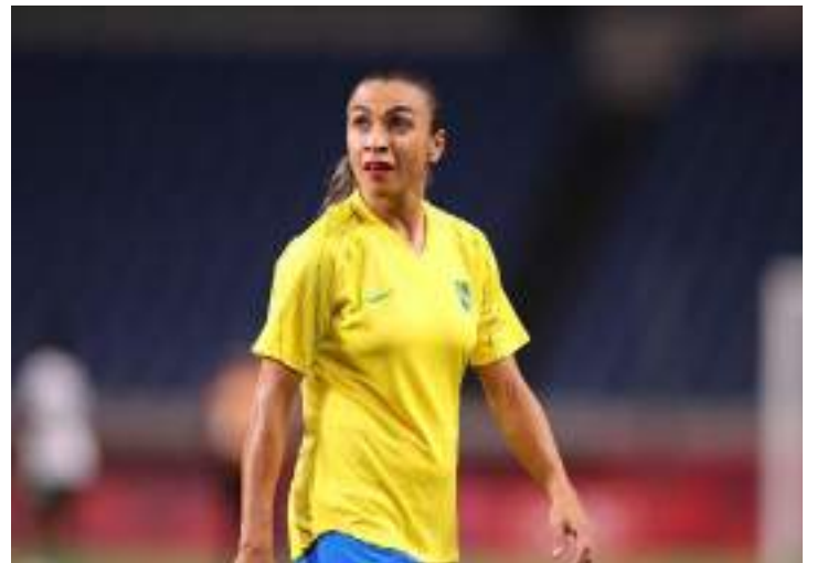
Marta aquecendo para jogo da Seleção Brasileira Feminina de Futebol