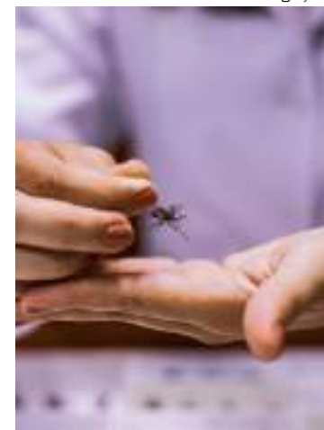
Pesquisa é fomentada pelo Programa Amazônidas

A pesquisadora da Fundação de Medicina Tropical Doutor Heitor Vieira Dourado (FMT-HVD) observou também que do total de 83,50 pacientes (60,3%) apresentam resultado sorológico negativo.