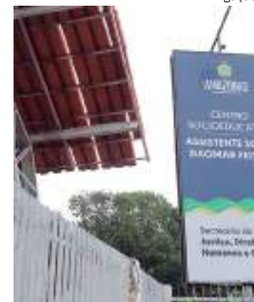
Centro tornou-se referência em ressocialização

A seção VII do capítulo IV do ECA diz que os adolescentes em cumprimento de pena têm direito, entre outras coisas, à educação, profissionalização, esporte e lazer.