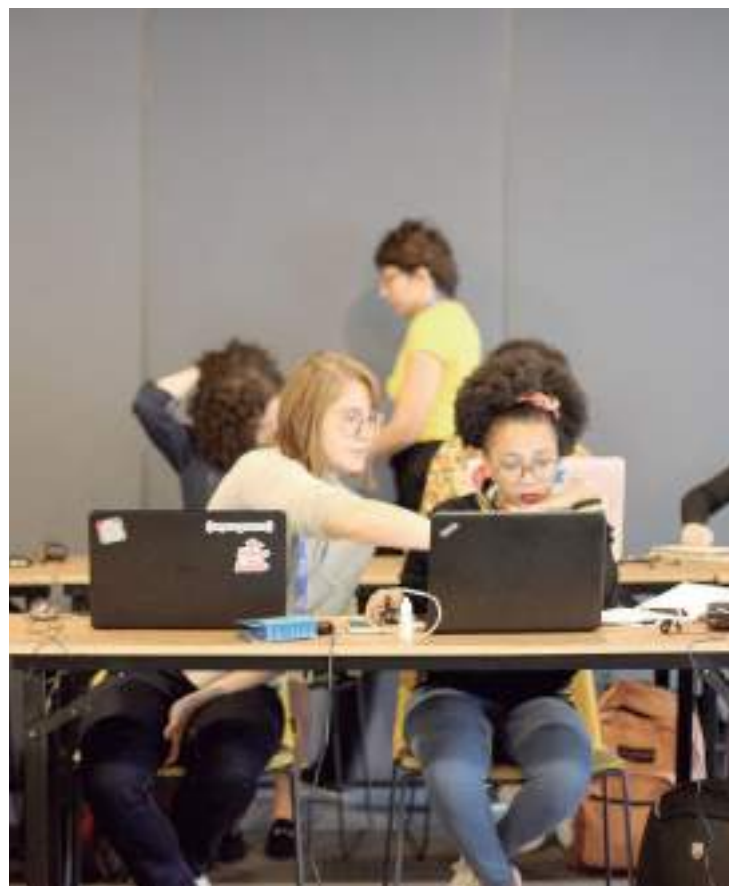
Iniciativa de impacto social foca em ensinar programação para mulheres