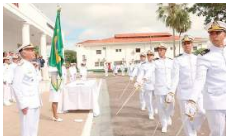
Marinha é acusada pelo TCU de comprar Viagra superfaturado

O Tribunal de Contas da União (TCU) determinou que o Hospital Naval Marcílio Dias, no Rio de Janeiro, devolva aos cofres públicos o valor de R$ 27,8 mil usados na compra de 15.120 comprimidos de citrato de sildenafil, genérico do Viagra, destinados à Marinha.