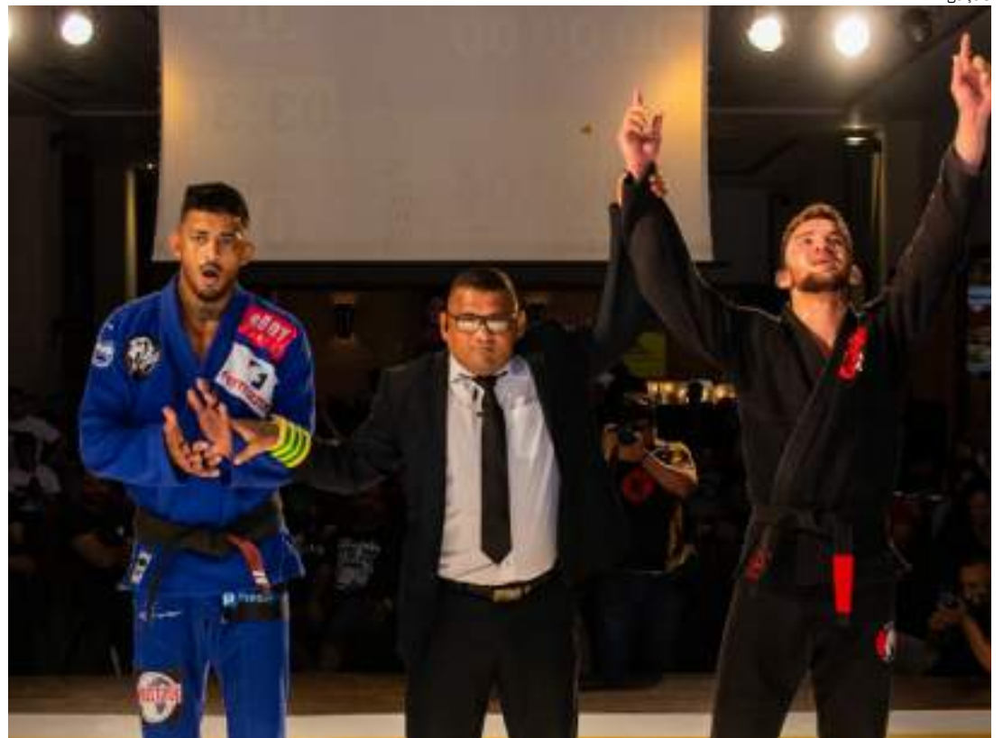
Atletas participam do Majestic BJJ3. Evento colocará lutadores amazonenses contra atletas de outros Estados

A outra opção é adquirir o Pacote Streaming Pay per View, que será disponibili-