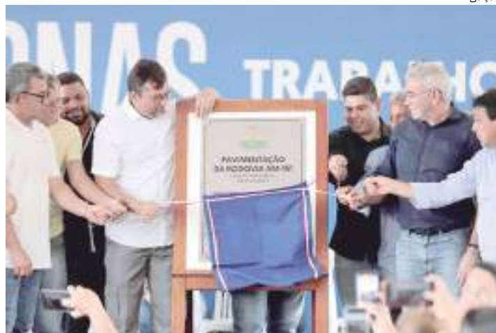
Estadualização da estrada Carlos Braga foi feita pelo governo em 2021

Desde 2019, o Governo do Estado já concluiu mais de 137 quilômetros de ramais e estradas (23 obras), com