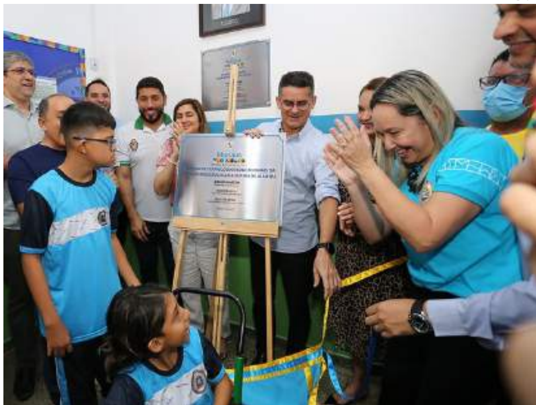
Prefeito David Almeida entrega escola municipal Maria Rufina de Almeida revitalizada

ros novos no andar de baixo, com acessibilidade e um depósito de freezer. O estabelecimento de ensino recebeu novo telhado, forro, pintura total e bebedouros. Além de reparos no sistema elétrico e hidráulico.