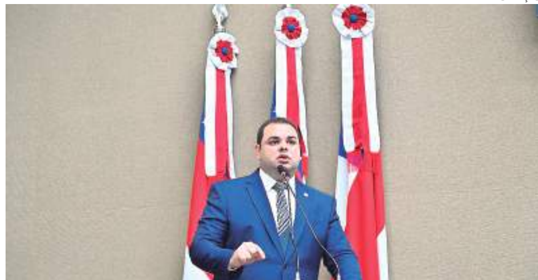
O presidente da Aleam defende em PL que o seja prestado apoio técnico e operacional ao cooperativismo

"Nossa proposta tem o objetivo de proporcionar mecanismos que permitam ter uma maior produtividade por área cultivada ou explorada, dentro dos padrões legais de exploração. Queremos resguardar o produtor que cultiva para o consumo próprio e para comercialização, além de toda a produção agrícola, seja animal ou vegetal. Com certeza, se os produtores tiverem melhores condições, mais