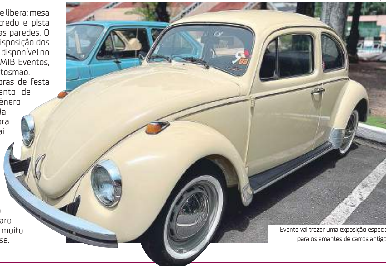
Evento vai trazer uma exposição especial para os amantes de carros antigos