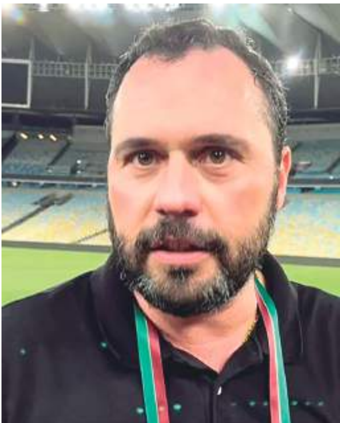
Mário Bittencourt é presidente do Fluminense desde 2019

O presidente do Fluminense, Mário Bittencourt, fez duras críticas ao Vasco sobre o Maracanã. O dirigente argumentou que o Cruz-Maltino só quer jogar no estádio em jogos que dão lucro, desrespeitando os critérios técnicos para a manutenção do gramado.