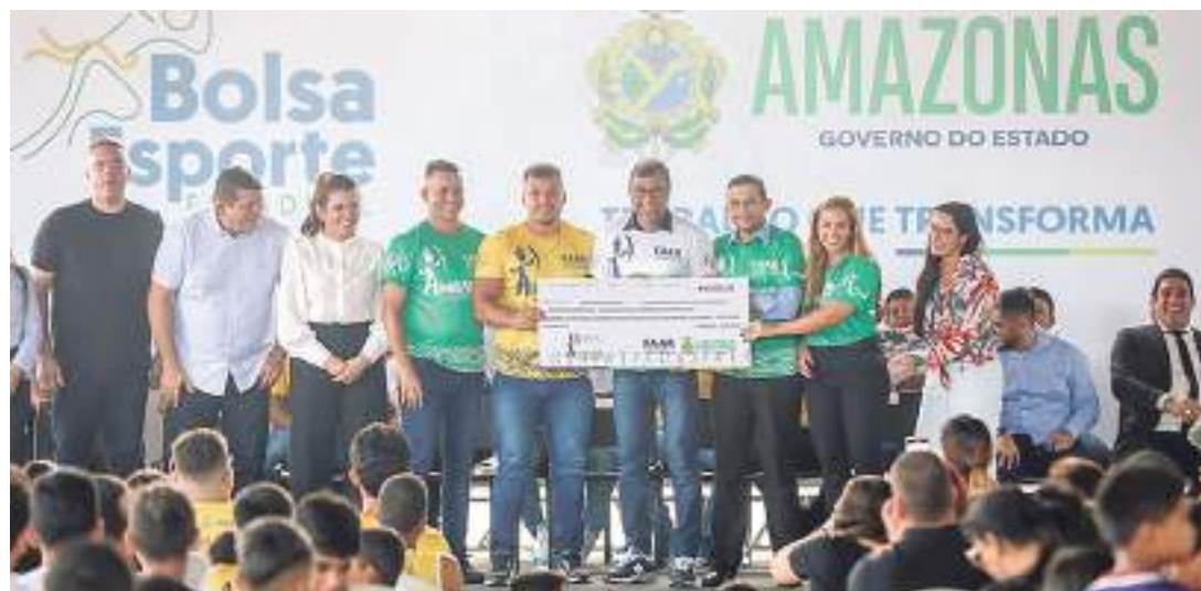
Governador anunciou programas de incentivo ao esporte para atletas do Amazonas