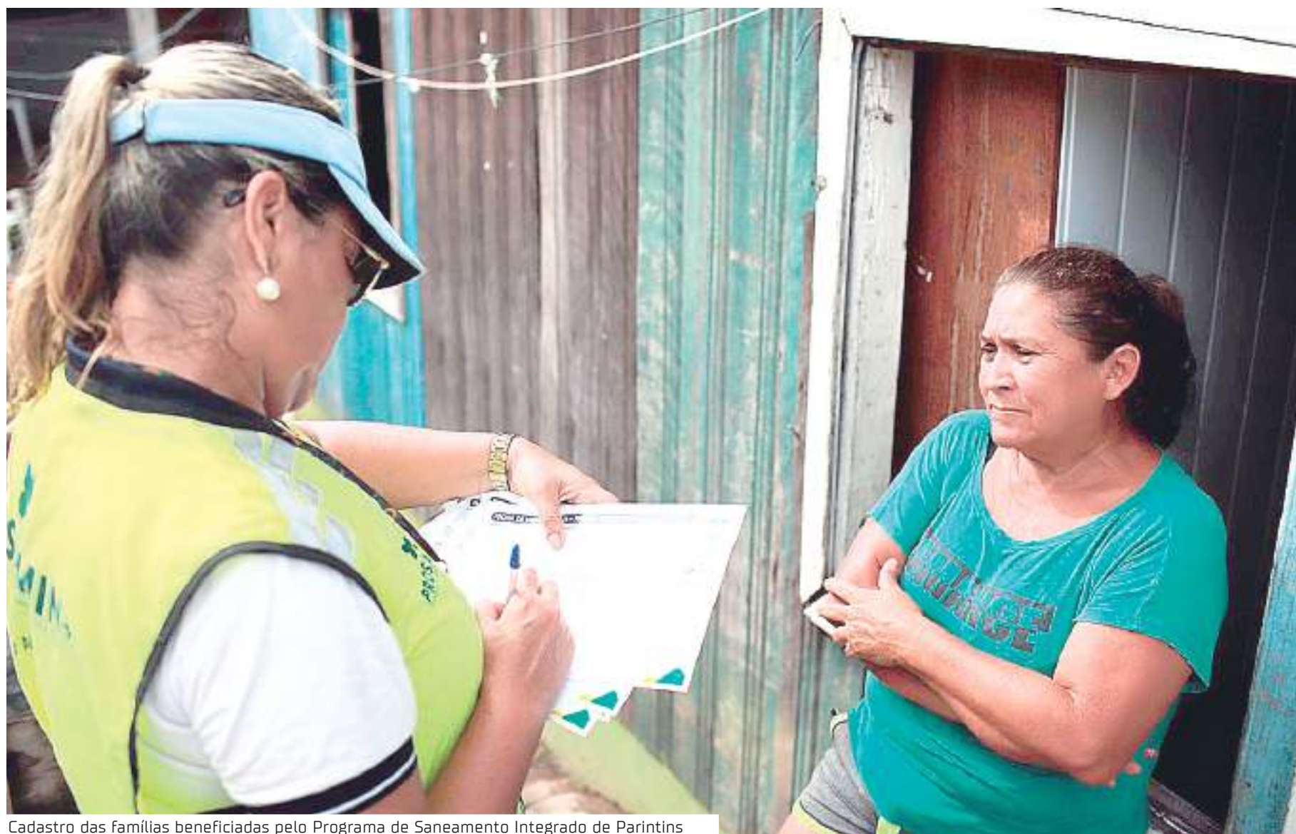
Cadastro das famílias beneficiadas pelo Programa de Saneamento Integrado de Parintins

"Nessa visita, as equipes sociais atualizam os dados dos proprietários e de seus familiares, para obter um retrato atual da envoltória de intervenção. É também o primeiro passo para o processo de mobilização para a Consulta Pública,