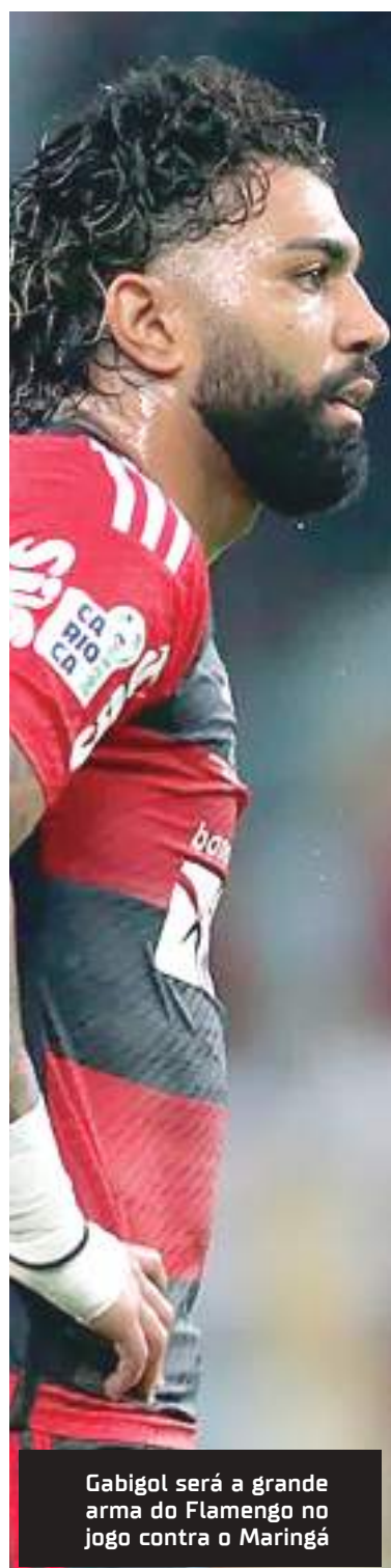
Gabigol será a grande arma do Flamengo no jogo contra o Maringá