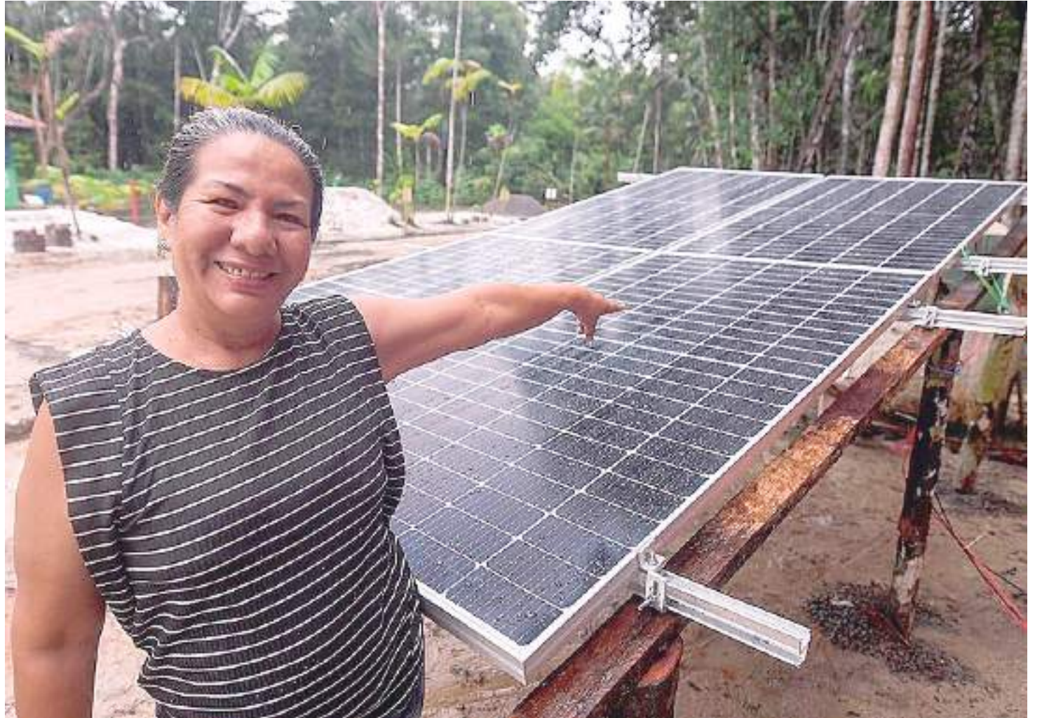
Proprietária do empreendimento turístico Abraço Verde é uma das beneficiadas pelo Brilha Amazonas

"O Brilha Amazonas é um programa para ajudar a sustentabilidade com energia limpa, uma energia sustentável, desenvol-