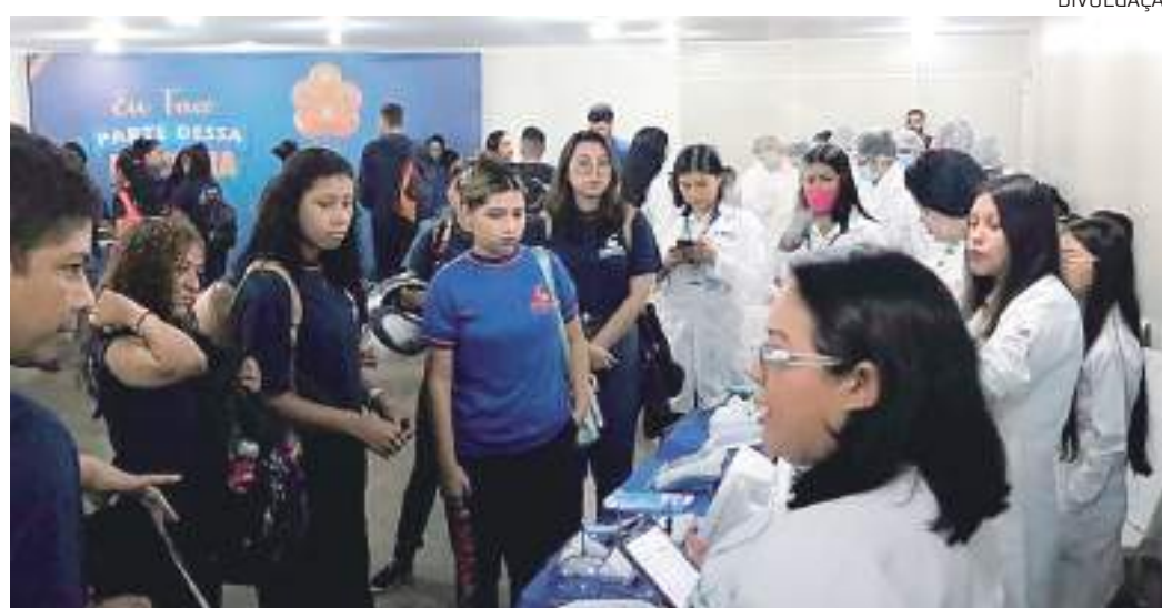
Alunos finalistas apresentam projetos na Feira das Profissões do Centec

A meta na Feira das Profissões é apresentar o real potencial de cada área, seja numa fábrica, num canteiro de obras ou no desenvolvimento de projetos. Como geração de energia solar ou