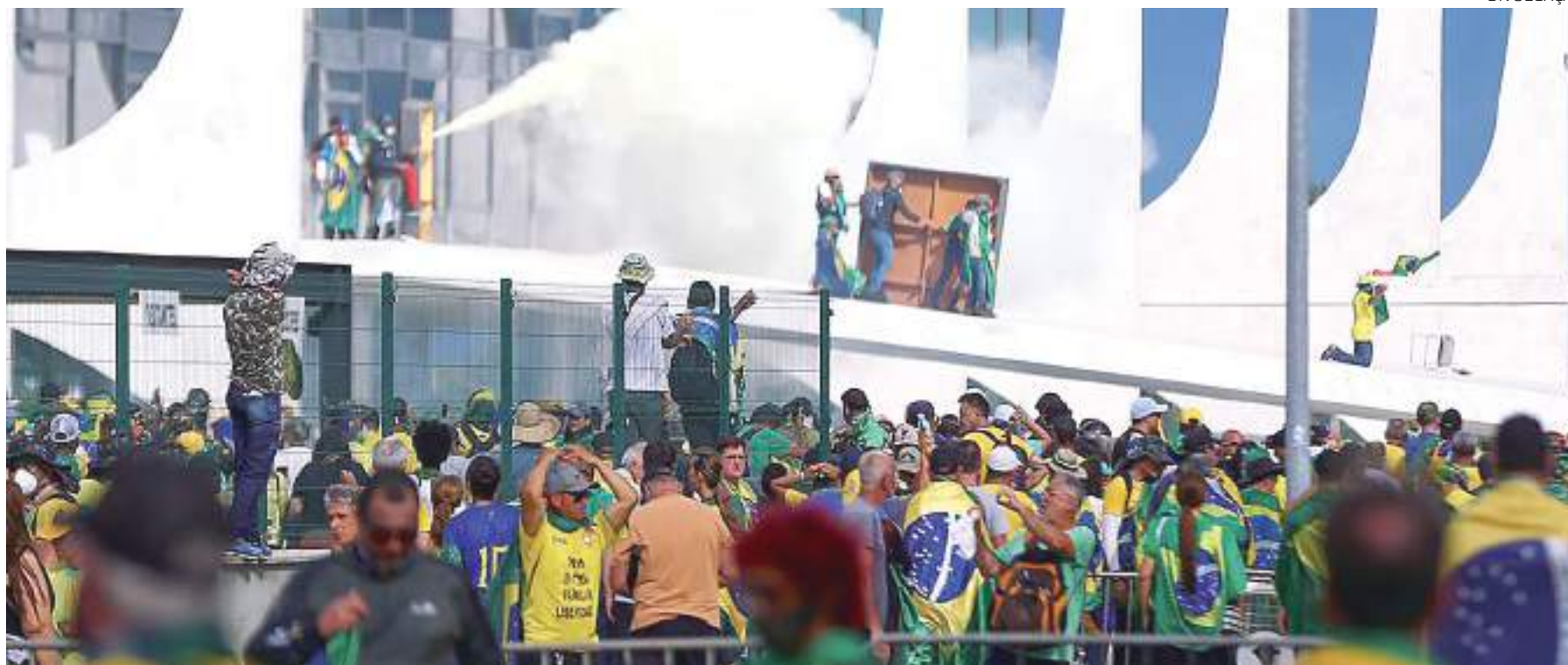
Apoiadores radicais de Jair Bolsonaro durante a mobilização que derivou no ataque às sedes dos Três Poderes em Brasília

O placar do julgamento foi finalizado com 8 votos que seguiram totalmente o relator pelo recebimento integral das denúncias. Os ministros André