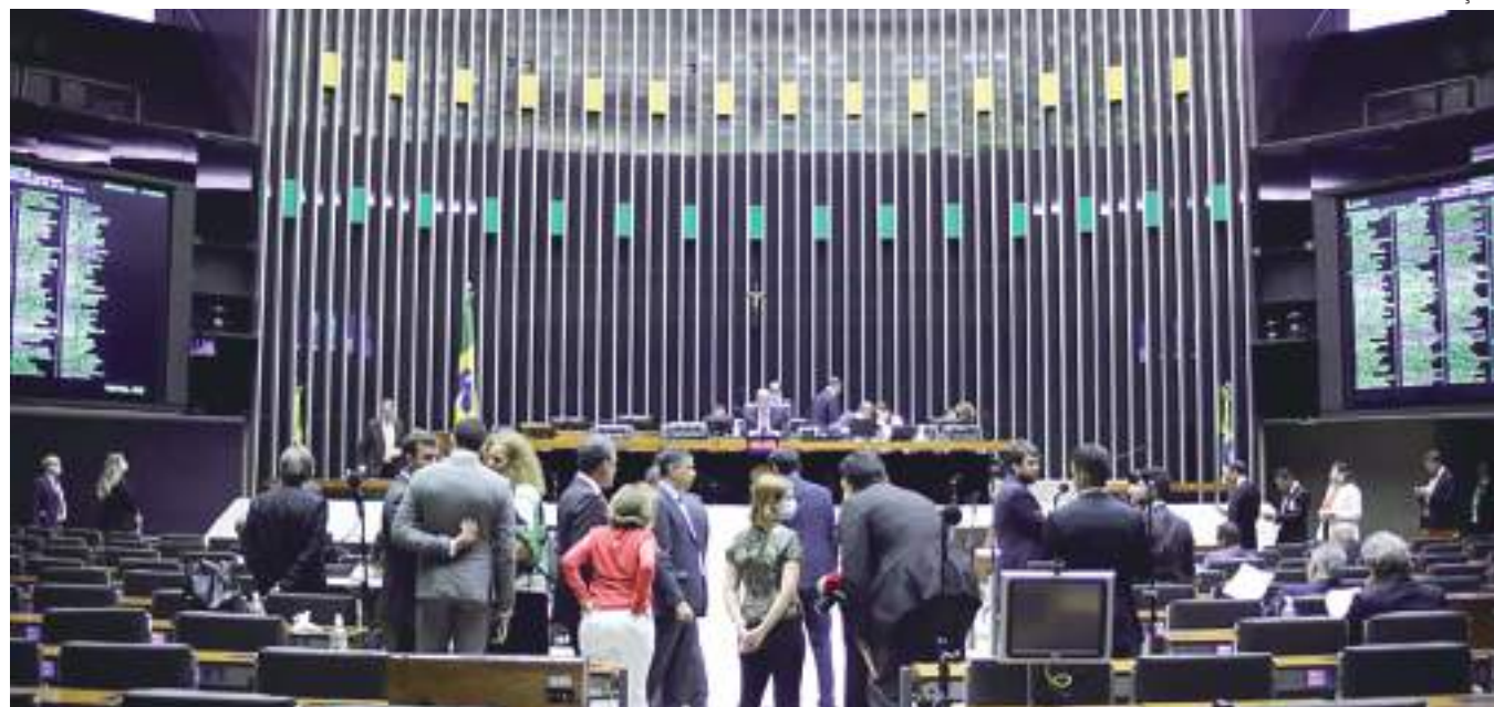
Entre os diferentes pontos contestados da proposta, os deputados citam especificamente o artigo que consta do último substitutivo do relator

Esse ponto estabelece que provedores atuem preventivamente diante de "conteúdos potencialmente ilegais gerados por terceiros no âmbito de seus serviços, tendo