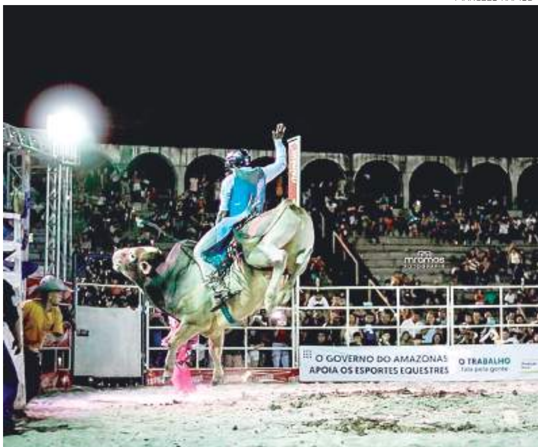
Campeonato de rodeio no Centro Social Urbano (CSU) do Parque Dez

A 3ª Edição do Manaus Country Festival terá como palco o Centro Social Urbano (CSU) do Parque Dez, na Zona Centro-Sul. O evento ocorre de 26 a 30 de abril, a partir das 17h, com entrada gratuita.