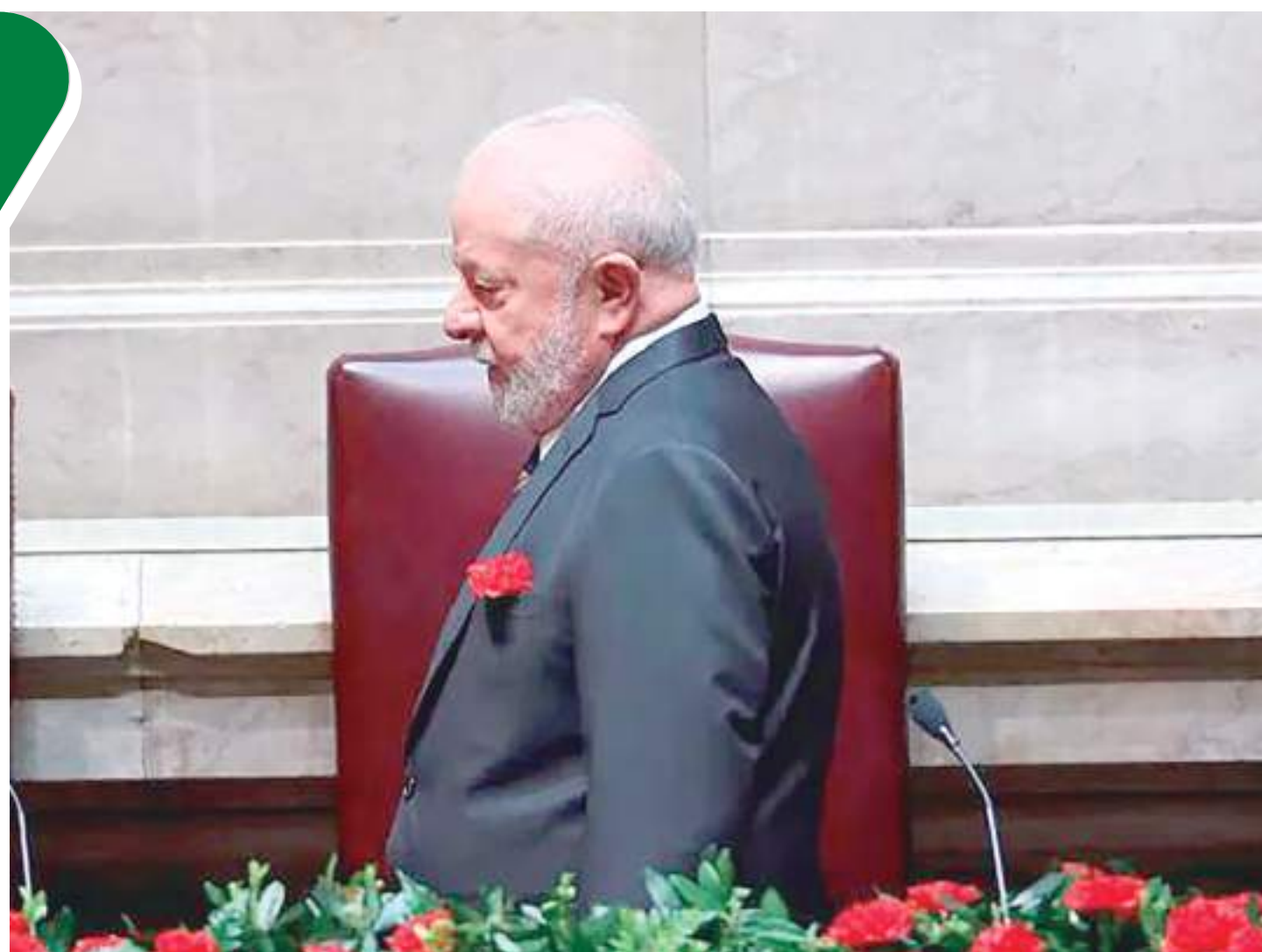
Lula tratou do papel atual da diplomacia brasileira e indicou que seu governo representa retomada de tradição diplomática

Em seguida, Lula pontuou que a guerra não poderá seguir indefinidamente. "A cada dia que os combates prosseguem, aumenta o sofrimento humano", destacou Lula,