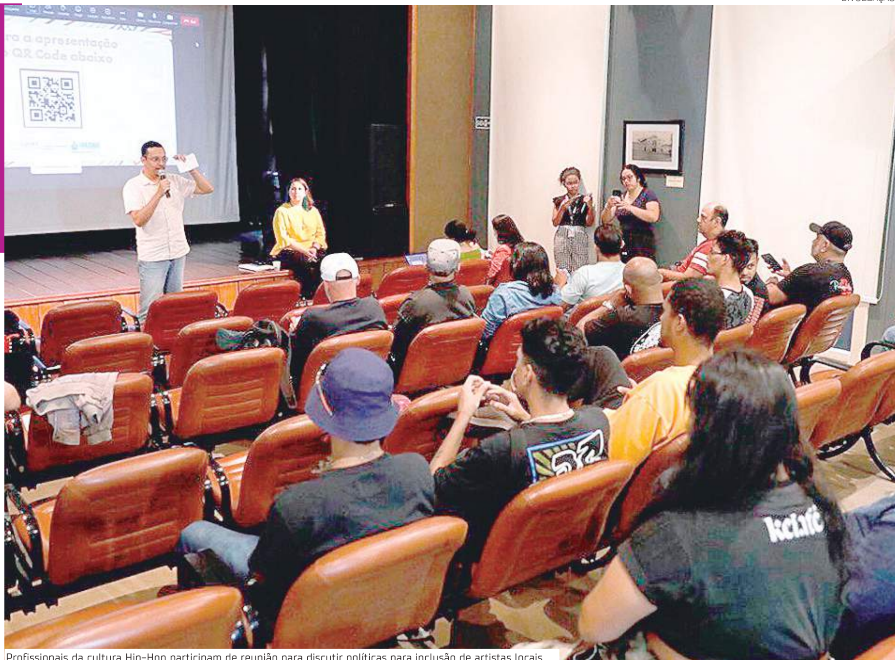
Profissionais da cultura Hip-Hop participam de reunião para discutir políticas para inclusão de artistas locais

“Os profissionais da cultura Hip-Hop estão segmentados nos editais da Secretaria desde a lei Aldir Blanc e agora em 2023 com a Lei Paulo Gustavo (LPG), estamos garantindo novamente aos profissionais do Hip-Hop uma maior ade-