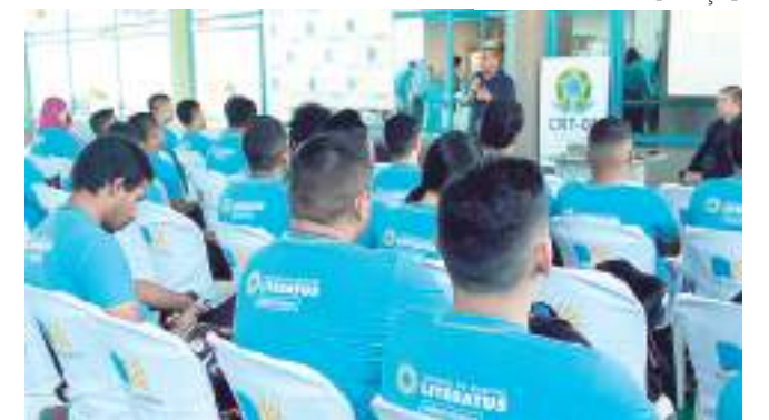
Centro de Ensino Literatus reforça as ações da campanha Abril Verde