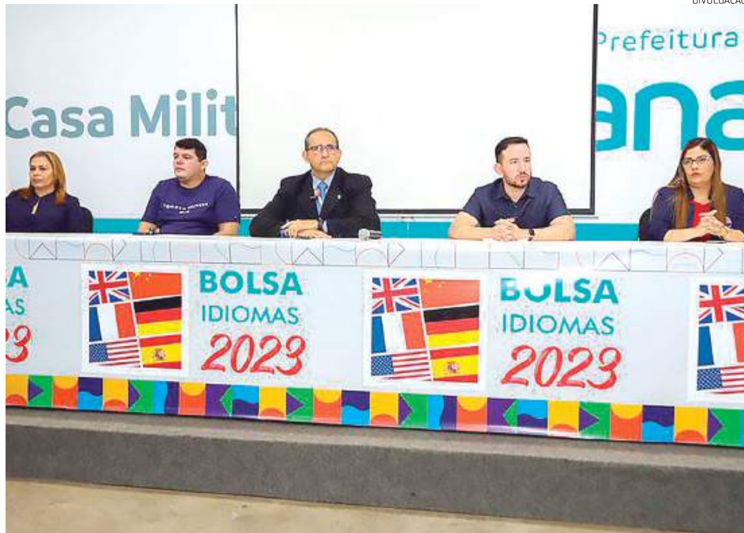
O PBI recebeu a adesão de 16 instituições de ensino de línguas estrangeiras