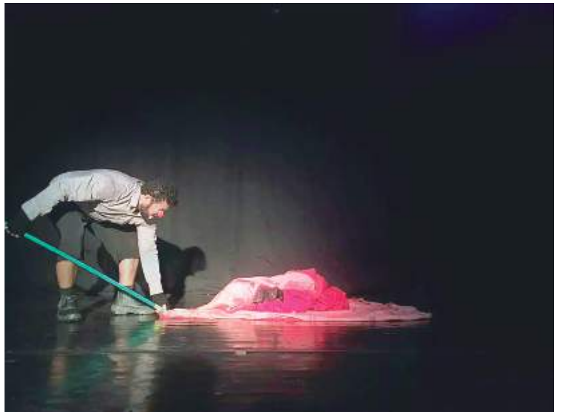
Alunos de teatro da Universidade do Estado do Amazonas realizam atividade cênica no teatro

O Américo Alvarez contempla 110 lugares e atualmente é utilizado pela Escola Superior de Artes e Turismo da Universidade do Estado do Amazonas (Esat/UEA), para realização de atividades pertinentes aos cursos da instituição.