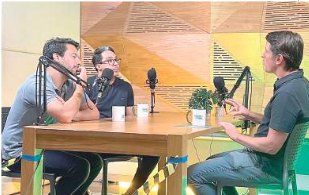
Gravação do primeiro episódio do Podcast "Virando a Chave"

Um projeto pioneiro do Grupo MRV&CO lança plataforma de comunicação inédita para corretores de imóveis do Brasil. O Podcast "Virando a Chave" teve o primeiro episódio gravado no último dia 18, com a participação de especialistas do mercado e parceiros convidados para abordar os diversos desafios da profissão e quais são os diferenciais necessários para se destacar na área.