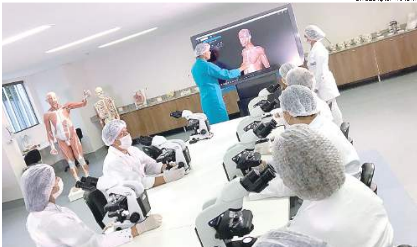
Alunos do curso de medicina da Fametro contam com uma estrutura ampla para se qualificarem e desenvolverem o conhecimento

O estudante do curso de Medicina da Fametro também tem a chance de participar de projetos de iniciação científica e de extensão e é preparado para lidar com a realidade regional.