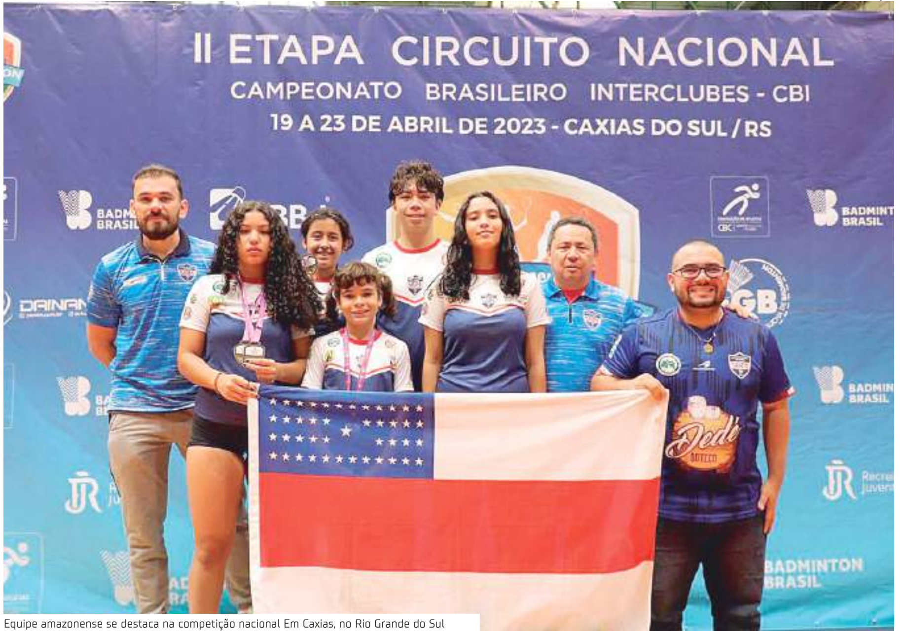
Equipe amazonense se destaca na competição nacional Em Caxias, no Rio Grande do Sul

Disputa aconteceu no Rio Grande do Sul. No total, foram 4 ouros e 5 bronzes conquistados pelos competidores