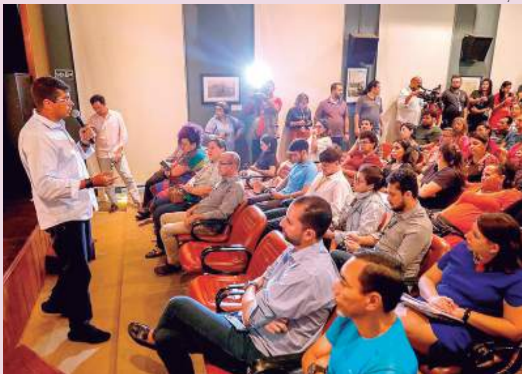
Representante da Secretaria de Cultura e Economia Criativa conversa com artistas do Amazonas

Dando continuidade às plenárias de implementação da Lei Paulo Gustavo (LPG), a Secretaria de Cultura e Economia Criativa reunirá artistas do circo, teatro e dança na tarde desta quinta-feira (13), das 14h às 17h, no Cineteatro Guarany, localizado na avenida Sete de Setembro, Centro. Já na sexta-feira (14), a reunião será com o setor de audiovisual. A reunião acontece em cumprimento aos critérios exigidos pelo Ministério da Cultura (MinC), para que o repasse da União seja efetivamente realizado ao estado e municípios.