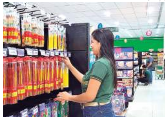
Grupo Queiroz abre cadastro de currículos para o banco de talentos