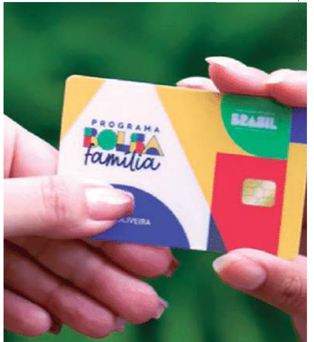
Governo federal promete realizar um "pente-fino" entre os beneficiários

A medida visa estimular a busca por emprego formal entre os beneficiários do programa, para reduzir a disparidade entre beneficiários e trabalhadores formais.