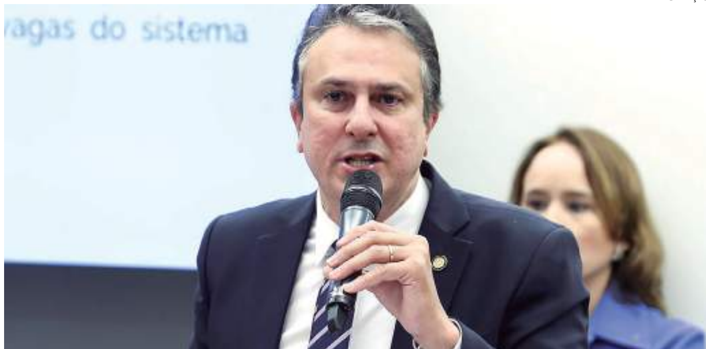
O ministro Camilo Santana falou sobre as prioridades da pasta para este ano

Camilo Santana enfatizou que a adesão a este modelo de ensino foi mínima – apenas 0,28% das escolas do país – e escolas cívico-militares não são prioridade no governo atual. "Não revoguei o programa. Só não será prioridade, nem estratégia do Ministério da Educação neste governo de criar novas escolas." O ministro disse que vai discutir,