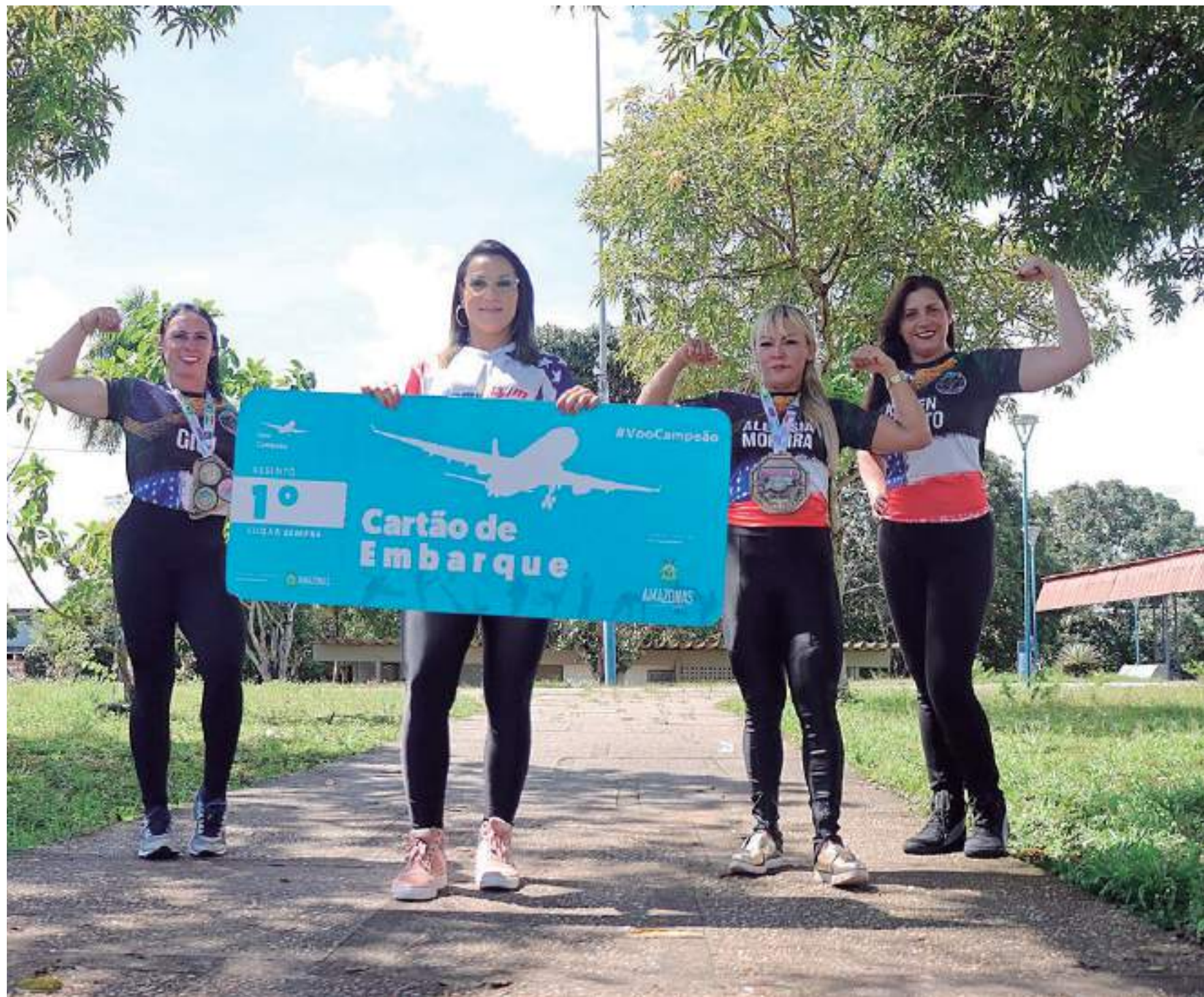
Atletas amazonenses seguram cartão de embarque disponibilizado pela Faar para participarem da competição

O Arnold South América é o maior evento multiesportivo da