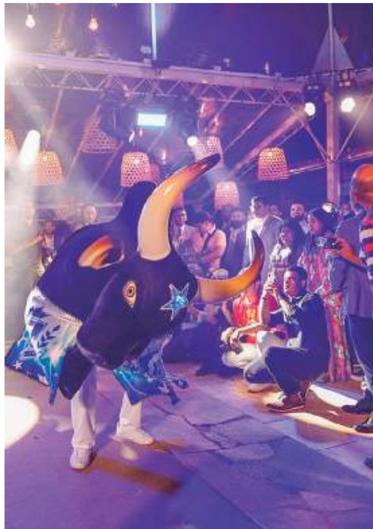
Artistas representaram os bumbás Caprichoso e Garantido em evento com ministros em Brasília

Encantada com a dança, as toadas e a disputa entre