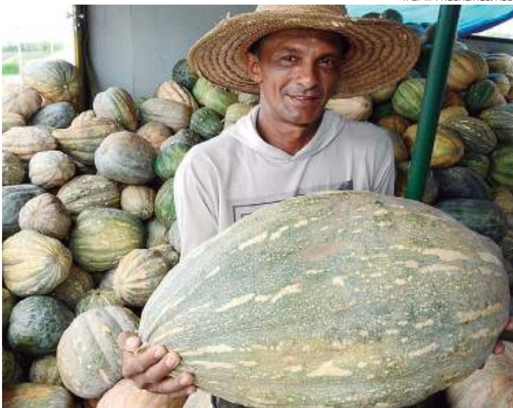
Jerimum ficou responsável pela maior fatia dos produtos comercializados

O Governo do Amazonas, por meio da Agência de Desenvolvimento Sustentável do Amazonas (ADS), auxiliou o escoamento de 184,6 toneladas de produtos alimentícios nos primeiros três meses do ano. Somente em março, foram 62 toneladas provenientes da capital e interior do estado entregues