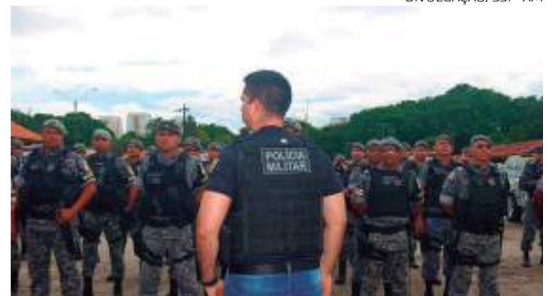
Redução é resultado de ações integradas das Forças de Segurança