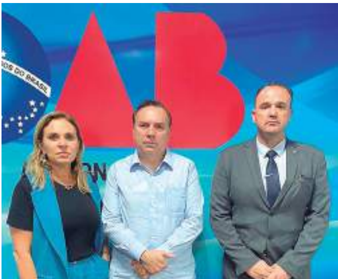
Comissão OAB Vai à Escola a Comissão de Proteção à Criança