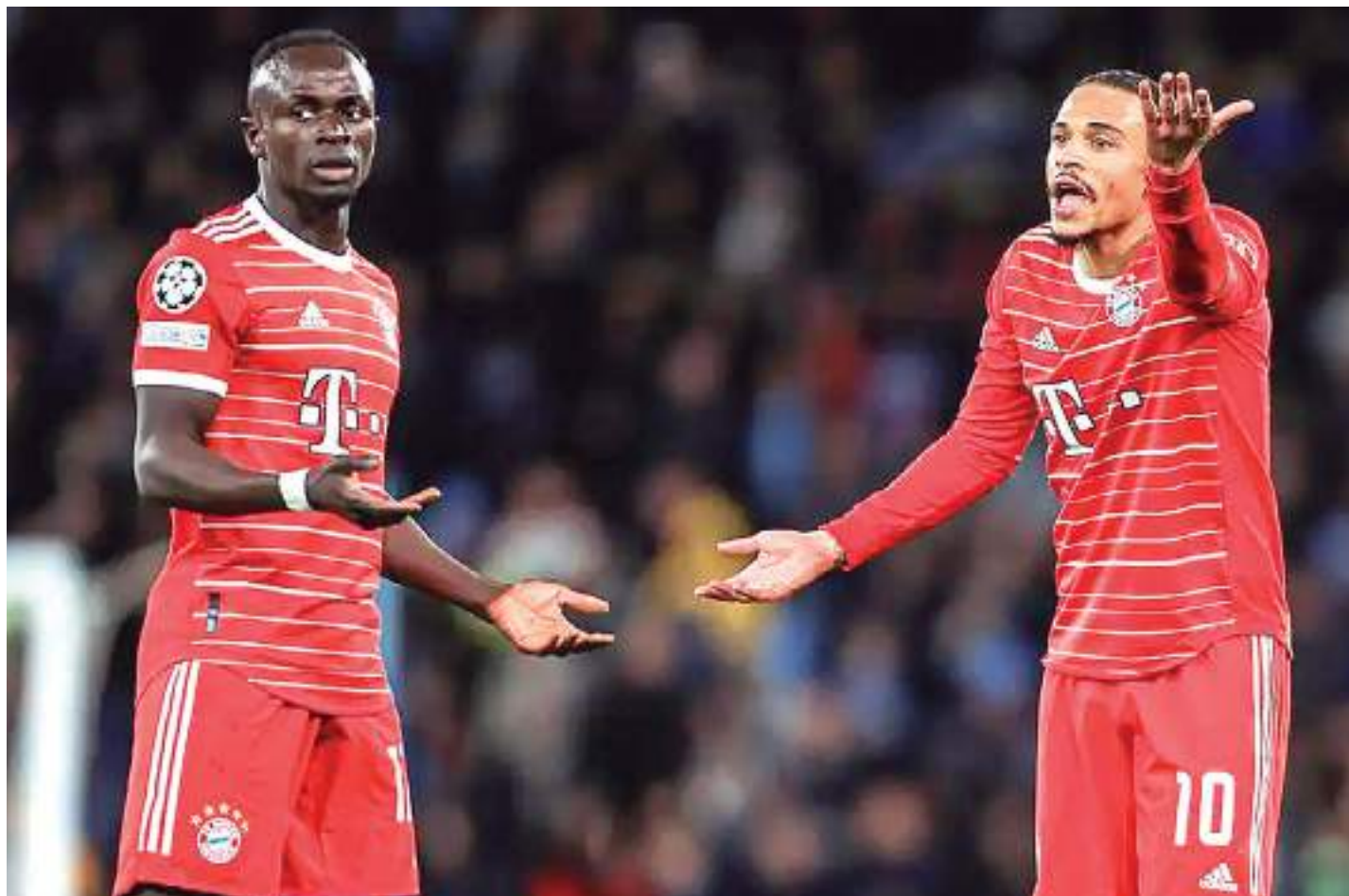
Sadio Mané e Leroy Sané discutem em campo. Confusão terminou em agressão no vestiário após partida

O Bayern não vive a melhor fase quando se trata do extracampo. A demissão de Julian Nagelsmann trouxe diversos problemas à tona, como o vestiário rachado e os problemas na comissão. Agora, com a discussão entre Mané e Sané, levantam-se dúvidas quanto à capacidade da equipe de segurar a liderança da Bundesliga e de virar contra o City, já que precisa tirar uma vantagem de três gols na próxima semana.