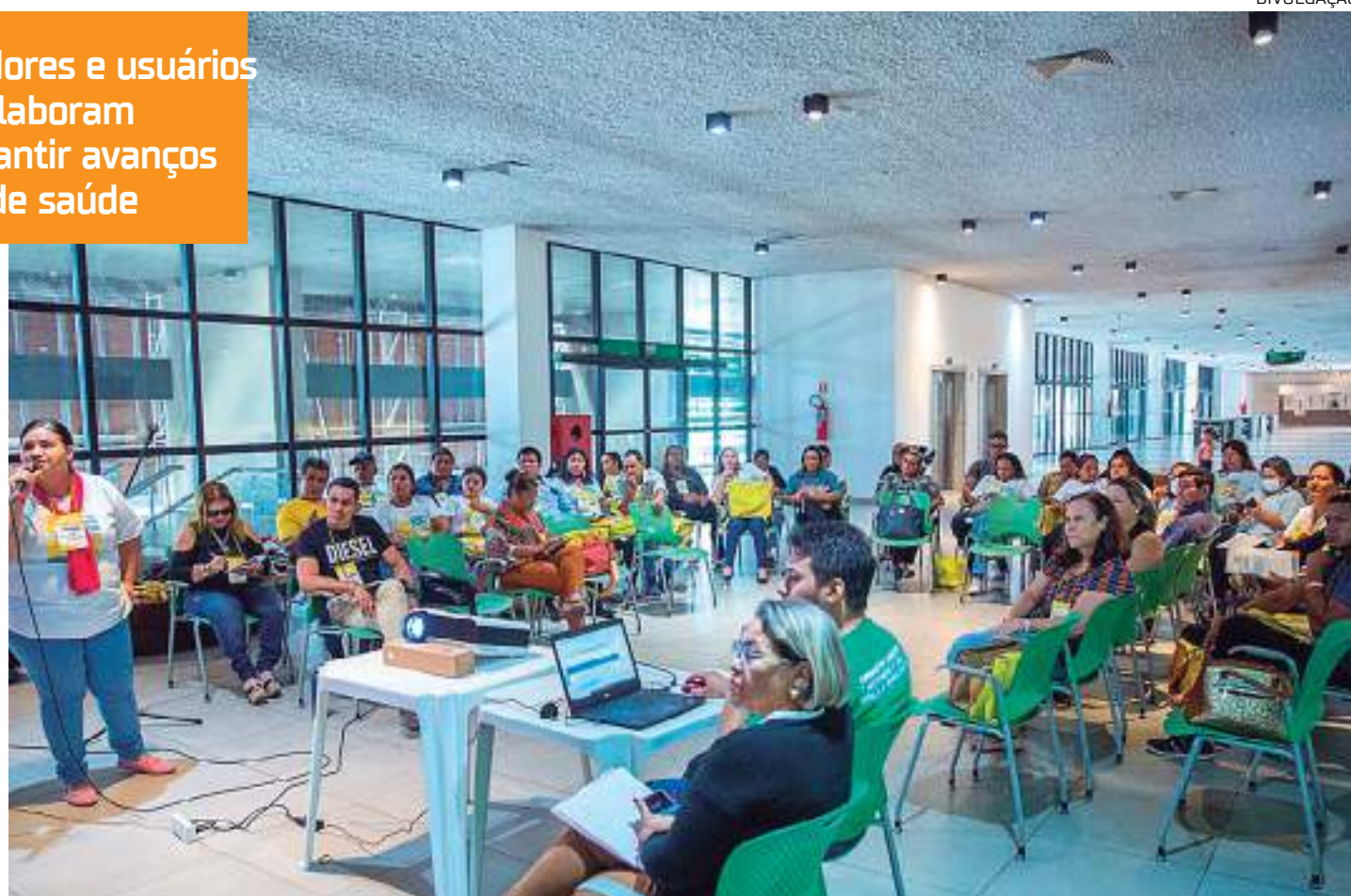
Conferência Municipal de Saúde de Manaus (IX Comus) aconteceu no Centro de Convenções do Amazonas Vasco Vasques

Para a elaboração das propostas, que serão incorporadas no Plano Municipal de Saúde (2025-2028) e demais instrumentos de planejamento na esfera municipal, além de encaminhadas para as esferas estadual e federal, os participantes da Comus foram divididos em oito grupos de trabalho, dois para cada um dos quatro eixos temáticos: O Brasil que temos. O Brasil que queremos; O papel do controle social e dos movimentos sociais para salvar vidas;