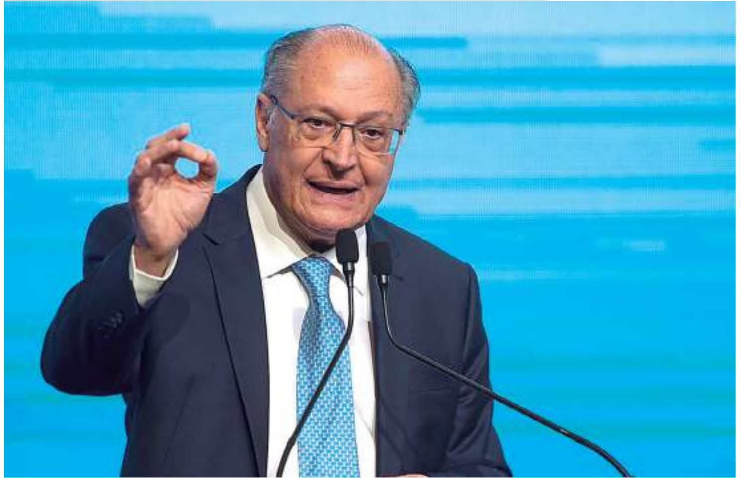
Segundo vice-presidente, apenas 26% das transações são intrarregionais

Ainda segundo Alckmin, o papel do crédito é importantíssimo nesse cenário e que deve ser impulsionado com a redução das taxas de juros a partir de melhora da expectativa com a política