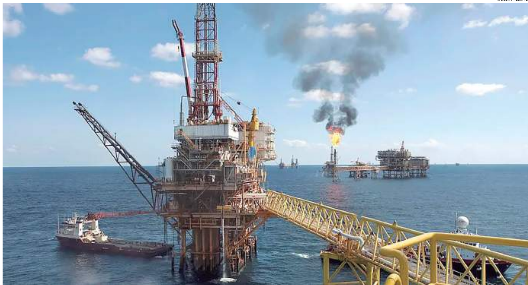
Petrobras considera a região como nova fronteira de produção

uma licença do Instituto Brasileiro do Meio Ambiente (Ibama) para perfurar o primeiro poço, batizado de Amapá Águas Profundas a 160 km da costa e a 40 km da fronteira com a Guiana Francesa. O objetivo desse poço é comprovar a viabilidade econômica.