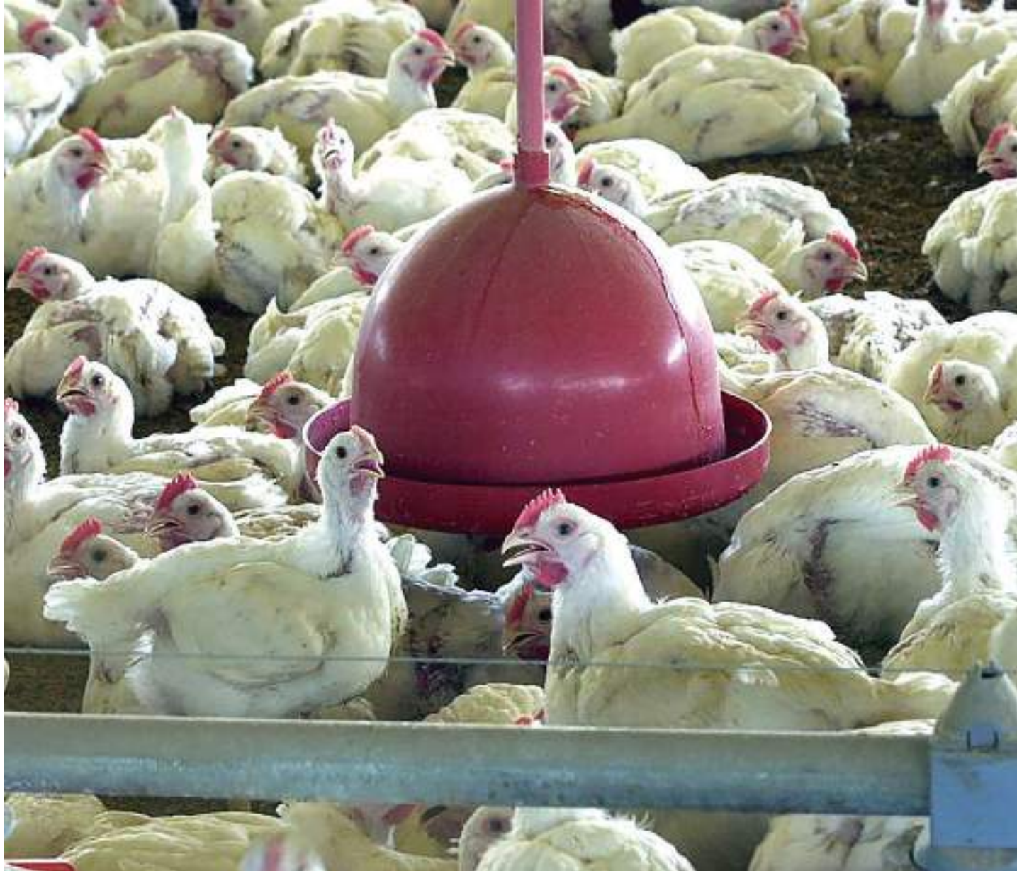
Mulher morreu na China, após se infectar com o vírus H3N8, causador da gripe aviária

A Organização Mundial da Saúde (OMS) confirmou a primeira morte por gripe aviária no mundo. A mulher, de 56 anos, morava na província de Guangdong, na China, e começou a apresentar sintomas em 22 de fevereiro. No dia 3 de março, ela precisou ser hospitalizada em razão de uma pneumonia grave e morreu no dia 16 do mesmo mês. No último dia 27, o governo chinês confirmou que a paciente foi infectada pelo vírus H3N8, causador da gripe aviária.