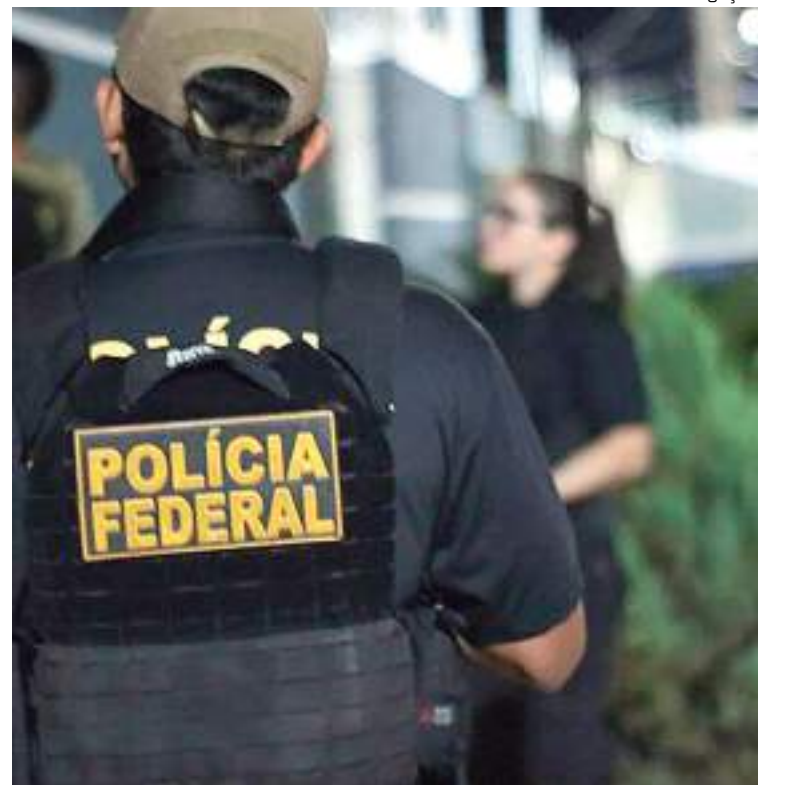
PF faz operação contra 20 faculdades por suspeita de fraude do Fies

A PF aponta ainda a participação de membros de escritórios advocatícios especializados em Direito Educacional. Os advogados atuavam junto aos servidores do FNDE com fins a possibilitar a reativação/liberação indevida de processos de recompra dos títulos públicos.