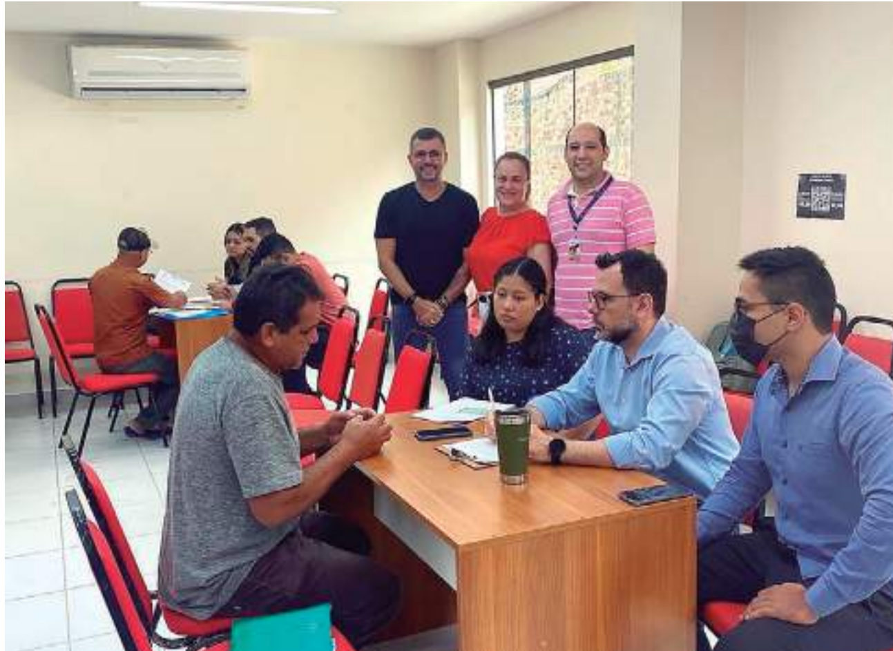
Além do atendimento jurídico gratuito, faculdade também oferece emissão da primeira e segunda via do RG

Para o serviço de emissão de RG primeira e segunda via é necessário apresentar certidão de nascimento ou de casamento, CPF, comprovante de residência e duas fotos 3x4.