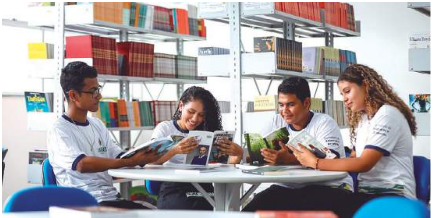
Em 2023, o Governo do Amazonas atuou na renovação do convênio que garante o Passe Livre Estudantil