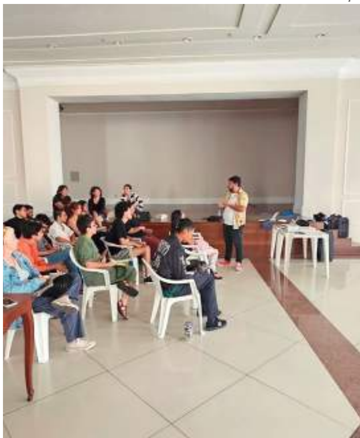
Professor ministra oficina de audiovisual em Manaus.

Os jovens interessados em carreira no segmento cultural, assim como profissionais já consolidados na área, tiveram a oportunidade de aprender ainda mais com sete oficinas disponibilizadas pela Prefeitura no campo do audiovisual. As aulas voltarão a ser oferecidas no mês de junho.