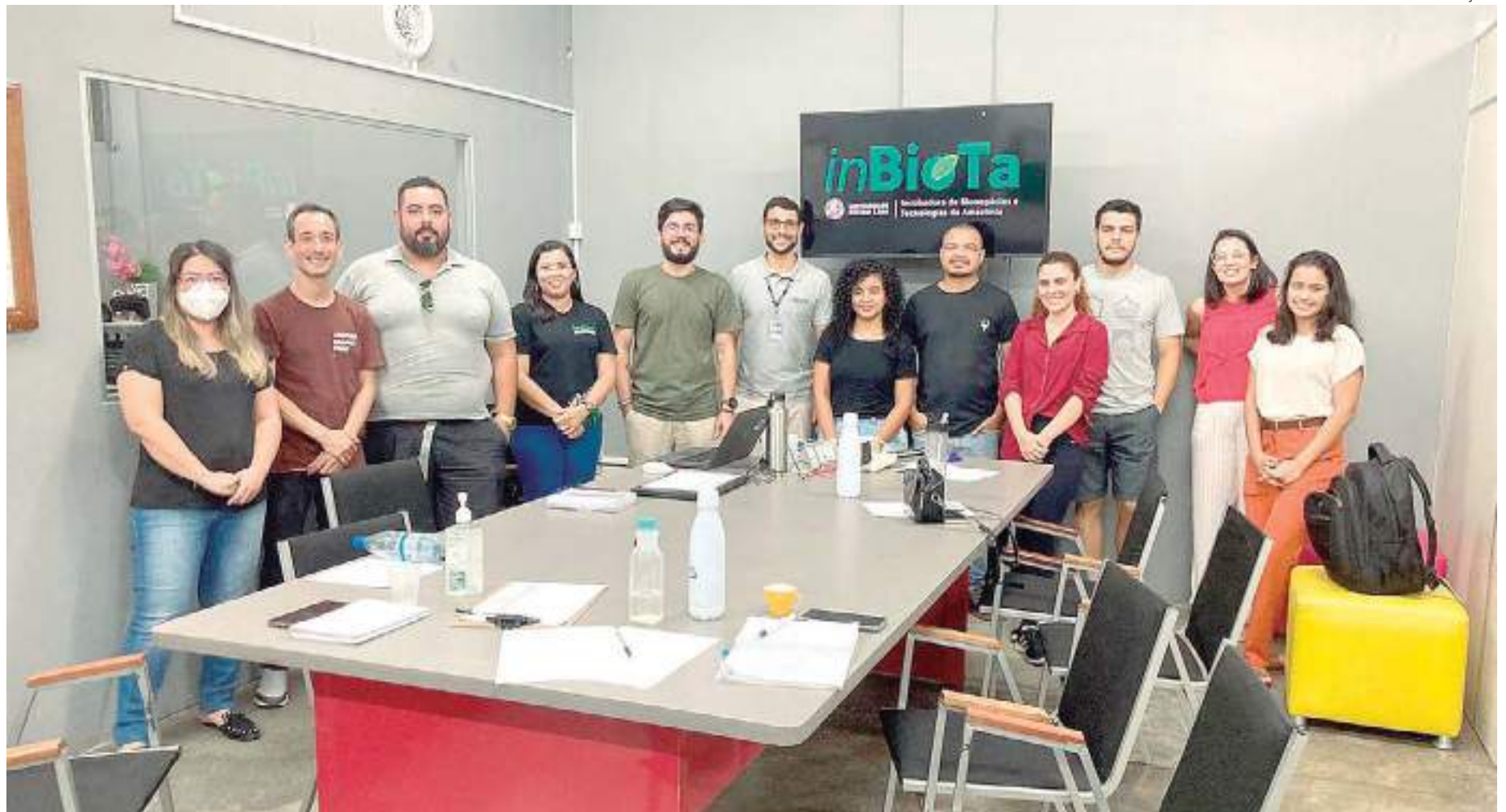
Equipe da Incubadora de Bionegócios e Tecnologias da Amazônia ou inBioTa

A equipe da inBioTa conta com mais de 10 parceiros envolvidos, três profissionais de inovação, que fazem parte do quadro efetivo da universidade e três bolsistas de apoio técnico cedidos pela universidade, que apoiam nas atividades e implantação dos processos-chaves, importantes para a certificação Cerne e fo-