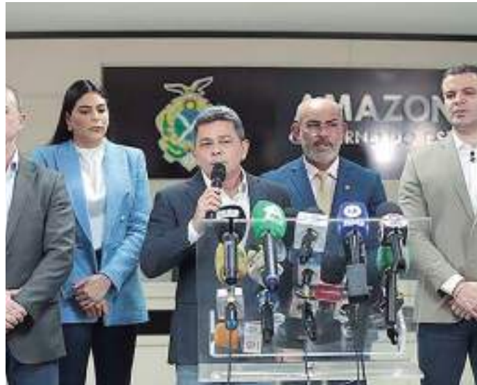
Detran-AM lança programa durante coletiva na sede do governo