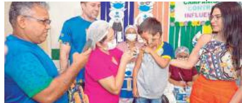
Imunização de criança durante Campanha Nacional de Vacinação contra a Influenza