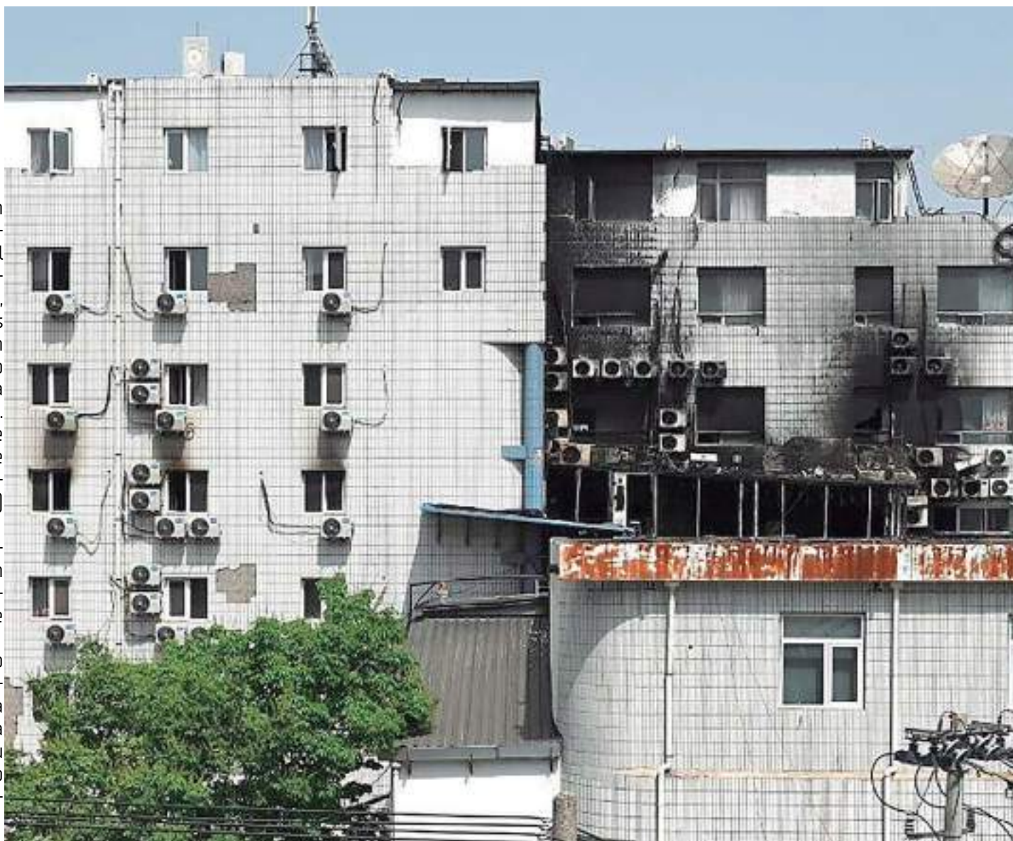
Incêndio em hospital, que deixou 29 mortos, é o maior da capital da China desde 2002

Doze pessoas foram detidas após o incêndio em um hospital de Pequim que deixou pelo menos 29 mortos, anunciaram as autoridades nesta quarta-feira (19), um dia após o acidente com o maior número de mortes na capital da China desde 2002.