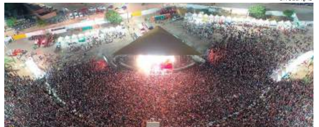
Multidão assiste a show no Centro de Eventos Juracema Holanda em Itacoatiara

As comemorações do aniversário do município de Itacoatiara, há 269 quilômetros da capital, vão ocorrer nos próximos dias 21, 22, 23 e 24 de abril. Mais de 25 atrações irão se revezar no palco do Centro de Eventos Juracema Holanda.