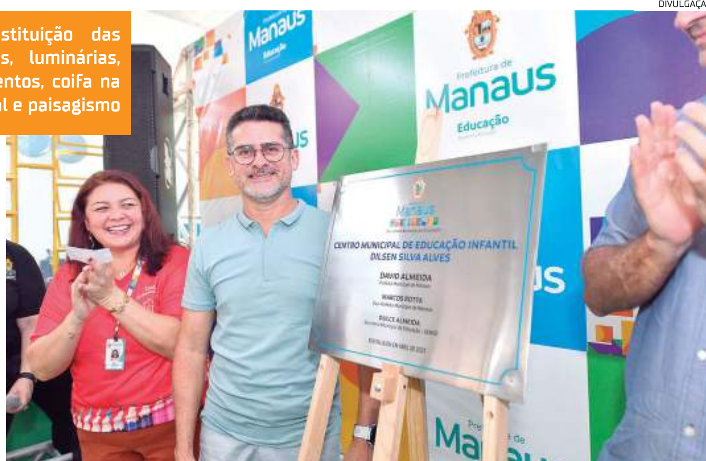
Cmei Dilsen Alves foi reinaugurado pelo prefeito de Manaus, David Almeida

O prédio escolar ganhou novas estruturas físicas, como construção de depósito de materiais de limpeza, banheiro,