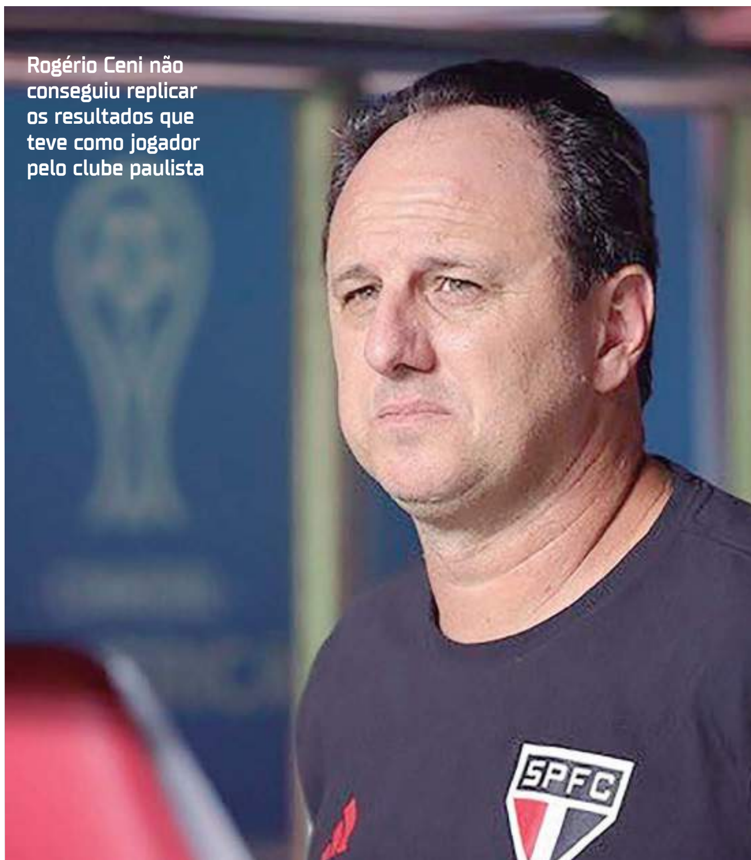
Treinador Rogério Ceni à frente do São Paulo, durante partida da Copa Sulamericana

Rogério Ceni não conseguiu replicar os resultados que teve como jogador pelo clube paulista