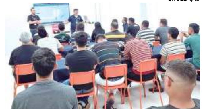
Empreendedores amazonenses se reúnem na sede da AMZ Tech