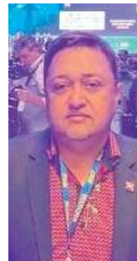
Prefeito foi morto com tiros na cabeça e no rosto