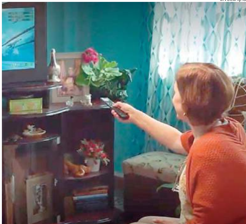
Famílias recebem nova parabólica digital no lugar da parabólica tradicional

A Siga Antenado é uma instituição não governamental criada por determinação da Anatel. Sem fins lucrativos, a entidade é a responsável por apoiar a população de menor renda durante a migração do sinal de TV utilizado pelas parabólicas tradicionais (Banda C) para o sinal das parabólicas digitais (Banda Ku).