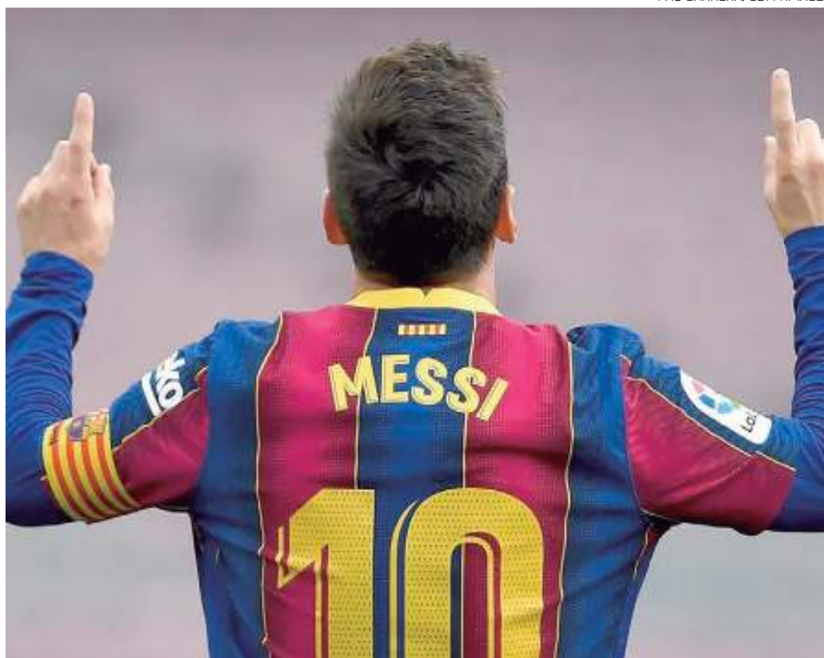
Lionel Messi atuando com a camisa dez do Barcelona. Argentino é o maior ídolo do clube catalão

A crise financeira do Barça, entretanto, impediu que a assinatura fosse possível, e La Liga não convenceu benefícios para os catalães contarem com o craque argentino. Messi então rumou para o Paris Saint Germain, onde tem uma temporada apagada. O melhor do mundo têm sido alvo de vaia rotineiramente