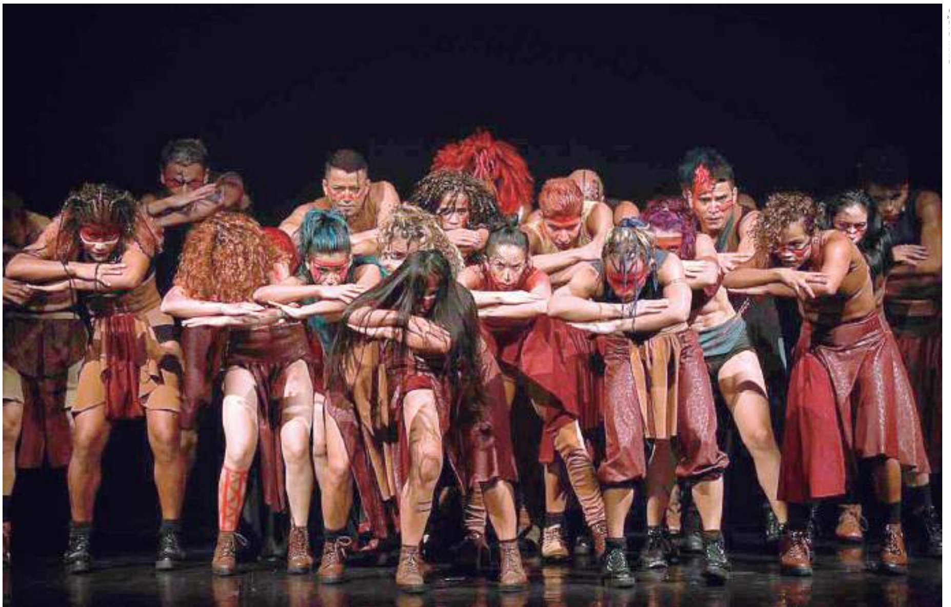
Apresentação do Corpo de Dança do Amazonas. Companhia realiza temporada no teatro Paulo Eiró, em São Paulo