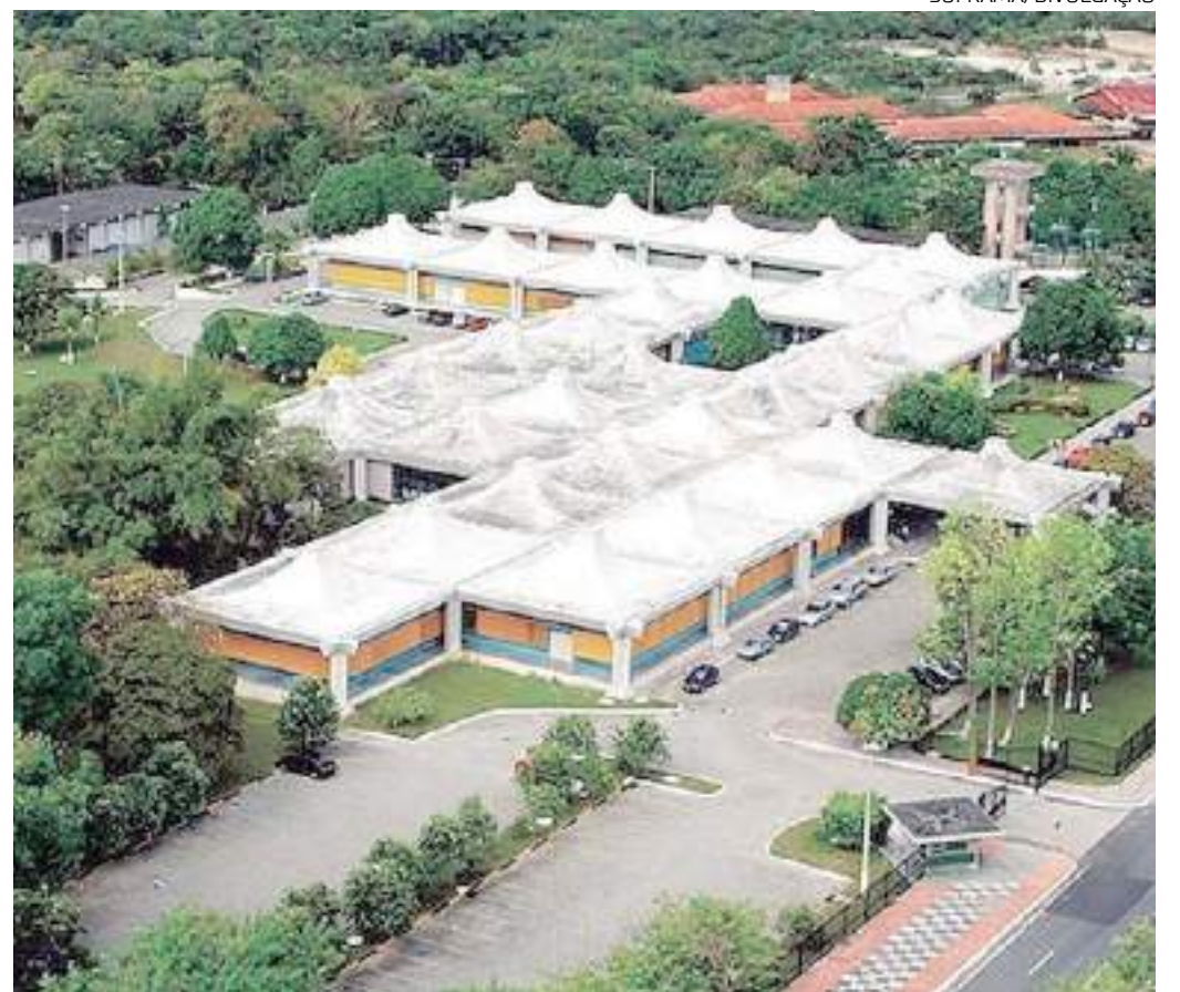
Superintendência da Zona Franca de Manaus

“A necessidade de valorização dos servidores da Suframa e do reforço do quadro de pessoal da instituição já foi verificada pelo próprio ministro do MDIC e