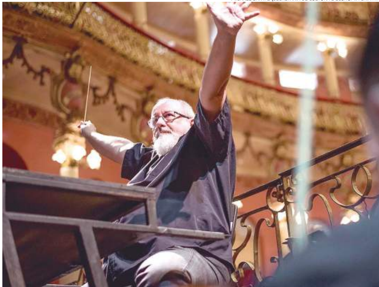
Maestro comanda orquestra durante espetáculo no Festival Amazonas de Ópera, no Teatro Amazonas