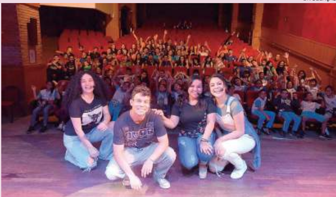
Atores posam para foto com alunos da rede pública do Amazonas, após apresentação

O projeto social 'Escola vai ao teatro' tem apoio do Ministério da Cidadania e levou, neste ano, 35 escolas da rede pública de Manaus e do Estado do Amazonas às plateias de diferentes peças. Atuando desde 2016, o projeto contou em 2023 com 16 sessões de espetáculos. O evento aconteceu do dia 20 de março à 3 de abril, no Teatro Manauara, localizado no shopping Manauara.