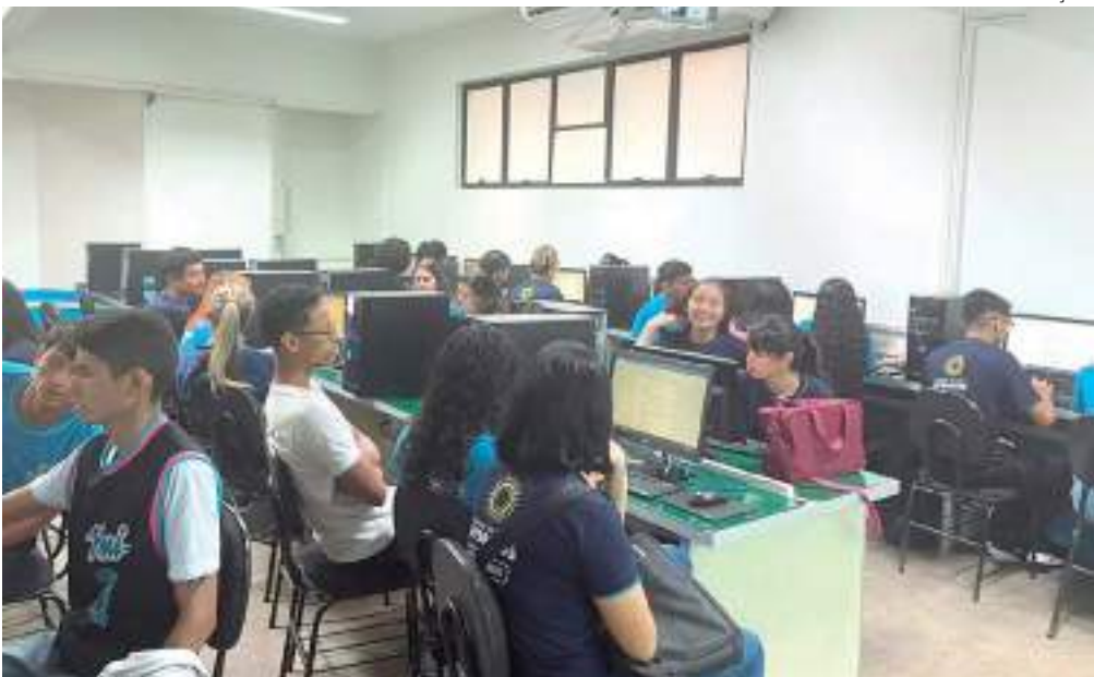
Estudantes participam da Oficina de Currículo no Centro de Ensino Literatus

Para ajudar estudantes a conquistarem melhores oportunidades no mercado, o Centro de Ensino Literatus conta com o projeto Oficina de Currículo que os orienta a como redigir e atualizar o currículo profissional. O objetivo é reforçar a importância da ferramenta que é porta de entrada para entrevistas e seleções de emprego.