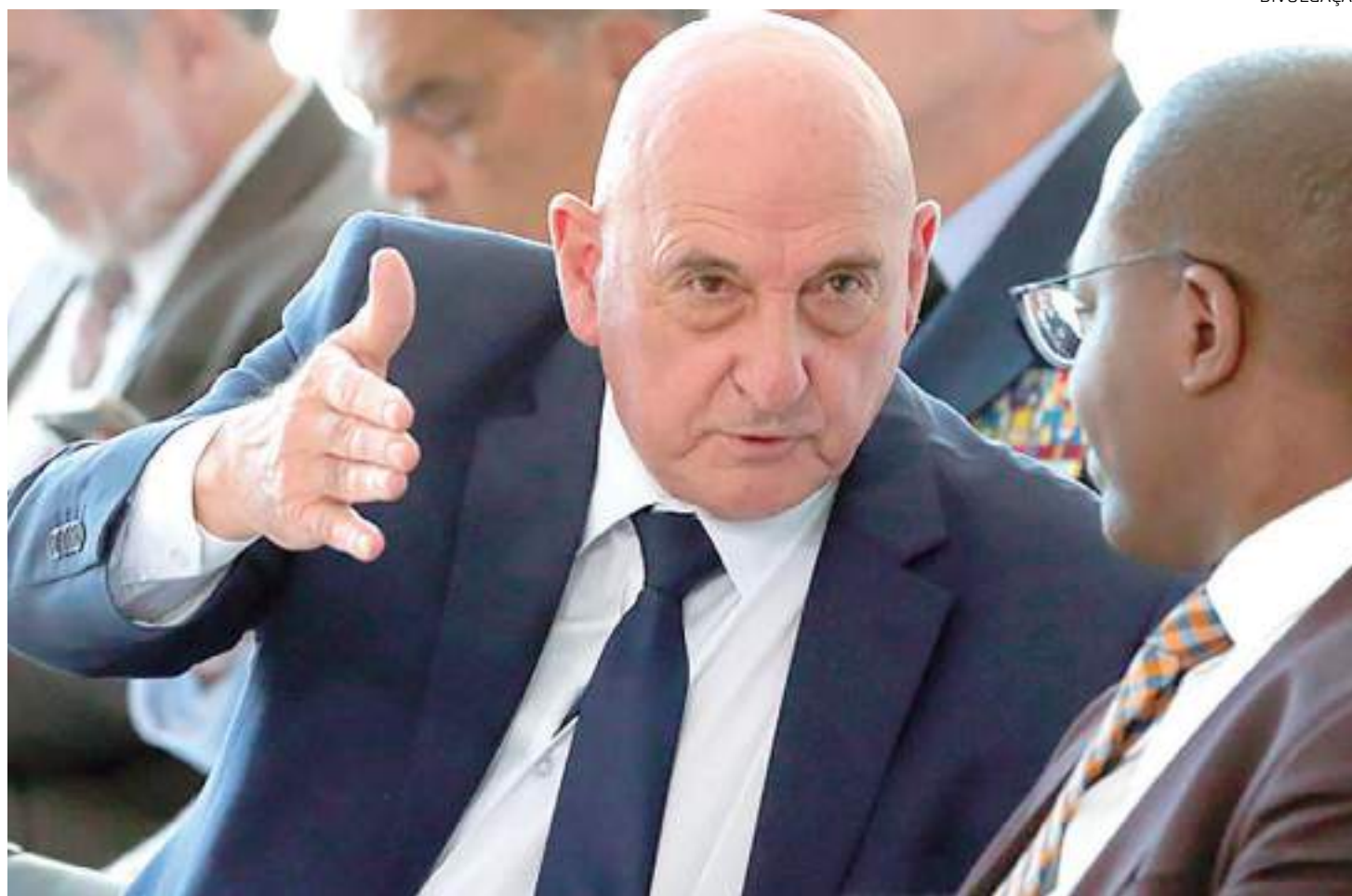
O ministro Gonçalves Dias chegou a mandar atestado para justificar sua falta à sessão da Câmara. Ele prestaria esclarecimentos

a Secretaria de Comunicação da Presidência da República disse que "não haverá impunidade para os envolvidos nos atos criminosos de 8 de janeiro". Leia a íntegra da nota: