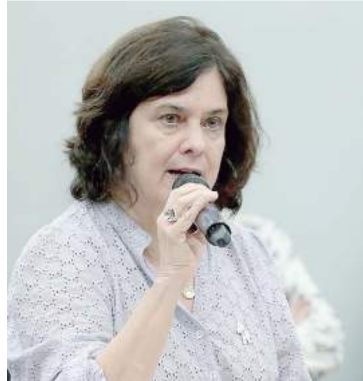
Nísia Trindade defende programa para preparação contra futuras pandemias

"Temos agora a oportunidade: veio a questão do arcabouço fiscal para o Congresso e, ao lado disso, toda a discussão da reforma tributária para pensarmos o país que queremos, o futuro que queremos", disse. Nísia citou ainda que as coberturas vacinais como um todo no país caíram desde 2016, sobretudo entre as crianças. "Temos visto, ainda hoje, um ataque frequente nas redes ao nosso movimento nacional pela vacinação", disse, ao pedir apoio aos parlamentares para impedir a propagação de fake news.