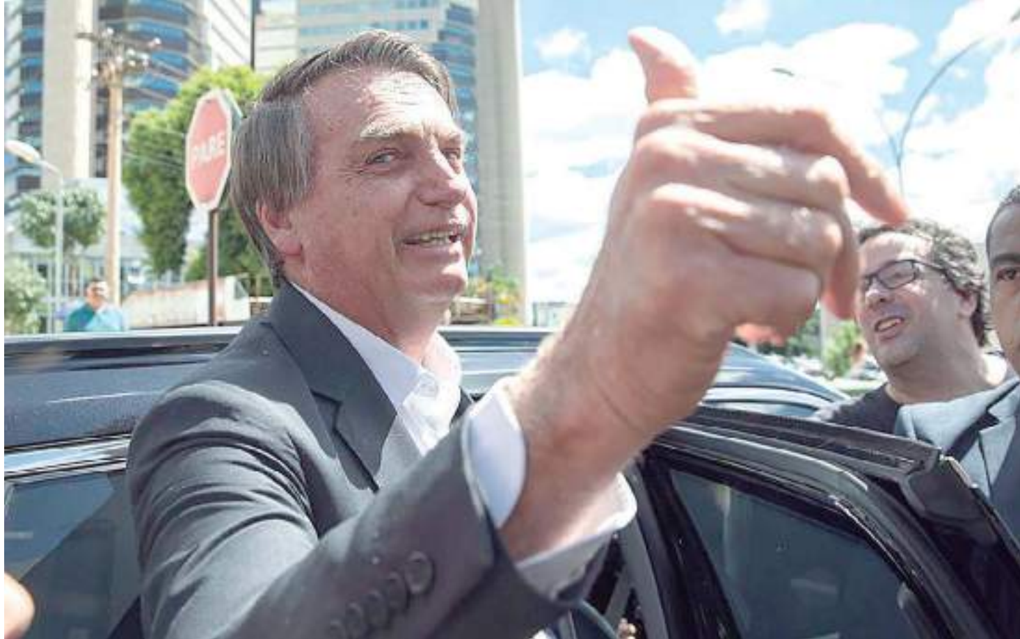
O ex-presidente Jair Bolsonaro após prestar depoimento à Polícia Federal (PF) sobre os ataques do dia 8 de janeiro

Defesa de Bolsonaro diz que ex-presidente ia apenas mandar vídeo por WhatsApp