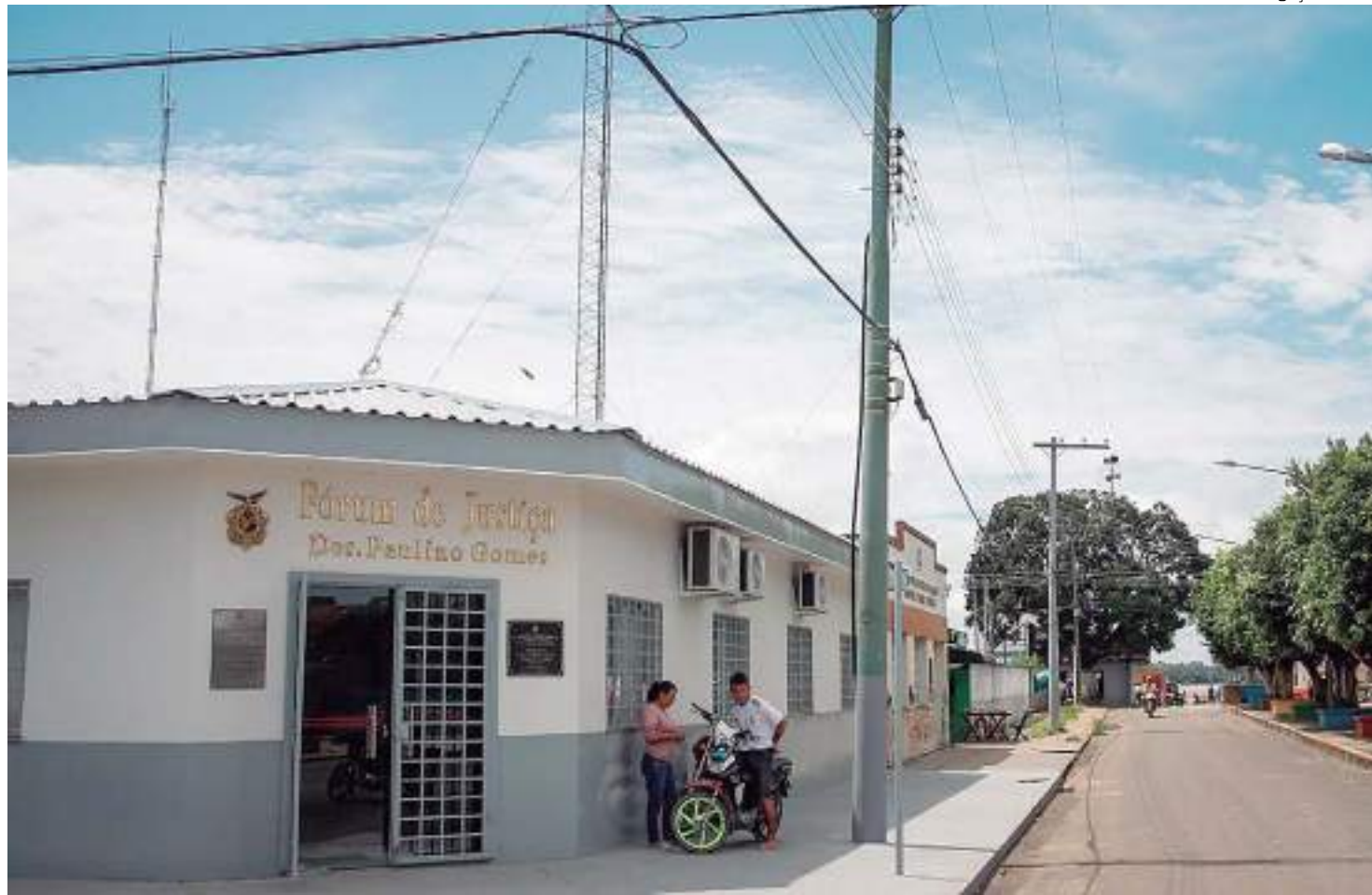
Processo envolvendo o Bradesco Vida e Previdência foi julgado na Comarca de Codajás

"No caso em apreço, os efeitos danosos da conduta imputada à parte promovida transcendem o mero aborrecimento inerente às relações massivas de consumo,