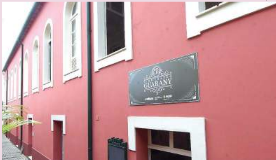
Personalidades são homenageadas na edição do Cineteatro Guarany