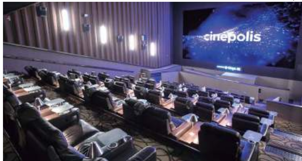
Rede Cinépolis estreia filmes no Shopping Ponta Negra

As estreias da semana da Rede Cinépolis, do Shopping Ponta Negra, nesta quinta-feira (27), têm filmes para todos os gostos: de ação, com o esperado "Cavaleiros do Zodíaco - Saint Seiya: O Começo"; suspense, com "Deixados para Trás - o início do fim"; terror, com "O Chamado