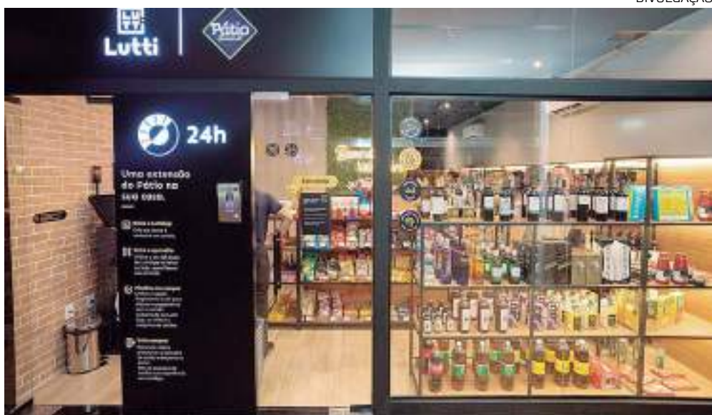
Grupo Nova Era inaugura loja em condomínio, com a marca Lutti by Pátio

O mercado de lojas autônomas vem se expandindo nos condomínios de Manaus. Entre os empreendimentos que estão ganhando esse mercado, o Grupo Nova Era segue inaugurando novas lojas, com a marca Lutti by Pátio. Em abril foram inauguradas duas unidades nesse formato, nos condomínios Laranjeiras e Passaredo. No mês de fevereiro, outras duas unidades já tinham sido abertas. Novas lojas serão inauguradas também em maio nos condomínios Quintas das Marinhas e Amazon Village.