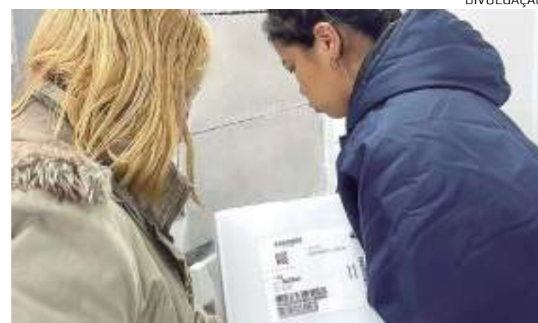
9.024.132 doses foram aplicadas em todo o estado

Conforme os dados parciais do Programa Nacional de Imunização (PNI) que 9.024.132 doses foram aplicadas em todo o estado até esta quarta-feira (26), sendo 3.423.001 de primeira dose, 2.890.506 de segunda dose, 77.173 com dose única, 1.806.336 de 1ª dose de reforço, 733.188 de 2ª dose de reforço e 4.973 de dose adicional para os imunossuprimidos e 88.955 doses de vacina bivalente.