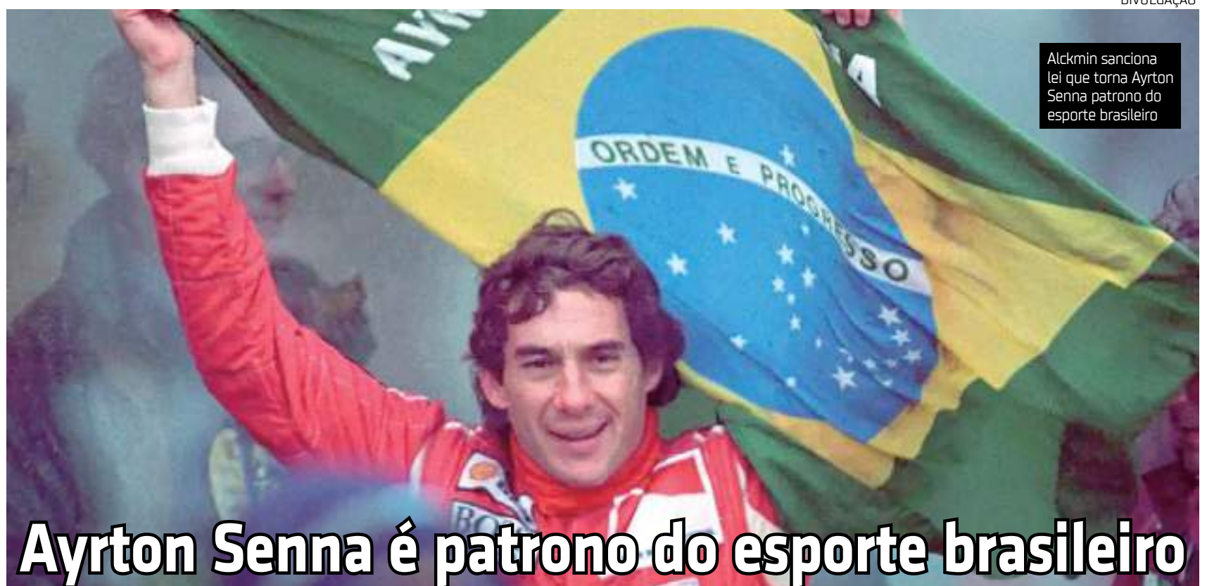
Alckmin sanciona lei que torna Ayrton Senna patrono do esporte brasileiro