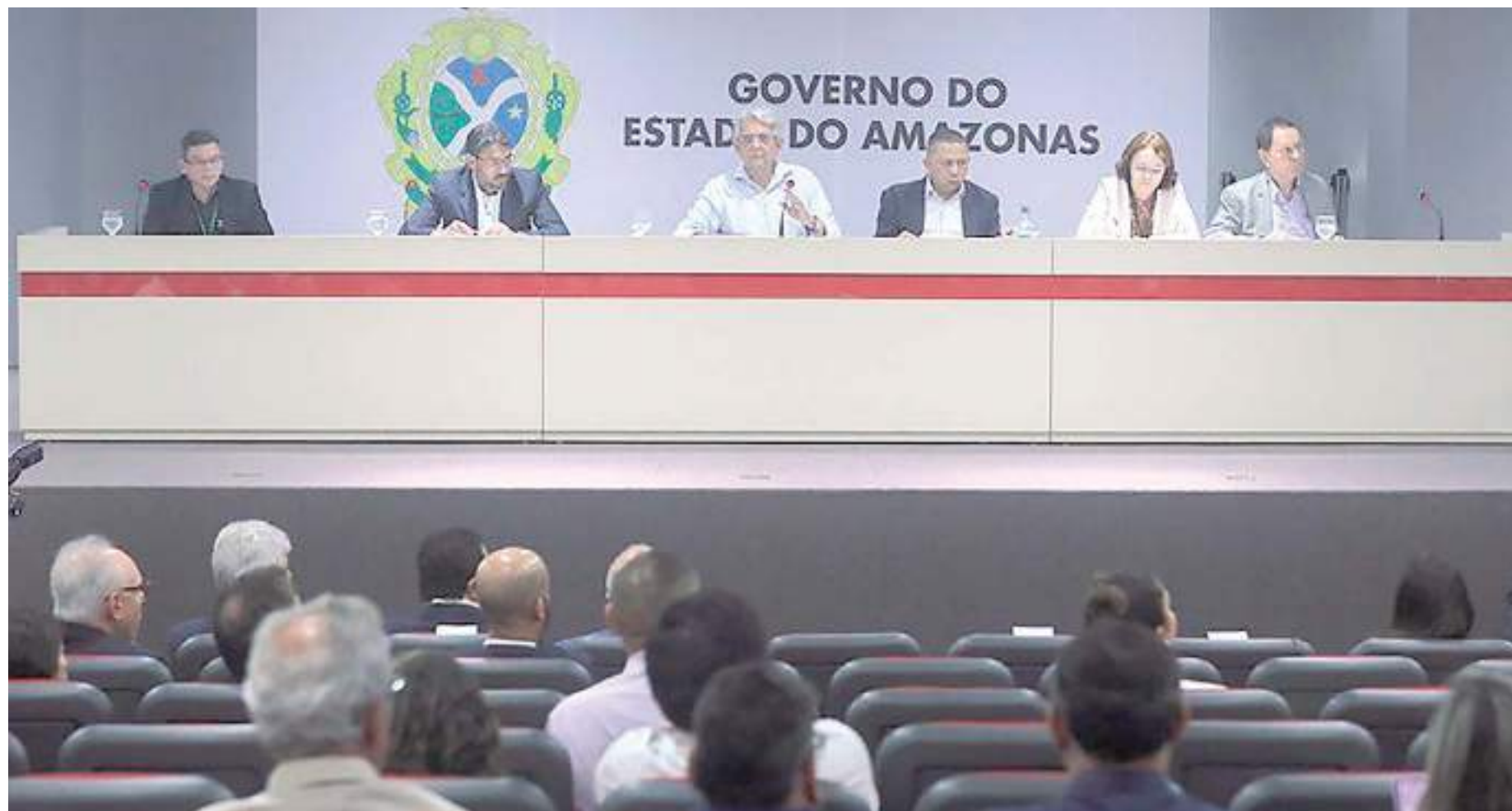
301ª reunião ordinária do Conselho de Desenvolvimento do Estado do Amazonas

“Esses projetos são importantes para geração de emprego e renda. Os projetos que foram aprovados hoje [quarta] têm o aporte de, aproximadamente, R$