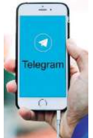
Telegram deve sair nos próximos dias no Brasil