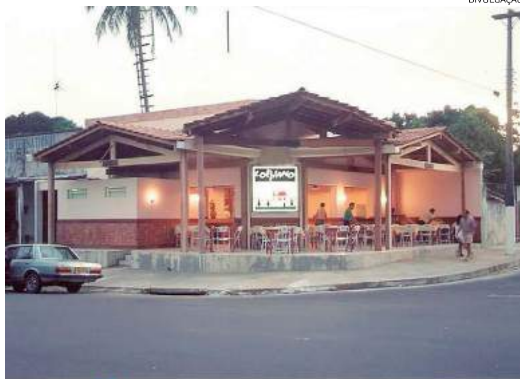
Estabelecimento fundado em 1994 comemora data com programação especial para os clientes

"Quando eles estavam começando, nós resolvemos dar espaço para eles, já que nosso propósito é apoiar os talentos da terra. Então, aproveitamos esta data de celebração para marcar mais um encontro com a banda na nossa casa. Além disso, teremos a participação do DJ Batista Pi, tocando músicas dos anos 70 e 80, para deixar a noite ainda mais memorável", assegura.