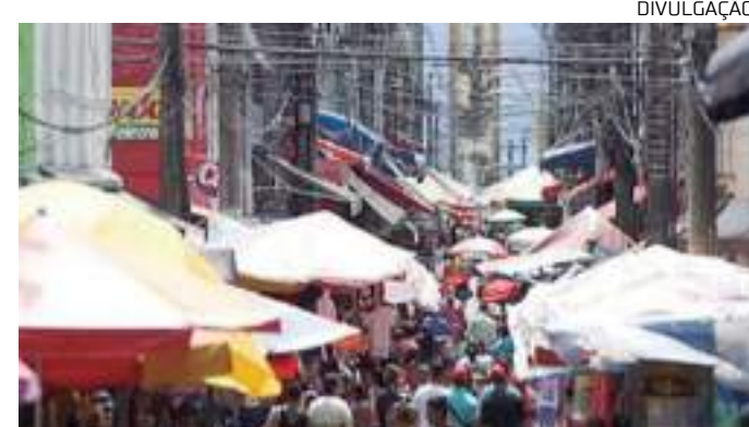
População amazonense ocupa a terceira colocação de inadimplentes

Ao todo, o Brasil conta com mais de 258 milhões de dívidas, que, somadas, ultrapassam a quantia de R$ 334,5 bilhões em março. O valor médio das dívidas de cada inadimplente passou a ser de R$ 4.731,62 e os valores aproximados de cada dívida chegam a R$ 1.293,69 - Distrito Federal, Santa Catarina e São Paulo seguem apresentando os três maiores valores da série entre os Estados, com valor médio de R$ 7.187,92, R$ 6.612,76 e R$ 5.464,44 respectivamente.