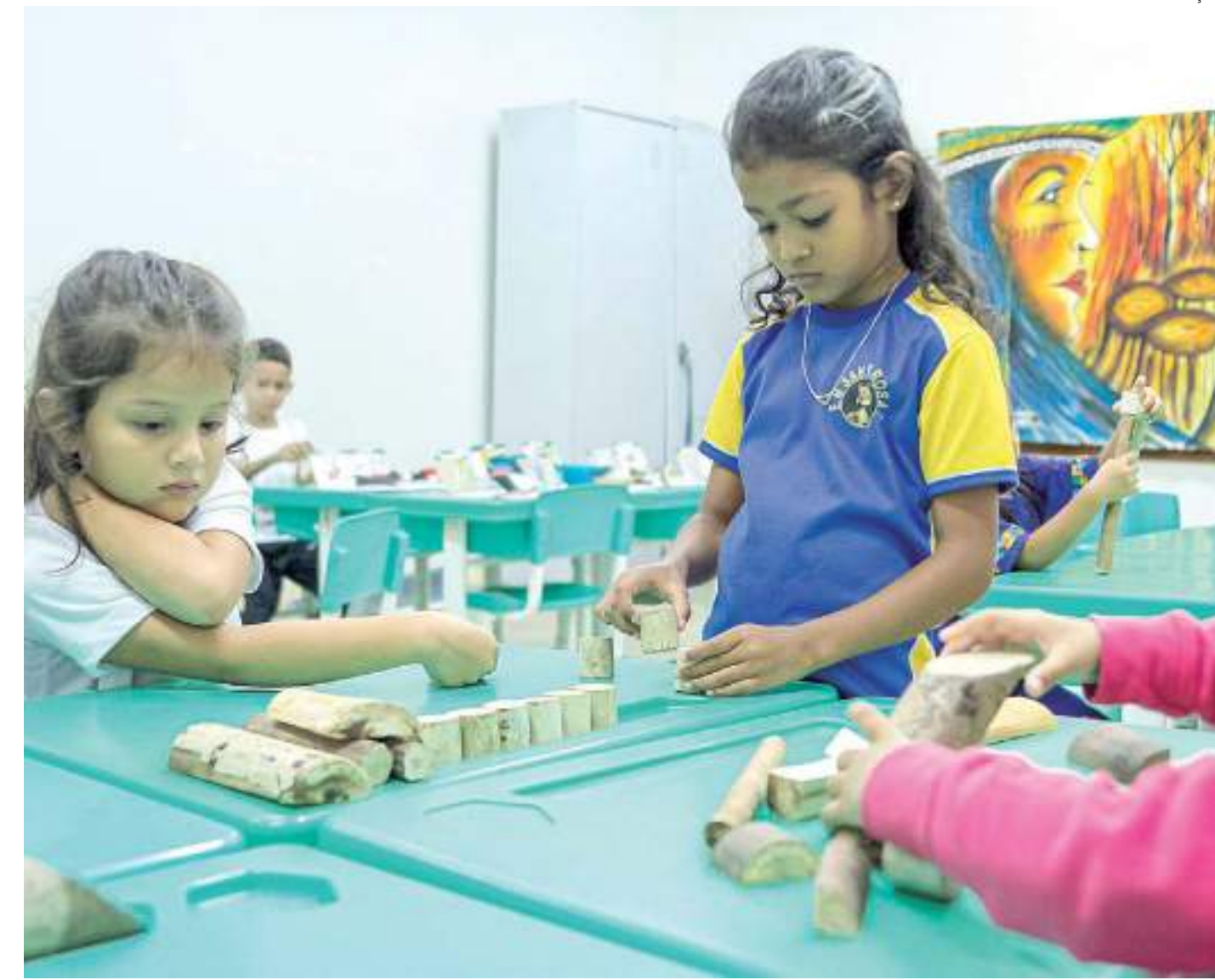
Estudantes de escola municipal participam de projeto que incentiva a preservação de animais da fauna amazônica

"As famílias participaram e fizeram a curadoria de todo o material, trouxeram