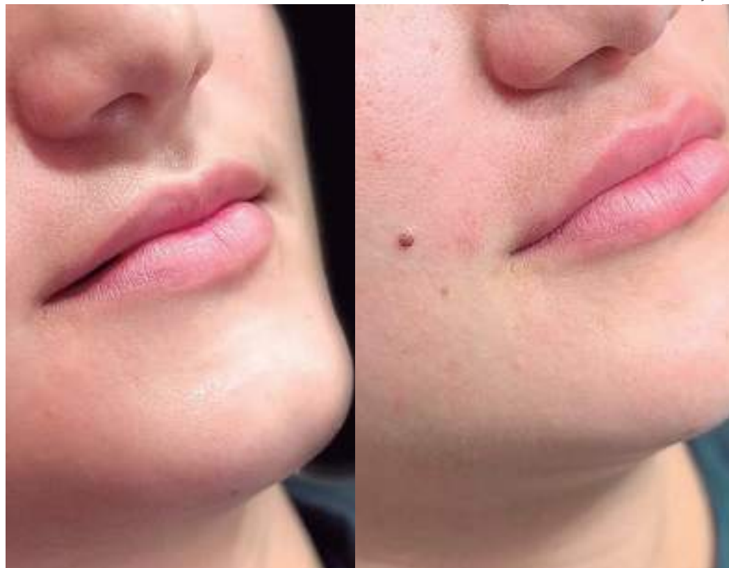
Preenchimento labial precisa ser realizado por um especialista em harmonização orofacial

"A diferença de um profissional que não tem o visagismo como recurso de diagnóstico é que ele vai ser bom na técnica, mas o profissional que tem o visagismo no seu planejamento vai pensar no objetivo de imagem do cliente associado à téc-