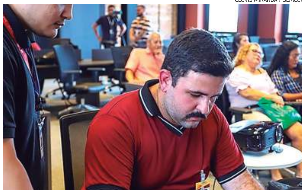
Curso facilitará o contato com o inglês e a interação entre os empreendedores e seus clientes

Com metodologia adaptada para negócios, as aulas poderão ser assistidas a partir do aplicativo do programa, e terá duração de dez meses.