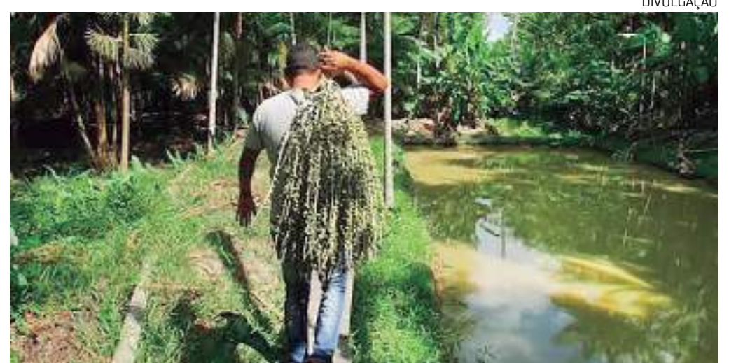
Empresa Bringel nasceu no coração da Amazônia, no ano de 1995

Ao longo dos 28 anos desde a abertura da primeira farmácia, atualmente, o Grupo Bringel está presente em 13 Estados brasileiros, gerando milhares de postos de trabalho diretos e indiretos e segue confiando e investindo no desenvolvimento do Brasil, do Amazonas e da Amazônia.