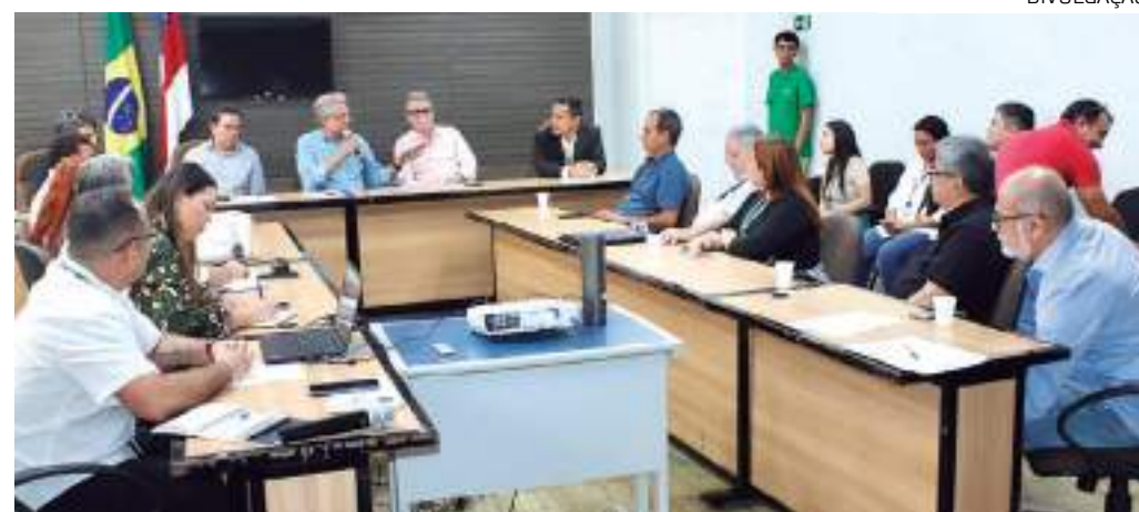
Zoneamento Ecológico Econômico para impulsionar economia do interior do Estado do Amazonas