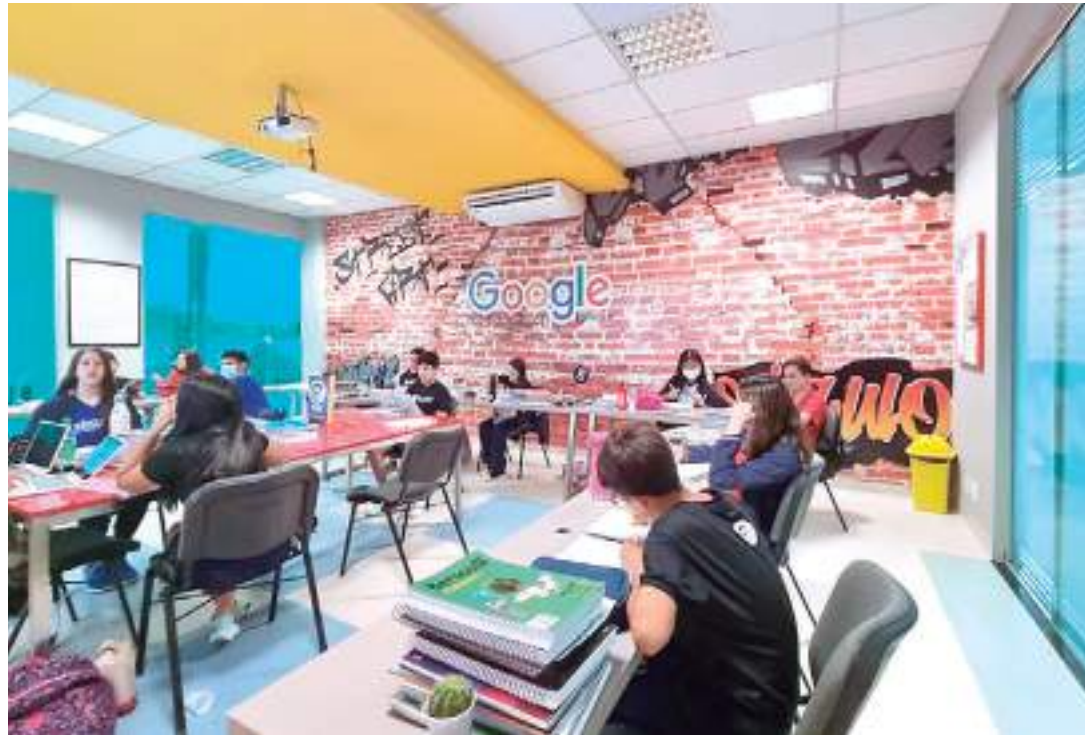
Unidade de ensino tem uma estrutura moderna para acolher os alunos, pais e professores

Para complementar e trazer mais qualidade de saúde bucal e mental para os alunos, o Século inaugurou, no dia 15 de março, as salas de odontologia e psicologia. As novas salas pretendem oferecer um ambiente diferenciado e dedicado aos alunos da instituição.