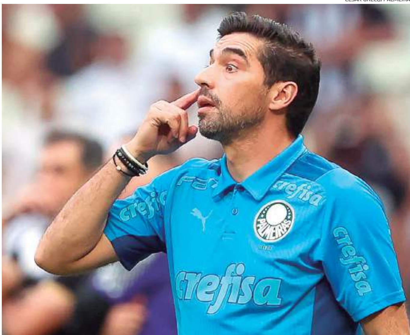
Técnico português Abel Ferreira busca seu oitavo título à frente do Palmeiras