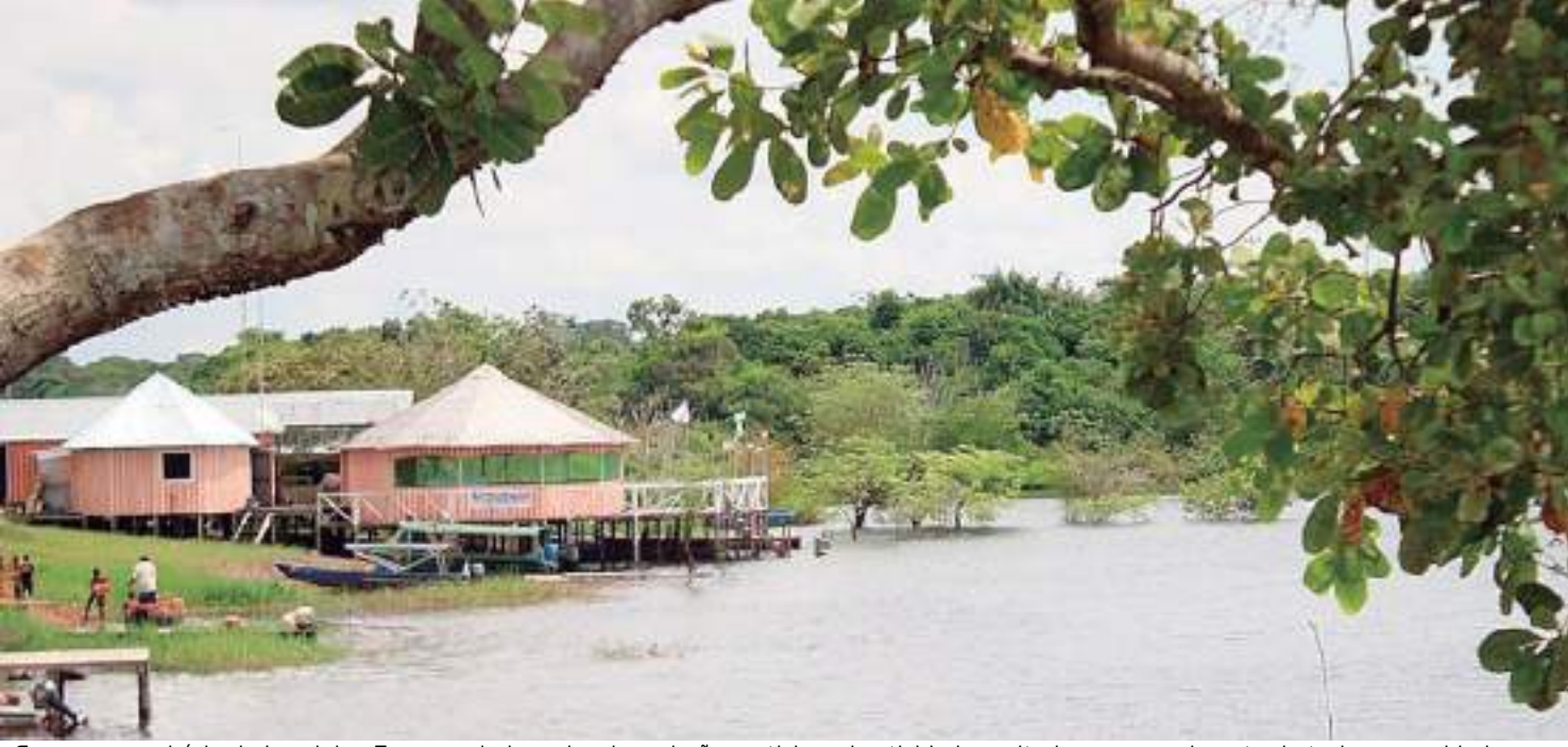
Casas no município de Irاندuba. Empreendedores locais poderão participar de atividades voltadas ao aquecimento do turismo na cidade