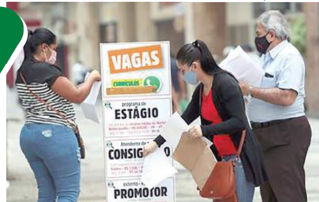
No Estado de São Paulo, mulher coloca currículo em caixa ao lado de anúncios de empregos

O Instituto Brasileiro de Geografia e Estatística (IBGE) informou que a taxa de desemprego ficou em 8,6% no período, o que representa alta em relação à taxa de 8,1% registrada no trimestre imediatamente anterior, até novembro, e é a mais