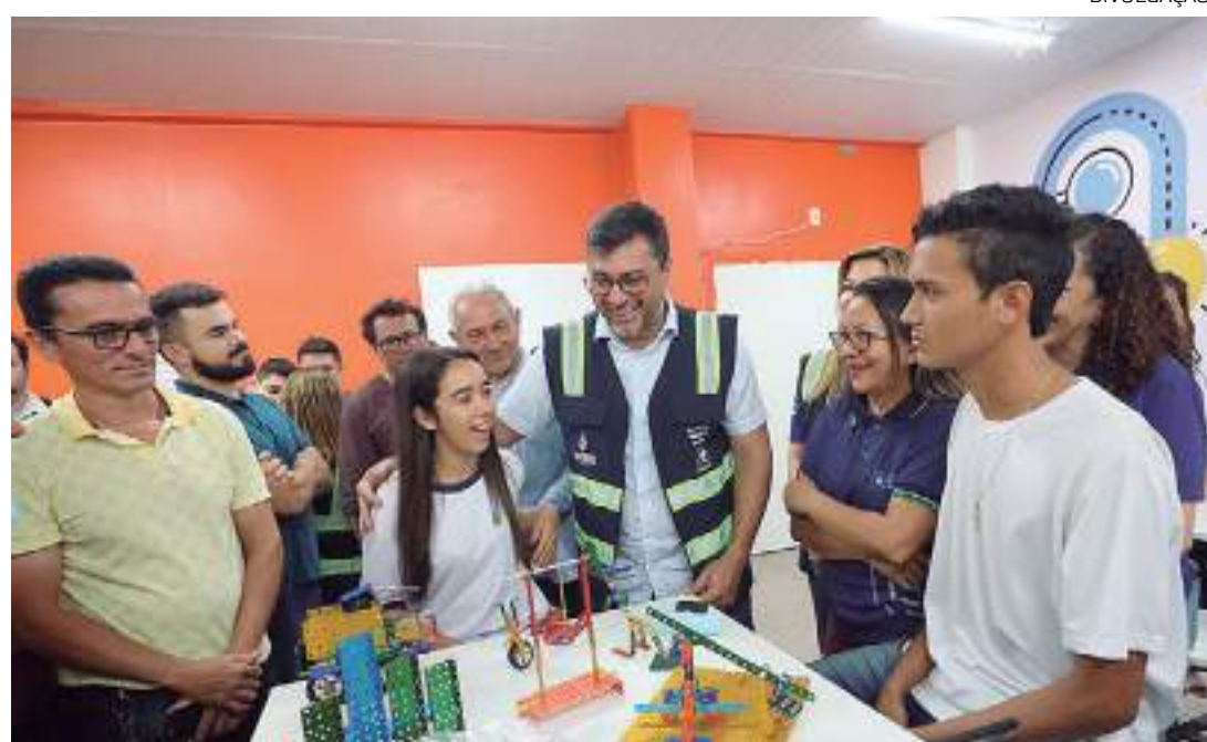
Wilson Lima visitou cada espaço da unidade escolar entregue pelo Governo do Amazonas

A nova escola conta com 21 salas de aula e uma sala de Recursos Especiais, equipada para atender alunos da Educação Especial, sala de dança, música, lutas, piscina, fanfarra, auditório, quadra de