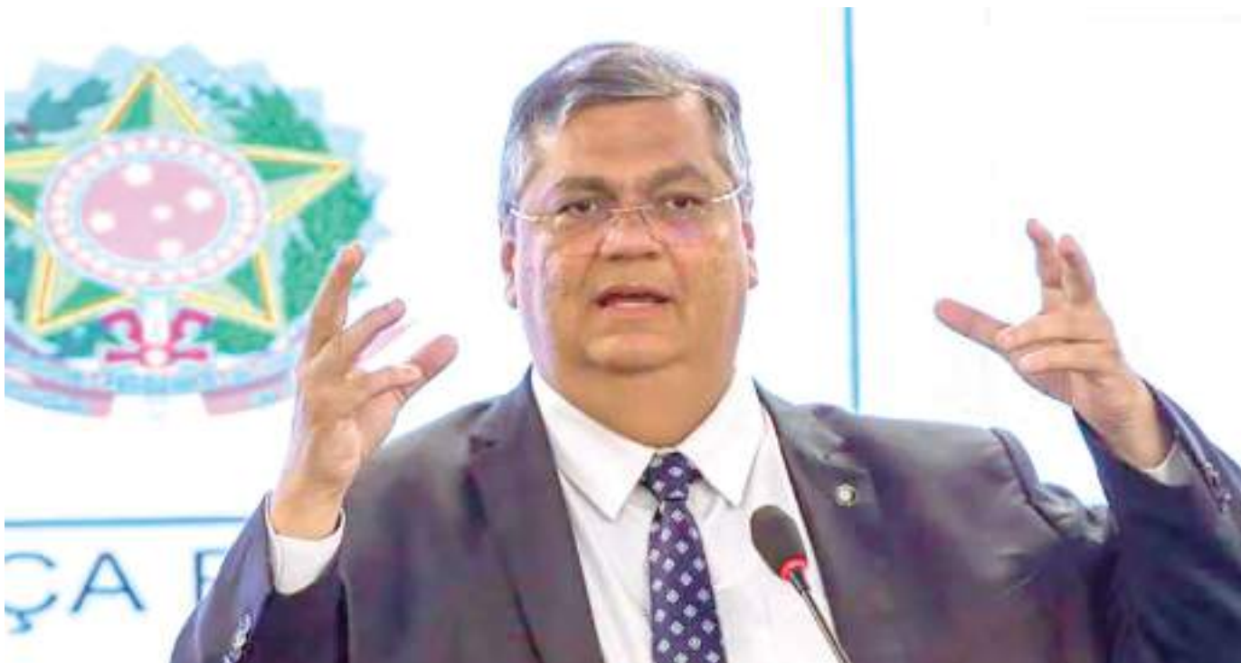
Ministro disse que, com a experiência que tem, "é possível dizer que inquérito está próximo de seu final"

Segundo o ministro da Justiça e Segurança Pública, Flávio Dino, o inquérito que investiga o recebimento de joias sauditas pelo ex-presidente Jair Bolsonaro (PL) está "próximo do fim".