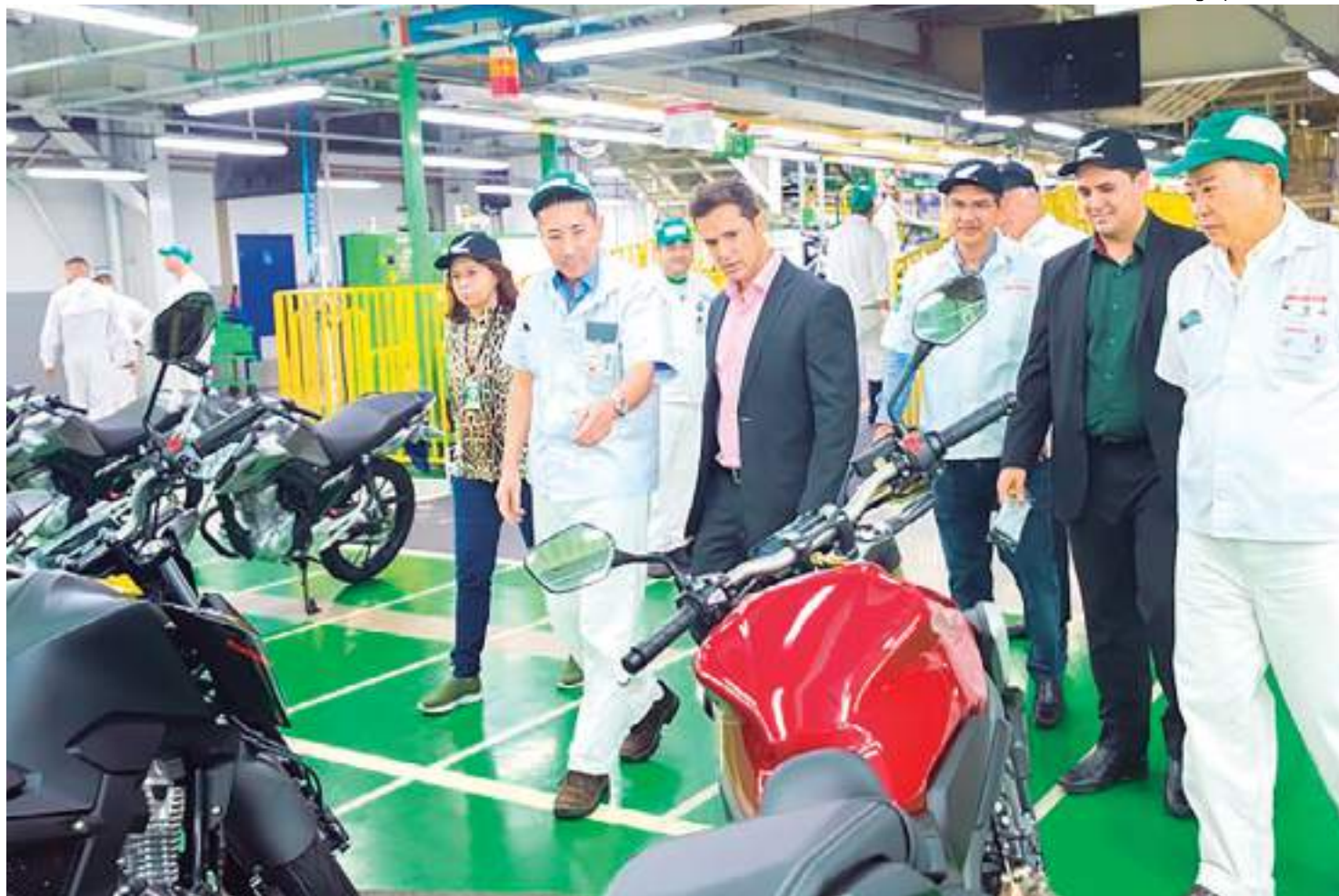
Secretário conheceu, in loco, as cadeias produtivas de empresas dos segmentos Eletroeletrônico, Bens de Informática e Duas Rodas do PIM

No mesmo dia, a comitiva ainda foi ao Sidia Instituto de Ciência e Tecnologia, uma das mais conceituadas ICTs priva-