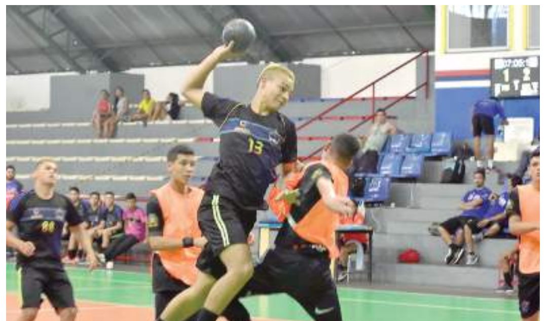
Atacante arremessa bola após superar defensor em partida de Handebol

A Taça Manaus de Handebol Junior será em formato "tiro curto", avançam para as semifinais os dois melhores times de cada grupo, em busca da fase classificatória para conquista do tão sonhado título. O evento tem entrada gratuita.