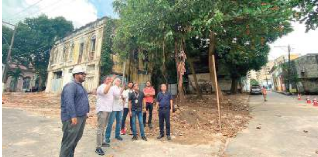
Técnicos realizam estudos para acabar com poluição visual do complexo de São Vicente, no Centro

“Temos algumas diretrizes e vamos levar o tema para a Amazonas Energia, já que par-