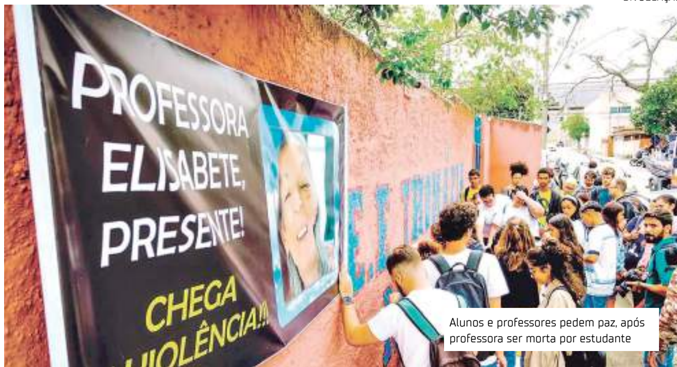
Alunos e professores pedem paz, após professora ser morta por estudante

Foram listadas 22 ocorrências desde 2002, sendo que em uma ocasião o ataque envolveu duas escolas. Em três episódios, o crime foi cometido em dupla. Em cinco, os atiradores se