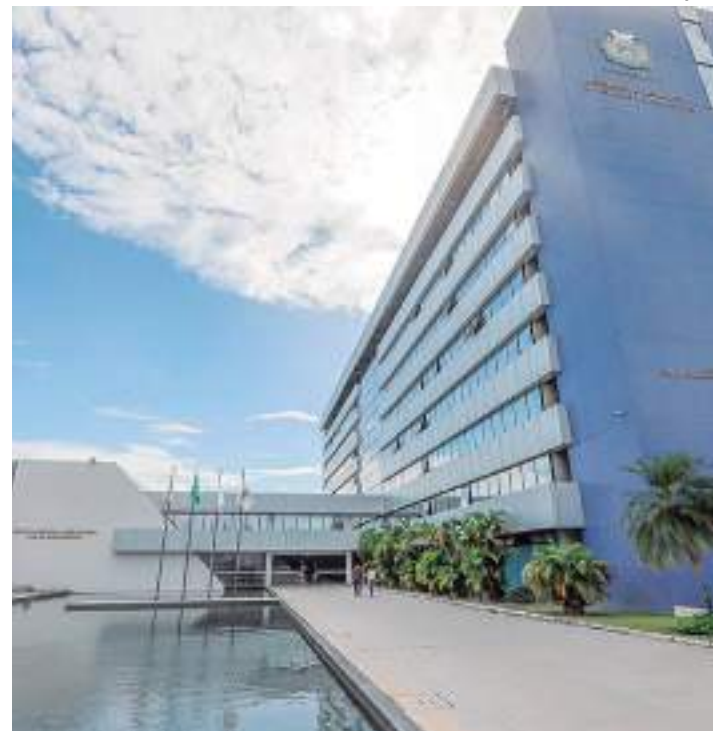
Saúde da mulher é uma das principais pautas da Aleam em 2023

O PL nº 41/2023, da deputada Joana Darc (União Brasil), institui a Semana Estadual em Prol da Saúde Mental Policial. A ação deverá ocorrer sempre na primeira semana de janeiro, coincidindo com o período que já acontece a campanha Janeiro Branco, dedicada à conscientização da saúde mental.