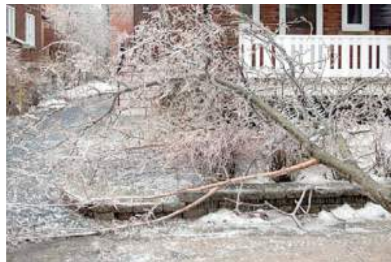
Galhos de árvore caídos em Monkland Village, Montreal, após a tempestade de gelo

"Foi a pior tempestade de gelo dos últimos 20 anos", disse à AFP o aposentado Jean-Marc Grondin, 64, que vive no centro da cidade.