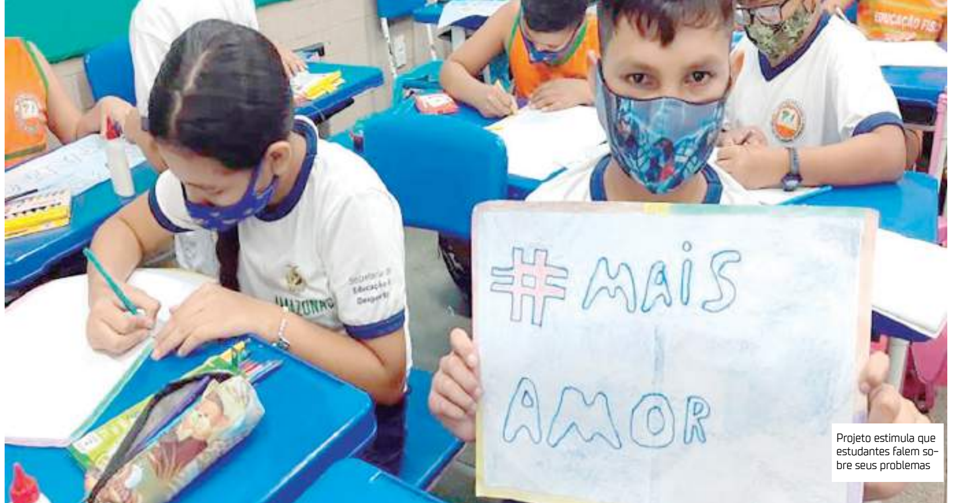
Projeto estimula que estudantes falem sobre seus problemas

"No primeiro ano das atividades, iniciamos por meio de uma assembleia que abordava as situações de convivência na escola e tinha o objetivo de introduzir e explicar o conceito. O próximo passo foi conhecer e estudar a Lei Antibullying, interpretando