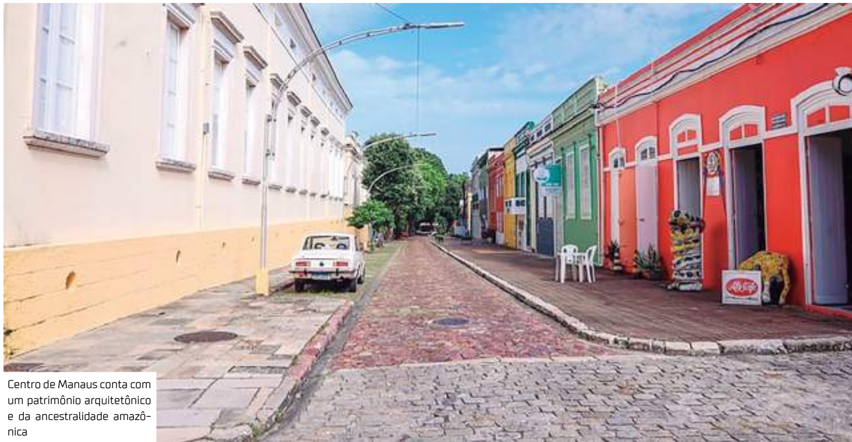
Centro de Manaus conta com um patrimônio arquitetônico e da ancestralidade amazônica

Um dos produtos do poder público de referência para o território é o “Manual de Placas: Parâmetros para Publicidades, Bancas e Despoluição Visual das Fachadas no Sítio Histórico e Centro Antigo e Histórico da Cidade de Manaus”, que está em nova edição revista e ampliada, devendo ser lançado até este primeiro semestre de