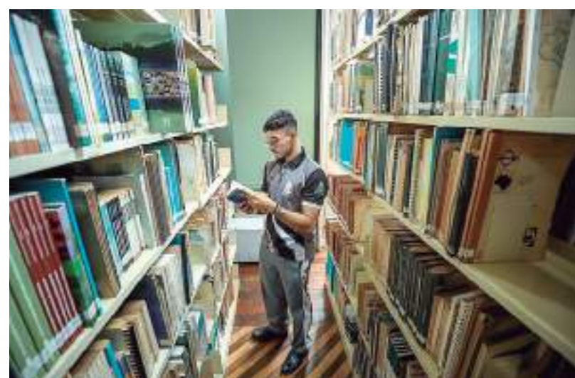
Alunos da rede pública usam a biblioteca como fonte de pesquisa e estudo