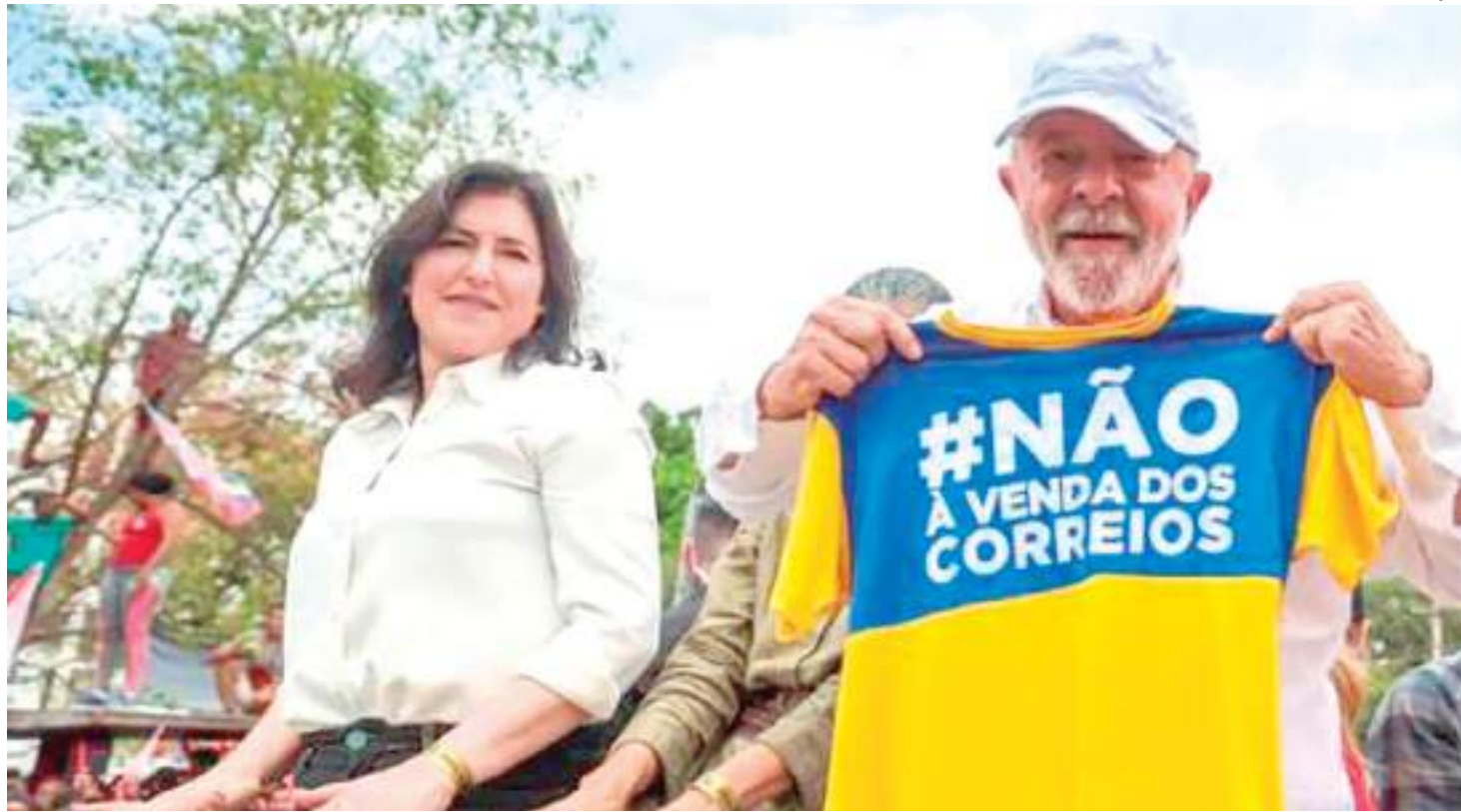
Ministra do Planejamento e Orçamento, Simone Tebet, e Lula em discurso contrário à privatização dos Correios

Na quarta-feira, 5, o Conselho do Programa de Parcerias