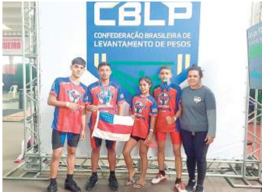
Atletas de diferentes idades que participarão do Campeonato Amazonense de Levantamento de Pesos. Evento busca trazer reconhecimento para a modalidade

Segundo o dirigente, aproximadamente 60 atletas vão disputar o estadual de levantamento de pesos em quatro faixas etárias: Sub-15, Sub-17, Sub-20 e Adulto.