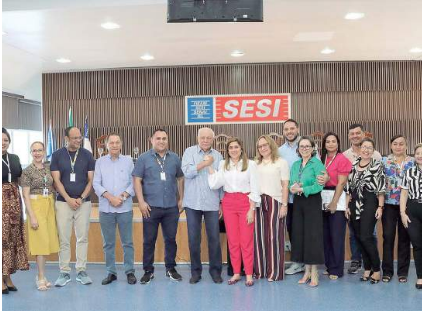
A assinatura do convênio foi na sede da escola, na avenida Governador Danilo de Matos Areosa, no Distrito Industrial

A parceria trabalha ainda para a distribuição de mais 300 vagas, em outras unidades do Sesi, até 2024.