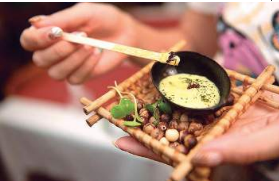
Restaurantes amazonenses promovem uma imersão na culinária local