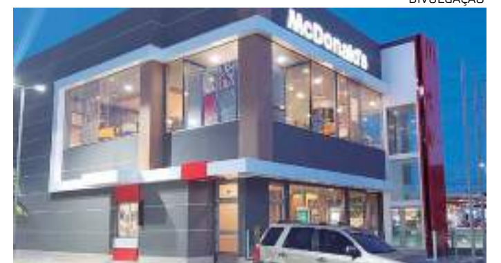
Restaurante McDonald's na avenida Djalma Batista