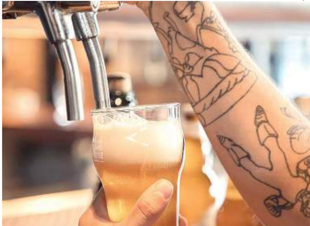
Cervejeiras oferecem formação para trabalhar em bares e restaurantes

O curso é fruto de uma parceria entre a Academia da Cerveja, espaço colaborativo de disseminação de conhecimento cervejeiro da Ambev, e do Bora, projeto de inclusão produtiva que vai conectar 5 milhões de pessoas com oportunidades de renda, seja com trabalho ou empreendedorismo até 2032. Para isso, a companhia está movimentando todo o seu ecossistema nessa jornada, para ampliar as oportunidades de conhecimento, conexões e apoio financeiro, reforçando sua atuação integrada em ESG.