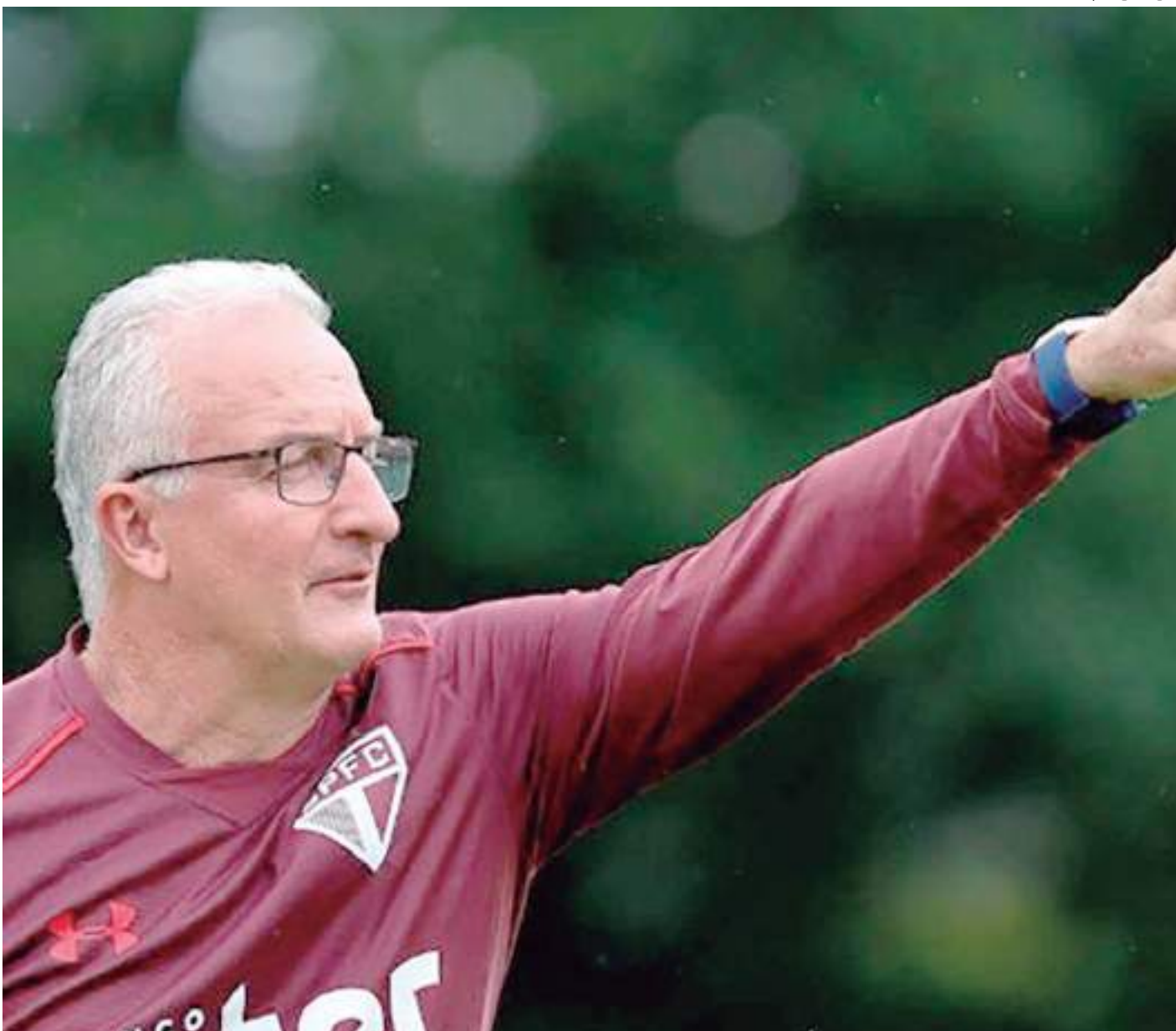
Dorival Júnior comanda treinamento no CT do São Paulo durante sua última passagem pelo clube