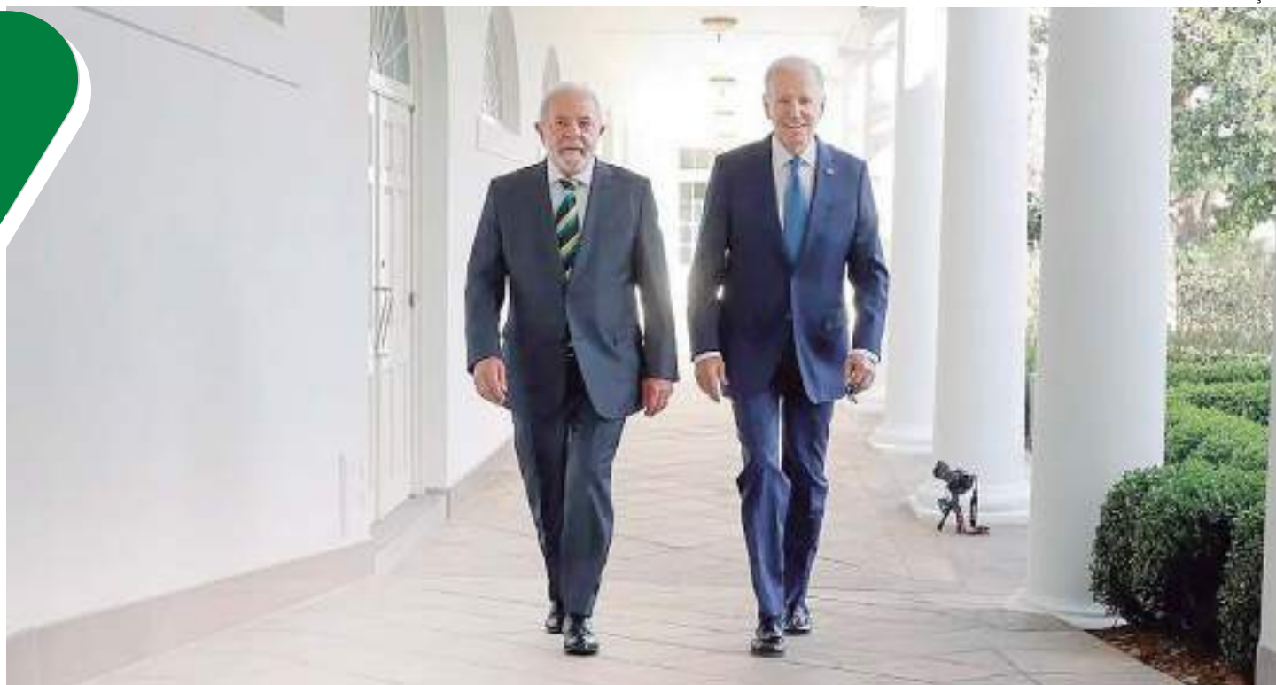
Biden garantiu ao presidente Lula US$ 500 milhões para Fundo Amazônia nos próximos 5 anos

Aporte está sendo feito diante do renovado compromisso do Brasil de acabar com o desmatamento.