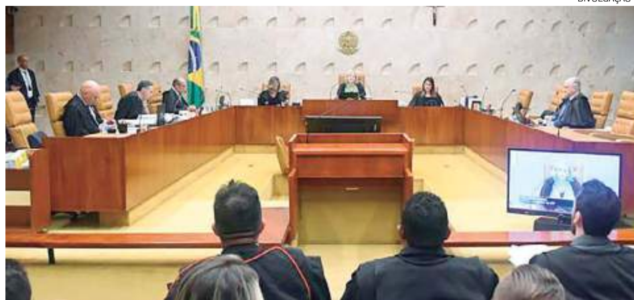
Dias Toffoli, Edson Fachin, Cármen Lúcia, Gilmar Mendes e Luís Roberto Barroso acompanharam o voto do relator, Alexandre de Moraes

Os ministros Gilmar Mendes, decano do Supremo Tribunal Federal (STF), e Luís Roberto Barroso votaram nesta quinta-feira (20) para tornar réus os denunciados por participarem dos ataques aos prédios dos Três Poderes da República em 8 de janeiro. Na última terça-feira (18), começou o julgamento, em plenário virtual, de 100 das 1.390 pessoas denunciadas pela Procuradoria-Geral da República (PGR).