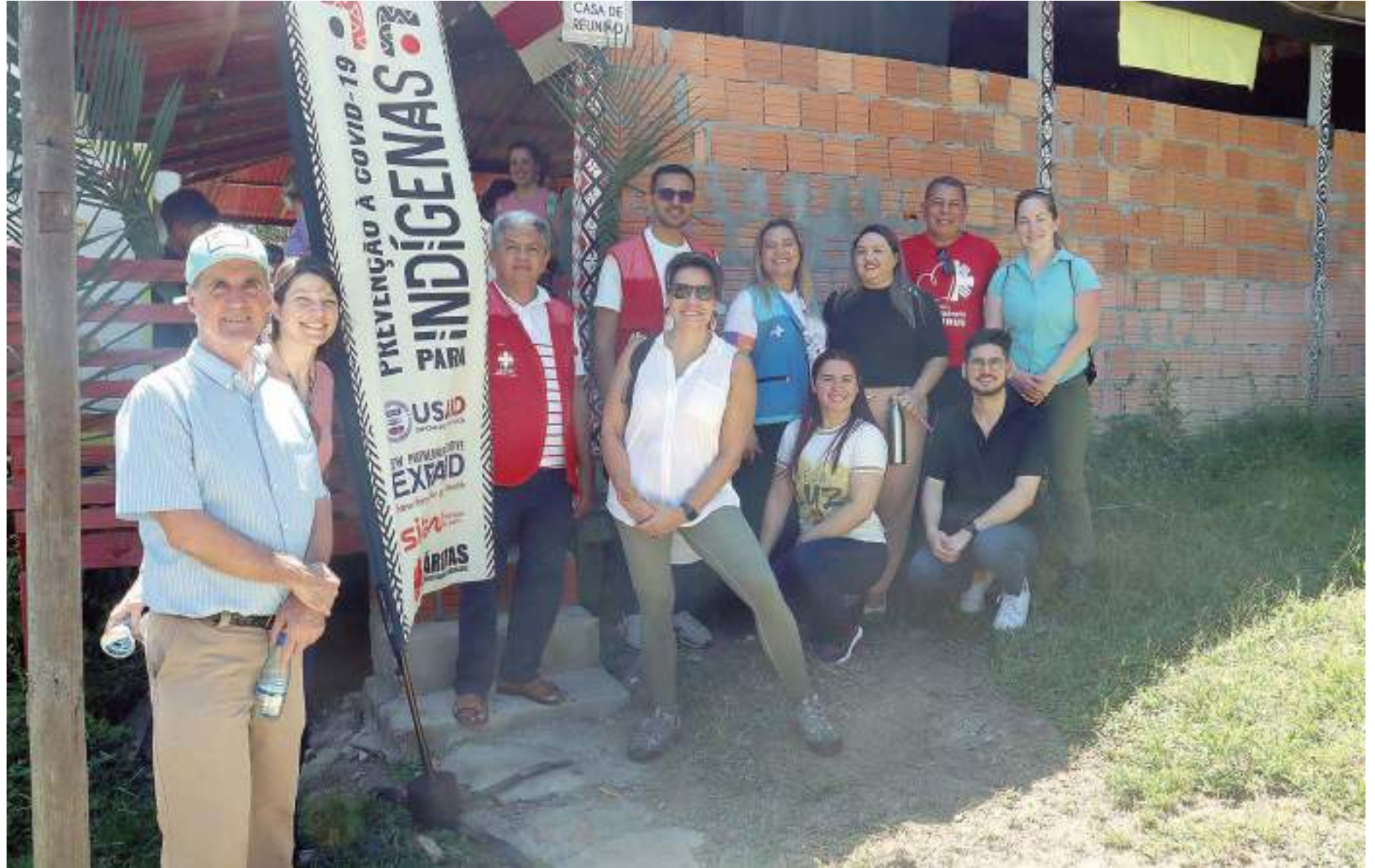
Serviços de saúde ofertados na Associação dos Índios Kokama Residentes em Manaus

A iniciativa cumpre um papel importante de ampliar o acesso dos povos originários aos serviços de atenção bá-