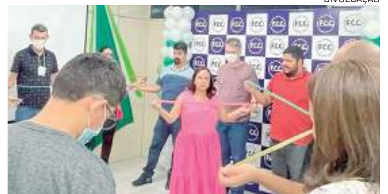
Curso "Liderança de Alto Impacto" ocorre nos dias 25 e 26 no Comfort Hotel