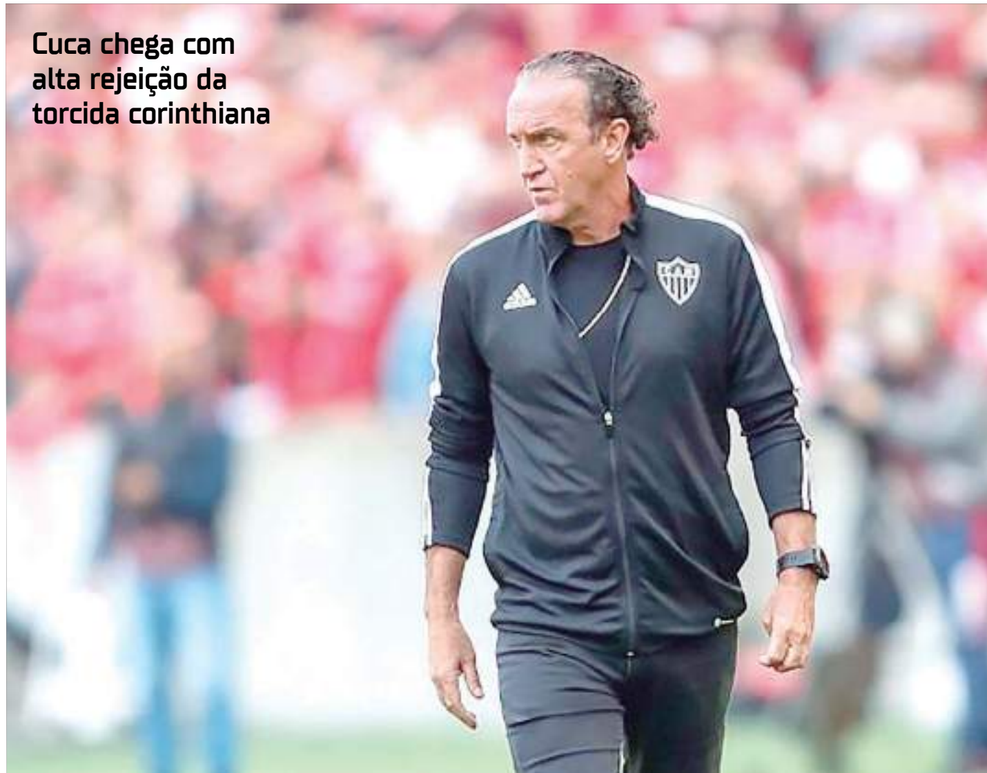
Técnico Cuca durante jogo do Atlético MG, onde trabalhou pela última vez em 2022. Treinador assina contrato com o Corinthians até dezembro de 2023

Cuca chega com alta rejeição da torcida corinthiana