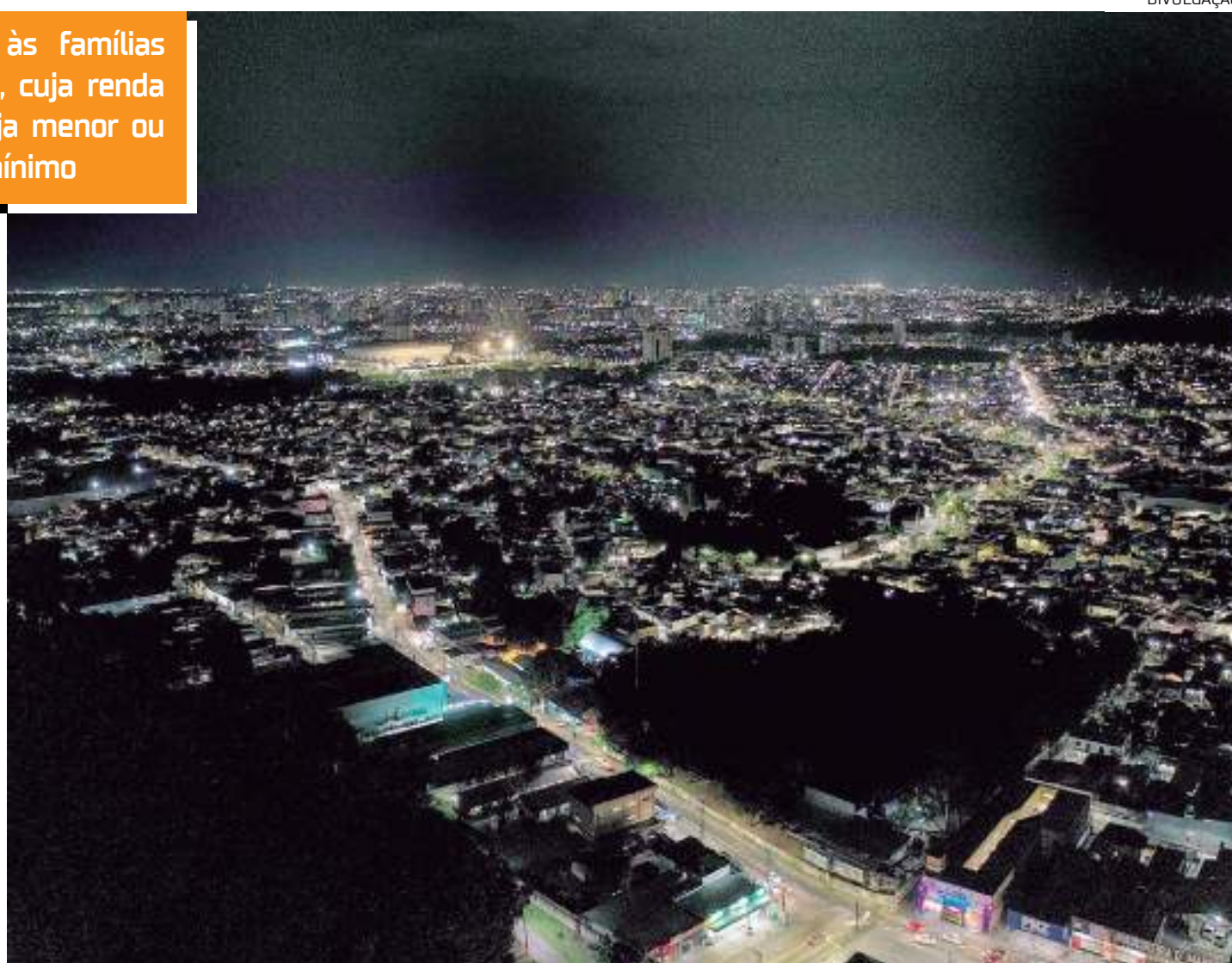
Programa Tarifa Social, do governo federal, contempla mais de 225 mil famílias da capital amazonense

Para o consumo de até 30 kWh, o desconto na tarifa é de 65%; de 31 a 100 kWh/mês, o valor fica 40% menor. Nos casos de consumo entre 101 kWh a 220 kWh, a redução é de 10%. E se a família ultrapassar o limite de 220 kWh, mesmo assim, ainda há desconto de 9%.