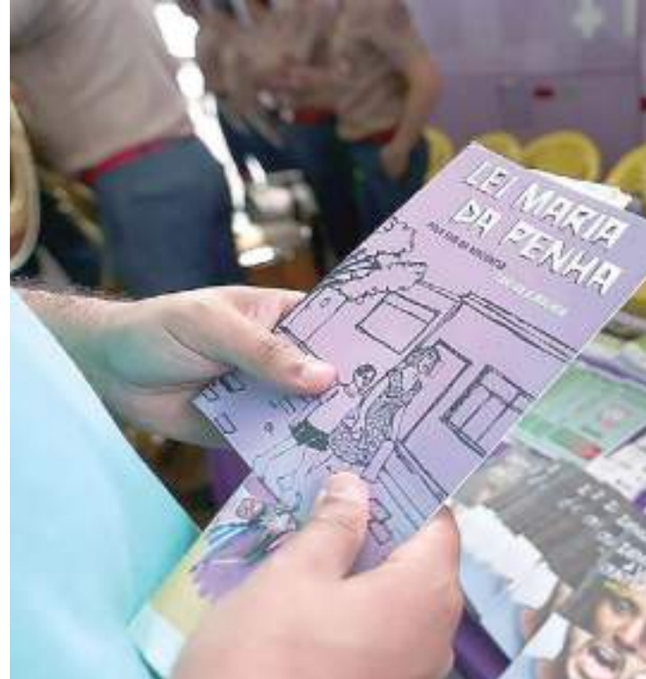
Lei Maria da Penha sofreu alteração para proteger vítimas de violência doméstica

Sancionada em 7 de agosto de 2006, a Lei recebeu o nome de Maria da Penha em homenagem à farmacêutica Maria da Penha Maia Fernandes, cujo marido tentou matá-la duas vezes e que, desde então, passou a se dedicar à causa do combate à violência contra as mulheres.