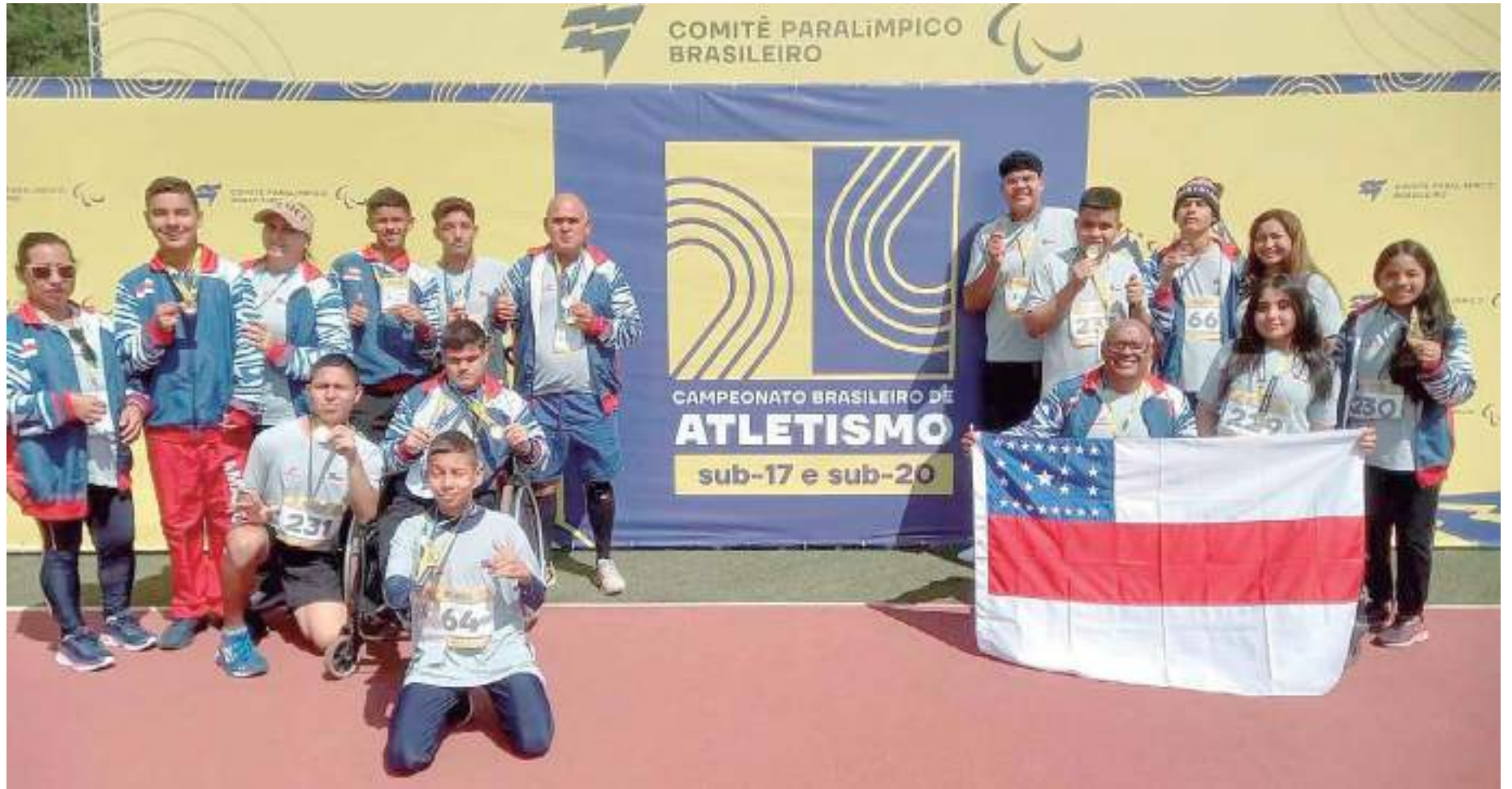
Paratletas amazonenses representam o Estado em campeonato nacional de atletismo em São Paulo

“Esse investimento e incentivo da Secretaria de Educação é muito impor-