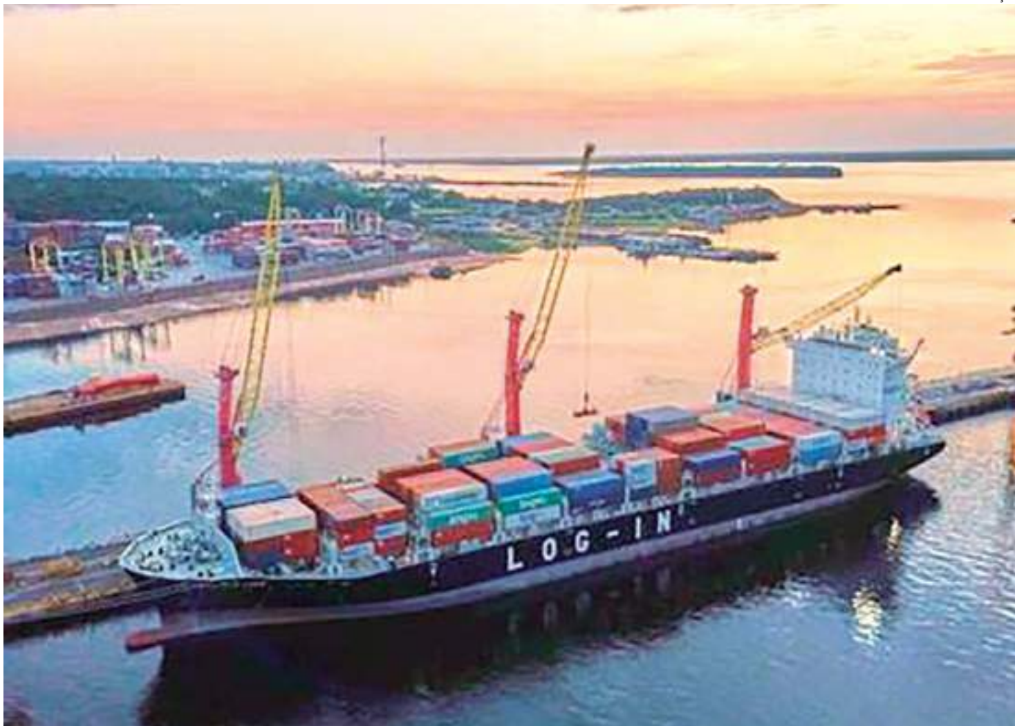
Empresa oferece serviço com transporte direto da cidade de Manaus ao Porto de Santos

“São vários os benefícios da Cabotagem, entre eles a regularidade, a redução de custos logísticos, o menor índice de avarias e maior segurança contra roubos e furtos. Outro fator de destaque é o benefício trazido para o meio ambiente pela adoção do modelo marítimo, um dos modais mais sustentáveis atualmente, tendo em vista a utilização, de modo natural, das vias navegáveis do país e a redução da emissão de CO 2 na atmosfera”, comenta.