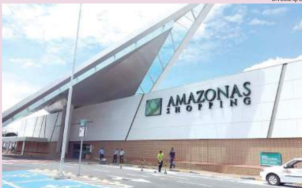
Amazonas Shopping, localizado na avenida Djalma Batista, onde ocorrerá a programação

O Amazonas Shopping e a Livraria Leitura promovem, a partir desta sexta-feira (21), o evento Semana de Arte e Literatura. A programação, alusiva ao Dia Mundial do Livro (23 de Abril), é gratuita e terá lançamento de publicação e oficinas de pintura e desenho.