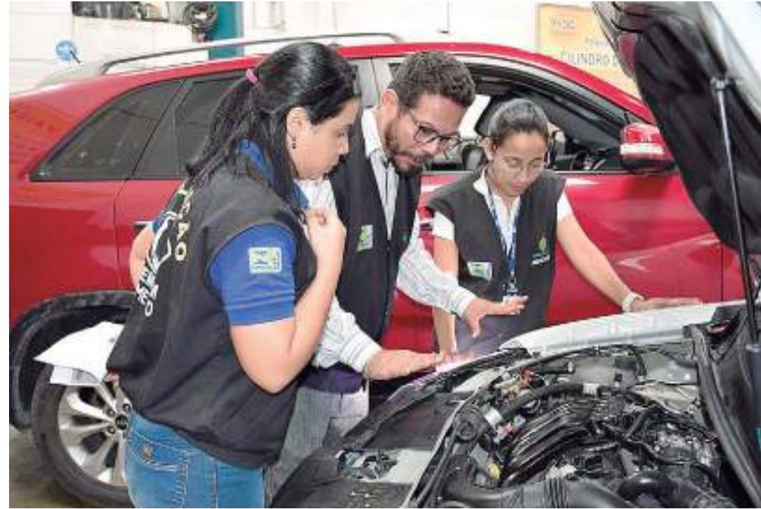
Fiscalização do IpeM em componentes de segurança na comercialização dos itens do sistema de GNV