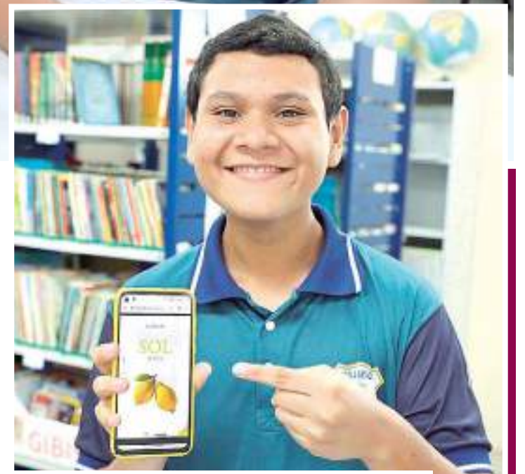
Estudante mostra o e-book "Sol de Feira", de Luiz Bacellar

Utilizando a sala da gestora da escola como estúdio, o podcast foi editado, produzido e roteirizado pelos próprios alunos. A produção pode ser encontrada nas plataformas digitais Spotify ( https://bit.ly/umpasseionafeira ), Apple Music, Amazon Music, Castbox e no Radio Public ( https://bit.ly/umpasseionafeiraradio ).