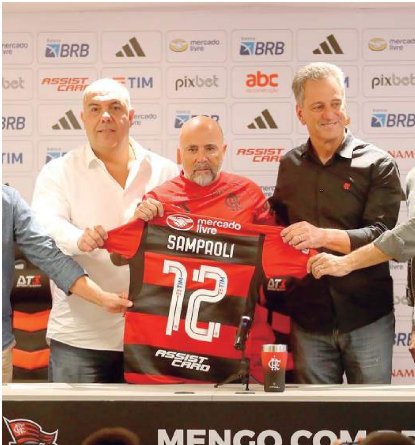
Jorge Sampaoli durante apresentação no Flamengo, ao lado de dirigentes do clube carioca

Além da entrevista de apresentação, Sampaoli e sua comissão técnica comandam a primeira atividade com o grupo nesta tarde. Quem foi titular diante do Coxa fará um trabalho regenerativo, mas o foco já