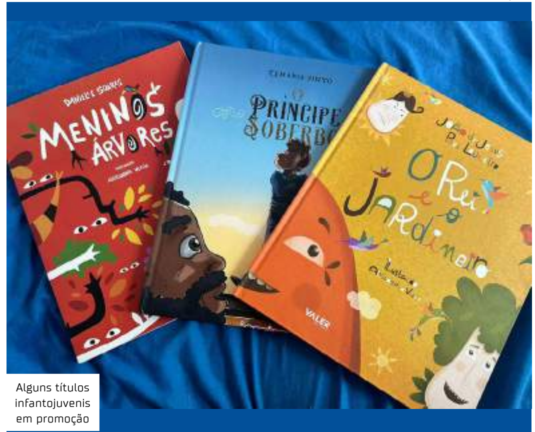
Alguns títulos infantojuvenis em promoção

O Rei e o jardineiro: Os jardins, os perfumes e as cores são importantes para nos alegrar. O rei mau tentou acabar com as flores do País do Sol. Encarcerou o jardineiro. Os pássaros morreram, e, da terra onde eles caíram, nasceram rosas. Para nós fica a mensagem: não se pode impedir que uma lei que nos ultrapassa seja cumprida, e nem que a alegria seja apagada.