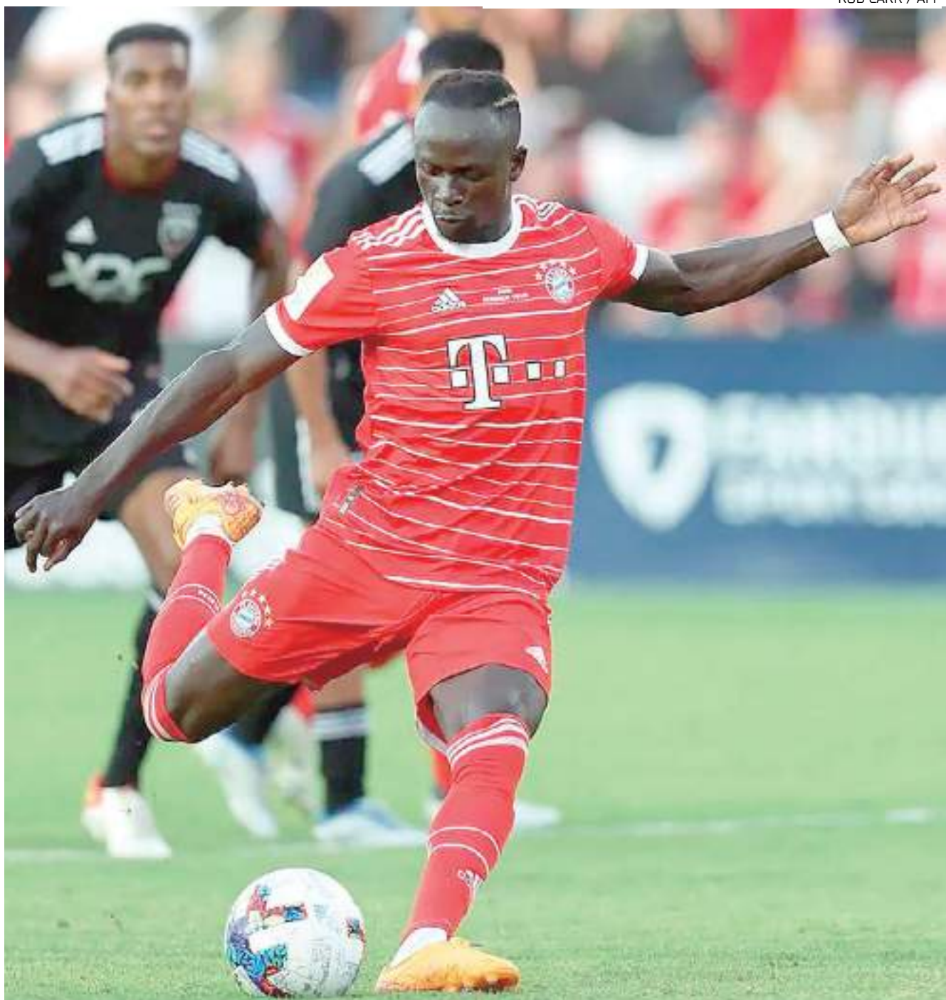
Sadio Mané cobra pênalti pelo Bayern de Munique. Atacante senegalês se envolveu em briga com companheiro de equipe recentemente