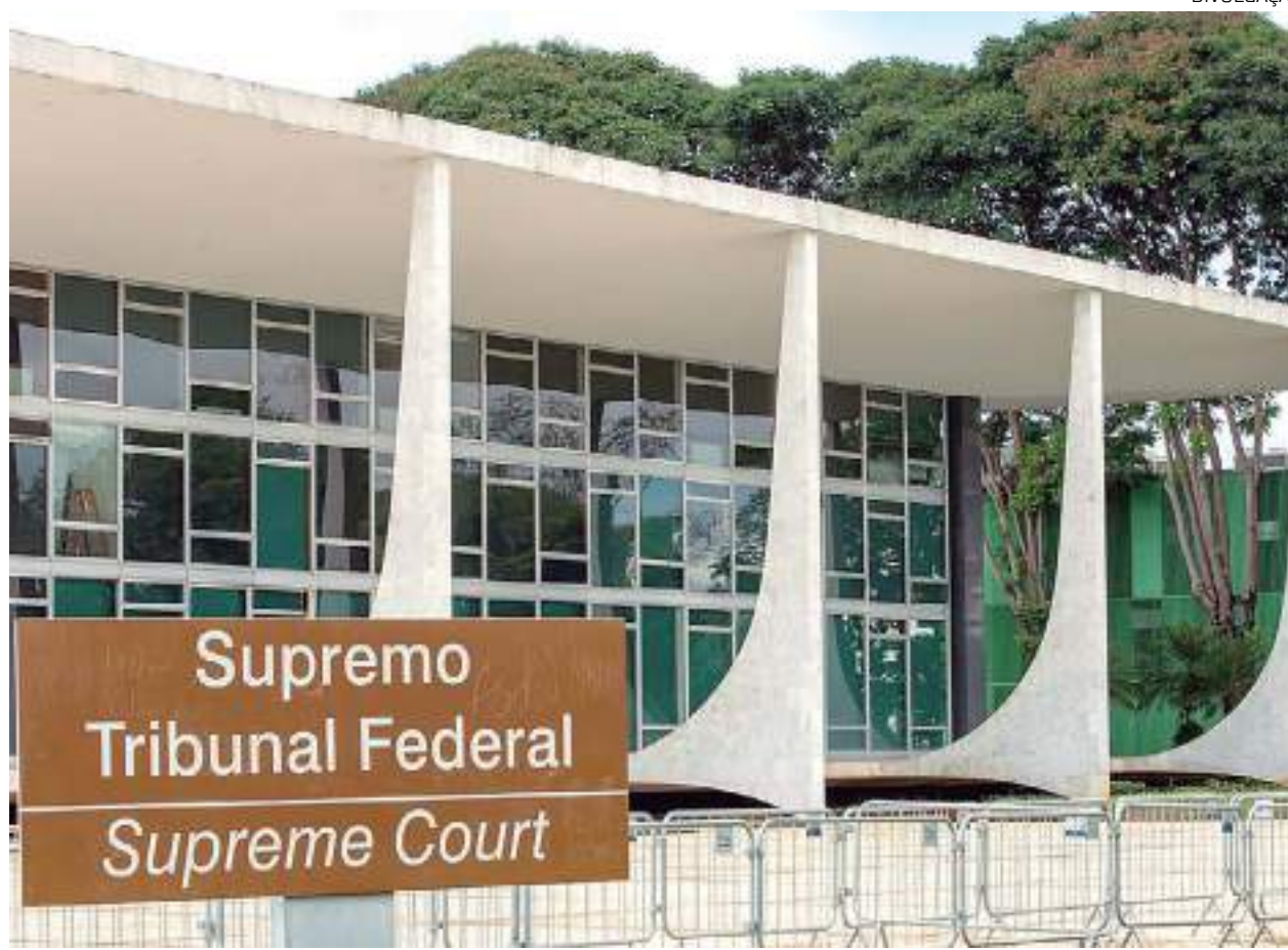
Ao todo, a Procuradoria Geral da República ofereceu 1.390 denúncias ao Supremo Tribunal Federal

À 0h de hoje (18), foram liberados relatórios relativos a cada um dos acusados e o voto do ministro Alexandre de Moraes sobre a abertura ou não de ação penal contra os