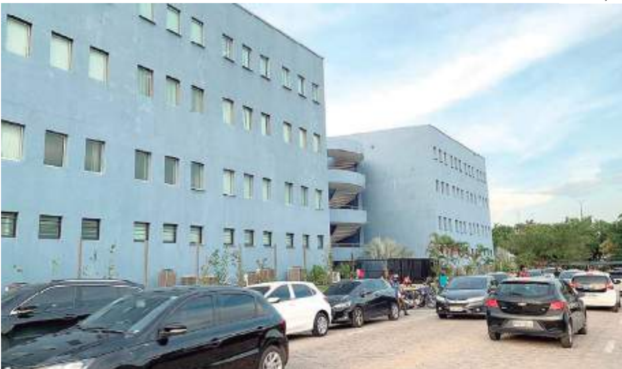
Universidade Nilton Lins, onde acontecerá a exposição "Direitos Dela! Dinheiro, Poder, Autonomia".

A biblioteca Anderson Dutra, da Universidade Nilton Lins, sediará, a partir desta quarta-feira (19), a exposição especial intitulada "Her Rights! Money, Power, Autonomy" (Direitos Dela! Dinheiro, Poder, Autonomia), realizada pelo consulado da Suécia em Manaus, com apoio da embaixada da Suécia no Brasil, até o dia 28 de abril, com entrada gratuita.