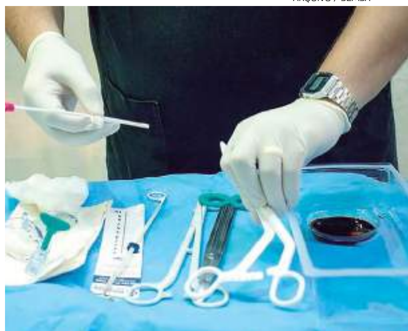
DIU de cobre possui mais de 99% de eficácia comprovada como contraceptivo

A Prefeitura de Manaus segue ampliando a oferta de inserção do Dispositivo Intrauterino (DIU), considerado um dos métodos contraceptivos mais seguros e eficazes, para aumentar o número de mulheres beneficiadas. A Secretaria Municipal de Saúde (Sems) incluiu a Unidade de Saúde da Família (USF) Frei Valério, localizada na rua Rufino Elizaldo s/nº, no bairro Novo Israel, Zona Norte, na lista de unidades que ofertam o serviço e que agora chegam ao total de 12.