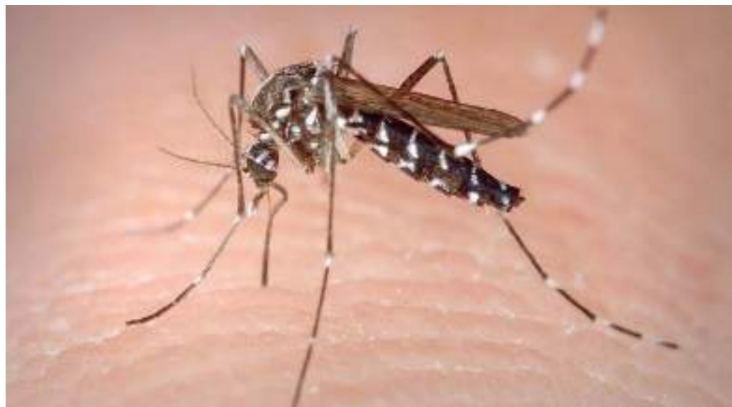
Surto do mosquito da dengue tem deixado em alerta população argentina

Técnicas semelhantes para esterilizar pragas usando a mesma radiação encontrada em raios-X têm sido utilizadas há décadas, ajudando os esforços globais para controlar doenças como chikungunya, dengue e Zika.