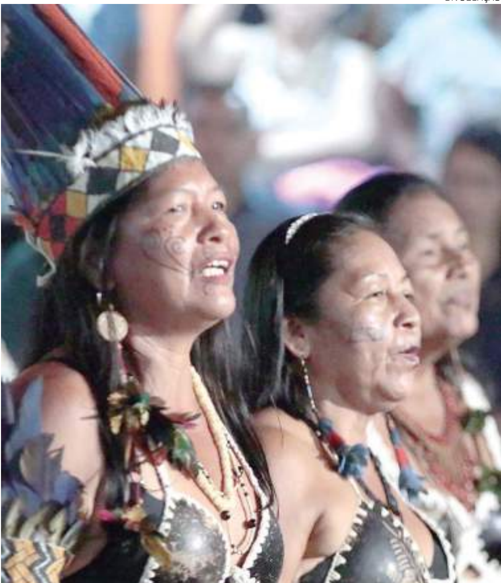
Evento reunirá 66 etnias, 12 federações e 93 associações indígenas do Amazonas