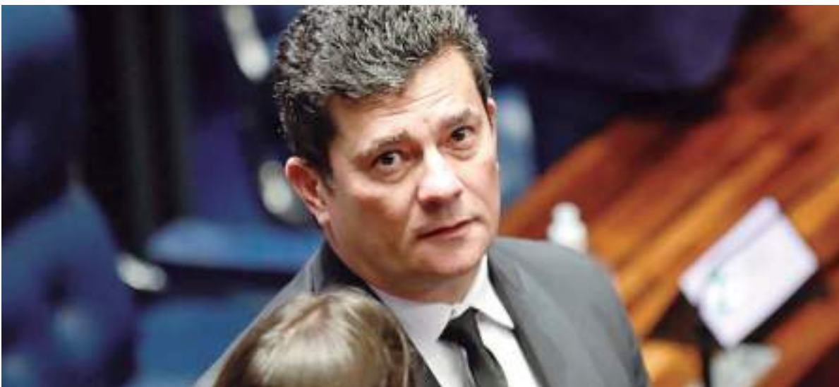
Ex-juíz e senador apareceu em vídeo declarando que seria possível 'comprar habeas corpus' de Gilmar Mendes

A Procuradoria-Geral da República (PGR) apresentou denúncia contra o senador Sergio Moro (União Brasil-PR) ao Supremo Tribunal Federal (STF) por calúnia que ele teria cometido contra o ministro Gilmar Mendes, que integra a Corte.