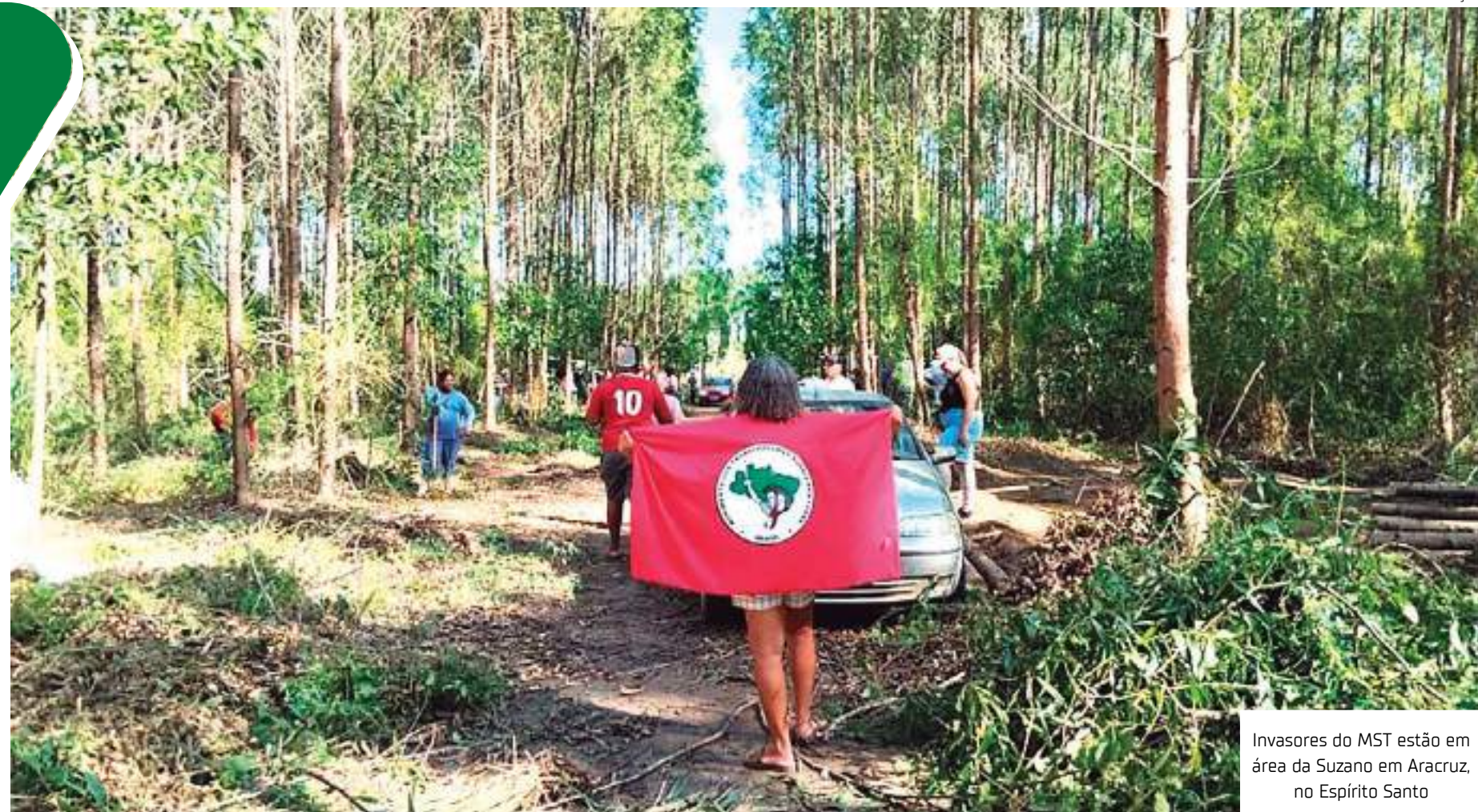
Invasores do MST estão em área da Suzano em Aracruz, no Espírito Santo

Segundo a CNN apurou, a Federação das Indústrias do Espírito Santo (Findes) e