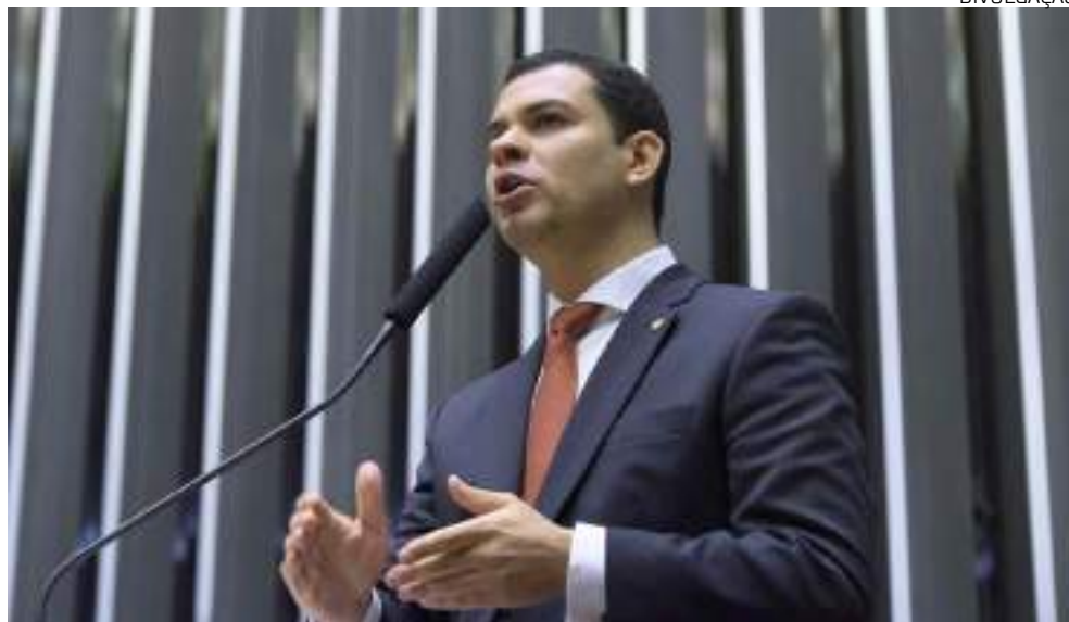
O deputado federal explicou as questões em tribuna

“Diante desse contexto, considerando a gravidade da doença e as dificuldades a que são submetidos os portadores de Lúpus, apresentei o projeto com o objetivo de proporcionar mais direitos e