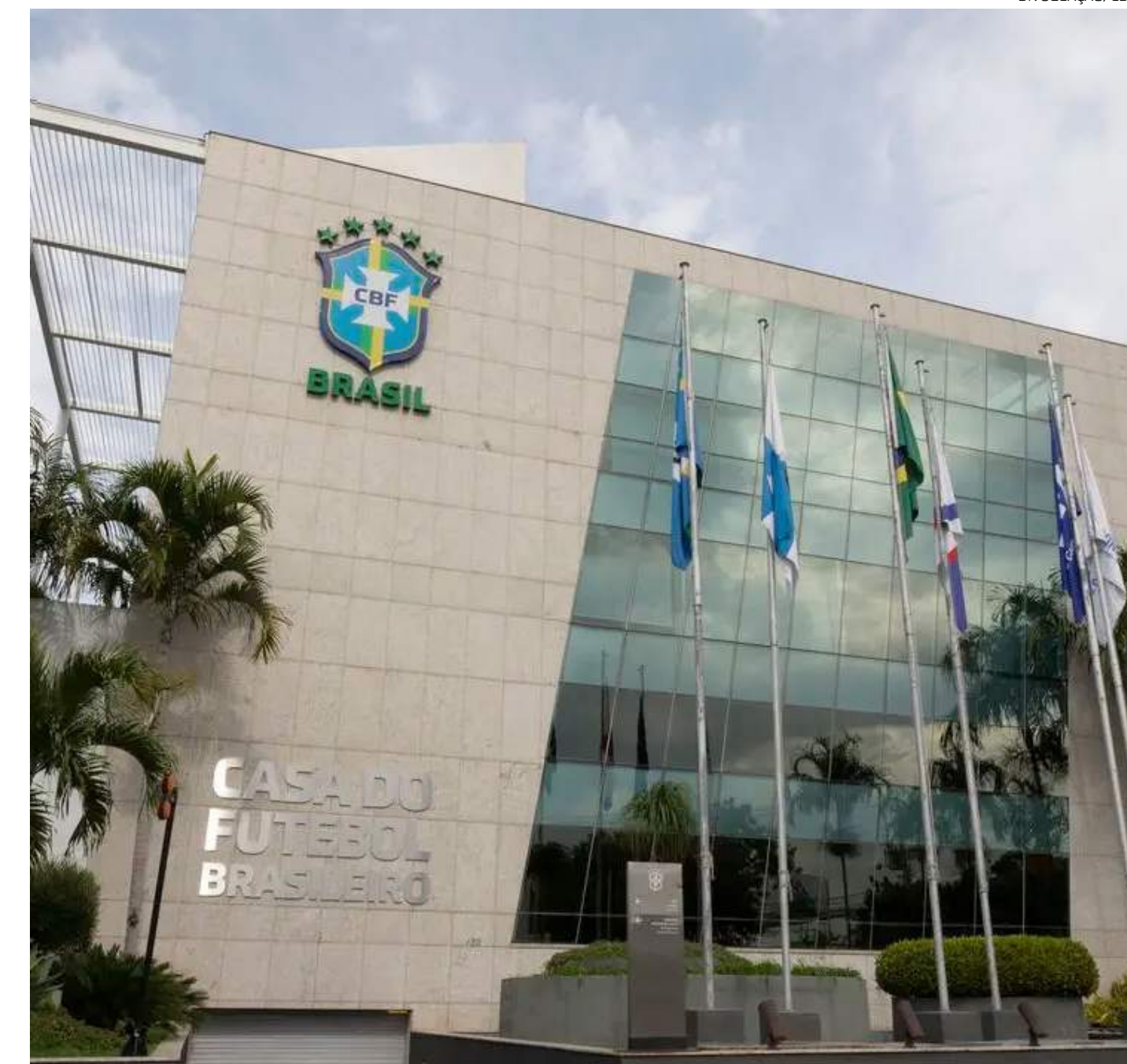
Confederação Brasileira de Futebol está negociando com a Fifa para ser sede da Copa do Mundo de Futebol Feminino

A Fifa revelou que esse é o processo de licitação mais robusto e abrangente da história da Copa do Mundo Feminina. O Congresso da entidade ocorre dia 17 de maio. Após enviar convite a todas as associações-membro (MAS) por manifestação de interesse em ser sede da competição, foram recebidas manifestação em conjunto de Bélgica, Holanda e Alemanha