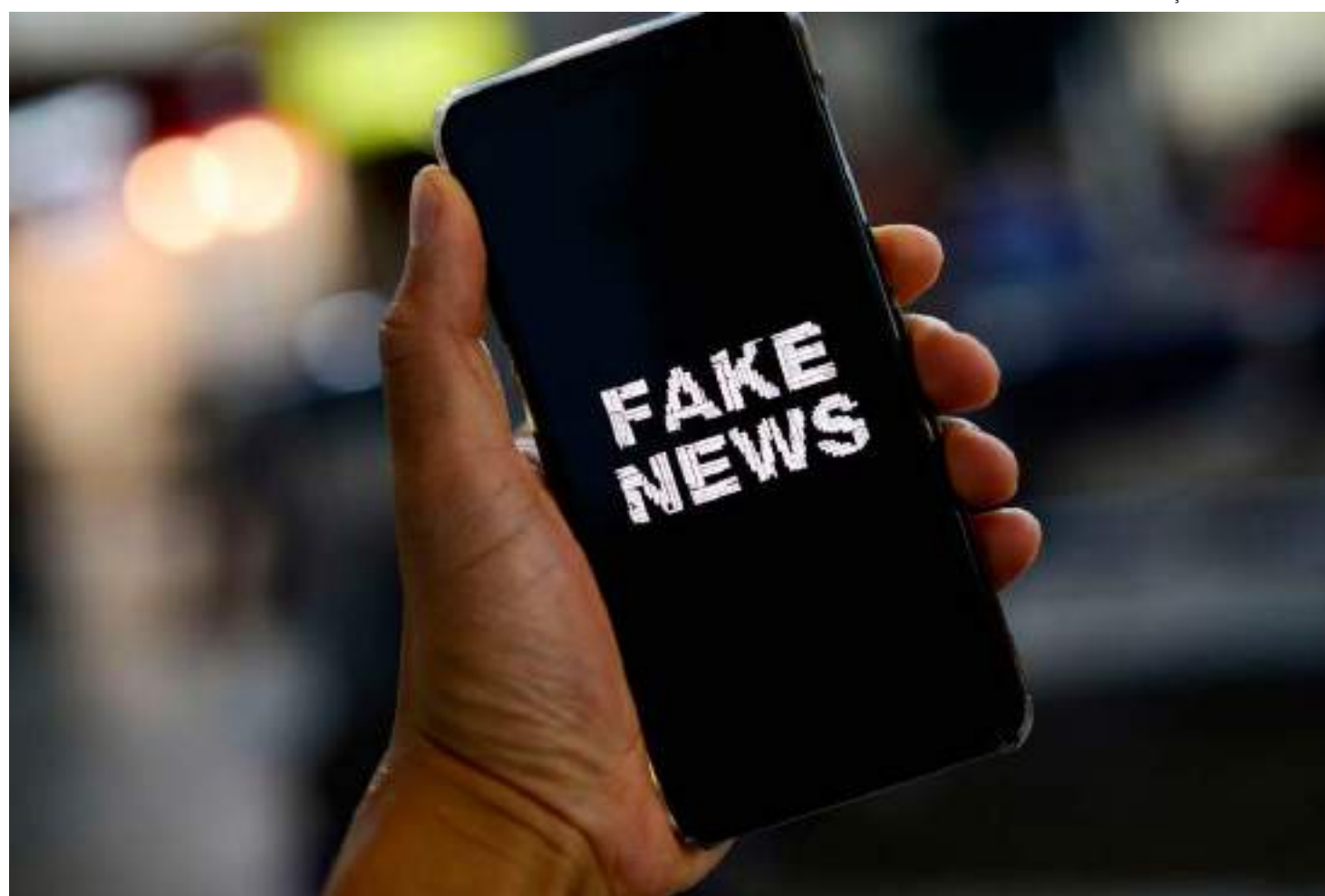
Projeto de Lei da Câmara Federal pretende acabar com fake news na internet

“Quando se fala em regulação de plataformas, agora, é para criar uma lista maior de temas que o provedor deve, com o chamado dever de cuidado, fazer intervenções, moderando