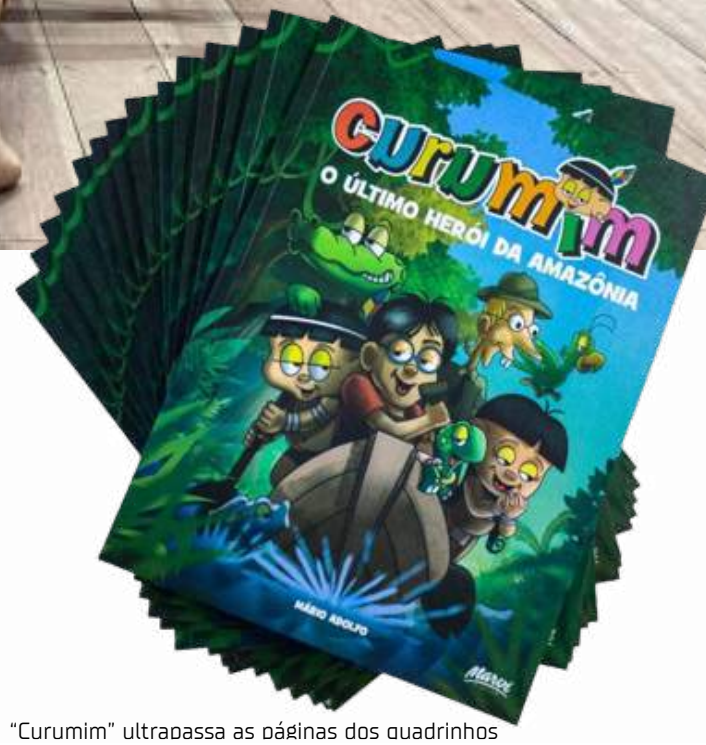
"Curumim" ultrapassa as páginas dos quadrinhos