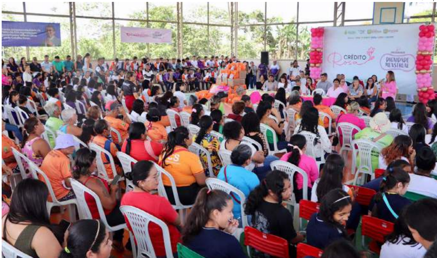
Estudantes, pais, responsáveis e funcionárias da rede pública participaram da entrega dos pacotes de absorvente em Rio Preto da Eva

“Estamos trazendo o programa Dignidade Menstrual, que leva absorvente para meninas em situação de vulnerabilidade, que não têm condições de aquisição. Que bom que hoje estamos quebrando esse tabu aqui em Rio Preto da Eva. Nós entregamos mais