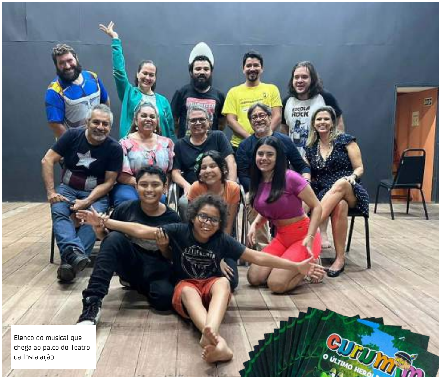
Elenco do musical que chega ao palco do Teatro da Instalação

O texto original da montagem foi escrito em abril de 1991, isto é, há 22 anos. Seria apresentado em 2020,