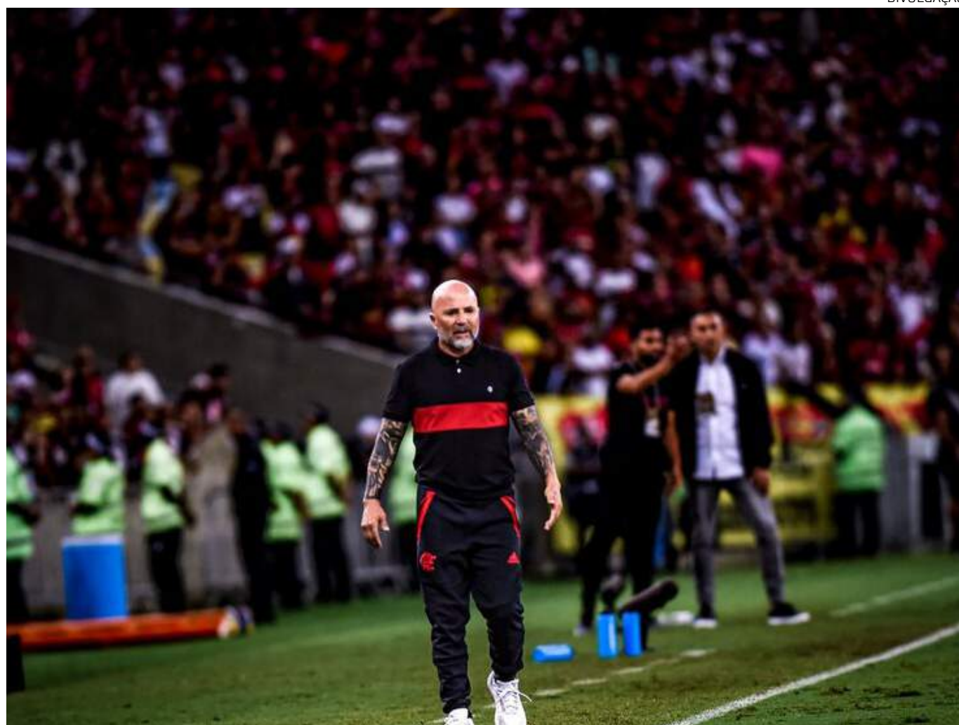
Sampaoli se irritou no jogo do Flamengo contra o Internacional, no estádio Beira-Rio

"Se o time tivesse convertido dentro das nove ou 10 chances no segundo tempo, estaríamos falando de outra coisa. Penso que hoje a contundência não está relacionada ao treinador, está relacionada aos jogadores. Futebol é dos jogadores. Eles que definem o jogo, que perdem e que ganham muitas vezes", avaliou o técnico após o duelo no Beira-Rio, em Porto Alegre, no domingo.