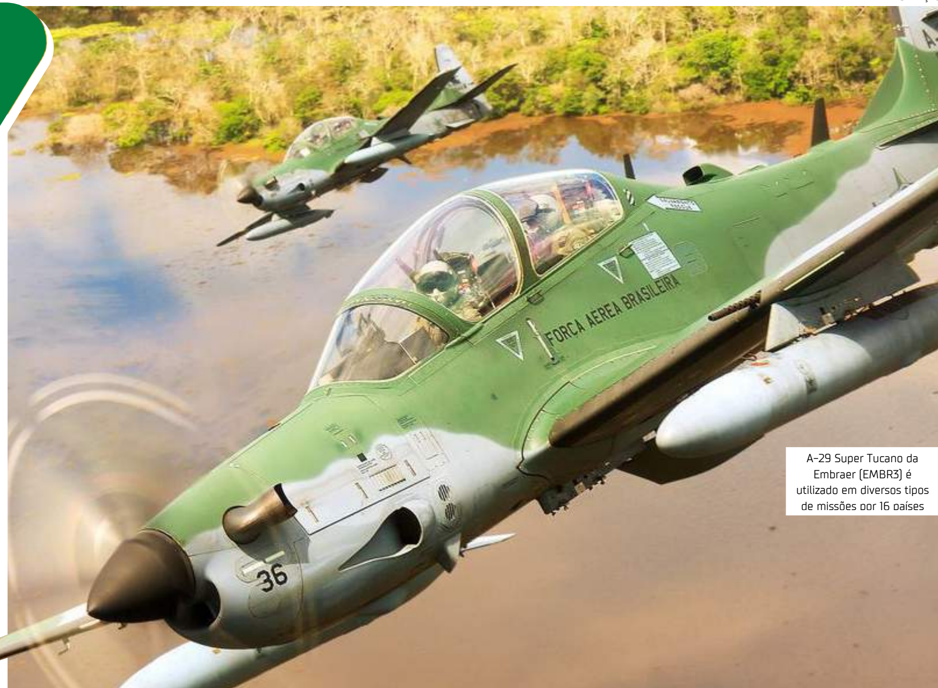
A-29 Super Tucano da Embraer (EMBR3) é utilizado em diversos tipos de missões por 16 países

Entre os diferentes desdobramentos do acordo, a Embraer destacou o potencial relacionamento estratégico nas áreas de desenvolvimento e integração de sistemas envolvendo o A-29 Super Tucano, em sua recém-lançada versão A-29N. O desenvolvimento desta aeronave está voltado para o atendimento das necessidades dos países membros da Organização Tratado do Atlântico Norte (Otan), a aliança militar de