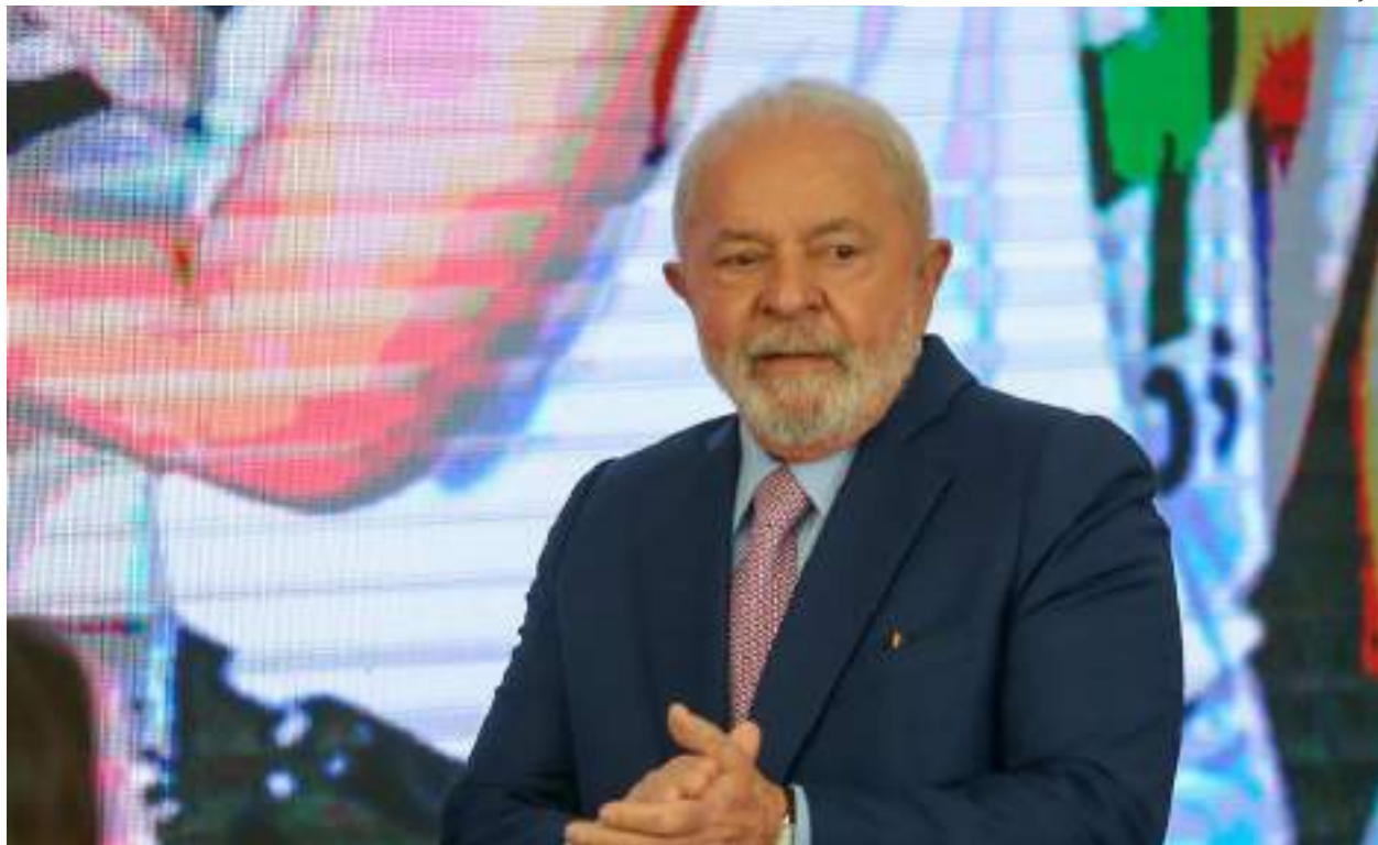
Em Fórum Empresarial, Lula criticou a privatização de empresas nos últimos governos

Segundo ele, além das 14 mil obras que estão paralisadas e que devem ser retomadas no país, o governo está apostando na indústria de hidrogênio verde no Nordeste do país e na perspectiva de estabelecer parcerias com o mundo todo na construção de usinas eólicas, de biomassa e energia solar.