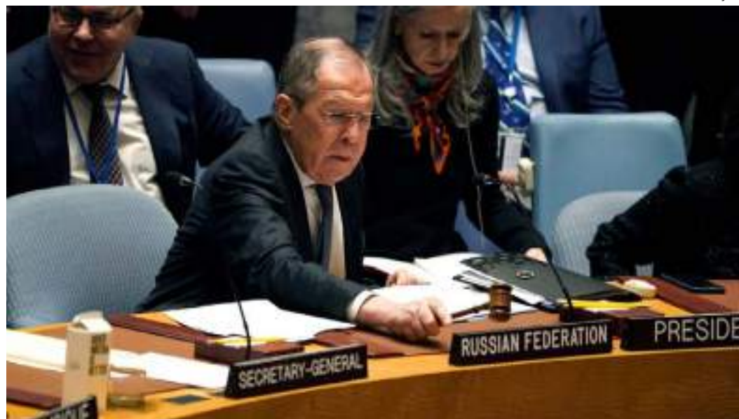
Pronunciamento de Lavrov na ONU foi alvo de forte controvérsia e atraiu críticas

"Como durante a Guerra Fria, atingimos o limite perigoso, possivelmente ainda mais perigoso", disse Lavrov ao conselho.