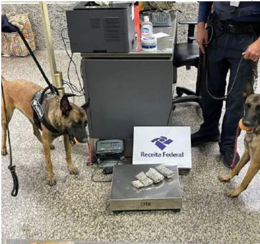
Droga que mais mata nos EUA é apreendida pela primeira vez pela Receita em Manaus

Considerada uma superdroga pelo Departamento de Narcóticos da polícia dos Estados Unidos, o fentanil foi apreendido pela primeira vez pela Receita Federal em Manaus. A substância é 50 vezes mais potente do que a heroína e cerca de cem vezes mais potente que a morfina, é a que mais mata norte-americanos.