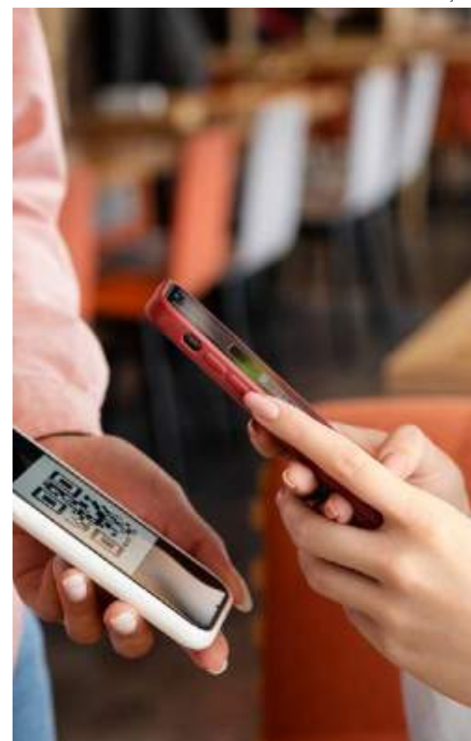
Popularização de carteiras digitais merece cuidados

Baixe o aplicativo da Serasa no Google Play ou App Store. Se preferir, acesse a sua área logada no site. Faça login com seu CPF e senha. Se ainda não tiver um cadastro, pode criar o seu na hora, em poucos minutos e sem pagar nada. Na página inicial, basta clicar em "Pagar" para ter acesso aos serviços da Carteira Digital Serasa.