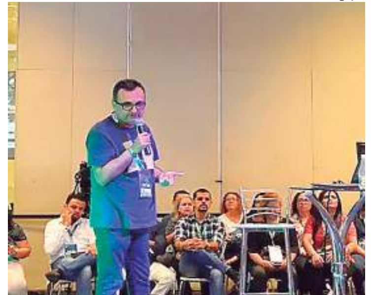
Palestra para qualificação de empreendedores pelo Sebrae

Finalizando a programação, na sexta, dia 26, o tema é “Como Vender Mais