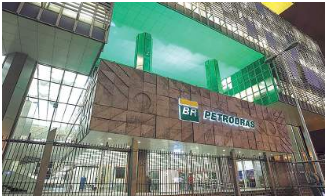
Petrobras anuncia mudanças nos valores de gasolina, diesel e gás de cozinha ficam mais baratos

Os reajustes continuarão sendo feitos sem pe-