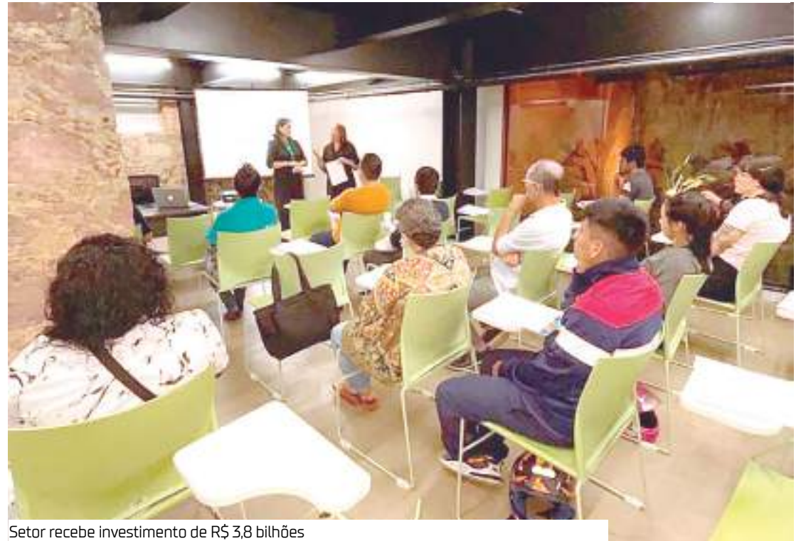
Setor recebe investimento de R$ 3,8 bilhões

“Essa semana tivemos a regulamentação da Lei Paulo Gustavo pelo presidente Lula, em Brasília, que assegura um investimento de R$ 3,8 bilhões para o setor. E, Manaus, a partir de segunda-feira, começa os trabalhos de implementação da lei que vai garantir fomento para projetos de música, dança, pintura, escultura,