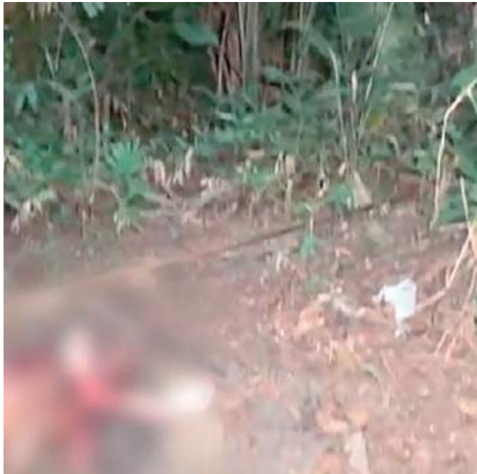
Crime bárbaro chocou moradores da rua Rio Amatari

O bárbaro crime será investigado Delegacia Especializada em Homicídios e Sequestros (DEHS), que já trabalha com a hipótese de o crime ser um acerto de contas.