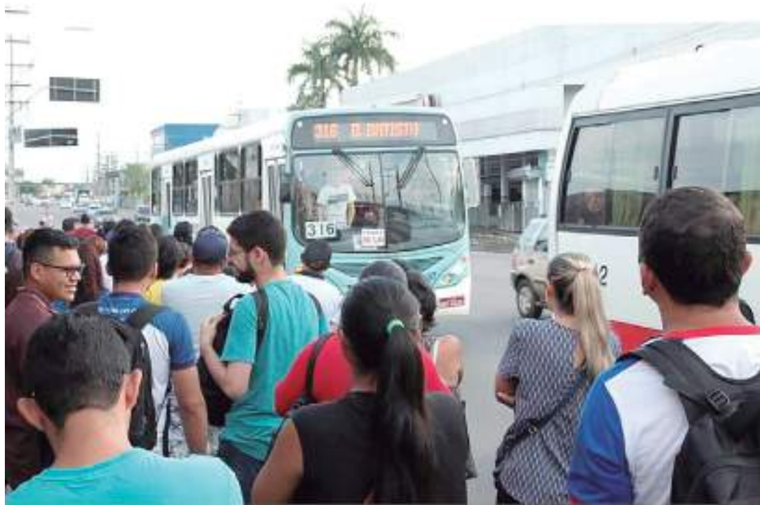
Uma nova reunião foi agendada com os representantes dos sindicatos na próxima quinta-feira (18)

da me ligou, e pediu para que nesse momento, nossa direção do sindicato suspendessem o movimento grevista que aconteceria amanhã. Diante do grande prestígio que o prefeito tem conosco e com nossa categoria, decidimos aten-