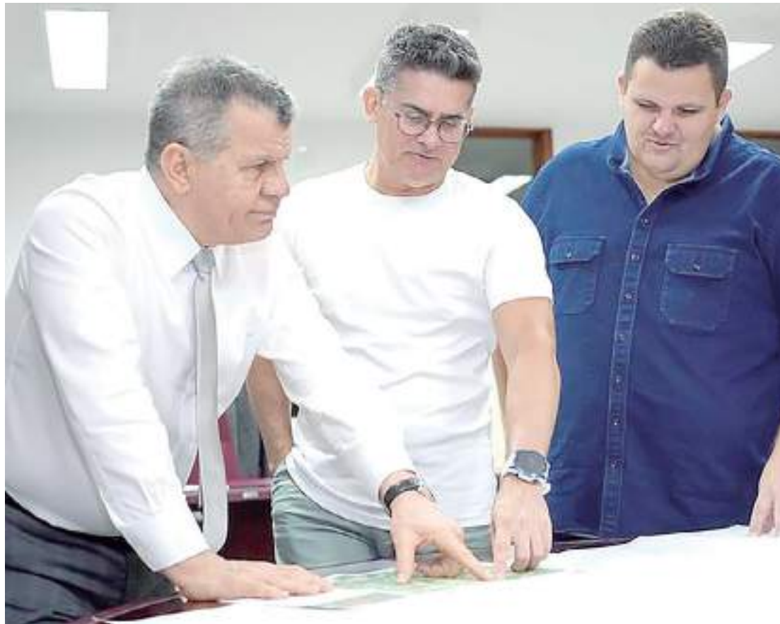
Outro tema discutido no encontro foi a construção do museu do Distrito Industrial

A expectativa é que a conversa realizada na sede da instituição, no Distrito Industrial, zona Sul da capital amazonense, avance e que a regularização fundiária ocorra já no segundo semestre deste ano. “Discutimos demandas que temos em comum para que possamos melhorar a cidade de Manaus na questão da regularização fundiária e asfaltamento de áreas que pertencem à Suframa. São áreas que