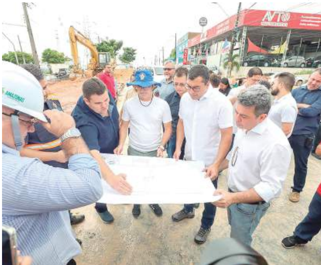
Obra no complexo viário na avenida Governador José Lindoso

A intervenção viária contempla a implantação de uma passagem de nível da rua Barão do Rio Branco sobre a avenida Governador José Lindoso, com duas alças de acesso; também prevê a adequação de dois retornos