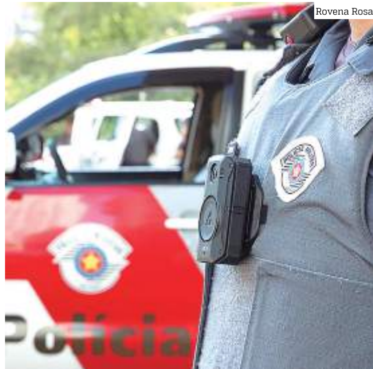
Câmera individual instalada na farda de policial na PM de SP

Em geral, o perfil das mortes em decorrência de intervenção policial em São Paulo não difere do retrato nacional das vítimas. Como apontado por edições anteriores do Anuário Brasi-