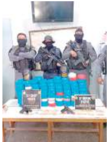
Operação Conjunta PC-AM e COE/PMAM em Tefé

Operação policial deflagrada pela Polícia Civil do Amazonas, na segunda-feira (15), resultou na prisão de 12 indivíduos por diversos crimes e apreendeu matérias que seriam utilizados para a comercialização de drogas, em Tefé (a 523 quilômetros de Manaus). A operação ocorreu na zona ribeirinha da comunidade do Bonfim, a 200 quilômetros do município.