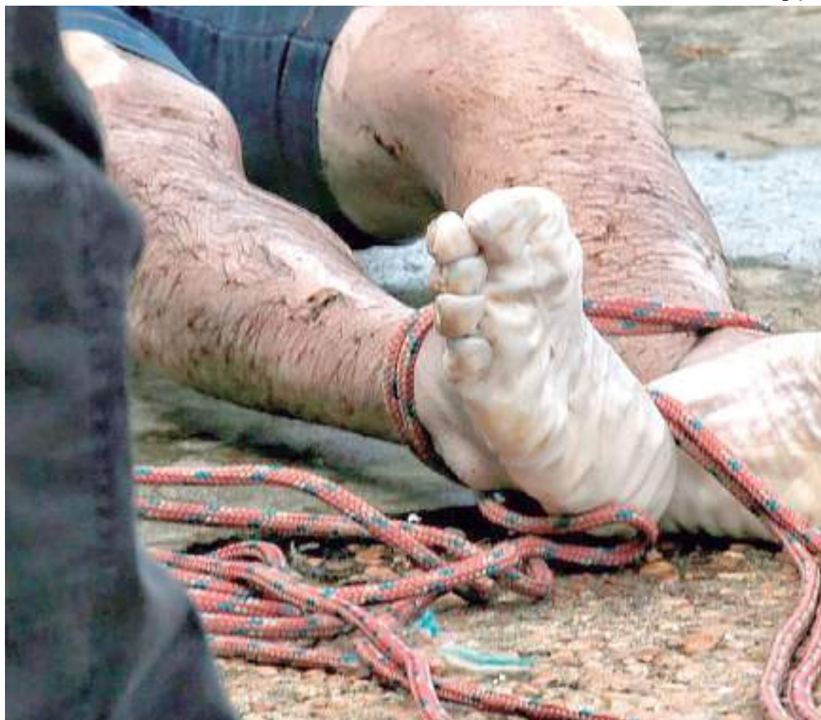
Corpo de um homem foi encontrado boiando no igarapé São Vicente

A Delegacia Especializada em Homicídios e Sequestros (DEHS) investiga o assassinato.