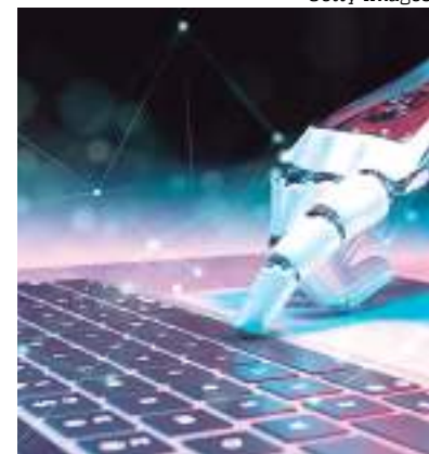
Usuários não devem confiar em dados de inteligência artificial

volve aspectos importantes de suas vidas, como aconselhamento médico ou jurídico. A OpenAI observa que trabalhou em "uma variedade de métodos" para evitar que "alucinações" sejam dadas em respostas aos usuários, incluindo avaliações de pessoas reais para evitar dados incorretos, preconceito racial ou de gênero, ou disseminação de informações falsas.