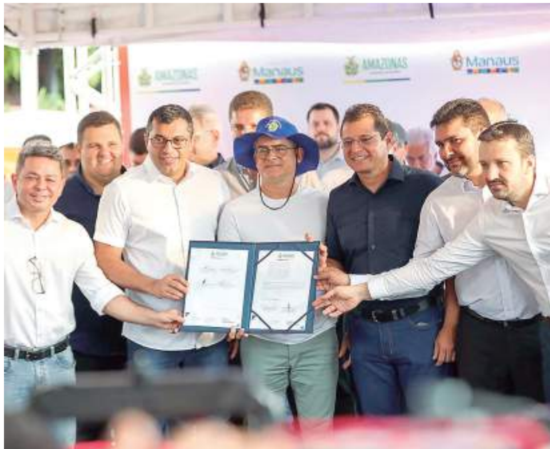
Investimentos da parceria governo e prefeitura vão atender mais de 1,3 mil domicílios. em abastecimento de água

“Eu quero agradecer, governador, em nome da população da cidade de Manaus, o seu olhar para a cidade, o seu olhar voltado para o bem-estar de quem mora na grande metrópole de Manaus, a capital da Amazônia. Nós estamos unidos para melhorar a