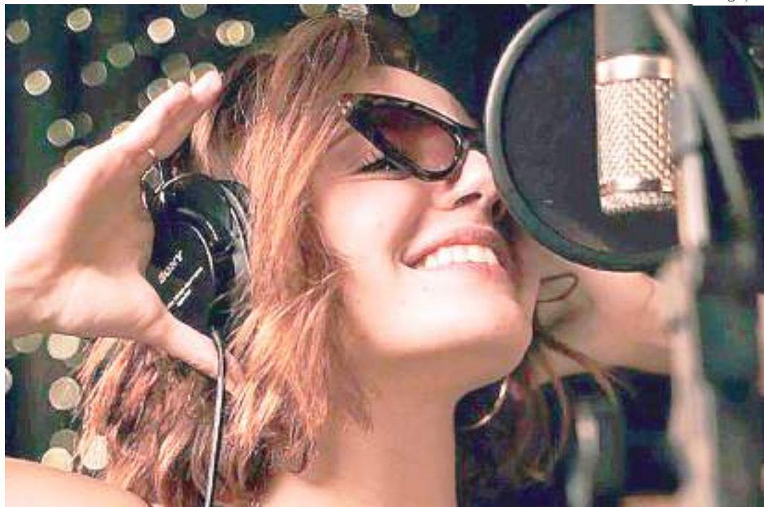
Produção original é assinada pelo Cartoon Network

A produção executiva é de Roberta Guzzon Godinho, que acumula experiências em grandes projetos nacionais e internacionais, como "Tudo pela Audiência", "Vai, Fernandinha", "Lady Night",