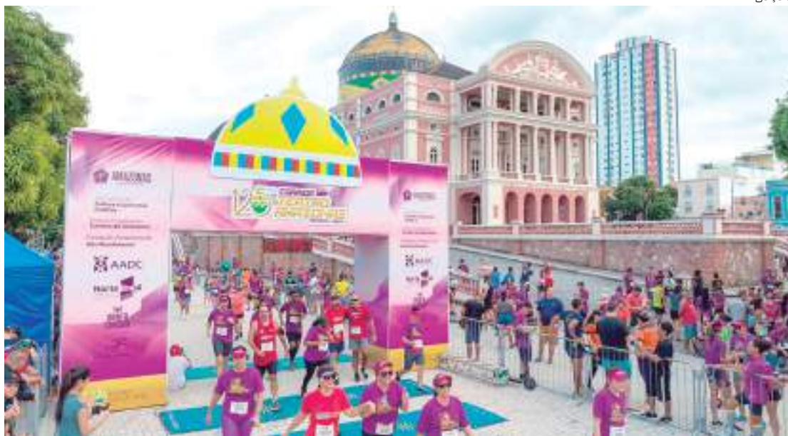
Corrida de 7 km traz um percurso pelas ruas históricas da área central

“É um evento esportivo que carrega um valor histórico singular, em um cenário totalmente nosso. Além do Teatro Amazonas, os atletas passam pelo Palacete Provincial, Parque Jefferson Perez, Palácio Rio Negro e o Palácio da Justiça. É um momento único, que proporciona às famílias que vão prestigiar o evento e aos atletas, uma atividade fora da rotina nas principais ruas do centro do Manaus”, destacou o secretário.