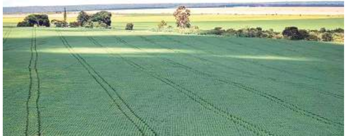
Soja é uma das principais monoculturas no Cerrado

O que está em debate, além da oposição ao uso de agrotóxicos, é o protesto contra transgênicos e outras biotec-