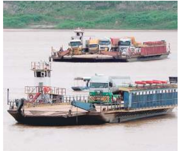
Embarcações de transporte questionam exigências de distribuidoras

O presidente da Fenavega alerta ainda, que caso não tenha um acordo entre as partes, a regularidade do