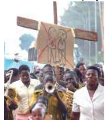
Há um sentimento antigay em parte da população de Uganda

diada por várias organizações da sociedade civil na Uganda, que planejam entrar com ações judiciais para derrubar a legislação, alegando que a mesma é discriminatória e viola os direitos das pessoas LGBT. O Tribunal Constitucional de Uganda anulou uma lei semelhante em 2014. O projeto de lei foi aprovado no Parlamento no início deste mês — e apenas um deputado se opôs a ele.