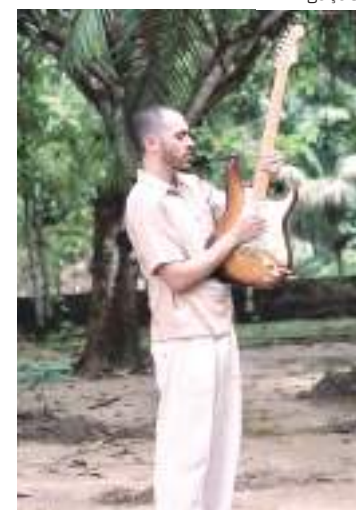
Show acontece dia 18/6 no Teatro Amazonas