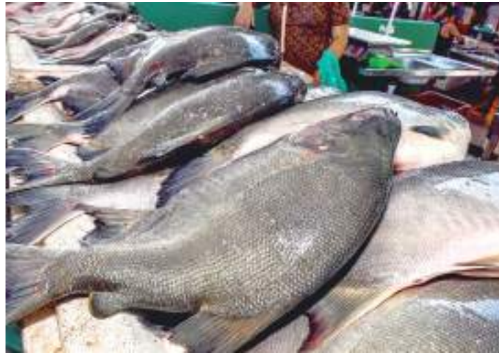
Um quinto dos pescados vendidos nas feiras e mercados apresentam altos níveis de substância tóxica

Entre os animais analisados, 110 eram peixes herbívoros, 130 detritívoros, 286 onívoros e 484 carnívoros. Os carnívoros, mais apre-