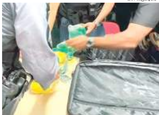
Apreensão de 45 tabletas de cocaína em malas

Dois homens e uma mulher foram presos com, pelo menos, 45 tabletas de cocaína dentro de duas malas na terça-feira (31), no Porto Público de Manaus.