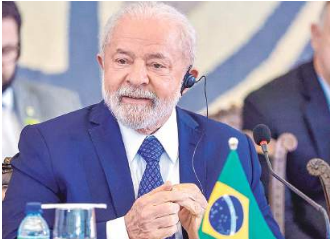
Presidente Lula tenta evitar derrota que marcaria vexame no Congresso Nacional

Diante da crise com o Congresso, Lula convocou de última hora para a manhã desta quarta-feira (31) uma reunião com o núcleo da articulação política do governo para discutir as derrotas na