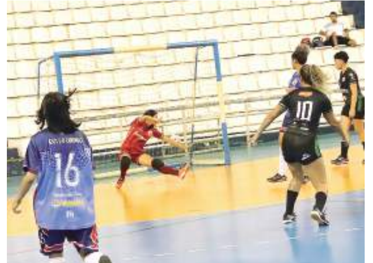
Meninas do Estrela dão show no Campeonato Amazonense de Futsal

Patrocinadores e apoiadores - Os campeonatos da Federação Amazonense de Futsal (FAFs) contam com o apoio do Governo do Amazonas (Secretaria do Desporto e Lazer), Prefeitura de Manaus (Fundação Manaus Esporte), Kagiva (bolas oficiais) e Emanuel Sports & Marketing (assessoria de imprensa). A FAFs é filiada à Confederação Brasileira de Futsal (CBFs).