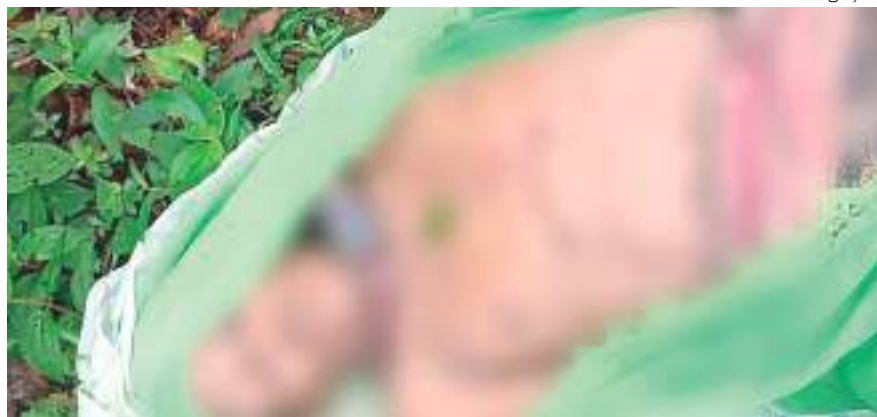
Corpo de homem achado com cinto amarrado no pescoço

Com um cinto amarrado no pescoço, um homem, ainda não foi identificado, foi achado morto na quarta-feira (31), no ramal do Flora, bairro Tarumã, Zona Oeste de Manaus.