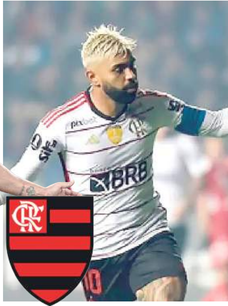
Gabigol vai comandar o Fla no clássico com o Flu

O técnico argentino deve entrar em campo com os seguintes jogadores: Santos; Guillermo Varela (Wesley), Fabrício Bruno, David Luiz (Léo Pe-