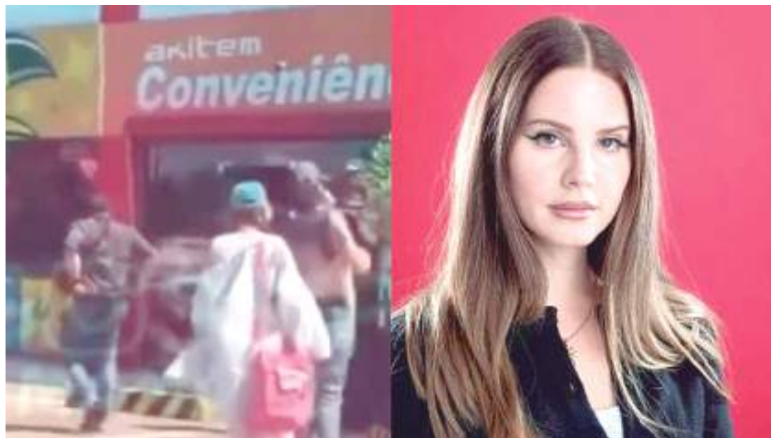
Cantora americana Lana Del Rey desembarcou em Manaus

A cantora americana Lana Del Rey desembarcou em Manaus na terça-feira (30), para conhecer a Amazônia e deixou os fãs amazonenses eufóricos. No primeiro momento muitos duvidaram que seria realmente a cantora.