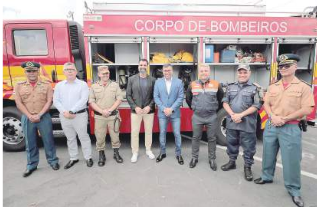
Mais de 3,3 mil itens vão fortalecer o combate à violência em Manaus e às queimadas no Amazonas

As ambulâncias entregues ao CBMAM fazem parte do plano de reestruturação do Grupamento de Resgate e Emergências Médicas (Grem), que dispõe da ampliação de bombeiros da área de saúde atuantes em todos os postos da capital. No dia 26 de maio, 54 bombeiros concluíram o curso de Operações de Resgate em Emergência e Atendimento Pré-Hospitalar (Core-APH) e já estão atuando