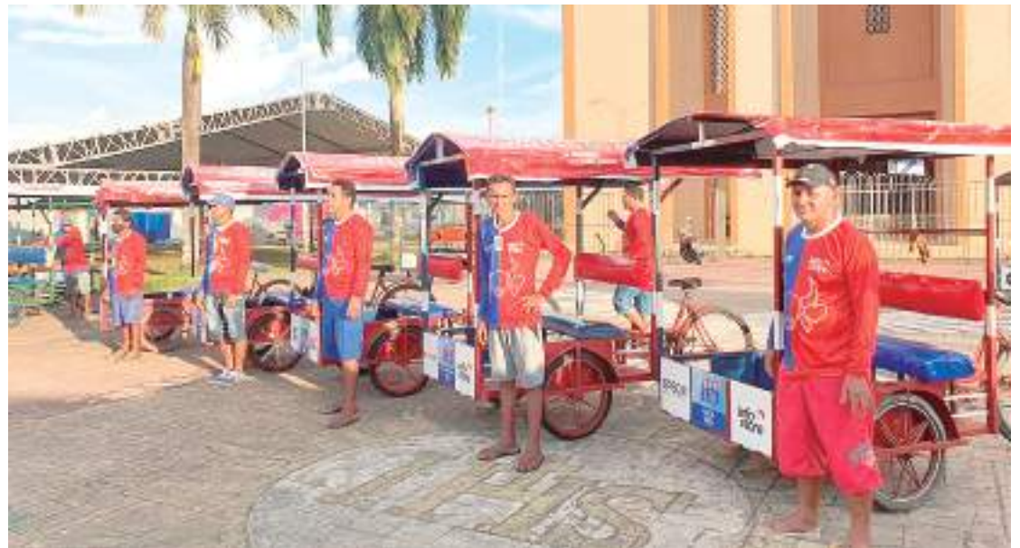
Tricicleiros são os condutores do tradicional meio de transporte em Parintins