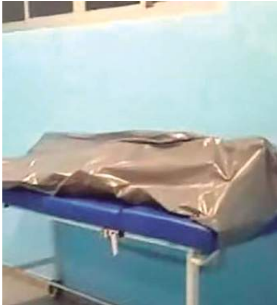
Após partida de futebol, "Yan" foi morto com pelo menos 10 tiros

O caso deve ser investigado pela Polícia Civil do Amazonas.