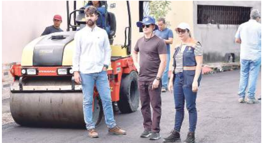
Obras acontecem em diferentes zonas da capital

bairros Flores e Santa Etelvina, o chefe do Executivo municipal fiscalizou os serviços de recuperação asfáltica que estão sendo realizados.