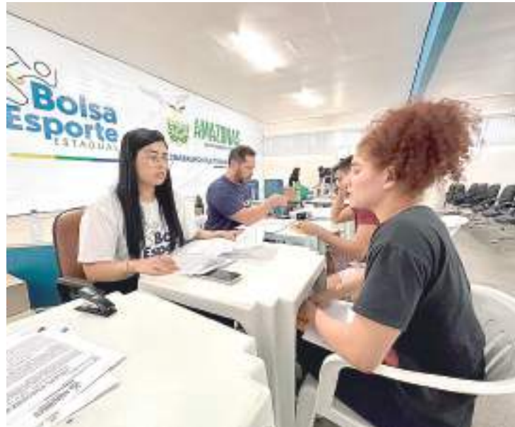
Atletas fazem inscrições para concorrer a Bolsa Esporte Estadual

Rendimento de base: tem direito o atleta e paratleta, de 12 a 18 anos, das modalidades olímpicas e não olímpicas, que participaram de eventos esportivos realizados entre 01 de abril de 2022 a 31 de março de 2023, e que continuam em atividade. Devendo ter sido convocado para integrar a Seleção Brasileira da Categoria de Base; ou ter sido campeão a nível nacional ou internacional, ou figurar no ranking nacional até a terceira colocação.