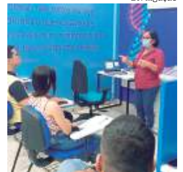
Interessados devem procurar o estande do Sebrae

Administrado pela Saphyr Shopping Centers, uma das mais importantes empresas do setor, o Shopping Manaus ViaNorte segue as novas normas orientadas pelo Grupo, sempre focadas na saúde e bem-estar de clientes, lojistas e colaboradores.