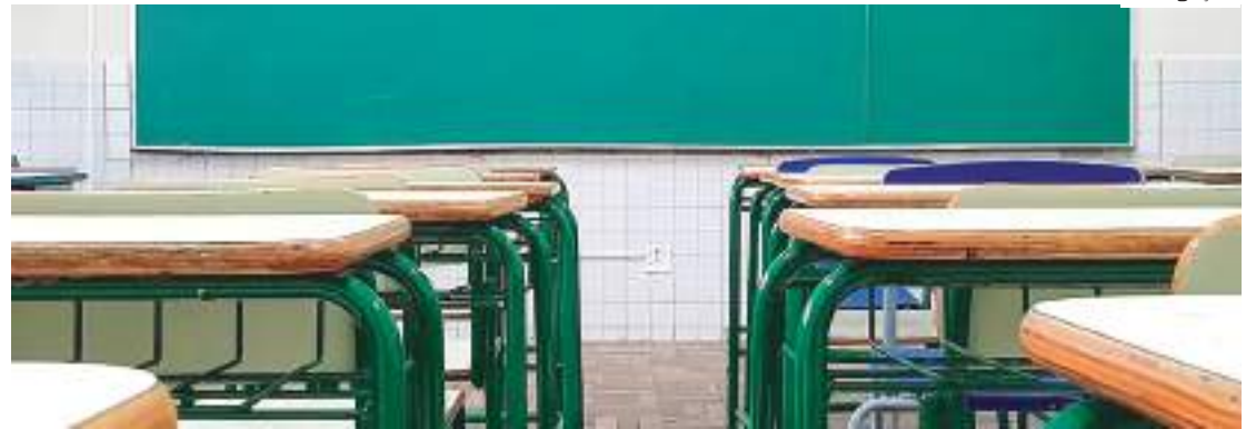
Crianças terminam 2º ano do ensino fundamental não alfabetizadas

O trabalho de coleta e análise de dados contou com o apoio do Instituto Nacional de Estudos e Pesquisas Educacionais (INEP). Ao todo foram ouvidos 251 professores em 206 municípios de todo o Brasil, entre abril e maio de