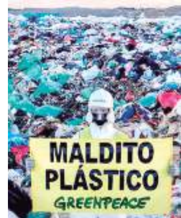
Valdemingómez Landfill em Madrid

A Greenpeace não poupou críticas a esta decisão e lembra que o processo de descarte de resíduos plástico e o envio desse lixo produzido pelos países ricos para os países mais pobres “afeta de forma desigual as comunidades mais vulneráveis”.