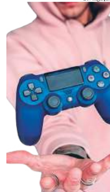
Mercado de games é segmento com destaque no Amazonas