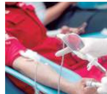
A ausência de doadores esta semana fez o estoque de O+ cair em quase 90%

O Hemoam funciona de segunda a sábado, das 7h às 18h, na avenida Constantino Nery, nº 4397, Chapada.