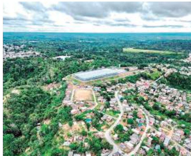
Dimicro será construído na Zona Leste de Manaus

“É um espaço fantástico e esperamos que, em junho, possamos, em conjunto com a Prefeitura de Ma-