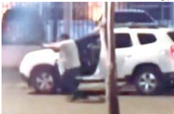
Agente à paisana sai do carro e atira contra carro

Tiros disparados durante uma abordagem policial na noite desta terça-feira (23) no Passeio do Mindú, na Zona Centro-sul de Manaus, causou pânico entre moradores e pessoas que usam o espaço para prática de exercícios físicos.