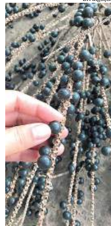
Ao todo, 16 pesquisadores participaram do estudo

O programa fomenta projetos de pesquisa científica, tecnológica, de inovação, ou de transferência tecnológica, vinculados a instituições ou centros de pesquisa e/ou ensino superior.