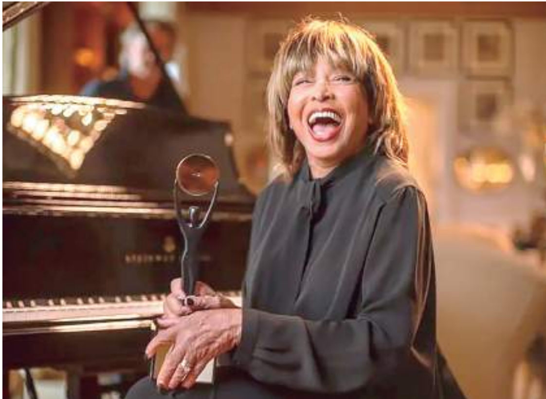
Tina Turner em 2021

Tina Turner, uma das maiores estrelas da música, morreu aos 83 anos de idade na quarta-feira (24), depois de uma longa doença, em sua casa em Kusnacht, perto de Zurique, na Suíça. O perfil da cantora no Instagram divulgou a notícia com uma foto em preto e branco da artista, sorrindo.