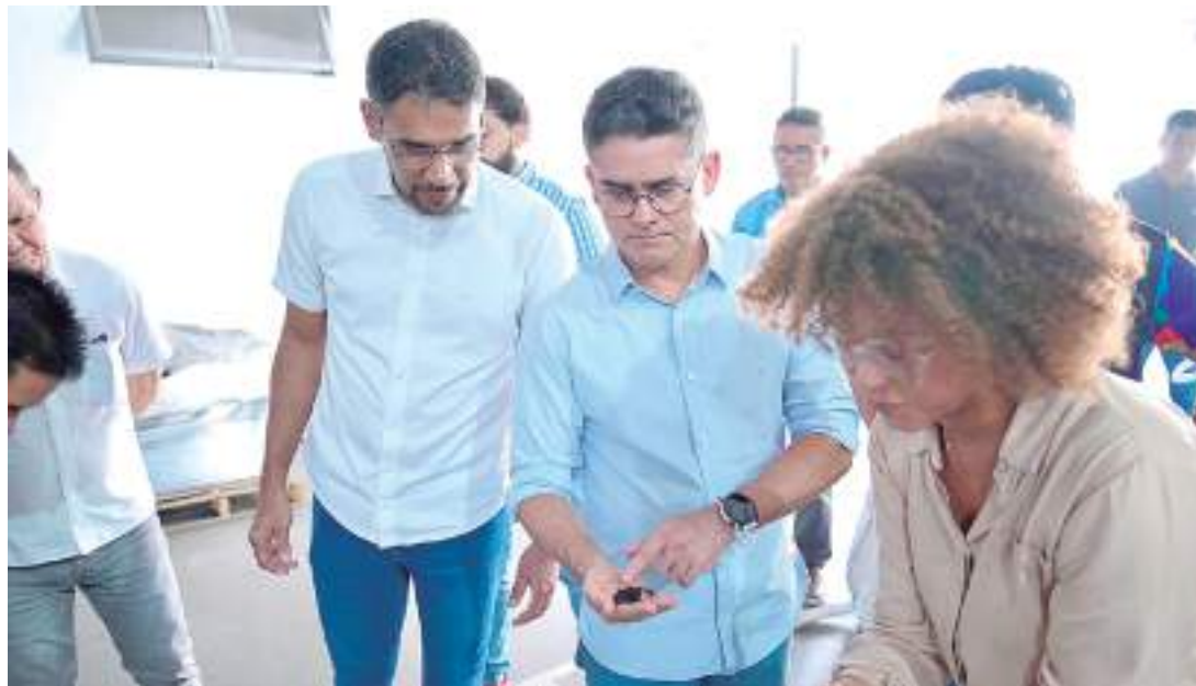
Prefeito David Almeida visita empresa no Distrito Industrial

“Essa é a primeira empresa a fazer esse processo produtivo completo, e a destinação correta desse tipo de material é fundamental para que possamos preservar o meio ambiente. Você vê a quantidade de pneus que tem aqui