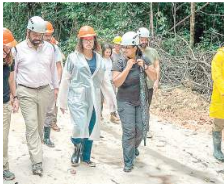
James Cleverly, à estação de pesquisa do AmazonFACE

Para isso, o AmazonFACE avalia a capacidade de resposta da floresta tropical a níveis elevados de dióxido de carbono (CO 2 ) e os impactos deste processo para o clima global, a biodiversidade e os ecossistemas. Ou seja: como a floresta reage ao aumento de concentração de CO 2 para entender seu papel dentro do contexto das mudanças climáticas.