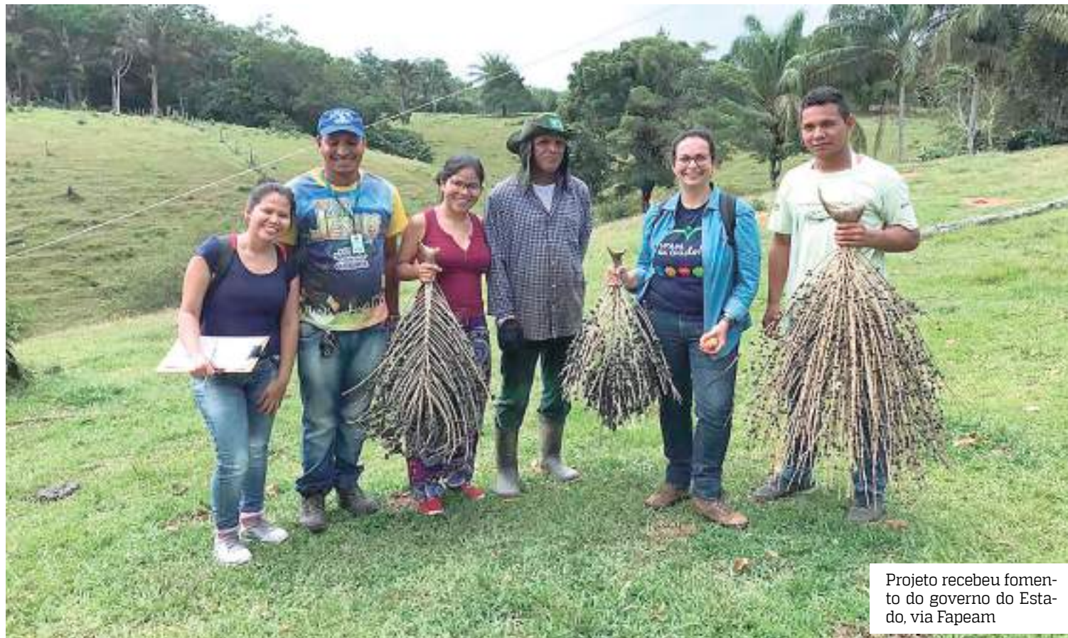
Projeto recebeu fomento do governo do Estado, via Fapeam