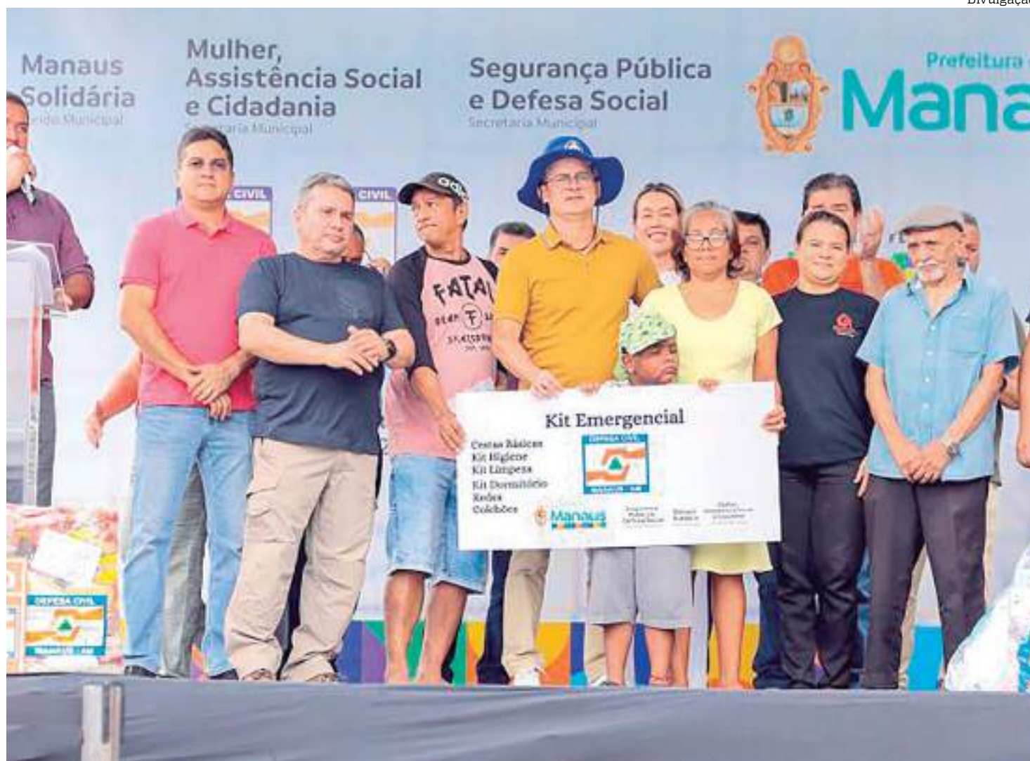
Chefe do Executivo municipal explicou que essa nova etapa é realizada com recurso federal

O prefeito destacou ainda as ações de prevenção realizadas com recursos próprios da prefeitura. “Nós já investimos R$ 68 milhões na contenção de encostas e recuperação de voçorocas. Nós já trabalhávamos antecipadamente com a prevenção. Entrei em 17 áreas e