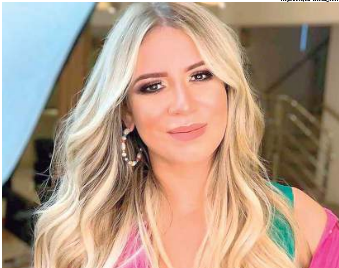
Cantora chegou a comentar que não queria mais viajar em aviões bimotores

O Centro de Investigação e Prevenção de Acidentes Aeronáuticos (Cenipa), ligado à Força Aérea Brasileira (FAB), finalizou a investigação sobre o acidente aéreo que culminou na morte da cantora Marília Mendonça em novembro 2021.