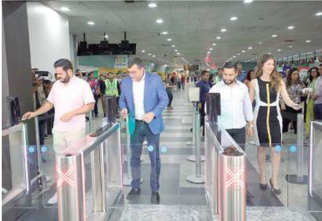
Moderno sistema automatizado foi implantado e governador projeta ainda mais avanços

Além do governador do Amazonas, participaram da cerimônia a diretora-presidente da