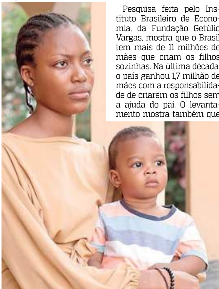
Mãe negra com filho nos braços

Pesquisa feita pelo Instituto Brasileiro de Economia, da Fundação Getúlio Vargas, mostra que o Brasil tem mais de 11 milhões de mães que criam os filhos sozinhas. Na última década, o país ganhou 1,7 milhão de mães com a responsabilidade de criarem os filhos sem a ajuda do pai. O levantamento mostra também que