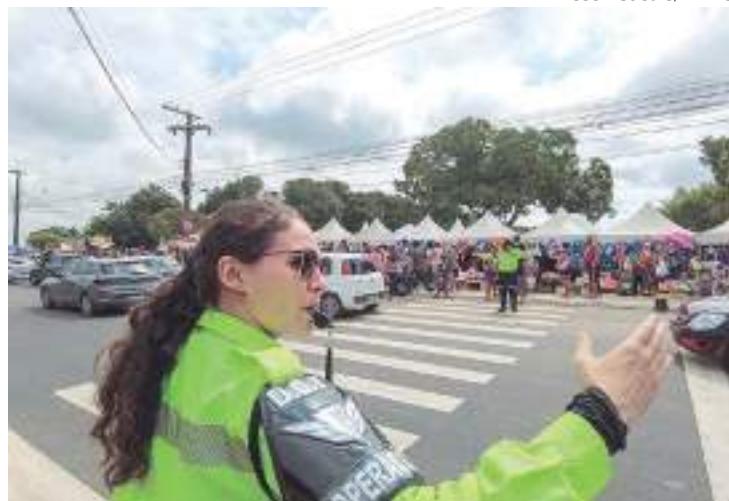
Ação de Trânsito, em Manaus