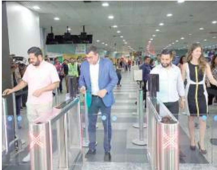
Divulgação Moderno sistema automatizado foi implantado e governador projeta ainda mais avanços

O governador Wilson Lima destacou, na última semana, que a posição estratégica do Amazonas dá condições para que o Estado se torne um hub aéreo da Amazônia, a partir do Aeroporto Internacional Eduardo Gomes. A declaração foi dada durante inauguração de sistema automatizado de acesso ao embarque doméstico e do novo fluxo de embarque internacional no aeroporto. Na ocasião, Wilson Lima reforçou que o Governo do Amazonas tem incentivado as companhias aéreas a criarem novas rotas interligando o interior com a capital e o Amazonas com outros países. Entre as iniciativas está a redução do ICMS sobre os combustíveis de aviação, o que também tem contribuído para movimentar a economia a partir do turismo, que é vocação do estado. A expansão da rota aérea, com apoio do Governo do Amazonas, possibilitou a conexão direta do estado com destinos internacionais como Panamá, Miami e Fort Lauderdale (nos Estados Unidos) e Colômbia, realizados pelas empresas Copa Airlines, Gol Linhas Aéreas e Azul e Avianca, respectivamente.