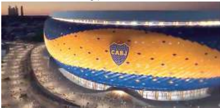
Boca Juniors vai investir na nova Bomboneira com 122 mil cadeiras

O Boca Juniors se prepara para um grande passo, a “Nueva Bombonera”. O histórico estádio atual possui capacidade para 54 mil torcedores e, no novo projeto, o clube poderia contar com uma capacidade máxima de 112 mil pessoas.