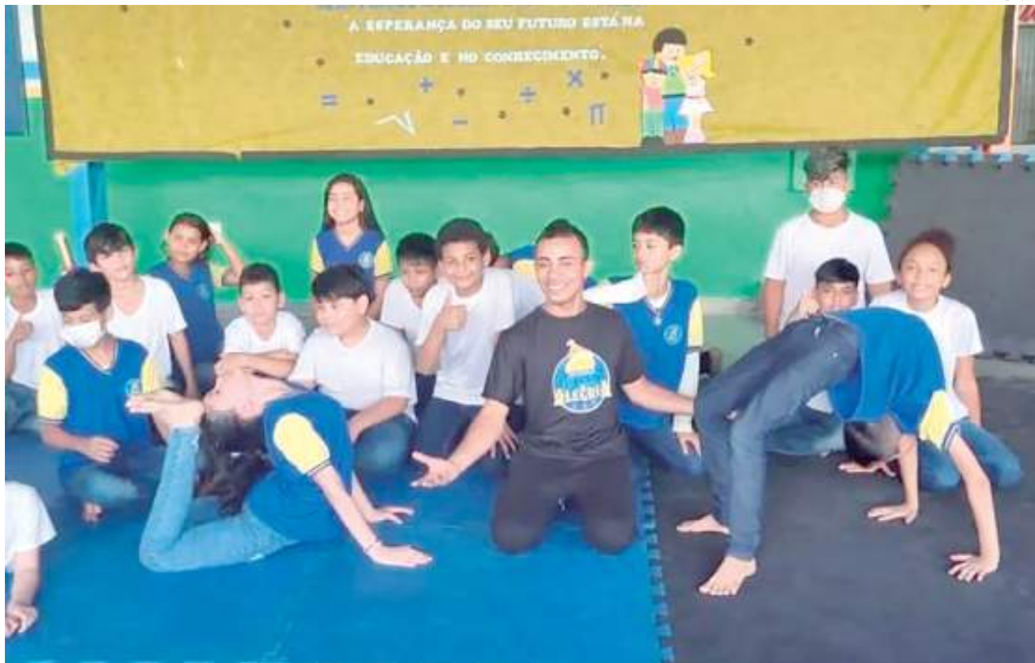
A proposta “Viveiro Acrobático” nasce visando democratizar o acesso à formação artística e, principalmente, a formação circense

A proposta nasce visando democratizar o acesso à formação artística e, principalmente, a formação circense. “As atividades circenses existem em Manaus, elas são práticas comuns que ocorrem em lugares artísticos, mas são mais acessíveis para pessoas com uma realidade social que permitem com que elas pratiquem atividades culturais. Por conta disso, as pessoas de lugares fora das zonas centrais contam com essa dificuldade porque não tem o acesso aos meios de cultura. Além do que, lugares com esse tipo