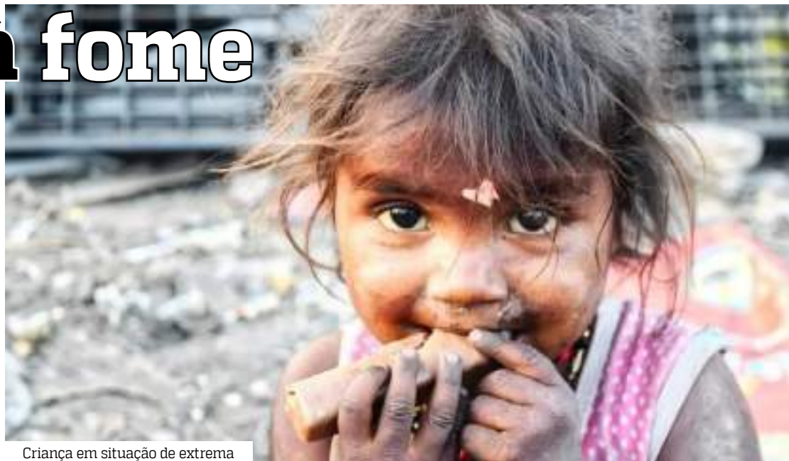
Criança em situação de extrema

Durante o lançamento do movimento Pacto Contra