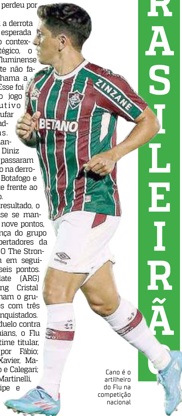
Cano é o artilheiro do Flu na competição nacional