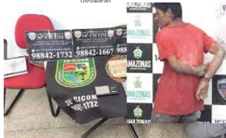
Suspeito foi preso no bairro Grande Vitória, na Zona Leste

Um homem identificado apenas como Fabrício, foi preso na sexta-feira (26), no bairro Grande Vitória, Zona Leste de Manaus.