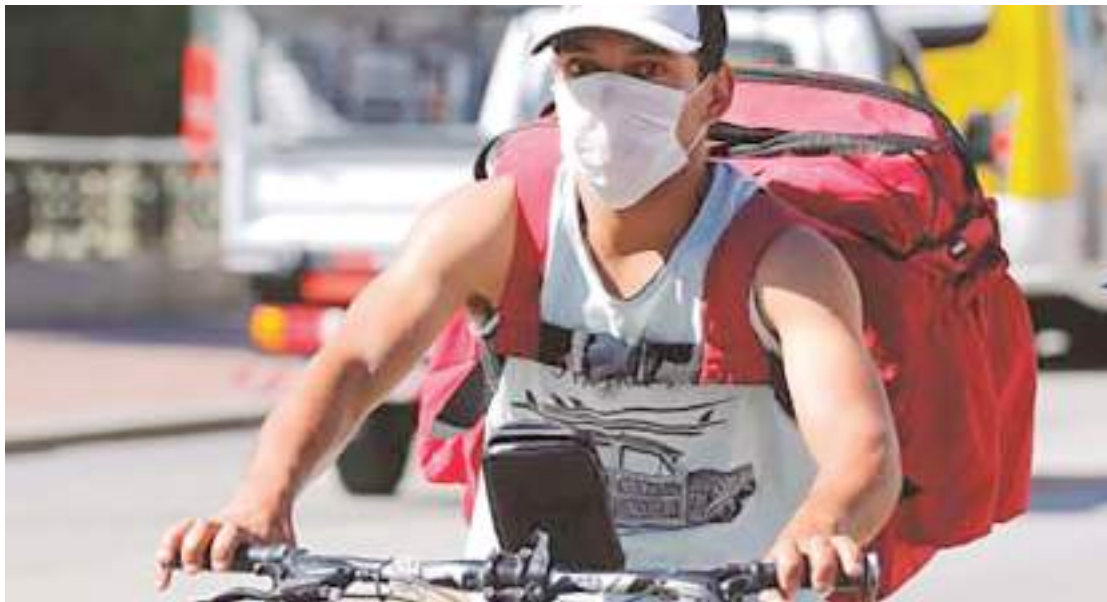
Cerca de 51% das mulheres e 56% dos pretos e pardos estão na informalidade

Quando consideradas as ocupações, a pesquisa revela que 86% tinham ocupações pouco desafiadoras e 14% dos jovens ocupados (2,2 milhões) tinham ocupações que envolviam atividades técnicas, da cultura ou da informática e comunicações.