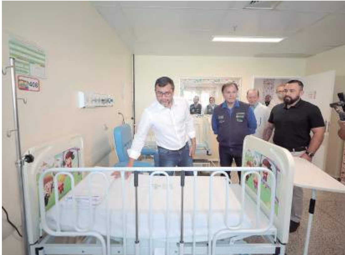
Estado reforça atendimento do público infantil diante da alta de casos de síndromes respiratórias

O HUGV possui, atualmente, 159 leitos clí-