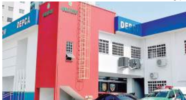
Delegacia Especializada em proteção à Criança e ao Adolescente

Um homem de 58 anos, condenado a 24 anos e quatro meses de reclusão pelo crime de estupro de vulnerável praticado contra a própria enteada, de 9 anos, foi preso na quinta-feira (25). O crime aconteceu em maio de 2018, em um residencial localizado no bairro Lago Azul, Zona Norte de Manaus.