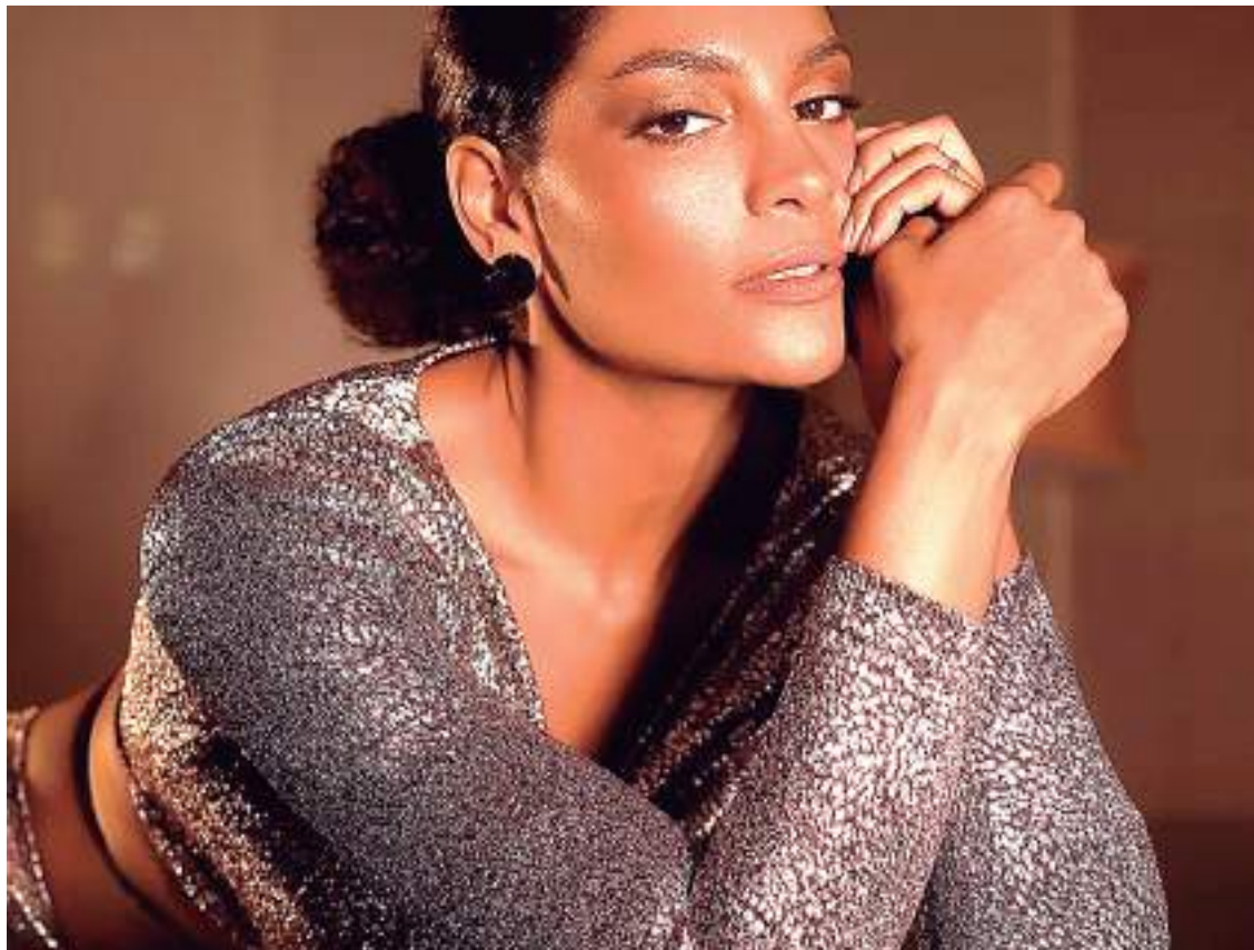
Barbara Reis, estrela de ‘Terra e Paixão’

Barbara Reis foi fazer o teste para Aline, a protagonista de Terra e Paixão, confiante, mas “pé no chão”. “Se rolasse seria muito bom, mudaria minha vida. O ‘não’ eu já tinha, então fui muito correndo atrás do ‘sim’”, diz a atriz de 33 anos, que não só passou como faz história como uma das poucas protagonistas negras do horário nobre - a primeira foi Taís Araújo, em 2009, em Viver a Vida, em um time que conta ainda apenas com Camila Pitanga e Lucy Alves.