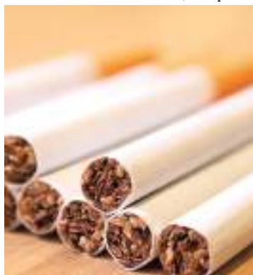
Relatório alerta para riscos à saúde de quem cultiva a planta

A Organização Mundial da Saúde (OMS) revelou hoje que mais de três milhões de hectares de terras estão sendo usados em mais de 120 países para o cultivo de tabaco, incluindo países onde as pessoas morrem de fome.