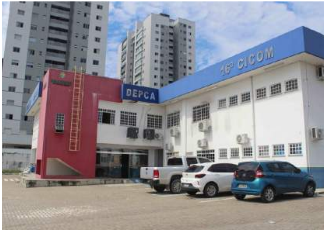
Mulher foi levada para Delegacia Especializada em Proteção à Criança e ao Adolescente