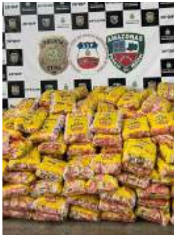
Trio atuou para desviar mais de duas toneladas de café

Três homens foram presos ontem (18) por envolvimento em furto e receptação de mais de duas toneladas de café, pertencentes a uma empresa do ramo. O crime ocorreu no dia 13 de maio deste ano, no bairro Lago Azul, Zona Norte.