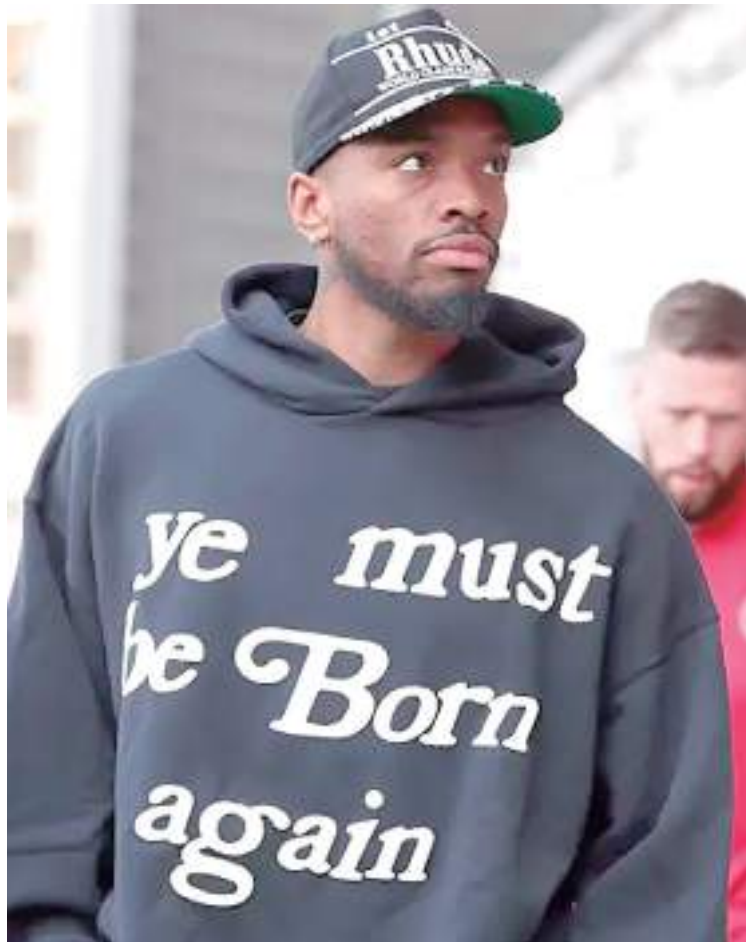
Ivan Toney é o principal jogador do surpreendente Brentford

Ivan Toney, principal jogador do time inglês Brentford, foi condenado, nesta quarta-feira (17), a oito meses de suspensão pela Associação de Futebol da Inglaterra (FA) por violar regras de apostas.