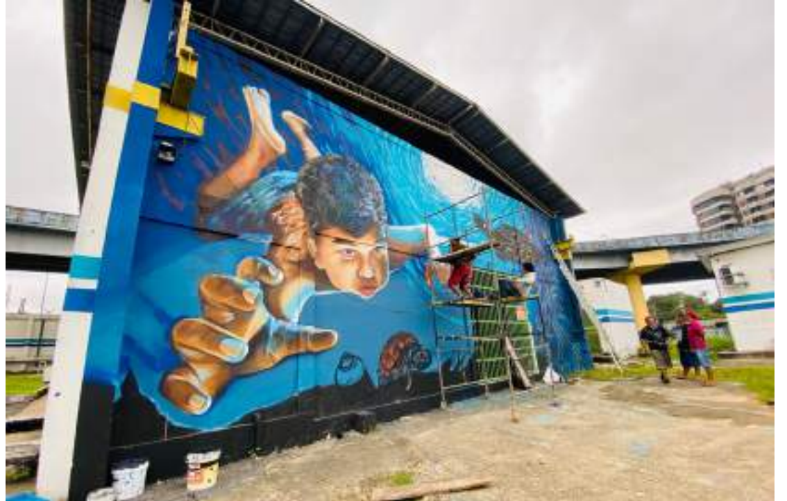
Todo o processo de grafiteagem levou quatro dias