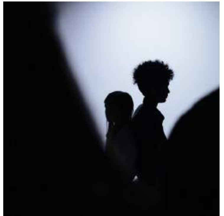
Aumento é de 68% em relação ao mesmo período do ano passado

Abuso e exploração sexual são crimes hediondos o que os torna inafiançáveis e insuscetíveis de graça, indulto ou anistia, fiança e liberdade provisória. Além disso, "caso o estupro seja praticado contra menor que tenha entre 14 e 18 anos (artigo 213, § 1º, do Código Penal), há aumento na pena do criminoso, que pode ir de 8 a 14 anos de reclusão. A mesma pena é aplicada caso o crime resulte em lesão corporal grave. Ter conjunção carnal ou praticar ato libidinoso com menor de 14