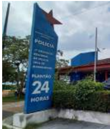
Delegacia Especializada de Polícia de Manacapuru

Dois homens, de 50 e 54 anos, foram presos em ocasiões distintas, entre a quarta e quinta-feira (17 e 18), pelos crimes de descumprimento de medida protetiva e injúria no âmbito da violência doméstica, praticados contra suas companheiras, de 21 e 38 anos. O crime foi praticado em circunstâncias distintas, no município de Manacapuru (a 68 quilômetros de Manaus).