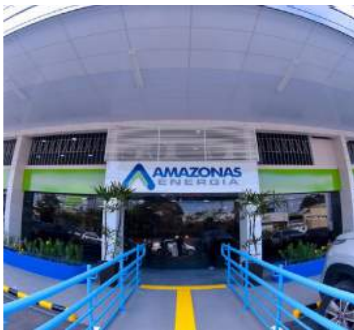
A concessionária afirma que não compactua com ações ilegais e pediu para que a empresa terceirizada tome providências

"Recebemos informações sobre um agente público que estaria furtando fios e tam-