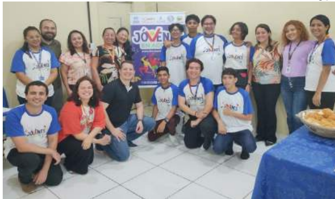
Adolescentes e jovens recebem qualificação para o mercado

O segundo projeto do Hermanitos, com inscrições abertas até domingo, dia 21 de maio, é o “Mujeres Fuertes” que é destinado a mulheres migrantes e refugiadas, que são mães solo e chefes de famílias. Desta vez, além de beneficiar mulheres venezuelanas, o programa também se estenderá à migrantes haitianas, em Manaus. Para saber mais, acesse o