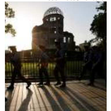
Hiroshima acolhe mais uma Cúpula do G7

Volodymyr Zelensky deverá participar na cúpula por videoconferência. As conversações devem centrar-se no reforço das sanções a Moscou, que já levaram a uma contração da economia russa no primeiro trimestre de 2023. Os líderes do G7 também vão discutir sanções contra o comércio russo de diamantes, que rende anualmente vários bilhões de dólares ao país.