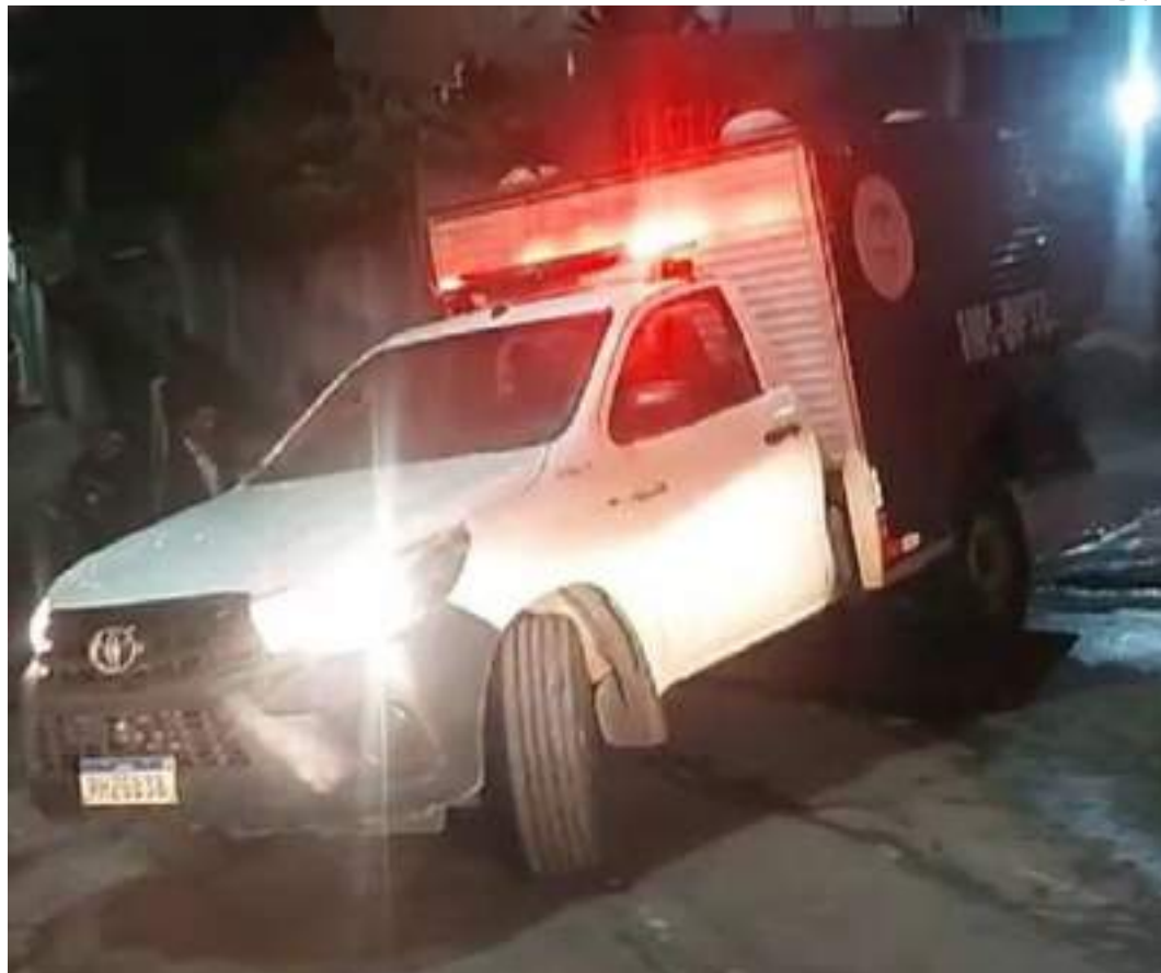
Carro do IML esteve no local e retirou o corpo de Jacó e Leidemar