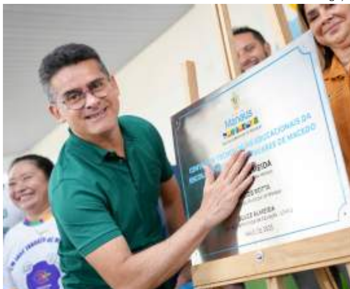
Foram feitas substituições na parte elétrica, no forro, nas louças e luminárias, entre outros consertos

Todo o investimento na estrutura física e pedagógica