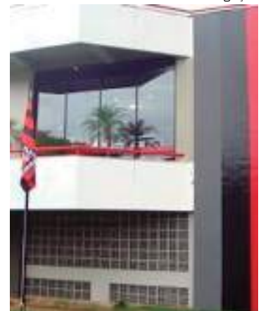
Flamengo se pronunciou sobre acusação a jogador do clube

Também não há qualquer menção, na denúncia do Ministério Público de Goiás, sobre apostas envolvendo jogadores do Flamengo, nem nesta, nem em qualquer outra partida.