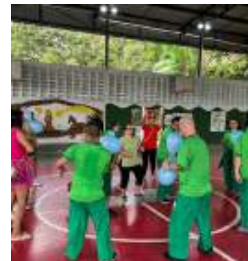
Atividade reuniu 60 alunos do curso

“Os nossos assistidos gostam dessas iniciativas que os tiram da rotina, então quando tem uma ação como essa sempre nos anima e nos alegra”, declarou.