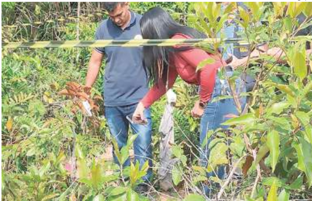
Mulher foi achada amordaçada, torturada e com perfurações de faca