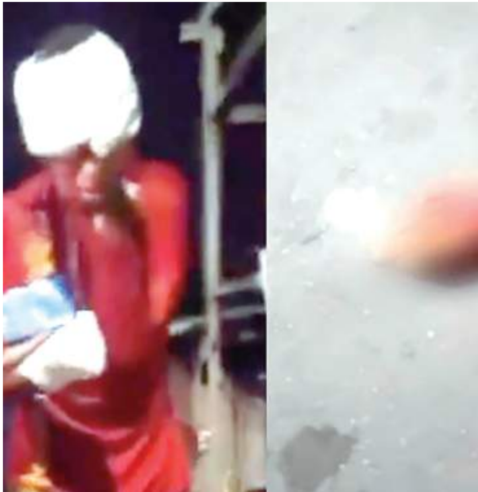
Suspeito foi atacado nas proximidades de um mercadinho

O autor do ataque fugiu imediatamente. O homem ferido foi atendido pela equipe do Serviço de Atendimento Móvel de Urgência (Samu) e levado a um hospital da capital. O caso deve ser investigado pela Polícia Civil.