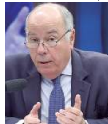
Ministro das Relações Exteriores, Mauro Vieira

O ministro das Relações Exteriores disse que já se encontrou com 90 interlocutores estrangeiros e que o presidente Lula manteve conversas com representantes de 30 países. O chanceler citou ainda negociações com os países sul-americanos sobre segurança das fronteiras e com os Estados Unidos sobre mudanças climáticas.