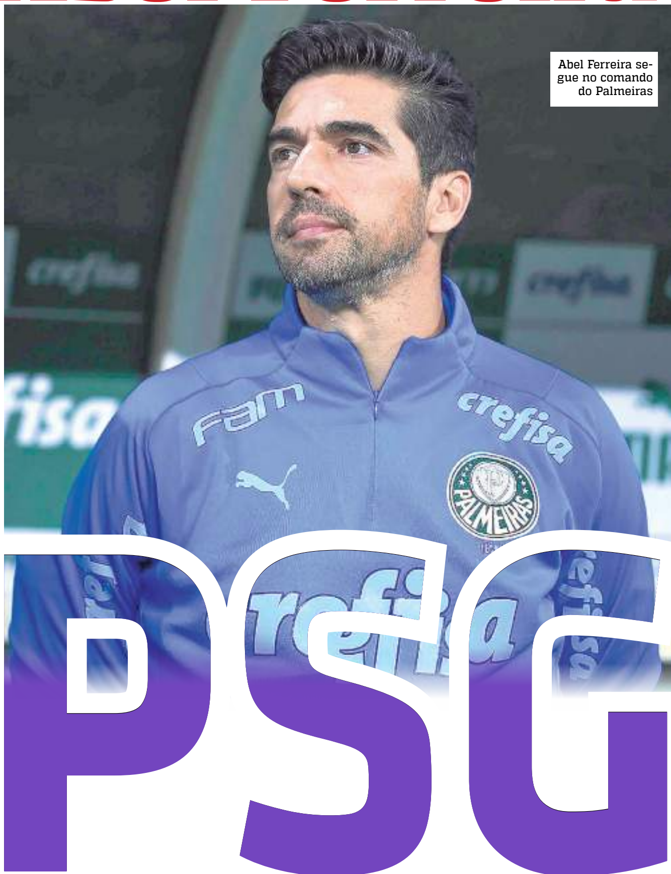
Abel Ferreira segue no comando do Palmeiras