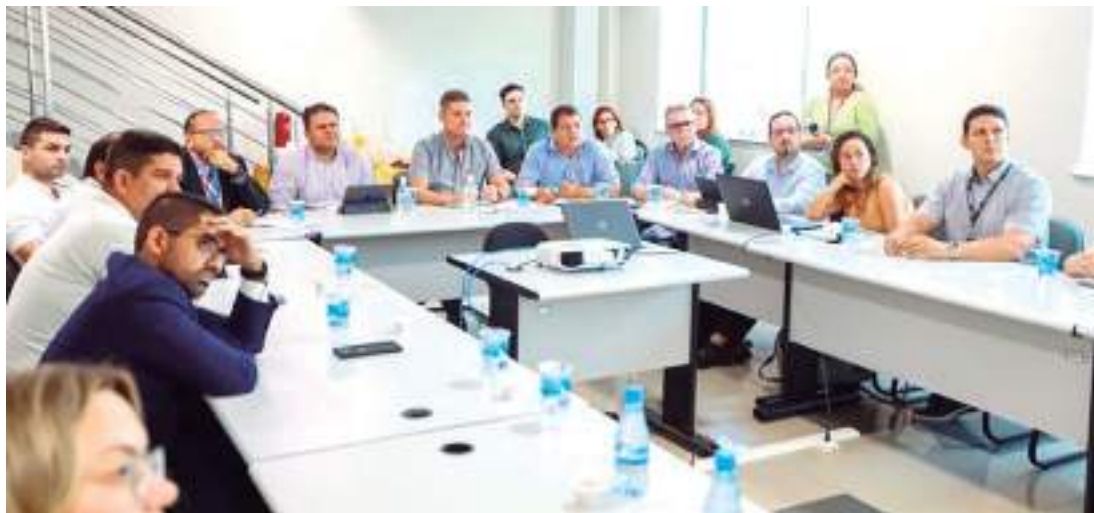
Reunião foi realizada nesta quinta-feira (25), na sede da Secretaria de Estado de Administração

A reunião foi realizada nesta quinta-feira (25), na sede da Secretaria de Estado de Administração (Sead) e contou também com a participação