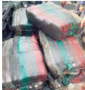
Mais 400 kg de drogas apreendidos na fronteira

Operação Ágata das Forças Armadas apreendeu, na noite de terça-feira (23), mais 400 kg de drogas na fronteira do Amazonas. Com essa nova apreensão, as Forças Armadas já somam mais de uma tonelada de drogas apreendidas durante a Operação Ágata - Comando Conjunto Uira.