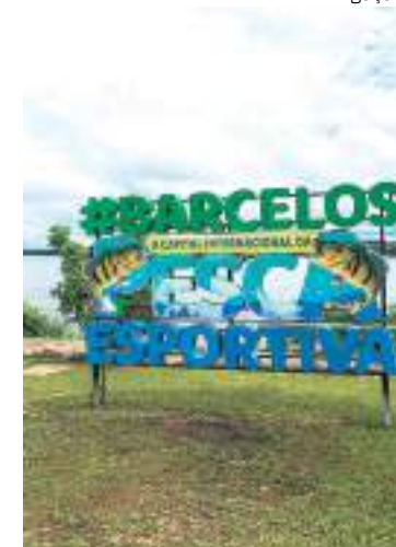
Moradores de Barcelos sofrem com ausência de internet

“A prestadora de serviço de internet deve garantir o funcionamento adequado do mesmo, sob pena de responder pelos danos causados ao consumidor, a teor do disposto nos artigos 373, II do CPC/15 e 14, § 3º do CDC”, explica.