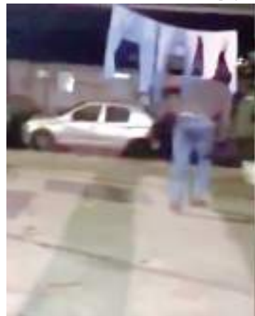
Ações de violência entre os grupos rivais assustam a população

Facções criminosas têm aterrorizado moradores de comunidade em Rio Preto da Eva, no interior do Amazonas. Ações de violência e ataques entre os grupos rivais assustam a população desde a segunda-feira (22).