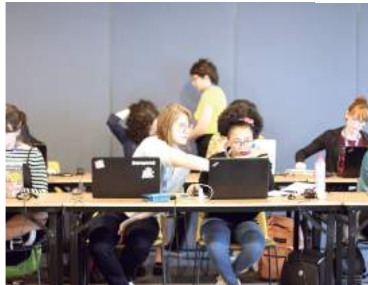
Qualificação prioriza mulheres em situação de vulnerabilidade

Após o fim das inscrições, as selecionadas serão anunciadas no dia 21 de junho. O curso ocorrerá de 5 de agosto a 8 de dezembro, com aulas de conteúdo aos sábados, das 09h às 17h. Já as aulas de revisão ocorrerão às segundas-feiras, das 20h às 22h e, além disso, as alunas terão a opção de