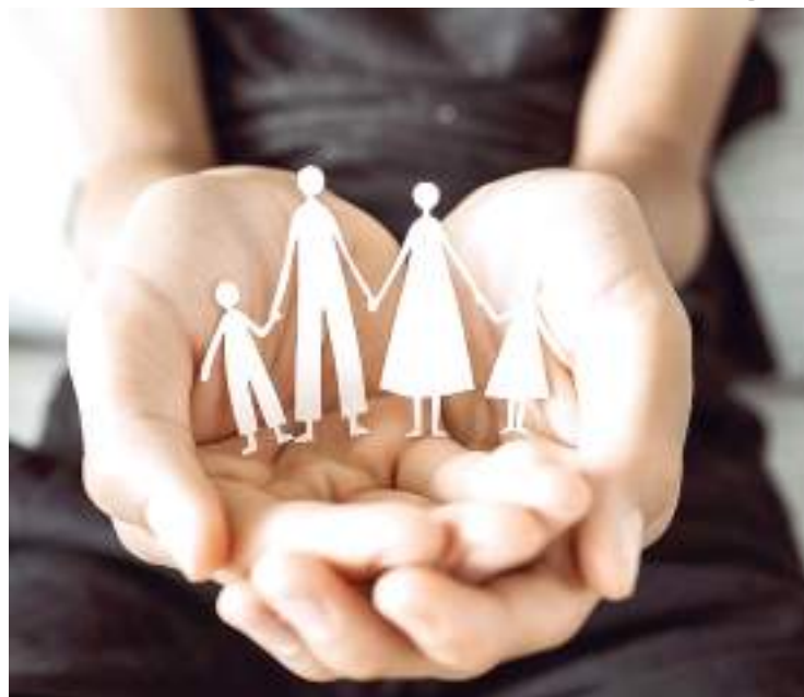
25 de Maio foi definido como o Dia Nacional da Adoção

Para que essa ação tenha efetividade, no entanto, ser-