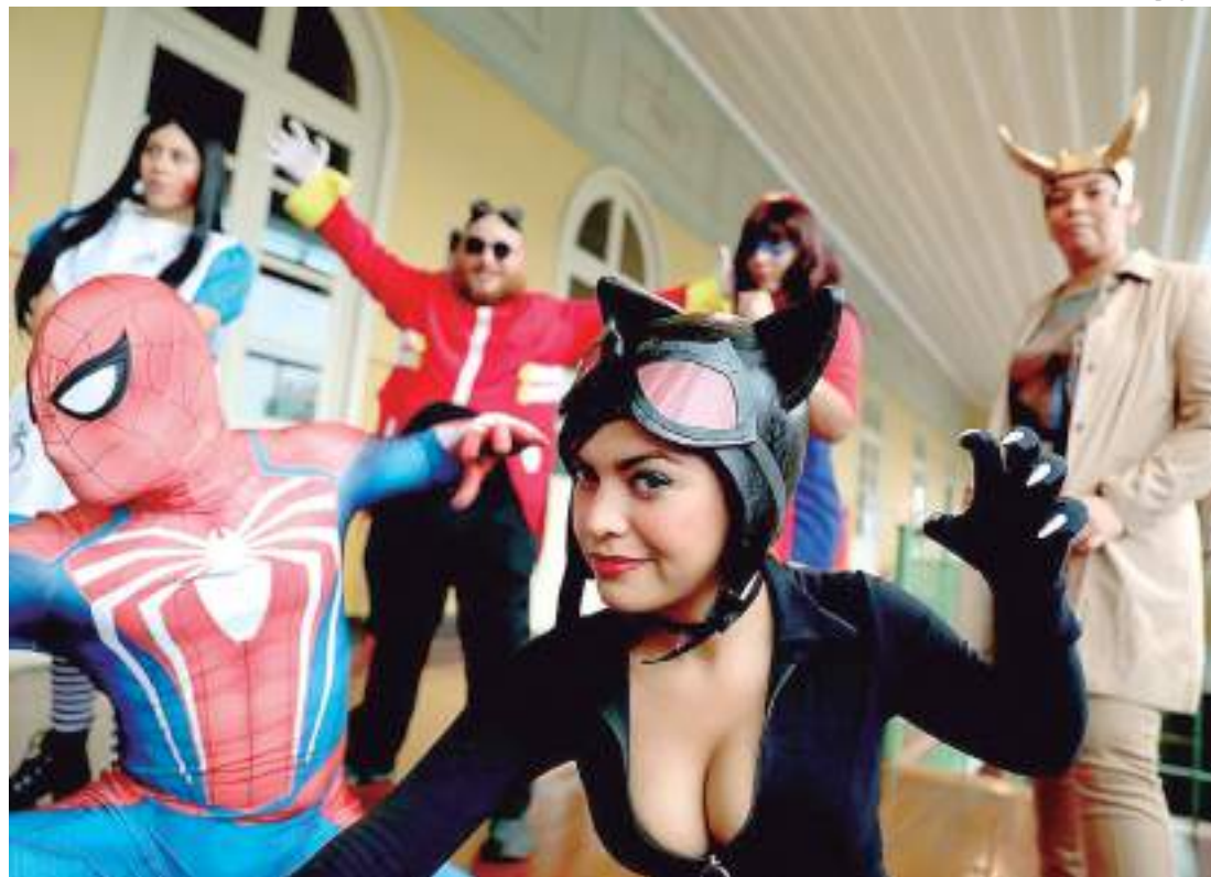
Palacete Provincial receberá mais uma edição do Universo Geek

O dia do Orgulho Nerd é comemorado mundialmente no dia 25 de maio,