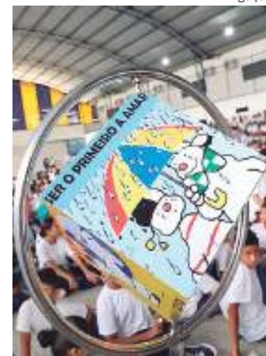
Monumento "Dado da Paz"