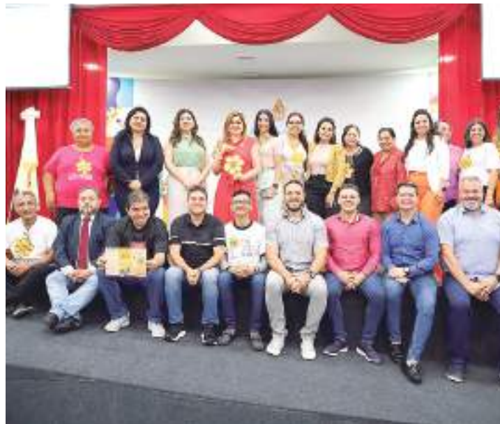
Semed apresenta protocolo no auditório Luiz Geraldo Pontes