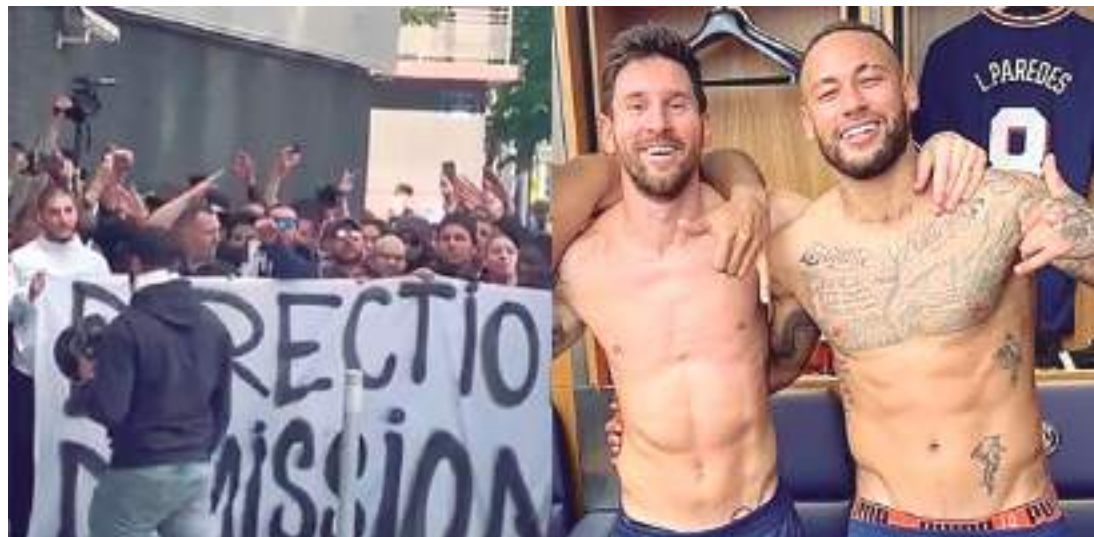
Messi e Neymar podem deixar PSG nesta temporada

Depois de se machucar em fevereiro deste ano em