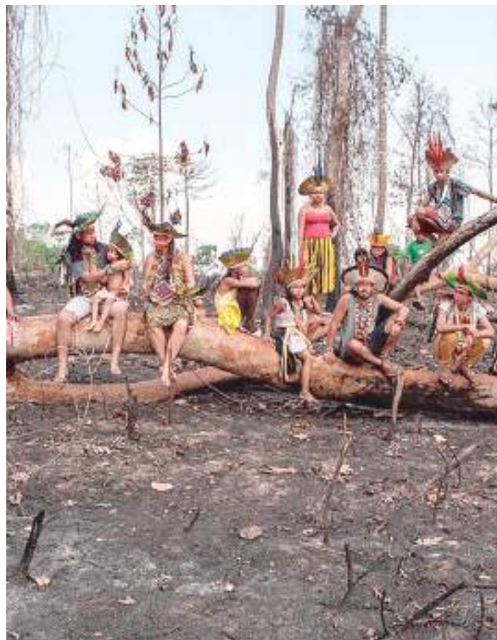
Queimadas devastaram território Huni Kui, em Rio Branco (AC), em 2019.

O novo estudo, liderado por pesquisadores da Universidade de Harvard, usa uma combinação de modelos de transporte químico atmosférico e uma função de resposta de concentração atualizada para estimar a taxa de mortalidade de indígenas expostos a altas concentrações de MP 2.5, nome dado às partículas microscópicas emitidas pelas queimadas.