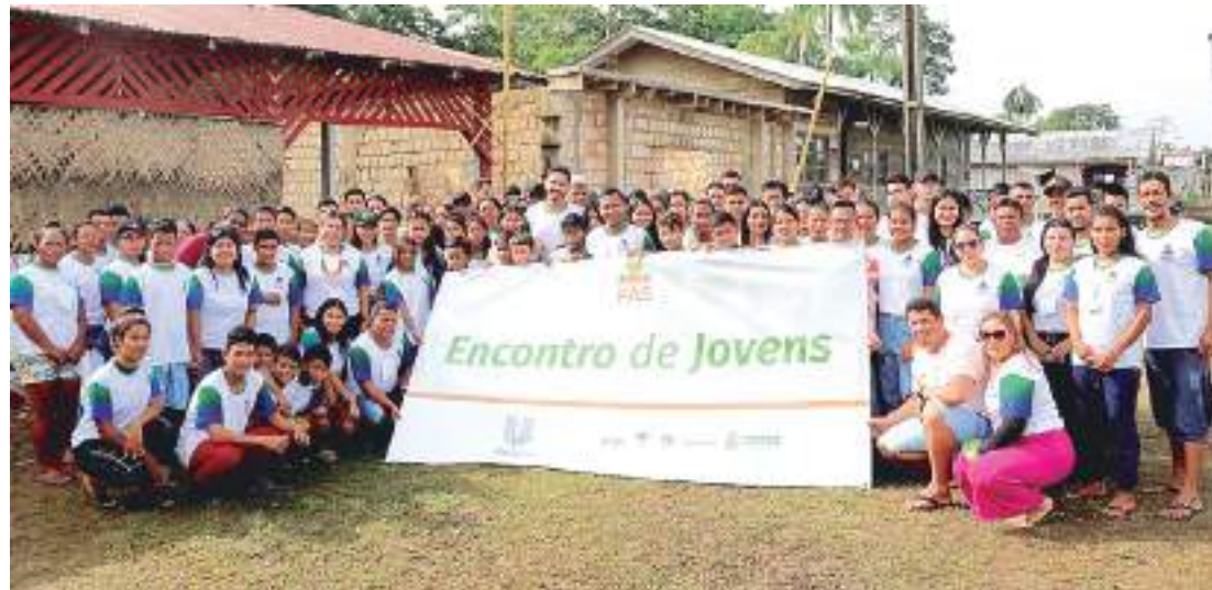
Jovens pedem escolas bem equipadas e seguras, água limpa e internet