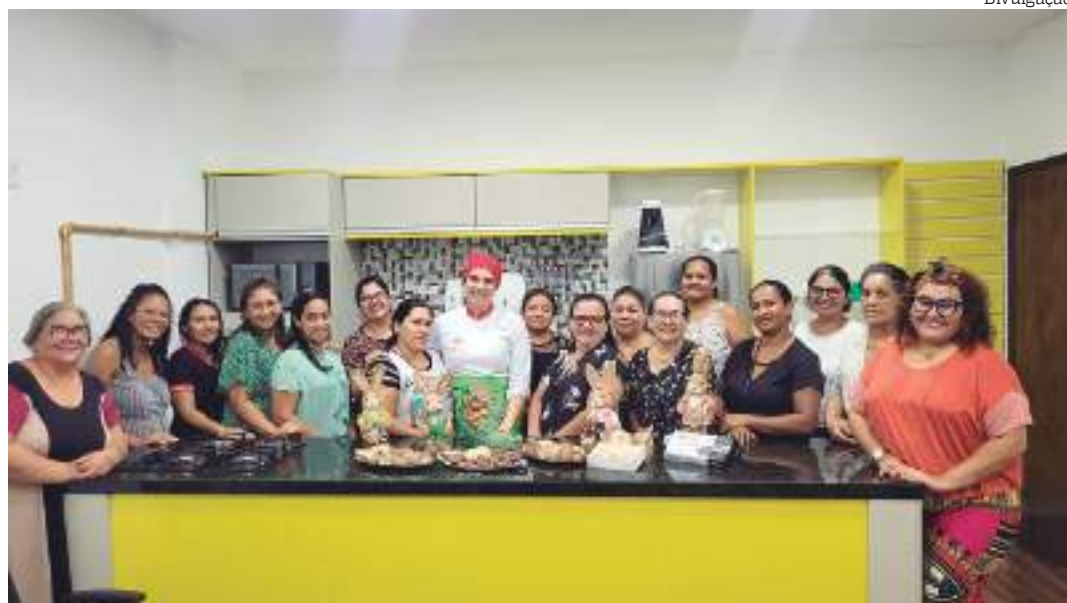
Alunas e professor do projeto Confeitaria em Casa