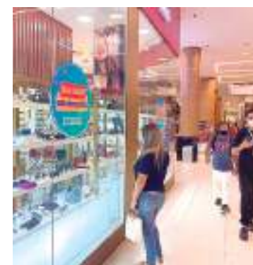
Vitrines do Millennium Shopping

zandra informa que os lojistas estão animados com a data e, por isso, trouxeram várias opções de presentes para tornar o Dia das Mães ainda mais especial. “Há desde perfumes, cosméticos, além das opções de calçados e vestuários, os lançamentos recentes de literatura e também smartphones ou tablets para as mães tecnológicas”, disse.