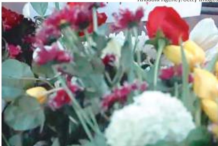
Cidadãos acendem velas em frente à escola, após tiroteio

Um menino de 13 anos abriu fogo contra seus colegas de classe em uma escola na capital sérvia, Belgrado, na quarta-feira (3), abalando o país dos Balcãs. O ataque deixou pelo menos oito crianças mortas, junto com um segurança. Embora a Sérvia esteja repleta de armas, tiroteios em massa como esses são raros.