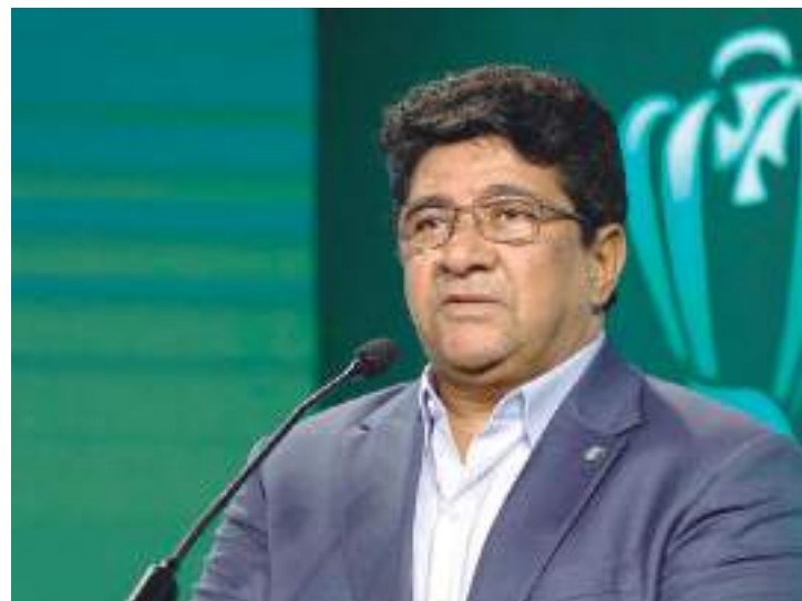
Mandatário da CBF afirma preferência pelo técnico Ancelotti

também analisa a situação de outros comandantes. Abel Ferreira, Jorge Jesus e Zinedine Zidane estão entre os sondados, mas a prioridade é do atual campeão da Champions. "Não que ele tenha qualquer tipo de proposta, mas acompanhamos e verificamos também se ele tinha algum tipo de vontade. Eu o tenho como plano A. Estou falando pela primeira vez de uma forma bem aberta e não adianta ficar escondendo a preferência. Mas procuro ser ético", finalizou.