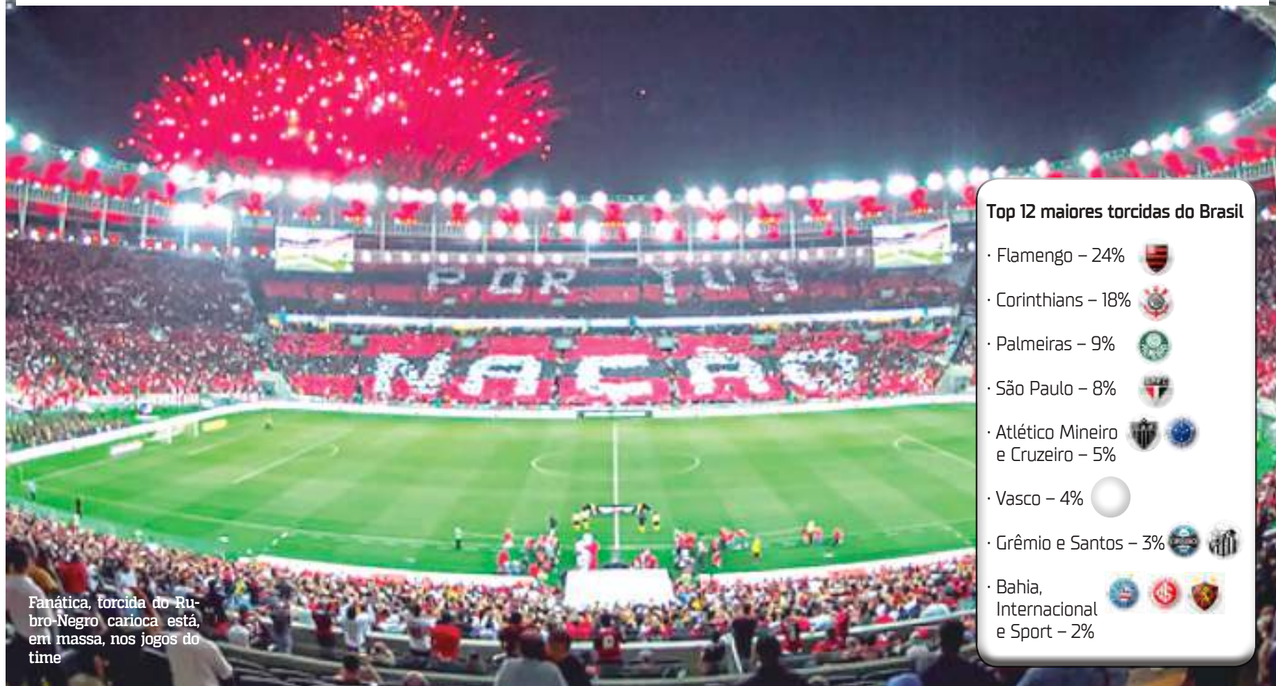
Fanática, torcida do Rubro-Negro carioca está, em massa, nos jogos do time

O Top 10 das maiores torcidas do Brasil, segundo a Pesquisa CNN Esportes/Itatiaia/Quaest, é fechado por três clubes de fora do Sudeste: Bahia (2%), Internacional (2%) e Sport (2%).