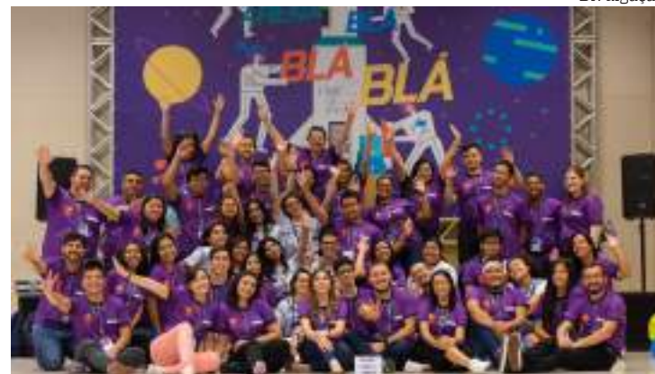
Inscrições gratuitas até 31 de maio

“O concurso é voltado para estudantes de Manaus e tem o objetivo de divulgar a edição deste ano, que retornará com força total e muitas novidades após três anos sem