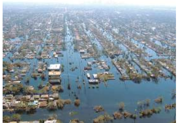
Vista aérea de Nova Orleans inundada quatro dias após passagem do furacão

Este projeto começou em 2018, quando se estudou as previsões de inundações na Índia, seguindo-se o projeto para o Bangladesh, tendo em vista ajudar a combater os danos catastróficos das inundações anuais. Perante os avanços dos modelos globais, com base na cartografia, hidrografia, espectrometria via satélite, previsões matemáticas meteorológicas, entre outros, ao qual se junta a previsão IA e aprendizagem do próprio sistema, a Google, em 2022, aplicou e ampliou esta tecnologia a mais 18 países, abrindo assim caminho para a atual expansão global.