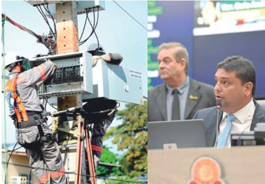
Lei do vereador proibia instalação dos medidores, mas decisão a classificou como inconstitucional