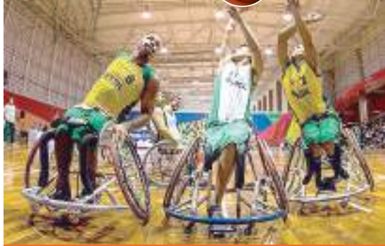
Esporte Página 9

Cem brasileiros vão participar do Parapan