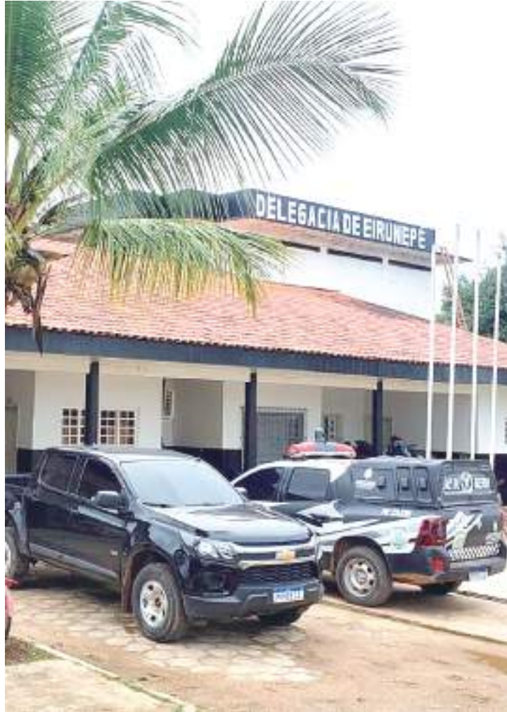
Adolescente de 15 anos é suspeito de matar o pai com golpes de faca

O adolescente foi transferido para o Centro Socioeducativo Assistente Social Dagmar Feitosa, situado no bairro Alvorada, Zona Centro-Oeste, onde cumprirá medidas socioeducativas, a pedido do Ministério Público, ele permanecerá à disposição do Juizado Infração.