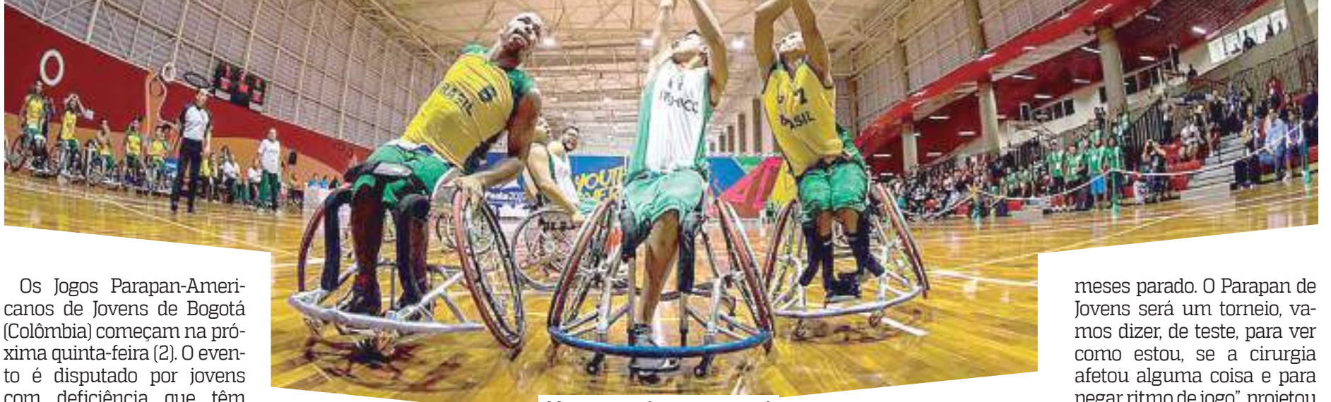
Massagem relaxante corporal

Os Jogos Parapan-Americanos de Jovens de Bogotá (Colômbia) começam na próxima quinta-feira (2). O evento é disputado por jovens com deficiência que têm entre 12 e 20 anos e reunirá cerca de 900 atletas de 21 países, em 12 modalidades. A competição estava inicialmente marcada para 2021, mas foi adiada por causa da pandemia de covid-19.