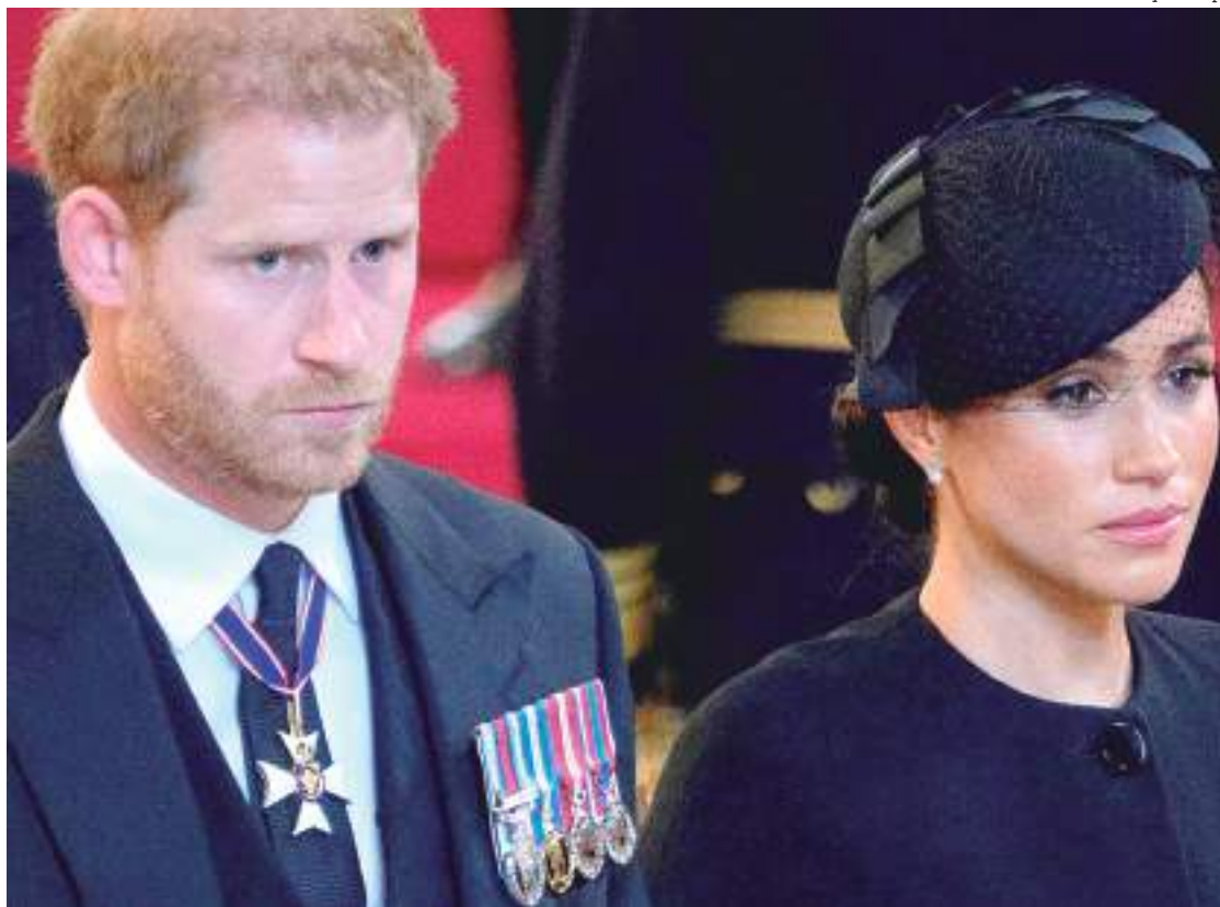
Príncipe Harry e Meghan Markle, no velório da Rainha Elisabeth II

Ao que tudo indica, Príncipe Harry e Meghan Markle não são mais um casal. De acordo com o jornal português Flash!, o casal vive um casamento de fachada e ensaia para tornar o divórcio público.