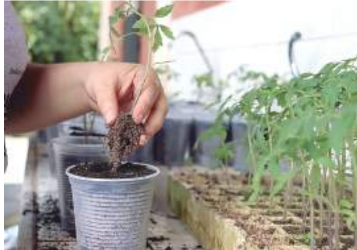
Pesquisa tem como base bactérias encontradas na microbiota Amazônica

no combate a doenças que afetam o cultivo de diversas plantas, utilizadas na alimentação humana, assegura que o produto consumido seja puro e sem contaminação de defensivos agrícolas tóxicos ou produtos químicos.