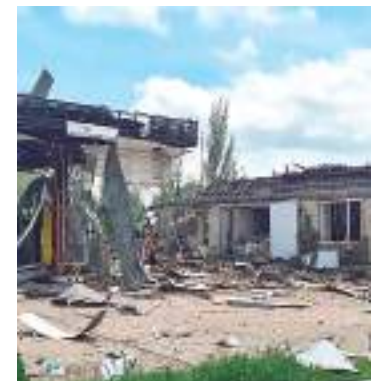
Posto de gasolina foi destruído durante ataque em Toretsk

A zona seria necessária para proteger as regiões ucranianas de bombardeios, escreveu o conselheiro presidencial Mykhailo Podolyak no Twitter.