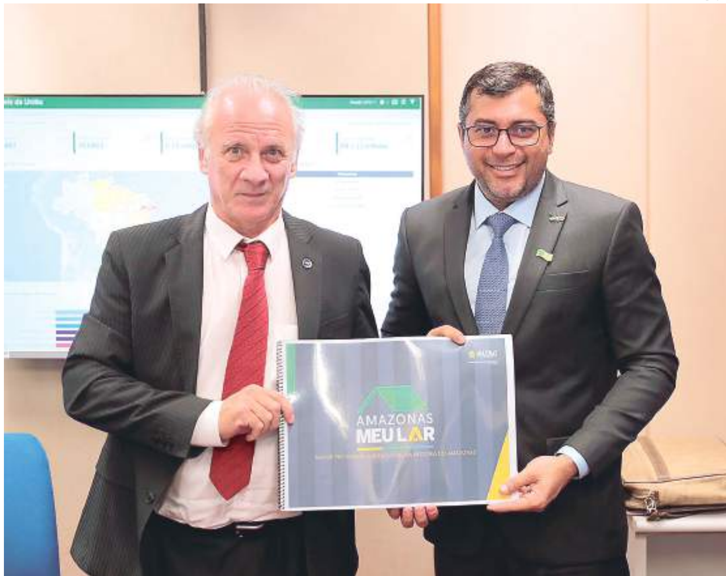
Projeto faz parte do 'Amazonas Meu Lar'