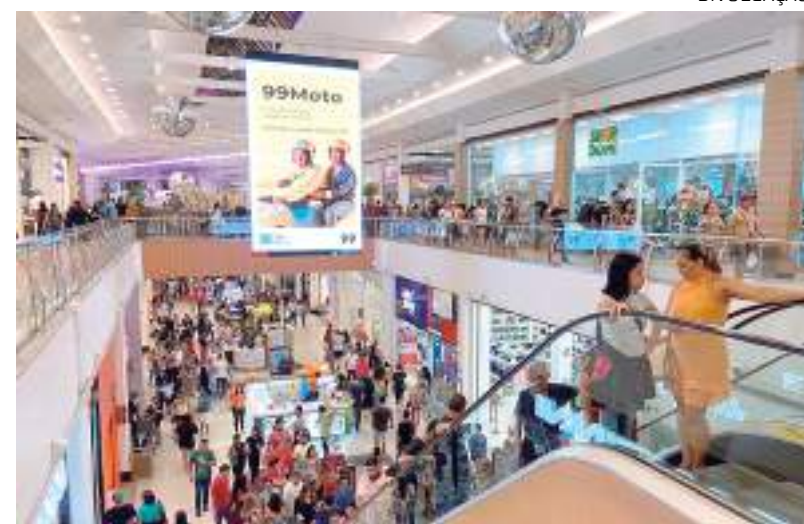
Amazonas Shopping segue ampliando seu mix de lojas