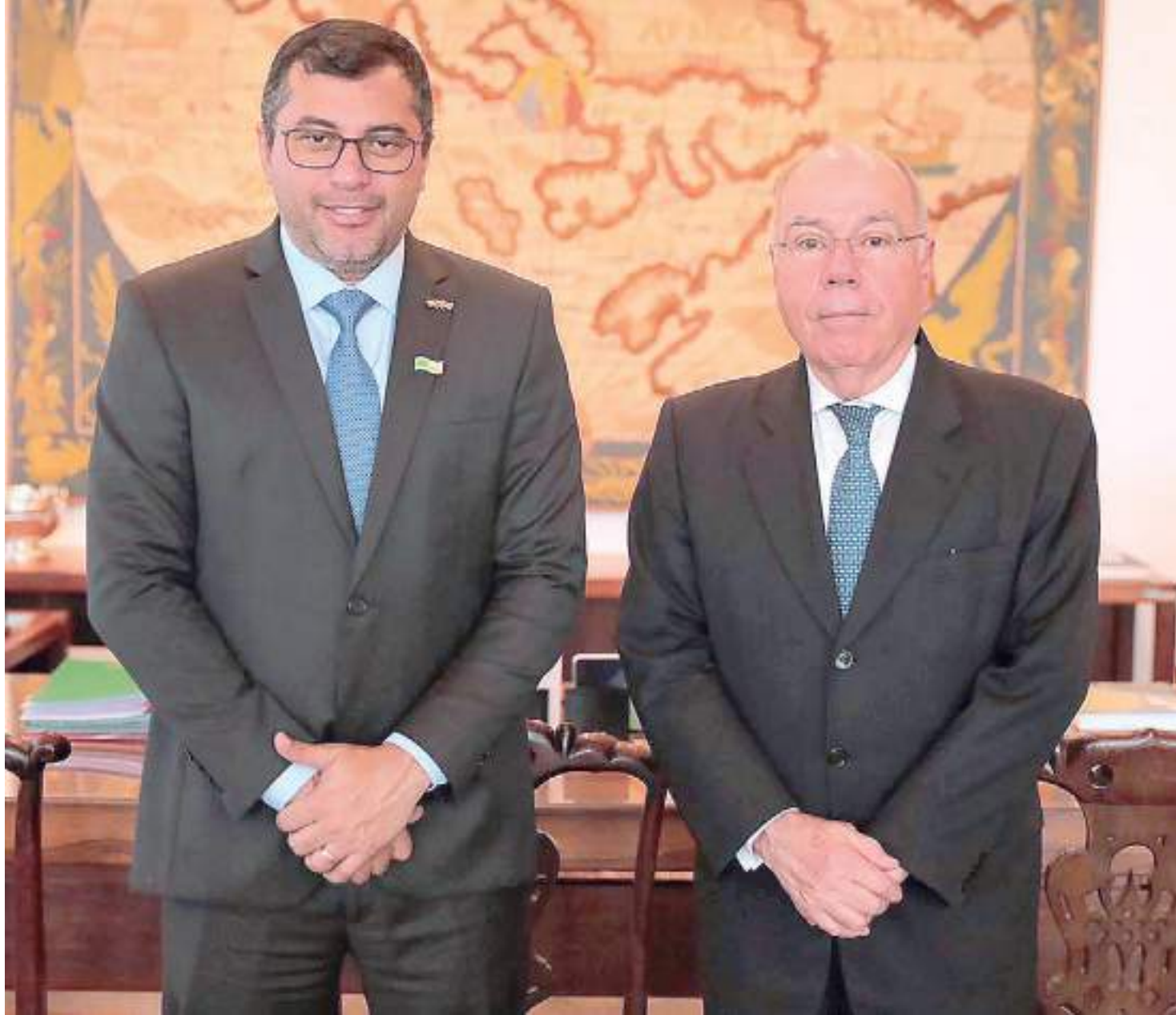
Wilson Lima reuniu-se com o ministro de Relações Exteriores, Mauro Vieira

Wilson Lima também destacou o trabalho de incentivo ao turismo local que o Governo do Amazonas tem feito, com a redução do Imposto sobre Circulação de Mercadorias e Serviços (ICMS) sobre os