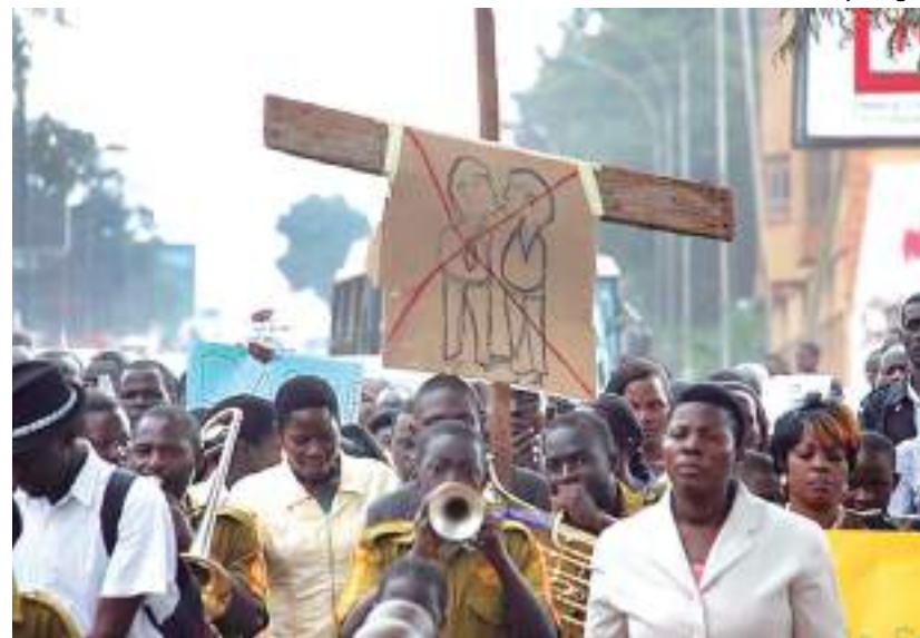
Há um sentimento antigay em parte da população de Uganda

O Pepfar, a Unids e o Fundo Global também desempenharam um papel importante na hora de apoiar os esforços de Uganda para conter o avanço do HIV/Aids por décadas. Em 2021, 89% das pessoas HIV positivas na Uganda estavam cientes da sua condição, mais de 92% estavam recebendo terapia antirretroviral e 95%