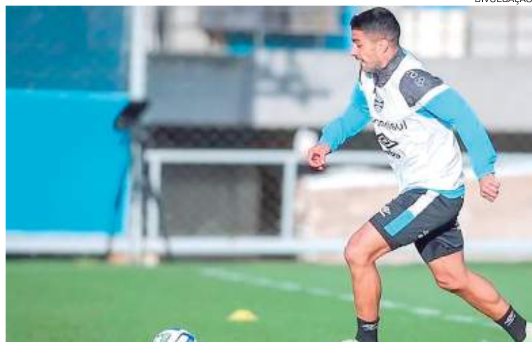
Suárez deve reforçar o Grêmio no duelo decisivo na casa do Cruzeiro