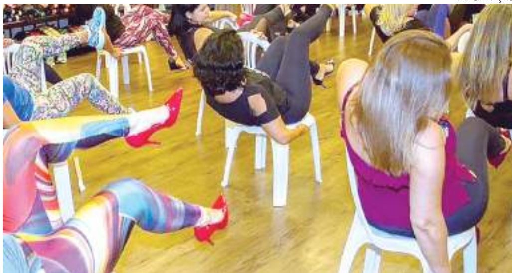
Em homenagem ao Dia dos Namorados, Fórmula Academia realiza aula especial gratuita de Stilleto e Chair Dance