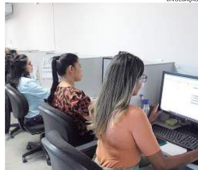
Jucea atua para auxiliar empreendedores a abrir um novo negócio

Ainda conforme o Mapa, não é considerado o tempo que o cidadão leva para apresentar as documentações aos órgãos públicos entre as etapas do processo.