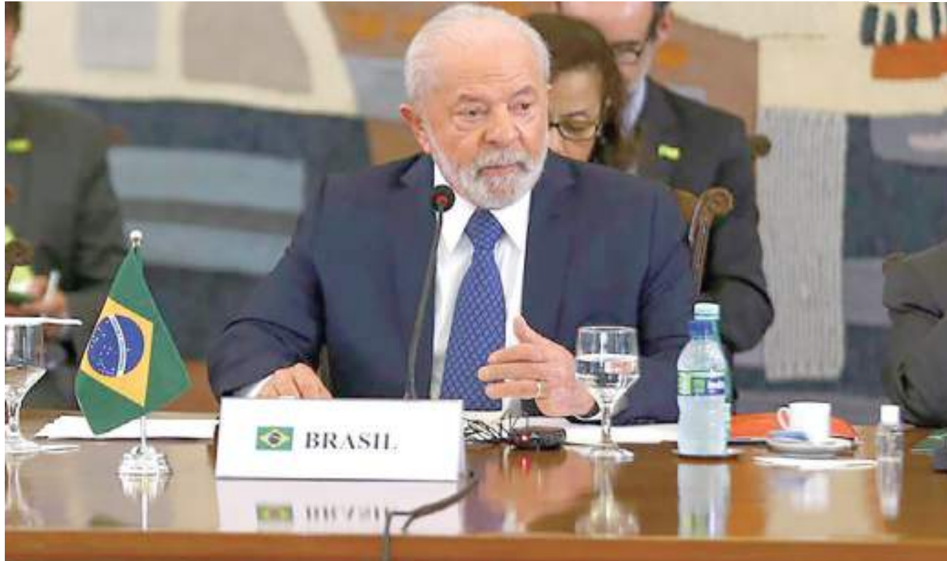
Onze presidentes participam do encontro na sede do Ministério das Relações Exteriores

O governo de extrema direita Jair Bolsonaro (2019-2022) "rompeu