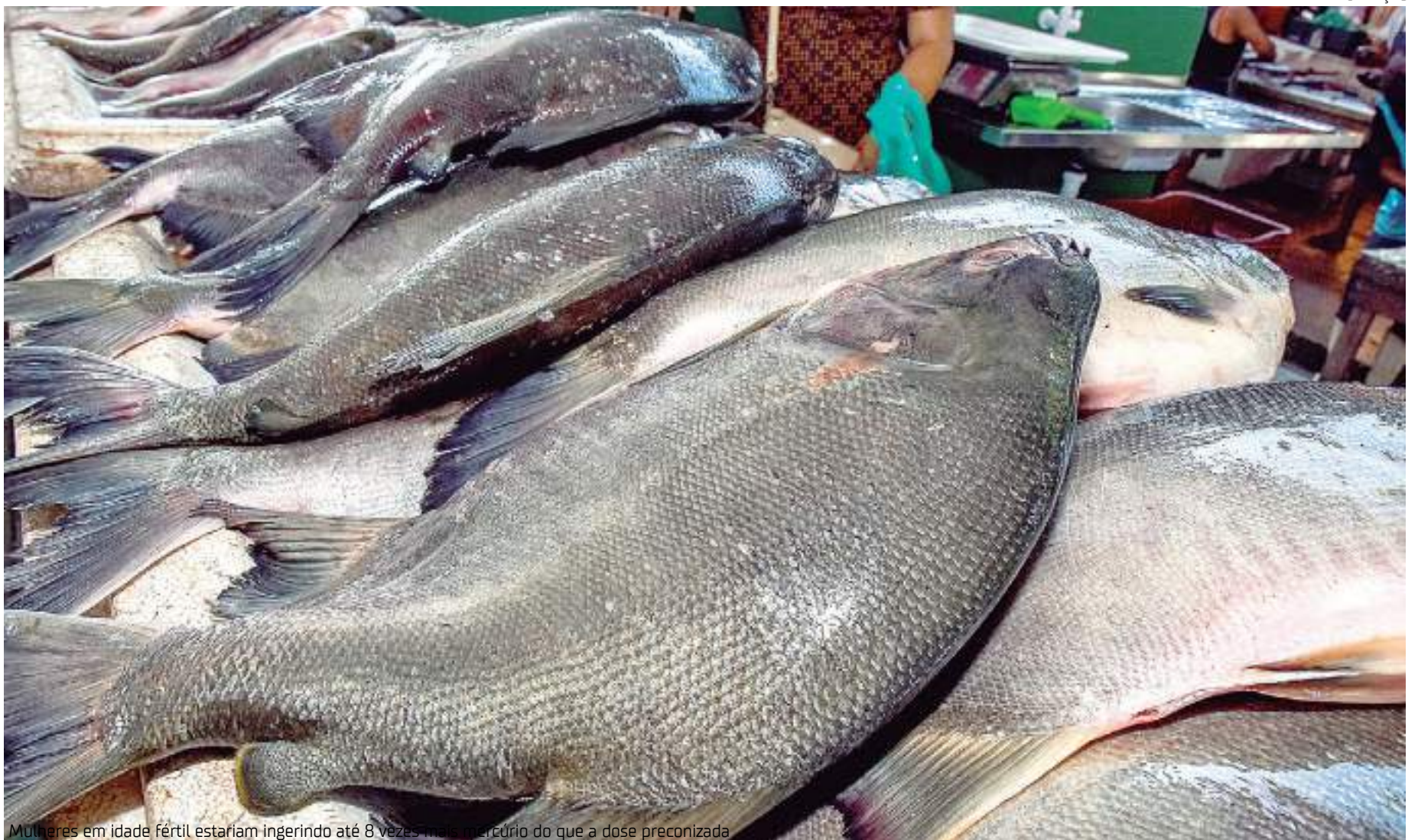
Mulheres em idade fértil estariam ingerindo até 8 vezes mais mercúrio do que a dose preconizada

A quantidade de mercúrio recomendada pela Anvisa é de até 0,5µg (micrograma) por grama de tecido muscular. Entretanto as análises de todos os animais indicaram