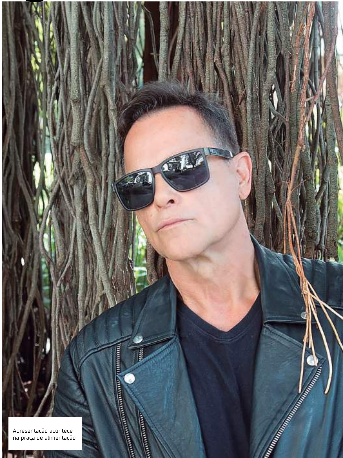
Apresentação acontece na praça de alimentação