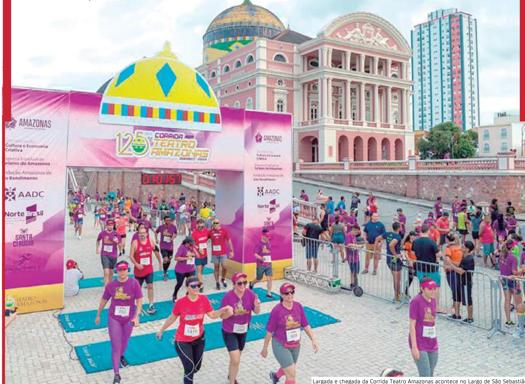
Largada e chegada da Corrida Teatro Amazonas acontece no Largo de São Sebastião

Os atletas que finalizarem o percurso receberão medalha de participação e premiação com troféus para as três primeiras colocações das categorias Geral Individual Masculino/Feminino, Visuais Masculino/Feminino e Cadeirantes. As três equipes com maior número de participantes que finalizarem a prova receberão premiação em dinheiro e troféu.