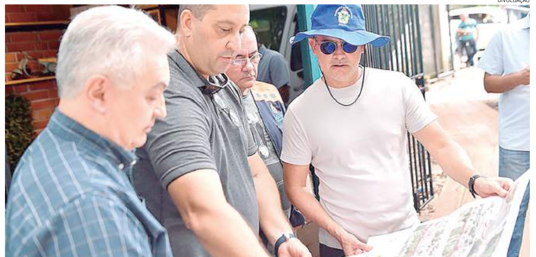
Obra representa investimento de R$ 4 milhões

“Nós vamos privilegiar tanto o ciclista quanto o pedestre e vamos entregar essa obra em seis meses. Além disso, nós