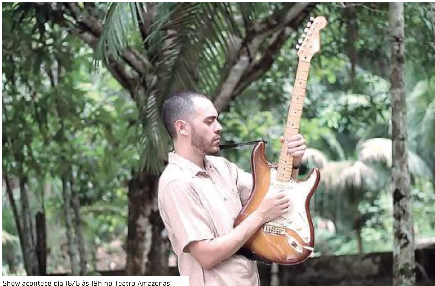
Show acontece dia 18/6 às 19h no Teatro Amazonas

Os amantes de música instrumental já podem adquirir os ingressos para o show O Rugido, que estão à venda na bilheteria do Teatro Amazonas, no site www.shoppingressos.com.br e nos pontos da Maricota's Craft, na Avenida Álvaro Maia, 1246, bairro Praça 14, e Casa Som Amazônia, localizada na Travessa Planalto, No. 3, bairro Parque 10 de Novembro.