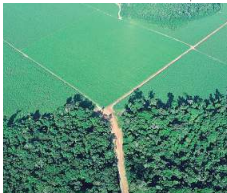
DAS está numa área de aproximadamente 589,3 mil hectares no Amazonas