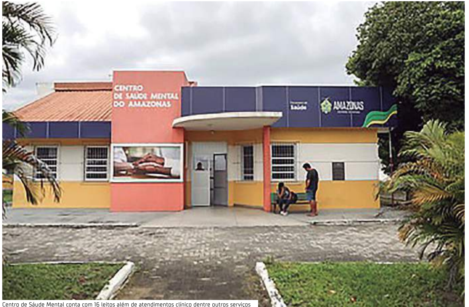
Centro de Saúde Mental conta com 16 leitos além de atendimentos clínico dentre outros serviços