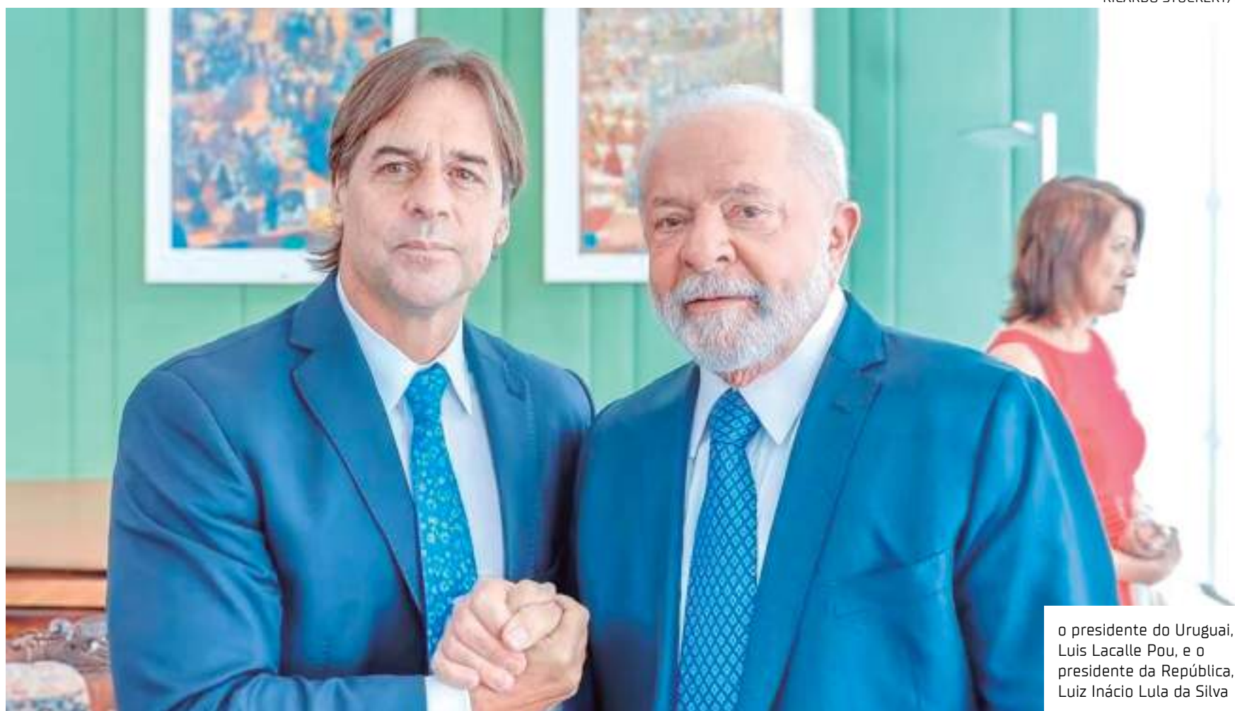
o presidente do Uruguai, Luis Lacalle Pou, e o presidente da República, Luiz Inácio Lula da Silva

O presidente do Uruguai, Luis Lacalle Pou, criticou na terça-feira (30) uma afirmação do presidente Luiz Inácio Lula da Silva (PT) de que a Venezuela é alvo de "narrativas" ideológicas devido ao regime de Nicolás Maduro. Durante a cúpula em Brasília de presidentes de países da América do Sul, Lacalle Pou disse ter ficado "surpreendido" com a declaração de Lula. Segundo o uruguaio, não se pode fechar os olhos para o que acontece na Venezuela.