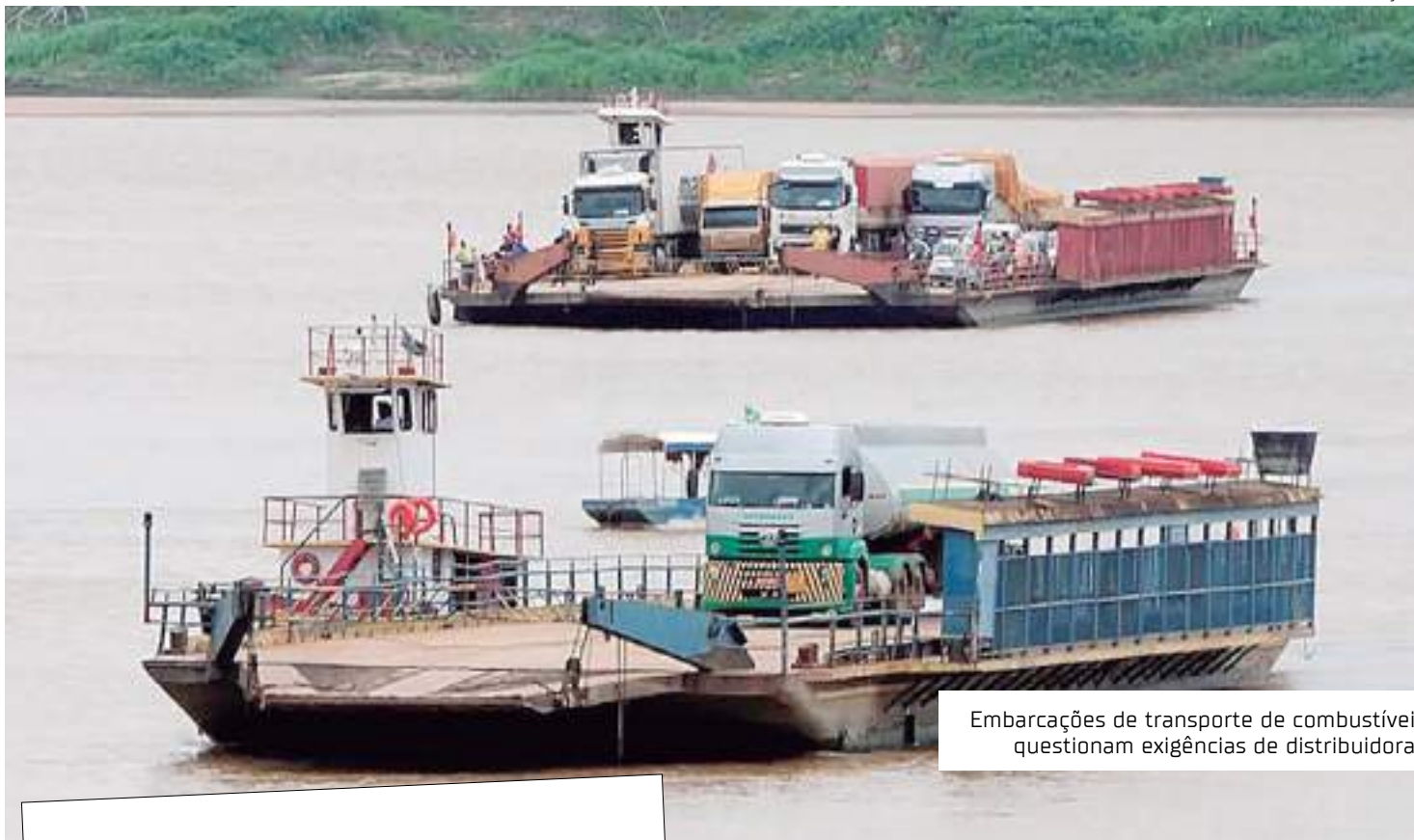
Embarcações de transporte de combustíveis questionam exigências de distribuidoras

Holanda alertou, ainda, que o fato das distribuidoras não aceitarem e reconhecerem