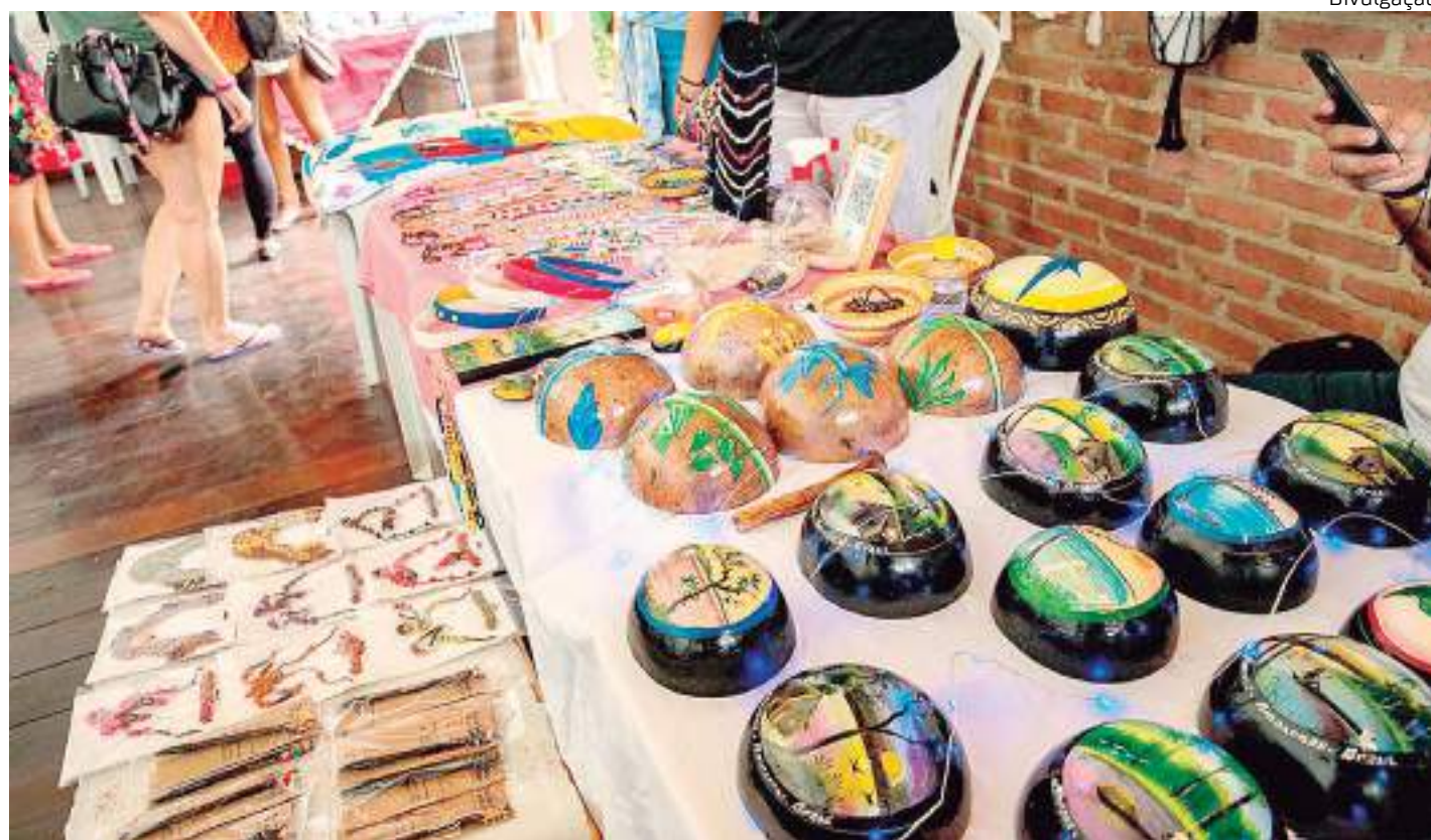
Evento destaca empreendedores da região com expositores indígenas, migrantes e refugiados

Para estimular os visitantes da Feira da FAS para o descarte correto do lixo, a instituição dispõe de um Ponto de Entrega Voluntária (PEV), na sua sede, que recebe resíduos de plástico, vidro, papel, alumínio, entre outros recicláveis, desde que os materiais estejam limpos e secos. A iniciativa faz parte do programa de Gestão de Resíduos e Recursos Hídricos da FAS. A partir das 12h30, ocorrerá uma apresenta-