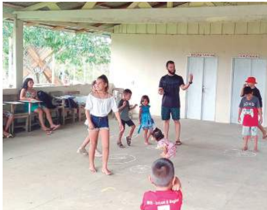
As comunidades contempladas são: Julião e Nossa Senhora do Livramento.

Em segunda fase, serão realizadas oficinas de iniciação teatral gratuitas em quatro comunidades rurais amazonenses. O projeto terá duração de seis meses