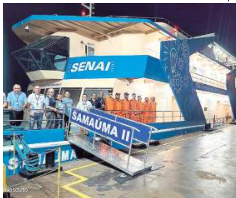
Barco-Escola Samaúma II oferece espaço de qualificação para moradores