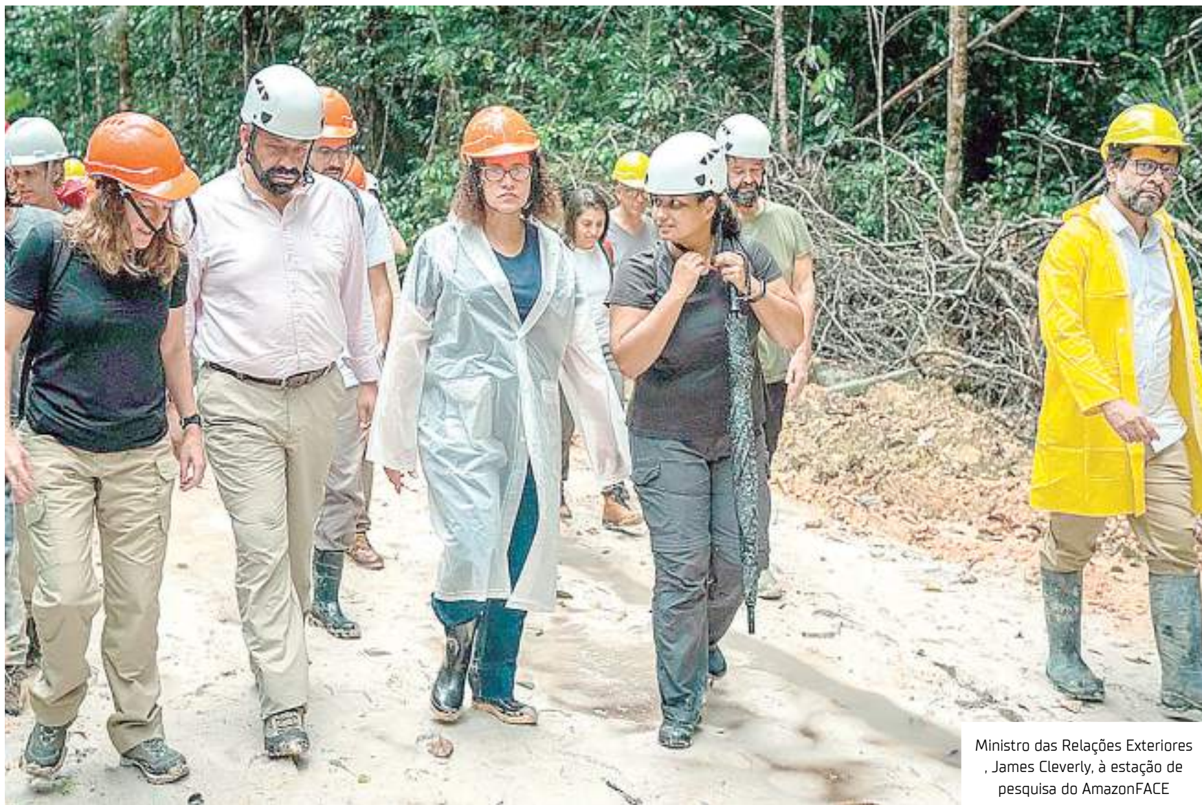
Ministro das Relações Exteriores, James Cleverly, à estação de pesquisa do AmazonFACE

"O AmazonFACE é o principal projeto de cooperação científica entre os dois países. O Reino Unido é o segundo maior parceiro de ciência e tecnologia do Brasil, sendo que nos últimos