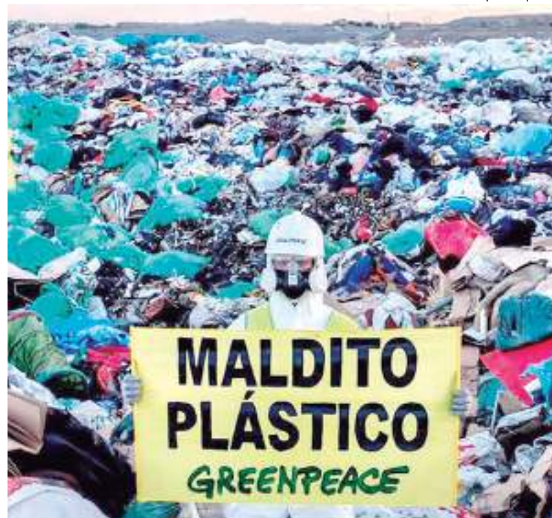
A análise apresentada pelo grupo ambientalista descreve que os plásticos reciclados contêm níveis mais altos de produtos químicos

A Greenpeace não poupou críticas a esta decisão e lembra que o processo de descarte de resíduos plástico e o envio desse lixo produzido pelos países ricos para os países mais pobres "afeta de forma desigual as comunidades mais vulneráveis".