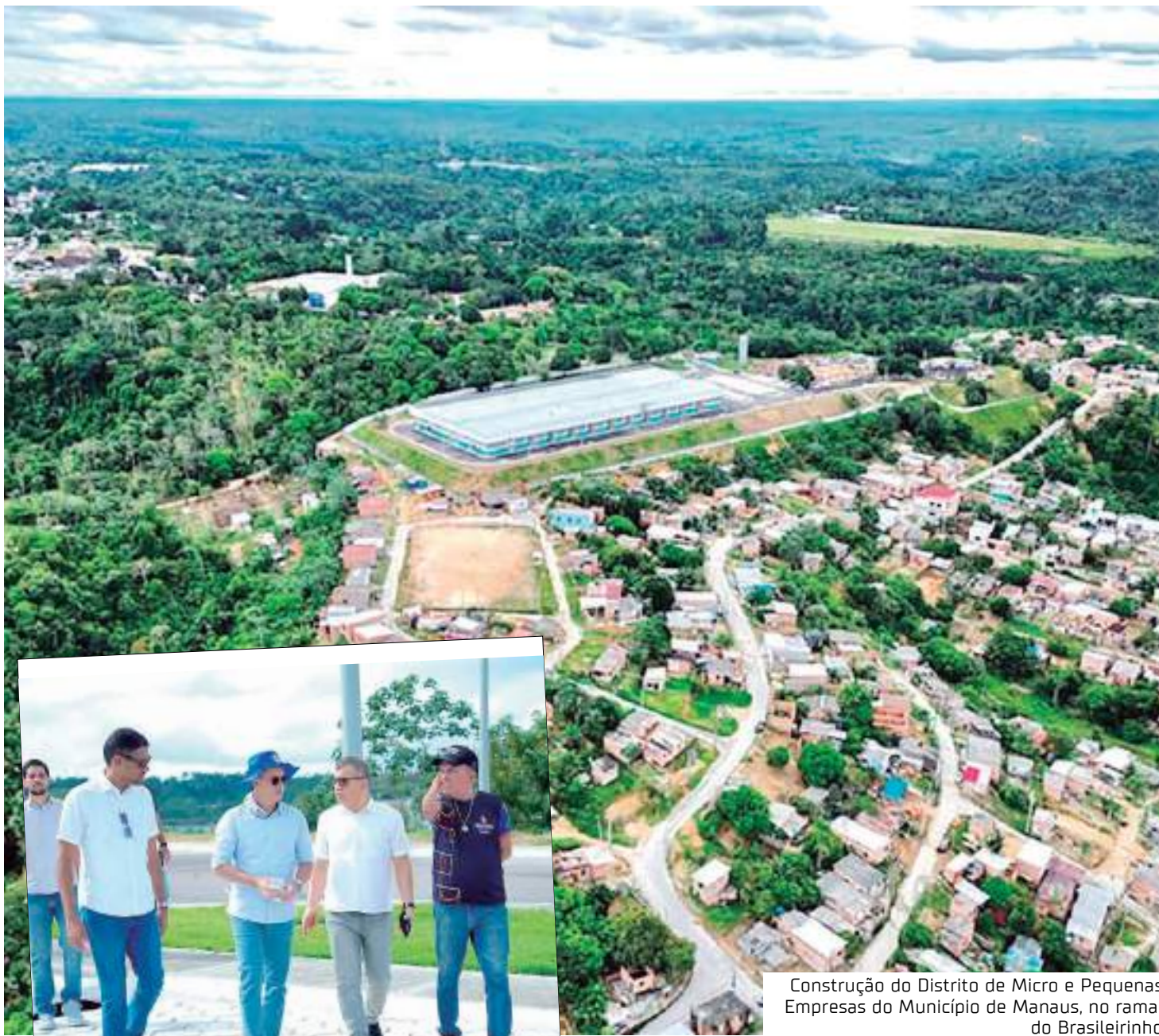
Construção do Distrito de Micro e Pequenas Empresas do Município de Manaus, no ramal do Brasileirinho

"É um espaço fantástico e esperamos que, em junho, possamos, em conjunto com a Prefeitura de Ma-