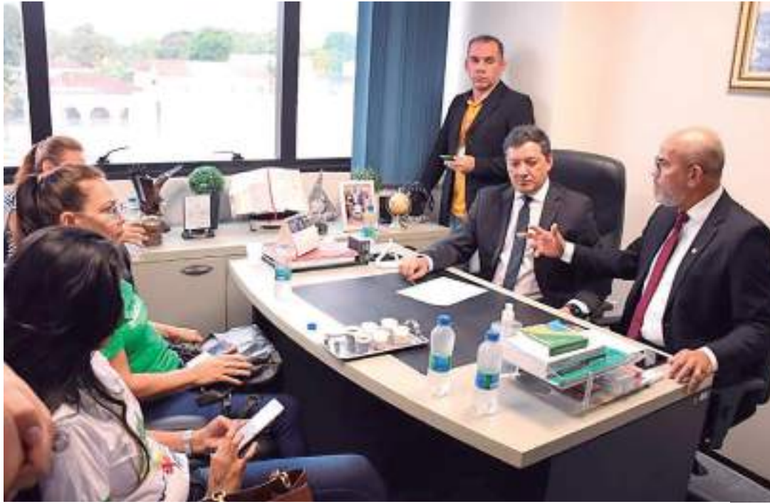
A deputada defendeu uma apuração rigorosa nos casos de violência obstétrica

"Essa cesárea foi adiada várias vezes até que essa mulher começou a correr o risco grave de morte, e mesmo assim ela foi forçada a ter o bebê de forma natural. Isso causou diversas complicações. Foi feito um esforço tão grande que o braço da criança foi quebrado durante o parto. O que é mais estranho: todos os