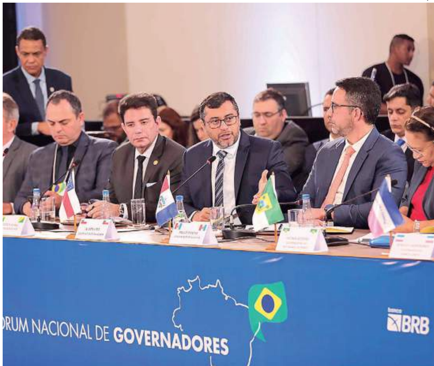
Governador Wilson Lima discursando no Fórum Nacional de Governadores, em Brasília

Participaram da reunião o deputado federal Aguinaldo Ribeiro (PB), relator da matéria na Câmara; e o senador Rodrigo Pacheco (MG), presidente do Senado, além de outros parlamentares – incluindo amazonenses – que integram o grupo de trabalho