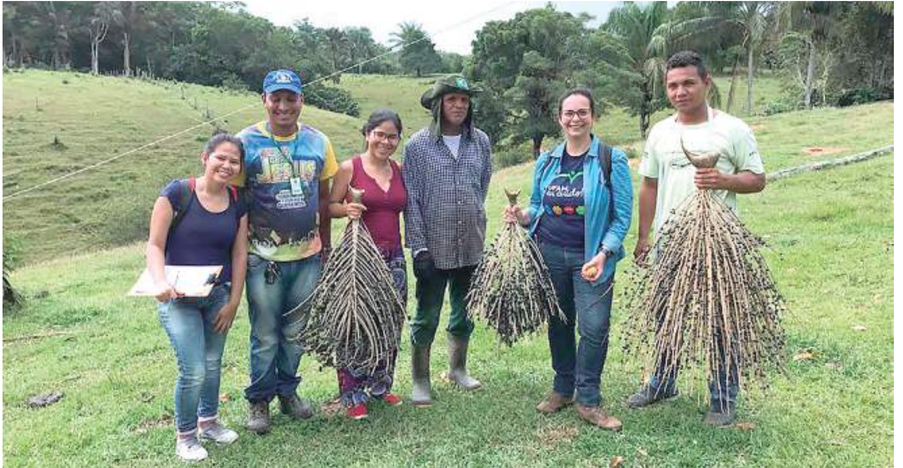
Pesquisa foi realizada em municípios do Médio Solimões

Com isso, as informações disponibilizadas pelo projeto também podem ser usadas para auxiliar medidas de saúde pública, já que doenças reportadas como sendo associadas ao consumo de açaí acontecem devido à falta de cuidado e higiene, durante a manipulação do fruto.