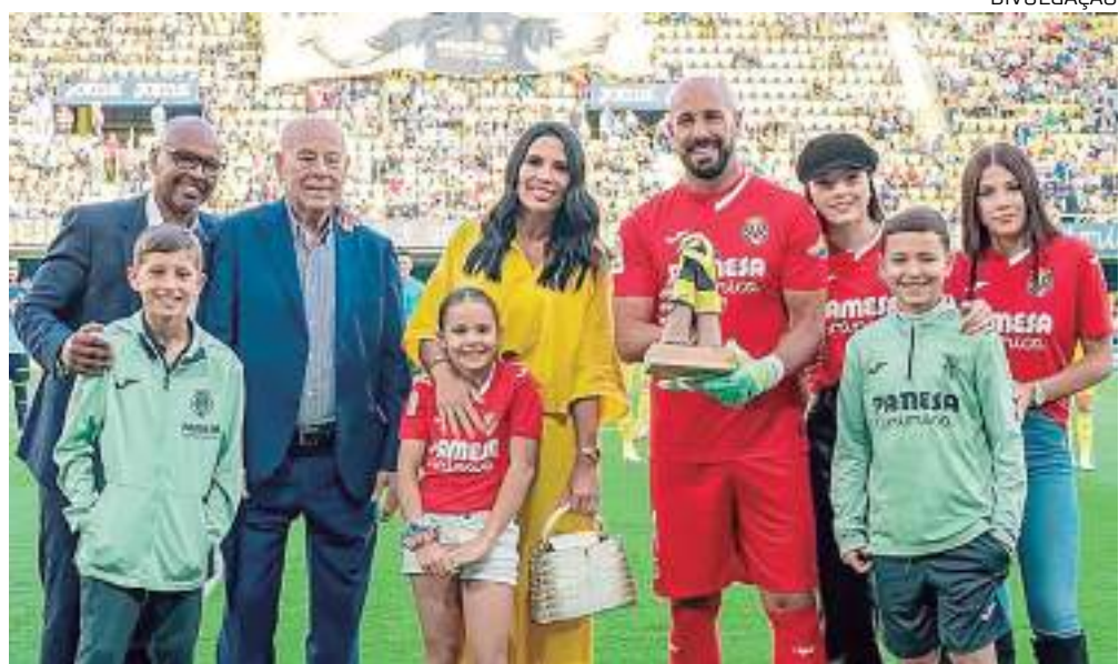
Goleiro chega a mil jogos na carreira e já pensa em ser técnico de futebol