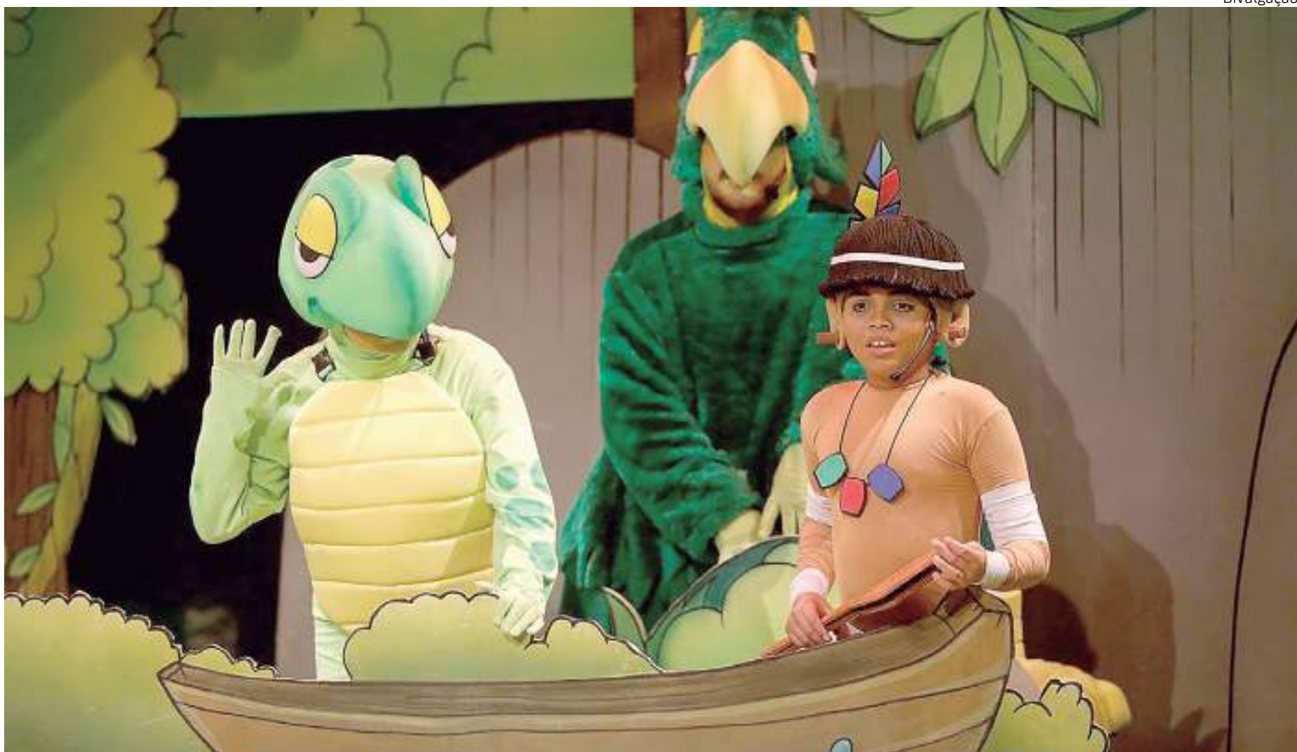
Musical infantil "Curumim, o Último Herói da Amazônia em Busca da Flor da Vida" encerra sua temporada no domingo (28)