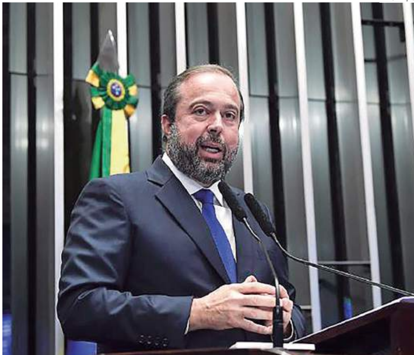
Ministro Alexandre Silveira, de Minas e Energia, participou de audiência na Comissão de Infraestrutura do Senado

No Senado, Alexandre Silveira avaliou como "inadmissível" que a Petrobras não possa "conhecer" as potências minerais a serem exploradas no Brasil. "Quando se fala em transição energética, não tem como se dissociar da mineração, principalmente dos minerais críticos. Nós ainda dependemos dos combustíveis fósseis", afirmou.