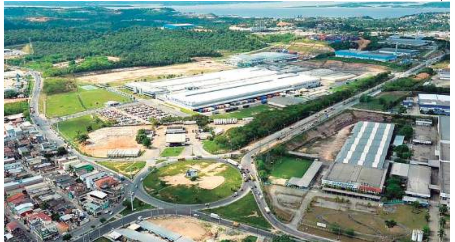
Polo Industrial de Manaus é um dos mais modernos da América Latina

As linhas de produção de aparelhos condicionadores de ar também deram sequência ao desempenho positivo neste início de ano. Os aparelhos do tipo split system registraram, até março, produção de