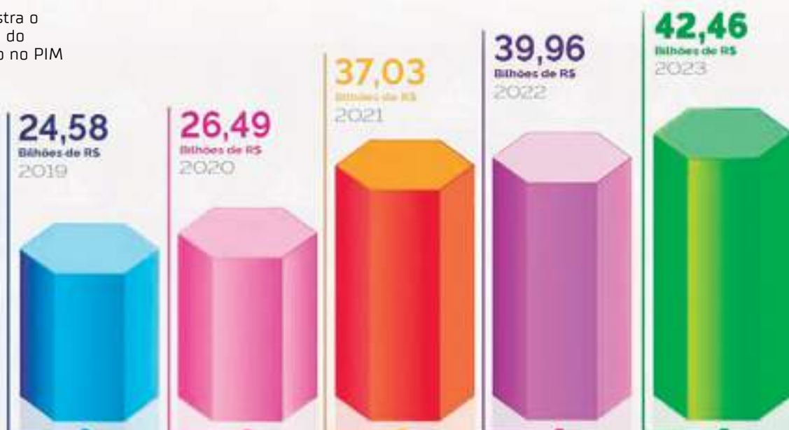
Gráfico registra o crescimento do faturamento no PIM

Fonte: Indicadores de Desenvolvimento do Polo Industrial de Manaus