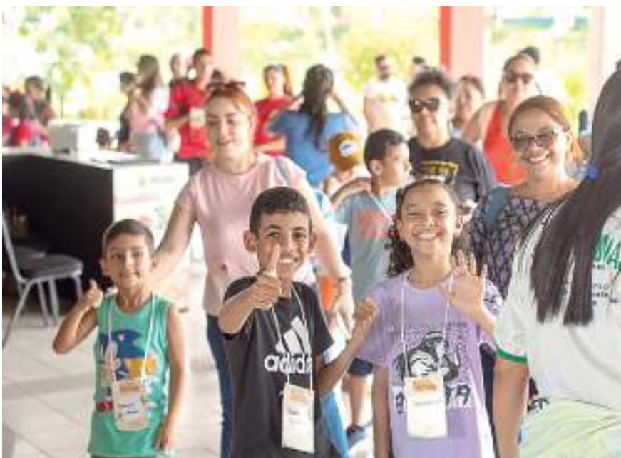
Evento terá programação voltada para crianças a partir de 6 anos

Na sexta-feira (26), as atividades ocorrerão no Centro Cultural dos Povos da Amazônia (avenida Silves, 2.222 – Distrito Industrial