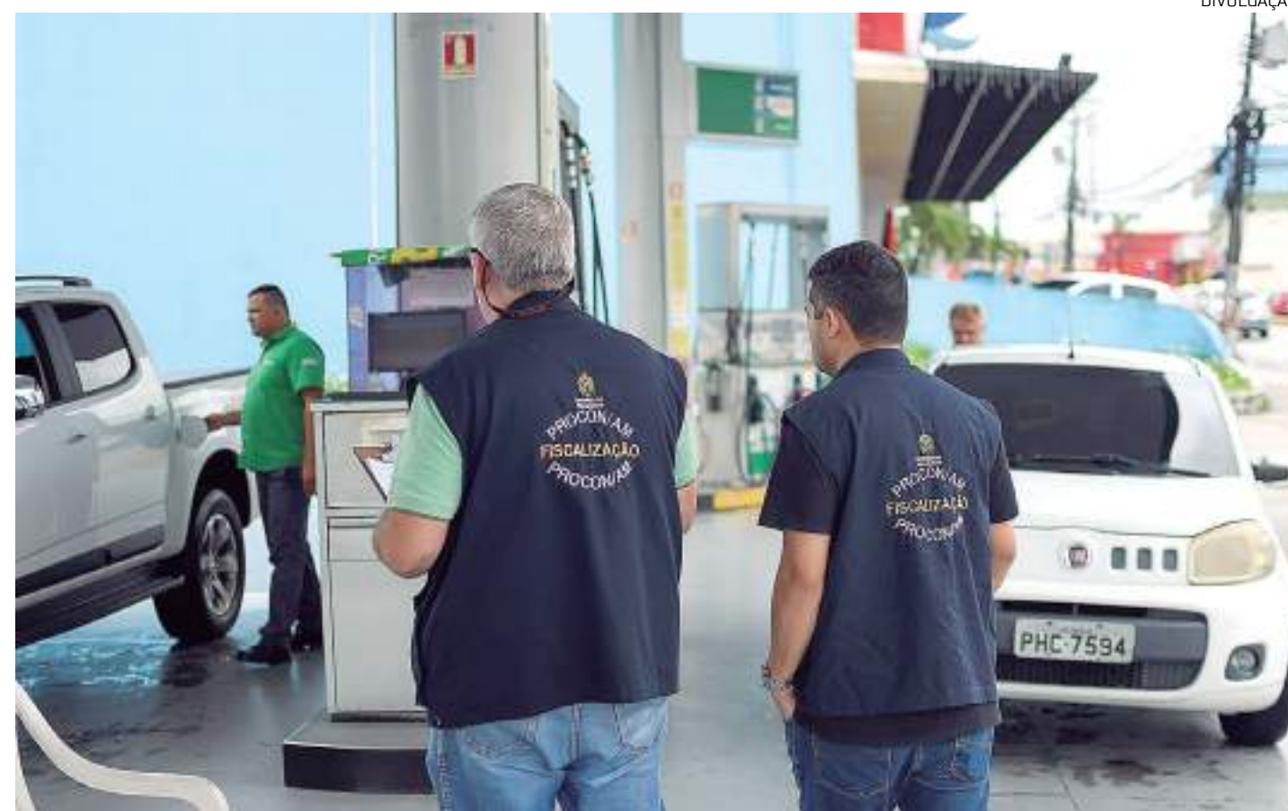
Ação faz parte do “Mutirão do Preço Justo” da Senacon

sificando as fiscalizações, mais de 90 postos até o momento já foram autuados e todos os procedimentos administrativos estão sendo realizados por parte do Procon-AM”, afirmou o diretor-presidente