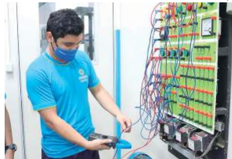
Centro de Ensino Literatus realiza Jornada da Indústria