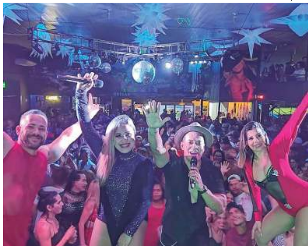
Banda Djavú anima o público manauara no Espaço Via Torres

A expectativa dos amantes do ritmo mais popular do Brasil já é grande para a realização do Festival Só tem Brega. O evento ocorre, neste sábado (6), a partir das 17h, no Espaço Via Torres, na Zona Centro-Sul de Manaus.