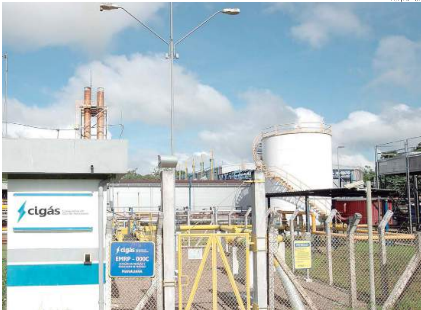
Companhia de Gás do Amazonas atua na distribuição e comercialização do produto

O combustível também tem contribuído para elevar o nível de competitividade de mais de 60 indústrias em razão de seu baixo custo, sendo estas localizadas no Dis-