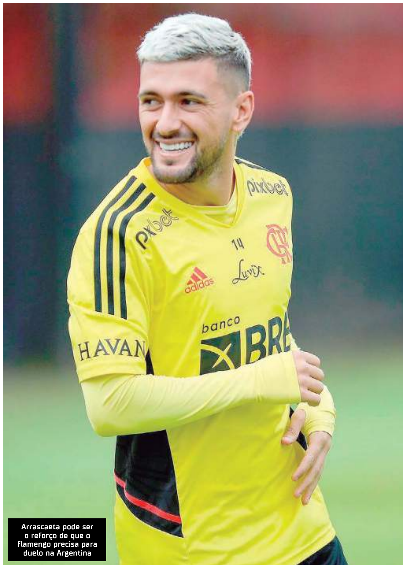
Arrascaeta pode ser o reforço de que o Flamengo precisa para duelo na Argentina

reforçar a delegação, o Flamengo viaja para a Argentina na tarde desta quarta-feira (03). Na quinta (04), o Rubro-Negro encara o Racing a partir das 18h (horário de Manaus), no estádio Presidente Perón, em Avellaneda. Como manda a tradição, o Coluna do Fla comandará a narração mais pé-quente da internet, na voz de Rafa Penido, no YouTube.