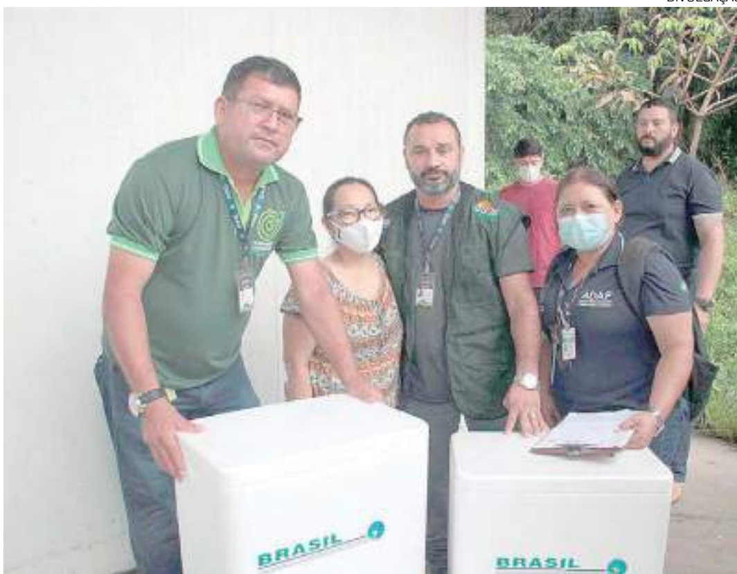
Campanha é resultado de cooperação entre órgãos do Governo do Amazonas

"A vacina é para todo o rebanho, de mamando a caducando, com a dose de 2 ml por animal, que é aplicada na tábua do pescoço". Até o momento, foram distribuídas 224.880 doses de vacinas. Em estoque, atualmente restam