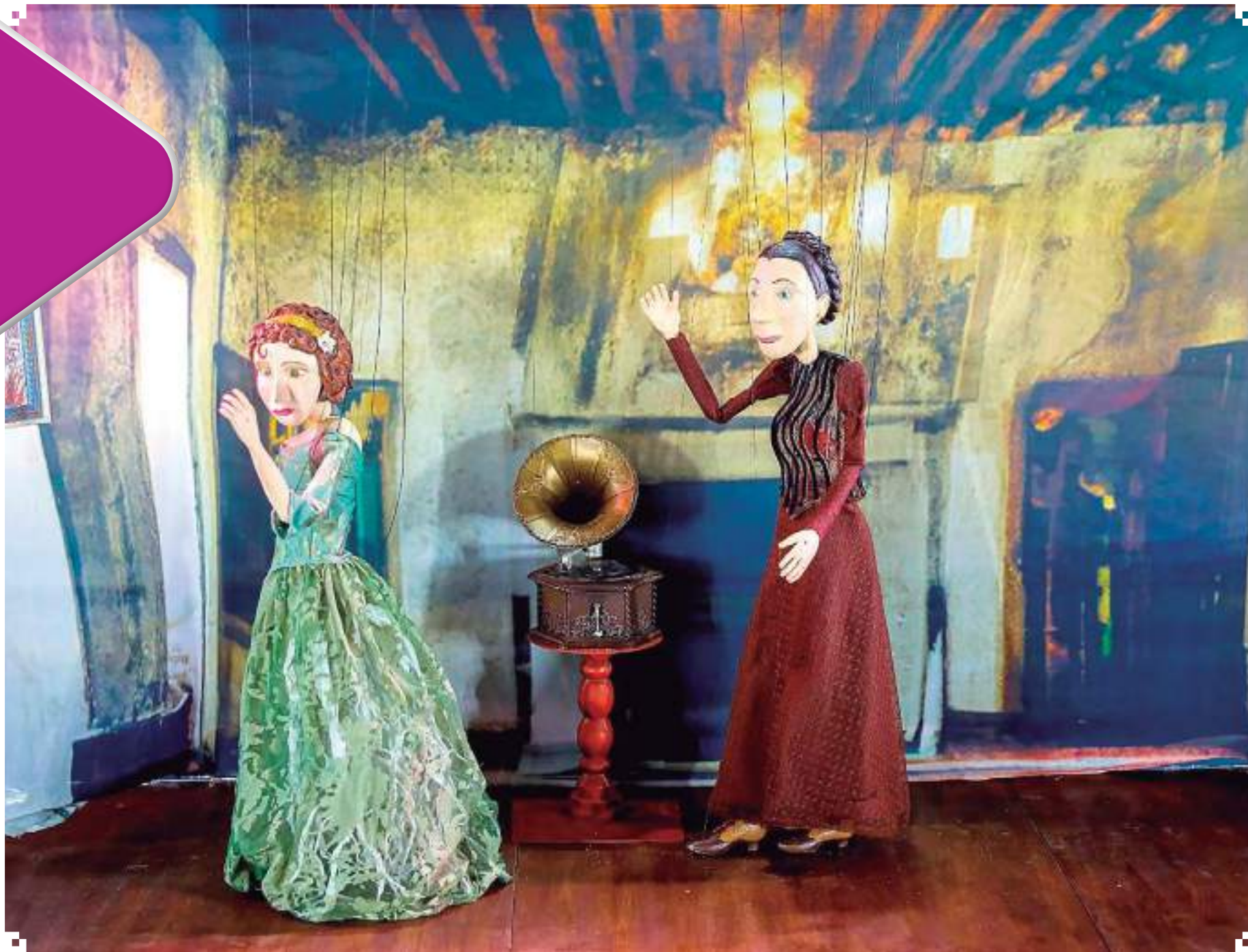
Espetáculo de ópera com marionetes "O Navio Fantasma"

"O governo do Estado tem atuado muito por meio da Secretaria para o desenvolvimento do público infantojuvenil, temos essa missão