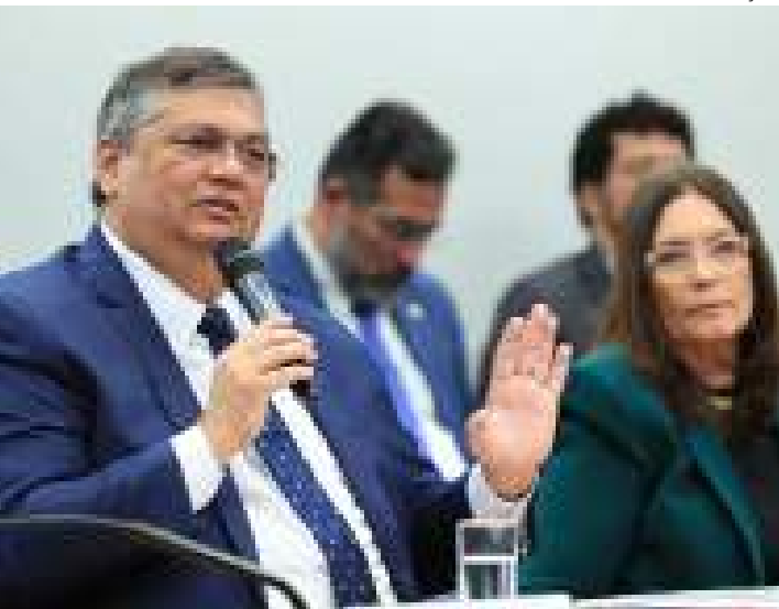
Ministro se refere a fraudes no cartão de vacinação do SUS

Segundo a PF, os investigados se associaram para inserir falsas informações relativas à vacinação contra a covid-19 no Sistema de