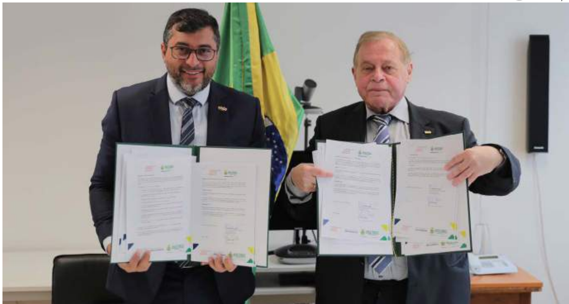
Cooperação entre países busca avanços em uso de energias renováveis e diminuição da emissão de poluentes