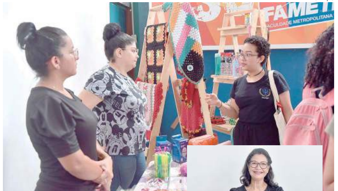
Produtores artesanais atendem público durante feira na instituição Fametro