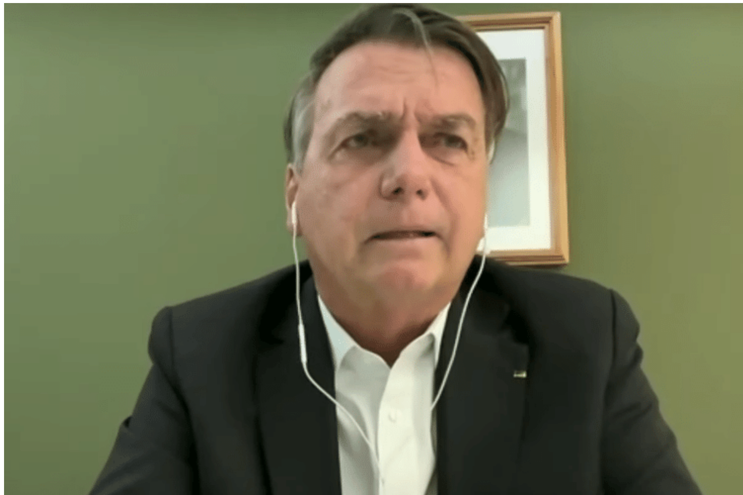
Ex-presidente Jair Bolsonaro concedeu entrevista após ação da PF e reafirmou não ter tomado vacina contra Covid

Estão sendo cumpridos 16 mandados de busca e apreensão e seis mandados de prisão preventiva em Brasília e no Rio de Janeiro. Entre os seis detidos nesta manhã de hoje está o tenente-coronel Mauro Cid, ex-ajudante de ordens do ex-presidente Jair Bolsonaro. A informação foi confirmada pela defesa do ex-assessor.