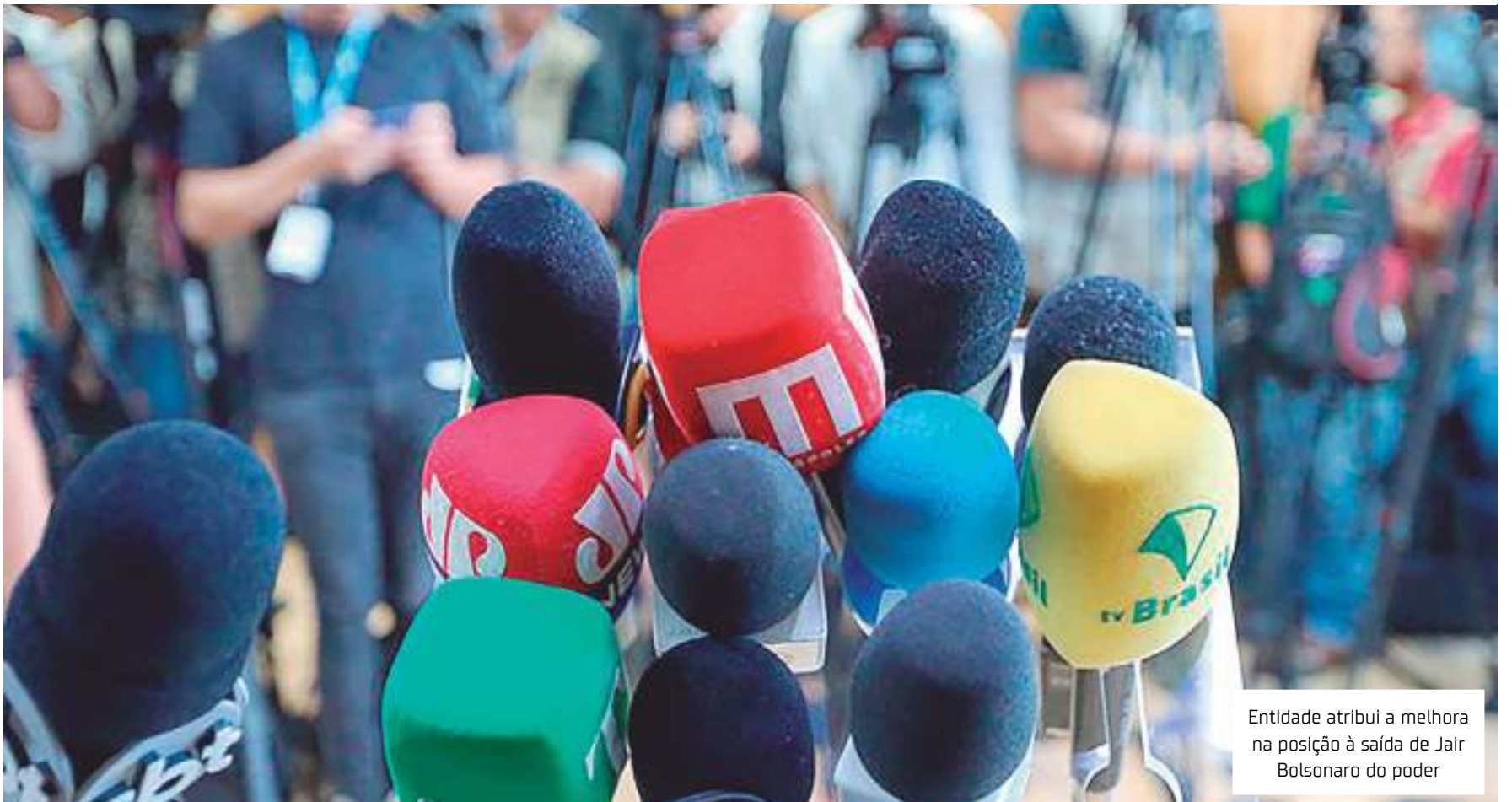
Entidade atribui a melhora na posição à saída de Jair Bolsonaro do poder

"Essa subida de 18 posições do Brasil no ranking é a mais importante de um país no continente americano e uma das mais significativas em nível global. O estudo reflete otimismo em relação à possível volta à normalidade nas relações entre governo e imprensa". O diretor da RSF entende que nos quatro anos do governo anterior as relações foram fragmentadas com um governo "hostil" ao jornalismo de maneira geral.