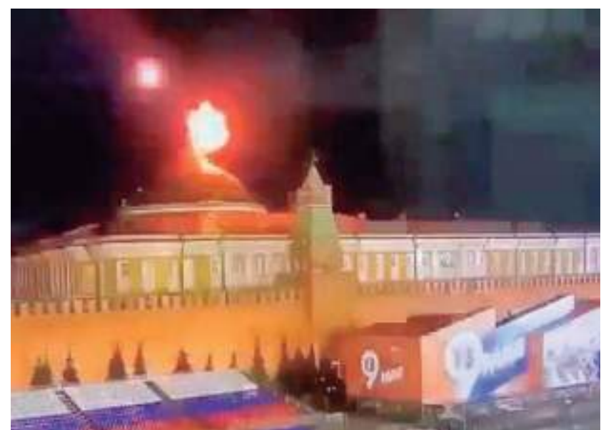
Explosão de um dos drones na sede do governo russo

"O que aconteceu em Moscou obviamente foi planejado para agravar a situação antes de 9 de maio", disse o porta-voz presidencial ucraniano Serhiy Nikiforov. O prefeito de Moscou anunciou na quarta-feira a proibição de voos não autorizados de drones sobre a cidade. Os voos de drone exigiram uma autorização especial do governo, disse Sergei