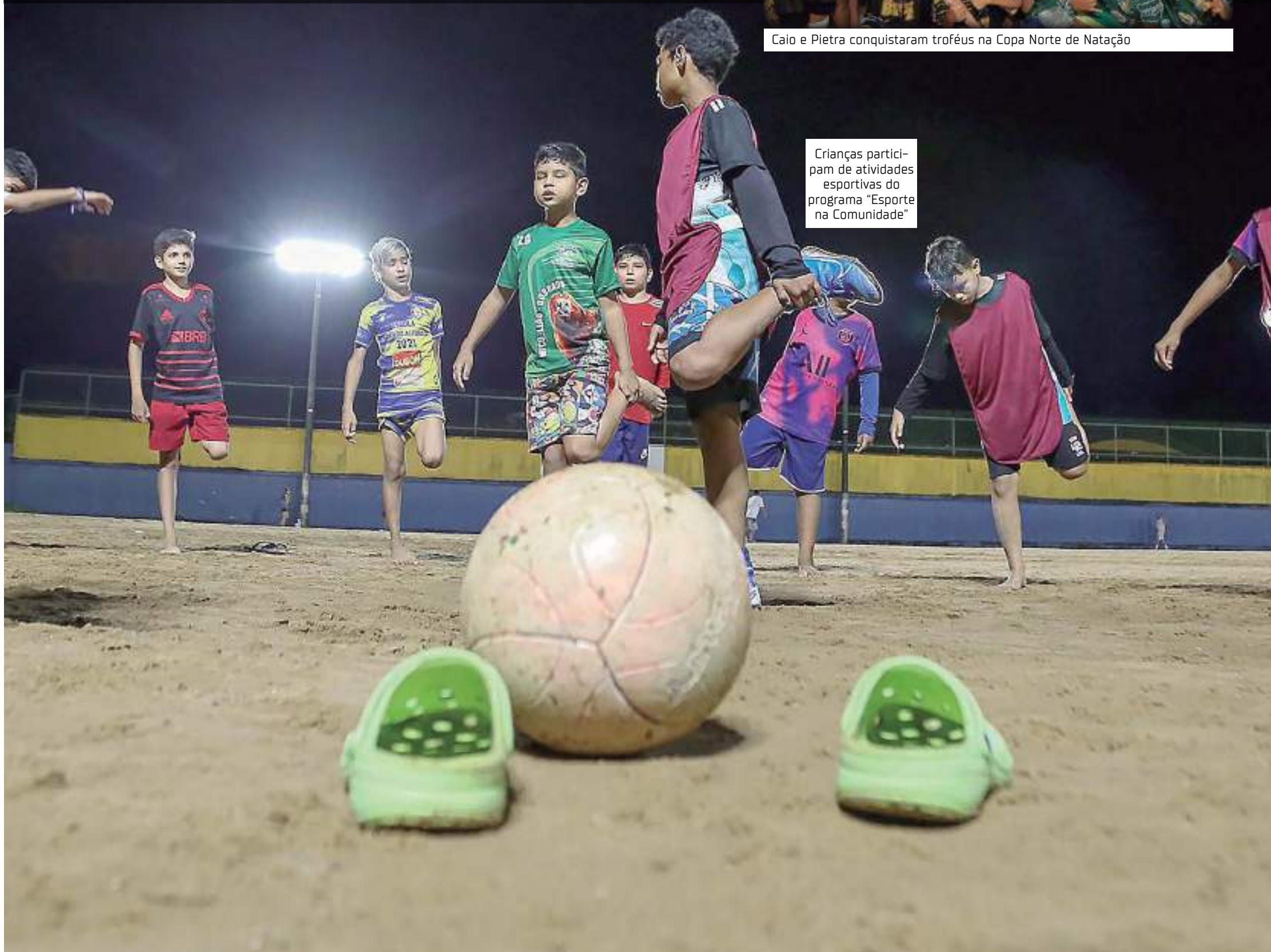
Crianças participam de atividades esportivas do programa "Esporte na Comunidade"