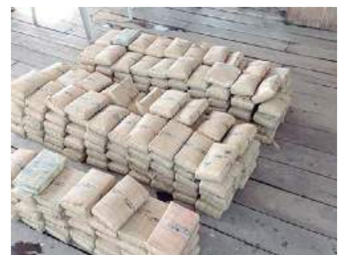
Material ilícito foi encontrado escondido em assentos

A Polícia Militar orienta a população que, ao tomar conhecimento de ações criminosas, informe imediatamente por meio do disque-denúncia 181, ou do 190.