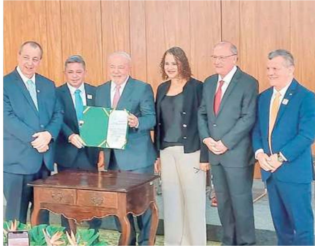
Presidente Lula resolve impasse de mais de 20 anos e oficializa a personalidade jurídica do CBA

"A nova identidade jurídica do CBA permitirá resolver uma disfunção na Amazônia. É assinado, na verdade, uma