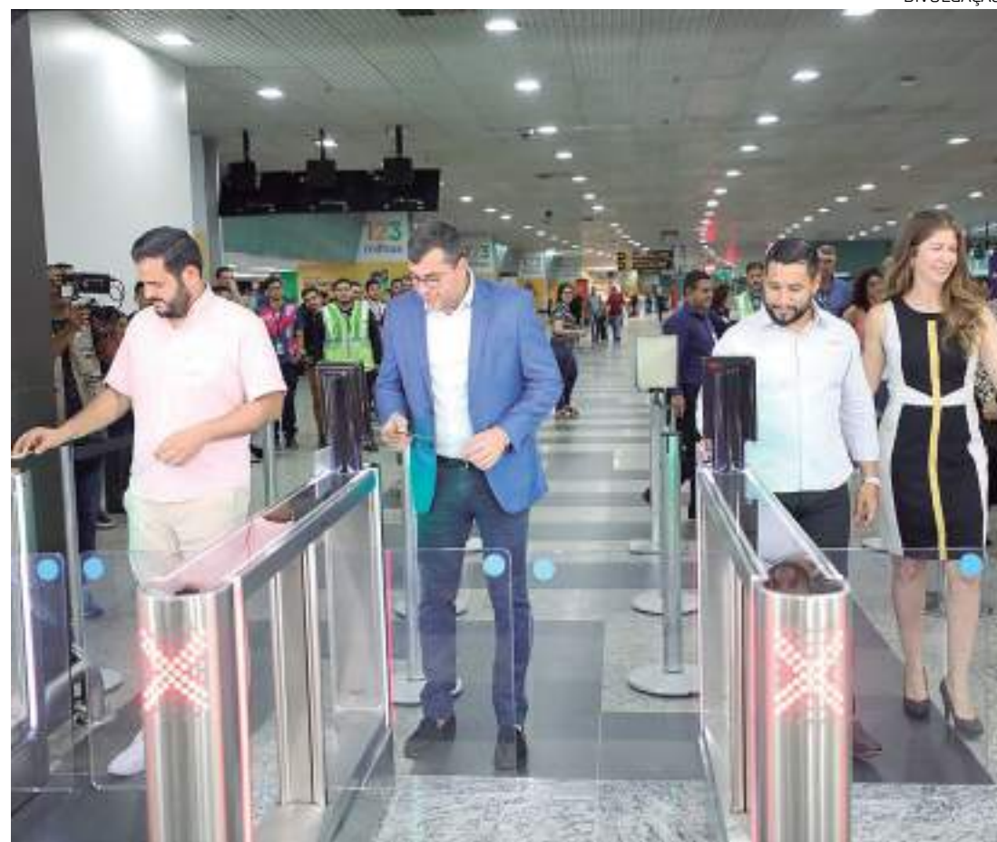
Moderno sistema automatizado foi implantado e governador projeta ainda mais avanços

esse tempo em solo da aeronave possa ser otimizado e haja esse trabalho não só dos funcionários, mas também que haja a estrutura necessária para dar as condições para que o passageiro possa fazer isso. A gente tem trabalhado para que o aeroporto de Manaus seja um hub da Ama-