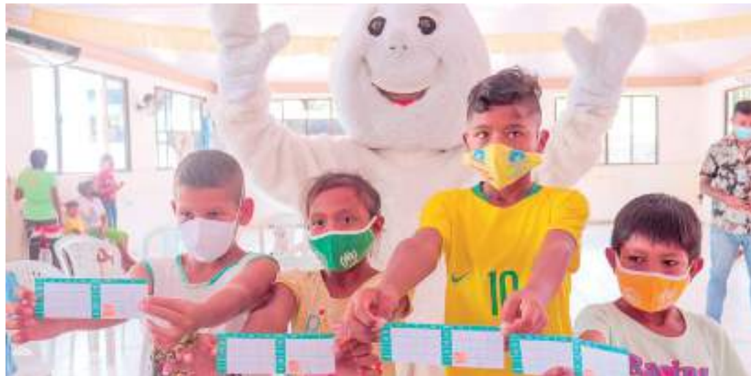
Crianças atualizam o cartão vacinal durante campanha em Manaus

"Essa campanha nacional está se iniciando de forma antecipada aqui no Amazonas, após a confirmação de um caso de poliomielite registrado no Peru, país que faz fronteira com os dois Estados, no último mês de