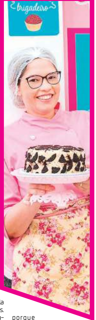
Confeitaria Esther Reis da Bolo da Mãe

única em uma sala com vários homens. Hoje, já existem outras mulheres atuando nesse mercado e ganhando destaque. Sobre o preconceito e as dificuldades, elas sempre vão existir. Creio que se você sabe quem você é de onde veio e o que realmente, não tem nada que faça você paralisar", declarou.