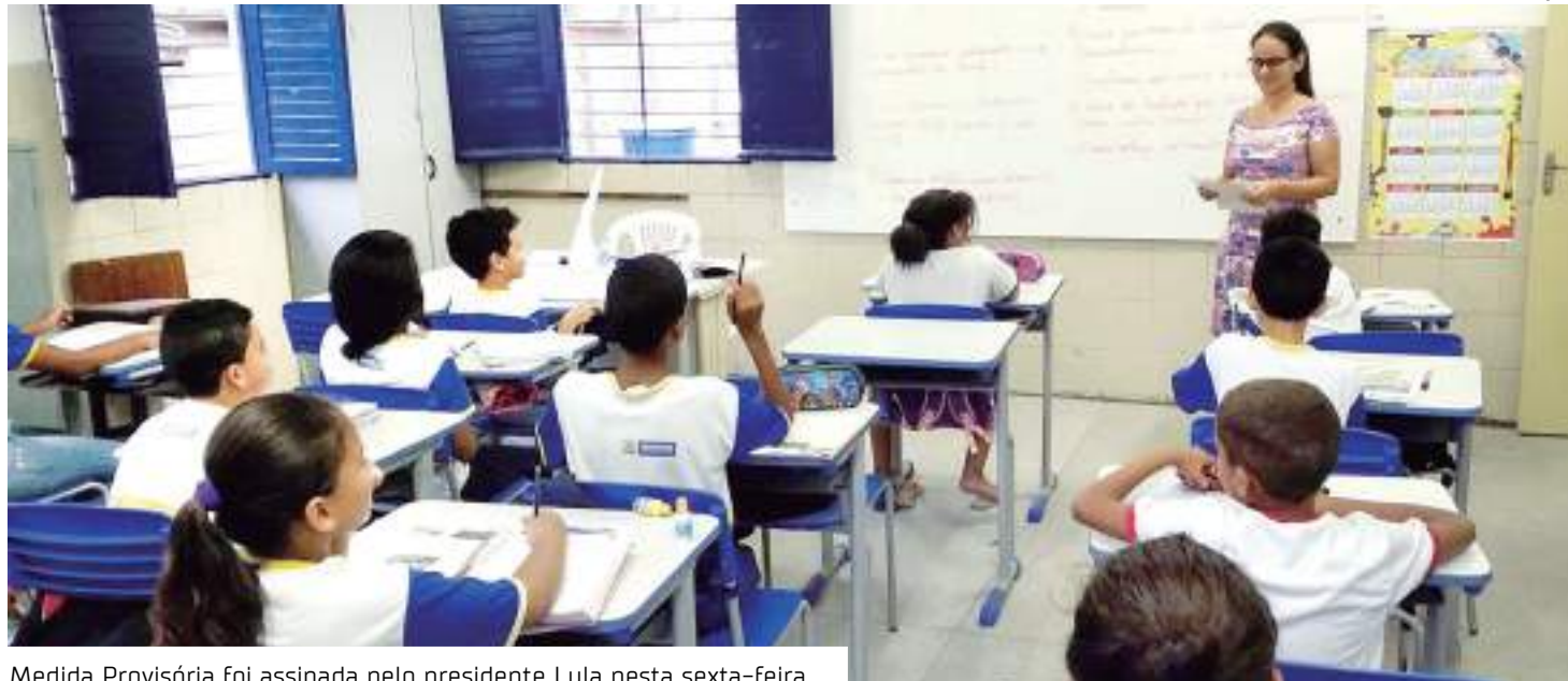
Medida Provisória foi assinada pelo presidente Lula nesta sexta-feira

O anúncio ocorreu no Centro de Eventos do Ceará, em Fortaleza. Antes, Lula visitou