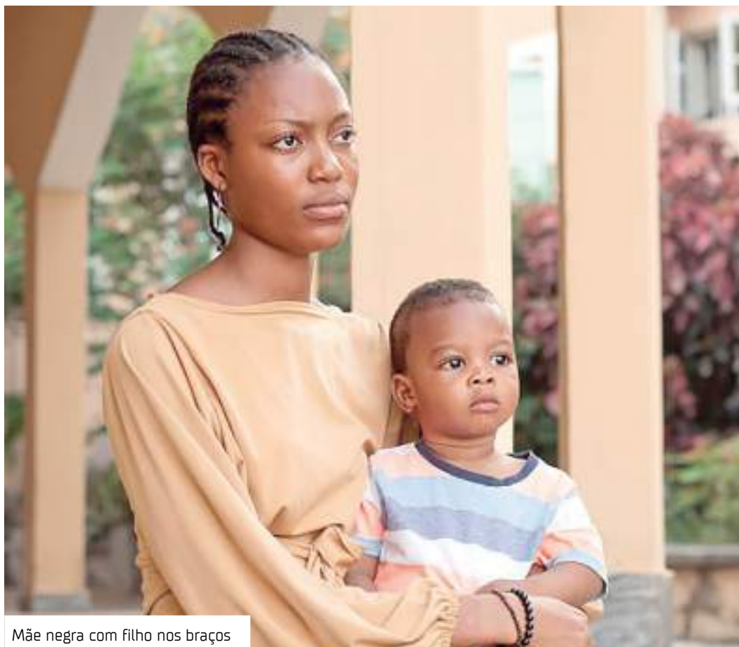
Mãe negra com filho nos braços

"Eu digo para você que é bastante complicado. O pai dá só o básico. A pensão alimentícia, só aquele básico