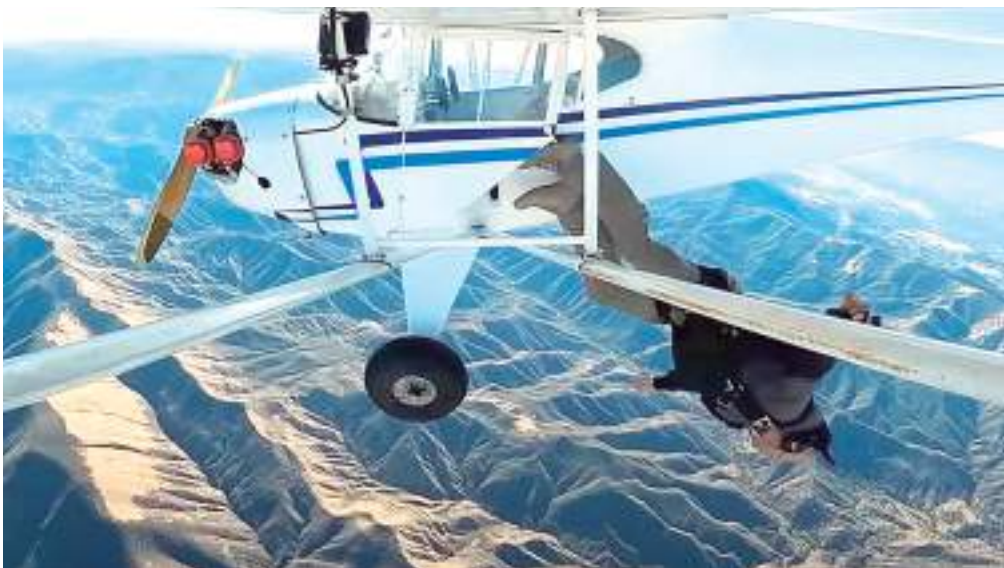
Trevor Jacob saltou de paraquedas de um voo solo, na Califórnia, em 2021