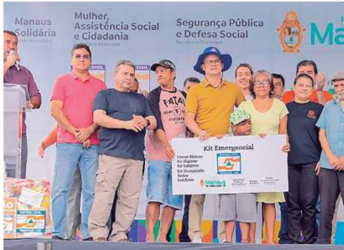
Chefe do Executivo municipal explicou que essa nova etapa é realizada com recurso federal

"Esses recursos são do governo federal. Estamos doando esses kits, em nome do governo federal, para essas famílias que foram afetadas em decorrência das fortes chuvas do dia 12 de março, que nos