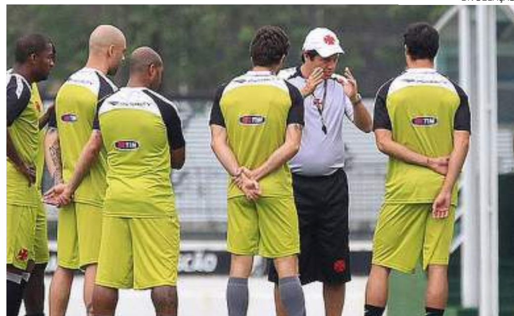
Time do Vasco realizou treino leva para duelo com o Santos no domingo (14)