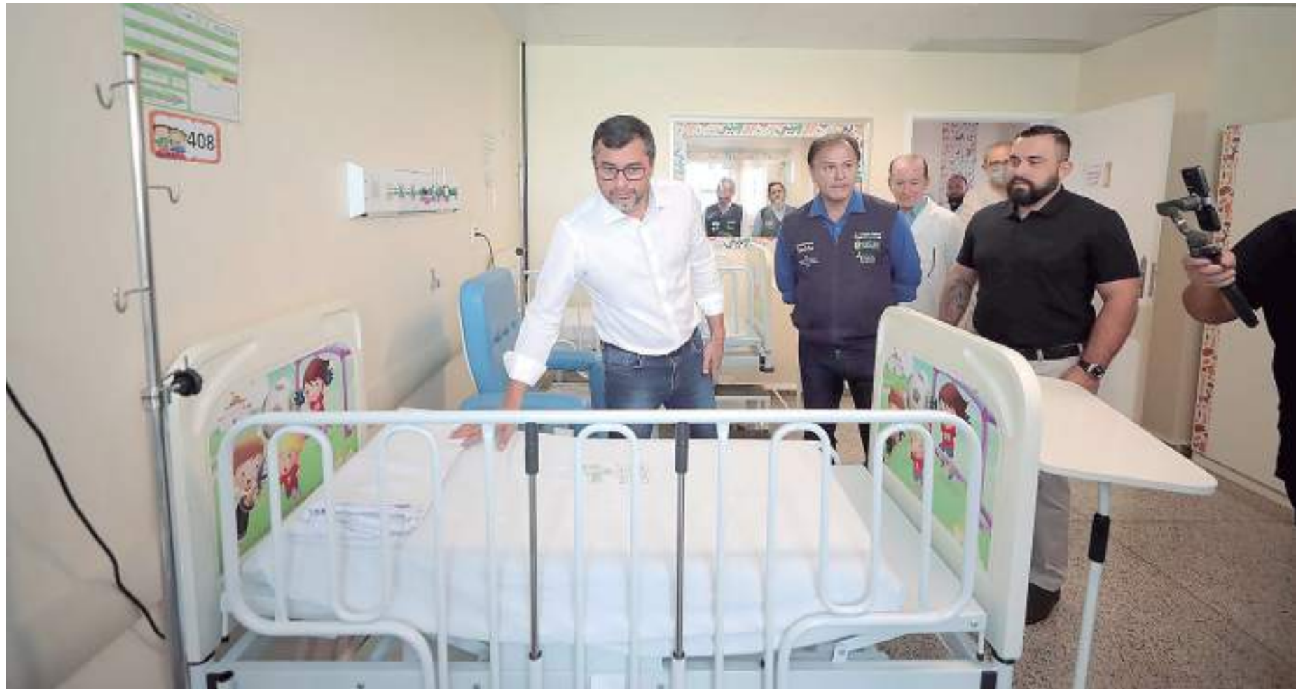
Entrega dos novos leitos foi feita durante visita do governador ao Hospital Universitário Getúlio Vargas (HUGV)

“É uma determinação do governador Wilson Lima, e já tem alguns meses, de ampliar o atendimento pediátrico, e