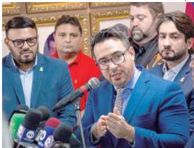
Vereadores comemoraram o resultado da CPI

Com a conclusão, a CPI conquistou a redução de 25% da cobrança da taxa de esgoto pelos próximos quatro anos,