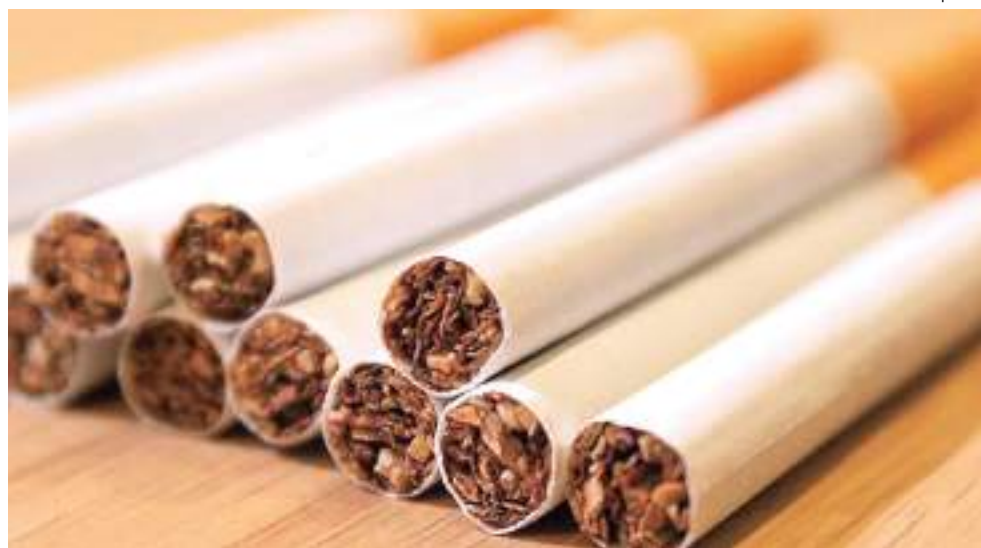
Relatório alerta para riscos à saúde de quem cultiva a planta