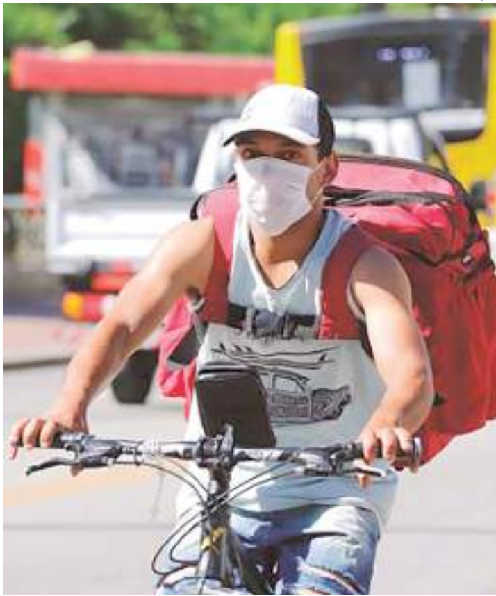
51% das mulheres e 56% dos pretos e pardos estão na informalidade

Segundo a pesquisa Empregabilidade Jovem Brasil,