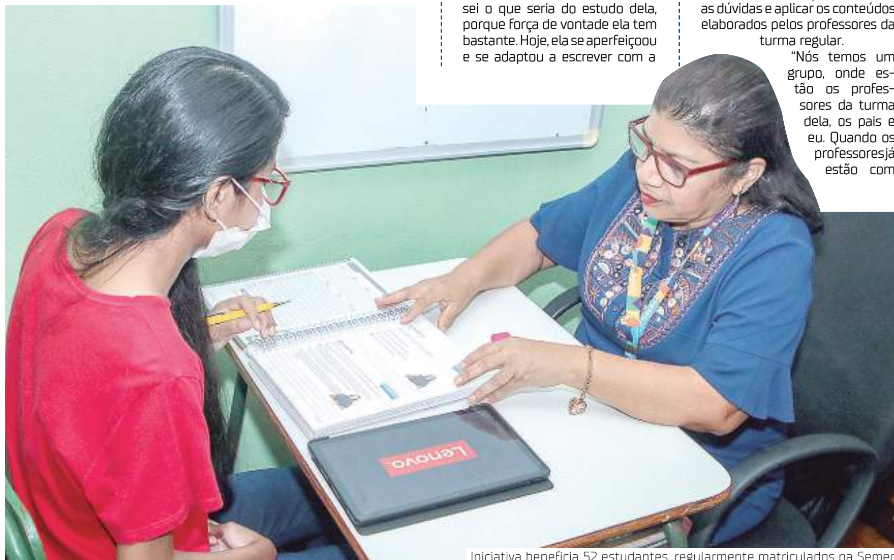
Iniciativa beneficia 52 estudantes, regularmente matriculados na Semed

Para solicitar atendimento domiciliar educacional é necessário que o estudante possua laudo médico, com recomendação ao atendimento domiciliar ou hospitalar. As informações relacionadas à frequência e rendimento dos estudantes, envolvidos nesse projeto, no Sistema Integrado de Gestão Educacional do Amazonas (Sigeam) é de responsabilidade da unidade de ensino onde o aluno esteja regularmente matriculado.