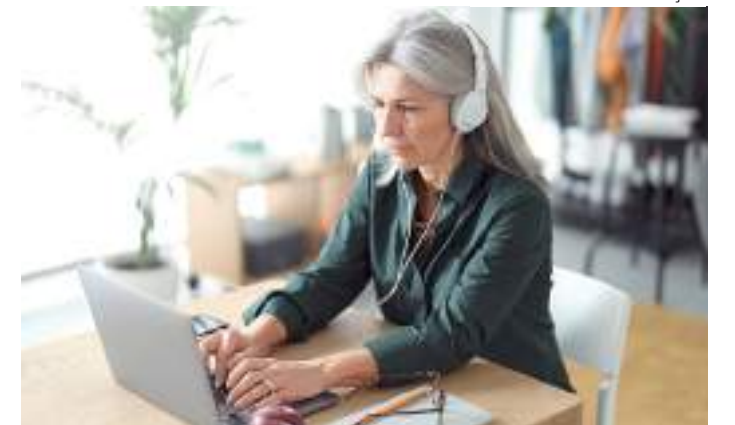
Idosa pode pagar contas atrasadas no computador

“Em geral, nota-se um aumento na proporção de pessoas idosas em relação à população total e, por consequência, um número absoluto maior de pessoas mais velhas em qualquer tipo de situação, inclusive de inadimplência”, analisa Luiz Rabi, economista-chefe da Serasa Experian. “Ao mes-