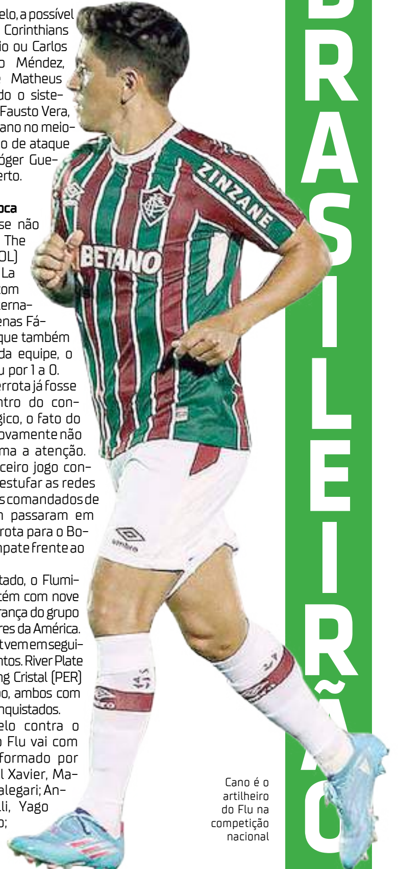
Cano é o artilheiro do Flu na competição nacional

Para o duelo contra o Corinthians, o Flu vai com time titular, formado por Fábio; Samuel Xavier, Manoel, Nino e Calegari; André, Martinelli, Yago Felipe e Ganso; Arias e Cano.