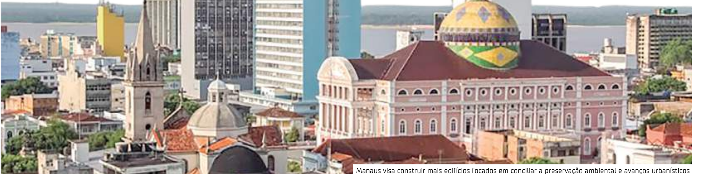
Manaus visa construir mais edifícios focados em conciliar a preservação ambiental e avanços urbanísticos

O programa ajudará Manaus a comunicar as virtudes de projetar e construir edifícios verdes e trilhar o caminho para os prédios zero carbono, além de treinar desenvolvedores e suas equipes no licenciamento e certificação. A colaboração entre o setor público e o setor privado é fundamental para transformar o mercado, ambos investindo no futuro.