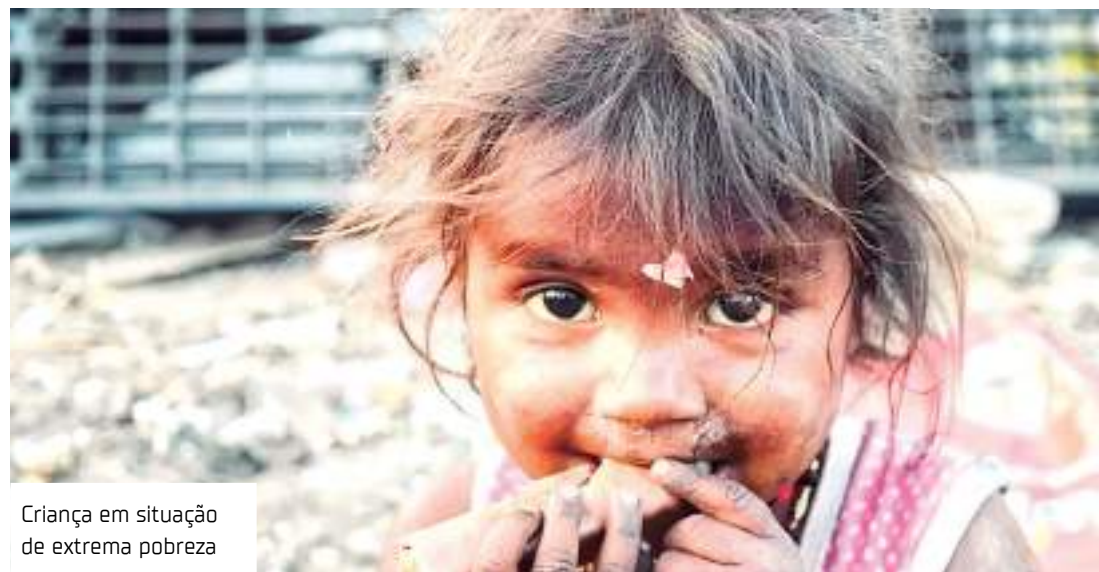
Criança em situação de extrema pobreza

Em 2022, o Segundo Inquérito Nacional sobre Insegurança Alimentar no Contexto da Pandemia de Covid-19 no Brasil apontou que 33,1 milhões de pessoas não têm garantido o que comer, o que representa 14 milhões de novos brasileiros em situação de fome. Conforme o estudo, mais da metade (58,7%) da população brasileira convive com a insegurança alimentar em algum grau: leve, moderado ou grave.