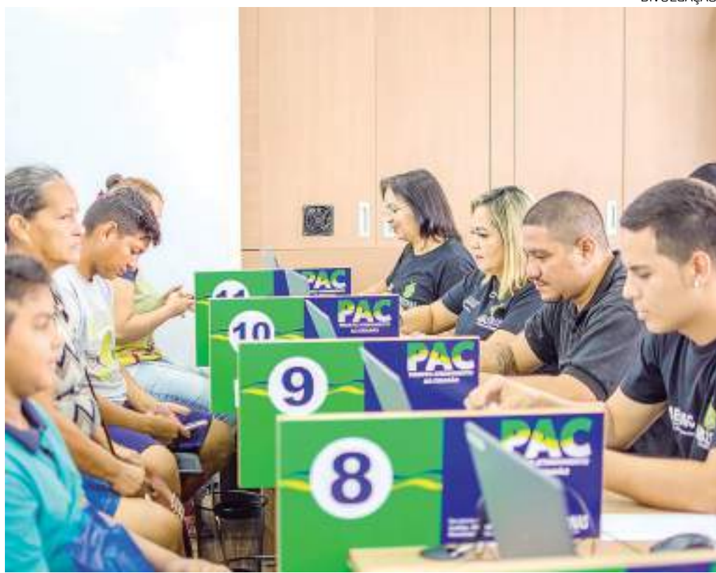
Espaços começam a atender nos novos endereços na segunda-feira (29/05)