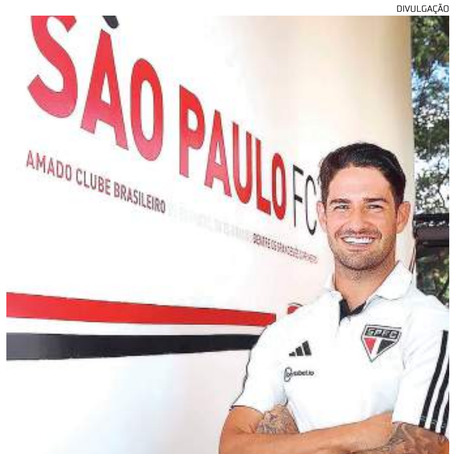
Atacante Alexandre Pato mais vai uma vez para o Tricolor Paulista

O atacante teve passagens no clube do Morumbi entre 2013 e 2015, e retornou em 2019, deixando a equipe em agosto de 2020. Somando suas duas passagens pelo time, disputou 136 jogos, com 47 gols marcados e 18 assistências.