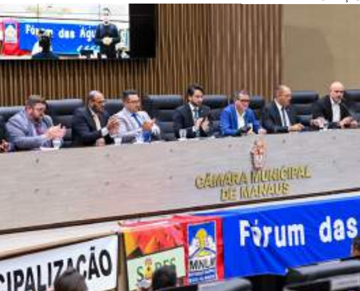
Audiência da CPI da Águas de Manaus realizada no Plenário Adriano Jorge