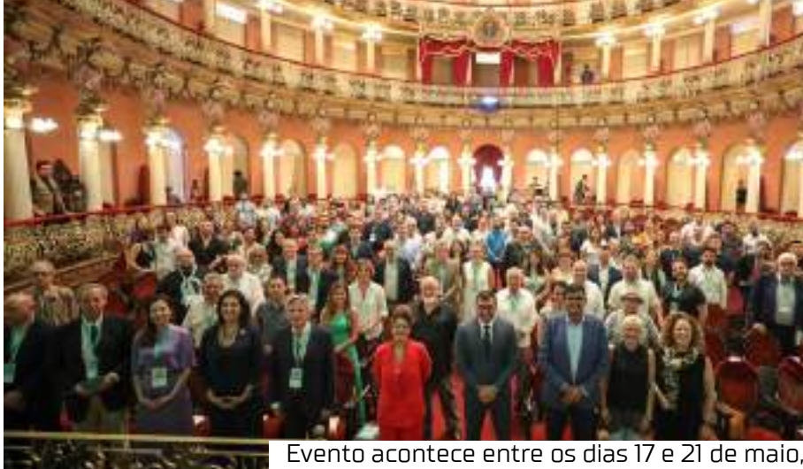
Evento acontece entre os dias 17 e 21 de maio, no Centro Cultural Palácio da Justiça

Participam do evento representantes da Funarte, da Academia Brasileira de Música, do BID e de casas de ópera ibero-americanas