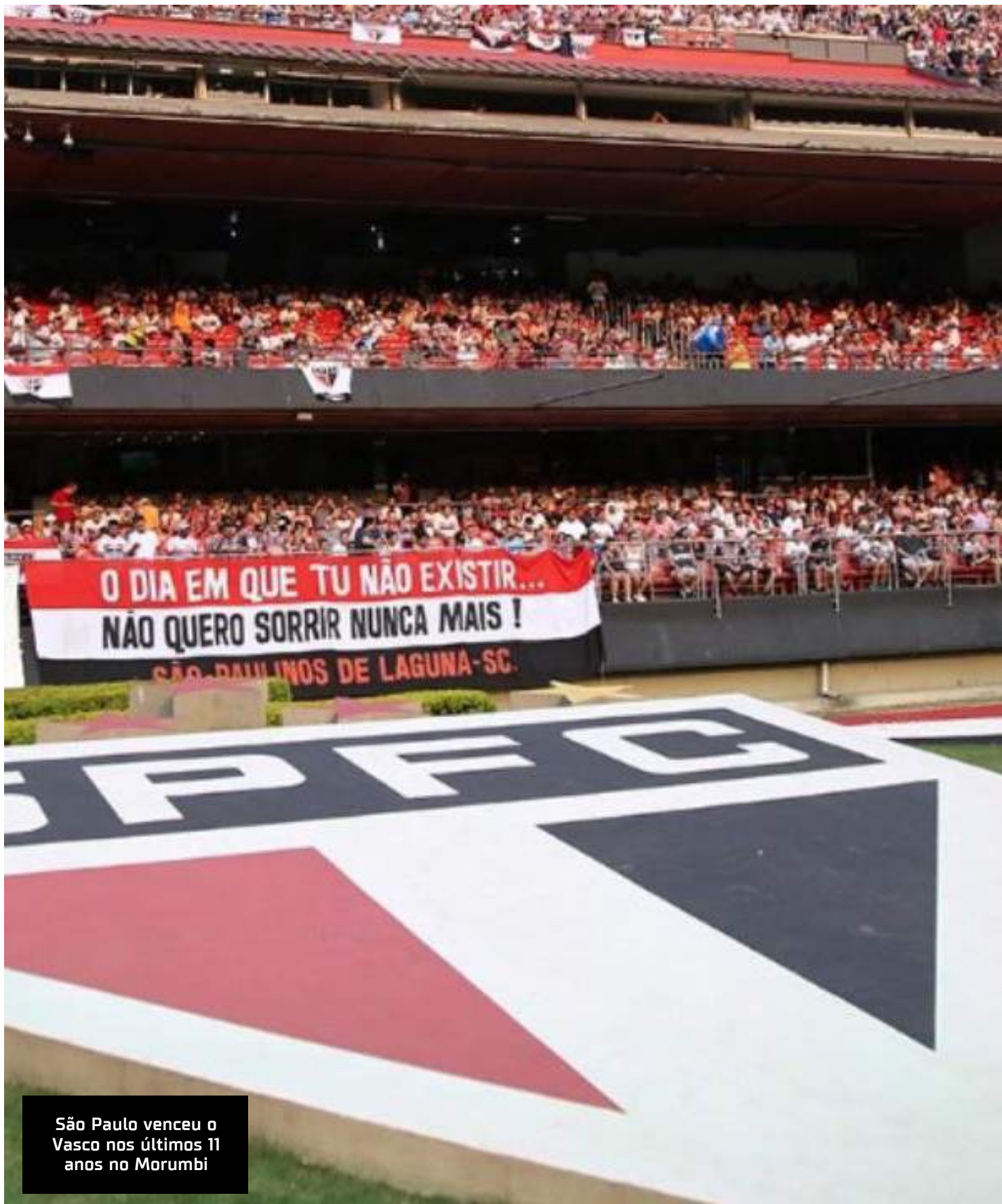
São Paulo venceu o Vasco nos últimos 11 anos no Morumbi