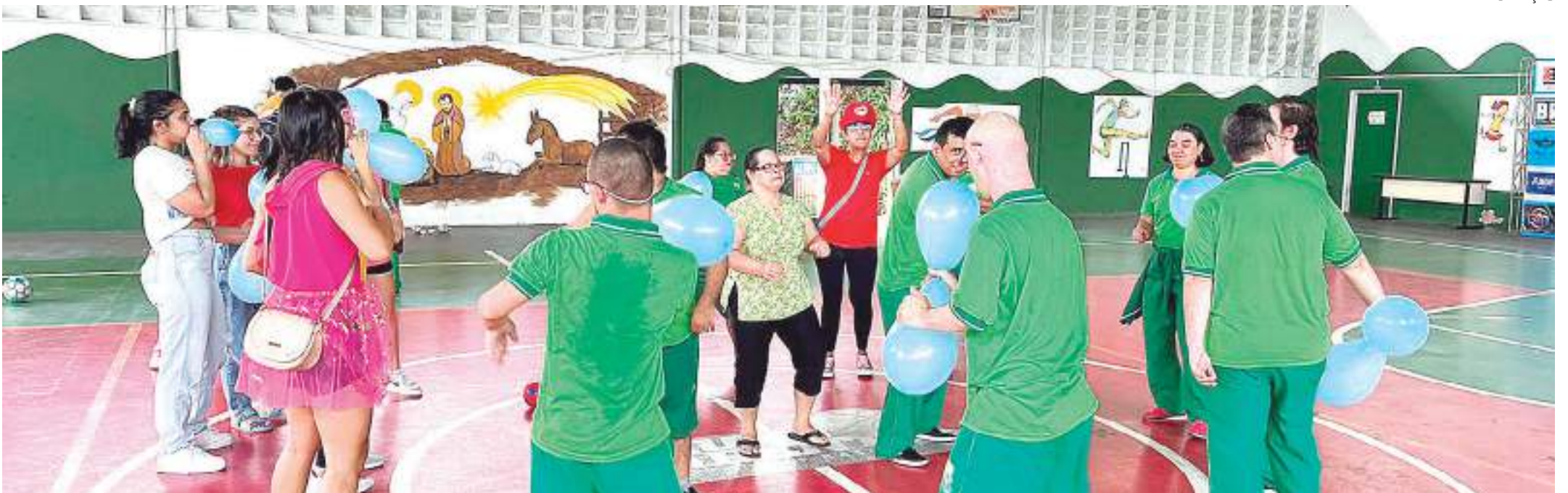
Atividade reuniu 60 alunos do curso

Estudantes de medicina do Centro Universitário Fametro realizaram, na quarta-feira, uma ação social na Associação de Pais e Amigos dos Excepcionais (Apae) com atividades lúdicas aos assistidos pela instituição.