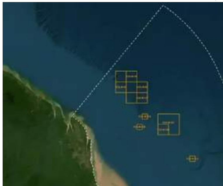
Petrobras não foi autorizado a explorar petróleo na foz do Rio Amazonas