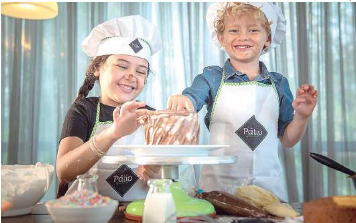
Para participar, basta adquirir R$ 150 em produtos no Pátio

As crianças que participarem da atividade receberão avental, toque blanche (chapéu usado por chefs de cozinha), além de certificado de Chef Kids.