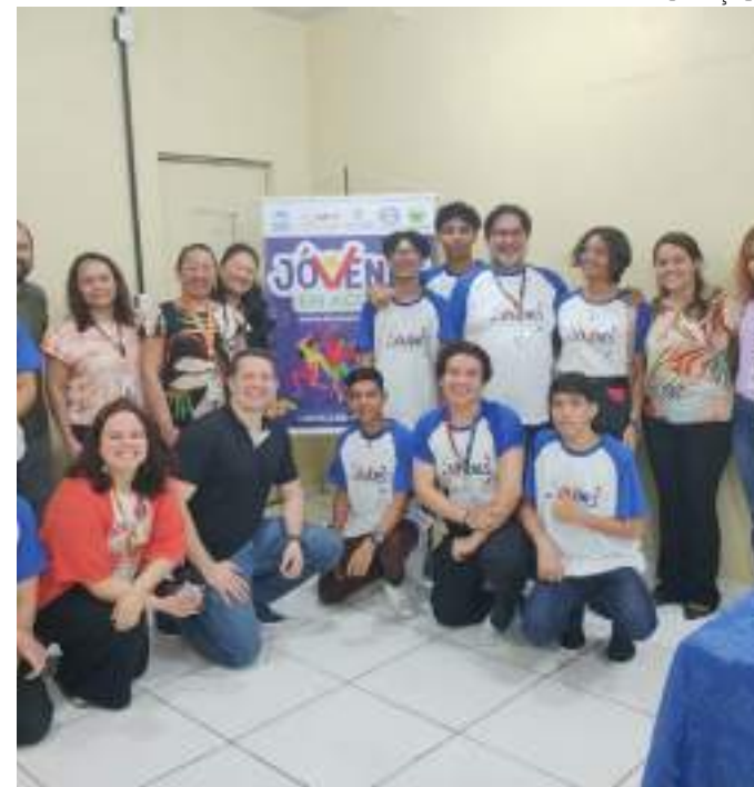
Adolescentes recebem qualificação para entrar no mercado de trabalho

O projeto é realizado com recursos oriundos de reversão trabalhista do Ministério Público do Trabalho (MPT) e tem parceria com a Agência da ONU para Refugiados (ACNUR) e o Tribunal Regional da 11ª Região (TRT 11ª Região).