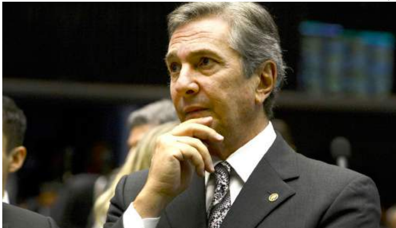
Ex-senador Fernando Collor foi julgado por corrupção passiva e lavagem de dinheiro

Além do relator, também votaram pela condenação os ministros Alexandre de Moraes, André Mendonça, Luís Roberto Barroso, Luiz Fux e Cármen Lúcia. A pena total de Collor ainda