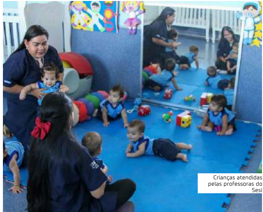
Crianças atendidas pelas professoras do Sesi

As vagas serão destinadas às três creches municipais que serão entregues nas próximas semanas com as seguintes localizações: rua Carlos Coutinho, s/n, conjunto Jardim Versailles, no Planalto, Zona Oeste; rua Jazira; s/n, conjunto Cidadão V, no Nova Cidade, Zona Norte; e rua Lameque,