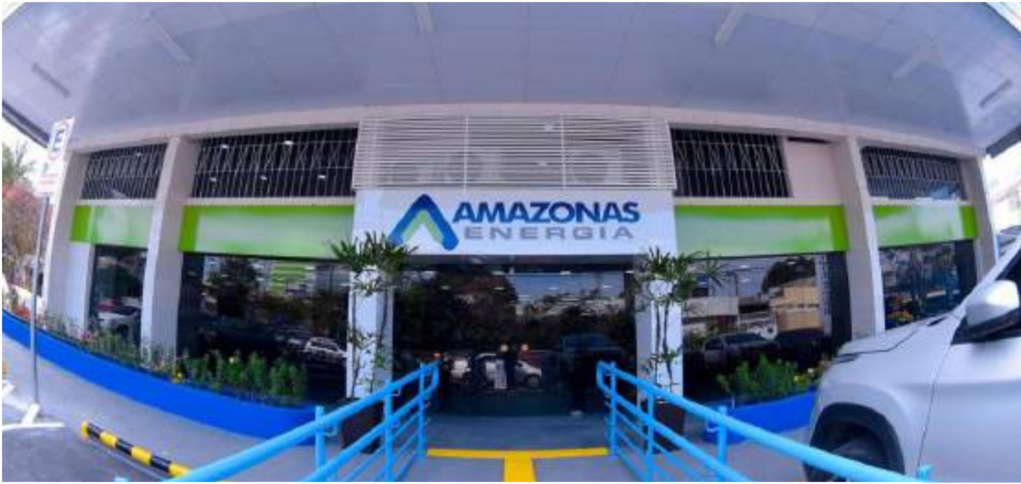
Concessionária afirma que não compactua com ações criminosas e pediu providências da empresa terceirizada

"Recebemos informações sobre um agente público que estaria furtando fios e também desviando a energia de forma criminosa para sua residência. Então, nos deslocamos e nos deparamos com os técnicos da concessionária de energia, que foram até a residência e atestaram o furto", apontou.