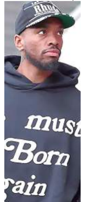
Ivan Toney, principal jogador do time inglês Brentford, foi condenado, nesta quarta-feira (17)