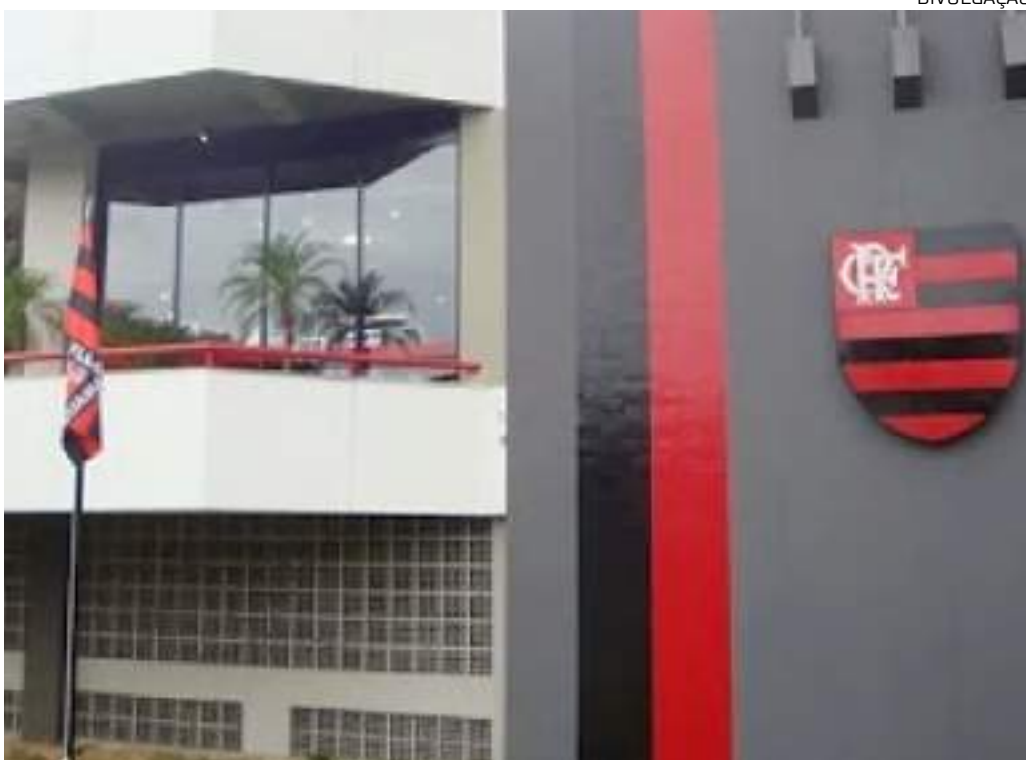
Flamengo nega ter conhecimento de menção a atleta do clube em esquema

Também não há qualquer menção, na denúncia do Ministério Público de Goiás, sobre apostas envolvendo jogadores do Flamengo, nem nesta, nem em qualquer outra partida.