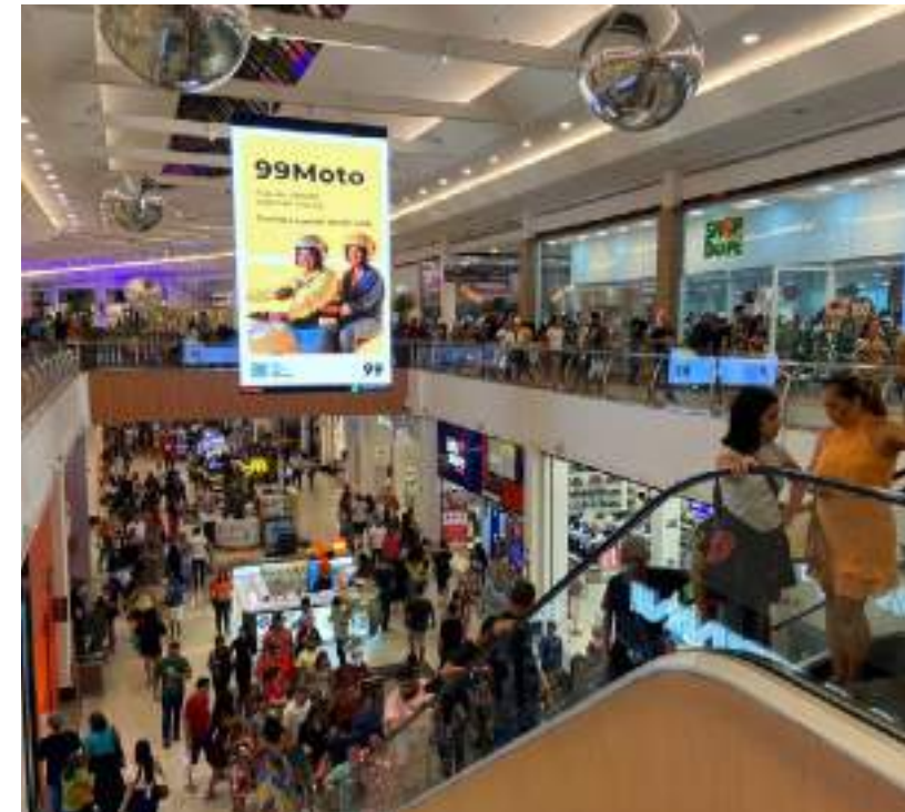
Lojistas do Amazonas Shopping se preparam para a edição 2023