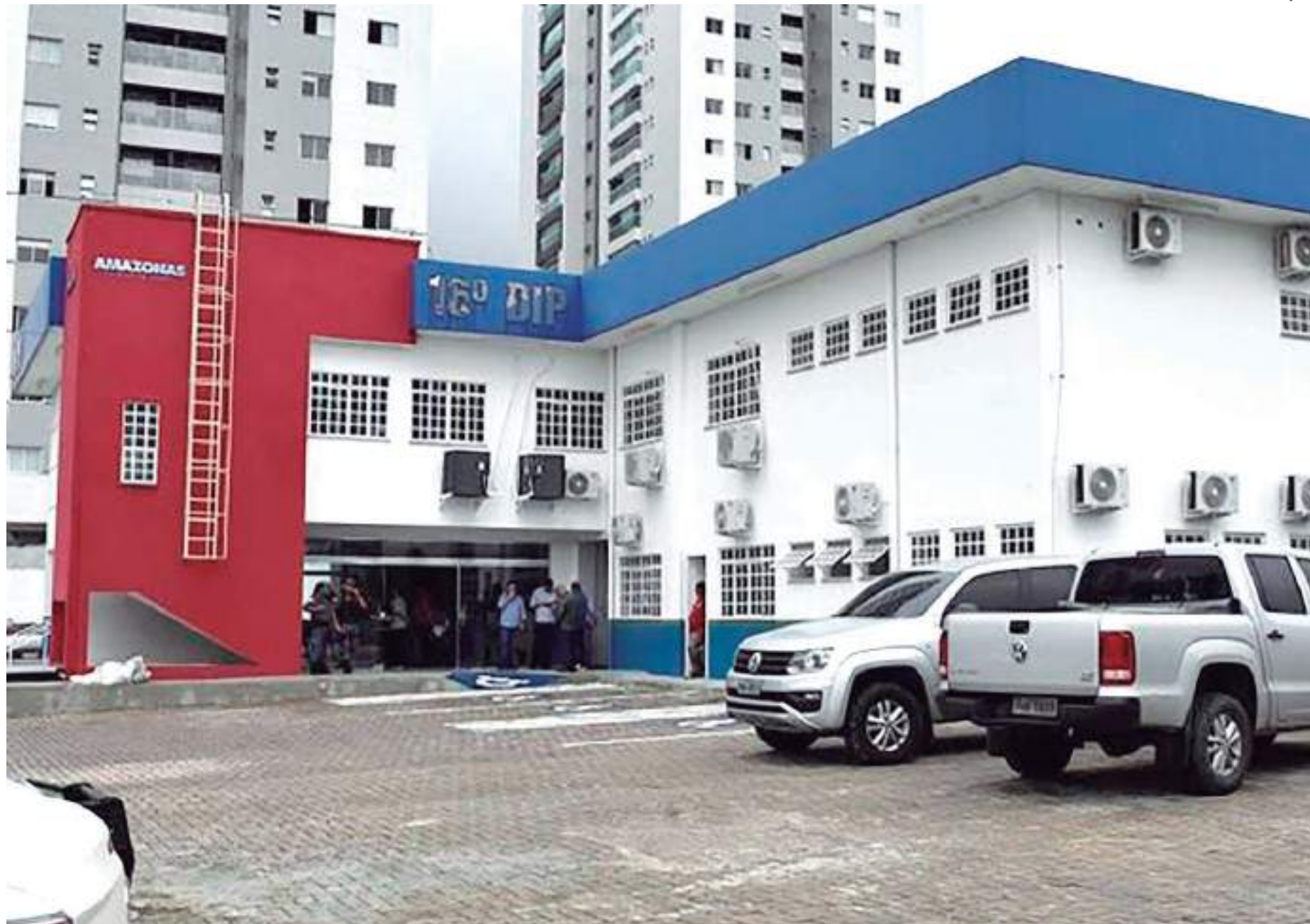
Centro Integrado irá funcionar nos altos da Depca, localizada na avenida Via Láctea, no bairro Aleixo

A unidade vai reunir, no mesmo espaço físico, serviços voltados à proteção e ao atendimento infantojuvenil. O Centro Integrado será um dos mecanismos da rede de proteção para a assistência às vítimas, testemunhas e famílias de