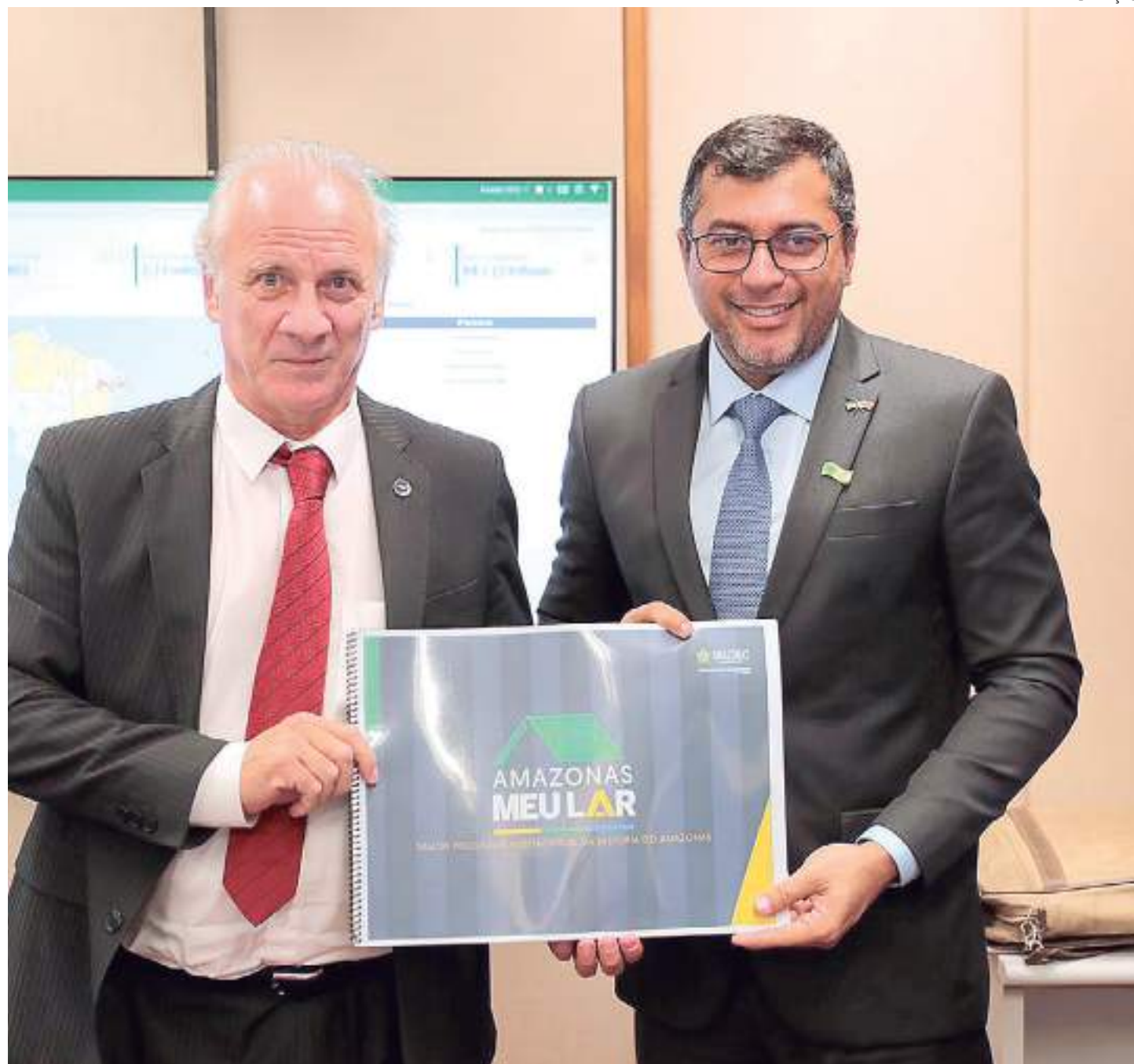
Programa tem investimento de quase R$ 4 bilhões

O governador lembrou, ainda, que o Estado está reas-