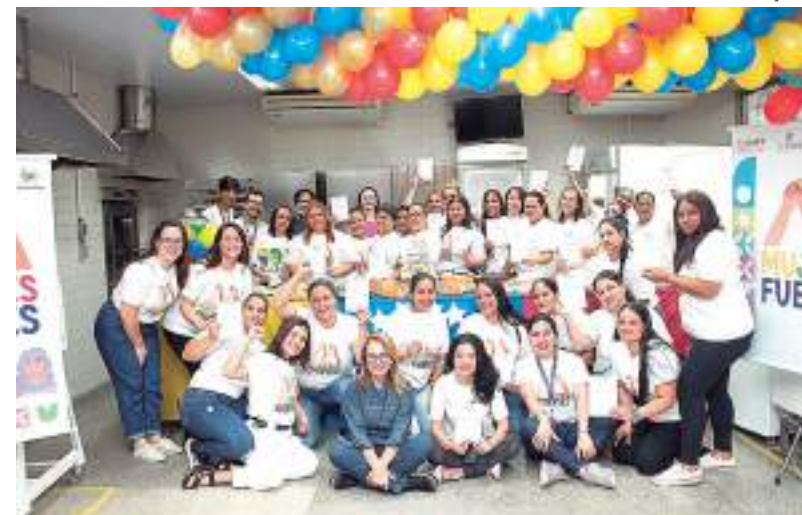
Alunas venezuelanas receberam certificado do curso de gastronomia