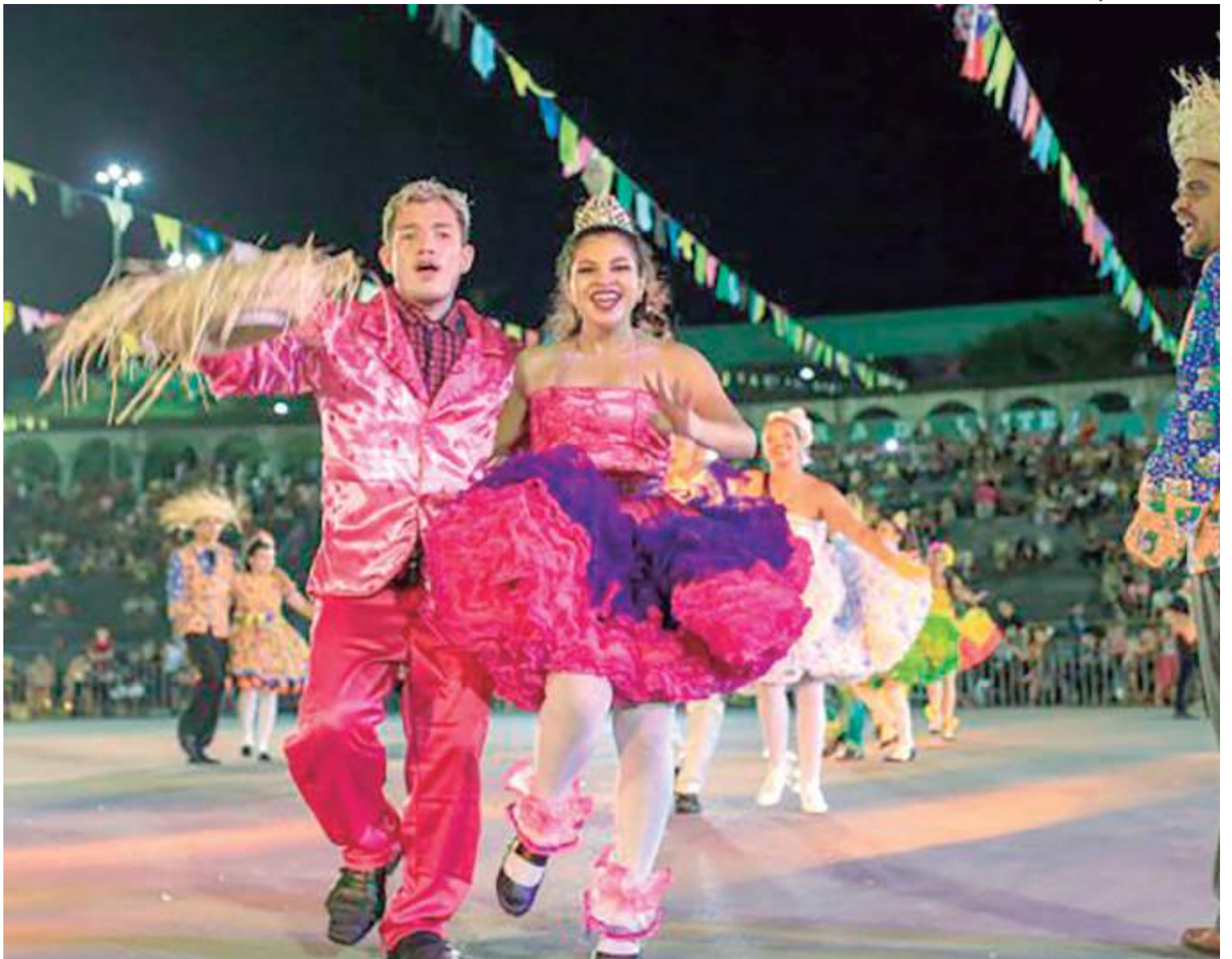
Quadrilha fará parte das apresentações do festival este ano

O festival inicialmente acontecia no centro da capital amazonense, onde hoje está localizado o Colégio Militar. Após o ano de 1979, com a instalação do colégio, ele passou a ser realizado no parque Amazonense, no estádio da Colina e no antigo estádio Vivaldo Lima, o Vivaldão. Mas foi na praça Francisco