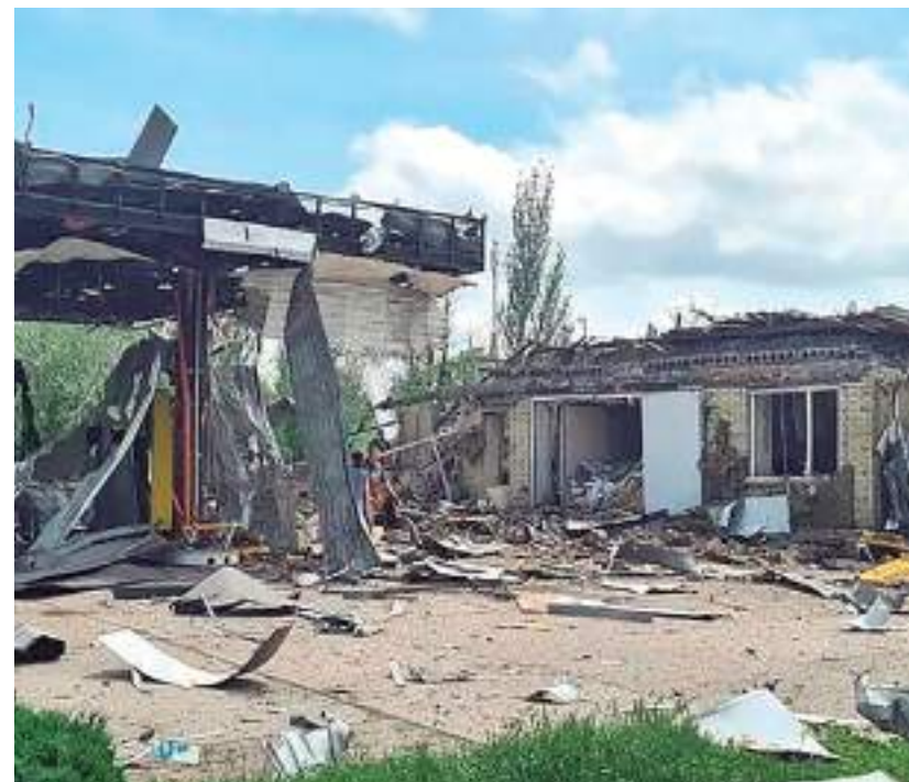
Posto de gasolina foi destruído durante ataque em Toretsk, na região de Bakhmut

A zona seria necessária para proteger as regiões ucranianas de bombardeios, escreveu o conselheiro presidencial Mykhailo Podolyak no Twitter. Ele comenta que as regiões russas que receberiam essa zona de segurança seriam Belgorod, Bryansk, Kursk e Rostov. "Provavelmente com um contingente de controle internacional obrigatório na primeira fase."