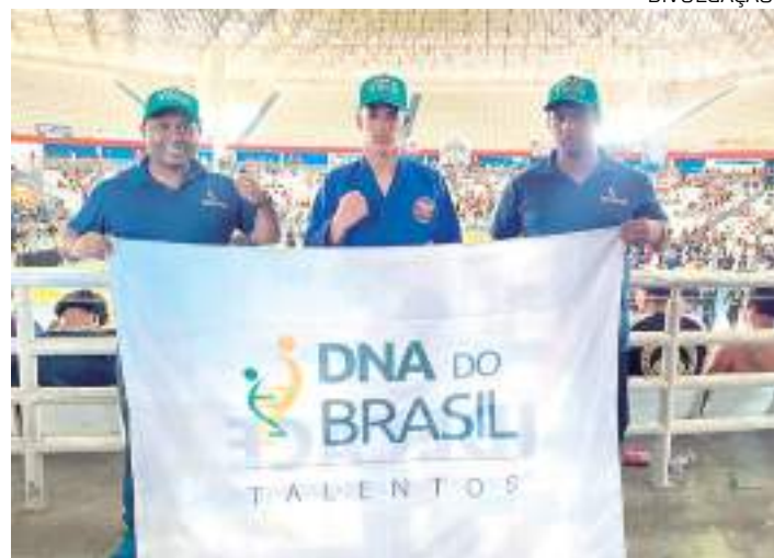
Atleta amazonense do DNA do Brasil conquistou medalhas em competição