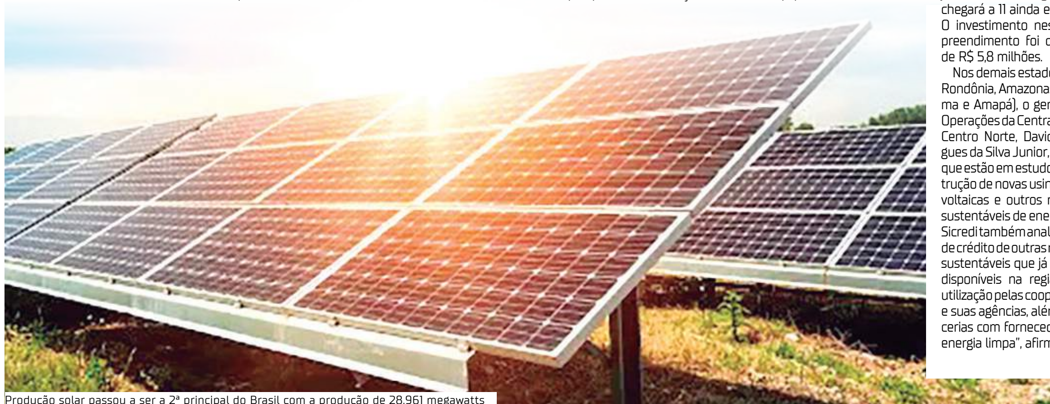
Produção solar passou a ser a 2ª principal do Brasil com a produção de 28.961 megawatts