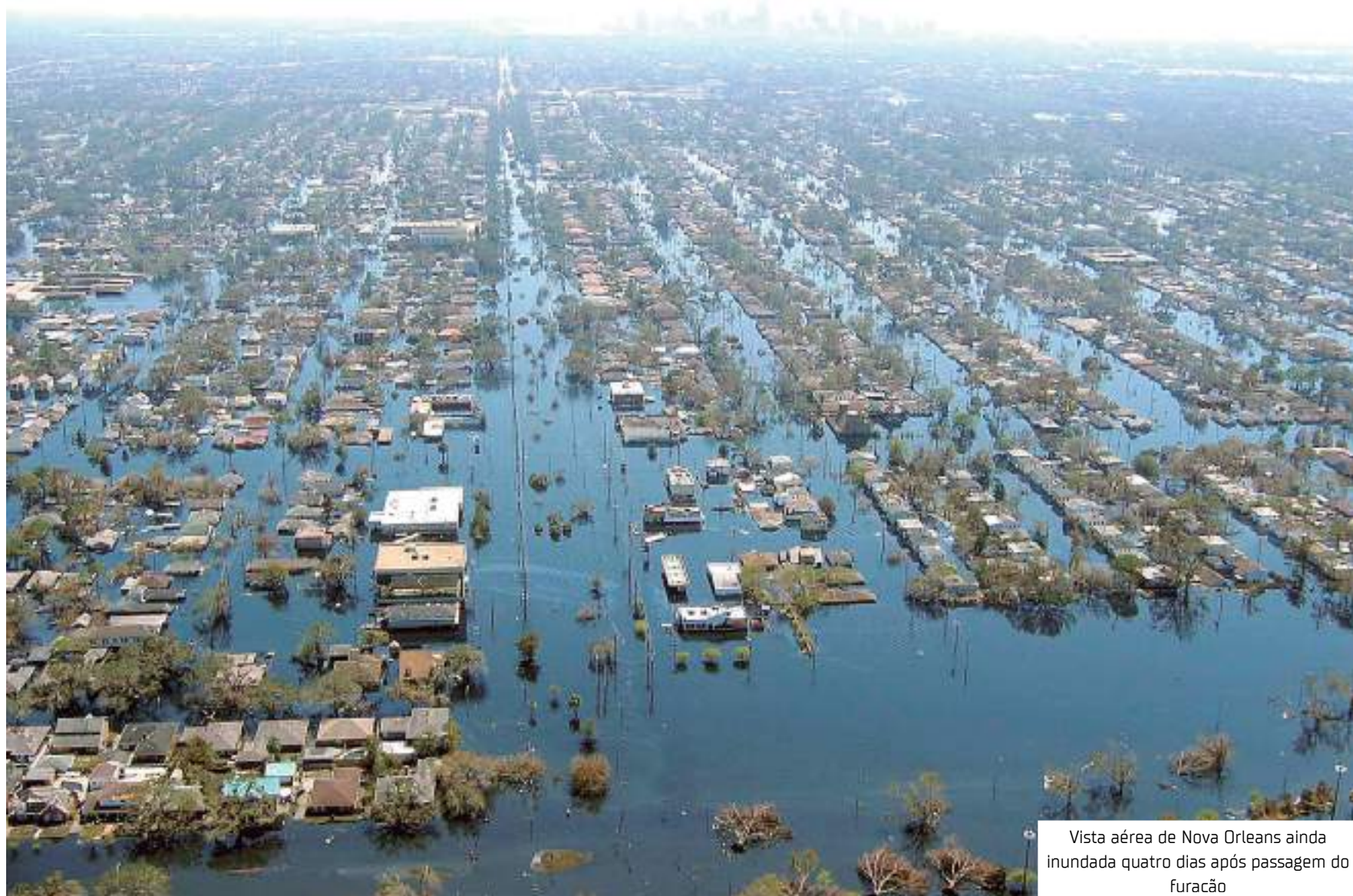
Vista aérea de Nova Orleans ainda inundada quatro dias após passagem do furacão

Inteligência Artificial ao serviço da prevenção