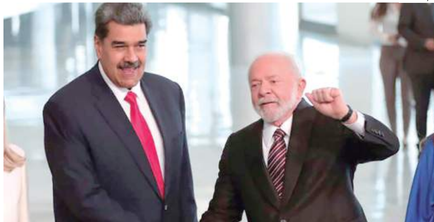
Maduro e presidente Lula reuniram-se no Palácio do Planalto e debateram retorno de parceria

Nas palavras do presidente brasileiro, o preconceito com a Venezuela é muito grande: