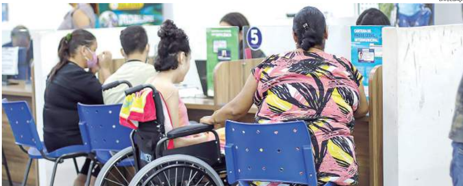
Descentralização deve aumentar em cinco vezes a quantidade de atendimentos

Além do PAC Compensa, as Pessoas com Deficiência (PcDs) podem tirar a carteira de identificação do PCD, solicitar o Passe Legal, Passa-Fácil, Credencial de Estacionamento para Idoso e PCD, e do Passe Interstadual em outros cinco PACs: Alvorada, Parque Dez,