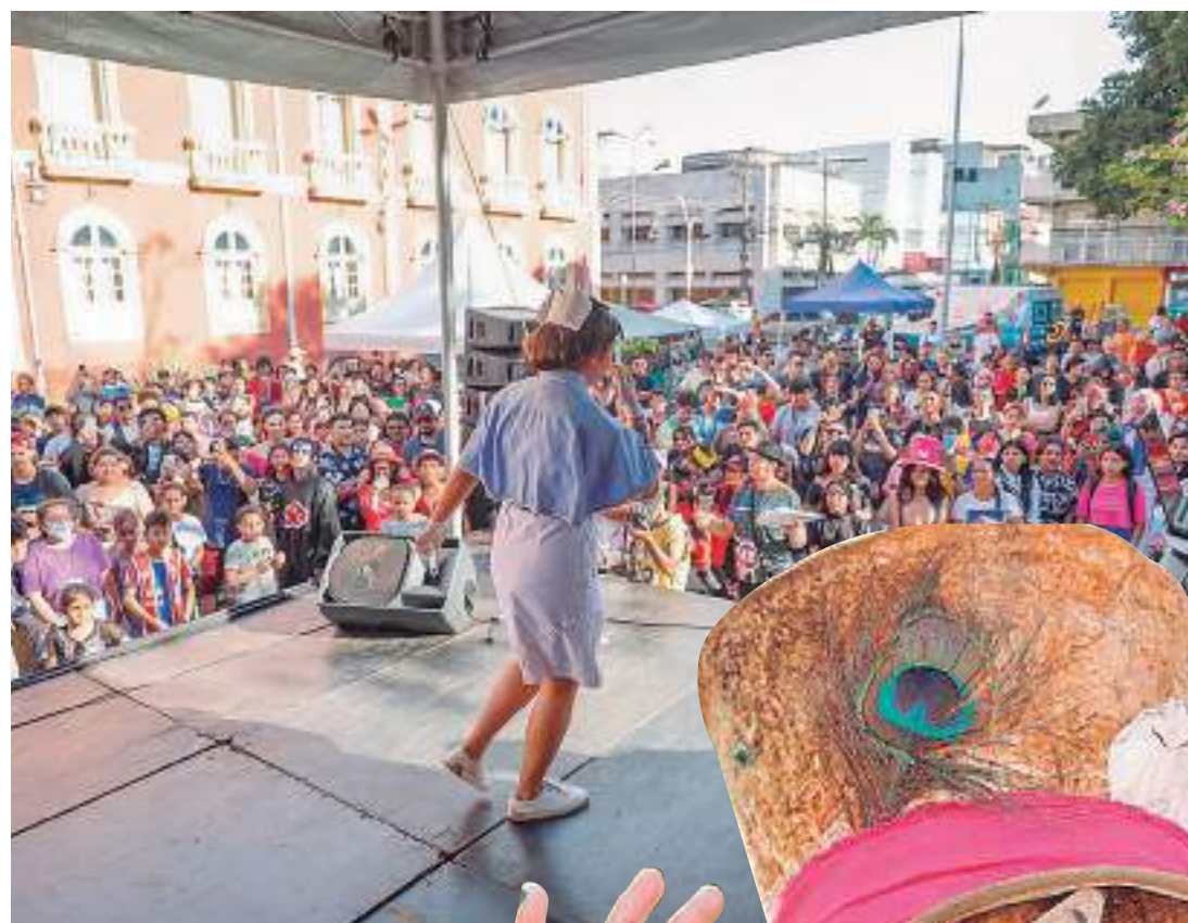
Evento aconteceu no Palacete Provincial, centro de Manaus

Para facilitar o acesso ao cosplay, um termo brasileiro denominado de cospobre habita o universo geek, assim o público que deseja tam-