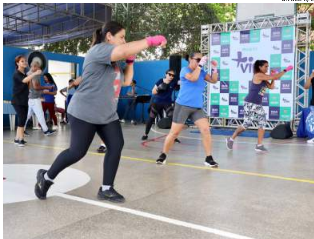
Esporte ajuda na coordenação motora, no condicionamento físico, perda de peso e na defesa pessoal