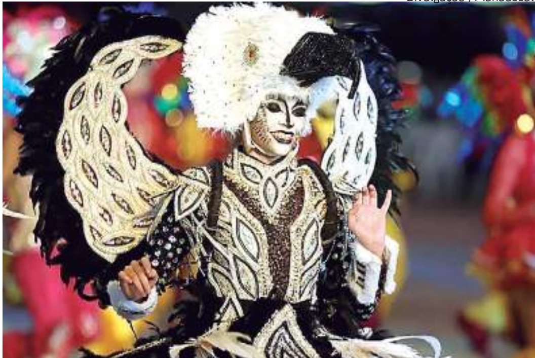
65ª edição de festival acontece no Centro Cultural Povos da Amazônia