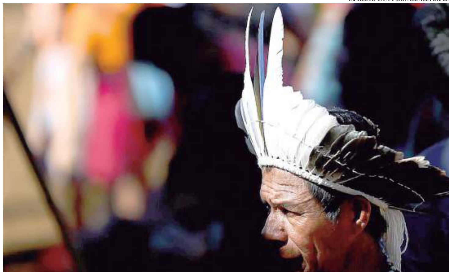
Acampamento Terra livre reúne milhares de indígenas de centenas de etnias de todas as regiões do país

Em tramitação na Câmara desde 2007, o texto teve sua análise acelerada após aprovação de requerimento de urgência, por 324 votos favoráveis e 131 contrários, na semana passada. A matéria retira a demarcação de terras de povos originários da Fundação Nacional dos Povos Indígenas (Funai) e devolve a atribuição ao