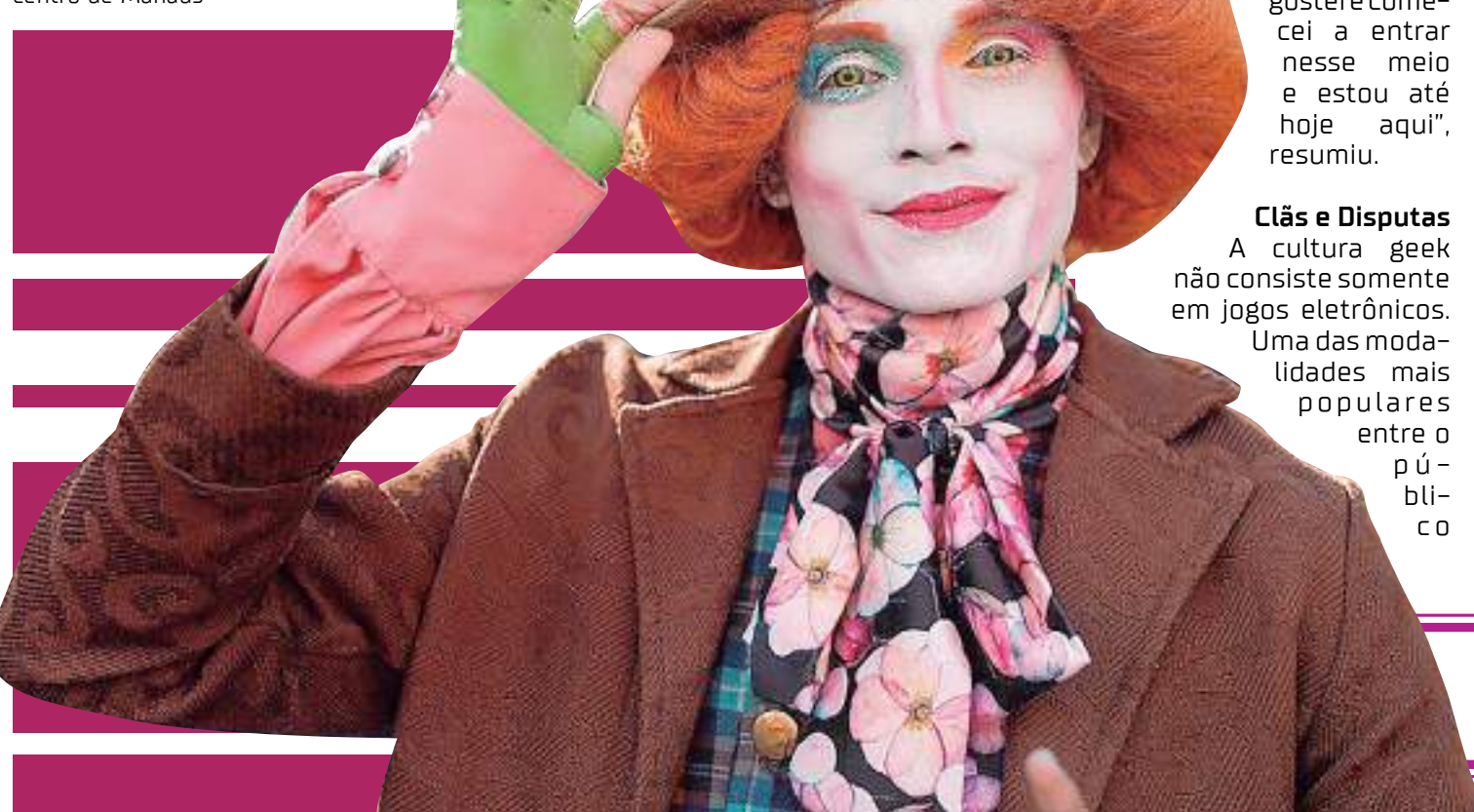
Cosplay de 'O Chapeleiro' em Alice no país das maravilhas