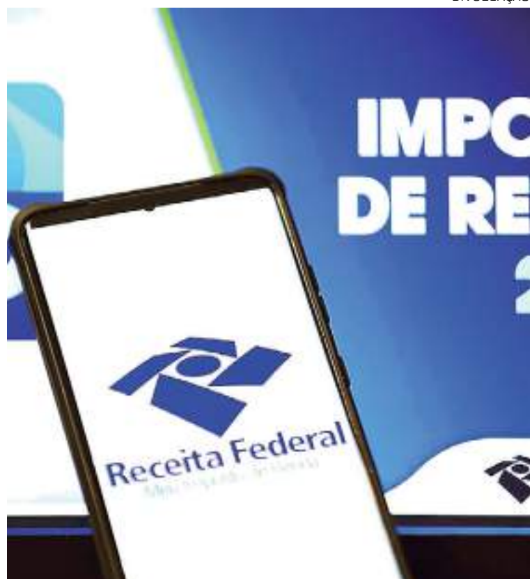
Declaração do IR da Pessoa Física 2023 pode ser enviado via Internet