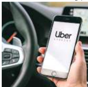
Parceria pretende garantir mais segurança

A Secretaria de Segurança Pública do Amazonas (SSP-AM) assinou na terça-feira (13) um Termo de Cooperação Técnica com a Uber. A iniciativa, pioneira no Norte do país, prevê a integração do botão “Ligar para a Polícia” do aplicativo com o Centro Integrado de Operações de Segurança (Ciops), que reúne as instituições envolvidas no aten-