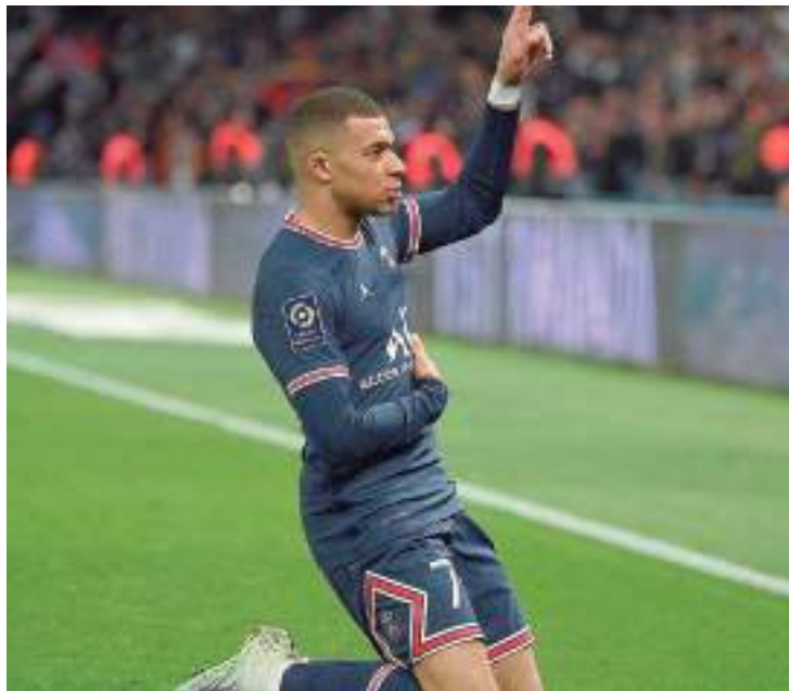
Kylian Mbappé anunciou saída do time francês na próxima temporada

Pouco tempo após a publicação da AFP, Mbappé usou suas redes sociais para desmentir uma notícia do jornal francês 'Le Parisien'. A publicação afirmava que a decisão do jogador de não renovar com o PSG teria sido tomada por conta da saída de Benzema do Real Madrid, e que o atacante teria a ideia de assinar com o Real Madrid já nesta janela de transferências. "Mentiras. Ao mesmo tempo, quanto maior, mais passa. Já disse que vou conti-