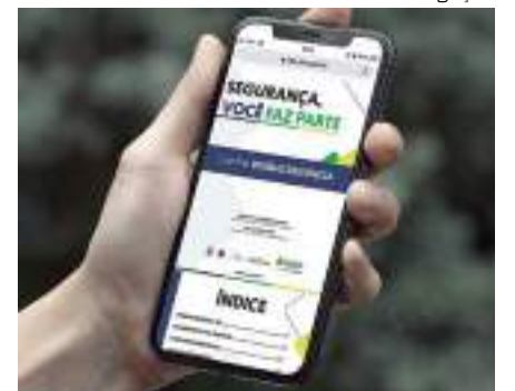
Só este ano, 25 prisões foram realizadas

O atendimento é feito por profissionais treinados e capacitados para realizar e extrair o máximo de informações possíveis em um curto espaço de tempo, além da garantia do sigilo em relação à identidade do denunciante.