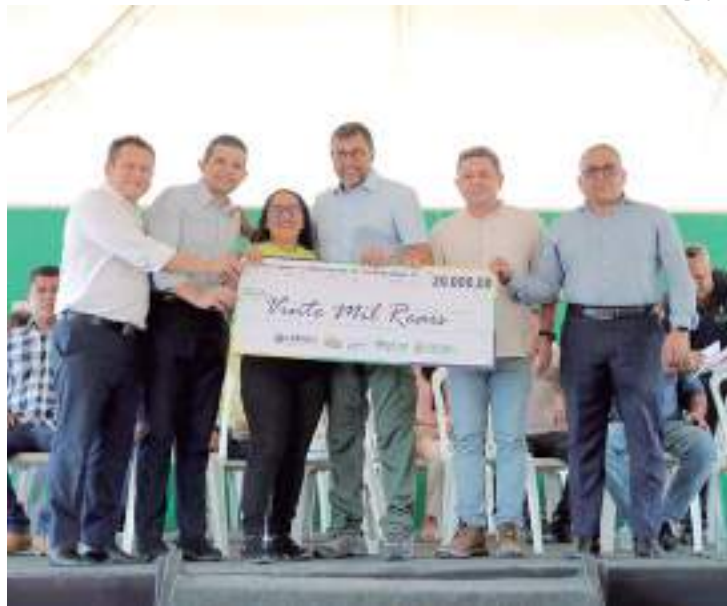
Quatro ramais foram revitalizados

Os quatro ramais também receberam trabalhos de hidrossemeadura, uma técnica que consiste em retocar o solo com sementes e adubos minerais para evitar erosão dos barrancos nas laterais das pistas.