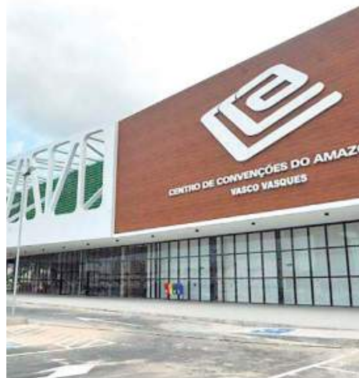
Evento será no Centro de Convenções do Amazonas Vasco Vasques