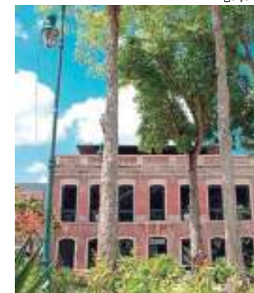
Curso será realizado Casarão de Inovação Cassina