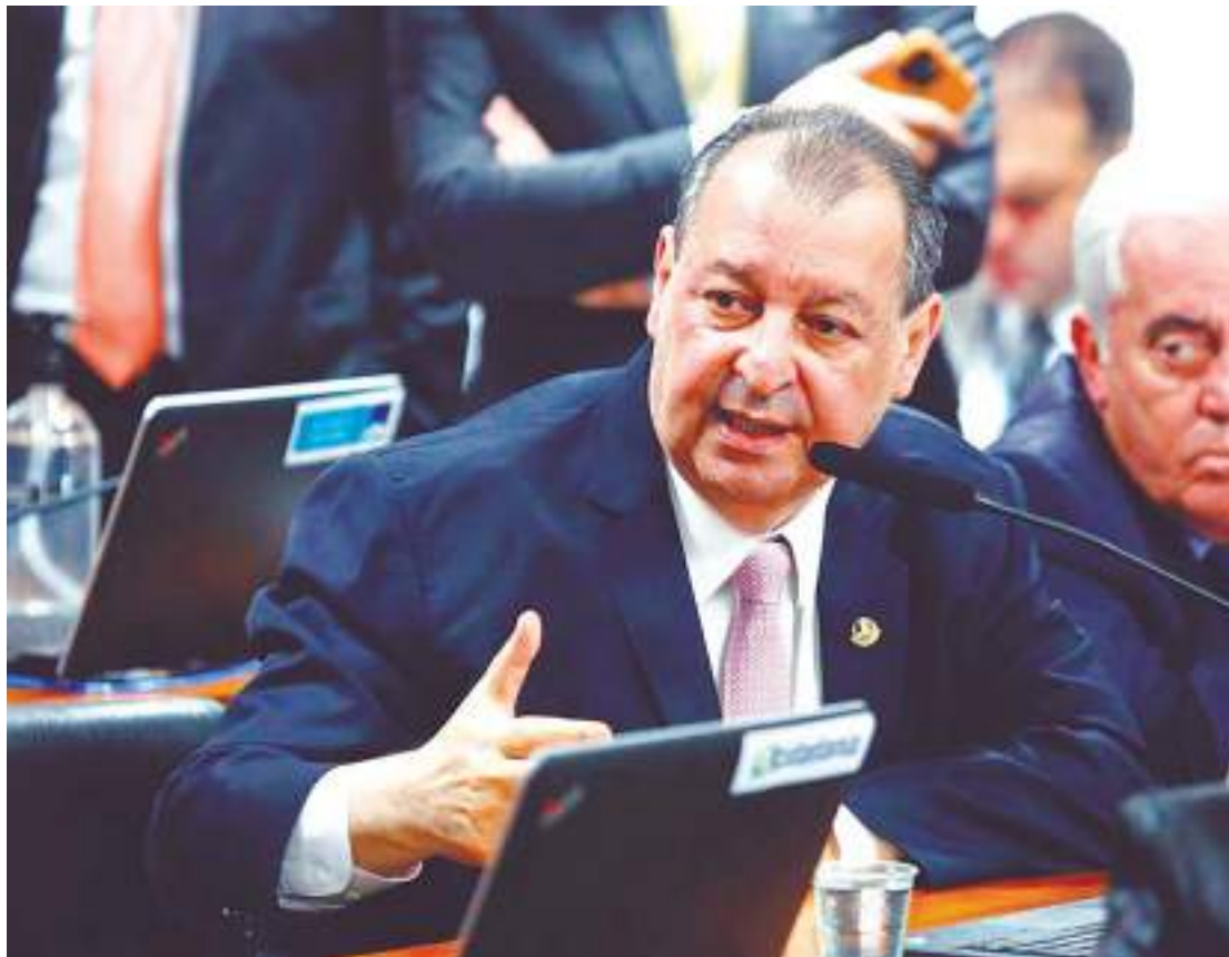
Omar Aziz deve incluir suas considerações sobre as emendas apresentadas

“Espero que votemos em breve na CAE e no mesmo dia possamos votar no plenário, após uma intensa discussão. A proposta é importante para que a gente tenha um limite de gas-