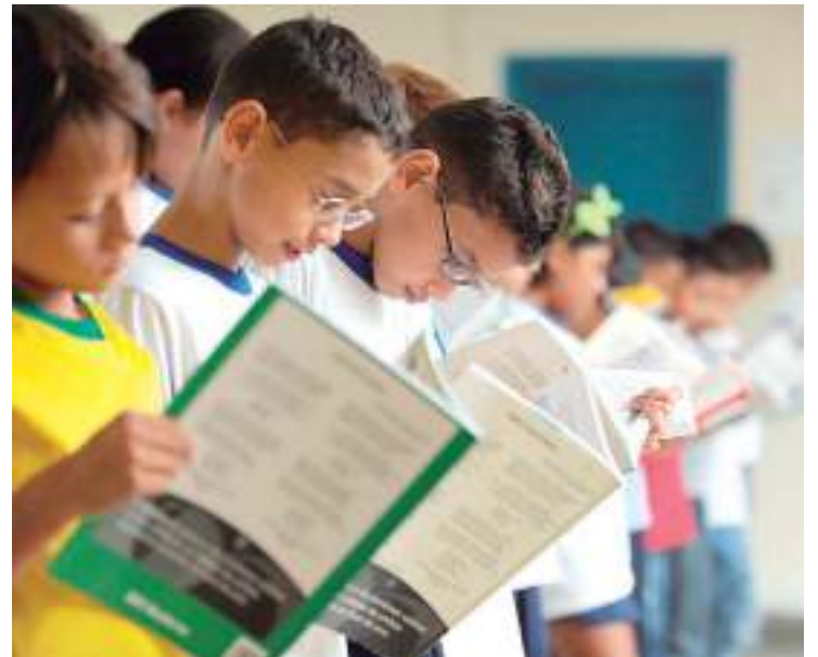
O objetivo é enfrentar as principais causas das deficiências da alfabetização no país

Para o cumprimento dos 5 eixos dessa iniciativa, o Ministério da Educação vai custear mais de 7 mil bol-