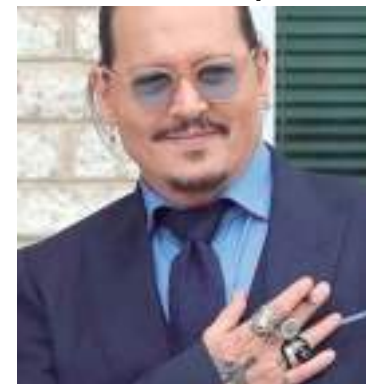
Depp escolheu cinco diferentes instituições para se beneficiarem