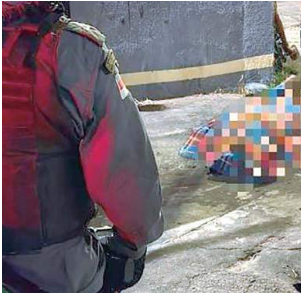
Lavador de carros foi executado na rua Professor Carlos Mesquita, bairro Santa Luzia

O caso deve ser investigado pela Delegacia Especializada em Homicídios e Sequestros (DEHS).