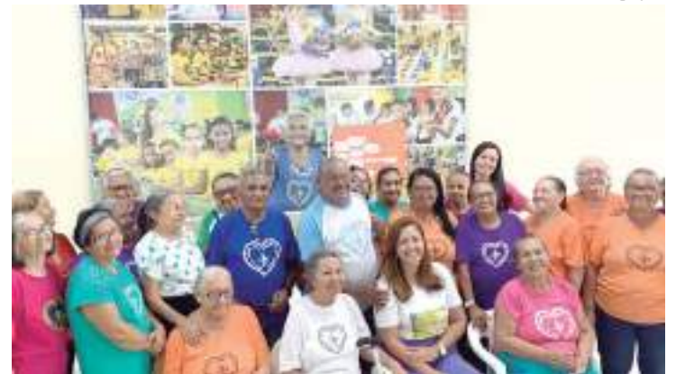
Campanha 'Diga não a violência'

nômica. Para a Organização Mundial da Saúde (OMS), ações que afetam a integridade física e emocional da pessoa e que impedem ou anulam seu papel social são classificadas como situações de violência. Muitos não denunciam por medo de represália ou de punições por parte da família e optam em permanecer em silêncio achando ser a melhor saída para evitar conflitos.