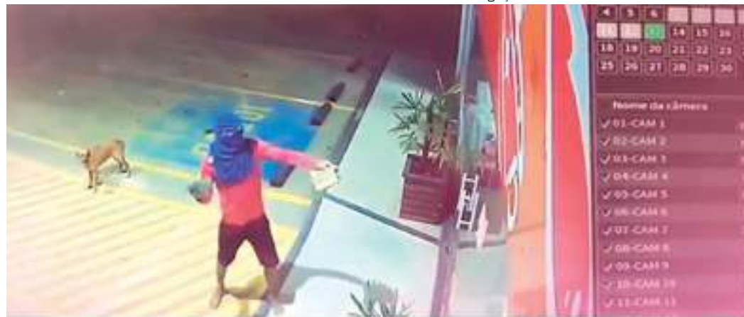
Homem mascarado usa tijolos para quebrar porta de vidro

Câmeras de segurança de uma loja de conveniência, localizada na Avenida do Turismo, Zona Oeste de Manaus, flagraram a ação de uma dupla que assaltou o estabelecimento na madrugada de terça-feira (13).