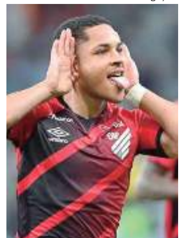
Atacante brasileiro, Vitor Roque, foi contratado pelo Barcelona