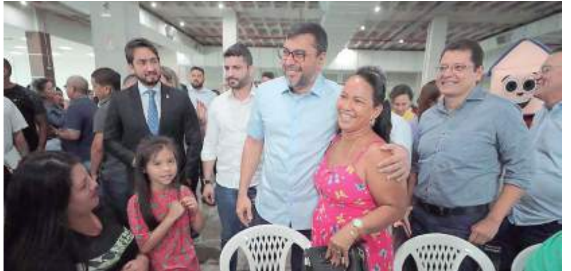
Famílias das comunidades da Sharp e Manaus 2000 são beneficiados

“Nós atingimos quase 800 famílias já reassentadas. Vamos cumprir a