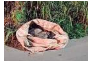
Corpo foi encontrado esquartejado dentro de um saco