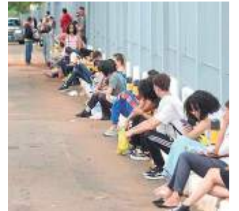
As inscrições para o Enem podem ser feitas até o dia 16 deste mês