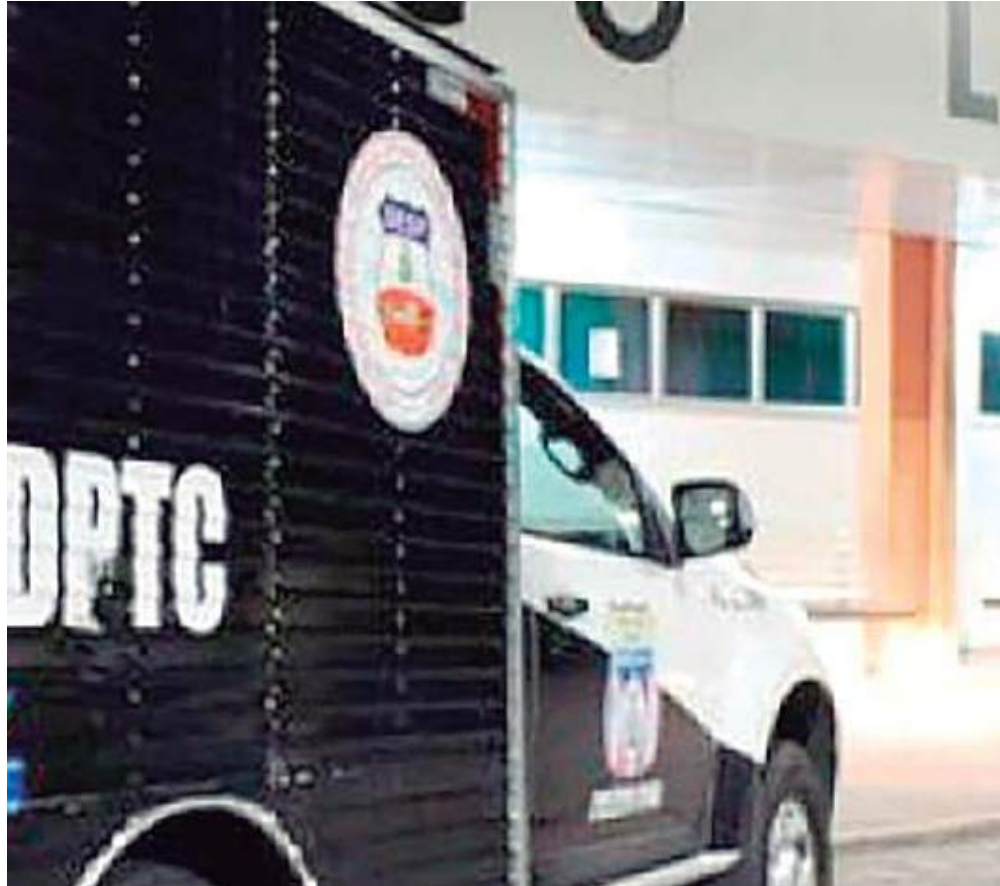
Carro do IML retirou o corpo do homem da frente de uma agência bancária

O Instituto Médico Legal (IML) também esteve no local para remover o corpo. O caso foi registrado na Delegacia Especializada em Homicídios e Sequestros (DEHS).