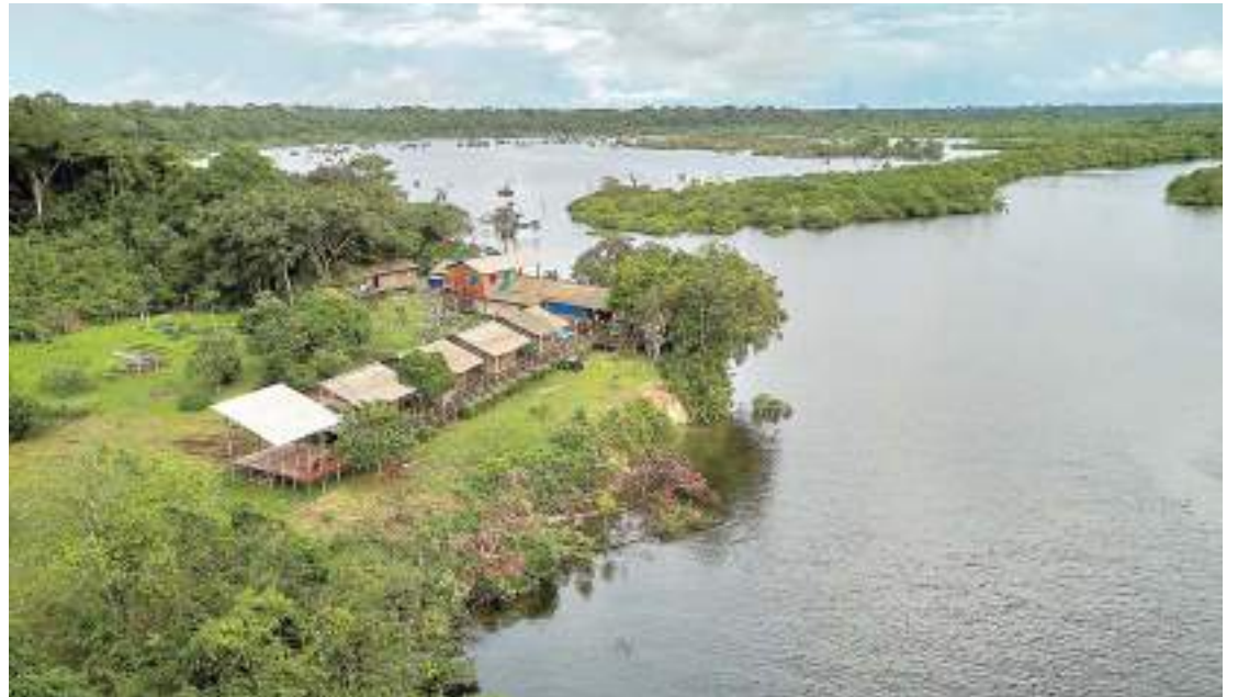
Terceiro encontro da série que já reuniu parceiros do Peru e Equador

O evento é uma realização da SDSN Amazônia, iniciativa secretariada pela Fundação Amazônia Sustentável (FAS), em conjunto com a Equator Initiative, União Internacional para a Conservação da Natureza