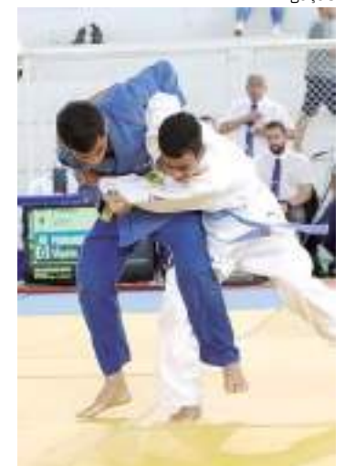
Federação de Judô do Amazonas realiza Copa Amazônia 2023