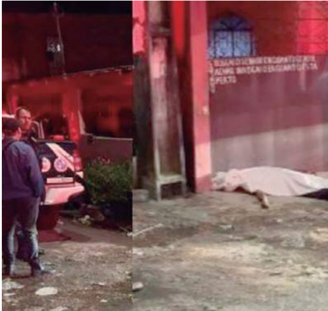
Homem foi morto a tiros na rua Canário, bairro Cidade de Deus

O Instituto Médico Legal (IML) fez a remoção do corpo. A Delegacia Especializada em Homicídios e Sequestros (DEHS) deve investigar o caso.