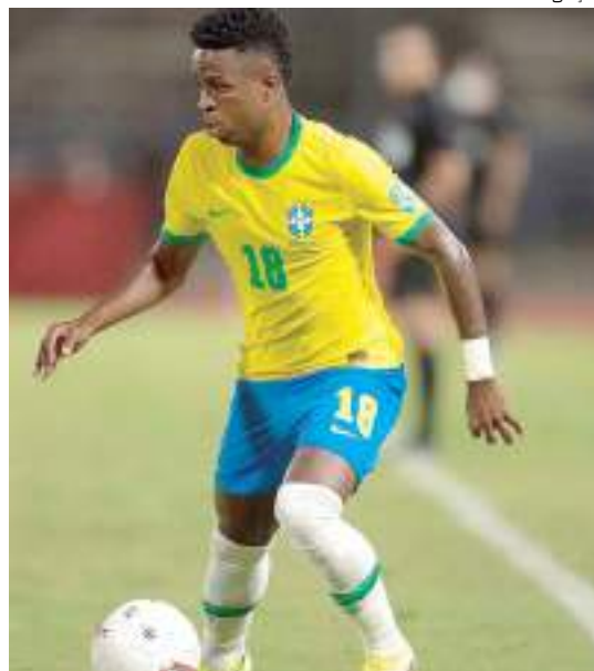
Vini Jr é titular absoluto da Seleção