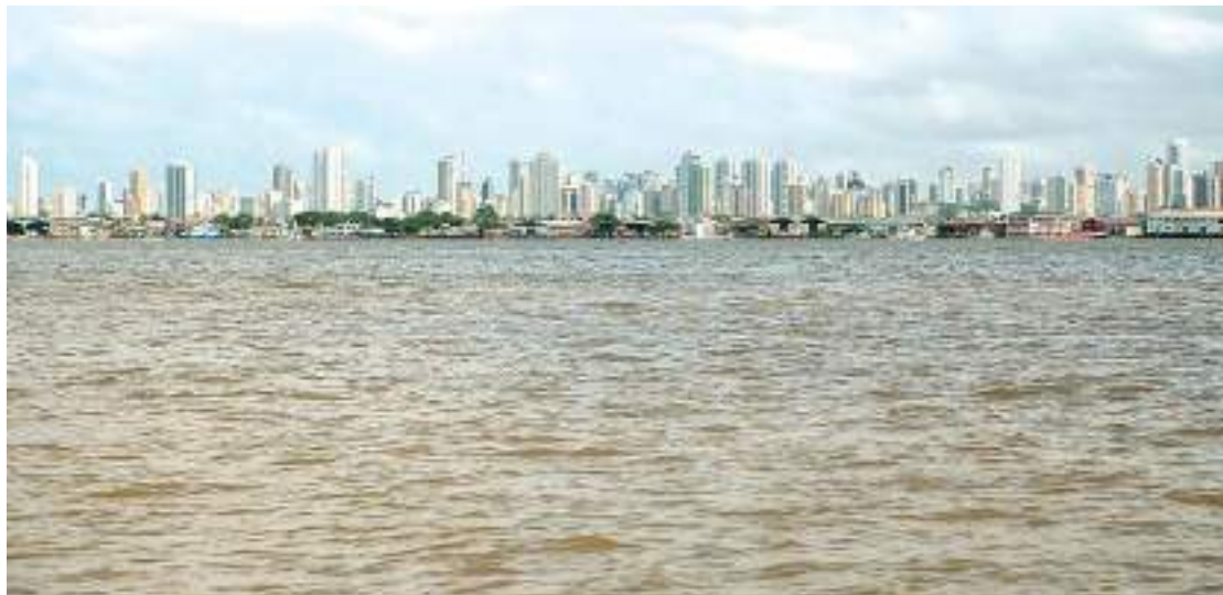
Anúncio da escolha pela capital paraense ocorreu no fim de maio

Na sexta-feira (16), Lula vai ao interior de Goiás, na cidade de Rio Verde, inaugurar o trecho final da Ferrovia Norte-Sul.