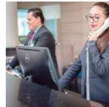
Evento aborda profissional disputado pelas empresas

O Núcleo de EmpregueHabilidades do Literatus é responsável por oferecer qualificação, orientação e acompanhamento dos alunos e egressos no planejamento de suas carreiras. Aconselhamento comportamental personalizado, eventos, palestras e oficinas estão entre as principais atividades do setor.