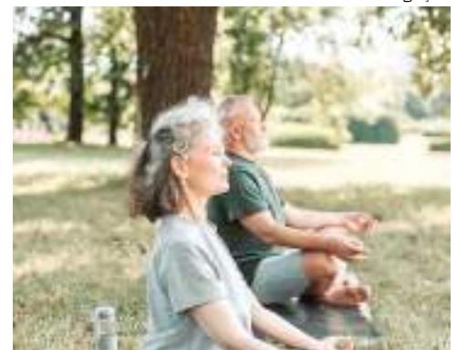
Manter uma rotina saudável é um dos fatores da longevidade

O médico também orientou sobre a necessidade de exercício físico para a saúde física e mental do idoso. Uma caminhada de 30 a 40 minutos por dia. “É aliada a uma alimentação equilibrada evita que surjam doenças durante o processo de envelhecimento”, informou o médico, que possui mais de 50 anos de experiência.