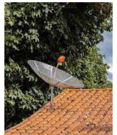
Troca de material é necessária por conta da 5G

Famílias de menor renda inscritas em Programas Sociais do Governo Federal e que tenham a antena parabólica tradicional em pleno funcionamento têm direito à instalação gratuita do novo equipamento, realizada pela Siga Antenado. Para agendar, basta acessar o site sigaantenado.com.br ou ligar para 0800 729 2404.