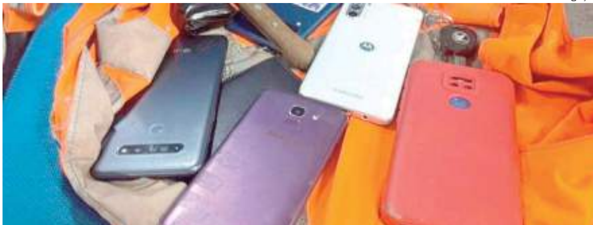
Polícia encontrou vários celulares e uma arma falsa com a dupla

Dois homens, que não tiveram as identidades divulgadas, foram presos, na terça-feira (13), após a polícia receber denúncias de que eles estavam fazendo arrastão com uma arma falsa, na rua Luiz Antony, bairro Centro, Zona Sul de Manaus.