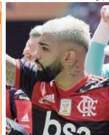
Flamengo está entre os 15 times com mais seguidores nas mídias sociais, no mundo