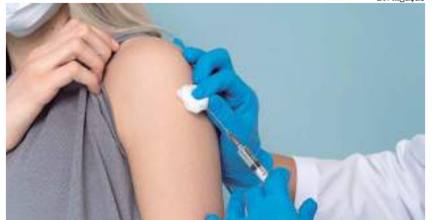
Serviço acontece de 10h às 17h no Amazonas Shopping

A vacinação é direcionada para o público em geral. No local, a equipe da Policlínica Naval de Manaus, da Marinha, irá avaliar o cartão de vacinação e verificar os imunizantes que faltam ser aplicados. Além da caderneta, é importante apresentar um documento de identidade com foto.