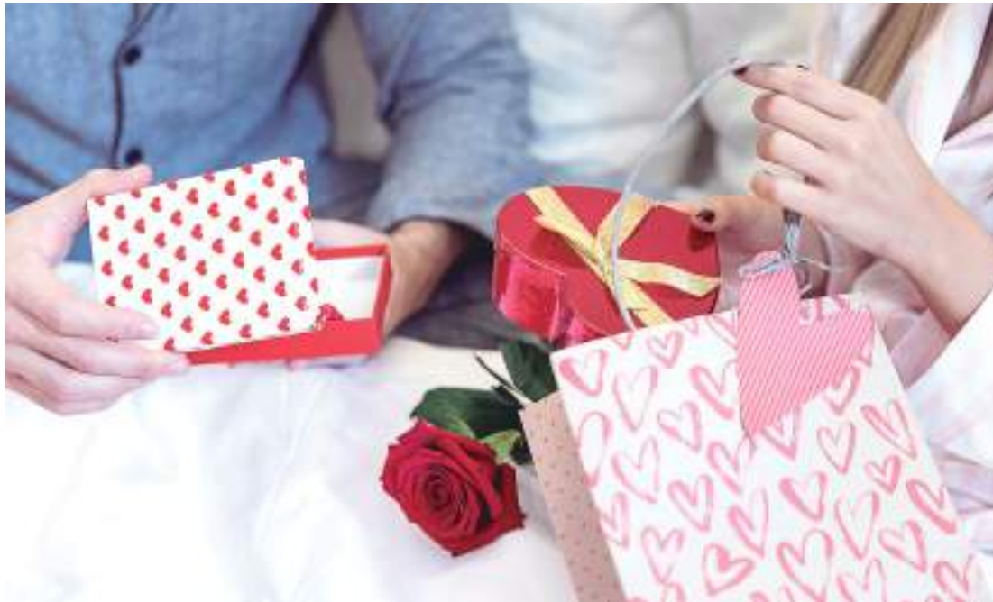
Shopping organiza evento para casais em comemoração ao Dia dos Namorados