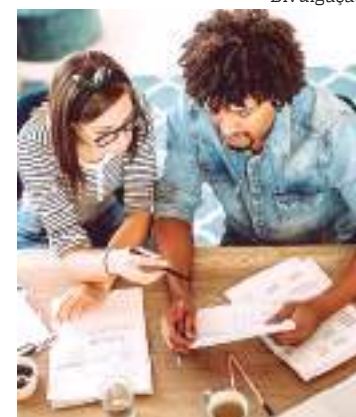
Desejo de empreender mais que triplicou entre brasileiros

Se comparado com a edição da pesquisa anterior, realizada em 2021, quando o sonho de ter o próprio negócio foi respondido por 46% dos entrevistados, houve um incremento de 14 pontos percentuais, um dos maiores das opções de respostas apresentadas aos entrevistados. Comparado com 5 anos atrás, o incremento foi de 42 pontos percentuais.