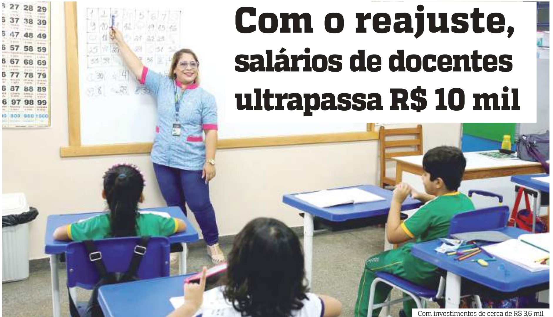
Com investimentos de cerca de R$ 3,6 mil

Com o reajuste de 8% da data-base dos 33.168 trabalhadores da rede estadual de educação, a amplitude salarial de docentes em início e final de carreira da Secretaria de Estado de Educação e Desporto Escolar, ultrapassa R$10 mil. De acordo com dados do Departamento Geral de Pessoas (DGP), o salário inicial com benefícios passou a ser de R$5.827,16 para professores 40h. Já o salário final para docentes com Doutorado é de R$ 16.040,24, enquanto aqueles que possuem Mestrado recebem até R$ 10.596,23.