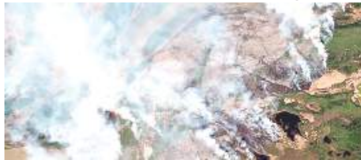
Imagem de satélite mostra incêndio na província de Alberta

de uma dúzia de estados dos EUA estavam sob alertas de qualidade do ar na quarta-feira, enquanto a fumaça de centenas de incêndios flores-