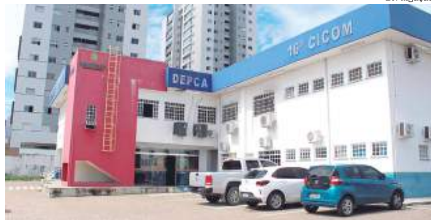
Homem foi levado à Delegacia Especializada em Proteção à Criança

Os moradores da área tentaram linchar o homem. A polícia encaminhou o suspeito à Delegacia Especializada em Proteção à Criança e ao Adolescente (Depca) para prestar depoimento. A vítima confirmou o abuso.