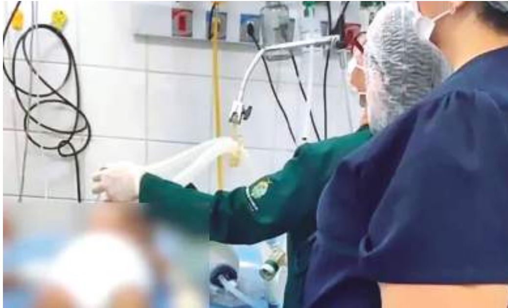
Criança chegou a ter as mãos queimadas por panela quente

Testemunhas afirmam que a criança já havia sido agredida pelo pai outras vezes. Em certa ocasião, o homem chegou a queimar as mãos do menino com uma panela, dizia que ele não era seu filho e o chamava de “veado”.