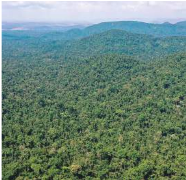
Os dados são do Instituto Nacional de Pesquisas Espaciais

“O governo atual recepcionou [da gestão anterior] o desmatamento em alta na Amazônia, em uma faixa bastante importante. O dado que o Deter acaba de disponibilizar representa uma queda de 10% no mês de maio, comparado com o mês de maio do ano anterior. No