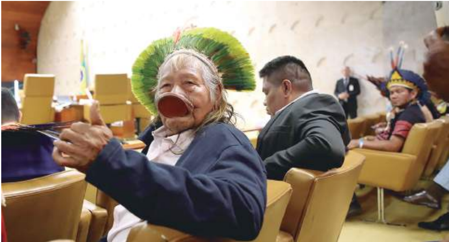
Representantes indígenas marcaram presença no Supremo Tribunal, onde marco será votado

O Supremo Tribunal Federal (STF) voltou a suspender ontem (7) o julgamento do processo que trata da legalidade do marco temporal para demarcação de terras indígenas. A suspensão foi ocasionada por um pedido de vista do ministro André Mendonça. Pelas regras internas do STF, o caso deverá ser devolvido para julgamento em até 90 dias.