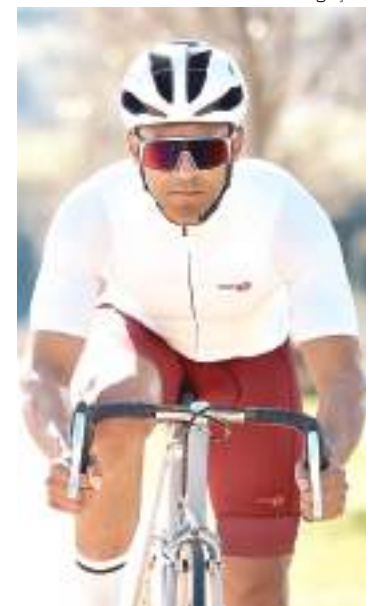
Duathlon combina corrida e ciclismo, e pode ser praticado indoor