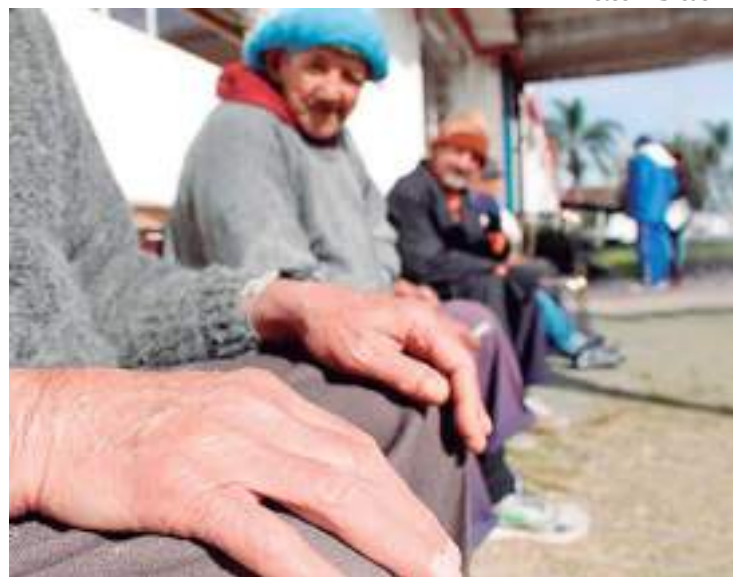
Mês de Junho é voltado para o combate à violência contra os idosos

Como parte das ações para marcar a data, foi lançada também a campanha “Assim você me vê”? Em