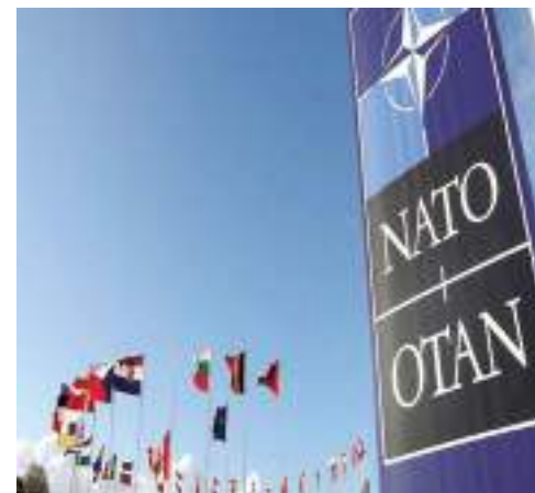
Bandeiras dos países membros da Otan, na Bélgica

çando nos planos de treinar pilotos ucranianos para voar em caças F-16 de fabricação americana e trabalhando para fornecer peças, munição e outros equipamentos necessários para manter em funcionamento os tanques Leopard, já entregues às forças da Ucrânia. No mês passado, a Casa Branca retirou restrições que impediam o fornecimento dos F-16 a Kiev.