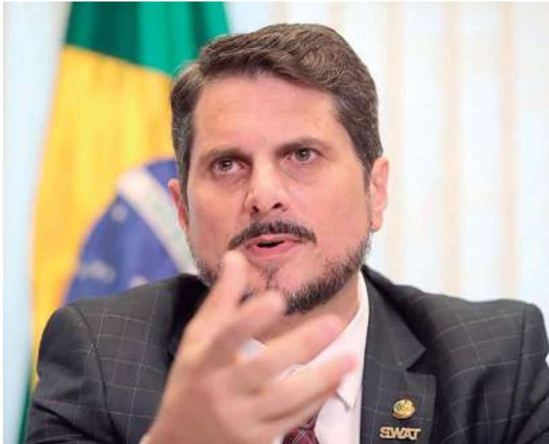
Marcos do Val está sendo investigado por suposto envolvimento em atos antidemocráticos

As buscas ocorrem no âmbito da investigação sobre atos antidemocráticos. Além da apreensão de provas físicas e digitais, o magistrado também determinou a suspensão das redes do congressista. Ele é sus-