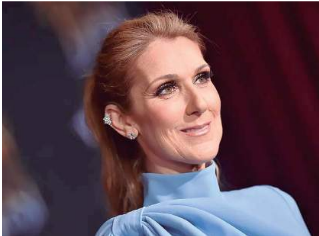
Cantora de 55 anos foi diagnosticada com síndrome de stiff-person

A cantora Celiné Dion, de 55 anos, teve uma piora em seu estado de saúde e provavelmente nunca mais voltará aos palcos, segundo o site RadarOnline. Ela revelou no ano passado que tinha sido diagnosticada com a síndrome de stiff-person (síndrome da pessoa rígida), doença neurológica rara que causa rigidez nos músculos e espasmos dolorosos, deixando a pessoa “dura”.