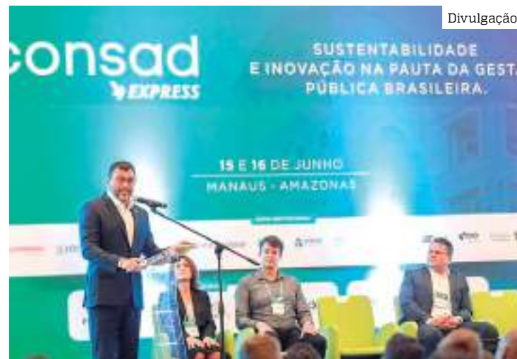
Wilson Lima anuncia processo eletrônico de documentos na gestão dele

Ainda de acordo com o governador, o Estado continua investindo na modernização da gestão para torná-lo mais eficiente na oferta dos serviços públicos, integrando os órgãos estaduais na governança de transformação digital do Executivo estadual.