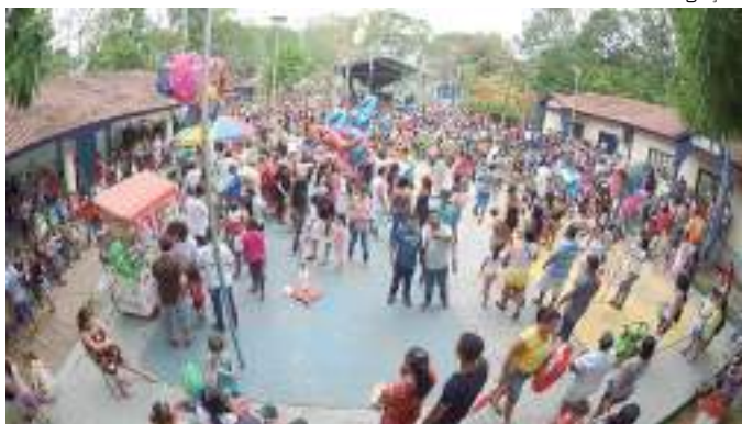
A ação ‘Rua de Lazer’ acontece neste sábado

Como parte do cronograma da “Campanha de Combate à Exploração do Trabalho Infantojuvenil nas Ruas de Manaus”, a Prefeitura de Manaus, por meio da Secretaria Municipal da Mulher, Assistência Social e Cidadania (Semasc), realiza, na manhã de sábado, 17/6, a ação “Rua de Lazer”, com atividades lúdicas e recreativas voltadas às famílias moradoras do bairro