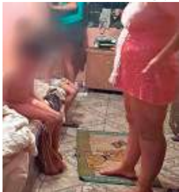
Crianças foram abandonadas pela mãe e resgatadas pela PM

Três crianças, de 10, 8 e 4 anos, foram resgatadas, na última quarta-feira (14), após terem sido abandonadas pela mãe em quarto alugado na rua Andirá, bairro Grande Vitória, Zona Leste de Manaus.