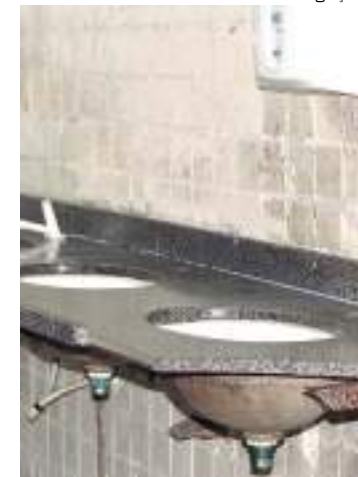
Banheiro do Terminal 2, no bairro Cachoeirinha