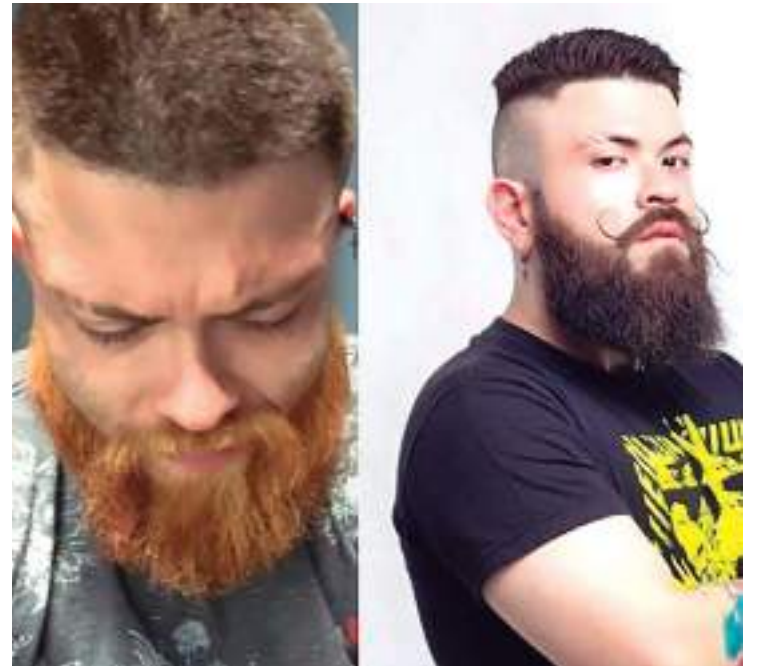
DJ foi preso novamente após ter sido detido pelos mesmos motivos

A titular da Sejusc também ressaltou a importância de casos de violência contra o idoso serem denunciados aos canais Disque 100 e Dis-