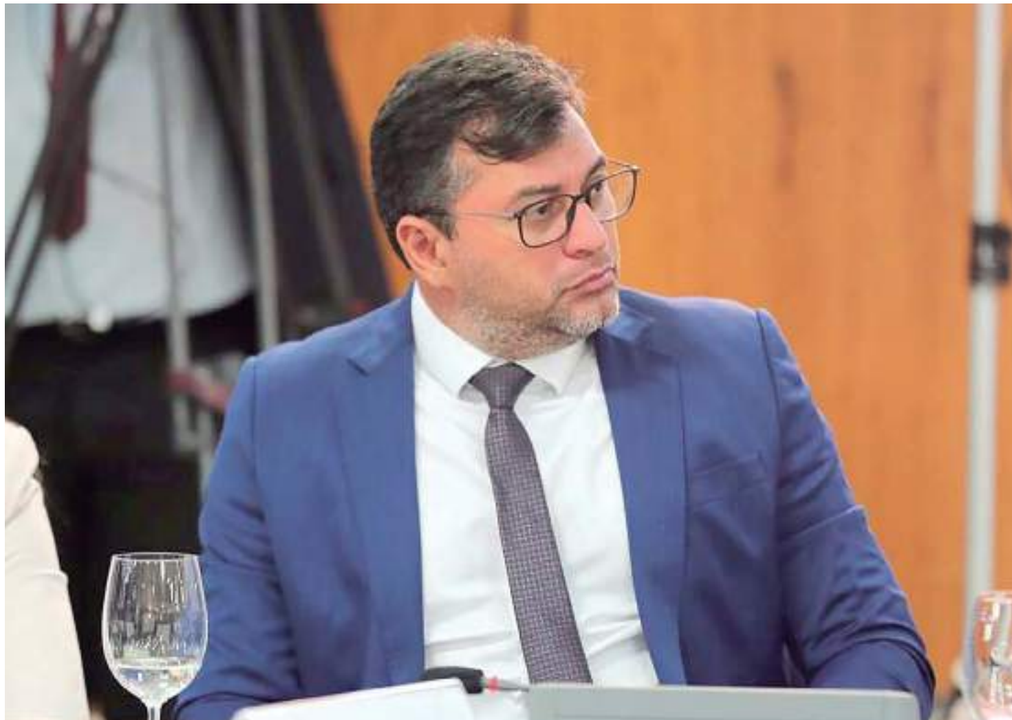
Wilson Lima reafirma comprometimento com acordos firmados entre Governo e servidores da educação

O Governo do Amazonas informou que os professores que tiveram valores descontados por faltas durante a greve da educação ocorrida no mês de maio, serão pagos hoje (16).