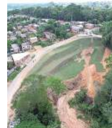
Obra alcança 50% dos serviços executados

O titular da Seminf afirmou que, com o trabalho, o meio-fio está assentado e a erosão praticamente contida. “A determinação do prefeito é para realizarmos essa obra em tempo recorde e, por isso, terceirizamos todo o serviço nessa área, que, em breve, estará restaurada” complementou.