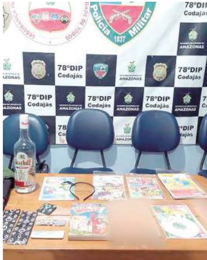
Polícia apreende DVDs pornográficos infantis, além de preservativos

Ambos foram autuados em flagrante pelos crimes de estupro de vulnerável e corrupção de menores. Eles serão encaminhados à audiência de custódia, e ficarão à disposição do Poder Judiciário.