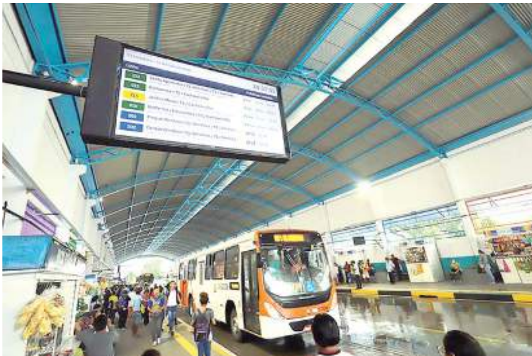
Município informou que os banheiros das estruturas estão entre os principais alvos dos vândalos