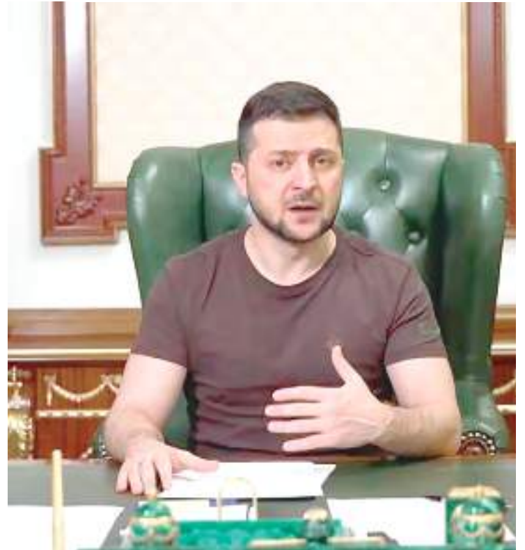
Presidente da Ucrânia, Volodymyr Zelensky

O presidente ucraniano, contudo, afirmou voltou a afirmar que quer se encontrar com o par brasileiro, em meio a sua tentativa de angariar apoio na América Latina e em um Sul Global