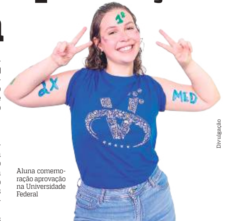
Aluna comemora aprovação na Universidade Federal

Oferecido com exclusividade pelo Vetor, o Método Leal torna o aluno especialista no seu próprio método de aprendizagem. A metodologia ensina o jovem a criar uma rotina de estudos