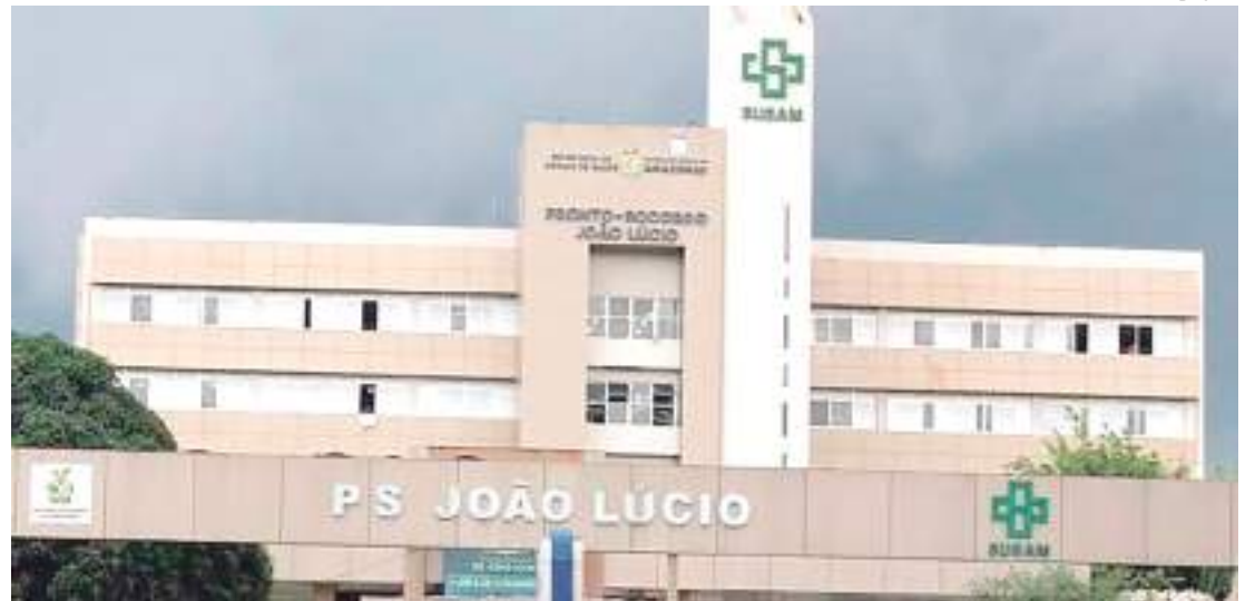
Jovem foi assediada enquanto esperava para fazer cirurgia no hospital

Sem muitas informações, a mãe da adolescente pro-