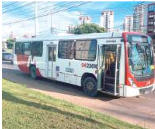
Assalto aconteceu no ônibus coletivo da linha 305

Um cabo da Polícia Militar (PM) foi baleado, na quinta-feira (1º), durante um assalto a um ônibus coletivo da linha 305, na Avenida Torquato Tapajós, Zona Norte de Manaus. Um dos suspeitos, que seria um adolescente também foi ferido na ocorrência.