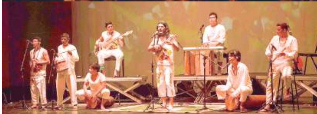
Agenda inclui espetáculos de música, dança, peças de teatro, além de saraus e exibição de filmes

da Orquestra de Violões, que formam o Quarteto Iberê, apresentam-se com canções de grande influência na MPB, trilhas de novelas e músicas que embalam muitos corações, num show romântico e intimista às vésperas do Dia dos Namorados. Os ingressos para o show já estão à venda no site https://shoppingressos.com.br ou na bilheteria do Teatro Amazonas.