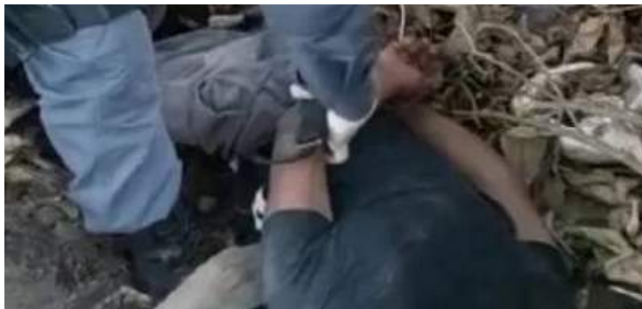
Homem foi encontrado pela PM com pés e mãos amarrados

Um homem, ainda não identificado, foi salvo pela Polícia Militar na quarta-feira (31), momentos antes de ser executado em um “tribunal do crime”, na rua Ibicaré, bairro Novo Aleixo, Zona Norte de Manaus.