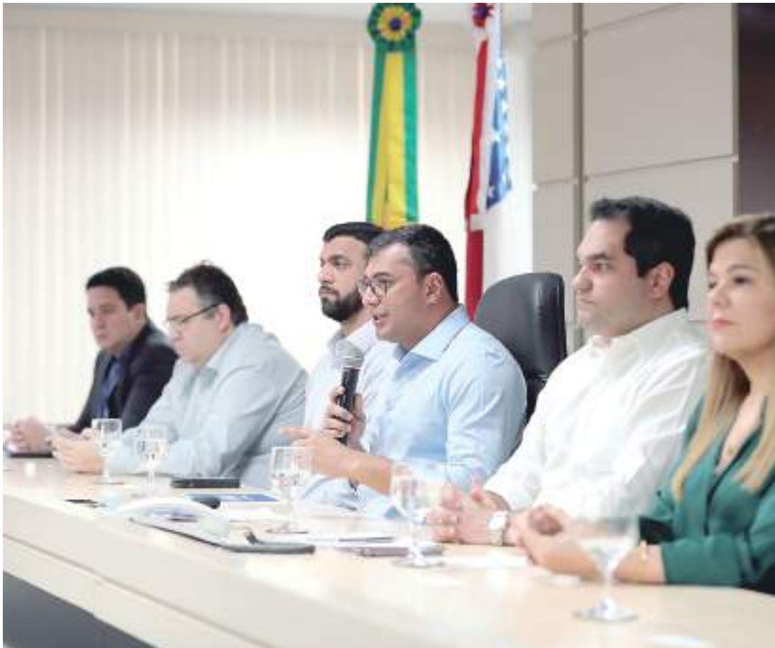
Wilson Lima garante que piso salarial pago aos professores da rede estadual chegará a R$ 5.129,16

O Governo do Estado também vai aumentar em