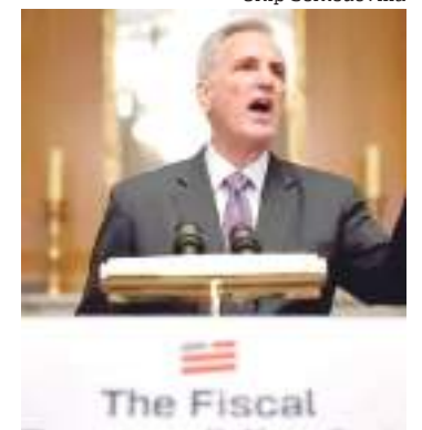
Presidente da Câmara dos EUA, o republicano Kevin McCarthy

Ela também limitará alguns gastos do governo nos próximos dois anos, acelerará o processo de licenciamento de certos projetos de energia, recuperará fundos não utilizados da covid-19 e expandirá os requisitos de trabalho para programas de ajuda alimentar para destinatários adicionais.