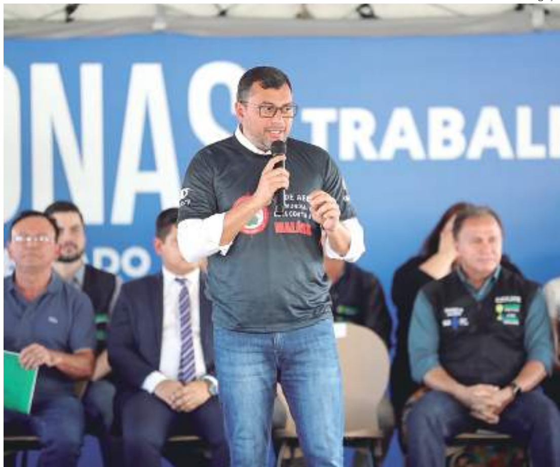
Plano foi lançado pelo governador durante entrega de 627 itens para o combate à doença

Entre as dificuldades em controlar a malária no estado, estão as áreas de difícil