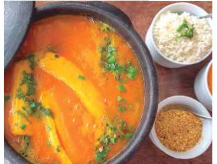
Estabelecimentos combinam a culinária amazonense com as delícias

Nas opções de hambúrguer, o Ancho disponibiliza dois pratos: o Vegan Burger, com pão de berinjela, hambúrguer de grão de bico, cogumelos, alface e ketchup de goiabada; e o Vegetariano Burger, com pão australiano, hambúrguer de grão de bico, cogumelos, creme de muçarela, alface e ketchup de goi-