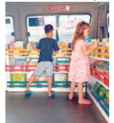
São 1200 obras de literatura infantil e infantojuvenil

“É muito gratificante colocar esse projeto em prática. Por meio dele, conseguimos incentivar o hábito da leitura e despertar a imaginação das crianças. Além disso, ampliamos o alcance da ação e formamos novas plateias e grupos de leitura”, conclui o secretário.