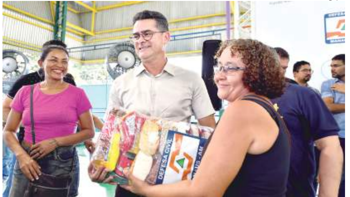
Esta é a terceira entrega de kits em menos de 20 dias

Além do valor de R$ 979.254,00, enviado pelo governo federal, foram empregados recursos do município para reduzir os impactos causados pelas chuvas em março. O dinheiro está sendo usado para serviços de infraestrutura, construção de moradias e trabalhos preventivos.