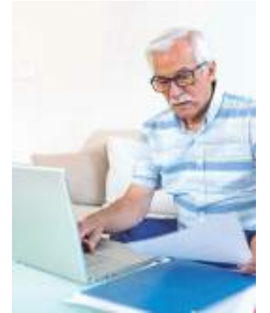
Cerca de 4 a cada 10 idosos pretendem pagar pendências

Para evitar esses tipos de fraude e renegociar com segurança, a Serasa reforça a importância de concentrar todas as operações nos sites oficiais e jamais compartilhar seus dados a terceiros.