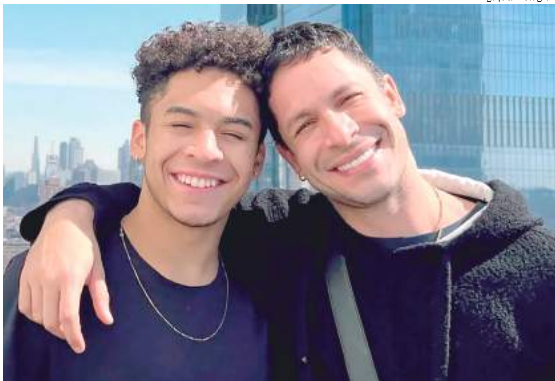
Pietro e o pai, Rainer Cadete

Rainer Cadete, de 35 anos, está seduzindo o público como Luigi, em Terra e Paixão, atual novela das 21h da Globo. Pouca gente sabe, mas o ator é pai de Pietro, de 16 anos, fruto do seu relacionamento com a ex-bailarina do Faustão Lily Alvez. Em entrevista realizada, o adolescente declara ser fã número um do pai e revela querer seguir os passos dele na carreira artística.