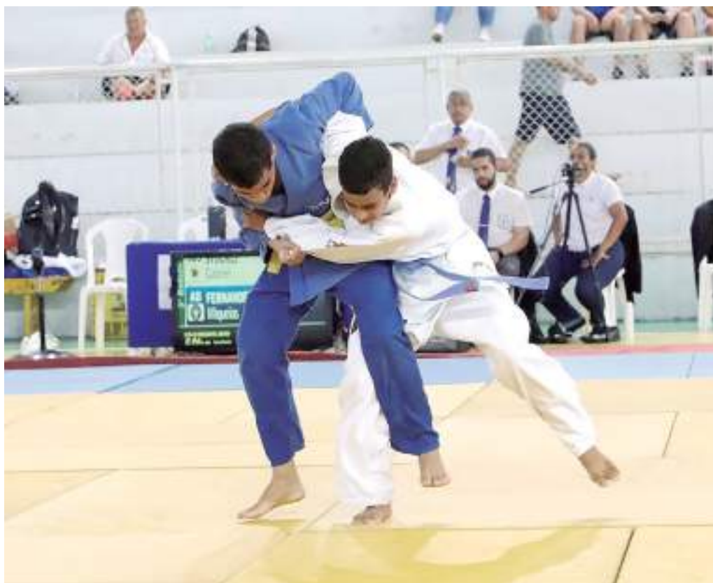
Federação de Judô do Amazonas realiza Copa Amazônia 2023 neste fim de semana