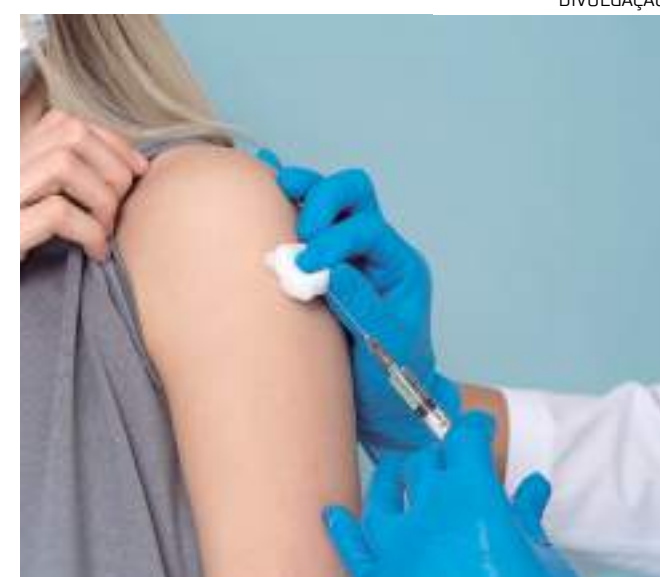
Serviço acontece de 10h às 17h no Amazonas Shopping

A vacinação é direcionada para o público em geral. No local, a equipe da Policlínica Naval de Manaus, da Marinha, irá avaliar o cartão de vacinação e verificar os imunizantes que faltam ser aplicados. Além da caderneta, é importante apresentar um documento de identidade com foto.