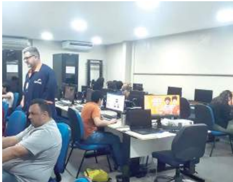
Senac-AM oferta cursos profissionalizantes no setor da tecnologia