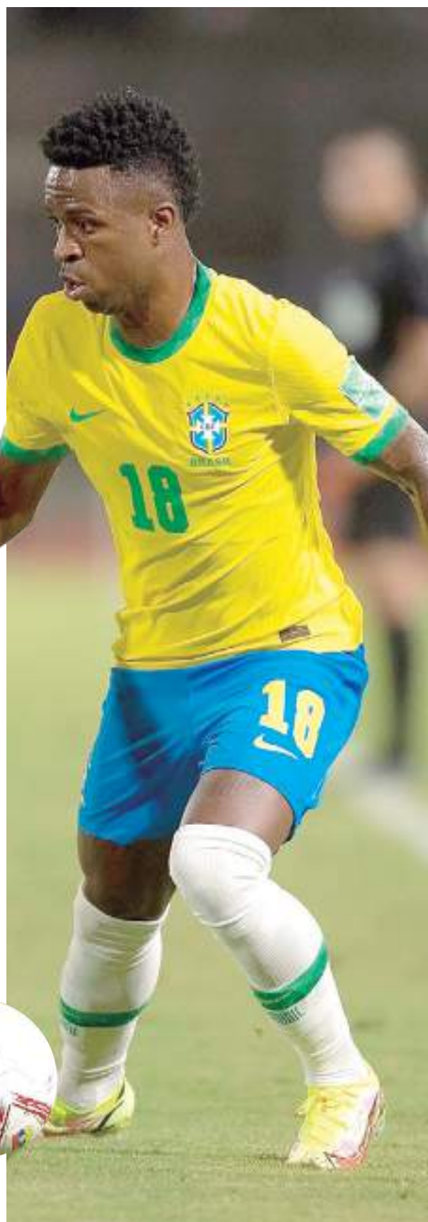
Vini Jr é titular absoluto da Seleção Brasileira

quarta-feira (13) com o grupo quase completo. A preparação foi feita pelo técnico interino Ramon Menezes, no CT do Espanyol, em Barcelona.