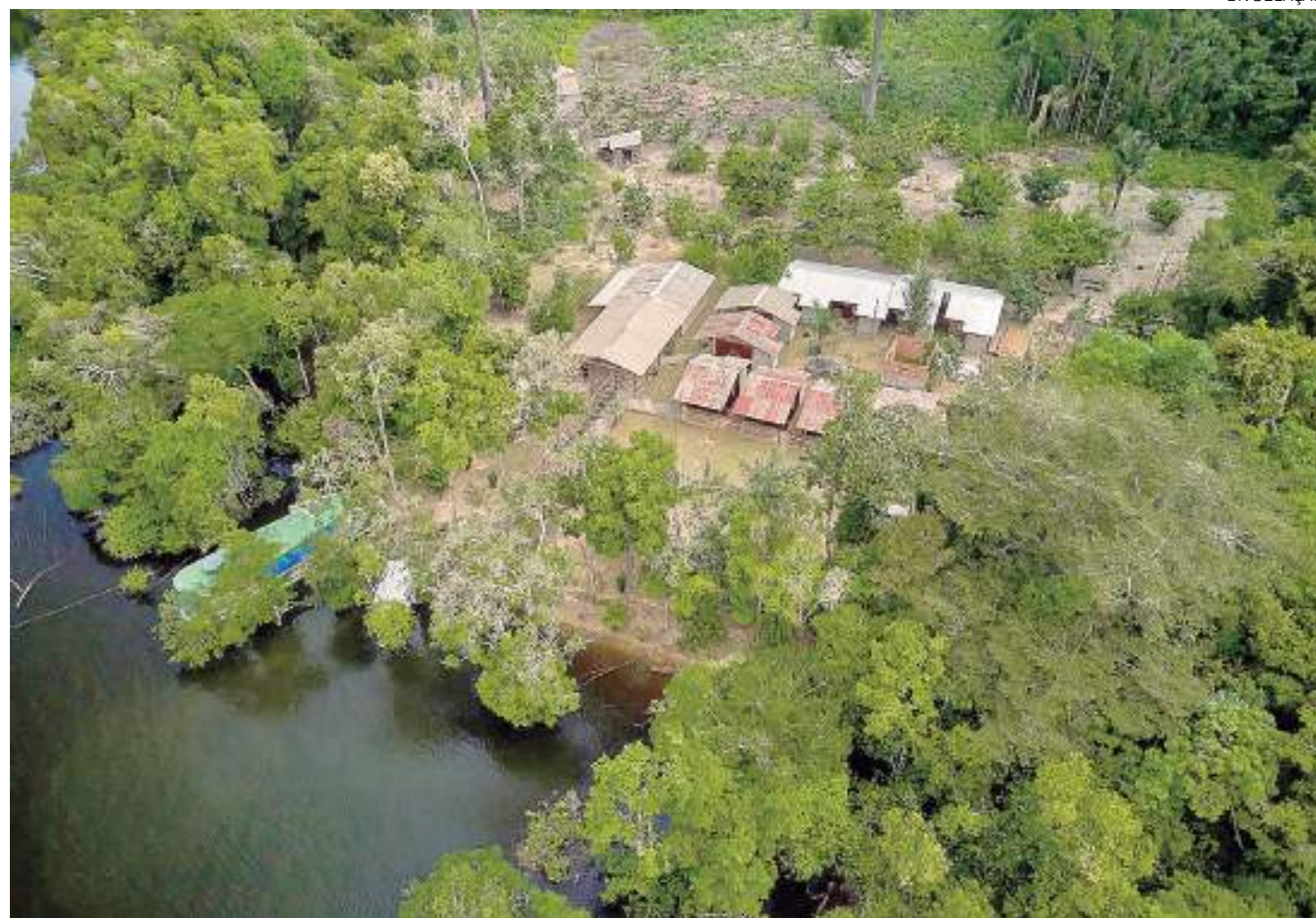
Evento on-line antecede a Cúpula da Amazônia, que acontecerá em agosto