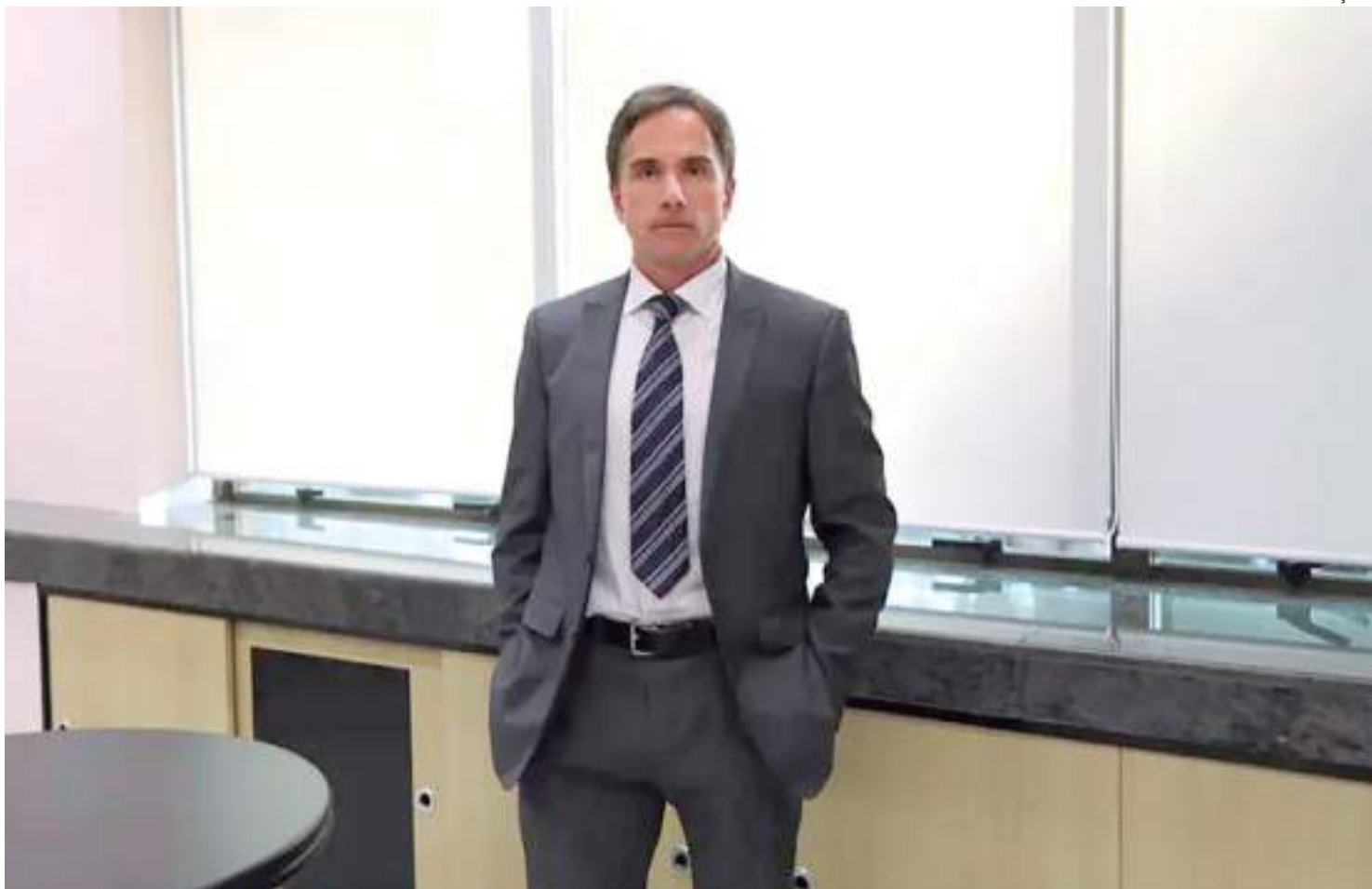
Juiz depois ao Conselho Nacional de Justiça que valores teriam sido distribuídos sem obedecer a critérios do próprio CNJ

técnicos da Vara que levantassem documentos com a Caixa Econômica Federal para descobrir para que órgãos a diferença de cerca de R$ 642 milhões tinha sido transfe-