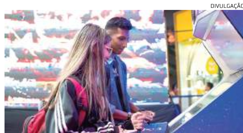
Programação segue até dia 23 de junho no Amazonas Shopping