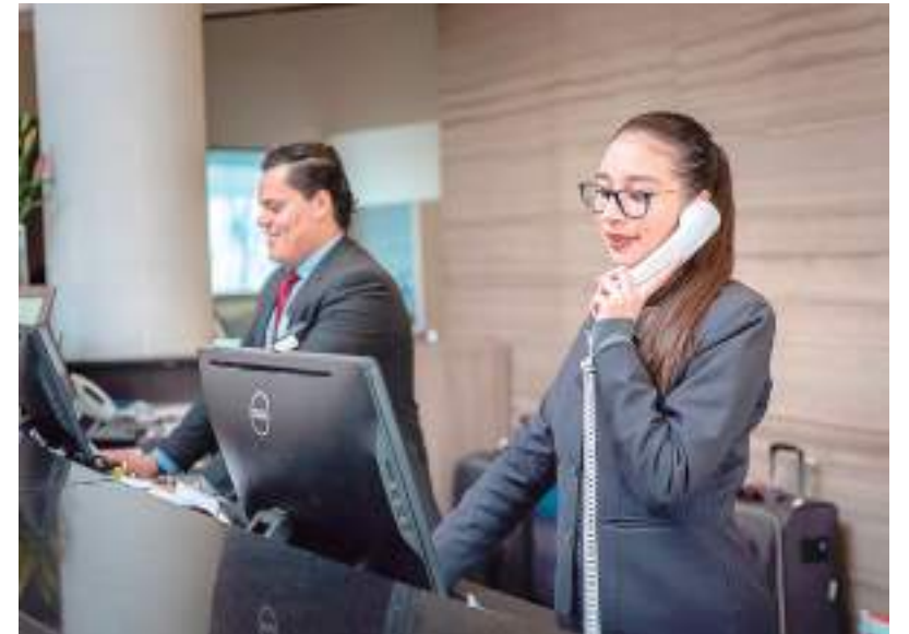
Evento aborda competências de um profissional disputado pelas empresas