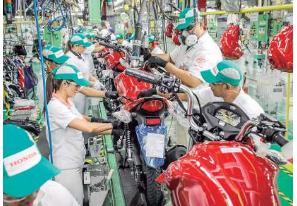
Produção de motocicletas nas linhas de produção do Polo Industrial de Manaus

A região Nordeste foi a que registrou o maior crescimento no ranking de emplacamentos. Em maio, foram licenciadas 49.807 motocicletas, alta de 26,9% na comparação com o