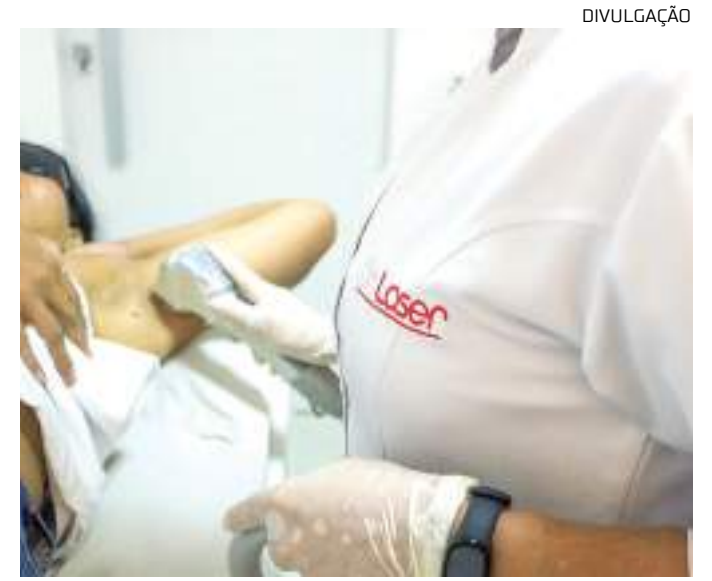
Remoção de pelos é realizada por fisioterapeuta dermatofuncional

A foliculite, segundo a especialista, é uma infecção causada na maioria das vezes pela dificuldade dos pelos de sair da pele. Essa inflamação, iniciada nos folículos pilosos, pode ser