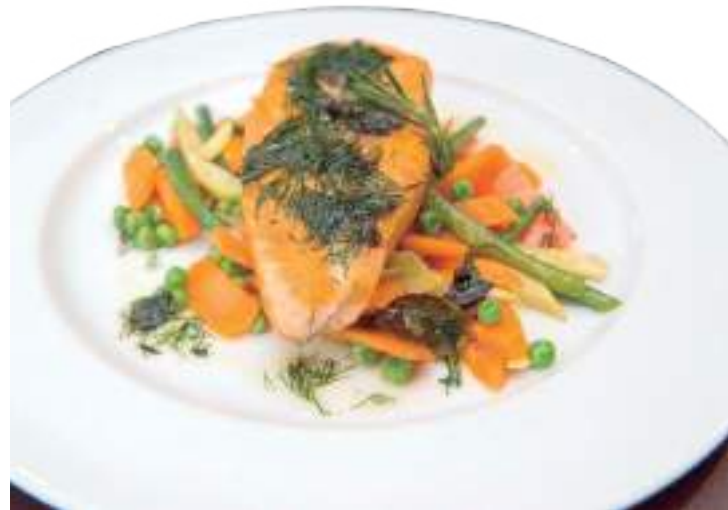
Salmão com legumes, receita do Belle Époque

um bom hamburger, a pedida é o Fire Burger – que também já é parceiro do Kwati e dispensa apresentações. "Reunimos de tudo um pouco para que os nossos clientes possam se sentir em casa, com conforto, comodidade e sem passar perrengue. A edição de 2023, com certeza, será inesquecível", finaliza Egreen.