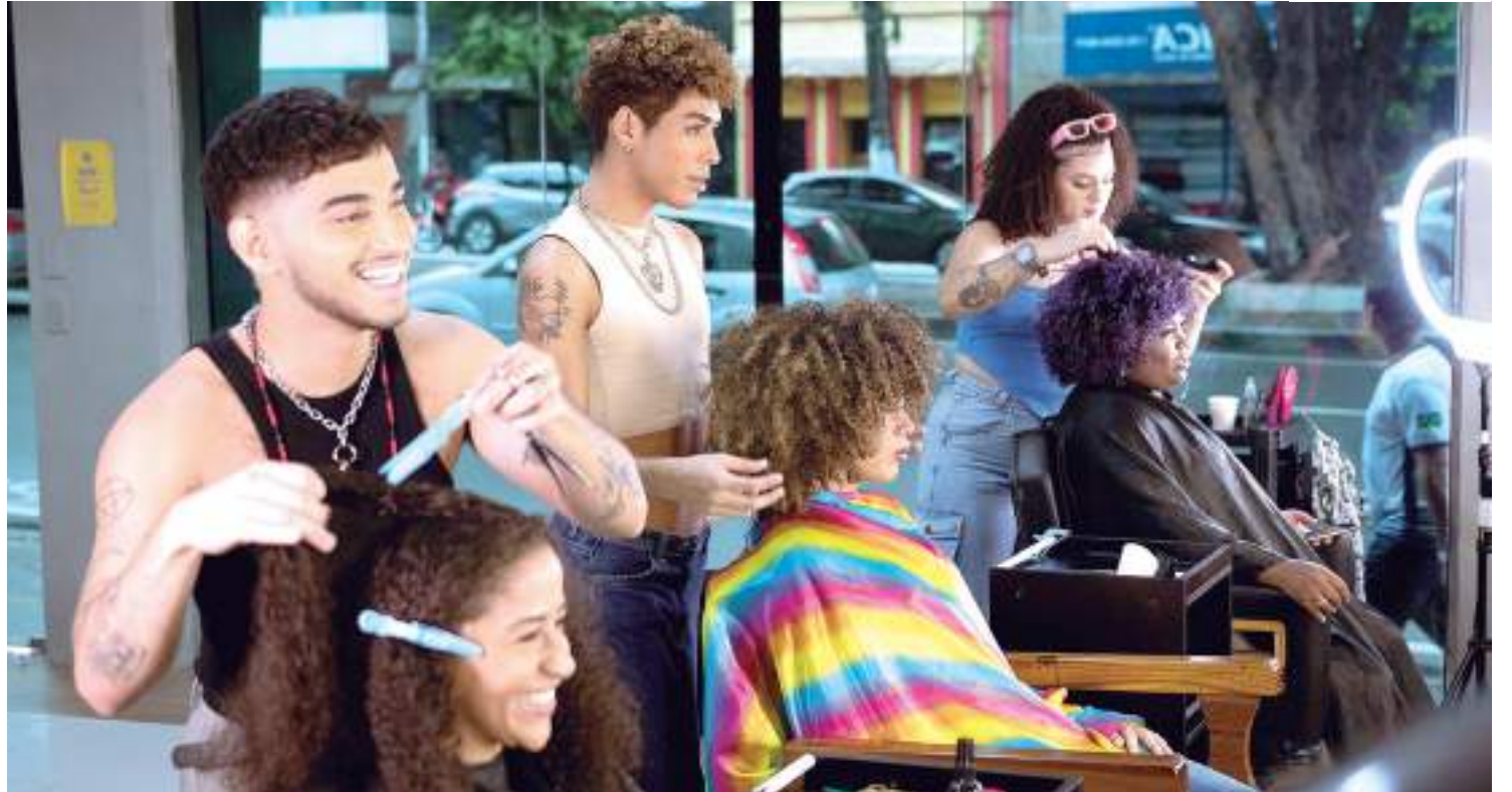
Matheus Sant Studio atende clientes com cabelos cacheados, crespos, ondulados e lisos naturais

Além de Matheus, o salão possui dez funcionários LGBTQIAP+ e a meta é expandir o número de traba-