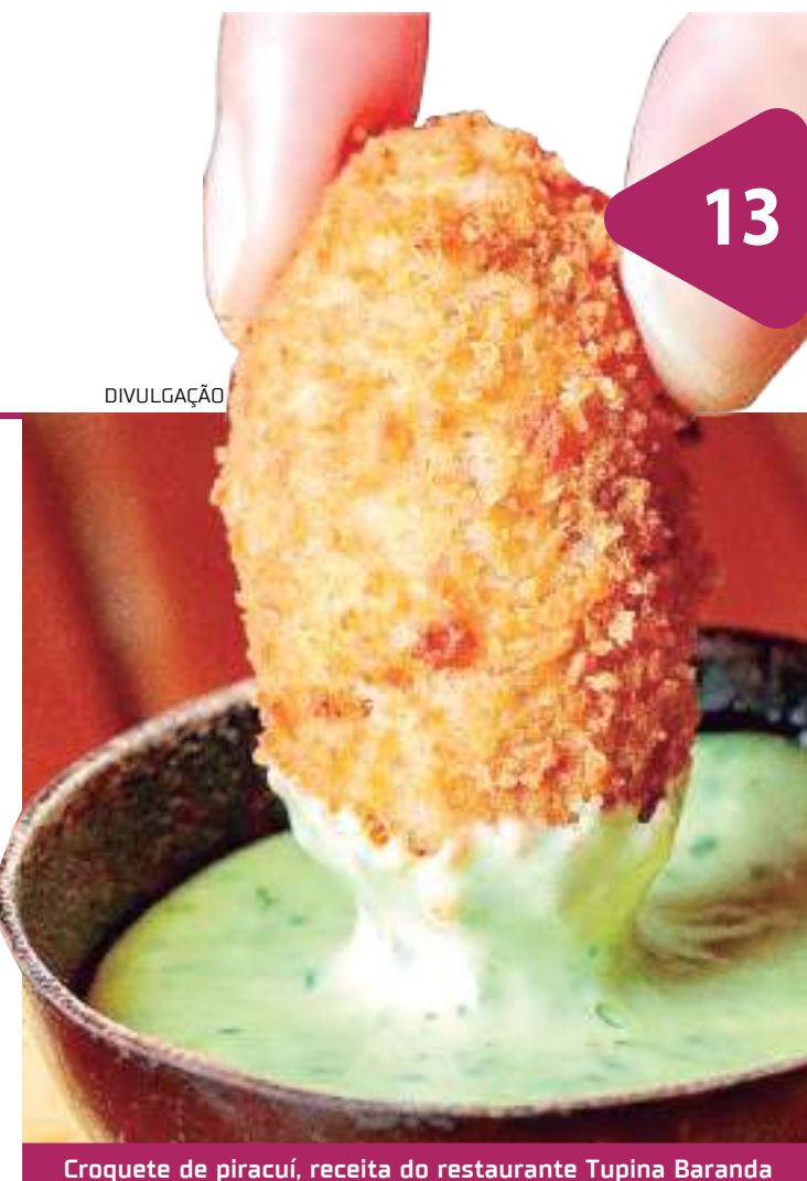
Croquete de piracuí, receita do restaurante Tupina Baranda

No Espresso Parintins, o público poderá desfrutar de salgadinhos e doces, além do famoso e indispensável x-caboquinho (pão, tucumã e queijo coalho). E para quem não dispensa