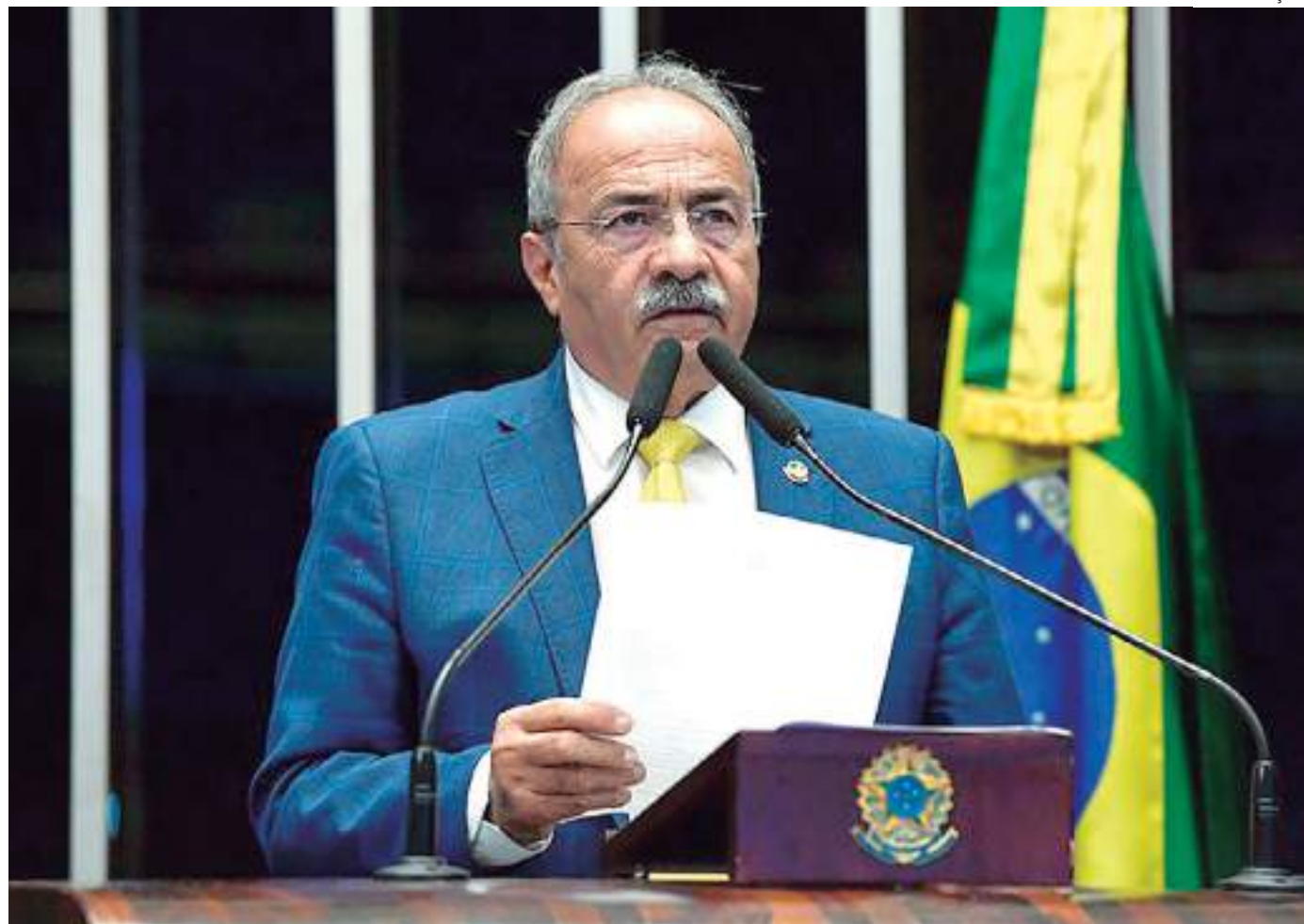
Senador Chico Rodrigues nega qualquer irregularidade no caso

Styvenson Valentim (Podemos-RN) será julgado por uma transmissão ao vivo realizada em 2021 quando ele ironizou a então deputada Joice Hasselmann, que disse ter sido vítima de uma