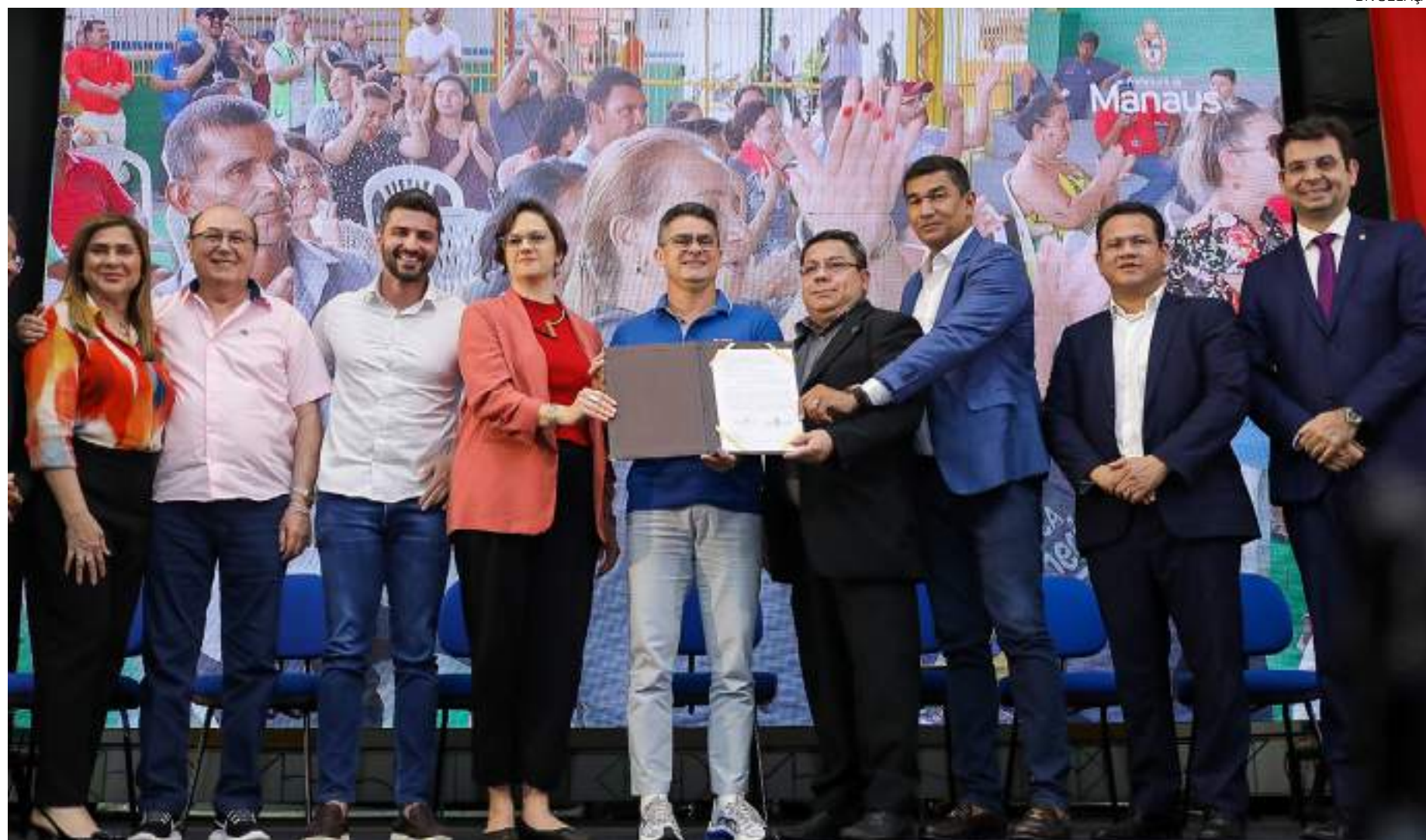
David Almeida destacou papel da Secretaria Municipal de Habitação e Assuntos Fundiários na parceria

“A partir de agora, esses moradores vão receber o título de posse e o registro do cartório. A nossa prefeitura se preocupa com isso. Já vamos entregar o registro completo aos moradores. Vamos fazer essas tratativas para que o mais breve possível pos-