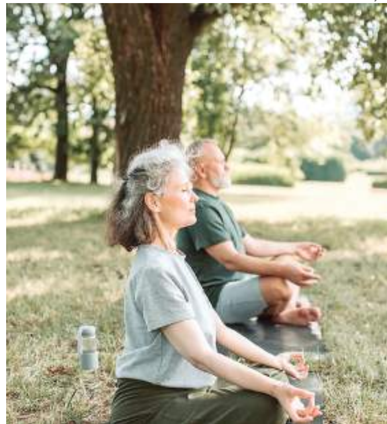
Atividade física auxilia na longevidade segundo especialista

Além da Defensoria Pública, há outros canais para denunciar violência contra o idoso, entre eles, a Delegacia Especializada de Crime Contra Idoso, localizada na rua do Comércio, 270 - Parque Dez, e o Disque 100.