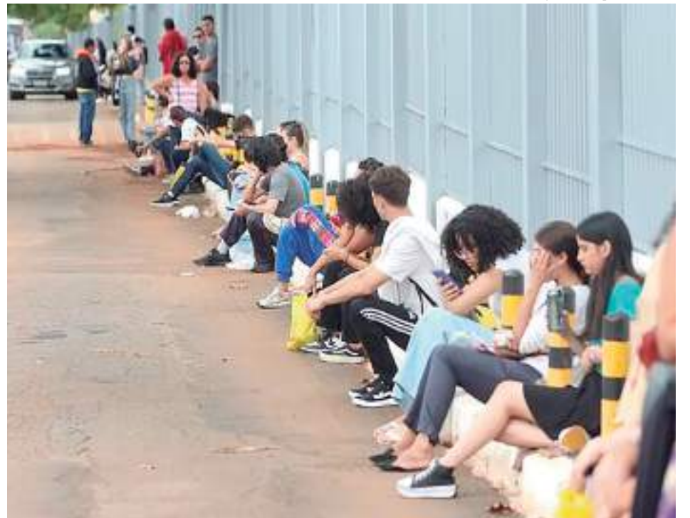
As inscrições para o Enem podem ser feitas até o dia 16 deste mês

Na última edição, em 2022, 3,3 milhões de candidatos se inscreveram para as provas do Enem. Cinco anos antes, em 2017, o Enem registrou mais de 6 milhões de inscritos confirmados.