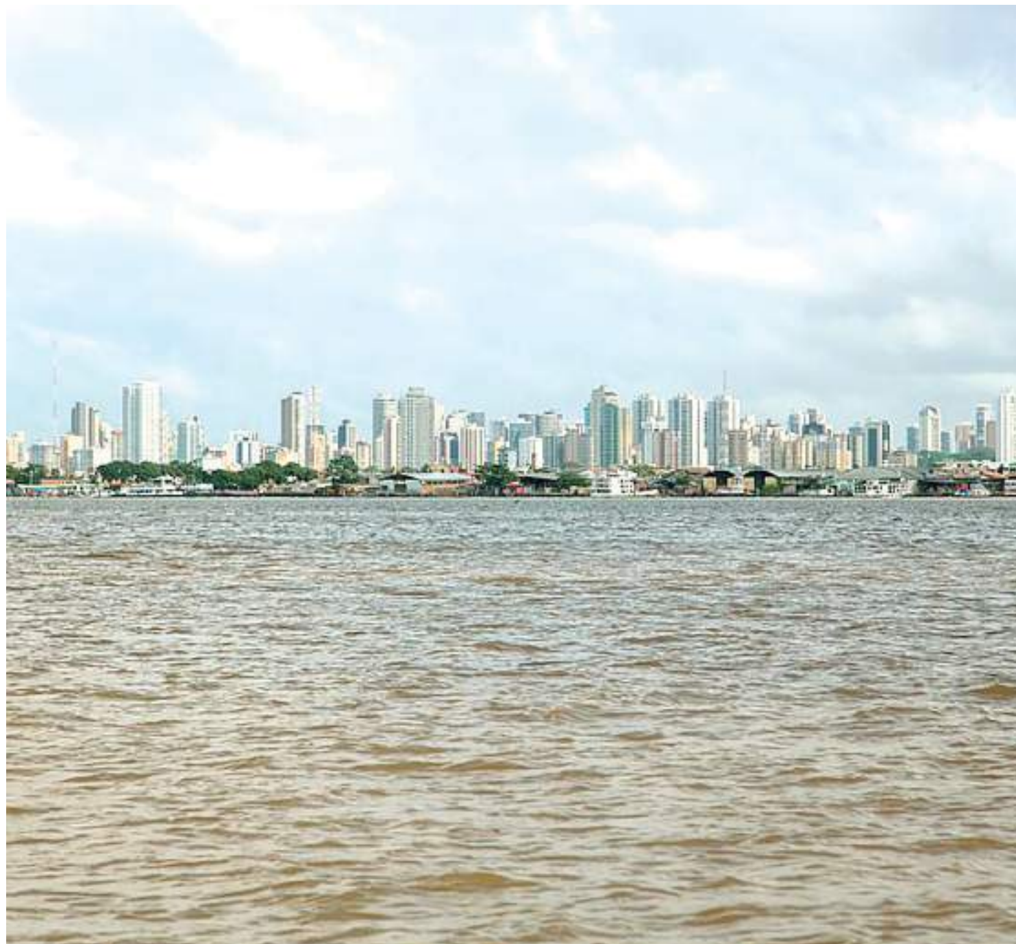
Anúncio da escolha pela capital paraense ocorreu no fim de maio

A capital paraense também se prepara para realizar, no dia 8 de agosto, a reunião dos oito países integrantes da Organização do Tratado de Cooperação Amazônica (OTCA). Participam os presidentes de Brasil, Bolívia, Colômbia, Equador, Guiana, Peru, Suriname e Venezuela. Um documento aprovado no encontro será apresentado durante a próxima Assembleia das