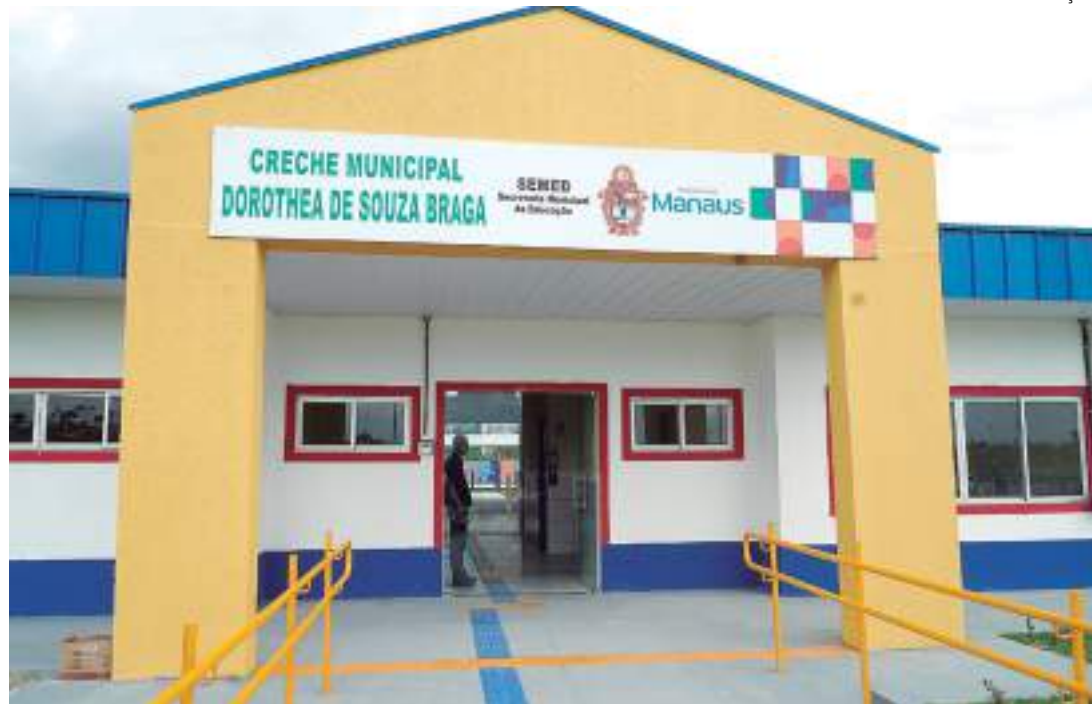
Edifício tem capacidade para atender 204 alunos