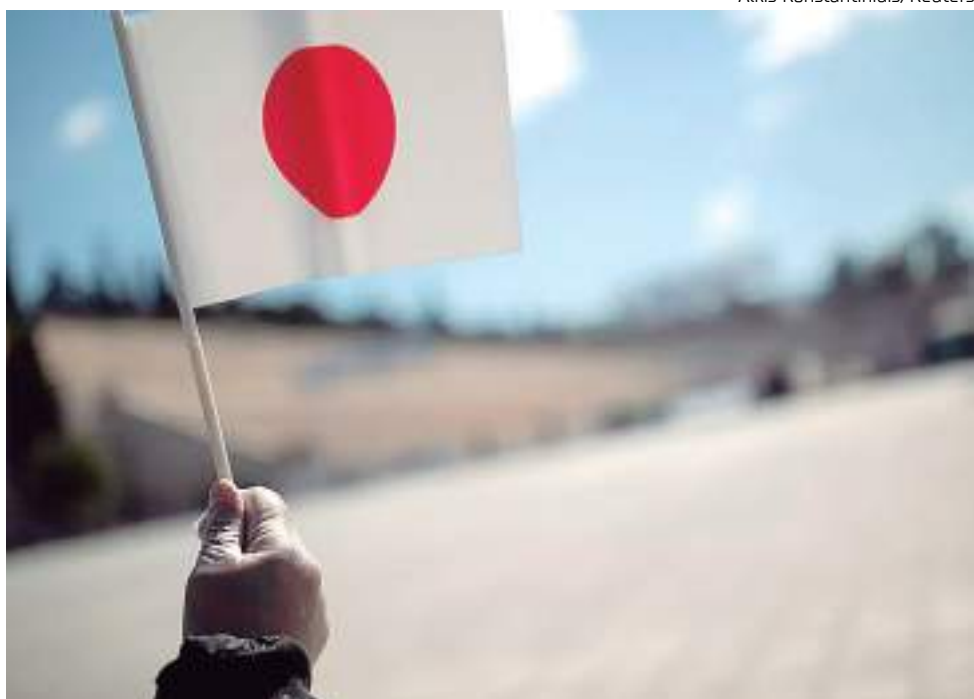
Bandeira do Japão