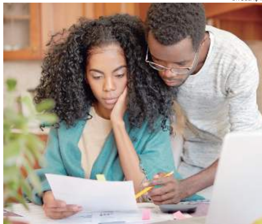
Pesquisa da Serasa revela que contas conjuntas vêm caindo em desuso e que 40% dos casais dividem as despesas igualmente

Entre os casais separados ou divorciados, questionados sobre o principal motivo que os levaram ao término da relação, os problemas financeiros aparecem em segundo lugar (27%), atrás de dificuldades na comunicação (41%). Além disso, 19% do total de respondentes revelou já terem tido seu nome negativado por causa do parceiro. "Falar sobre dinheiro não é romântico, mas é necessário, muitas vezes para evitar até situações de violência patrimonial", alerta Valéria. "É primordial que cada indivíduo saiba quais são seus direitos em uma relação – inclusive, quando falamos em dinheiro".