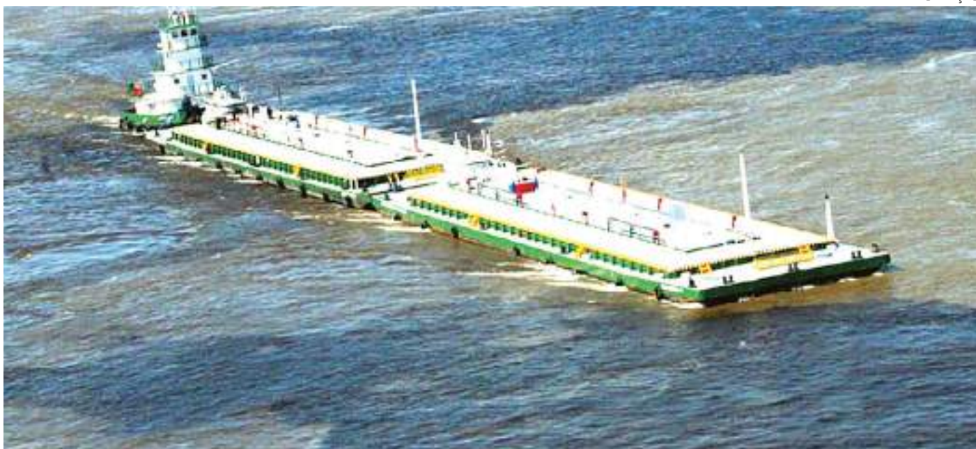
Dados são referentes ao primeiro semestre de 2023