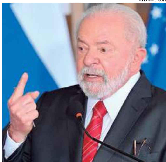
Apoio ao presidente oscila negativamente, mas ainda é maior que o de Jair Bolsonaro no mesmo período

Outro recorte feito pela pesquisa Ipec se dá com relação ao apoio ao governo Lula entre eleitores que votaram em branco ou nulo no segundo turno das eleições. Neste segmento, os que apontam a gestão como ruim ou péssima são minoria (33%). A maior parte dessa população considera o governo como regular (43%) e 17% avaliam como ótimo ou bom.