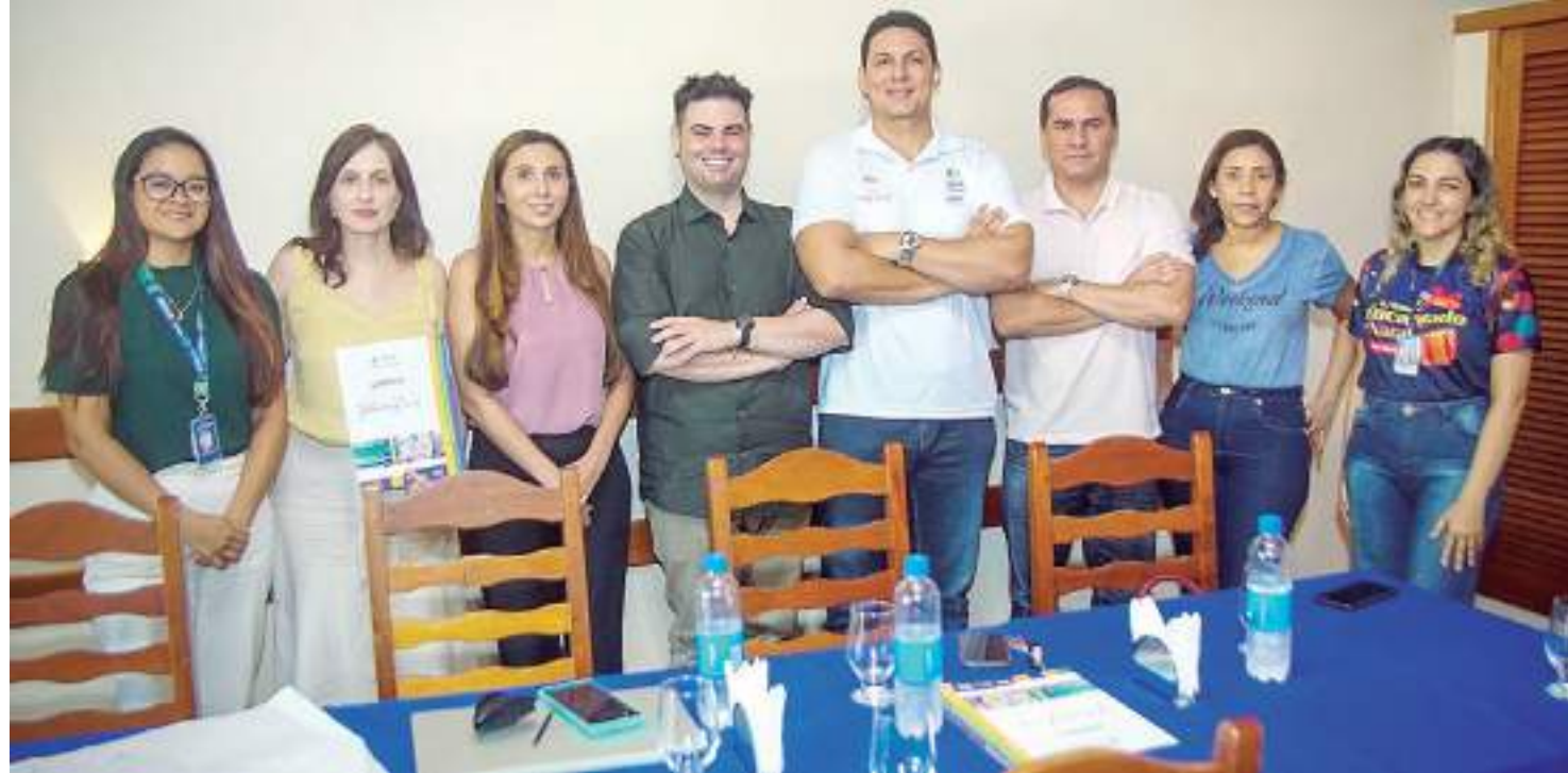
Reunião entre secretariado do governo e representante do BID discutiu ações em prol do turismo