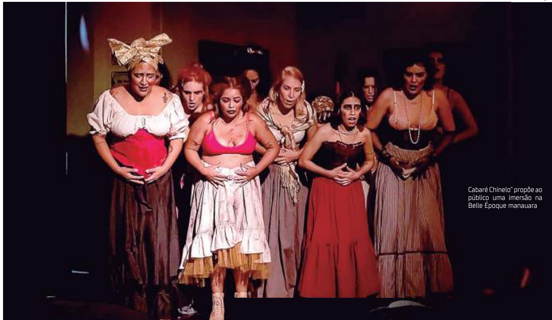
"Cabaré Chinelo" propõe ao público uma imersão na Belle Époque manauara