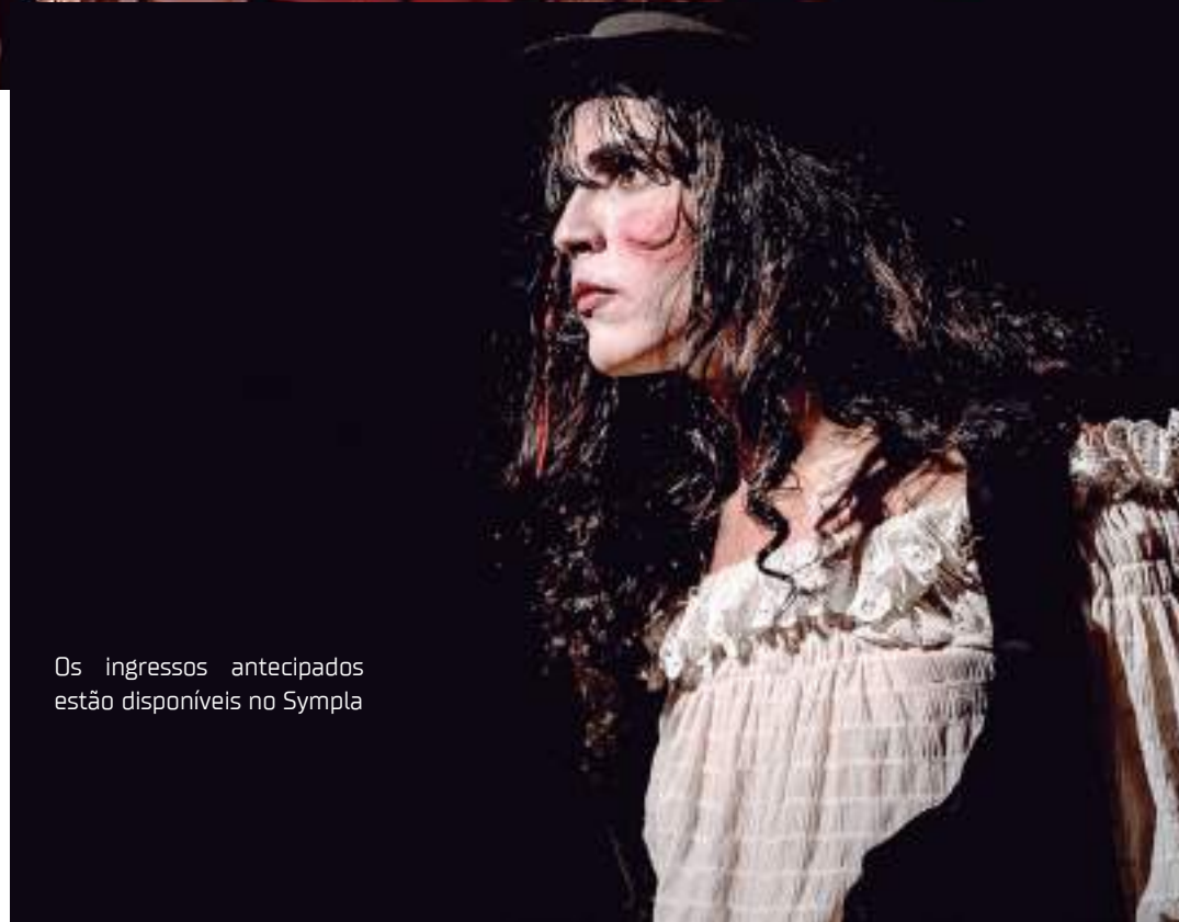
Os ingressos antecipados estão disponíveis no Sympla

"Antonieta teve uma narrativa de violência com a qual eu posso me identificar. Vivo dando voz para outras travestis, ecoando as vozes delas para lugares onde não puderam estar e sinto que a Antonieta é isso também, ela reúne vivência de mulheres que não puderam falar, que não tiveram escolhas", comenta a artista. "Como uma pessoa trans, é representativo para mim estar em cena. Sei que, para comunidade, esse lugar que outras pessoas não se veriam se eu não tivesse lá é forte"