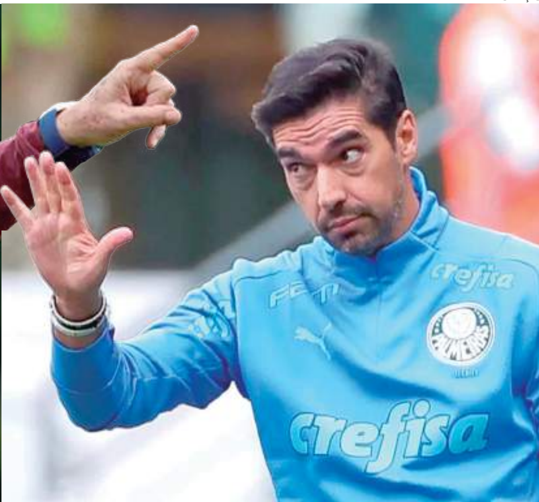
Abel Ferreira coleciona título no comando do Palmeiras

O São Paulo recebe o Palmeiras, neste domingo (11), às 15h (de Manaus), pelo primeiro Choque-Rei, do Brasileirão nesta temporada. A partida será no Morumbi, pela 10ª rodada do torneio, essa será a segunda vez no ano que os rivais se encontram. Apesar dos poucos encontros na atual temporada, São Paulo x Palmeiras é um dos clássicos mais disputados e equilibrados dos últimos anos. Desde 2021 que o Choque-Rei vem sendo um clássico que é disputado de forma constante, independente do torneio.