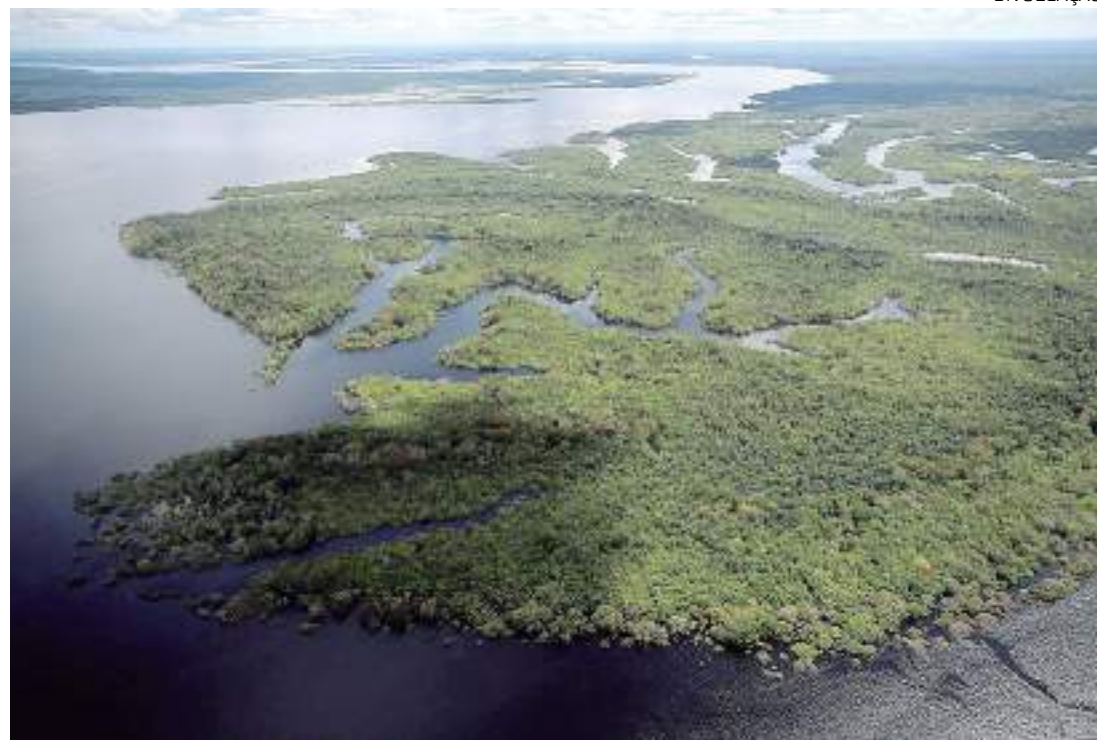
Além da RDS do Uatumã, receberão o projeto a Área de Proteção Ambiental Caverna do Maroaga, e a RDS Plagaçu Purus

A unidade na RDS do Uatumã está localizada na comunidade Bom Jesus do Angelim, onde moram mais de 20 famílias, que vivem da agricultura sustentável. Conforme o fiscal da Secretaria de Educação na obra, engenheiro Renato