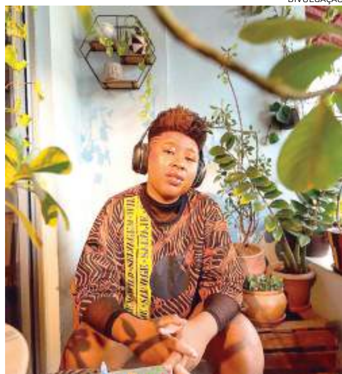
Cantora é natural de Maués, interior do Amazonas

Novamente inspirada pelo ritmo do afrobeats, estilo musical nascido na Nigéria e difundido pelo