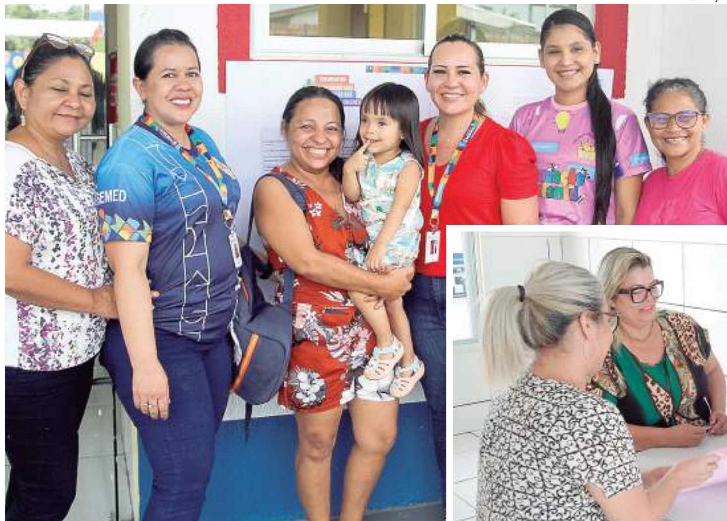
Equipe pedagógica e pais de alunos

“Ofertamos para todas as unidades de Maternal, o currículo da educação infantil, que tem naturalmente as especificidades de creche. As crianças estão nesses espaços para o desenvolvimento delas. Atendemos de acordo com a legislação e sempre voltados para a promoção do desenvolvimento das crianças”, finaliza.