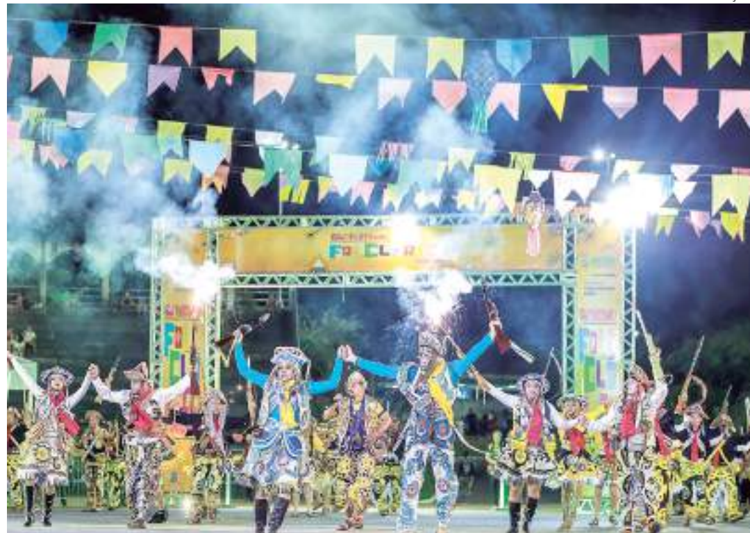
Evento terá apresentações musicais, quadrilha, entre outras atividades

E para dar oportunidade a novos grupos que almejam ingressar na disputa oficial, nos dias 11 e 12, dezoito danças se apresentarão na modalidade "Mostra Folclórica", sem avaliação de jurados