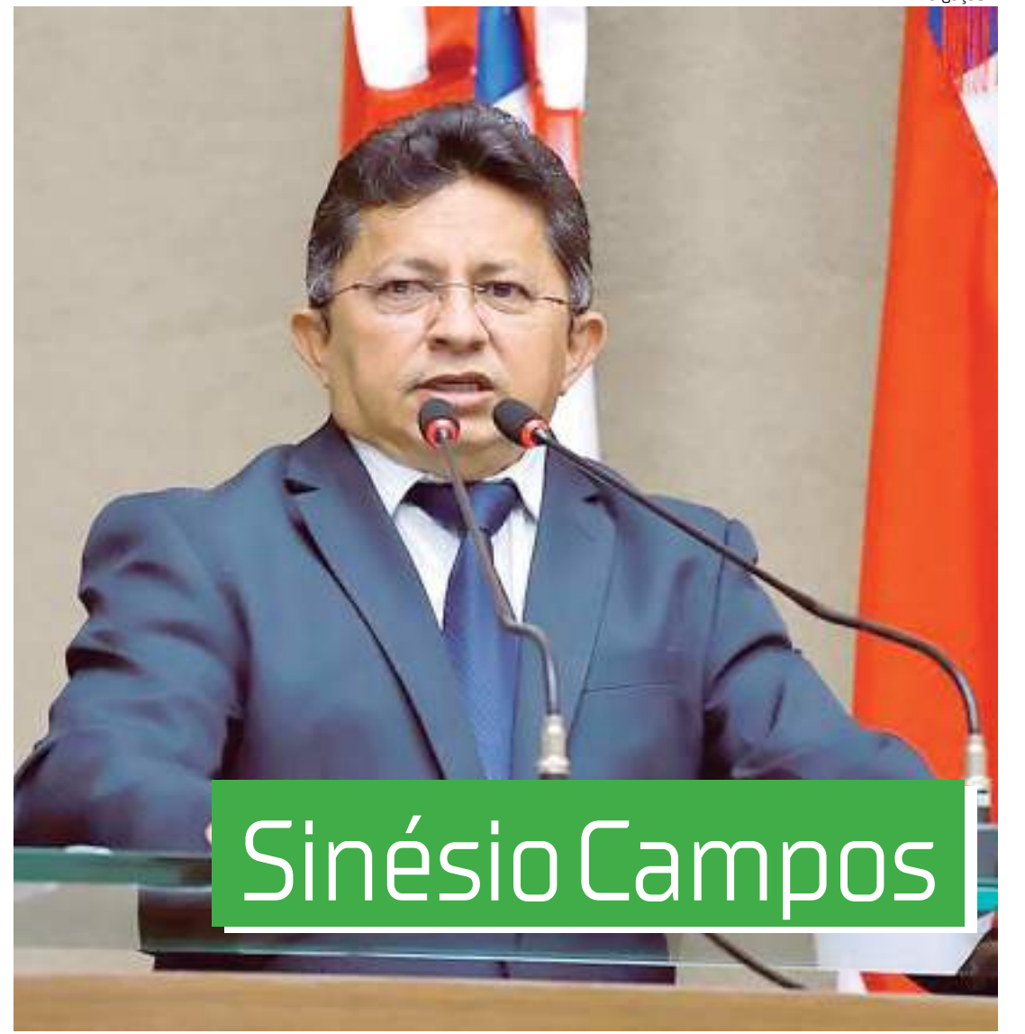
Parlamentar discursando na tribuna da Assembleia Legislativa do Amazonas

E com isso, eu identifiquei mais um motivo que me levou a ser o relator da quebra do monopólio do gás, porque só está sendo possível o aproveitamento do gás em energia, como para combustível auto-