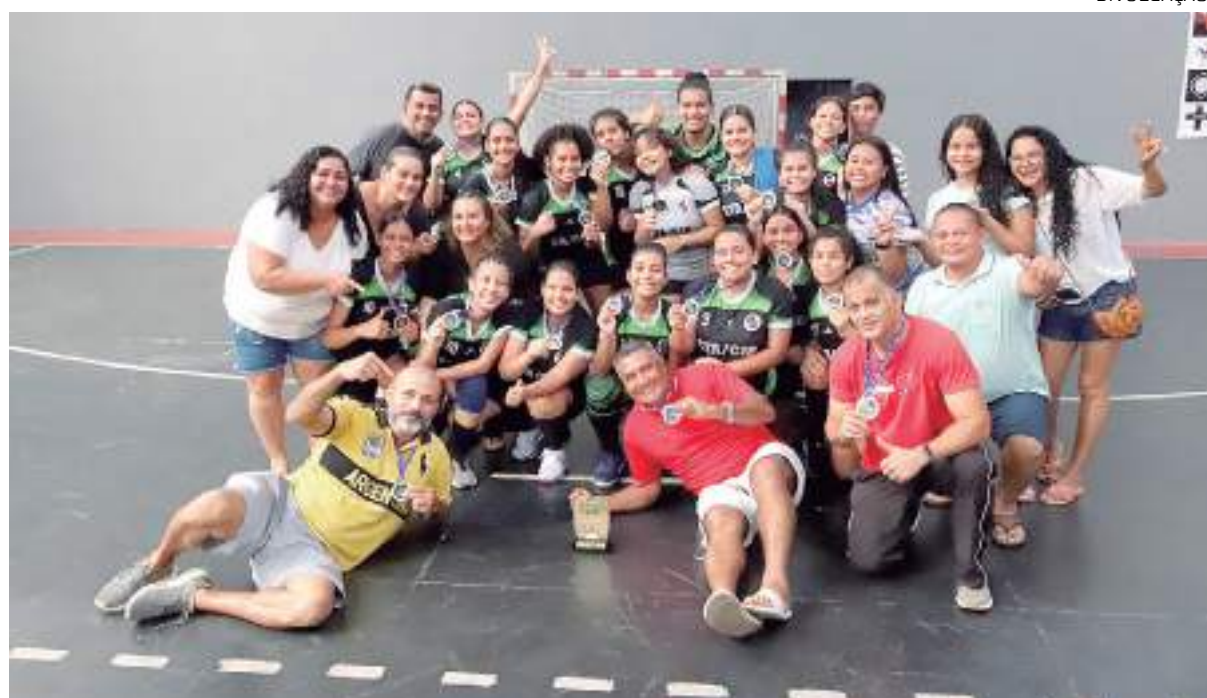
Santa Etelvina/CETI João Braga conquista Taça Manaus de Handebol