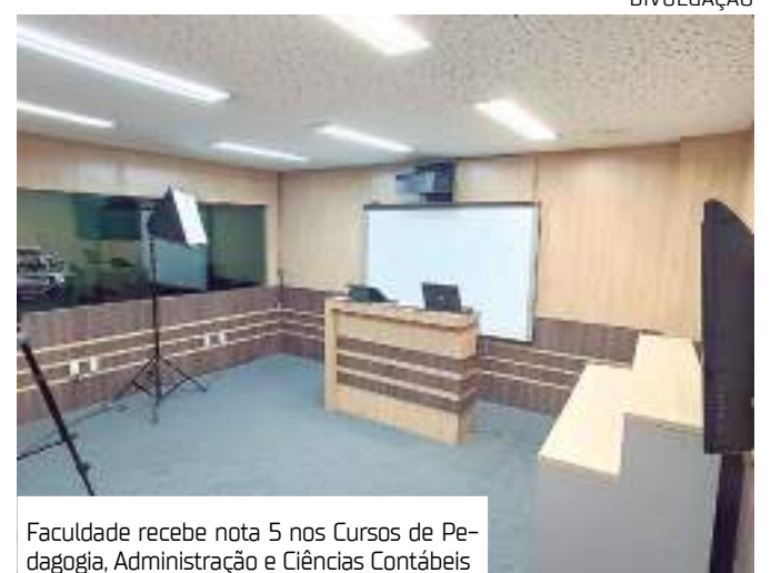
Faculdade recebe nota 5 nos Cursos de Pedagogia, Administração e Ciências Contábeis

Tudo o material didático do EaD Fametro é produzido internamente por equipe própria, composta por profissionais da área de audiovisual, impressos e WEB. Além disso, os alunos contam com o suporte de tutores e professores especializados que estão disponíveis para sanar dúvidas e orientar os estudantes ao longo do