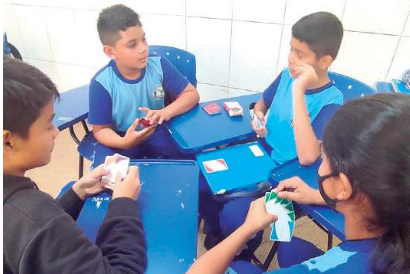
A ação alcançou 120 alunos da Escola Estadual Maria Ivone de Araújo Leite

"A Fundação desenvolve um papel de fundamental importância, pois possibilita