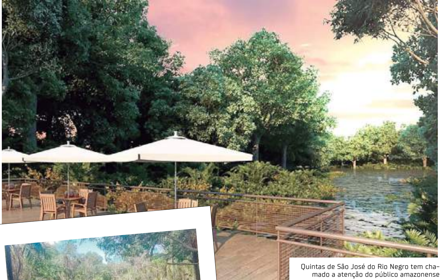
Quintas de São José do Rio Negro tem chamado a atenção do público amazonense

“O Quintas de São José do Rio Negro tem se sobressaído por pensar em espaços para familiares e amigos e sustentabilidade de oferecer itens como iluminação de Led que geram econo-