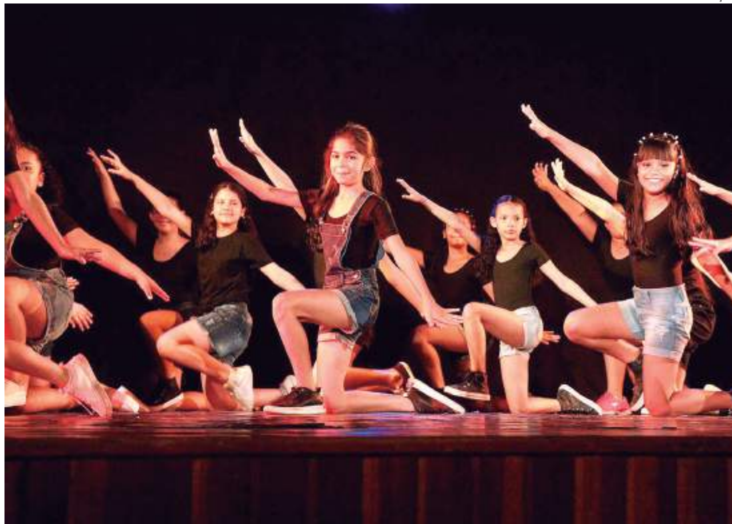
Apresentações teatrais, palestras de prevenção e sensibilização, dentre outras atividades, fizeram parte das ações iniciadas durante a campanha