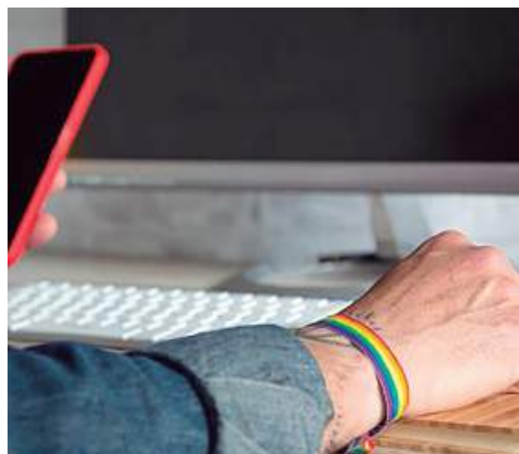
Projetos selecionados receberão investimento de até R$ 55 mil