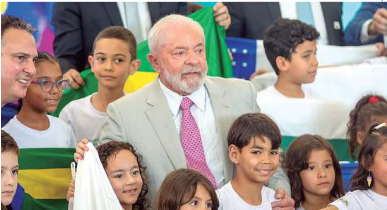
Lula recebeu estudantes em cerimônia no Palácio do Planalto e discursou sobre importância do setor de educação

"O compromisso não é uma ideia que o Ministério da Educação [MEC] tirou do seu chapéu, pelo contrário, foi construída após muito diálogo com especialistas e gestores dos demais níveis federativos. Ele nasceu da colaboração e com a cooperação sairá do papel e fará diferença nas salas de aula", disse, afirmando que espera a adesão de todos os 27 governadores ao compro-