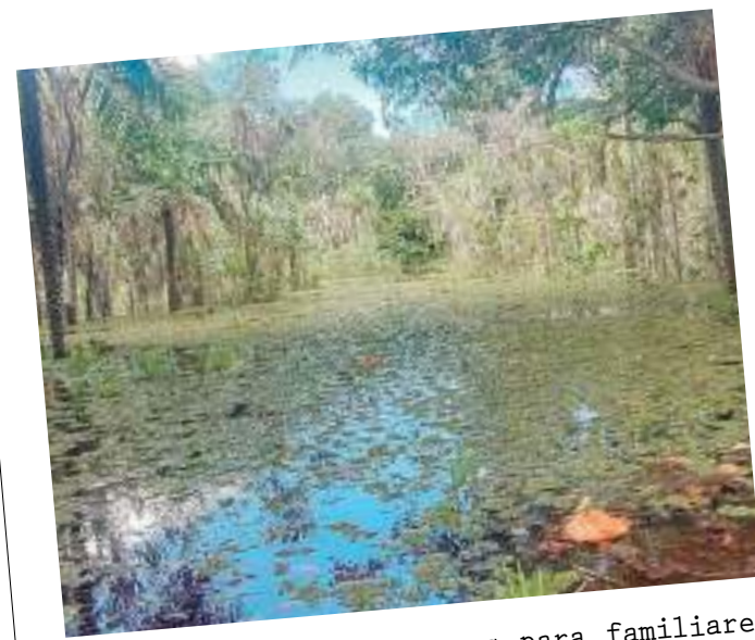
Quintas conta com espaços para familiares e amigos, investindo em sustentabilidade

mias de até 90% de energia”, informou o diretor da CIA Multiplataforma.