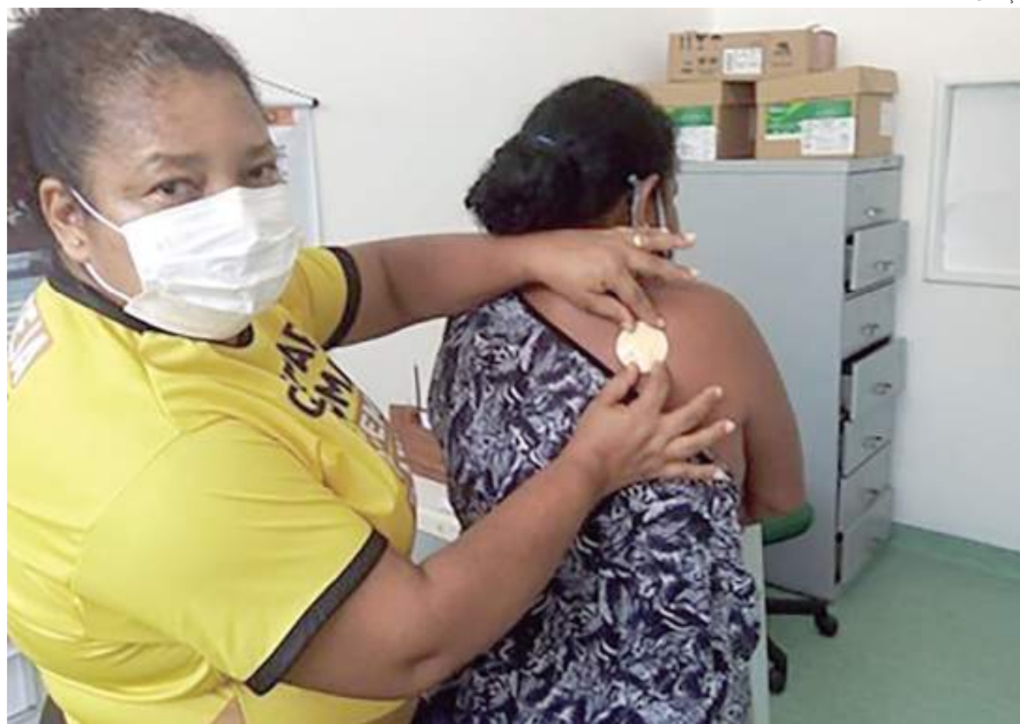
Ao todo, 22 profissionais de saúde receberam treinamento

"O principal objetivo do programa é reduzir o número de fumantes, porque o