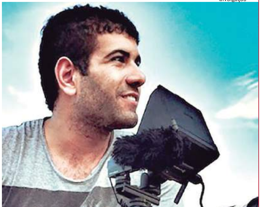
Cineasta paulista já filmou na Amazônia

O cineasta que estreia na Sonoraplay já esteve na Amazônia, onde já filmou e garante que pretende voltar. Ele deu um spoiler e garantiu que seu primeiro longa, o documentário "A Primeira Vez do Cinema Brasileiro", é a sua dica para os entusiastas da sétima arte começarem a ver na Sonoraplay.