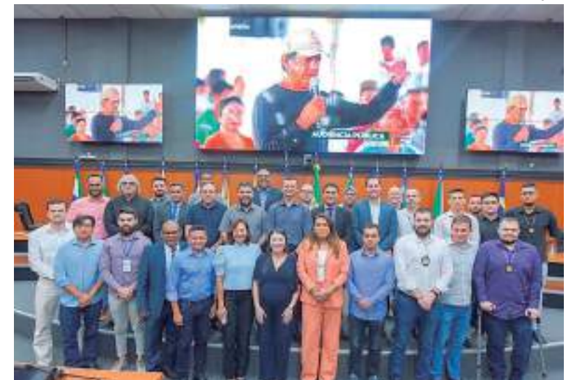
Audiência pública debate os Desafios da Reforma Tributária na ALE-RR