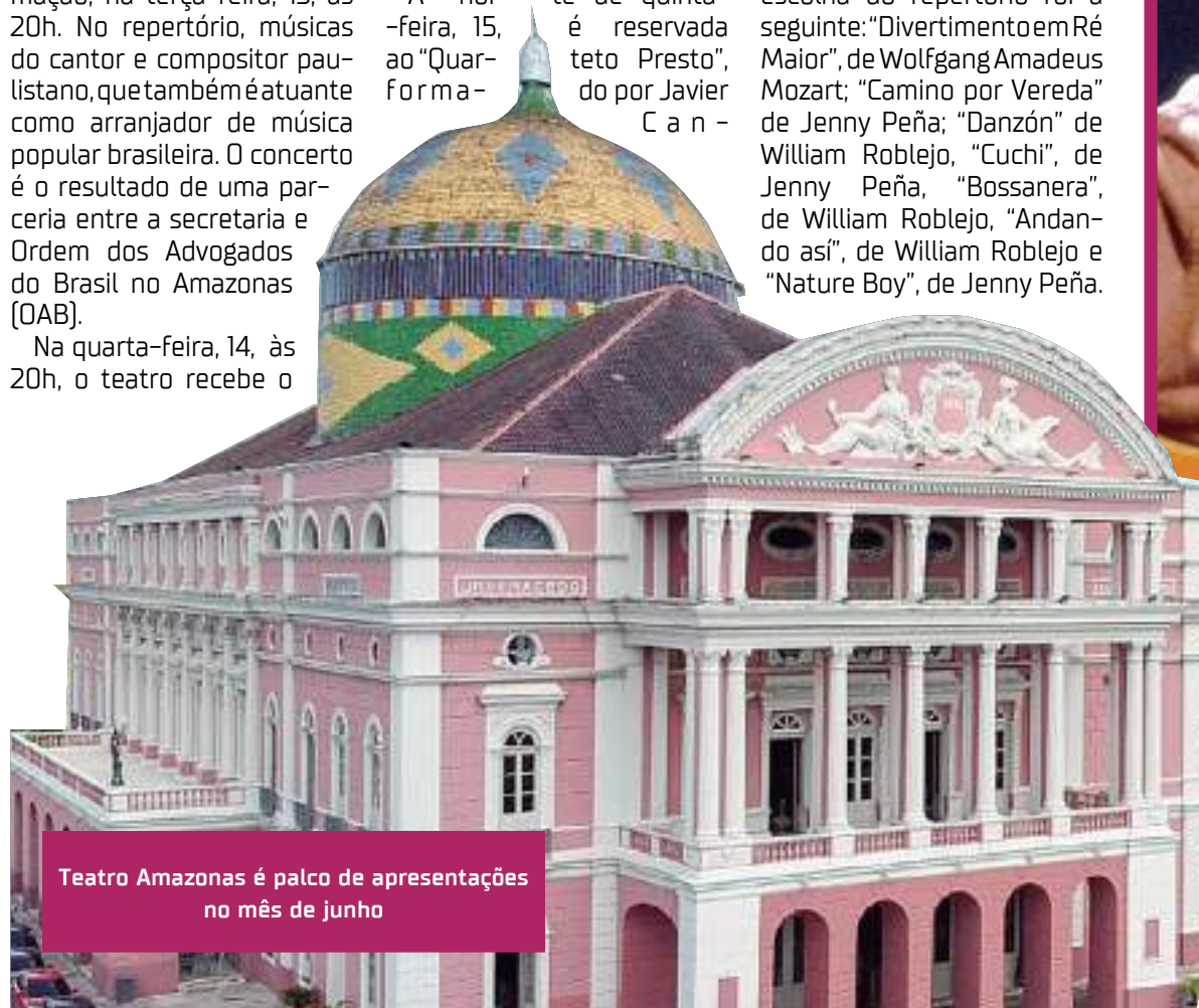
Teatro Amazonas é palco de apresentações no mês de junho