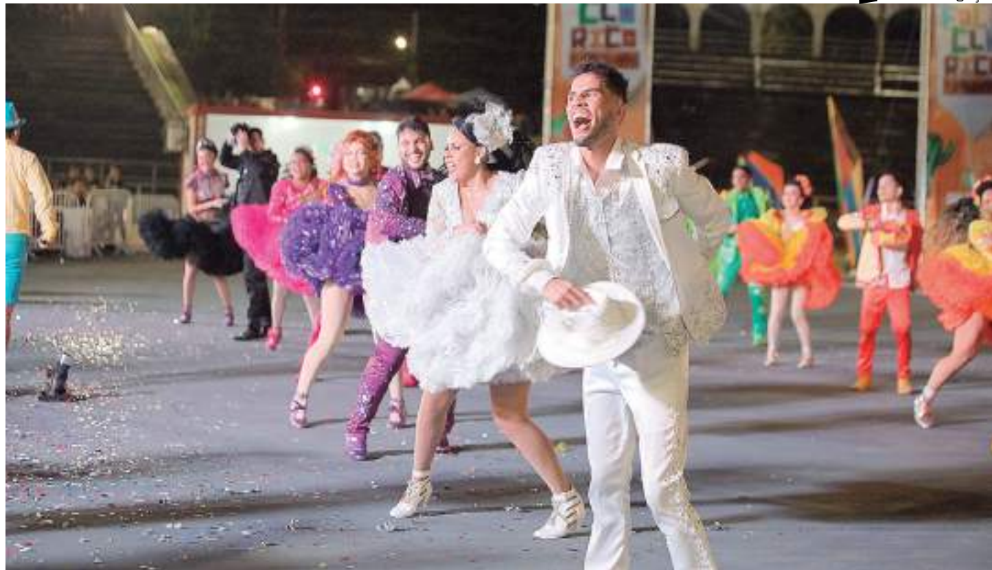
Neste ano, 18 grupos folclóricos se apresentam pela primeira vez

O evento é promovido pela Prefeitura de Manaus, em parceria com o governo do Amazonas, por meio da Fundação Municipal de Cultura, Turismo e Eventos (Manauscult), Secretaria de Estado de Cultura e