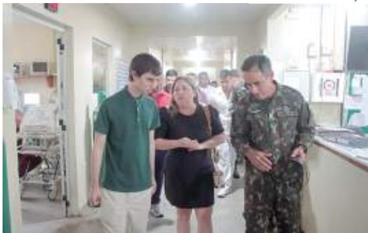
Parlamentar deu continuidade à apuração dos casos e articula CPI