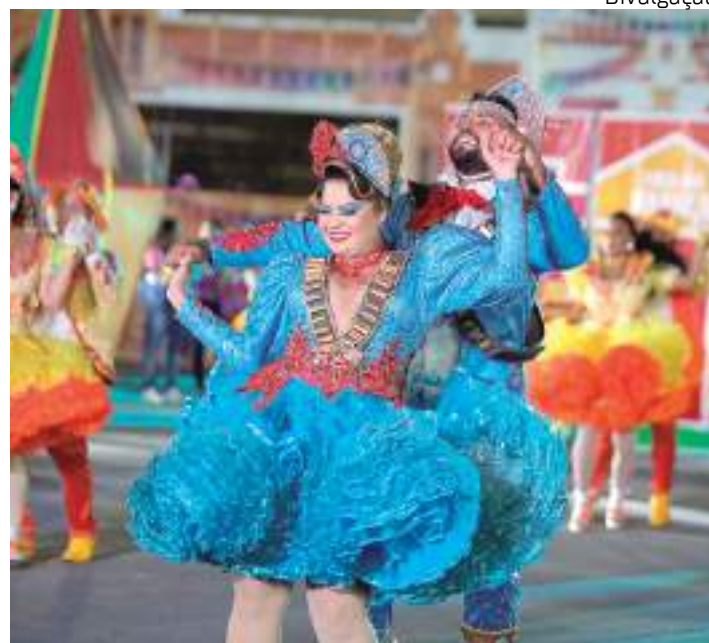
Evento reúne gastronomia, danças e atividades típicas juninas