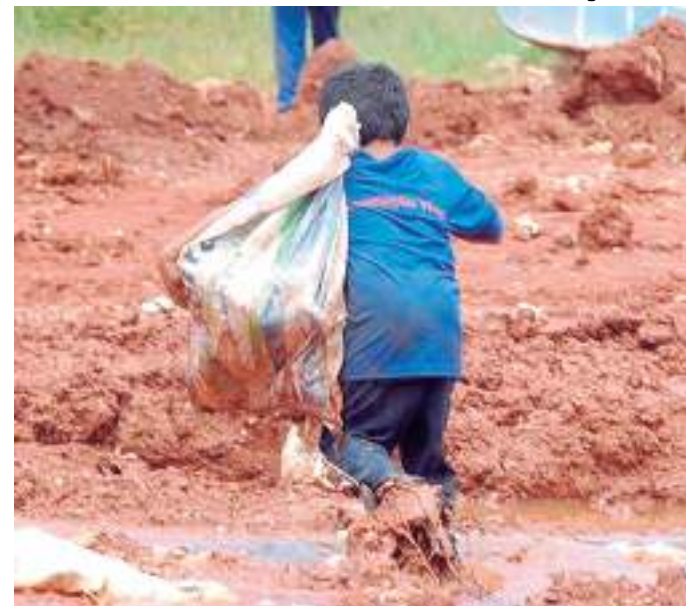
Estimativa é divulgada no Dia Mundial contra o Trabalho Infantil

Diante desses números alarmantes, a Organização Internacional do Trabalho defende a criação de uma