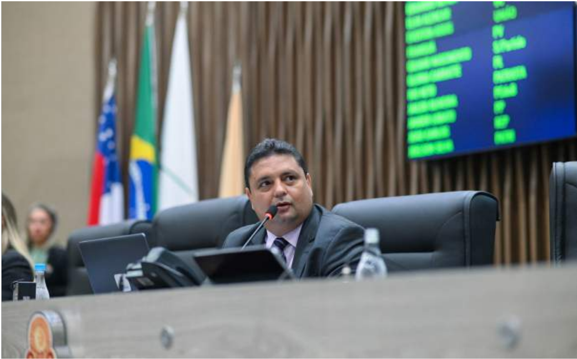
Vereador presidente da Câmara Municipal destacou que setores são de grande importância para população

berada pelos vereadores e, sob o nº 004/2023, seguiu para a 2ª Comissão de Constituição, Justiça e Redação da CMM.