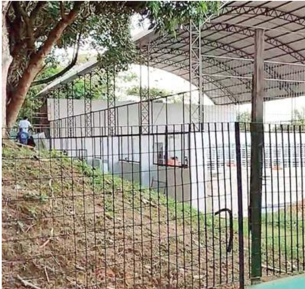
Vítima foi encontrada com os pés e mãos amarrados no vestiário da escola

O corpo do vigilante foi removido para o Instituto Médico Legal (IML). A Delegacia Especializada em Homicídios e Sequestros (DEHS) deve investigar o caso.