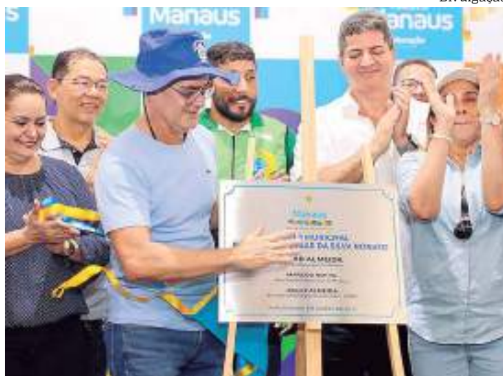
Unidade tem capacidade para atender 294 estudantes

As obras iniciaram em agosto de 2022. A nova edificação possui oito salas de aula, sala administrativa, cozinha com refeitório,