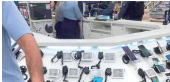
Equipe da PM esteve no local após criminosos roubarem celulares