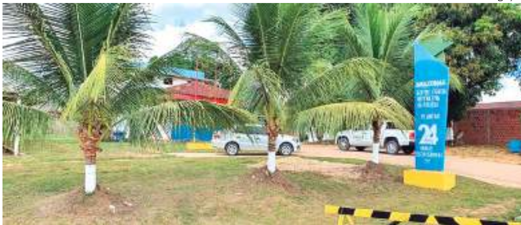
Homem foi preso na delegacia de Pauini suspeito de estupro

Um homem de 41 anos, foi preso na segunda-feira (19), por estupro de vulnerável praticado contra sua sobrinha de 10 anos, no município de Pauini (a 923 quilômetros de Manaus).