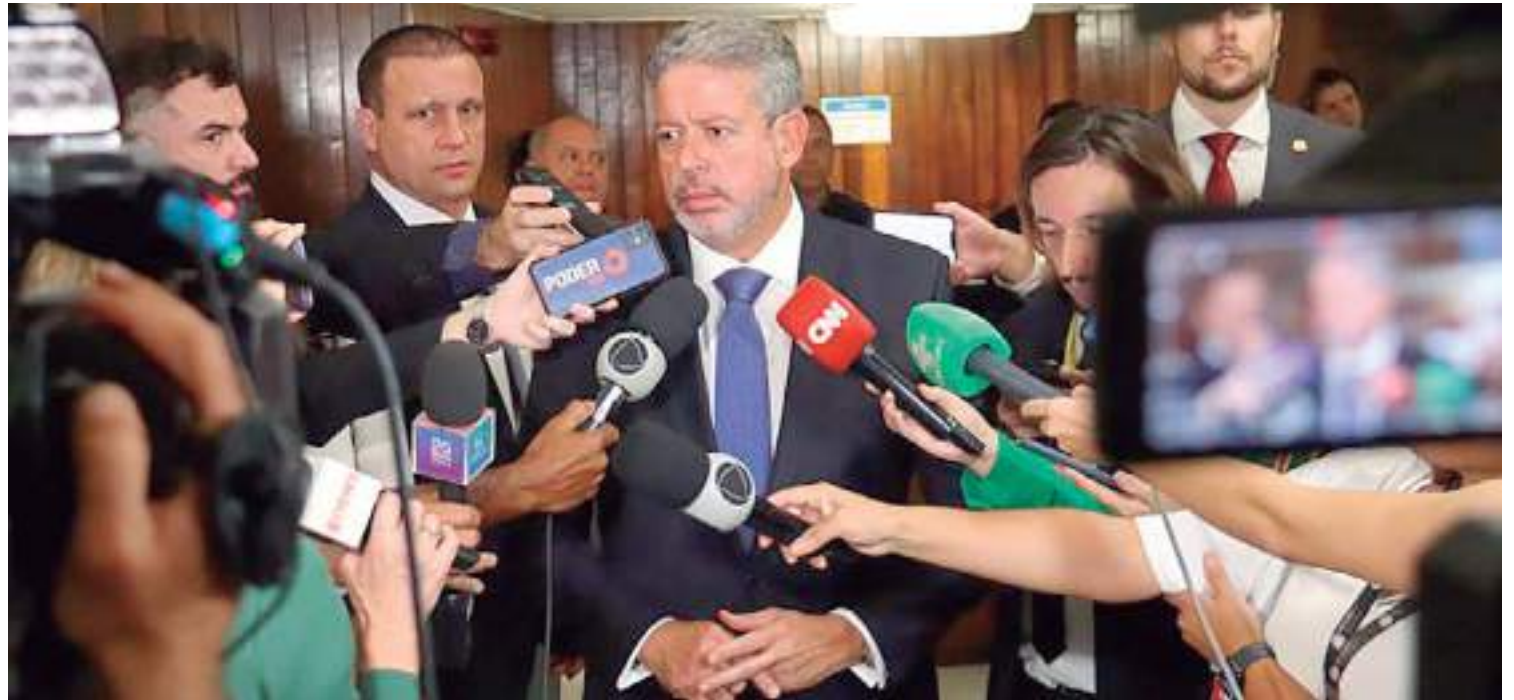
Em entrevista, Presidente da Câmara disse que reunião será decisiva para andamento da reforma tributária

Na avaliação do presidente, as diretrizes básicas da reforma estão dadas com a garantia de não aumentar a carga tributária e simplificar os impostos de consumo. Lira destacou que a proposta busca desonerar o investimento para que a indústria nacional tenha paridade de forças com