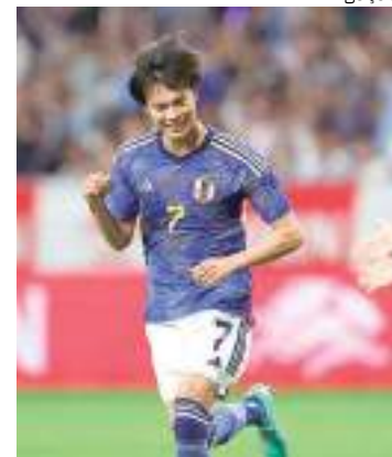
Japão está embalado com goleada sobre a Seleção do Peru

Assim, a Coreia do Sul ainda não comemorou vitória com o técnico Jürgen Klinsmann.