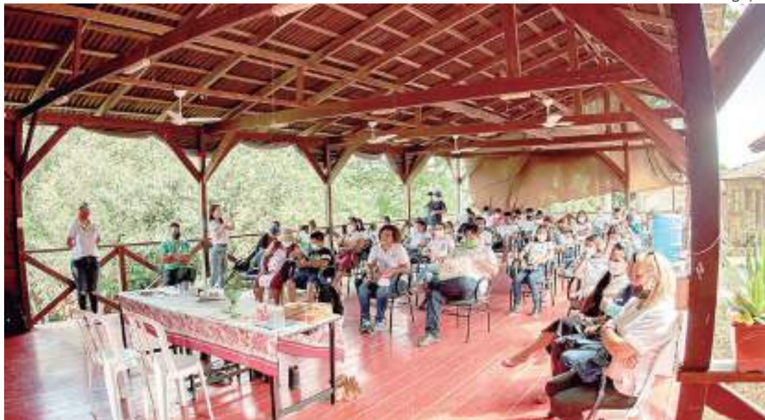
Iniciativa promove a cidadania por meio de cursos como informática, música e liderança jovem

As atividades são realizadas por meio do Programa de Desenvolvimento Integral de Crianças e Adolescentes Ribeirinhas da Amazônia (Dicara) que atende o público de 0 a 17