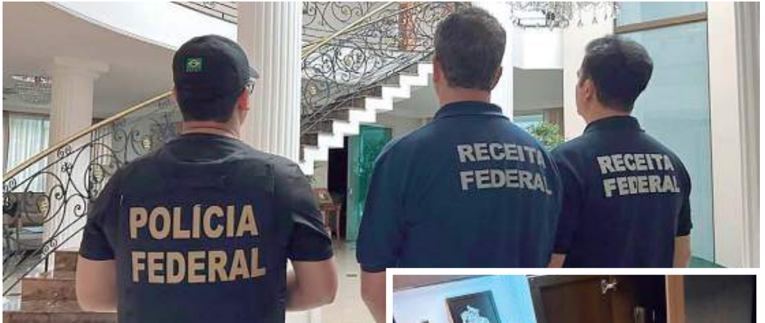
Operação cumpriu 13 mandados de busca e apreensão

“A Operação, denominada Entulho, já identificou, até o momento, a participação de 31 empresas de fachada, escritório de contabilidade, além de seus respectivos