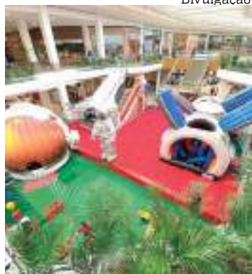
Ingresso custa R$ 40

Com a proximidade das férias escolares, a criança já se prepara para os dias de descanso da rotina de estudos. Para a diversão dos pequenos, nesse período, o Amazonas Shopping inaugurou uma nova atração, o parque Space Kids.