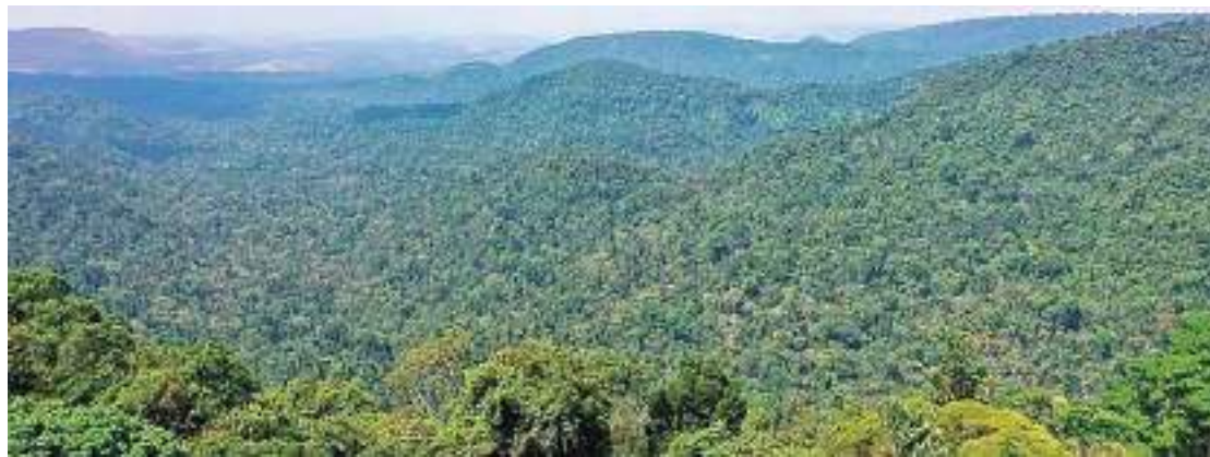
A região tem um déficit comercial de 114 bilhões de reais por ano

Com base em técnicas econômicas e modelos desen-