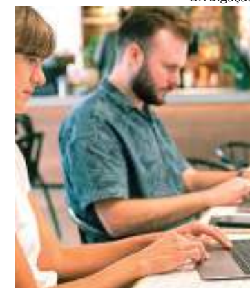
Centro de Ensino Literatus oferece o curso de Transformação Digital

O curso Transformação Digital possui carga horária de 40h e é oferecido na modalidade on-line. A plataforma também conta com mais de 60 capacitações disponíveis nas áreas de saúde, informática, gestão e negócios. Os interessados podem realizar as inscrições por meio do site https://loja.literatus.edu.br/ .