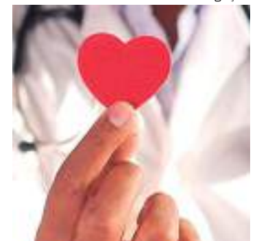
Amazonas possui apenas 123 profissionais

De acordo com Tiago Bignoto, a Cardiologia Clínica é a especialidade com uma das maiores demandas, no país. O profissional com essa formação pode atuar em ambulatório, pronto-socorro, terapia intensiva, enfermaria e salas de intervenção.