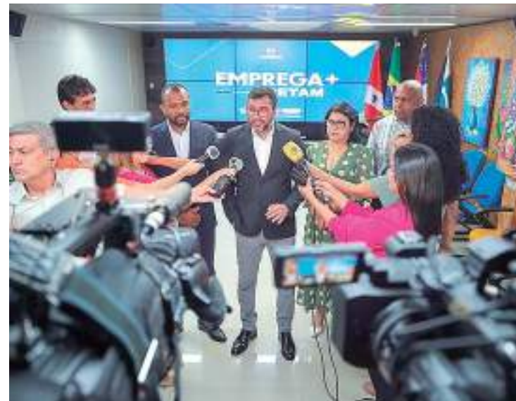
Wilson Lima lança projeto e reforça compromisso com formação técnica

Na ocasião do lançamento do projeto, o depoimento de uma empreendedora de Parintins, que atua há 20 anos no ramo da produção de uniforme, fardamentos e malharia, chamou a atenção do governador, já que o relato foi de que quando a empresa expandiu seus negócios para a capital buscou mão de obra qualificada junto ao