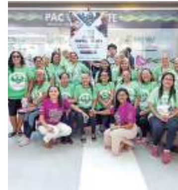
Espaço vai funcionar de segunda a sexta, das 8h às 17h

No Centro Integrado a população idosa, que vive na zona norte, terá acesso facilitado a atendimentos psicossociais, podendo registrar denúncias e receber orientações e encaminhamentos para a rede de proteção.