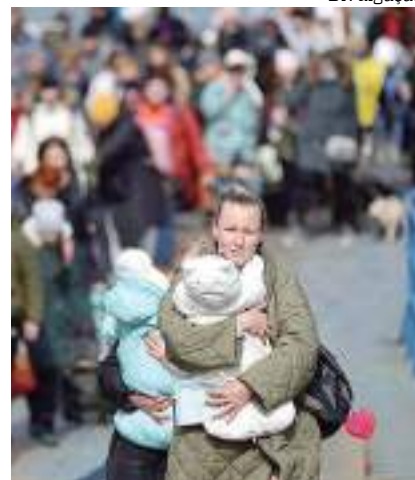
Submarino da OceanGate

Submarinos desaparecidos podem ser localizados a partir de um sonar. O instrumento funciona a partir da emissão de ondas sonoras no oceano.