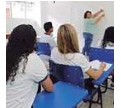
Valores serão transferido na sexta-feira