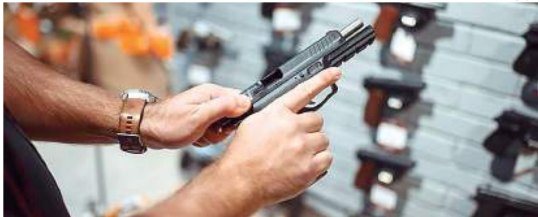
Mais de 60 armas foram levadas pelos bandidos

Uma família foi feita refém durante um assalto a uma residência na rua do Cruzeiro, bairro Betânia, Zona Sul de Manaus, na terça-feira (27).