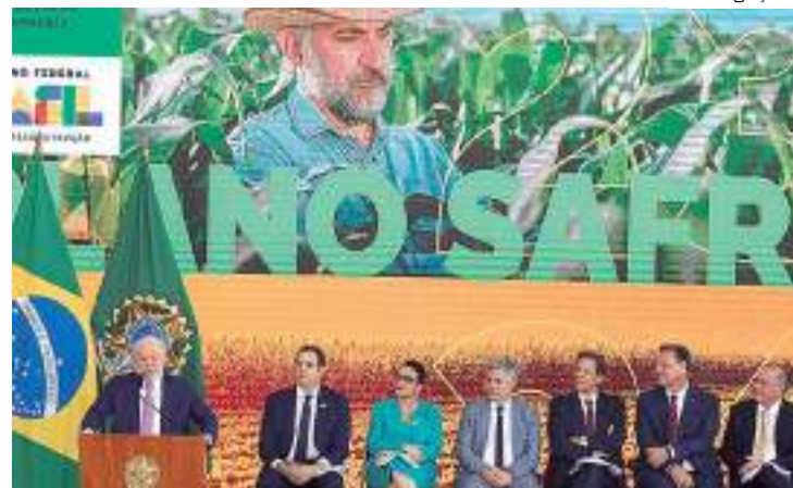
Lula lança Plano Safra 2023/2024 com R$ 364,22 bilhões

O presidente está sugerindo ainda que o governo fe-