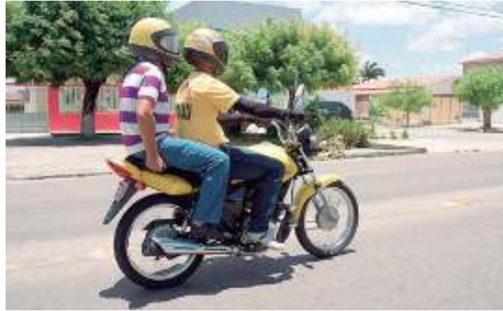
São mais de 50 ferramentas utilizadas antes, durante e depois da corrida

O uso do capacete é obrigatório tanto para os motociclistas quanto para os passageiros. A empresa recomenda que o motociclista parceiro tenha um capacete