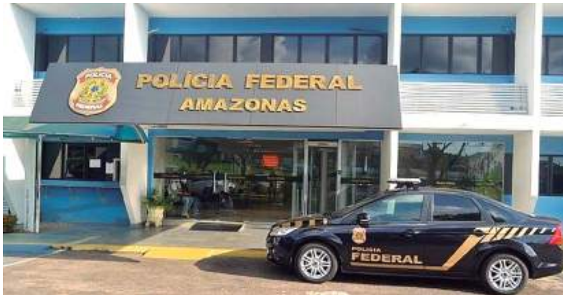
Militar do Exército repassava informações de operações para organização