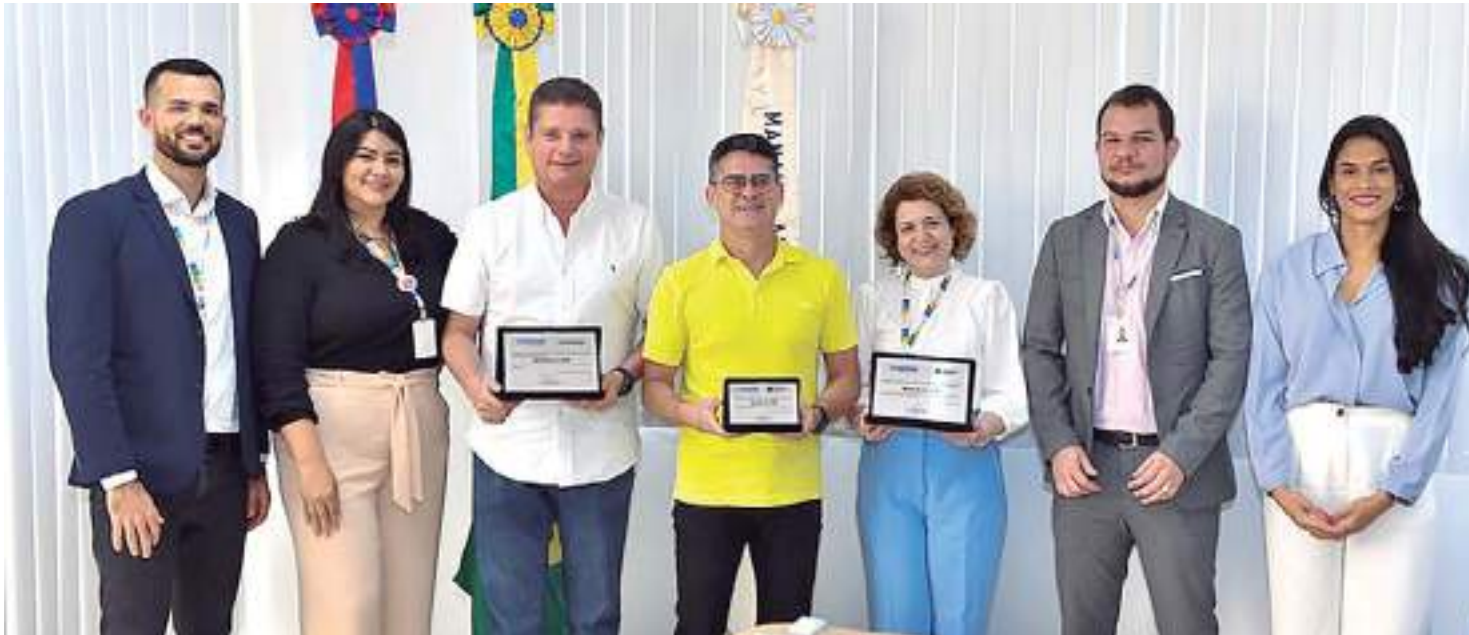
PCCR vai alcançar analistas e técnicos previdenciários, servidores do quadro efetivo da Manaus Previdência