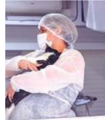
Vacinação segue até dia 31 de agosto

O principal critério para a vacinação é o animal estar em boas condições de saúde e ter, ao menos, três meses de idade. Além das ações da campanha realizada anualmente, a Prefeitura de Manaus mantém a vacina contra raiva animal disponível durante todo o ano na sede do CCZ, na avenida Brasil, s/nº, bairro Compensa, de segunda a sexta-feira, das 8h às 16h, sem necessidade de agendamento.