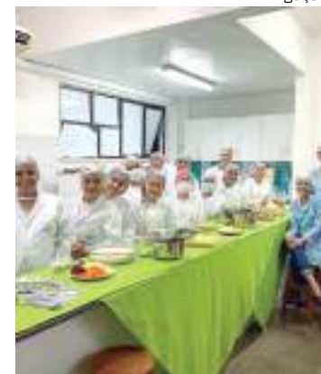
Evento contará com uma palestra e uma oficina de panificação.