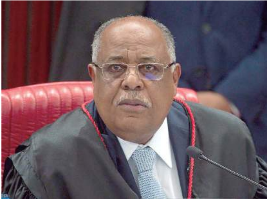
Ministro Benedito é o relator da ação que pode tornar Bolsonaro inelegível

Benedito disse que a inclusão do documento no processo não contraria a tese firmada no julgamento que absolveu a chapa Dilma Rousseff/Michel Temer, em 2017. "A admissibilidade do decreto de estado de defesa não confronta, não revoga e não