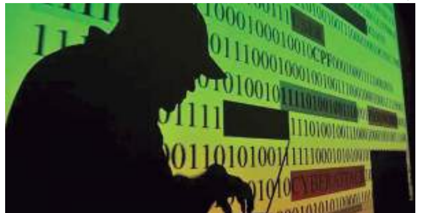
Marcello Casal Jr.

Foram ainda apreendidos mais de 900 veículos, quase 1 mil armas, 83 barcos e 40 aviões com os criminosos, que desde então já foram condenados a penas que somam mais de 7 mil anos.