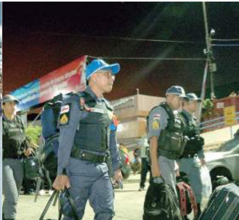
Ação faz parte do conjunto de medidas para reforçar a segurança no município

às 17h, nos dias 29 e 30 de junho e 1º de julho, e das 8h às 12h, no dia 2 de julho, no Porto de Parintins, com policiais civis, entre delegados, investigadores e escrivães.