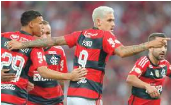
Jogadores do Flamengo comemoram vitória fora de casa, para subir na tabela

Após a partida contra o Bragantino, que será realizada na quinta-feira (22), às 20h30 (horário de Manaus), a delegação rubro-negra desembarca no Rio de Janeiro na madrugada de sexta (23). Os jogadores não receberão folga, e irão se reapresentar às 16h (de Manaus), no Centro de Treinamento Ninho do