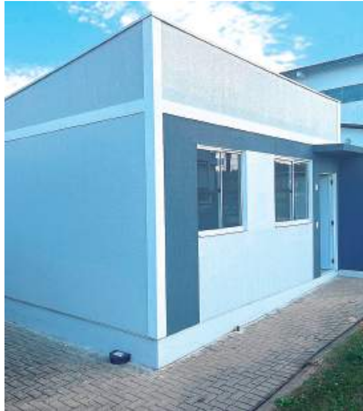
Programa tem previsão de contratar dois milhões de unidades habitacionais

“Estivemos visitando casos de sucesso. Queremos adquirir uma metodologia, essa tecnologia, que é uma estrutura totalmente adequada ao nosso clima, a nossa unidade, que vai ajudar na construção dessas novas moradias. Já estamos em discussão