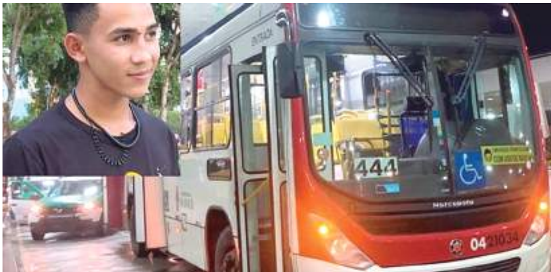
Segundo testemunhas, a vítima não reagiu ao assalto