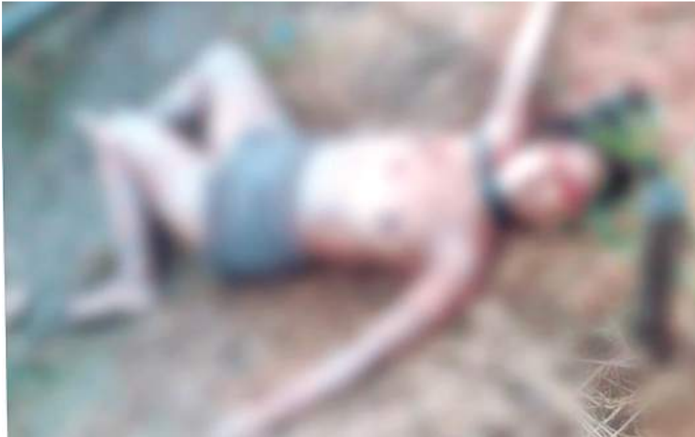
Vítima estava usando apenas uma saia e não tinha nada cobrindo os seios

Com os olhos arrancados e seminua, uma mulher ainda não identificada foi encontrada morta, na quarta-feira (21), em Tabatinga (a 1.108 quilômetros de Manaus). Ela também estava com per-