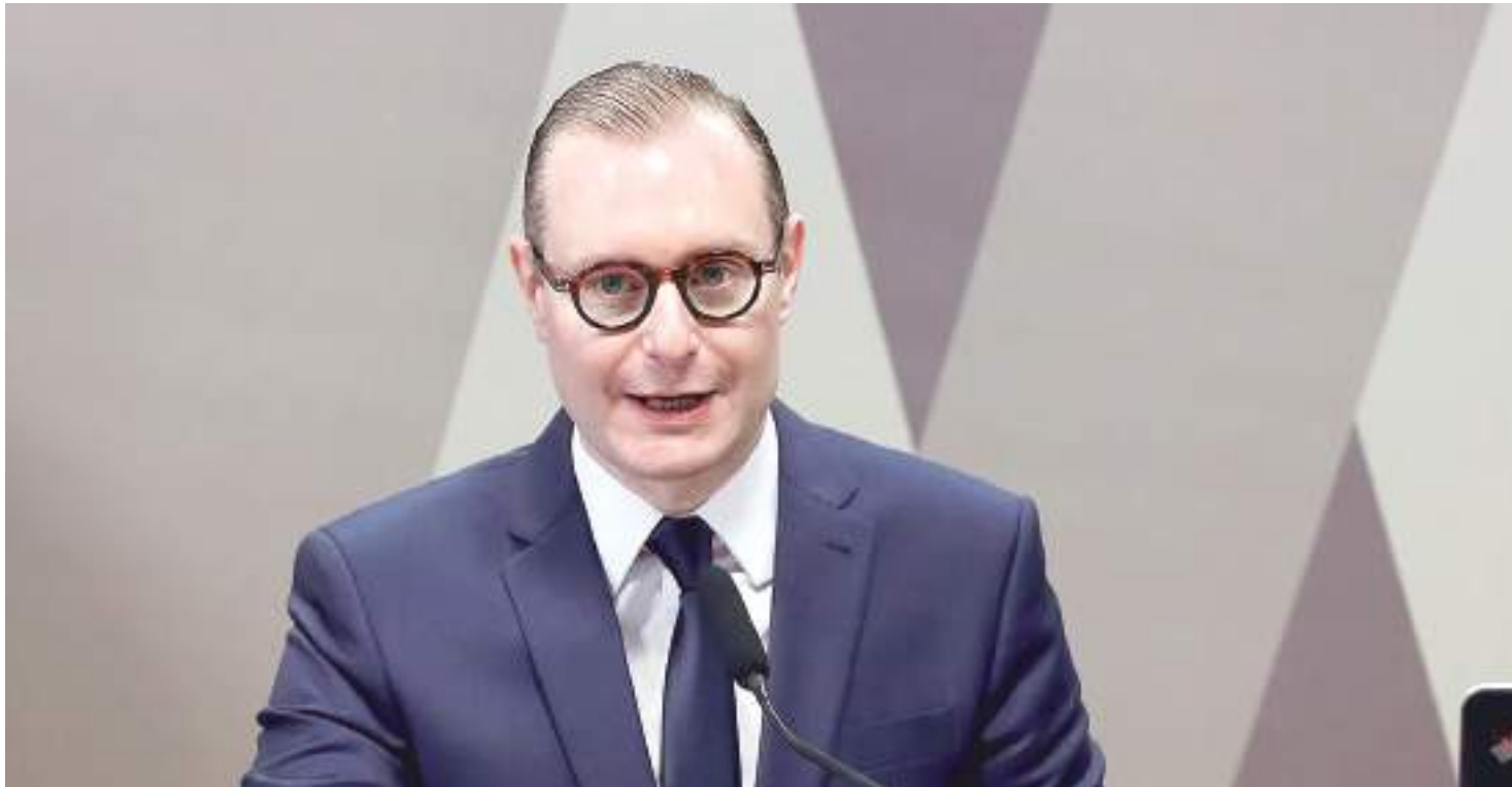
Advogado, Cristiano Zanin; Durante sabatina para indicado do cargo de ministro do STF

O plenário do Senado aprovou nesta quarta-feira (21) por 58 votos favoráveis e 18 contrários a indicação do advogado Cristiano Zanin para o Supremo Tribunal Federal (STF).