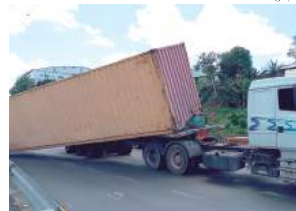
Carreta tomba na Av. das Flores nesta quarta-feira

Na semana passada, durante uma operação, o Instituto Municipal de Mobilidade Urbana (IMMU) autuou 23 condutores em operação para combater a circulação irregular de veículos pesados na Avenida Ephigênio Salles. Os agentes do IMMU abordaram 16 veículos pesados que estavam circulando pelo lado esquerdo, em desacordo com as normas estabelecidas.