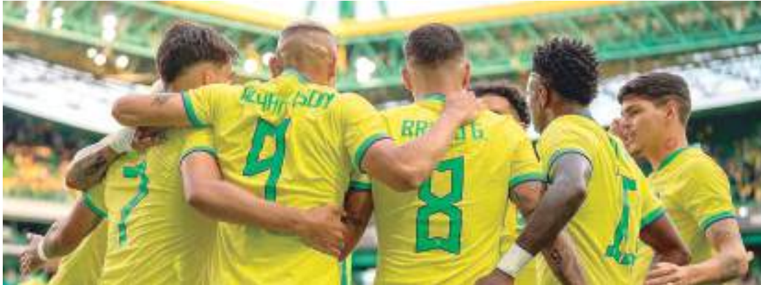
Jogadores não conseguiram bom introsamenrto e sofreram goleada histórica para Senegal

Imagine você trabalhar em uma empresa em que não há um chefe definido, nem um direcionamento de seus afazeres, nem uma organização mínima para entender a quem recorrer em caso de necessidades gerais. Ruim, né? Pois é... Assim deve se sentir o elenco da Seleção Brasileira enquanto espera uma definição sobre o novo técnico. O reflexo está na atuação e na derrota por 4 a 2 para Senegal. O resultado é vergonhoso, mas não é surpreendente. O que causa surpresa mesmo é encarar com naturalidade um período tão longo sem um treinador efetivo. É preciso definir um rumo de forma urgente.