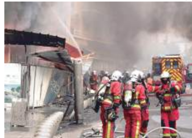
Explosão ocorreu próximo a universidade

Mais tarde o chefe da polícia de Paris, Laurent Nunez, informou que o fogo foi controlado.