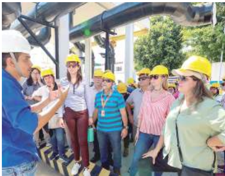
Delegação formada por 24 pessoas, está desde terça (20) na capital amazonense

Delegações dos governos do Paraguai, Panamá e Bolívia e do Banco Interamericano de Desenvolvimento (BID) participaram, nesta quarta-feira (21), de visita de campo às áreas do Programa Social e Ambiental de Manaus e Interior (Prosamin+). A delegação, formada por 24 pessoas, está desde terça (20) na capital amazonense, e segue até esta quinta-feira (22), em evento de intercâmbio técnico de experiências com programas de intervenção socioambiental, envolvendo reassentamento de populações.