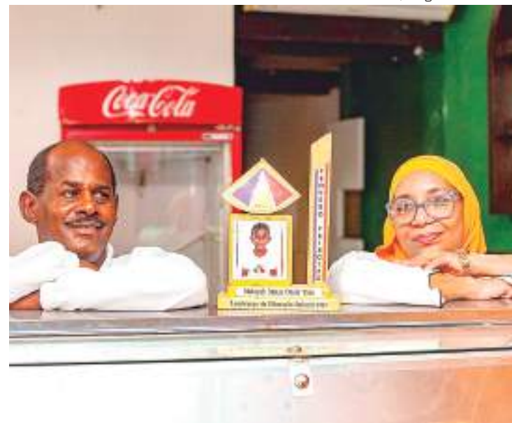
Casal Motaz e Limia deixou a República do Sudão após perseguições

Os dados levantados indicam que os refugiados buscam se preparar para atuar com o empreendedorismo no país. Entre os participantes, 81% passaram por alguma capacitação