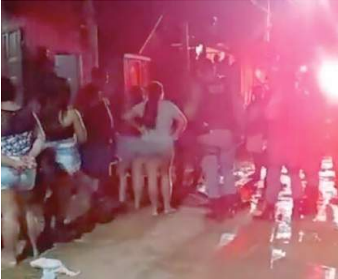
Vítima foi atingida com cinco tiros no bairro do Jauari

O corpo do homem foi encaminhado ao Instituto Médico Legal (IML), na Zona Norte da capital. A Polícia Civil deve investigar o caso.