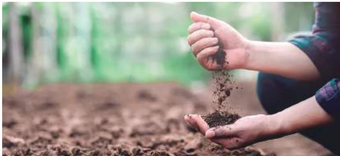
Mapeamento inédito indica que Brasil estoca no solo equivalente a 70 anos de emissões de gases estufa no país

De acordo com informações do MapBio-mas, o solo é um dos quatro grandes reservatórios de carbono do planeta, junto da atmosfera, dos oceanos e das plantas, que absorvem carbono no processo de crescimento. O solo que estoca esse carbono orgânico, quando em estado de degradação, pode liberar o elemento para a atmosfera na forma de gás carbônico e metano, agravando as mudanças do clima.