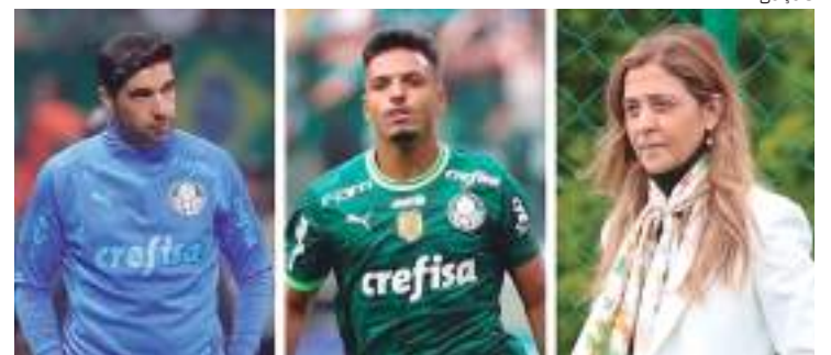
CPI das Apostas abre pedido para investigar Gabriel Menino e ouvir Abel e Leila, do Palmeiras