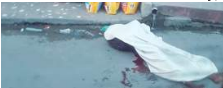
Homem foi perseguido e morto a tiros na Zona Leste de Manaus

Um morador de rua, que ainda não foi identificado, foi perseguido e morto a tiros durante a madrugada de quarta-feira (21). O crime aconteceu na rua Alameda da Esperança, bairro Novo Aleixo, Zona Leste de Manaus.