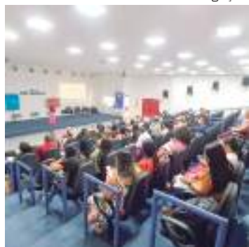
Capacitação acontece de seg. a sexta de 08h às 17h

O Fundo das Nações Unidas para a Infância (Unicef) reuniu, nesta quarta-feira (21), com representantes de 55 municípios amazonenses em Manaus, com o objetivo de contribuir para a melhoria dos processos de escuta de crianças e adolescentes que já foram vítimas ou testemunharam violências.