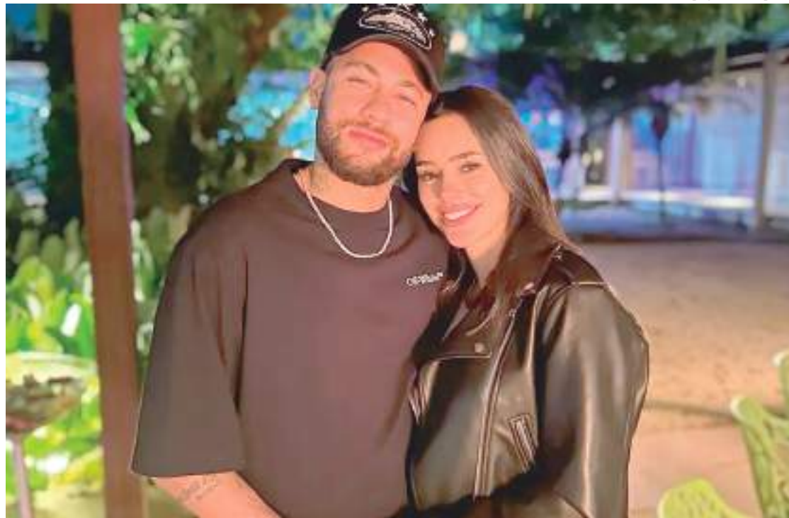
Neymar e Bruna Biancardi

Neymar escreveu uma carta aberta para a namorada, Bruna Biancardi, na quarta-feira (21). Os dois esperam o primeiro filho juntos e o jogador admitiu que errou com a influenciadora.