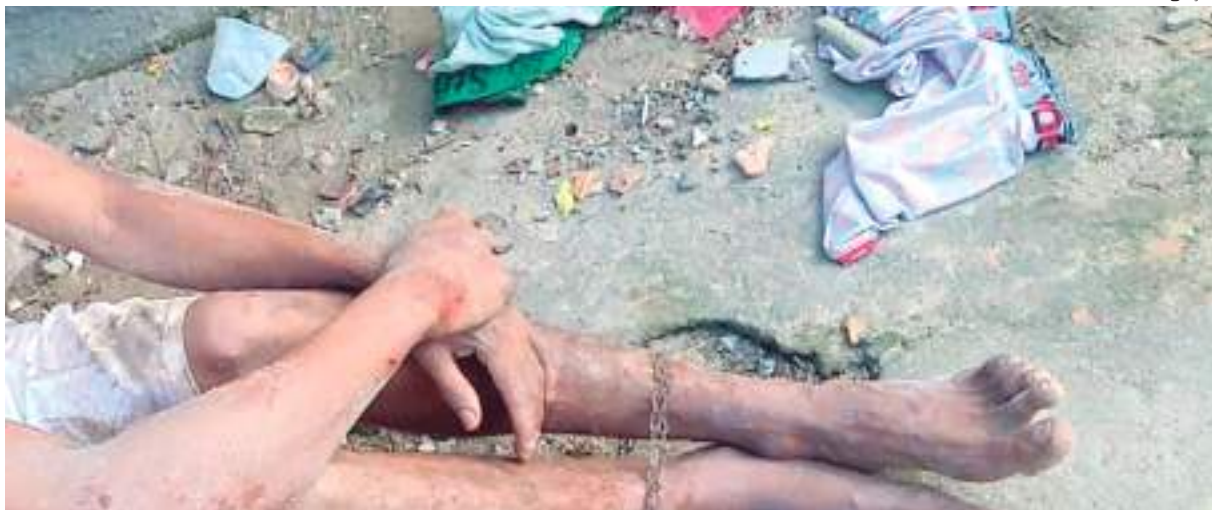
Suspeito teria entrado em um terreno e exibido pênis na frente de crianças

Um homem, que não teve o nome divulgado, foi espancado por moradores do bairro Colônia Antônio Aleixo, na Zona Leste, após supostamente mostrar o órgão genital dele para uma mulher e criança na tarde de quarta-feira (21), em Manaus.