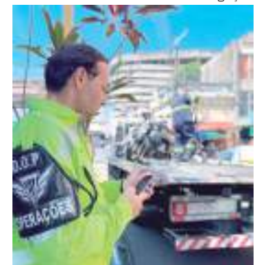
Objetivo é melhorar a rotatividade dos estacionamentos

Para informações ao cidadão, a prefeitura disponibiliza o Disque Trânsito: 0800.092.1188.