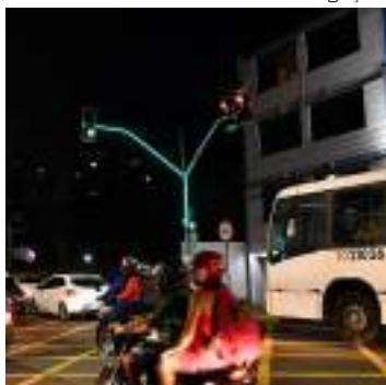
Sistema de iluminação semafórica na Umberto Calderaro Filho

Visibilidade é um dos fatores-chaves para manter a atenção dos condutores que transitam pelas vias de Manaus. E foi justamente com esse objetivo que a Prefeitura de Manaus, por meio do Instituto Municipal de Mobilidade Urbana (IMMU), instalou o primeiro sistema complementar de iluminação semafórica na avenida Umberto Calderaro