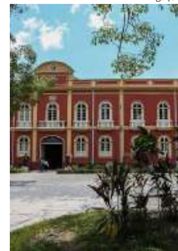
Palacete Provincial (Praça da Polícia), centro de Manaus