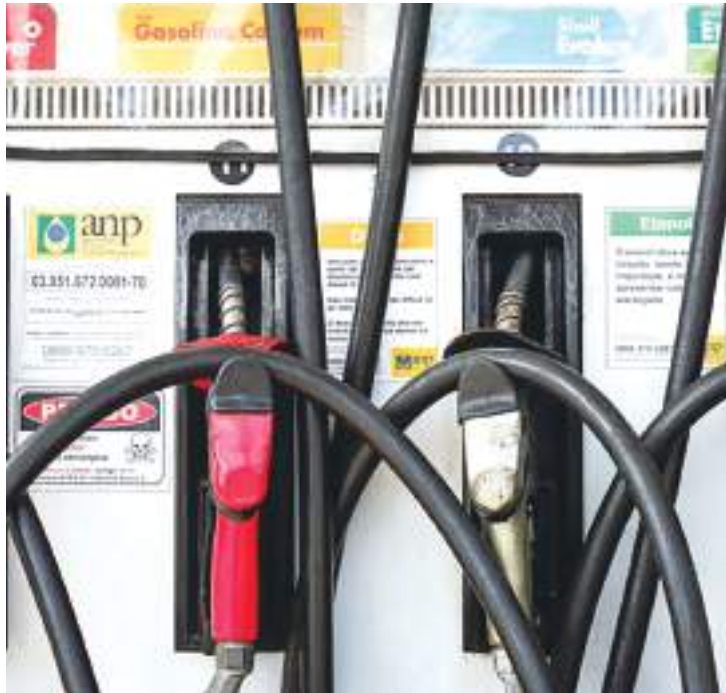
Preço da gasolina terá alta de R$ 0,34 por litro

O preço da gasolina deve aumentar R$ 0,27 por litro, por causa da nova alíquota do PIS/Cofins e mais R$ 0,07 e em função da volta da Cide, totalizando um impacto de