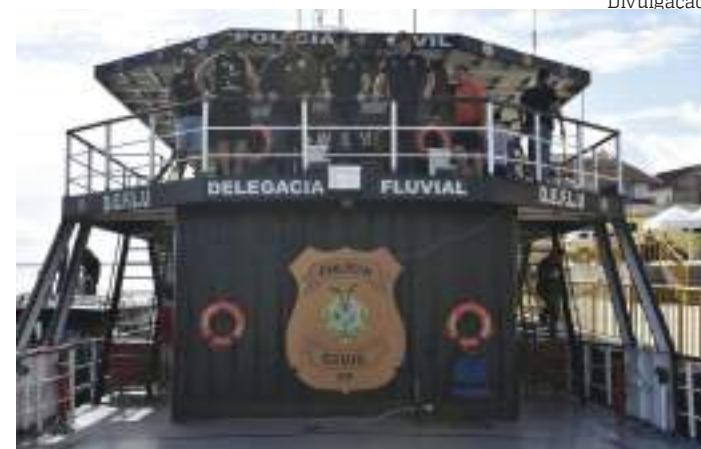
Delegacia está situada em um ponto estratégico, no Porto de Parintins

“A Delegacia do Turista é uma iniciativa muito importante da Polícia Civil do Amazonas, justamente para atender aquelas pessoas que chegam à cidade de Parintins para participar deste grande festival. Todas as ações que estão sendo feitas, cumprem a determinação do governador Wilson Lima para intensificar as ações das forças de segurança”, disse o titular da SSP-AM.