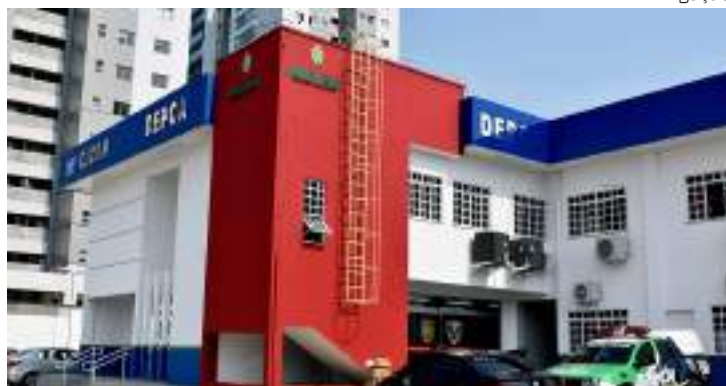
Delegacia Especializada de Proteção à Criança e ao Adolescente

Um homem, de 25 anos, foi preso, na quinta-feira (29), por estupro de vulnerável praticado contra uma adolescente de 13 anos. O crime aconteceu em setembro de 2020, no ramal da Pedreira, na rodovia federal BR-174.