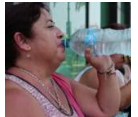
Onda de calor extremo deixou muitas pessoas mortas

rológicas mexicanas estão prevendo que o país pode enfrentar outra onda de calor extrema em julho, o que acende o alerta entre a população. O Serviço Meteorológico Nacional do México também emitiu um comunicado, alertando que as altas temperaturas persistirão nos estados da costa nordeste, norte, centro e sul do Pacífico.