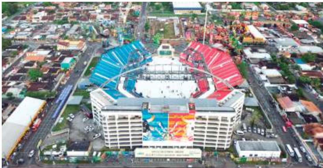
“Bumbódromo” é o palco para a rivalidade entre o Caprichoso e o Garantido

O secretário lembrou que há provocação entre as torcidas, mas que não há atrito no bumbódromo: “É um desafio verbalizado, é divertido e mexe com a emoção da população”.