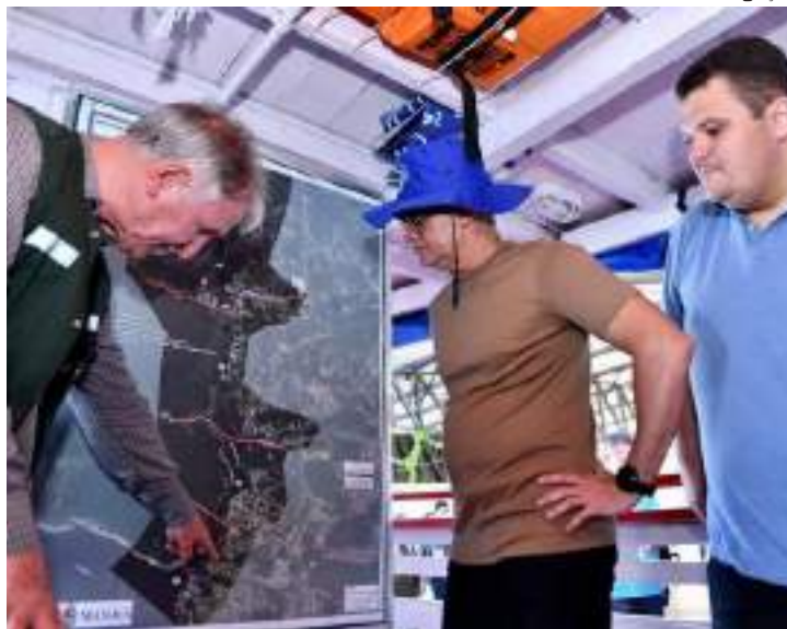
Prefeito David Almeida (Avante) e secretários municipais participaram da fiscalização inicial dos flutuantes

Essa é considerada uma etapa importante para o processo de disciplinamento e de ordenamento da orla de Manaus, segundo compromisso atribuído ao município na mesma decisão judicial, que inclui: identificação de critérios técnicos que salvaguardem o patrimônio ambiental, turístico e econômico da cidade. Eles serão construídos em interação com os órgãos que compõem o Sistema Nacional do Meio Ambiente (Sisnama) e demais instituições, direta ou indiretamente, relacionadas à atividade em questão.