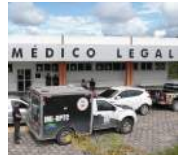
Explosivo foi detonado na área do Instituto Médico Legal